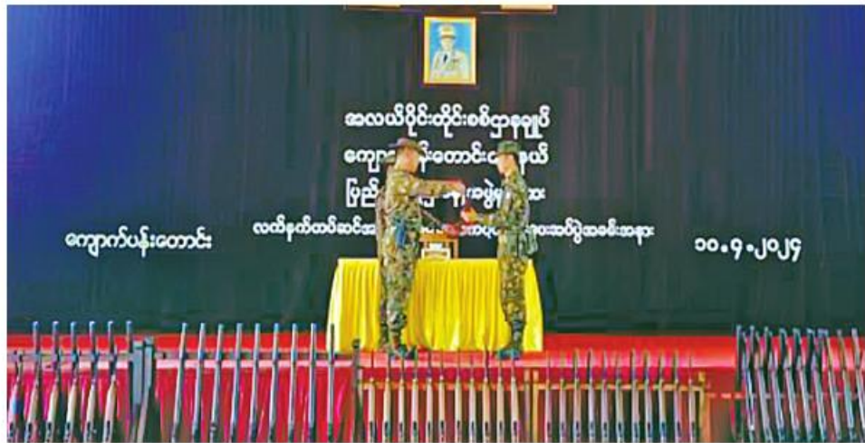
အလယ်ပိုင်းတိုင်းစစ်ဌာနချုပ် ကျောက်ပန်းတောင်းမြို့နယ် ပြည်သူ့စစ်(ဌာနေ)တပ်ဖွဲ့ဝင်များကို လက်နက်များ တပ်ဆင်ပေးခြင်းနှင့် ထောက်ပံ့ပစ္စည်းများ ပေးအပ်

နေပြည်တော် ဧပြီ ၁၀ မန္တလေးတိုင်းဒေသကြီး ကျောက်ပန်းတောင်းမြို့နယ်အတွင်းရှိ ပြည်သူ့စစ်(ဌာနေ)တပ်ဖွဲ့ဝင်များကို လက်နက်တပ်ဆင်ပေးခြင်းနှင့် ထောက်ပံ့ပစ္စည်းများ ပေးအပ်ခြင်းကို ယနေ့နံနက်ပိုင်းတွင် ကျောက်ပန်းတောင်းမြို့ရှိ နယ်မြေခံတပ်နယ်ခန်းမ၌ ပြုလုပ်ရာ အလယ်ပိုင်းတိုင်းစစ်ဌာနချုပ် ကျောက်ပန်းတောင်းတပ်နယ်မှ တာဝန်ရှိသူများ၊ ပြည်သူ့စစ်(ဌာနေ)တပ်ဖွဲ့ဝင်များနှင့် ဖိတ်ကြားထားသူများ တက်ရောက်ကြသည်။ ဦးစွာ တာဝန်ရှိသူတစ်ဦးက အမှာစကား ပြောကြားသည်။ ထို့နောက် တာဝန်ရှိသူများက ပြည်သူ့စစ်(ဌာနေ)တပ်ဖွဲ့ဝင်များအတွက် လက်နက်များ တပ်ဆင်ပေးခြင်းနှင့် ထောက်ပံ့ပစ္စည်းများ ပေးအပ်ရာ ပြည်သူ့စစ်(ဌာနေ)တပ်ဖွဲ့ဝင်များ ကိုယ်စား တာဝန်ရှိသူတစ်ဦးက ကျေးဇူးတင်စကားပြန်လည် ပြောကြားသည်။ ယင်းနောက် တာဝန်ရှိသူများသည် တပ်ဆင်ပေးအပ်လက်နက်များကို လိုက်လံကြည့်ရှုကြပြီး တက်ရောက်လာကြသည့် ပြည်သူ့စစ်(ဌာနေ)တပ်ဖွဲ့ဝင်များကို ရင်းရင်းနှီးနှီးလိုက်လံနှုတ်ဆက်ခဲ့ကြောင်း သတင်းရရှိသည်။