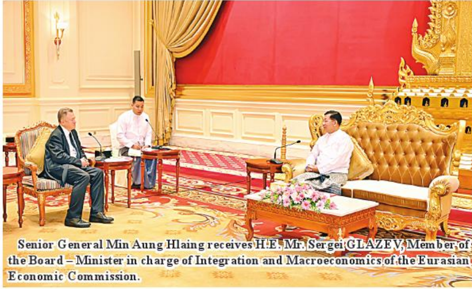
Senior General Min Aung Hlaing receives H.E. Mr. Sergei GLAZEV, Member of the Board – Minister in charge of Integration and Macroeconomics of the Eurasian Economic Commission.