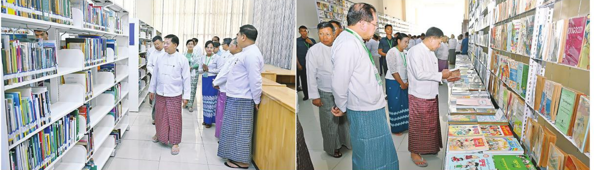
နိုင်ငံတော်စီမံအုပ်ချုပ်ရေးကောင်စီဥက္ကဋ္ဌ နိုင်ငံတော်ဝန်ကြီးချုပ် ဝိုလ်ချုပ်မှူးကြီးမင်းအောင်လှိုင် ဝင်းကျင်းပြသထားသည့် စာအုပ်စာစောင်များနှင့် အမျိုးသားစာကြည့်တိုက်ရှိ e-Library and Reading Room တို့ကို လှည့်လည်ကြည့်ရှုစဉ်။

ပွင့်လင်းစွာ အမြင်ချင်းဖလှယ် ဆွေးနွေး ခဲ့ကြသည်။ တွေ့ဆုံပွဲအပြီးတွင် နိုင်ငံတော်စီမံ အုပ်ချုပ်ရေးကောင်စီဥက္ကဋ္ဌ နိုင်ငံတော် ဝန်ကြီးချုပ်နှင့် ဥရောပအာရှစီးပွားရေး ကော်မရှင်ဘုတ်အဖွဲ့ဝင် အကြီးစား စီးပွားရေးနှင့် ပေါင်းစည်းရေးဝန်ကြီး တို့သည် အမှတ်တရလက်ဆောင်ပစ္စည်းများ အပြန်အလှန်ပေးအပ်ကြပြီး မှတ်တမ်းတင် ဓာတ်ပုံရိုက်ခဲ့ကြကြောင်း သတင်းရရှိသည်။