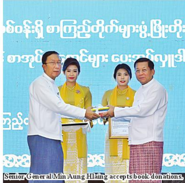
Senior General Min Aung Hlaing accepts book donations.

Library is a institute to disseminate knowledge. It is necessary to organize the people to read and raise reading habit. Individuals need to read books for accumulate knowledge. They have to note down knowledge from the books not just for reading. Reading can accumulate knowledge, benefiting the life. Moreover, readers have to discuss and talk about thing they have read for dissemination of knowledge. Hence, it is necessary to hold seminars in relevant wards and villages weekly or monthly. The Myanmar proverb mentions one morning for water and seven days for food.