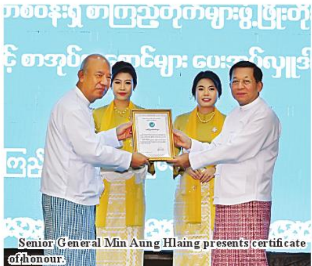
Senior General Min Aung Hlaing presents certificate of honour.

Likewise, lack of literary knowledge will be difficulties along the life. Due to lack of literary knowledge and weak knowledge, many people face difficulties in daily routine. See Page 13