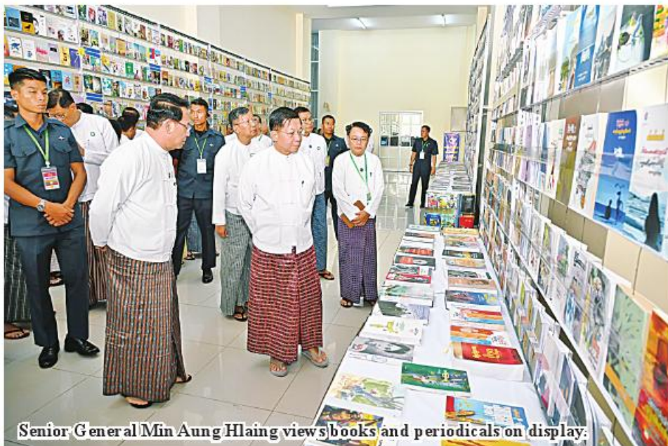
Senior General Min Aung Hlaing views books and periodicals on display.

From Page 12 It is necessary to strive for changing their lifestyle and shaping the wise society in the future. In so doing, it must be a long term plan not a just short term plan. The government is im-plementing two political visions: strengthening the genuine, disciplined multi-party democratic system and building the Union based on democratic and federal systems based on the roadmap and objectives. In so doing, it is a must do for emergence of a well-versed human resources and shaping the knowledgeable society. It is necessary to consider how to share knowledge with the people by spending the least cost. Moreover, books