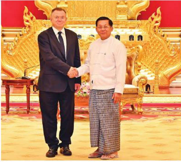
နိုင်ငံတော်စီမံအုပ်ချုပ်ရေးကောင်စီဥက္ကဋ္ဌ နိုင်ငံတော်ဝန်ကြီးချုပ် ဝိုလ်ချုပ်မှူးကြီးမင်းအောင်လှိုင် ဥရောပအာရှစီးပွားရေးကော်မရှင် ဘုတ်အဖွဲ့ဝင် အကြီးစားစီးပွားရေးနှင့် ပေါင်းစည်းရေးဝန်ကြီး H.E. Mr. Sergei GLAZEV အား ရင်းရင်းနှီးနှီးနှုတ်ဆက်စဉ်။