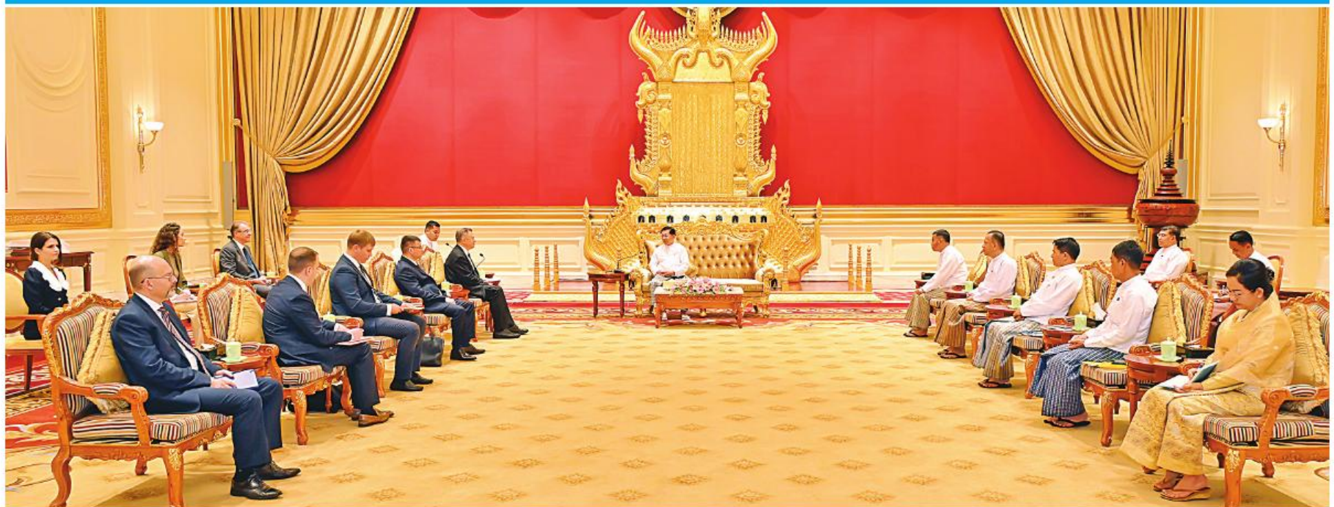
နိုင်ငံတော်စီမံအုပ်ချုပ်ရေးကောင်စီဥက္ကဋ္ဌ နိုင်ငံတော်ဝန်ကြီးချုပ် ဗိုလ်ချုပ်မှူးကြီးမင်းအောင်လှိုင်ထံ ဥရောပအာရှစီးပွားရေးကော်မရှင် ဘုတ်အဖွဲ့ဝင် အကြီးစားစီးပွားရေးနှင့် ပေါင်းစည်းရေးဝန်ကြီး H.E. Mr. Sergei GLAZEV ဦးဆောင်သော ကိုယ်စားလှယ်အဖွဲ့က လာရောက်ဂါရဝပြုတွေ့ဆုံစဉ်။

နေပြည်တော် ဧပြီ ၁၀ ဗိုလ်ချုပ်မှူးကြီး မင်းအောင်လှိုင်ထံ နှင့် ပေါင်းစည်းရေးဝန်ကြီး H.E. မွန်းလွဲပိုင်းတွင် နေပြည်တော်ရှိ ခန်းမ၌ လာရောက်ဂါရဝပြုတွေ့ဆုံ နိုင်ငံတော်စီမံအုပ်ချုပ်ရေးကောင်စီ | ဥရောပအာရှ စီးပွားရေးကော်မရှင် | Mr. Sergei GLAZEV ဦးဆောင် | နိုင်ငံတော် စီမံအုပ်ချုပ်ရေးကောင်စီ | သည်။