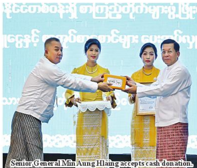
Senior General Min Aung Hlaing accepts cash donation.