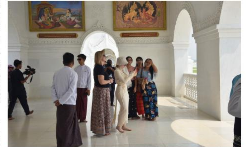
ဥရောပအာရှစီးပွားရေးကော်မရှင်ဘုတ်အဖွဲ့ဝင် အကြီးစားစီးပွားရေးနှင့် ပေါင်းစည်းရေးဝန်ကြီး H.E. Mr. Sergei GLAZEV ၏ဇနီးနှင့် တာဝန်ရှိသူများ ဂန္ဓကုဋ်တိုက်အတွင်း ကြည့်ရှုလေ့လာစဉ်

မာရဝိဇယ ဗုဒ္ဓရုပ်ပွားတော်မြတ်ကြီးနှင့် ဗုဒ္ဓဥယျာဉ်တော်ပုံစံပုံသဏ္ဍာန်များ၊ ဗုဒ္ဓဥယျာဉ်တော်အတွင်းကျင်းပခဲ့သည့် မဟာမင်္ဂလာအခမ်းအနားများတွင် အသုံးပြုခဲ့သည့်ပစ္စည်းများ၊ ဘုရားရှင်ဓာတ်တော်၊ ရဟန္တာဓာတ်တော်များ ထည့်သွင်းပူဇော်ခဲ့သည့် ရွှေဖလားများ၊ မာရဝိဇယဆင်းတုတော်ကြီးတည်ဆောက်ထားသော ဆင်းတုတော်ကြီး ပုံစံပုံသဏ္ဍာန်၊ မြန်မာ့ရိုးရာပန်းဆယ်မျိုးလက်ရာပုံစံပုံသဏ္ဍာန်၊ ရုပ်ပွားတော်မြတ်ကြီး တည်ထားပူဇော်မှု မှတ်တမ်းဓာတ်ပုံများ၊ ဝိသုကာလက်ရာများဖြင့် ခမ်းနားထည်ဝါစွာ တည်ထားပူဇော်ထားသည့် အဂ္ဂိမိပတိသာသနာဗိမာန်တော်ကြီး၊ ကျောက်စာရံစေတီများနှင့် အခြားသာသနာ အဆောက်အအုံများကို ဆက်လက်ဖူးမြော် လေ့လာကြည့်ညှိခဲ့ကြသည်။ ထို့အတူ မာရဝိဇယဗုဒ္ဓရုပ်ပွားတော်မြတ်ကြီးအား အနယ်နယ်အရပ်ရပ်မှ ရဟန်းရှင်လူဘုရားဖူးပြည်သူများလည်း လာရောက်ဖူးမြော် ကြည်ညိုလျက်ရှိကြောင်း သတင်းရရှိသည်။