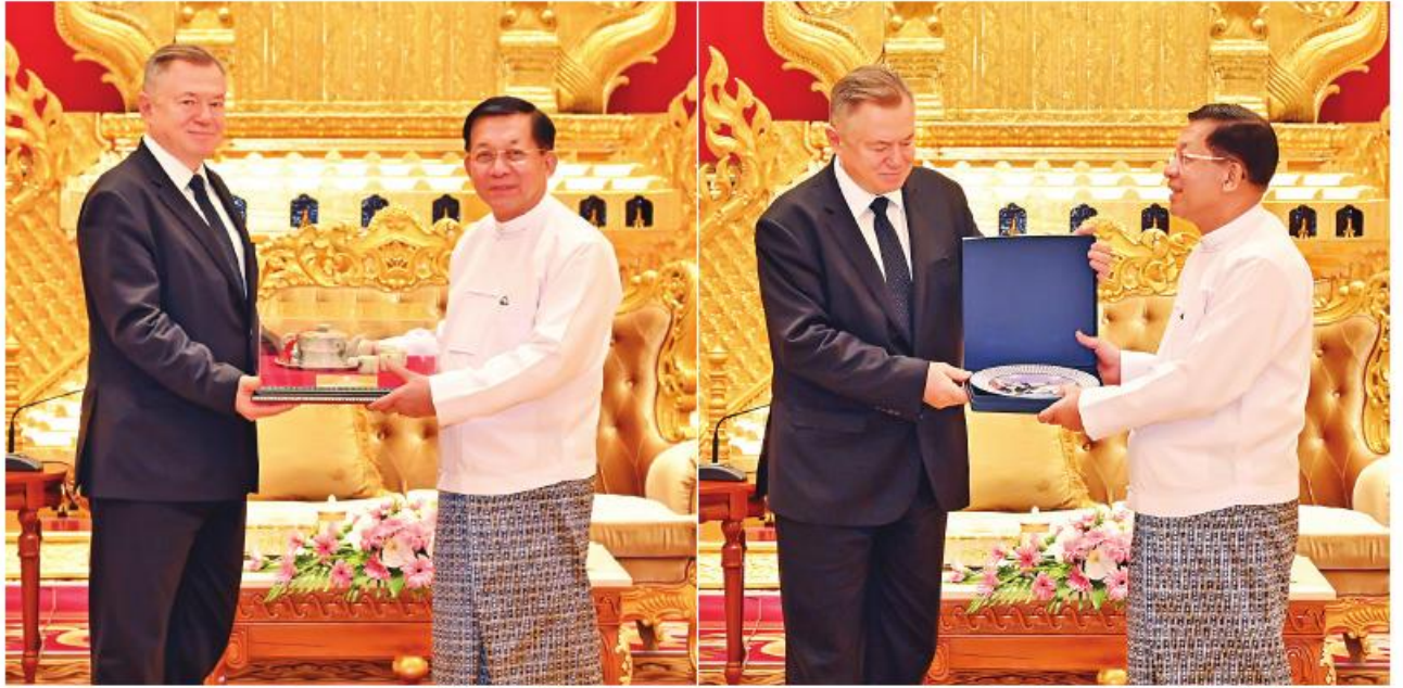
နိုင်ငံတော်စီမံအုပ်ချုပ်ရေးကောင်စီဥက္ကဋ္ဌ နိုင်ငံတော်ဝန်ကြီးချုပ် ဝိုလ်ချုပ်မှူးကြီးမင်းအောင်လှိုင်နှင့် ဥရောပအာရှစီးပွားရေးကော်မရှင် ဘုတ်အဖွဲ့ဝင် အကြီးစားစီးပွားရေးနှင့် ပေါင်းစည်းရေးဝန်ကြီး H.E. Mr. Sergei GLAZEV တို့ အမှတ်တရလက်ဆောင်ပစ္စည်းများ အပြန်အလှန်ပေးအပ်စဉ်။