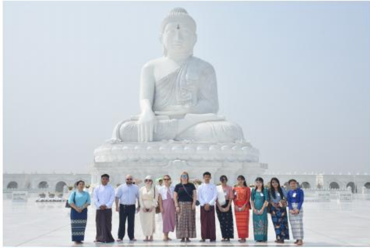
မာရဝိဇယဗုဒ္ဓရုပ်ပွားတော်မြတ်ကြီးအား ဥရောပအာရှစီးပွားရေးကော်မရှင် ဘုတ်အဖွဲ့ဝင် အကြီးစားစီးပွားရေးနှင့် ပေါင်းစည်းရေးဝန်ကြီး H.E. Mr. Sergei GLAZEV ၏ဇနီးနှင့် တာဝန်ရှိသူများ ဖူးမြော်ကြည်ညိုပြီး ဖုန်းပေးစာတိုပို့ရက်စဉ်

နေပြည်တော် ဧပြီ ၁၀ ပြည်ထောင်စုနယ်မြေ နေပြည်တော် ဒေသခံသီရိမြို့နယ်ရှိ ဗုဒ္ဓဥယျာဉ်ဝတ္ထုတော်တွင်တည်ထားပူဇော်သည့် ကမ္ဘာပေါ်ရှိ ထိုင်တော်မူကျောက်ဆင်းစုပွဒ္ဓရုပ်ပွားတော်များအနက် ဉာဏ်တော်အမြင့်ဆုံးဖြစ်သည့် မာရဝိဇယ ဗုဒ္ဓရုပ်ပွားတော်မြတ်ကြီးအား ဥရောပအာရှစီးပွားရေးကော်မရှင် ဘုတ်အဖွဲ့ဝင် အကြီးစားစီးပွားရေးနှင့်ပေါင်းစည်းရေးဝန်ကြီး H.E. Mr. Sergei GLAZEV ၏ဇနီးနှင့် တာဝန်ရှိသူများသည် ယနေ့နံနက်ပိုင်းတွင် လာရောက်ဖူးမြော် ကြည်ညိုကြသည်။ ဦးစွာမော်ကွန်းတိုက်၌ မာရဝိဇယဘုရားကြီး တည်ထားကိုးကွယ်ပူဇော်ရခြင်း ရည်ရွယ်ချက်၊ ရုပ်ပွားတော်မြတ်ကြီးအား လုပ်ငန်းစဉ်အဆင့်ဆင့်ဖြင့် အောင်မြင်စွာ တည်ထားပူဇော်နိုင်ခဲ့မှု၊ ကျောက်စာရံစေတီများ တည်ထားဆောင်ရွက်ခဲ့မှု၊ သာသနာရေးဆိုင်ရာအခမ်းအနားကြီးများ စည်ကားသိုက်မြိုက်စွာ ကျင်းပနိုင်ခဲ့မှုအခြေအနေ