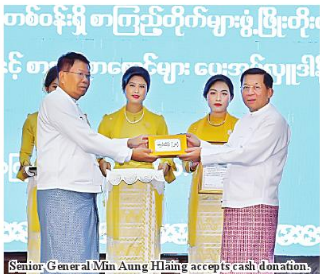
Senior General Min Aung Hlaing accepts cash donation.