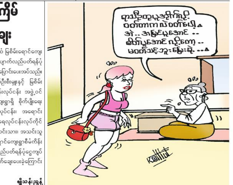
ရီသန်းညွန့်

လုပ်ငန်းအဖွဲ့ဝင်များထံ မြစ်မီးရောင်ကျေးရွာစီမံကိန်း အရင်းမပျောက်လည်ပတ်ရန်ပုံငွေကျပ် ၃၂၅ သိန်း လွှဲပြောင်းပေးအပ်သည်။ ထို့နောက် မြို့နယ်ဦးစီးမှူးနှင့် မြစ်မီးရောင်ကျေးရွာစီမံကိန်းလုပ်ငန်း အဖွဲ့ဝင်များက ဩဘာညွန့်ကျေးရွာရှိ စိုက်ပျိုးရေးလုပ်ငန်း၊ မွေးမြူရေးလုပ်ငန်း၊ အရောင်းအဝယ်လုပ်ငန်းနှင့် ရေလုပ်ငန်းလုပ်ကိုင်သူ စုစုပေါင်း အသင်းသား၊ အသင်းသူ ၁၀၂ ဦးကို မြစ်မီးရောင်ကျေးရွာစီမံကိန်း အရင်းမပျောက် လည်ပတ်ရန်ပုံငွေကျပ် ၃၂၅ သိန်း ထုတ်ချေးပေးခဲ့ကြောင်း သိရသည်။