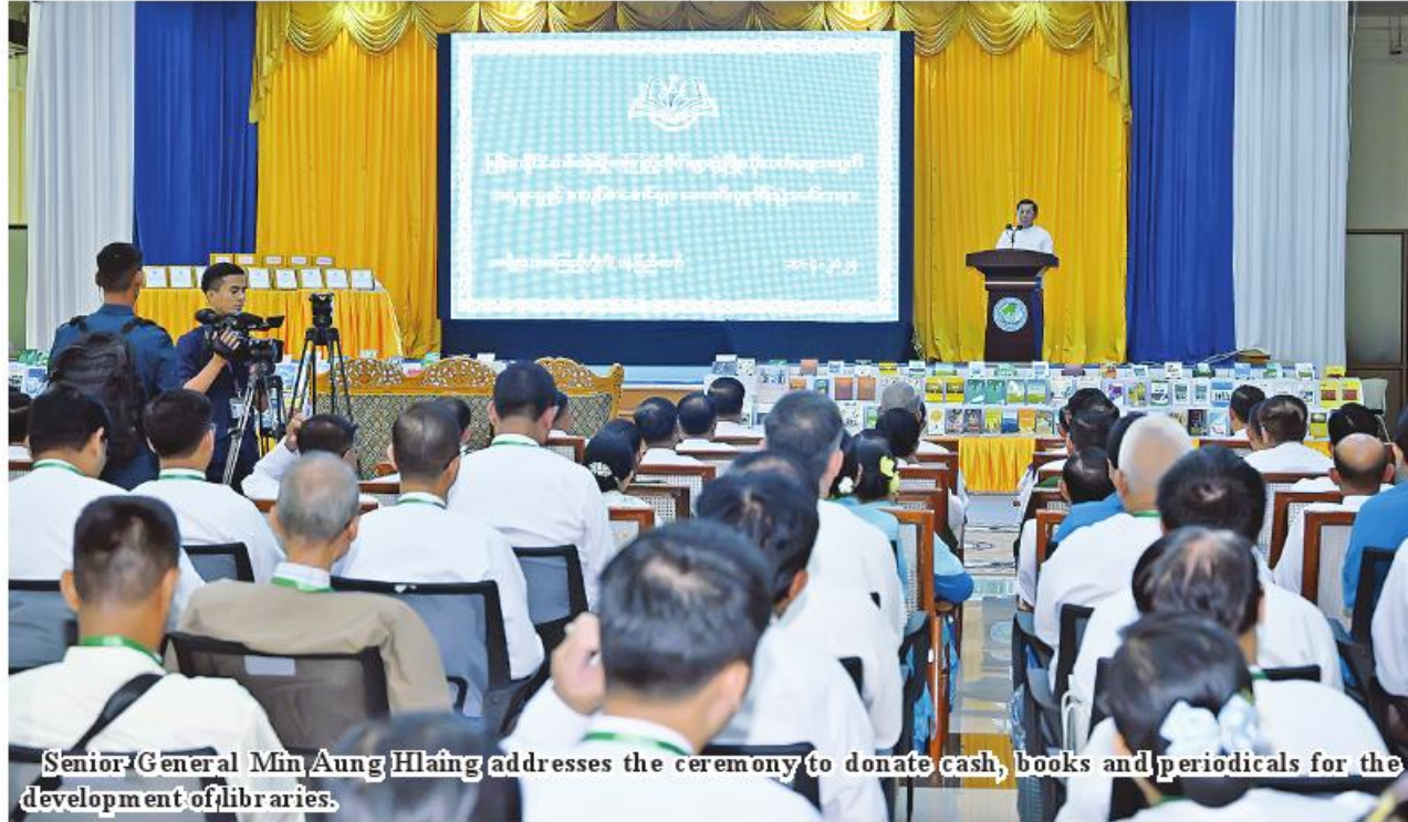
Senior General Min Aung Hlaing addresses the ceremony to donate cash, books and periodicals for the development of libraries.