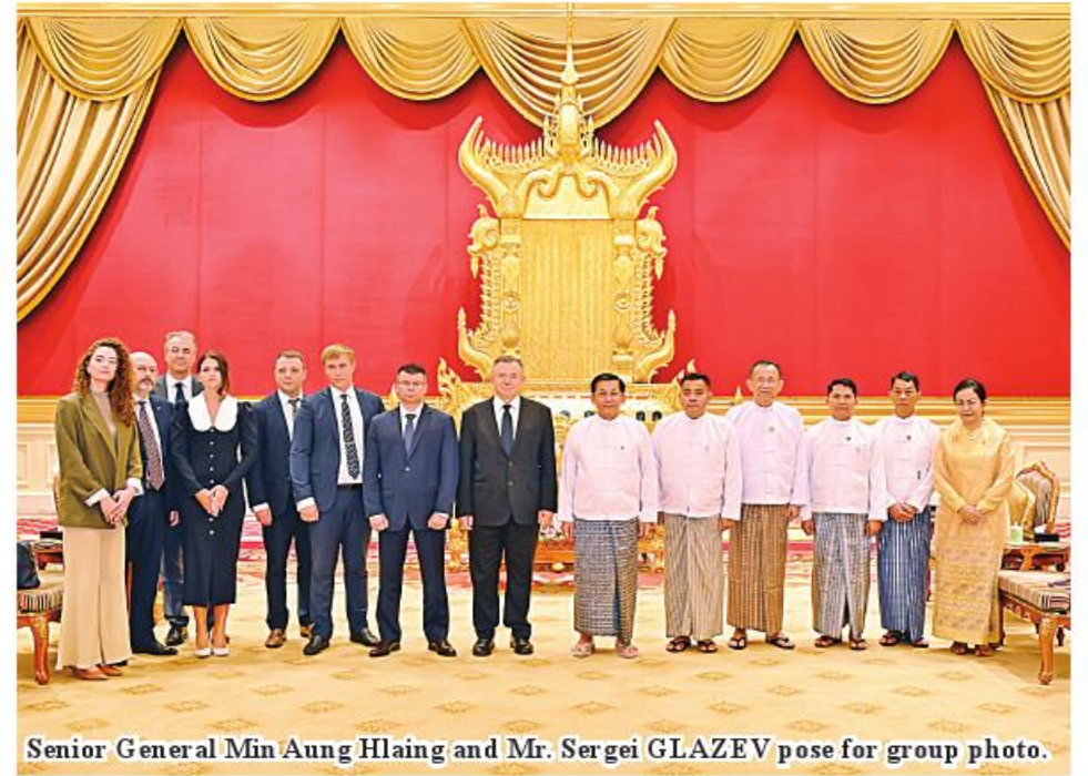
Senior General Min Aung Hlaing and Mr. Sergei GLAZEV pose for group photo.

In the meeting, issues related to mutual export of goods and direct payments between Myanmar and the European Asian Economic Commission, technical cooperation regarding agricultural products, tourism sector development and direct flights, the production of petroleum products and the production of mineral resources into high-grade finished products, cooperation in textile industries and cooperation in other fields between Myanmar and the European Asian Economic Commission were discussed. After the meeting, the Senior General and Mr. Sergei GLAZEV exchanged souvenirs and posed for a documentary photo. 100