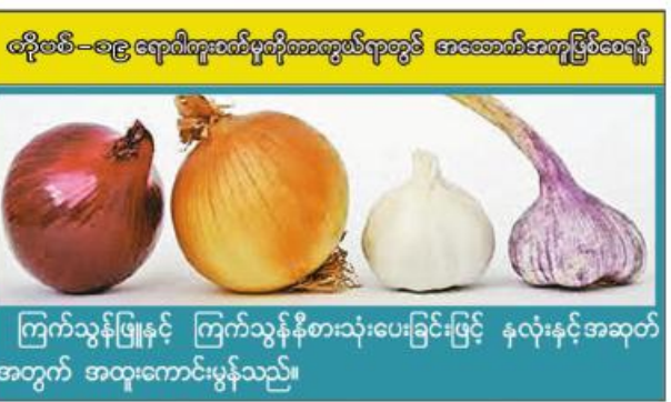
ကြက်သွန်ဖြူနှင့် ကြက်သွန်နီစားသုံးပေးခြင်းဖြင့် နှလုံးနှင့်အဆုတ်အတွက် အထူးကောင်းမွန်သည်။