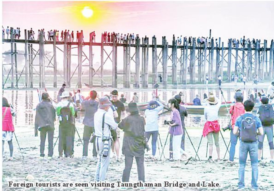
Foreign tourists are seen visiting Taungthaman Bridge and Lake.

Mandalay April 6 As Thingyan festival is nearing, tourists from Southeast Asian countries pay visit to Taungthaman