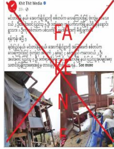
အချို့၏ သတင်းပေးပို့ချက်အရ လုံခြုံရေး တပ်ဖွဲ့များမှ နယ်မြေလုံခြုံရေးသွားရောက်

သာဖြစ်ကြောင်းနှင့် ထိုနေ့တွင်လေကြောင်း ပျံသန်းမှုမရှိကြောင်းကို သက်ဆိုင်ရာ နယ်မြေရှိ လုံခြုံရေးတာဝန်ရှိသူတစ်ဦး၏ ပြောကြားချက်အရ သိရှိရသည်။ အလားတူ ယနေ့နံနက်တွင် ရွှေဘိုမြို့ နယ် ရှားတောရွာကို တပ်မတော်က စစ်ကြောင်းထိုးဝင်ရောက်ပြီး နေအိမ်များ ကို မီးရှို့ဖျက်ဆီးမှုကြောင့် ပြည်သူများ ရွာလုံးကျွတ် ထွက်ပြေးနေရကြောင်း မဟုတ်မမှန် ရေးသားဖော်ပြထားသည်ကို တွေ့ရှိရပြီး ဖြစ်စဉ်အမှန်မှာ အဆိုပါ ကျေးရွာတွင် အကြမ်းဖက်သမားများ ခိုအောင်းလှုပ်ရှားလျက်ရှိကြောင်း အကြမ်း ဖက်မှုကို မလိုလားသော ဒေသခံပြည်သူ