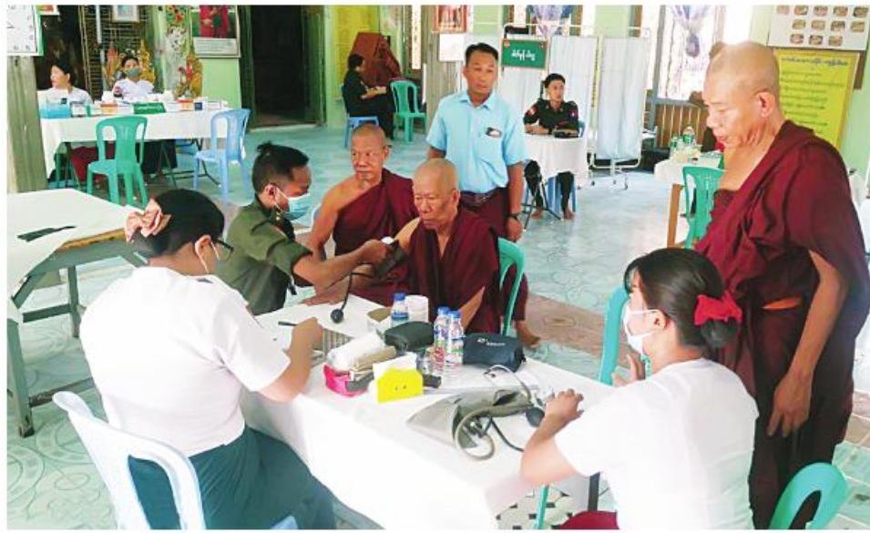
သံဃာတော်များအား အလယ်ပိုင်းတိုင်း ဝန်ထောက်ချုပ် နယ်မြေခံ ဆေးကုသရေး အဖွဲ့က ကျန်းမာရေး စောင့်ရှောက်မှု လုပ်ငန်းများ ဆောင်ရွက်ပေးစဉ်။