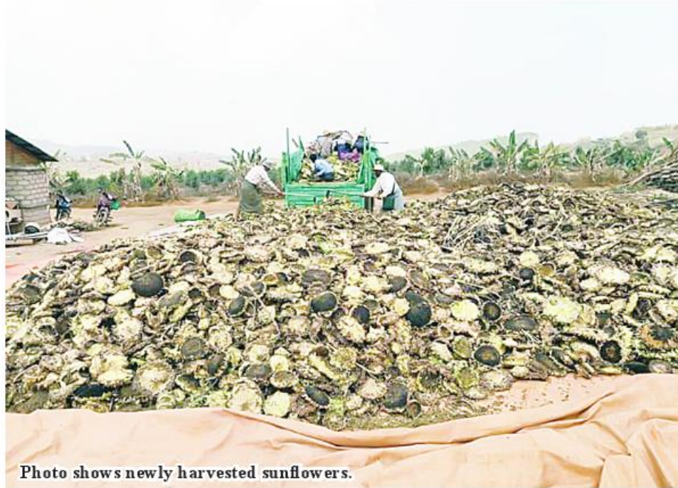
Photo shows newly harvested sunflowers.

Htigyaing April 6 A total of 6,492 acres of sunflowers planted in the winter crop season in Htigyaing Township, Katha District, Sagaing Region,