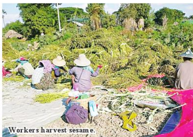
Workers harvest sesame.

ing techniques," he added. The training courses will be conducted under the instructions of the Mandalay Region Department of Fisheries. The topics will be hatching of golden sturgeon and floating cage fishing. Moreover, the fishing camp will distribute healthy fingerlings to the local fish farmers. 185