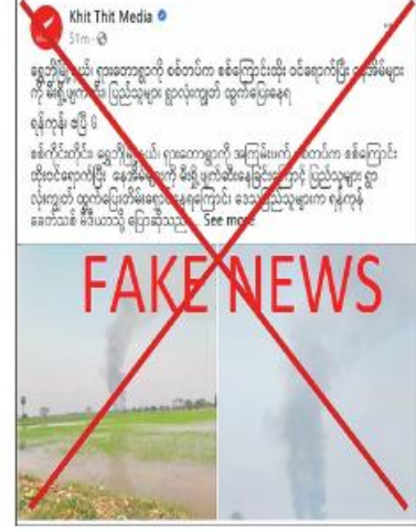
ဆောင်ရွက်မှုကို PDF အမည်ခံ အကြမ်း ဖက်အဖွဲ့များက လက်နက်ကြီးများဖြင့်

ပစ်ခတ်တိုက်ခိုက်ခြင်း၊ Drop ပုံးချတိုက် ခိုက်ခြင်းများ လုပ်ဆောင်ကာကျေးရွာရှိ နေအိမ်အချို့ကို မီးရှို့ဖျက်ဆီးမှုများ ကြောင့်ဒေသခံပြည်သူများ ဘေးလွတ်ရာ သို့ ထွက်ပြေးတိမ်းရှောင်မှုများရှိကြောင်း သိရှိရသည်။ အကြမ်းဖက်အားပေး ပြည်ဖျက်မီဒီယာ များသည် အကြမ်းဖက်သမား၏ လုပ် ရပ်များကို ပြည်သူလူထုက တပ်မတော် အပေါ် အထင်အမြင်လွှဲမှားသွားစေရန် သတင်းတုသတင်းမှားများကို အချိန်ကိုက် ရေးသားဖြန့်ဝေကာ ဝါဒဖြန့်ချိနေခြင်းသာ ဖြစ်ကြောင်း သတင်းရရှိသည်။