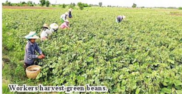
Workers harvest green beans.