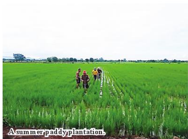
A summer paddy plantation.

aims to benefit all of groups in the project as well as emergence of job opportunities and creation of more linkages between private businesses and foreign market. This year, local farmers expanded 43 acres of summer paddy more than previous year. They have to repay the loan in next six months," he explained. Cultivation of summer paddy through the State economic promotion fund will be 718 acres in Kyaukse District, 100 acres in NyaungU District, 60 acres in TadaU