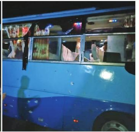
PDF အမည်ခံအကြမ်းဖက်သမားများက မိုင်းထောင်ဖောက်ခွဲပစ်ခတ်ခဲ့သည့် ခရီးသည်တင်စောင့်ယာဉ် ထိခိုက်ပျက်စီးခဲ့မှု မှတ်တမ်းဓာတ်ပုံ။

နေပြည်တော် ၈ ဇူလိုင် CRPH၊ NUG တို့၏ လက်ဝေခံ PDF အမည်ခံအကြမ်းဖက်သမားများက ဧပြီ ၄ ရက်တွင် ဘီးလင်းမြို့နယ်အတွင်း အေးချမ်းစွာခရီးသွားလာနေသော ခရီးသည်တင် ယာဉ်ကို အကြောင်းမဲ့ပစ်ခတ်တိုက်ခိုက်ခဲ့