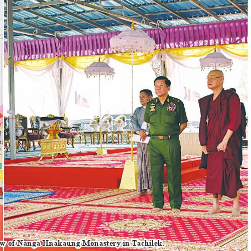
Senior General Min Aung Hlaing inspects preparations to hold the funeral rites of Patron Sayadaw of Nanga Hnakaung Monastery in Tachilek.