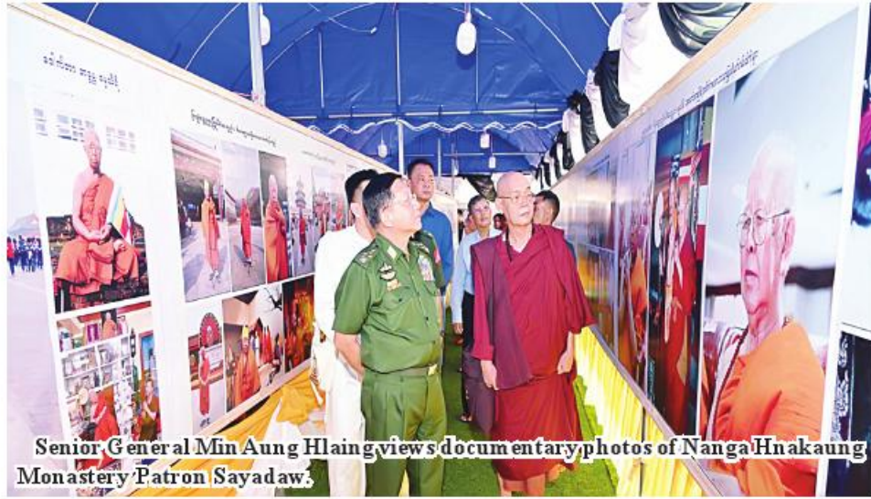
Senior General Min Aung Hlaing views documentary photos of Nanga Hnakaung Monastery Patron Sayadaw.