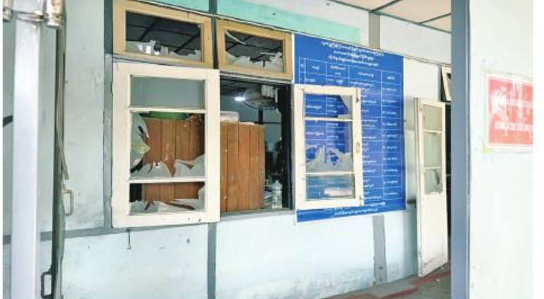
PDF အမည်ခံအကြမ်းဖက်သမားများက မဟာအောင်မြေမြို့နယ်ရှိ လူဝင်မှုကြီးကြပ် ရေးနှင့်ပြည်သူ့အင်အားဦးစီးဌာနရုံးကို လက်လုပ်မိုင်းဖြင့် ပစ်ခတ်တိုက်ခိုက်မှုကြောင့် ထိခိုက်ပျက်စီးမှုကိုတွေ့ရစဉ်။

ရသည်။ ယင်းသို့ တိုက်ခိုက်ခဲ့သည့် အကြမ်းဖက် သမားများကို အမြန်ဆုံးဖော်ထုတ်ဖမ်းဆီး ရမိရေး လုံခြုံရေးတပ်ဖွဲ့ဝင်များက ပြည်သူ လူထုနှင့်ပူးပေါင်း၍ လိုအပ်သည့် လုံခြုံရေး လုပ်ငန်းများ ဆောင်ရွက်လျက်ရှိကြောင်း နှင့် နိုင်ငံအကျိုးစီးပွားဝန်ထမ်းဆောင်နေ သော ဝန်ထမ်းကောင်းများနှင့် အပြစ်မဲ့ ပြည်သူများကို ယခုကဲ့သို့ အကြမ်းဖက် တိုက်ခိုက်နေမှုများအပေါ် ပြည်သူလူထု တစ်ရပ်လုံးအနေဖြင့် ဒေသတွင်းတည်ငြိမ် အေးချမ်းရေးအတွက် လုံခြုံရေး တပ်ဖွဲ့ဝင်များနှင့်အတူ ပူးပေါင်းကာကွယ် သွားကြရန် သတင်းထုတ်ပြန်အပ် ပါသည်။