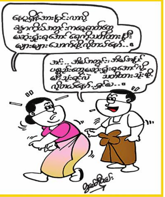
နေပုဒ်အားဖြင့် လာလို့ ဆွဲကုန်သွားတော့ ကရောက်တော့ မဆုံးရှုံးရအောင် ရေကိုသတ်ထားပြီး များများ သောက်ဖို့ လိုတယ်နော်... အင်း... အိမ်အတွင်း၊ အိမ်အပြင် ပစ္စည်းတွေမဆုံးရှုံးရအောင် လိုက်ဖက်ဖွဲ့စည်းပေးရမယ် သတ်ထားသုံးဖို့ လိုတယ်နော်... အင်း... အိမ်အတွင်း၊ အိမ်အပြင် ပစ္စည်းတွေမဆုံးရှုံးရအောင် လိုက်ဖက်ဖွဲ့စည်းပေးရမယ် သတ်ထားသုံးဖို့ လိုတယ်နော်... အင်း... အိမ်အတွင်း၊ အိမ်အပြင် ပစ္စည်းတွေမဆုံးရှုံးရအောင် လိုက်ဖက်ဖွဲ့စည်းပေးရမယ် သတ်ထားသုံးဖို့ လိုတယ်နော်...