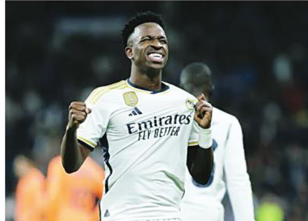
Ref: Sputnik Trs: ML

အခက်အခဲကြောင့် အဆိုပါကစားသမားနှစ်ဦးမှ တစ်ဦးသည် ကလည်း ရိုဒရီဂိုကိုခေါ်ယူနိုင်ရန် ပစ်မှတ်ထားကြိုးပမ်းမှုများ ရှိနေကြောင်း သိရသည်။