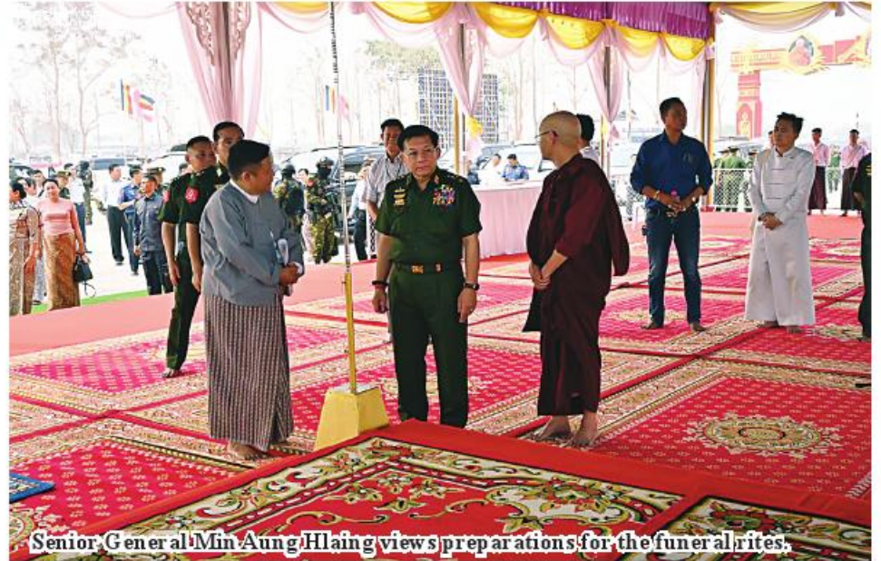
Senior General Min Aung Hlaing views preparations for the funeral rites.

dhamma Jotikadhaja Title in 2001, Abhidhaja Agga Maha Saddhamma Jotika Title in 2005, Abhidhaja Maha Ratha Guru Title in 2021. Thailand also conferred titles on the Sayadaw. The Sayadaw continued his religious work till he passed away at age of 96 and vasa 77. The funeral rites will be held on 6 April on a grand scale. 100