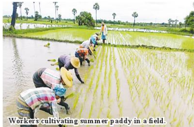
Workers cultivating summer paddy in a field.

Officials of relevant township agriculture departments provide technical assistance for local farmers to successfully grow monsoon crops and summer paddy with the use of natural fertilizers. Moreover, officials inspect paddy farms to be free from pests and to have high yield. 206