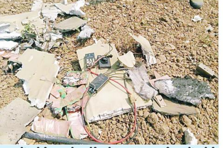
ဖောက်ခွဲဖျက်ဆီးရေးပစ္စည်းများပါရှိသည့် Fixed Wing များကို ဖောက်ခွဲဖျက်ဆီး ထားရှိမှုကိုတွေ့ရစဉ်။

လေကြောင်း လုံခြုံရေးတာဝန်များထမ်း ဆောင်လျက်ရှိသည့် လေကြောင်းရန် ကာကွယ်ရေးတပ်ဖွဲ့များက လေကြောင်း ရန်ကာကွယ်ရေးစနစ်များဖြင့် ထောက်လှမ်း သိရှိခဲ့ရပြီး အဆိုပါ Fixed Wing များ အားလုံးကို လက်ဦးမှရယူ ဟန့်တားနိုင်ခဲ့ သည်။ ထိုသို့ လက်ဦးမှရယူ ဟန့်တားနိုင်ခဲ့ မှုကြောင့် နှစ်စီးမှာ သတ်မှတ်နေရာမရောက် မီ လေထဲတွင်ပေါက်ကွဲပျက်စီးခဲ့ပြီး အခြား Fixed Wing အားလုံးကိုလည်း ပစ်ချ ဟန့်တားနိုင်ခဲ့သည်။ အဆိုပါ ပစ်ချဟန့်တားခဲ့မှုကြောင့် မြေပြင်ပေါ်သို့ပျက်ကျခဲ့သည့် Fixed Wing များအနက် ၁၃ စီးအား သိမ်းဆည်း ရရှိခဲ့ပြီး ၎င်းတို့အနက် လေးစီးတွင် ဖောက်ခွဲဖျက်ဆီးရေးပစ္စည်း များပါရှိလာ သဖြင့် စနစ်တကျဖောက်ခွဲဖျက်ဆီးခဲ့ ရသည်။ အခြားမြေပြင်ပေါ်သို့ ပျက်ကျခဲ့ သည့် Fixed Wing များအား သိမ်းဆည်း ရမိရေးအတွက်လည်း လုံခြုံရေးတပ်ဖွဲ့ဝင် များက ဆက်လက်ဆောင်ရွက်လျက်ရှိ ကြောင်း သိရှိရသည်။ ဖြစ်စဉ်များတွင် လူနှင့်အဆောက်အအုံ များ ထိခိုက်ပျက်စီးမှုမရှိခဲ့ကြောင်းနှင့် လုံခြုံရေး တပ်ဖွဲ့ဝင်များအနေဖြင့် အရေး ပေါ်အခြေအနေများတွင် ဖြစ်ပေါ်လာ သော အခြေအနေများကို လုံခြုံရေး အရ ချက်ချင်းတုံ့ပြန်နိုင်ရေး ဆက်လက် ဆောင်ရွက်လျက်ရှိကြောင်း သတင်း ရရှိသည်။