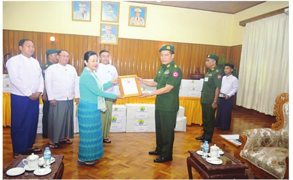
ပြည်ထောင်စုဝန်ကြီး ဦးကိုကိုလွင် လုံခြုံရေးတပ်ဖွဲ့ဝင်များအတွက် စားသောက်ဖွယ်ရာများကို နေပြည်တော်တိုင်းစစ်ဌာနချုပ် တိုင်းမှူး ဗိုလ်ချုပ်စောသန်းလှိုင်ထံ ရက်ပြုပေးအပ်စဉ်။