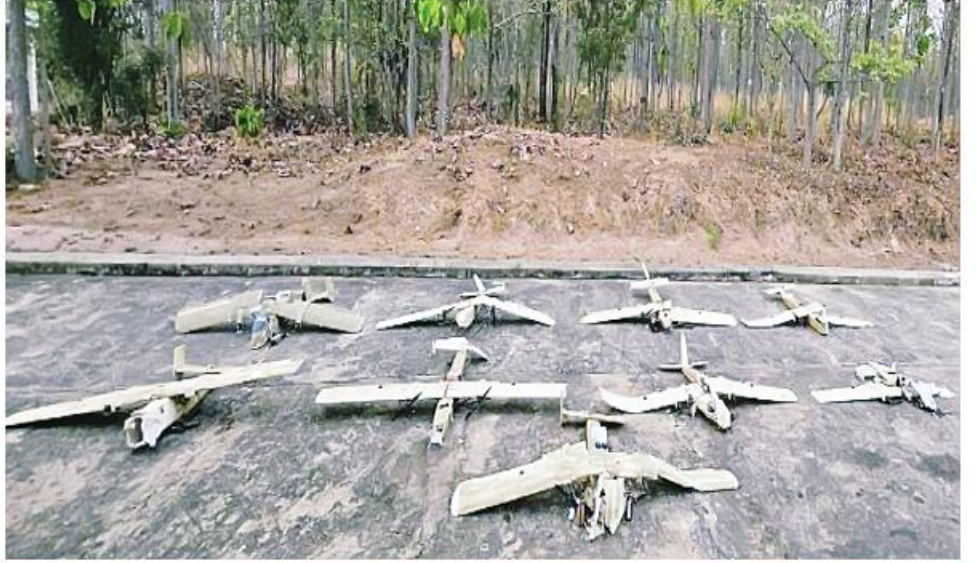
နေပြည်တော်ကောင်စီနယ်မြေ အလောမြို့နယ်နှင့် ဇေယျာသီရိမြို့နယ်တို့ရှိ အရေးကြီးနေရာများကို ဖောက်ခွဲဖျက်ဆီးခြင်းများပြုလုပ်ရန် အကြမ်းဖက်သမားများလွှတ်တင်ခဲ့သည့် Fixed Wing များအားလုံး ပစ်ချဟုတ်တားနိုင်ခဲ့ပြီး သိမ်းဆည်းရမိမှုကိုတွေ့ရစဉ်။

နေပြည်တော်ကောင်စီနယ်မြေ ဇေယျာ သီရိမြို့နယ်နှင့် အလောမြို့နယ်တို့ရှိ အရေးကြီး အဆောက်အအုံများနှင့် နေရာ ဌာနများကို ဖောက်ခွဲဖျက်ဆီးရန်နှင့်ပြည်သူ များ အထိတ်တလန့်ဖြစ်စေရန် ယုတ်မာ ကောက်ကျစ်သည့် အကြံအစည်များဖြင့် အကြမ်းဖက်သမားများသည် ယနေ့နံနက် ၁၀ နာရီခွဲတွင် အလောမြို့နယ်နှင့် ဇေယျာသီရိမြို့နယ်အနီးတို့မှ Fixed Wing များလွှတ်တင်ခဲ့ပြီး အကြမ်းဖက် ဖောက်ခွဲရေးလုပ်ရပ်များ လုပ်ဆောင်နိုင် ရန်ကြံစည်ကြပြီးပါးလာခဲ့သည်။ ထိုသို့ ကြံစည်ကြပြီးပါးလာခဲ့မှုကို နေပြည်တော် ကောင်စီနယ်မြေအတွင်း