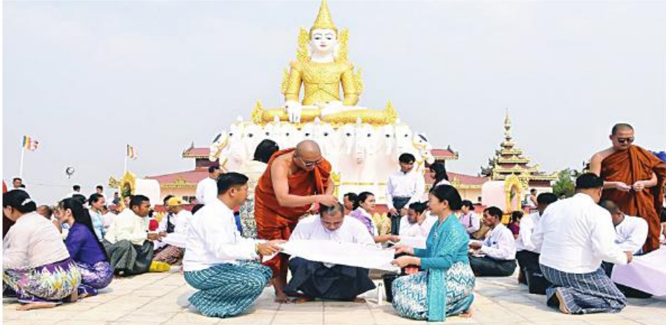
အရှေ့အလယ်ပိုင်းတိုင်းစစ်ဌာနချုပ်၏ အဋ္ဌမအကြိမ်မြောက် စုပေါင်းရဟန်းခံ၊ ရှင်ပြု၊ သီလရှင်ဝတ်အလှူတော်မင်္ဂလာ ကျင်းပစဉ်။