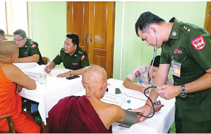
သံဃာတော်များအား မြောက်ပိုင်းတိုင်း စစ်ဌာနချုပ် နယ်လှည့်ဆေးကုသရေးအဖွဲ့က ကျန်းမာရေးစောင့်ရှောက်မှုလုပ်ငန်းများ ဆောင်ရွက်ပေးစဉ်။