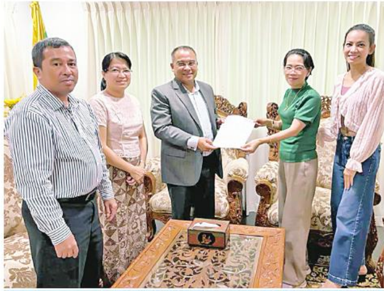
မြန်မာနိုင်ငံသားတစ်ဦး စင်ကာပူနိုင်ငံသို့ သွားရောက်လည်ပတ်စဉ် ပျောက်ဆုံးခဲ့သည့် ငွေသားနှင့်ပစ္စည်းများကို ကာယကံရှင်ထံ ပြန်လည်ပေးအပ်ခဲ့ခြင်း။