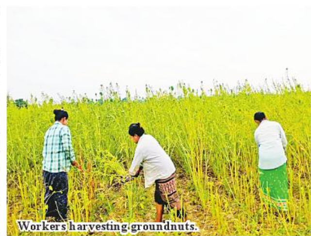
Workers harvesting groundnuts.

Pwintbyu Township has earmarked cultivation of 2,930 acres of groundnut, 6,500 acres of sesame, 12,805 acres of sunflower and 121 acres of niger, totalling 33,851. “In harvesting winter oil crops, groundnut yielded 54.05 baskets, sesame 8.25 baskets, sunflower 25.50 baskets and niger 10.70 baskets. Moreover, they could earn incomes from sale of oil crops. Our department helps local farmers to apply good agricultural practice in order to expand sown acre of oil crops year after year and provides necessary agricultural techniques to local farmers,” said Daw Moe Moe Wai. Township Agriculture