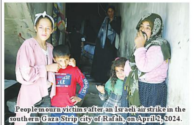
People mourn victims after an Israeli air strike in the southern Gaza Strip city of Rafah, on April 2, 2024.

"How will my two young children live without me, and how will I bear being away from them? What sin have we committed to be displaced in this tragic way?" exclaimed the mother. The 35-year-old mother moved to Gaza from Egypt after she married a Palestinian man ten years ago. She told Xinhua that her life had been happy until everything was shattered after the conflict broke out in Gaza in October last year. Xinhua