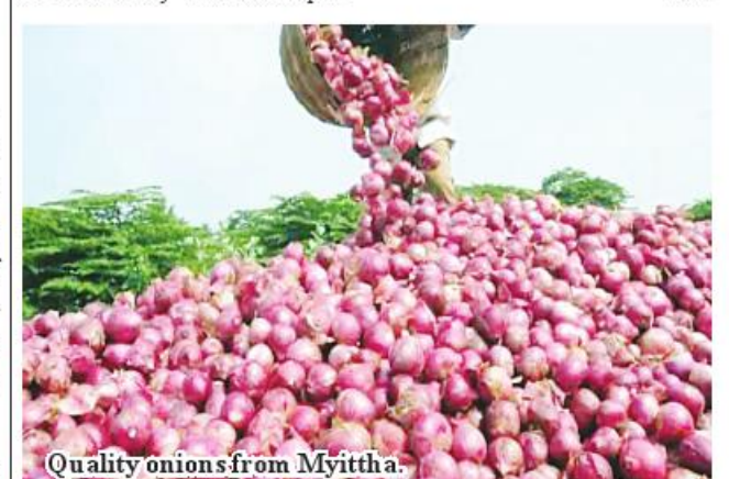
Quality onions from Myittha.

sent. We see onion produced from Myittha is in high trading,” she added. On 29 March, Myittha’s onion fetched K3,100 per viss in Mandalay market.