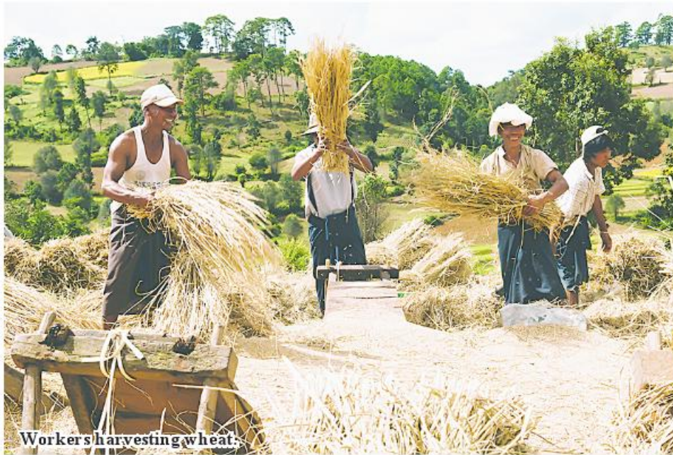
Workers harvesting wheat.