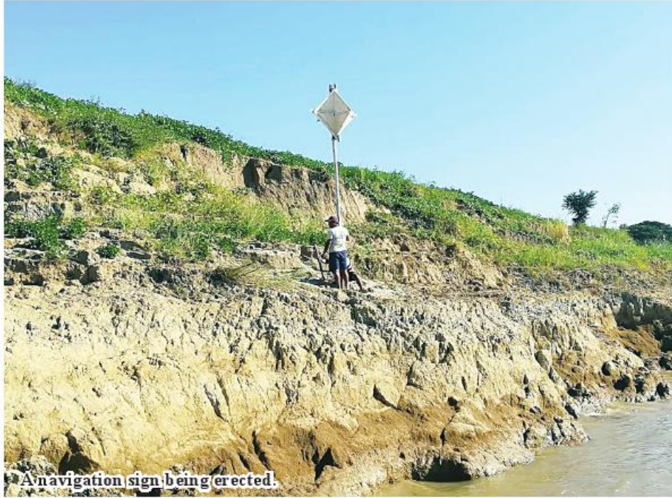
Anavigation sign being erected.