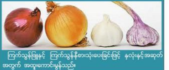
ကြက်သွန်ဖြူနှင့် ကြက်သွန်နီစားသုံးပေးခြင်းဖြင့် နှလုံးနှင့်အဆုတ် အတွက် အထူးကောင်းမွန်သည်။

ဧည့်သည်-ဧည့်သည်များအားလုံးအားလုံးအားလုံး အထောက်အကူပြုနိုင်ရန်