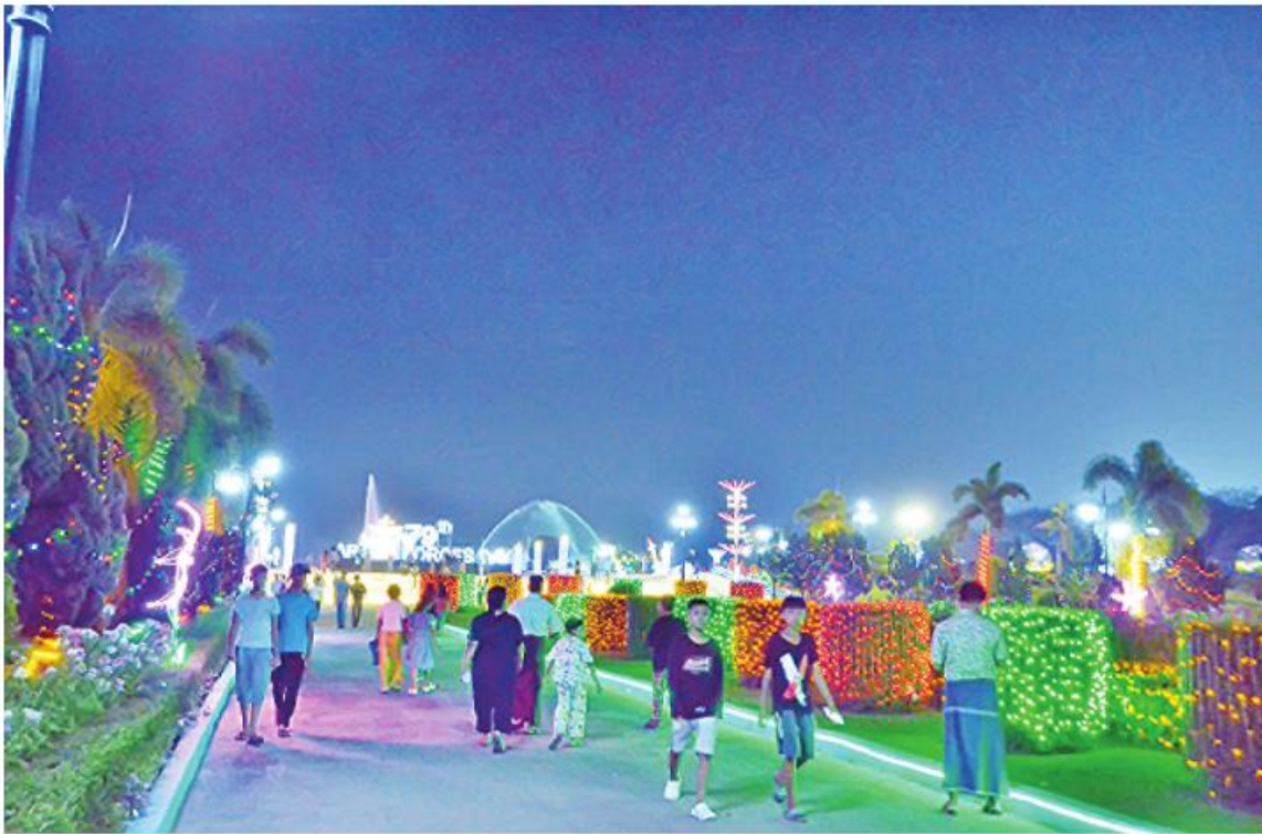
(၇၉)နှစ်မြောက် တပ်မတော်နေ့ကို ဂုဏ်ပြုသောအားဖြင့် နေပြည်တော်ရှိ တပ်မတော်ပန်းခြံတွင် မီးအလှများ၊ ပန်းအလှများဖြင့် အလှဆင်ထားရာ လာရောက်အပန်းဖြေလည်ပတ်သူများဖြင့် စည်ကားနေမှုကို တွေ့ရစဉ်။

နေပြည်တော် မတ် ၃၀ ၂၀၂၄ ခုနှစ် မတ် ၂၇ ရက်တွင် ကျရောက်သည့် (၇၉)နှစ်မြောက် တပ်မတော်နေ့ကို ဂုဏ်ပြုသောအားဖြင့် နေပြည်တော်ကောင်စီနယ်မြေအတွင်းရှိ ပင်လောင်းမီးပွိုင့်လမ်းဆုံနှင့် ကာကွယ်ရေးဦးစီးချုပ်ရုံး(ကြည်း) ဝင်းအတွင်း၌ မျိုးချစ်စိတ်ဓာတ် ရှင်သန်ထက်မြက်ပြီး ဇာတိသွေး၊ ဇာတိမာန်တက်ကြွစေမည့် တပ်မတော်(ကြည်း၊ ရေ၊ လေ) စစ်သည်များ၏ လှုပ်ရှားမှုပုံရိပ်များကို ဖော်ကျူးထားသော ပို့စတာကြီးများကို စိုက်ထူထားရှိသည်။ အလားတူ ပင်လောင်းလမ်းဆုံမှ စစ်ရေးပြကွင်းကြီးသို့ သွားရောက်သည့် လမ်းတစ်လျှောက်တွင်လည်း တပ်မတော်၏ဆောင်ပုဒ်များကို မြန်မာ-အင်္ဂလိပ်နှစ်ဘာသာဖြင့် စိုက်ထူထားပြီး စစ်ရေးပြကွင်းအဝင်ဝရှိ မုခ်ဦးကြီးကိုလည်း စာမျက်နှာ ၁၆ ကော်လံ ၅၂။