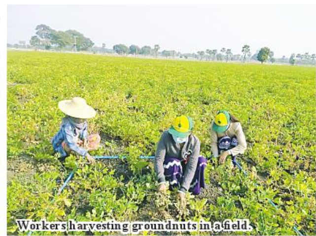
Worker harvesting groundnuts in a field.

In monsoon of 2023-24 financial year, local farmers planted 5,730