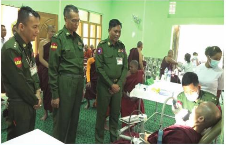
သံဃာတော်များအား အလယ်ပိုင်းတိုင်းစစ်ဌာနမှ နယ်မြေခံစားကုသရေးအဖွဲ့က ကျန်းမာရေးစောင့်ရှောက်မှုလုပ်ငန်းများ ဆောင်ရွက်ပေးနေမှုကို တာဝန်ရှိသူများက ကြည့်ရှုအားပေးစဉ်။

ထိုကဲ့သို့ CRPH၊ NUG နှင့် ယင်းတို့၏ လက်အောက်ခံအဖွဲ့အစည်းများ၊ ယင်းတို့နှင့် ဆက်သွယ်နေသော အဖွဲ့အစည်းများ၊ လူပုဂ္ဂိုလ်များသည် နိုင်ငံတော်တည်ငြိမ်အေးချမ်းရေးကို ပျက်ပြားစေရန်နှင့် အစိုးရယန္တရားများ ပျက်ပြားစေရန်ရည်ရွယ်လျက် လှုံ့ဆော်ခြင်း၊ ဝါဒဖြန့်ခြင်းများပြုလုပ်ခဲ့မှုအပေါ် အားပေးကူညီခြင်းပြုလုပ်ခဲ့သူများကို ဥပဒေနှင့်အညီ ထိရောက်စွာ အရေးယူသွားမည်ဖြစ်ကြောင်းနှင့် ထိုသို့လှုံ့ဆော်သူ၊ ဝါဒဖြန့်သူများကို ဆက်လက်ဖော်ထုတ်အရေးယူသွားမည်ဖြစ်ကြောင်း မိဘပြည်သူများ သိရှိနိုင်ရေး အသိပေးသတင်းထုတ်ပြန်အပ်ပါသည်။