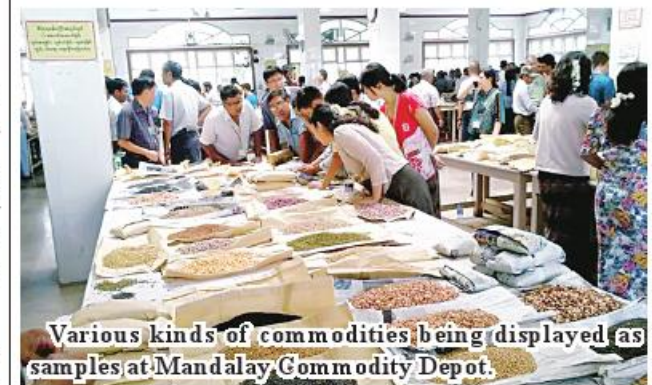
Various kinds of commodities being displayed as samples at Mandalay Commodity Depot.