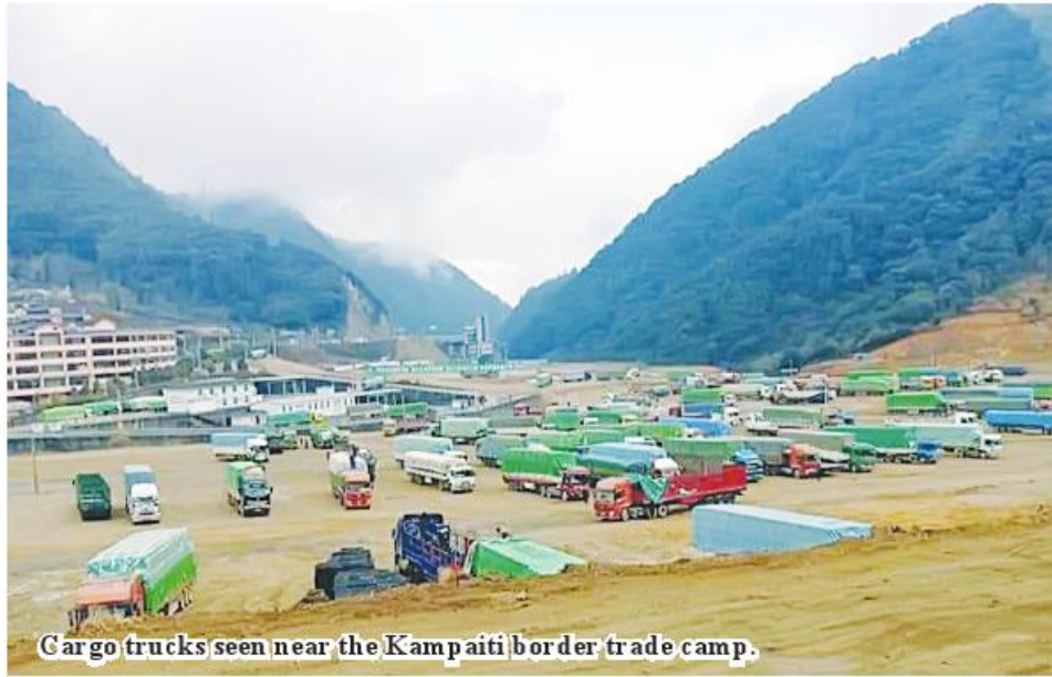
Cargo trucks seen near the Kampaiti border trade camp.