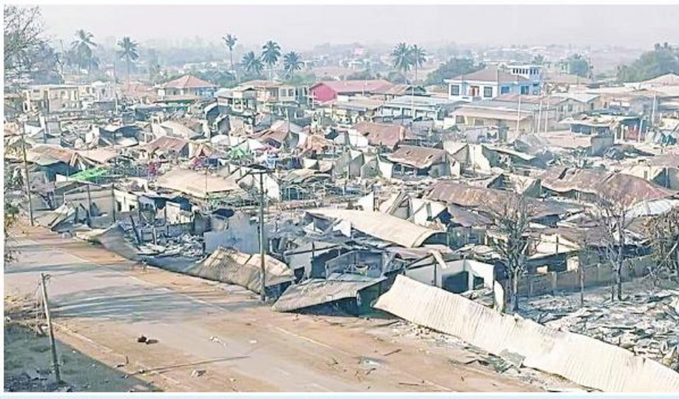
အကြမ်းဖက်သောင်းကျန်းသူများ ခိုင်းထောင်ဖောက်ခွဲမီးရှို့ဖျက်ဆီးခဲ့သည့် ဆီဆိုင်မြို့ မှတ်တမ်းဓာတ်ပုံ။