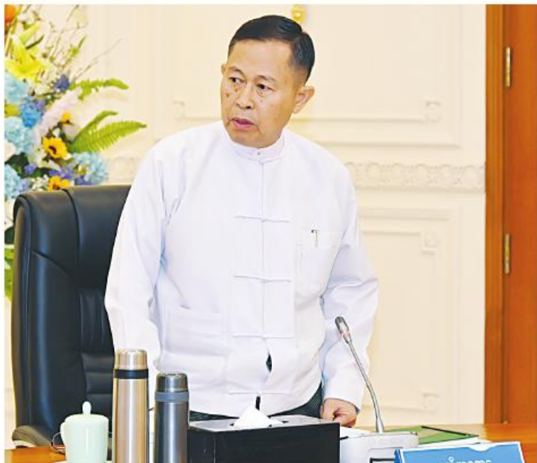
နိုင်ငံတော်စီမံအုပ်ချုပ်ရေးကောင်စီဒုတိယဥက္ကဋ္ဌ ဒုတိယဝန်ကြီးချုပ် ဒုတိယ ဝိုင်းချုပ်မျိုးကြီးစိုးဝင်း ဆွေးနွေးတင်ပြစဉ်။

ဆောင်ရွက်နိုင်ခဲ့ကြောင်း၊ ပြည်ပကြေးမြီ များကိုလည်း သုံးနှစ်တာကာလအတွင်း အမေရိကန်ဒေါ်လာ ၂ ဒသမ ၂ ဘီလီယံ ပြန်လည်ပေးဆပ်နိုင်ခဲ့ကြောင်း၊ ပြန်ဆပ်ငွေ အများစုမှာလည်း ယခင်အစိုးရအဆက်ဆက် ချေးယူခဲ့သည့် အရင်းငွေများဖြစ်ကြောင်း။ စိုက်ပျိုးရေးထုတ်ကုန်များ တိုးတက် ထုတ်လုပ်နိုင်ရေး ဆောင်ရွက်ရာတွင် နှိုင်းကောင်းချီးမြှင့်ခြင်း၊ ပန်းတိုင် ရည်မှန်းချက် အထွက်နှုန်းတိုးတက်အောင် ဆောင်ရွက်ခြင်း၊ သီးထပ်စွမ်းအားတိုးချဲ့၍ အထွက်နှုန်းတိုးတက်အောင် ဆောင်ရွက် ခြင်းဟု အပိုင်း သုံးခုရှိရာ မိမိတို့အစိုးရ အနေဖြင့် ပန်းတိုင်ရည်မှန်းချက် အထွက် နှုန်းတိုးတက်အောင် ဆောင်ရွက်ခြင်းနှင့် သီးထပ်စွမ်းအားတိုးချဲ့၍ အထွက်နှုန်း တိုးတက်အောင် ဆောင်ရွက်ခြင်းတို့ကို အထူးအလေးထား ဆောင်ရွက်လျက်ရှိ