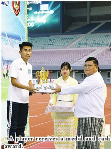
A player receives a medal and cash award.