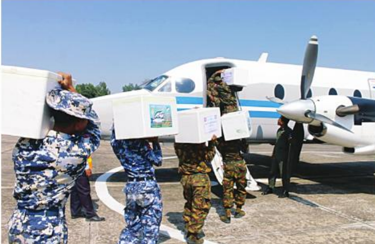
နိုင်ငံတော်ကာကွယ်ရေးနှင့် လုံခြုံရေးတာဝန်များကို စွမ်းစွမ်းတမ်းတမ်းဆောင်လျက်ရှိသော လုံခြုံရေးတပ်ဖွဲ့ဝင်များအတွက် စေတနာရှင်ပြည်သူများက လှူဒါန်းသည့် ရေချိုငါးတန် ပိဿာ ၅၀၀ ကို တပ်မတော်လေယာဉ်ဖြင့် ပို့ဆောင်ပေးစဉ်။

နေပြည်တော် မတ် ၂၉ နိုင်ငံတော်ကာကွယ်ရေးနှင့် လုံခြုံရေးတာဝန်များကို စွမ်းစွမ်းတမ်းတမ်းဆောင်လျက်ရှိသော လုံခြုံရေးတပ်ဖွဲ့ဝင်များအတွက် စေတနာရှင်ပြည်သူများက လှူဒါန်းသည့် ရေချိုငါးတန် ပိဿာ ၅၀၀ ကို တပ်မတော်လေယာဉ်ဖြင့် ပို့ဆောင်ပေးစဉ်။ ထိုသို့ ပေးအပ်လျက်ရှိရာ ယနေ့နေ့လယ်ပိုင်းတွင် ဧရာဝတီတိုင်းဒေသကြီးပုသိမ်မြို့ရှိ စေတနာရှင်ပြည်သူများက လုံခြုံရေးတာဝန်များကို စွမ်းစွမ်းတမ်းတမ်းဆောင်လျက်ရှိသည့် လုံခြုံရေးတပ်ဖွဲ့