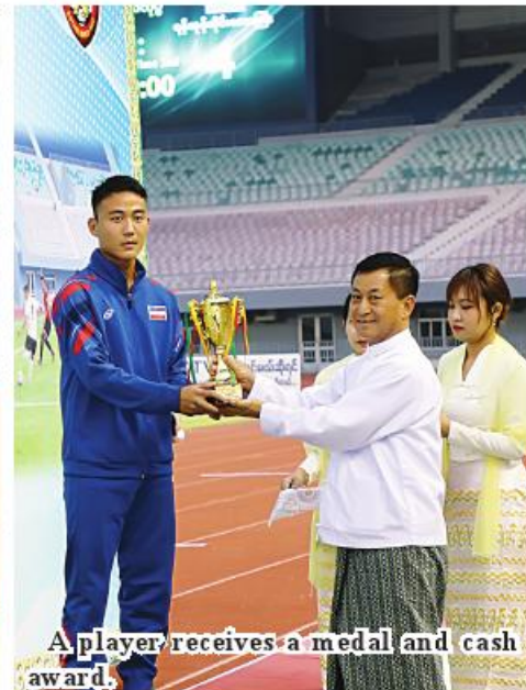
A player receives a medal and cash award.