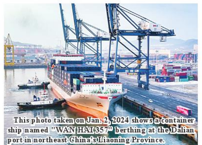
This photo taken on Jan. 2, 2024 shows a container ship named "WAN HAI 357" berthing at the Dalian port in northeast China's Liaoning Province.