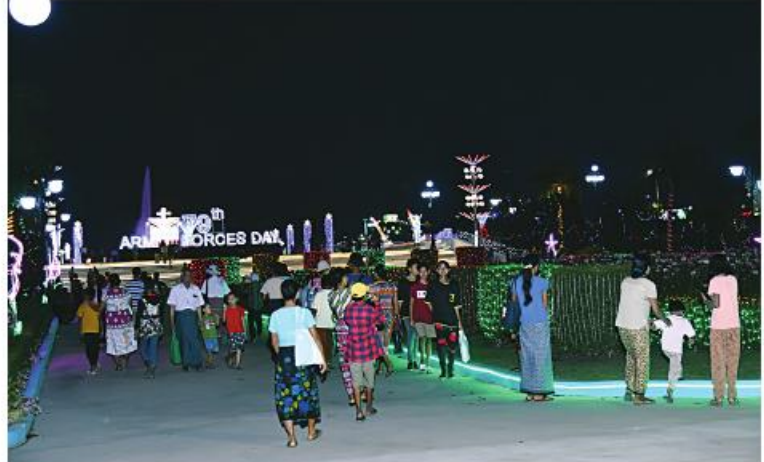
နေပြည်တော်စစ်ရေးပြကွင်းကြီးရှေ့ရှိ တပ်မတော်ပန်းခြံတွင် လာရောက်အပန်းဖြေလည်ပတ်ကြသူများဖြင့် စည်ကားလျက်ရှိသည်ကို တွေ့ရစဉ်။

နေပြည်တော် မတ် ၂၉ ၂၀၂၄ ခုနှစ် မတ် ၂၇ ရက်တွင်ကျရောက်သည့် (၇၉)နှစ်မြောက် တပ်မတော်နေ့ကို ဂုဏ်ပြုသောအားဖြင့် နေပြည်တော်ကောင်စီနယ်မြေအတွင်းရှိ ပင်လောင်းမီးပွိုင်လမ်းဆုံနှင့် ကာကွယ်ရေးဦးစီးချုပ်ရုံး (ကြည်း) ဝင်းအတွင်း၌ မျိုးချစ်စိတ်ဓာတ်ရှင်သန်ထက်မြက်ပြီး ဇာတိသွေး၊ဇာတိမာန်တက်ကြွစေမည့် တပ်မတော်(ကြည်း)ရေလေ့စစ်သည်များ၏ လှုပ်ရှားမှုပုံရိပ်များကို ဖော်ကျူးထားသော ပိုစတာကြီးများကို စိုက်ထူထားရှိသည်။ အလားတူ ပင်လောင်းလမ်းဆုံမှ စစ်ရေးပြကွင်းကြီးသို့ သွားရောက်သည့် လမ်းတစ်လျှောက်တွင်လည်း တပ်မတော်၏ဆောင်ပုဒ်များကို မြန်မာ-အင်္ဂလိပ်