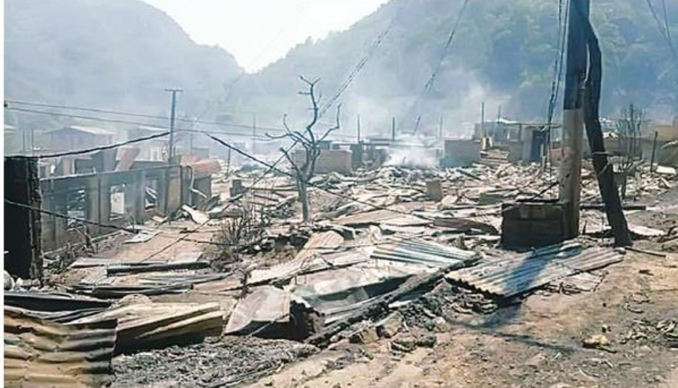
ရှမ်းပြည်နယ်(တောင်ပိုင်း) ဟိုပုံးမြို့နယ် မဲနယ်တောင်ဒေသရှိ ပအိုဝ်းတိုင်းရင်းသားများနေထိုင်သည့် ကျေးရွာများကို PNLO၊ KNDF၊ PDF အကြမ်းဖက်သောင်းကျန်းသူများက နေအိမ်အဆောက်အအုံများကို မီးရှို့ဖျက်ဆီးခဲ့သည့် မှတ်တမ်းဓာတ်ပုံ။