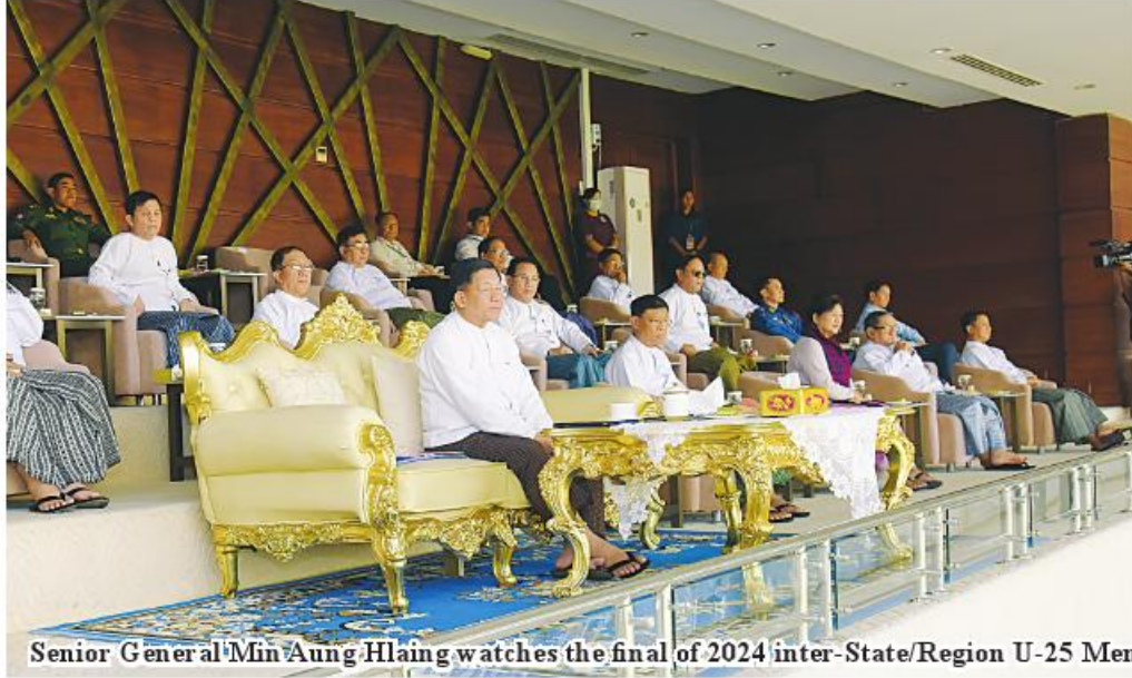
Senior General Min Aung Hlaing watches the final of 2024 inter-State/Region U-25 Men's Football Tournery.