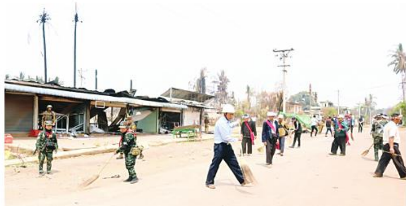
Tatmadaw members, MPF members, departmental staff, local militiamen and local people collectively clearing debris in Hsihseng.