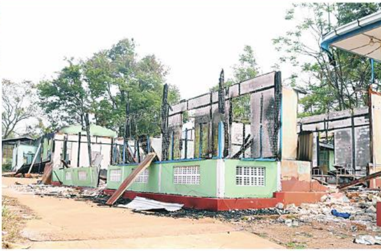
PNLO၊ KNDF၊ PDF အကြမ်းဖက်သောင်းကျန်းသူများက ဆီဆိုင်မြို့တွင်းရှိ မြို့နယ်ကျန်းမာရေးဦးစီးဌာနကို ဖျက်ဆီးထားသည့် မှတ်တမ်းဓာတ်ပုံ။