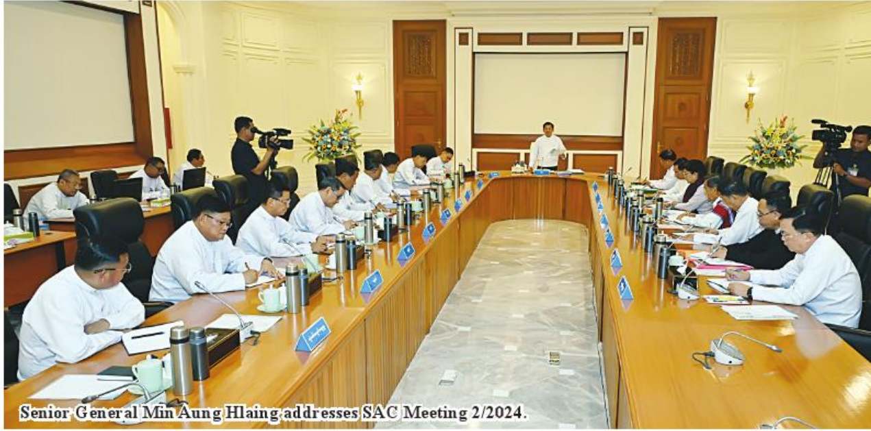
Senior General Min Aung Hlaing addresses SAC Meeting 2/2024.

Nay Pyi Taw March 29 The State Administration Council meeting 2/2024 took place at the meeting hall of the Chairman of the State Administration Council Office in Nay Pyi Taw this afternoon, with an address by SAC Chairman Prime Minister Senior General Min Aung Hlaing.