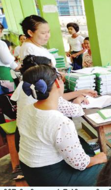
ရခိုင်ပြည်နယ် အထက(မြေပုံ)၌ ကျောင်းအပ်လက်ခံရေး ဆောင်ရွက်ပေးစဉ်။

ပြည်သူတွေထံ အမြန်ဆုံးရောက်ရှိရေး၊ ဆေးရုံဆေးခန်းများ အမြန်ဆုံးဖွင့်လှစ် နိုင်ရေး ကြိုးပမ်းဆောင်ရွက်ခဲ့ကြောင်း သိရပါတယ်။