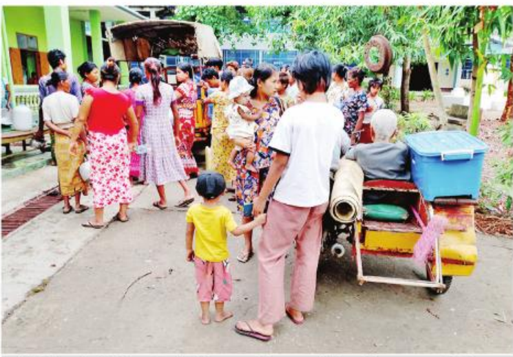
ရခိုင်ပြည်နယ် မြေပုံမြို့နယ် မုန်တိုင်းအန္တရာယ်ကျရောက်နိုင်သည့်နေရာများမှ ပြည်သူများအား ဘေးလွတ်ရာသို့ရွှေ့ပြောင်းပေးစဉ်။

အစည်းအဝေးမှာ နိုင်ငံတော်ဝန်ကြီးချုပ်က ပြီးခဲ့တဲ့ရက်ပိုင်းအတွင်း မုန်တိုင်းသတိပေးချက်တွေ ဆက်တိုက်ထုတ်ပြန်ပေးခဲ့တဲ့ အကြောင်း၊ လွန်ခဲ့တဲ့ သုံးရက်ခန့်ကတည်းက အနီရောင်အဆင့် မုန်တိုင်းသတိပေး