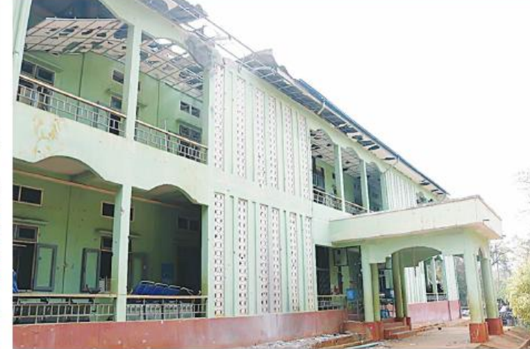
PNLO၊ KNDF၊ PDF အကြမ်းဖက်သောင်းကျန်းသူများက ဆီဆိုင်မြို့တွင်းရှိ အထွေထွေအုပ်ချုပ်ရေးဦးစီးဌာနကို ဖျက်ဆီးထားသည့် မှတ်တမ်းဓာတ်ပုံ။