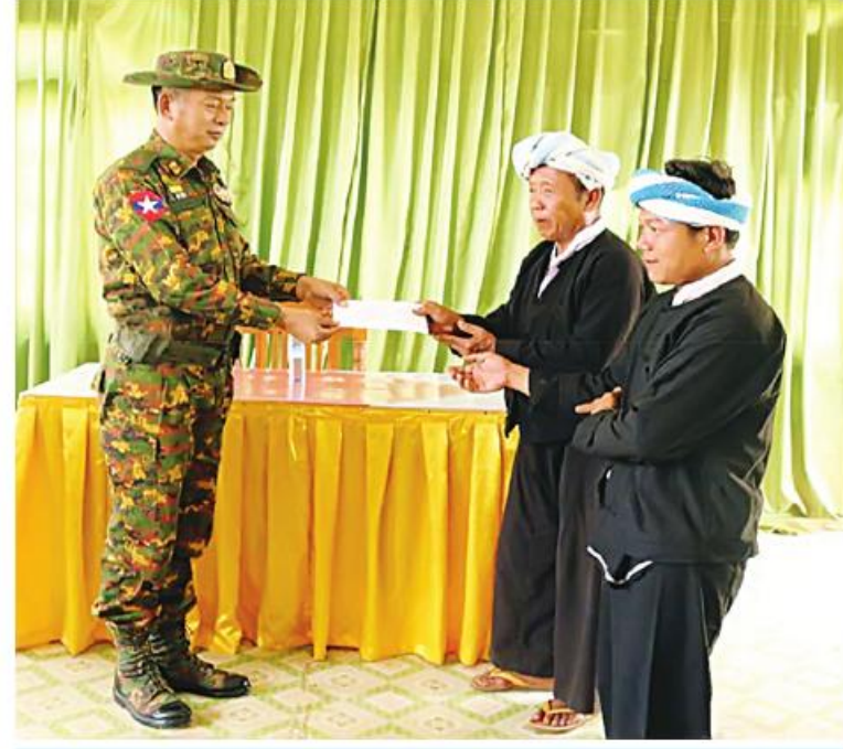
ကာကွယ်ရေးဦးစီးချုပ်ရုံး(ကြည်း)မှ ဗိုလ်ချုပ်ချိုင်နိုင်ဦး ဆီဆိုင်မြို့ရှိ ဌာနဆိုင်ရာဝန်ထမ်းများ၊ လုံခြုံရေးတပ်ဖွဲ့ဝင်များနှင့် တွေ့ဆုံအမှာစကားပြောကြားပြီး လိုအပ်သည်များညှိနှိုင်းဆောင်ရွက်ပေးနေသည့် မှတ်တမ်းဓာတ်ပုံ။