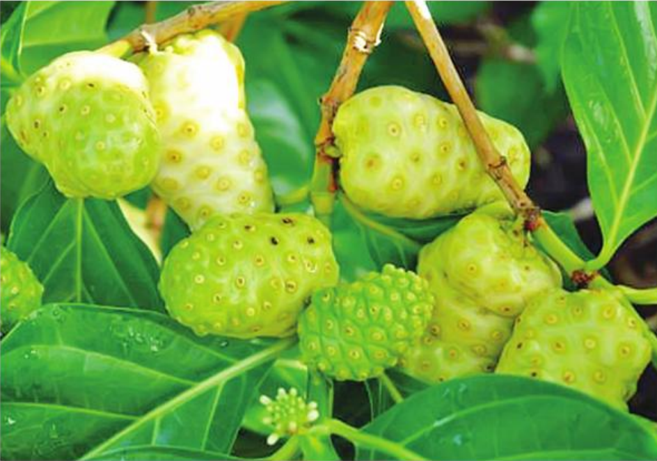
ဆေးဖက်ဝင် ရဲယိုသီးကို တွေ့ရစဉ်။

ဖြေ ။ ။ ရာသီဥတုအကူးအပြောင်းမှာ ဖြစ်ပွားလေ့ရှိတဲ့ အဖျားရောဂါကို ကာကွယ်ကုသနိုင်ဖို့နည်းလမ်းတွေက- ၁။ နေ့စဉ်ရေချိုးချိန်ကို နေမုန်းမတည့်ခင်အချိန်အတွင်းပဲ ချိုးပါ။ နေ့လယ်နေကျော်သွားချိန် ညနေနေဝင်စအချိန်တွေမှာ ရေမချိုးပါနဲ့။ အခိုးငုပ်ပြီး ဖျားတတ်ပါတယ်။ ၂။ ဖျားချင်သလို စိတ်ကမြစ်နေရင် ကွမ်းရွက်၊ ချင်း၊ ထန်းလျက်ပြုတ်ရည်