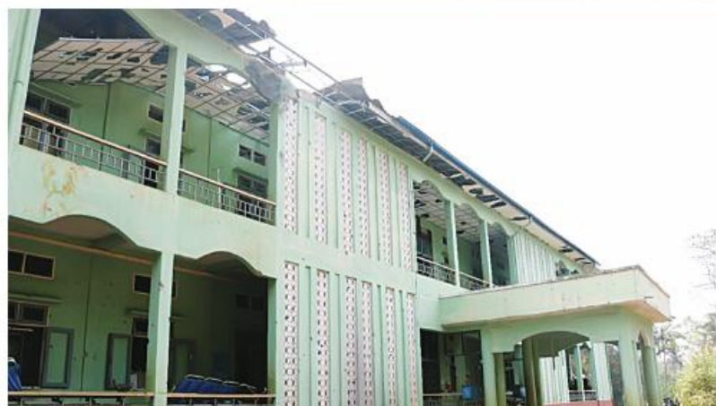
Photo shows the Township People's Hospital in Hsihseng vandalized by PNLO, KNDF, and PDF.