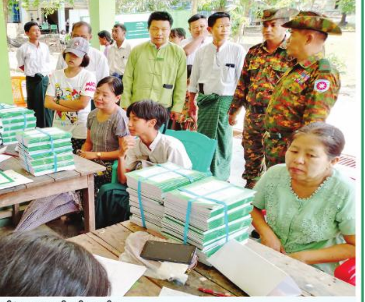
ရခိုင်ပြည်နယ် အထက(မြေပုံ)၌ ကျောင်းအပ်လက်ခံရေး ဆောင်ရွက်ပေးစဉ်။

ဒီကနေ့ နိုင်ငံတော်အစိုးရရဲ့ မြန်မာ ပြည်သူတစ်ရပ်လုံးက မြေပုံမြို့နယ်အပါ အဝင် ရခိုင်ပြည်နယ်အတွင်းမှာရှိကြတဲ့ မြို့နယ်တွေအားလုံး ဖွံ့ဖြိုးတိုးတက်စေချင် တယ်။ တည်ငြိမ်စေချင်တယ်။ အေးချမ်း စေချင်တယ်။ လုပ်စီးပွားကိုင်စီးပွားတွေ တိုးစေချင်တယ်ဆိုတာ မိုခါကသက်သေပဲ။ မုန်တိုင်းကျရောက်တော့မယ်ဆိုတာသိတာ နဲ့ မိဘကသားသမီးတွေအပေါ် စိတ်ပူ သလိုပဲ နိုင်ငံတော်အကြီးအကဲတွေ ကိုယ်တိုင်စစ်တွေမြို့ကို အမြန်ဆုံးသွား ရောက်တယ်။ စီမံကွပ်ကဲတယ်။ လိုအပ်တဲ့ အထောက်အပံ့တွေ အချိန်မီရအောင်