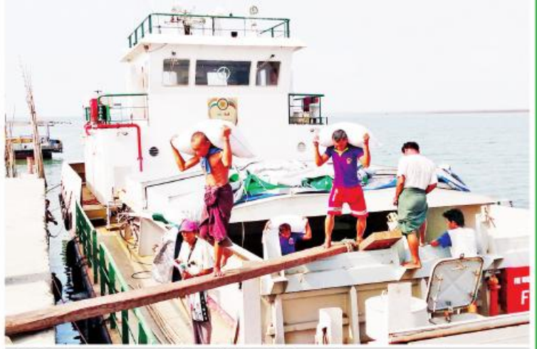
ရခိုင်ပြည်နယ် မြေပုံမြို့နယ် ငှက်ပင်လယ်ဆိပ်ကမ်းသို့ ရောက်ရှိလာသော စားရေရိက္ခာများအား ပြောင်းရွှေ့နိုင်ရေး ဆောင်ရွက်နေစဉ်။

လူနေအဆောက်အအုံပျက်စီးမှုကတော့ တစ်စိတ်တစ်ပိုင်းပျက်စီးမှုအဆောက်အအုံ ၆၃၉၁ လုံး၊ လုံးဝပျက်စီးမှု ၁၁၂၈ လုံးနှင့် တဲအိမ် ၁၁၂၈ လုံး ပျက်စီးသွားခဲ့ပါတယ်။ ဌာနဆိုင်ရာ ရုံးအဆောက်အအုံ ၂၉ လုံး ပျက်စီးခဲ့ပါတယ်။ ကျောင်းအနေနဲ့ကတော့ မူလတန်း၊ အလယ်တန်း ၂၄ ကျောင်း၊ အထက်တန်း ၁၅ ကျောင်းပျက်စီးပြီးတော့ ကျေးလက်ကျန်းမာရေးဌာနနှစ်ခု၊ ဆေးရုံဆေးခန်းကိုးခု ပျက်စီးခဲ့ပါတယ်။ လူနေ