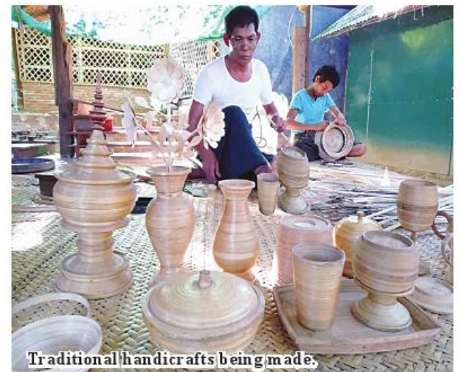
Traditional handicrafts being made.

industries, six minerals industries, 26 transport vehicle assembling industries, 11 electronic industries, 11 machinery industries, and 126 general small-scale industries, totalling 590. "We slated to register 445 industries of businesspersons this financial year but we have allowed registration of 590 industries. It aims to emerge small-scale industrial businesspersons in the region. So, we allow registration for manageable scale businesspersons to legally produce products in relevant areas," he explained. In Mandalay Region, the department allows registration for the industries personal and cosmetic industries, weaving, Myanmar traditional handicraft workers and more than three workers to operate handiworks, foodstuffs, industries. 185