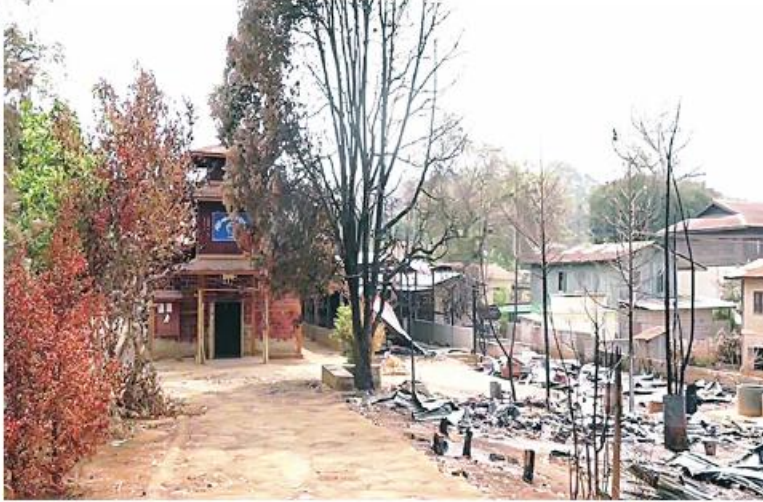
PNLO၊ KNDF၊ PDF အကြမ်းဖက်သောင်းကျန်းသူများက ဆီဆိုင်မြို့တွင်းရှိ စရစ်ယာန်ဘုရားရှိခိုးကျောင်းကို ဖျက်ဆီးထားသည့် မှတ်တမ်းဓာတ်ပုံ။