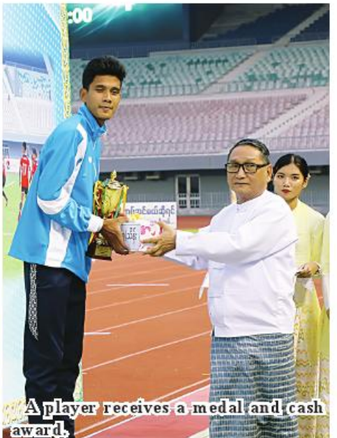
A player receives a medal and cash award.