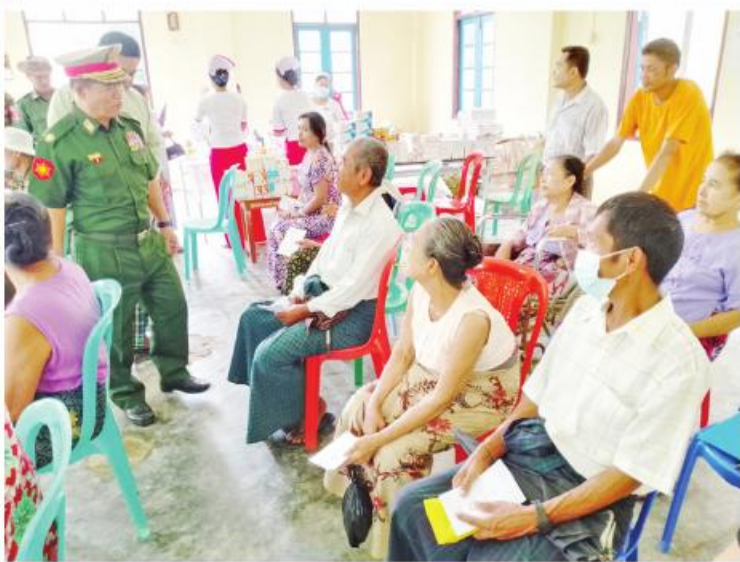
ရခိုင်ပြည်နယ် မြေပုံမြို့နယ် ပြည်သူ့ဆေးရုံအစည်းအဝေးခန်းမ၌ လေဘေးသင့်ပြည်သူများအား ဆေးကုသပေးစဉ်။

ပညာရေးဝန်ကြီးဌာန၊ အဆင့်မြင့်ပညာဦးစီးဌာနရှိ တက္ကသိုလ်၊ ဒီဂရီကောလိပ်များ၏ ၂၀၂၄ ပညာသင်နှစ်၊ ပထမနှစ် အဝေးသင် သင်တန်း ကျောင်းဝင်မှတ်ပုံတင်ခြင်းကို ၂၆-၁၂-၂၀၂၃ ရက်နေ့မှ စတင်လက်ခံခဲ့ရာ ၃၀-၄-၂၀၂၄ ရက်နေ့(နောက်ဆုံး)နောက်ဆုံး ထား၍လည်းကောင်း၊ ဒုတိယနှစ်နှင့်အထက် ကျောင်းဝင်မှတ်ပုံတင်ခြင်းကို ၅-၂-၂၀၂၄ ရက်နေ့မှ စတင်လက်ခံရာ ၁၇-၅-၂၀၂၄ ရက်နေ့(နောက်ဆုံး) နောက်ဆုံးထား၍ လည်းကောင်း သက်ဆိုင်ရာတက္ကသိုလ်နှင့် ဒီဂရီကောလိပ်များတွင် ဆောင်ရွက်သွားမည်ဖြစ်ကြောင်း ကြေညာလိုက်သည်။ အဆင့်မြင့်ပညာဦးစီးဌာန၊ ပညာရေးဝန်ကြီးဌာန