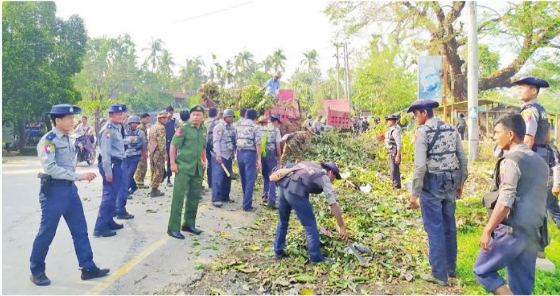
ရခိုင်ပြည်နယ် မြေပုံမြို့နယ်၌ စုပေါင်းသန့်ရှင်းရေးများဆောင်ရွက်နေသည်ကို တွေ့ရစဉ်။

အဖျက်စွမ်းအားကြီးမားတဲ့ မိုခါမုန်တိုင်း ရခိုင်ပြည်နယ်အတွင်း ဝင်ရောက်တိုက်ခတ်ခဲ့တာ လာမယ့် မေလ ၁၄ ရက်နေ့ဆိုရင် တစ်နှစ်တင်းတင်းပြည့်ပြီ။ မိုခါကို အန်တိုပီ မြန်မာနိုင်ငံသူ၊ နိုင်ငံသားတွေဟာ သွေးချင်းညီအစ်ကိုတွေဖြစ်တဲ့ ရခိုင်ပြည်နယ်သူ၊ ပြည်နယ်သားတွေအပေါ် ကျရောက်လာမယ့်သဘာဝဘေးဆိုးကြီးကို စည်းလုံးညီညွတ်မှုစွမ်းပကားနဲ့ ဝိုင်းဝန်းကာကွယ်ကူညီခဲ့ကြတယ်။ မုန်တိုင်းကျရောက်စဉ် ငွေအား၊ လူအား၊ ပစ္စည်းအားပါမကျန် အစွမ်းကုန် ထောက်ပံ့ပေးခဲ့ကြတယ်။ ပြန်လည်ထူထောင်ရေးလုပ်ငန်းတွေ အမြန်ဆုံးပြီးမြောက်အောင် ဝိုင်းဝန်းကြိုးပမ်းဆောင်ရွက်ချက်တွေဟာ ကျွန်တော်တို့အားလုံး “အရေးကြီးရင် သွေးနီ၊ အရေးကြုံရင်သွေးဆုံ” တယ်ဆိုတဲ့စကားကို သက်သေပြုလိုက်ခြင်းပဲ ဖြစ်ပါတယ်။