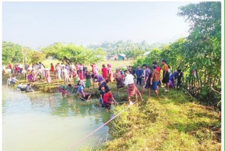
ရခိုင်ပြည်နယ် မြေပုံမြို့နယ် ကျောက်တန်းကျေးရွာ မြေသားရေကန် တာပေါင်မြင့်တင်ခြင်း ဆောင်ရွက်နေစဉ်။

တွေ့ရ၊ ကြားရတော့တကယ့်အနိဋ္ဌာရုံ မြင်ကွင်းတွေပါပဲ။ ဒီကြားထဲနေစရာဆိုတာ မရှိ။ စားစရာဆိုတာနုတ္တိဆိုတော့ ခိုင်မာတဲ့တိုက်အိမ်သွားနားခိုမိလို့ တိုက်ပြိုအုတ်နံရံပိတဲ့ သူတွေဆိုလည်းရှိသေး။ မုန်တိုင်းရဲ့ရက်စက်ကြမ်းကြုတ်မှုကတော့ ပြောမကုန်အောင်ပါပဲ။