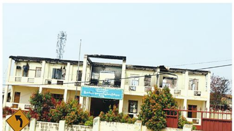
Photo shows the General Administration Department in Hsihseng vandalized by PNLO, KNDF, and PDF.

are underway in Hsihseng. Myanmar police, government department staff, and ethnic militia forces are working to restore residential areas and vital infrastructure, including religious sites, healthcare