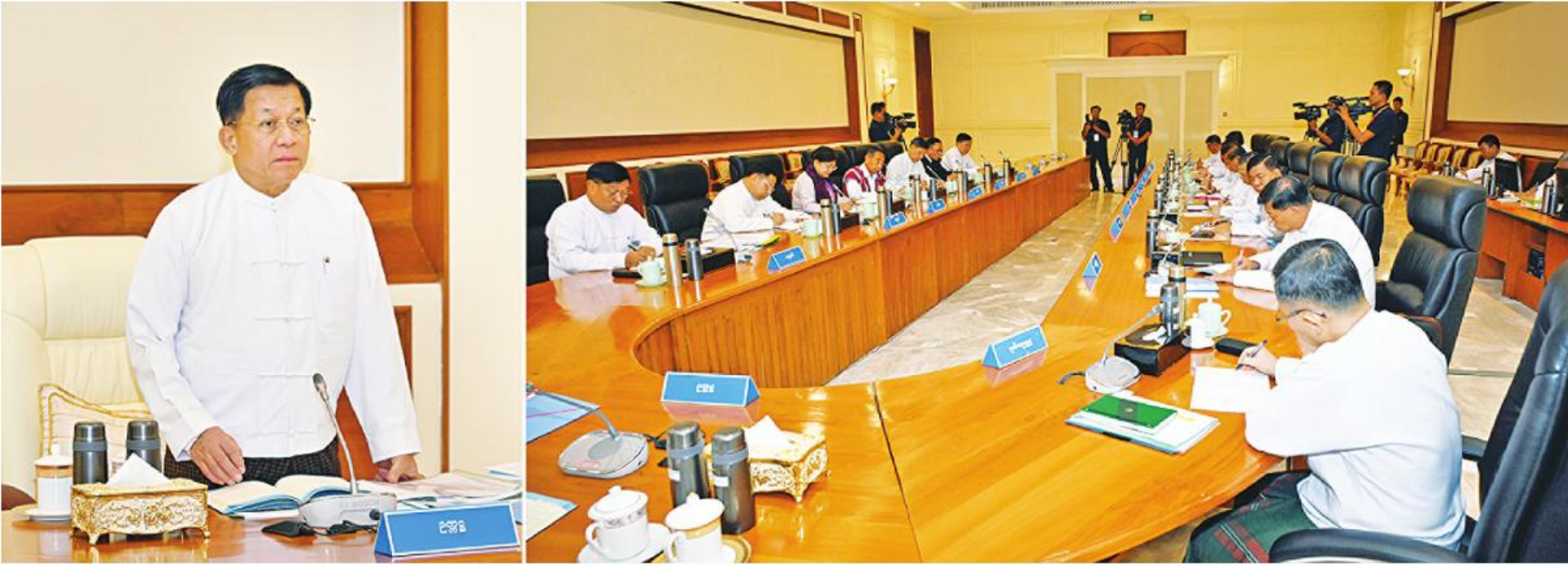
နိုင်ငံတော်စီမံအုပ်ချုပ်ရေးကောင်စီဥက္ကဋ္ဌ နိုင်ငံတော်ဝန်ကြီးချုပ် ဝိုင်းချုပ်မှူးကြီးမင်းအောင်လှိုင် နိုင်ငံတော်စီမံအုပ်ချုပ်ရေးကောင်စီအစည်းအဝေး(၂/၂၀၂၄)တွင် အမှာစကားပြောကြားစဉ်။