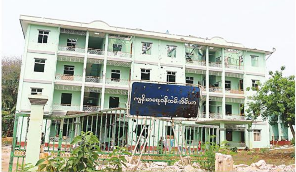
PNLO၊ KNDF၊ PDF အကြမ်းဖက်သောင်းကျန်းသူများက ဆီဆိုင်မြို့တွင်းရှိ အဆောက်အအုံများကို မီးရှို့ဖျက်ဆီးထားသည့် မှတ်တမ်းဓာတ်ပုံ။