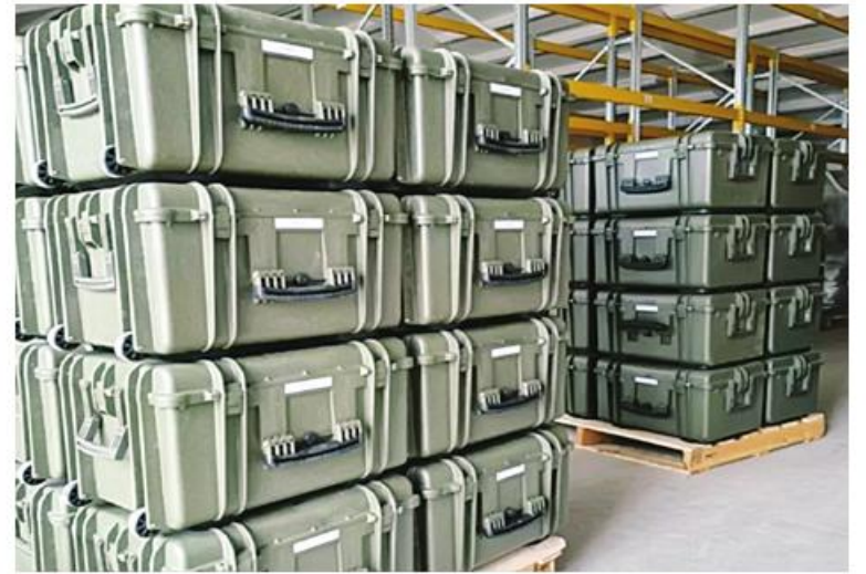
မူသင်တန်းများ ဖွင့်လှစ်ဆောင်ရွက်ပေးသွားရန် စီစဉ်ထားသည်။ Lithuania Sends Drone Jammers to Ukraine Following New Aid Plan ကိုဘာသာပြန်ဆိုထားပါသည်။

(အမေရိကန်ဒေါ်လာ ၁ ဒသမ ၀ ဘီလီယံ) ပံ့ပိုးပေးခဲ့ပြီး လက်ရှိတွင် နိုင်ငံ GDP ၏ ၁ ဒသမ ၂ ရာခိုင်နှုန်းကို ခွဲဝေပံ့ပိုးပေးထားခြင်းလည်းဖြစ်သည်။ ၎င်း၏အဓိကကျသော ပံ့ပိုးမှုများတွင် Kongsborg အဆင့်မြင့်မြေပြင်မှဝေဟင်ပစ်ခွဲကျည်စနစ် နှစ်စုံ၊ Bofors L-70 လေယာဉ်ပစ်အမြောက် ၃၆ စုံ၊ ခဲယမ်းများနှင့် M113 သံချပ်ကာလူသယ်ယာဉ် အစီး ၅၀ တို့ ပါဝင်သည်။ ထို့ပြင် ၂၀၂၄ ခုနှစ်နှင့်လာမည့် ၂၀၂၅ ခုနှစ်များအတွက် မိုင်းရှင်းလင်းရေးကိရိယာများ၊ ခဲယမ်းများနှင့် ရိက္ခာများ ပံ့ပိုးပေးပို့ရန် အစီအစဉ်များရှိကြောင်း ထုတ်ပြန်ကြေညာခဲ့ပြီးဖြစ်သည်။ ဆက်လက်၍ ၂၀၂၄ ခုနှစ် နှစ်ကုန်ပိုင်းထိ ယူကရိန်းတပ်ဖွဲ့ဝင်အင်အား ၃၀၀၀ ခန့်ကို နိုင်ငံတွင်း၌ စစ်ရေးလေ့ကျင့်