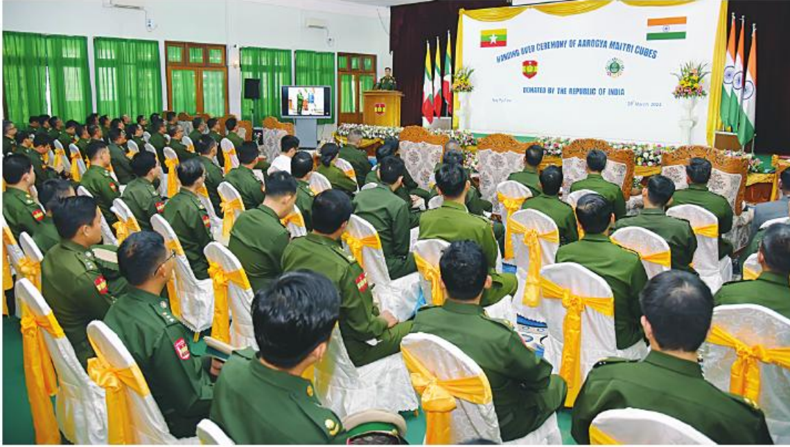
အိန္ဒိယသမ္မတနိုင်ငံက မြန်မာ့တပ်မတော်သို့ လှူဒါန်းသော Aarogya Maitri Cubes နှစ်စုံ လွှဲပြောင်းလက်ခံပွဲအခမ်းအနားကျင်းပစဉ်။