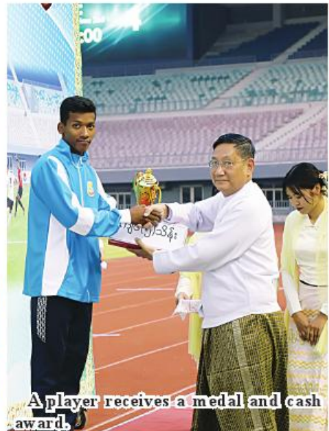
A player receives a medal and cash award.