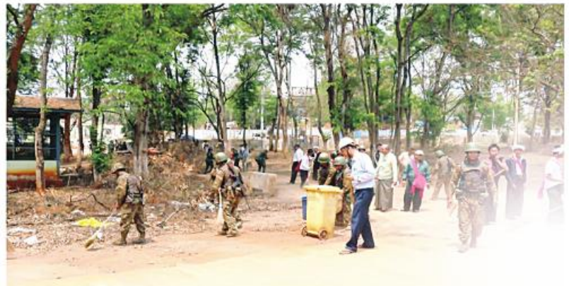
Tatmadaw members, MPF members, departmental staff, local militiamen and local people collectively clearing debris in Hsihseng.