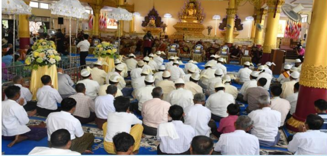
၂၀၂၄ ခုနှစ် သာသနာတော်ဆိုင်ရာဘွဲ့တံဆိပ်တော်များရရှိကြသည့် မန္တလေးတိုင်းဒေသကြီးမှ သံယာတော်များ၊ သာသနာ့နွယ်ဝင်သီလရှင်များနှင့် လူပုဂ္ဂိုလ်များအား သာသနာတော်ဆိုင်ရာဘွဲ့တံဆိပ်တော်များ ဆက်ကပ်ပူဇော်ပွဲ ကျင်းပစဉ်။

နေပြည်တော် မတ် ၂၄ ၂၀၂၄ ခုနှစ် သာသနာတော်ဆိုင်ရာဘွဲ့တံဆိပ်တော်များရရှိကြသည့် ပြည်နယ်နှင့် တိုင်းဒေသကြီးအသီးသီးတို့မှ သံယာတော်များ၊ သာသနာ့နွယ်ဝင်သီလရှင်များနှင့် လူပုဂ္ဂိုလ်များအား သာသနာတော်ဆိုင်ရာဘွဲ့တံဆိပ်တော်များ ဆက်ကပ်ပူဇော်ပွဲများနှင့် ဆွမ်းဆန်စိမ်းလောင်းလှူပွဲများကို ယနေ့တွင် တိုင်းဒေသကြီးနှင့် ပြည်နယ်အသီးသီးတို့ရှိ သက်ဆိုင်ရာနေရာများ၌ ပြုလုပ်ရာ တိုင်းဒေသကြီးနှင့် ပြည်နယ်ဝန်ကြီးချုပ်များ၊ တိုင်းမှူးများနှင့် ဌာနဆိုင်ရာ တာဝန်ရှိသူများ၊ စေတနာရှင်အလှူရှင်များ အသီးသီးတက်ရောက်ကြည့်ညိကြသည်။ ဦးစွာ တိုင်းဒေသကြီးနှင့် ပြည်နယ်ဝန်ကြီးချုပ်များ၊ တိုင်းမှူးများနှင့် ဌာနဆိုင်ရာတာဝန်ရှိသူများက သံယာတော်များထံမှ ငါးပါးသီလ ခံယူဆောက်တည်ကြသည်။ ထို့နောက် သံယာတော်များက သမ္မောဒနီယဩဝါဒကထာမြက်ကြားပြီး ပရိတ်တရားများရွတ်ပွားချီးမြှင့်တော်မူကြသည်။ ယင်းနောက် တာဝန်ရှိသူများက သာသနာရေးဆိုင်ရာများလျှောက်ထားပြီး ဘွဲ့ခံဆရာတော်ကြီးများ၊ သံယာတော်များ၊ သာသနာ့နွယ်ဝင်သီလရှင်များနှင့် လူပုဂ္ဂိုလ်တို့အား ဘွဲ့တံဆိပ်တော်များ အသီးသီးဆက်ကပ်လှူဒါန်းချီးမြှင့်ကြသည်။ ထို့နောက် သံယာတော်များထံမှ အနုမောဒနာတရားနာယူကာ လှူဒါန်းမှုအစုစုတို့အတွက် ရေစက်ချအမျှပေးဝေကြသည်။ ထို့ပြင် တိုင်းဒေသကြီးနှင့် ပြည်နယ်အသီးသီးတို့တွင်လည်း တိုင်းဒေသကြီးနှင့် ပြည်နယ်ဝန်ကြီးချုပ်များ၊ တိုင်းမှူးများနှင့် စေတနာရှင်အလှူရှင်များက သံယာတော်များနှင့် သာသနာ့နွယ်ဝင်သီလရှင်များအား သတ်မှတ်နေရာများ၌ ဆွမ်းဆန်စိမ်းနှင့် လှူဖွယ်ပစ္စည်းများ လောင်းလှူပူဇော်ခဲ့ကြကြောင်း သတင်းရရှိသည်။