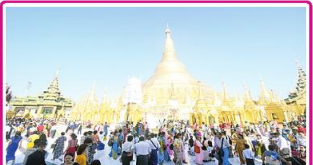
ရွှေတိဂုံစေတီတော် ၂၆၁၂ နှစ်မြောက် ဗုဒ္ဓပူဇော်ယတပေါင်းပွဲတော်အောင်ပွဲနှင့် ရေစက်ချအနုမောဒနာအခမ်းအနားကျင်းပ

နေပြည်တော် မတ် ၂၄ မန္တလေးတိုင်းဒေသကြီး မန္တလေးမြို့ မဟာမုနိဘုရားကြီး၌ တပေါင်းပွဲတော်အခမ်း အနားကို ယနေ့မုန်းလွဲပိုင်းတွင် အဆိုပါ အလယ်ပိုင်းတိုင်းစစ်ဌာနချုပ် တိုင်းမှူး ဗိုလ်ချုပ်ကြည်ခိုင်နှင့်တာဝန်ရှိသူများ၊ တိုင်းဒေသကြီး ဝန်ကြီးချုပ် ဦးမျိုးအောင်၊ စာမျက်နှာ ၂၄ ကော်လံ ၄ ☆