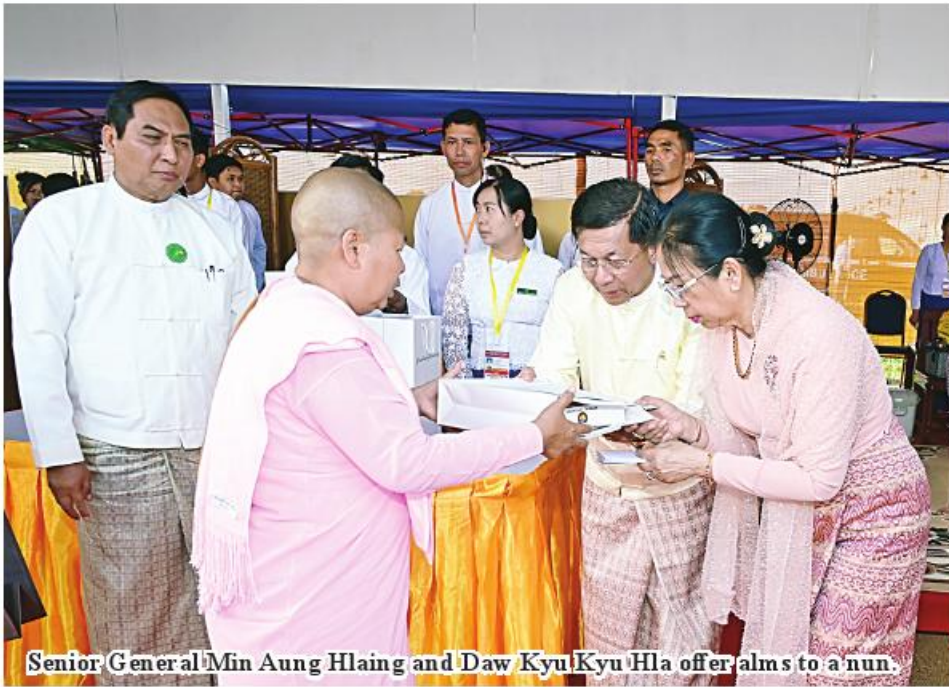
Senior General Min Aung Hlaing and Daw Kyu Kyu Hla offer alms to a nun.

Then followed the religious title conferring ceremony. The Senior General offered the Abhidhaja Maha