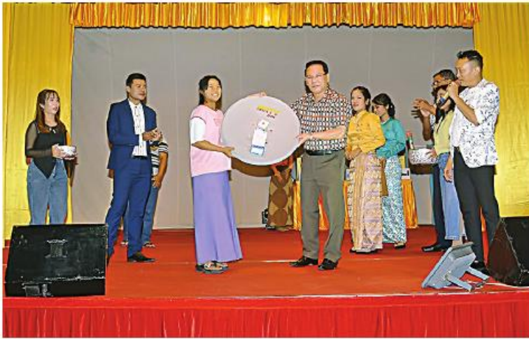
နေပြည်တော် မတ် ၂၄

(၇၉)နှစ်မြောက် တပ်မတော်နေ့ စစ်ရေးပြအခမ်းအနားတွင်ပါဝင်သည့် စစ်ရေးပြစစ်ကြောင်းများအား ဂုဏ်ပြုဖော်ဖြေပွဲကို ယနေ့ညနေပိုင်းတွင် နေပြည်တော်ရှိ စစ်ကြောင်းရေးနှင့် တည်းခိုရေးစခန်း၌ ကျင်းပရာ ပြန်ကြားရေးဝန်ကြီးဌာန ပြည်ထောင်စုနံ့ကြီး ဦးမောင်မောင်အုန်း တက်ရောက်ကြည့်ရှုအားပေးသည်။ အဆိုပါဂုဏ်ပြုဖော်ဖြေပွဲသို့ ပြန်ကြားရေး ဝန်ကြီးဌာန ဒုတိယဝန်ကြီး ဦးရဲတင့်၊ တပ်မတော်မှ အရာရှိကြီးများ၊ ဌာနဆိုင်ရာ တာဝန်ရှိသူများ၊ စစ်ရေးပြစစ်ကြောင်းများမှ တပ်မတော်(ကြည်း)၊ အရာရှိ စစ်သည်များ၊ တပ်မတော်(ကြည်း)