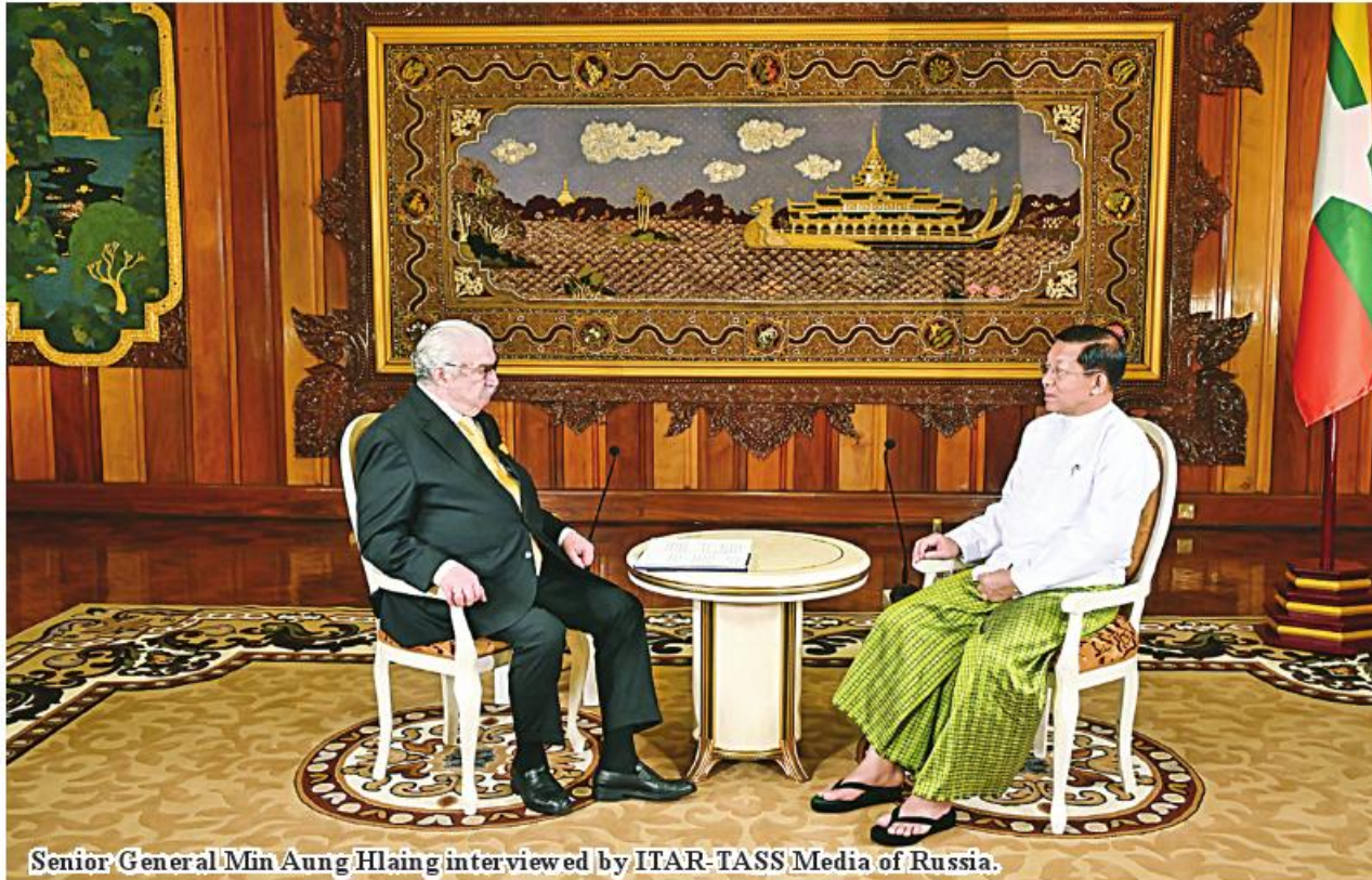
Senior General Min Aung Hlaing interviewed by ITAR-TASS Media of Russia.

Chairman of State Administration Council Prime Minister Senior General Min Aung Hlaing was interviewed by ITAR-TASS Media of Russian Federation about the situation of Russia-Myanmar sector-wise cooperation at the Credentials Hall of Zeyathiri Beikman in Yangon Region on 18 March morning. The following is the interview: