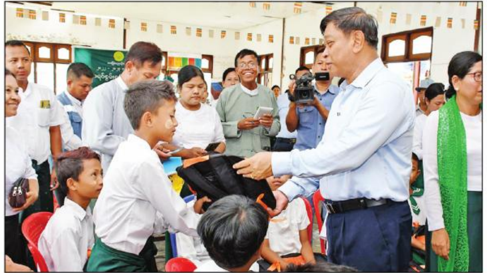
နိုင်ငံတော်စီမံအုပ်ချုပ်ရေးကောင်စီအဖွဲ့ဝင် ဒုတိယဝန်ကြီးချုပ်နှင့် ပြည်ထောင်စုဝန်ကြီး ဝိုင်းချုပ်ကြီးတင်အောင်စန်းနှင့်အဖွဲ့ဝင်များ ၂၀၂၃ ခုနှစ် မေလ ၂၄ ရက်က ပေါက်တောမြို့ အခြေခံပညာအထက်တန်းကျောင်းတွင် ပညာသင်ကြားနေသော ကျောင်းသားများအား သွားရောက်၍ အမှတ်တရလက်ဆောင်ပေးအပ်စဉ်။