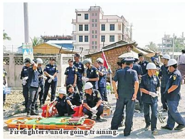
Fire fighters undergoing training.