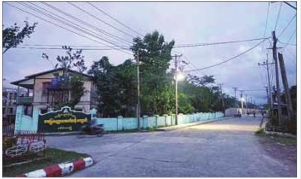
မိုခါဆိုင်ကလုန်းမုန်တိုင်းကြောင့် ပေါက်တောမြို့နှင့် ကျေးရွာများ၌ လျှပ်စစ်ဓာတ်အားရရှိမှုပြတ်တောက်ခဲ့ပြီး သက်ဆိုင်ရာတာဝန်ရှိသူများ၏ ကြိုးပမ်းဆောင်ရွက်မှုဖြင့် ပေါက်တောမြို့နယ် ဓာတ်အားခွဲခွဲနှင့် မြို့ပေါ်ရပ်ကွက်များ၌ လျှပ်စစ်ဓာတ်အား ပြန်ပြုပေးထားမှုကို ၂၀၂၃ ခုနှစ် ဇူလိုင်လ ၅ ရက်တွင် တွေ့ရစဉ်။