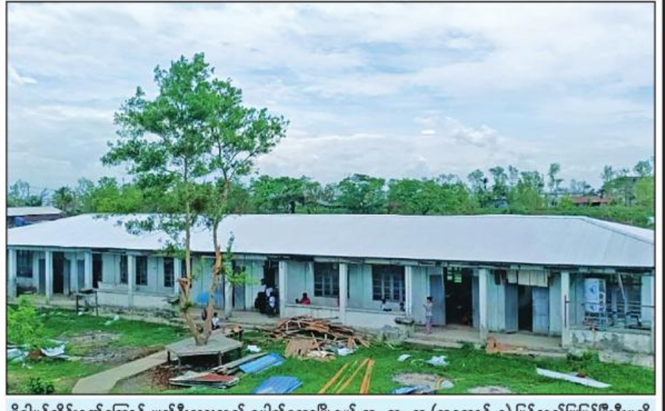
မိုခါမုန်တိုင်းဒဏ်ကြောင့် ပျက်စီးသွားသည့် ပေါက်တောမြို့နယ် အ. ထ. ၈ (အဆောင်-၅) ပြန်လည်ပြုပြင်ပြီးစီးမှုကို တွေ့ရစဉ်။