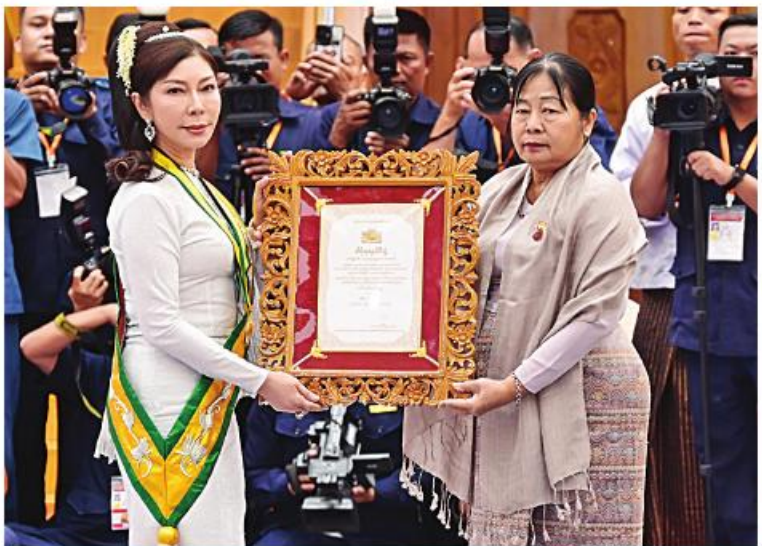
နိုင်ငံတော်စီမံအုပ်ချုပ်ရေးကောင်စီဒုတိယဥက္ကဋ္ဌ ဒုတိယဝန်ကြီးချုပ် ဒုတိယဗိုလ်ချုပ်မှူးကြီး စိုးဝင်း၏ဇနီး ဒေါ်သန်းသန်းနွယ် သီရိသုဓမ္မသီရိဘွဲ့ရရှိသူ ဒေါ်မော်မော်ညွန့်အား ဘွဲ့တံဆိပ်နှင့် အဆောင်အယောင်များ ချီးမြှင့်အပ်နှင်းစဉ်။

ဆက်လက်၍ ကောင်စီဝင်များ၊ ပြည်ထောင်စုအဆင့် ပုဂ္ဂိုလ်များ၊ ပြည်ထောင်စုဝန်ကြီးများ၊ ကာကွယ်ရေး ဦးစီးချုပ်ရုံးမှ တပ်မတော်အရာရှိကြီးများ နှင့် တာဝန်ရှိသူများက အဘိဓဇ အဂ္ဂမဟာ သဒ္ဓမ္မဇောတိက၊ အဘိဓဇမဟာရဒ္ဓဂုရု၊ အဂ္ဂ မဟာပဏ္ဍိတ၊ အဂ္ဂမဟာသဒ္ဓမ္မဇောတိကဇ၊ အဂ္ဂမဟာဂန္ထဝါစကပဏ္ဍိတ၊ အဂ္ဂမဟာ ကမ္မဋ္ဌာနာစရိယဘွဲ့ရရှိသည့် ဆရာတော် ကြီးများထံ ဘွဲ့တံဆိပ်တော်နှင့် အဆောင် အယောင်များကို ဆက်ကပ်ပူဇော်ကြသည်။ ယင်းနောက် နိုင်ငံတော်စီမံအုပ်ချုပ်ရေး ကောင်စီဥက္ကဋ္ဌ နိုင်ငံတော်ဝန်ကြီးချုပ်၏ ဇနီးက အဂ္ဂမဟာဂန္ထဝါစကပဏ္ဍိတ ဘွဲ့တံဆိပ်တော်ရ စစ်ကိုင်းမြို့၊ ဓေယျသီရိ သီလရှင်စာသင်တိုက် သီလရှင်ဆရာကြီး ဒေါ်ဂုဏဝတီနှင့် မုရွာမြို့၊ ဒေသဝတီသီလရှင် စာသင်တိုက် သီလရှင်ဆရာကြီး ဒေါ်ဓမ္မေသီ တို့ထံ ဘွဲ့တံဆိပ်တော်နှင့်အဆောင်အယောင် များ ဆက်ကပ်ပူဇော်ကြသည်။ ဆက်လက်၍ သာသနာ့နဂါးဘွဲ့တံဆိပ် များကို ချီးမြှင့်အပ်နှင်းရာ နိုင်ငံတော်စီမံ အုပ်ချုပ်ရေးကောင်စီဥက္ကဋ္ဌ နိုင်ငံတော် ဝန်ကြီးချုပ်က အဂ္ဂမဟာသီရိသုဓမ္မ မဏိလောတစရဘွဲ့ရရှိသူ ဒေါက်တာ မောင်မောင်ဦး၊ သီရိသုဓမ္မမဏိလောတစရ ဘွဲ့ရရှိသူများဖြစ်ကြသည့် ဦးမန်းစိန်နှင့် ဦးဝမ်ရှင်ရွှေတို့အား ဘွဲ့တံဆိပ်နှင့်အဆောင် အယောင်များ ချီးမြှင့်အပ်နှင်းသည်။ ယင်းနောက် နိုင်ငံတော်စီမံအုပ်ချုပ်ရေး ကောင်စီဒုတိယဥက္ကဋ္ဌ ဒုတိယဝန်ကြီးချုပ် က သီရိသုဓမ္မမဏိလောတစရဘွဲ့ရရှိသူ ဦးအောင်ကိုလော်အား ဘွဲ့တံဆိပ်နှင့်အဆောင်