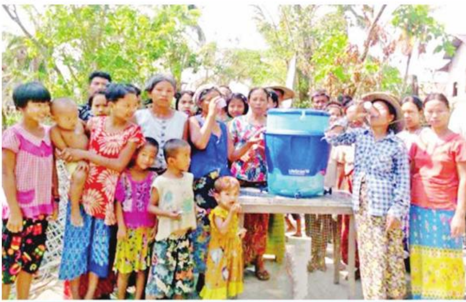
ပေါက်တောမြို့နယ် ငြင်းချောင်းကျေးရွာတွင် Life Straw ရေသန့်စက်ဖြင့် သောက်သုံးရေများပြန့်ဝေနေစဉ်။