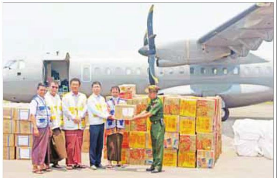
ရခိုင်ပြည်နယ်အတွင်းမြို့နယ်များသို့ မှန်တိုင်းအန္တရာယ်ကျရောက်လာပါက ကူညီကယ်ဆယ်ရေးလုပ်ငန်းများကို အရေးပေါ်တုံ့ပြန်ဆောင်ရွက်နိုင်ရေးအတွက် ဆေးဝါးပစ္စည်းများ၊ ကူညီကယ်ဆယ်ရေးသုံးပစ္စည်းများနှင့် စားသောက် ဖွယ်ရာများကို ပို့ဆောင်နိုင်ရေးအတွက် တာဝန်ရှိသူများထံ ၂၀၂၃ ခုနှစ် မေလ ၁၀ ရက်က ပေးအပ်စဉ်။