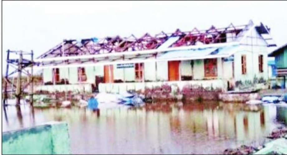
မိုခါမုန်တိုင်းဒဏ်ကြောင့် ပျက်စီးသွားသည့် ပေါက်တောမြို့နယ် အ. လ. က(ခွဲ) ဆည်သုံးတန် အဆောင်(၁)ကို တွေ့ရစဉ်။