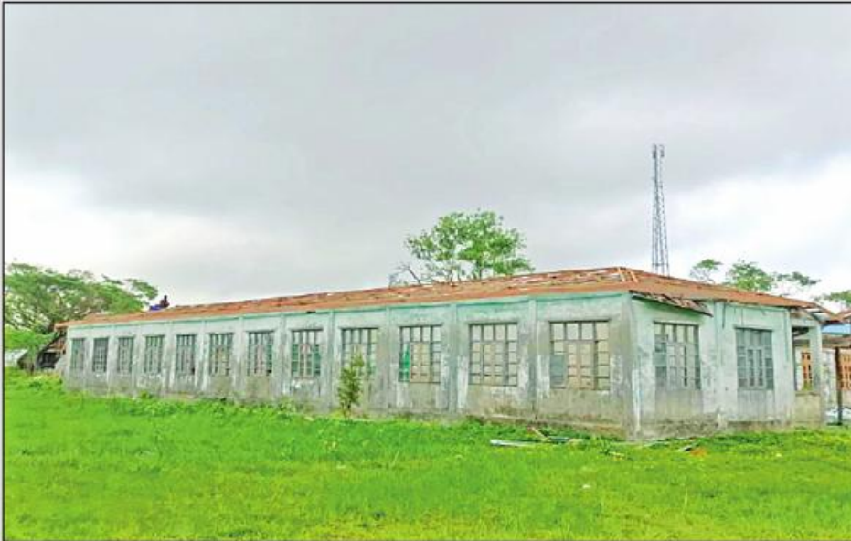
မိုခါမုန်တိုင်းဒဏ်ကြောင့် ပျက်စီးသွားသည့် ပေါက်တောမြို့နယ် အ. ထ. ၈ (အဆောင်-၅)ကို တွေ့ရစဉ်။