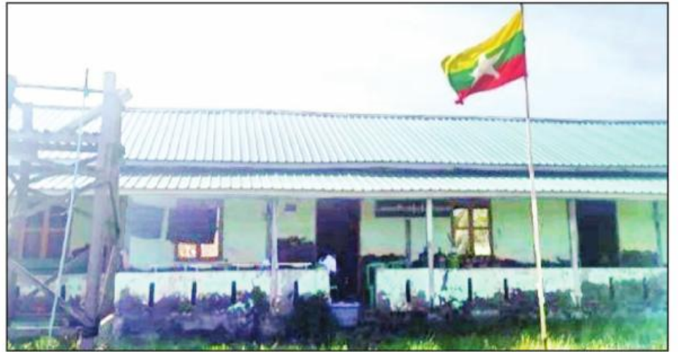
မိုခါမုန်တိုင်းဒဏ်ကြောင့် ပျက်စီးသွားသည့် ပေါက်တောမြို့နယ် အ. လ. က(ခွဲ) ဆည်သုံးတန် အဆောင်(၁)ပြန်လည်ပြုပြင်ပြီးစီးမှုကို တွေ့ရစဉ်။

ဘင်္ဂလားပင်လယ်အော် အရှေ့အလယ်ပိုင်းတွင်ဖြစ်ပေါ်ခဲ့သည့် အလွန်အလွန်အားကောင်းသော ဆိုင်ကလွန်းမုန်တိုင်း “မိုခါ” (MOCHA) သည် ၂၀၂၃ ခုနှစ် မေလ ၁၄ ရက်နေ့ နံနက်ပိုင်းတွင် ရခိုင်ကမ်းရိုးတန်းဒေသ စစ်တွေမြို့အနီးမှ ဖြတ်ကျော်ဝင်ရောက်တိုက်ခတ်မှုကြောင့် ရခိုင်ပြည်နယ်အပါအဝင် ပြည်နယ်နှင့် တိုင်းဒေသကြီးများတွင် ထိခိုက်ပျက်စီးဆုံးရှုံးမှုများဖြစ်ပေါ်ခဲ့သည်။ အလွန်အလွန်အင်အားပြင်းထန်သော