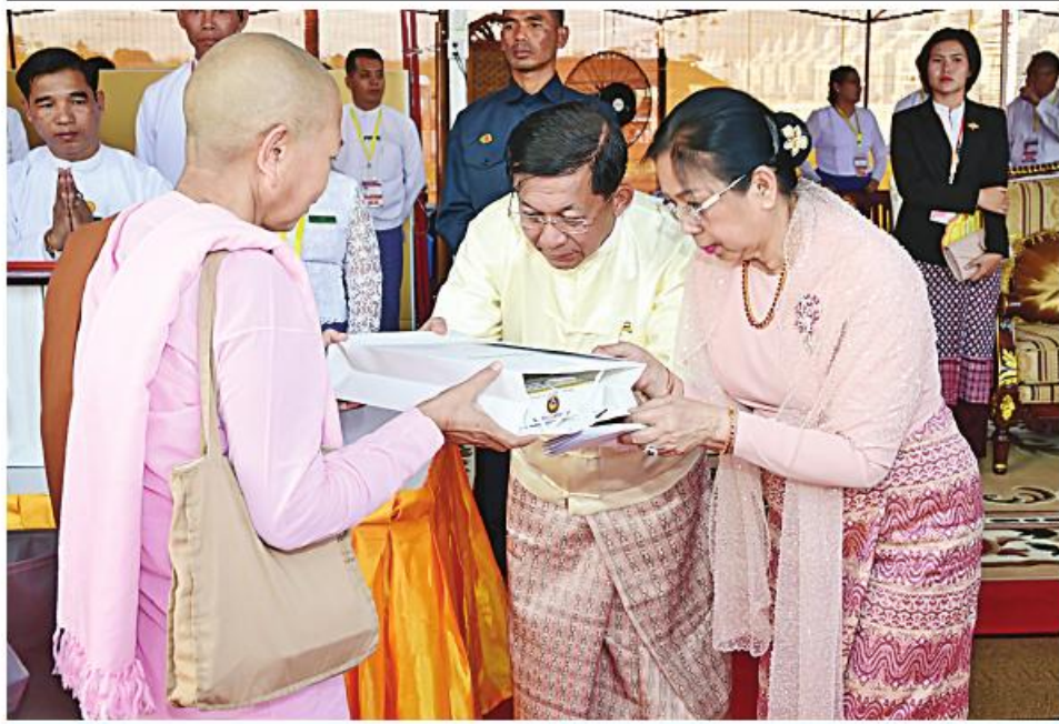
နိုင်ငံတော်စီမံအုပ်ချုပ်ရေးကောင်စီဥက္ကဋ္ဌ နိုင်ငံတော်ဝန်ကြီးချုပ် ဗိုလ်ချုပ်မှူးကြီးမင်းအောင်လှိုင်နှင့် ဇနီး ဒေါ်ကြူကြူလှတို့က သီလရှင်ဆရာကြီးများအား ဆွမ်းဆန်စိမ်း ဆက်ကပ်လောင်းလျှာစဉ်။