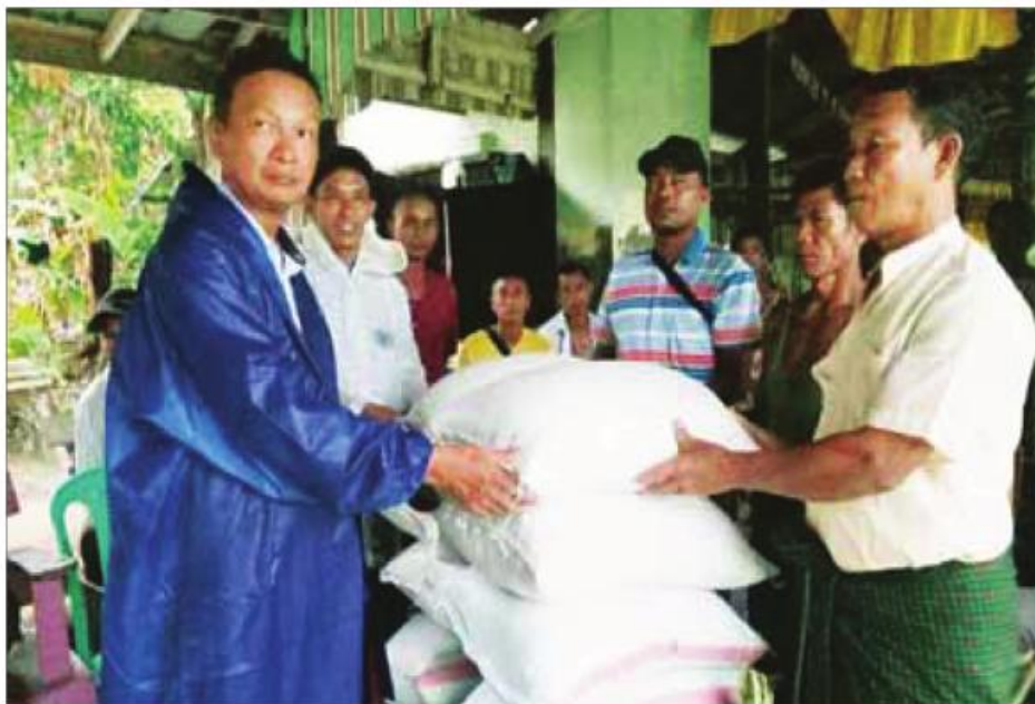
၂၀၂၃ ခုနှစ် မေလ ၁၃ ရက်တွင် ရခိုင်ပြည်နယ် ပေါက်တောမြို့နယ် စီမံအုပ်ချုပ်ရေးအဖွဲ့ဥက္ကဋ္ဌနှင့်အဖွဲ့ဝင်များ၊ ဌာနဆိုင်ရာတာဝန်ရှိသူများပါဝင်သောအဖွဲ့ မှန်တိုင်းရွှေငါးပြည်သူများထားရှိရာ ယာယီခိုလှုံရေးစခန်းများသို့ သွားရောက်၍ ထောက်ပံ့ပစ္စည်းများပေးအပ်စဉ်။