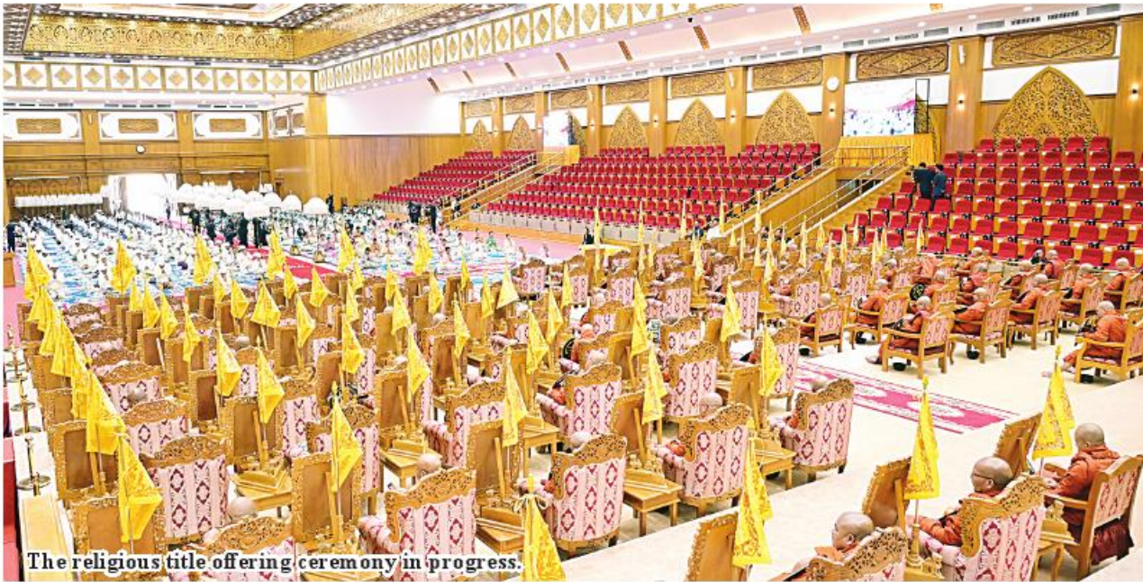
The religious title offering ceremony in progress.