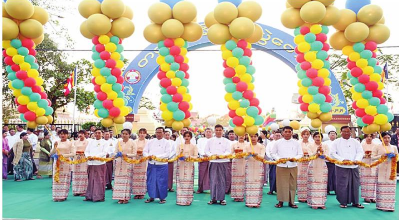
မန္တလေးတိုင်းဒေသကြီးဝန်ကြီးချုပ် ဦးမျိုးအောင်၊ တိုင်းမှူး ဗိုလ်ချုပ်ကြည်ခိုင်နှင့်တာဝန်ရှိသူများက တပေါင်းပွဲတော်အခမ်းအနားကို ဖဲကြီးဖြတ်ဖွင့်လှစ်ပေးစဉ်။

နေပြည်တော် မတ် ၂၄ မန္တလေးတိုင်းဒေသကြီး မန္တလေးမြို့ မဟာမုနိဘုရားကြီး၌ တပေါင်းပွဲတော်အခမ်း အနားကို ယနေ့မုန်းလွဲပိုင်းတွင် အဆိုပါ အလယ်ပိုင်းတိုင်းစစ်ဌာနချုပ် တိုင်းမှူး ဗိုလ်ချုပ်ကြည်ခိုင်နှင့်တာဝန်ရှိသူများ၊ တိုင်းဒေသကြီး ဝန်ကြီးချုပ် ဦးမျိုးအောင်၊ စာမျက်နှာ ၂၄ ကော်လံ ၄ ☆