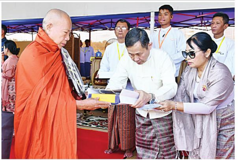
နိုင်ငံတော်စီမံအုပ်ချုပ်ရေးကောင်စီဒုတိယဥက္ကဋ္ဌ ဒုတိယဝန်ကြီးချုပ် ဒုတိယဗိုလ်ချုပ်မှူးကြီးစိုးဝင်းနှင့် ဇနီး ဒေါ်သန်းသန်းနွယ်တို့က ဆရာတော်၊ သံဃာတော်များအား ဆွမ်းဆန်စိမ်း ဆက်ကပ်လောင်းလျှာစဉ်။