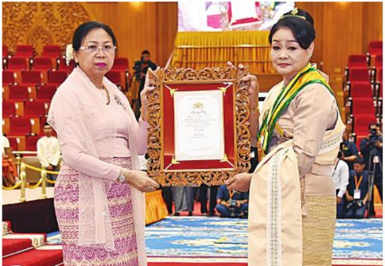
နိုင်ငံတော်စီမံအုပ်ချုပ်ရေးကောင်စီဥက္ကဋ္ဌ နိုင်ငံတော်ဝန်ကြီးချုပ် ဗိုလ်ချုပ်မှူးကြီး မင်းအောင်လှိုင်၏ဇနီး ဒေါ်ကြူကြူလှ သီရိသုဓမ္မသီရိဘွဲ့ရရှိသူ ဒေါ်တင်ညွန့်အား ဘွဲ့တံဆိပ်နှင့် အဆောင်အယောင်များ ချီးမြှင့်အပ်နှင်းစဉ်။

လှူဖွယ်ပစ္စည်းများ ဆက်ကပ်ပူဇော်ခဲ့ပြီး သာသနာ့နဂါး တွဲတံဆိပ်ရရှိကြသည့် လူပုဂ္ဂိုလ် ၁၂ ဦးတို့ကို ဘွဲ့တံဆိပ်နှင့် အဆောင်အယောင်များကို ချီးမြှင့်အပ်နှင်း ခဲ့သည်။ ကျန်ရှိသည့် ဘွဲ့ခံဆရာတော်ကြီး များ၊ သီလရှင်ဆရာကြီးများနှင့် လူပုဂ္ဂိုလ် များကိုလည်း သက်ဆိုင်ရာ နေပြည်တော် ကောင်စီနယ်မြေ၊ တိုင်းဒေသကြီးနှင့် ပြည်နယ်များအလိုက် ဝန်ကြီးချုပ်များနှင့် တာဝန်ရှိသူများက အသီးသီးဆက်ကပ် ပေးအပ်ချီးမြှင့်ခဲ့ကြကြောင်း သိရှိရသည်။ ဆက်လက်ပြီး ဆွမ်းဆန်စိမ်းလောင်းလျှာ ပွဲကိုကျင်းပရာ နိုင်ငံတော်စီမံအုပ်ချုပ်ရေး ကောင်စီဥက္ကဋ္ဌ နိုင်ငံတော်ဝန်ကြီးချုပ် ဗိုလ်ချုပ်မှူးကြီးမင်းအောင်လှိုင်နှင့် ဇနီး ဒေါ်ကြူကြူလှတို့နှင့်အတူ ကောင်စီ ဒုတိယဥက္ကဋ္ဌ ဒုတိယဝန်ကြီးချုပ် ဒုတိယ ဗိုလ်ချုပ်မှူးကြီးစိုးဝင်းနှင့် ဇနီး ဒေါ်သန်းသန်းနွယ်၊ ကောင်စီအတွင်းရေးမှူး