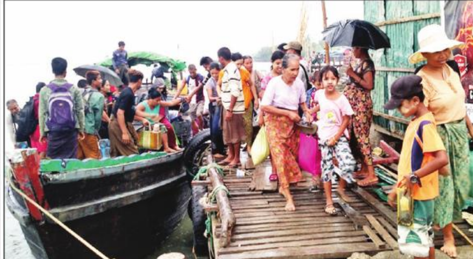
ရခိုင်ပြည်နယ် ပေါက်တောမြို့နယ်၌ မုန်တိုင်းအန္တရာယ်ကျရောက်နိုင်သည့်နေရာများမှ ပြည်သူများအား ဘေးလွတ်ရာသို့ မေလ ၁၃ ရက်တွင် တာဝန်ရှိသူများက ရေယာဉ်ဖြင့် ကြိုတင်ရွှေ့ပြောင်းပေးစဉ်။