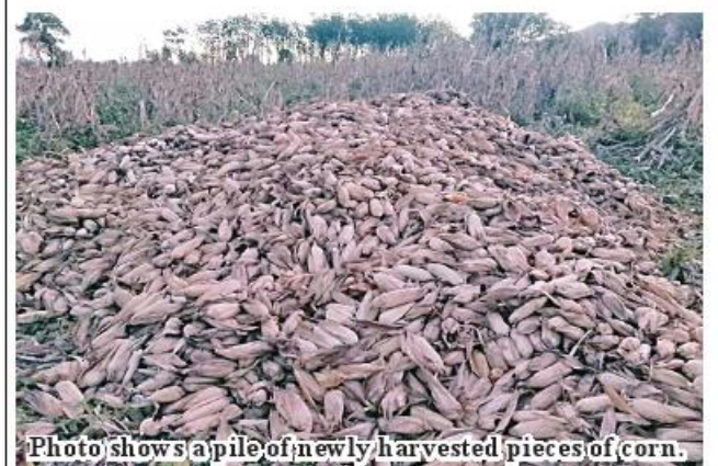
Photo shows a pile of newly harvested pieces of corn.