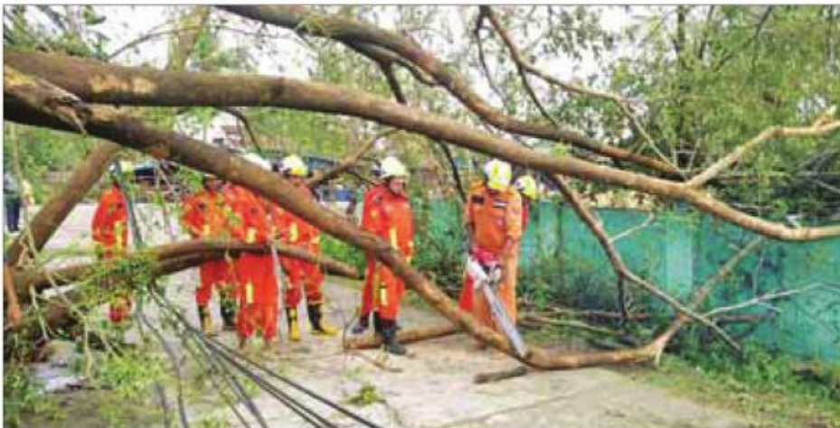
ရခိုင်ပြည်နယ် ပေါက်တောမြို့နယ်၌ အလွန်အလွန်အားကောင်းသော မိုခါဆိုင်ကလုန်းမှန်တိုင်းကြောင့် ပြုလုပ်ပျက်စီး သည့်သစ်ပင်သစ်ကိုင်းများအား ကူညီကယ်ဆယ်ရေးအဖွဲ့များ ရှင်းလင်းဖယ်ရှားစဉ်။