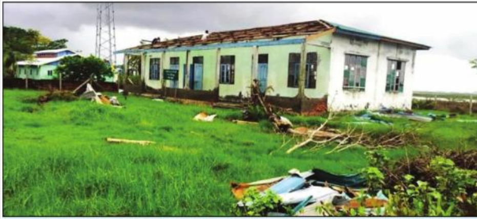
မိုခါမုန်တိုင်းဒဏ်ကြောင့် ပျက်စီးသွားသည့် ပေါက်တောမြို့နယ် အ. မ. ၈ လှိုင်ကျေးရွာကျောင်း ပင်မဆောင်ကို တွေ့ရစဉ်။