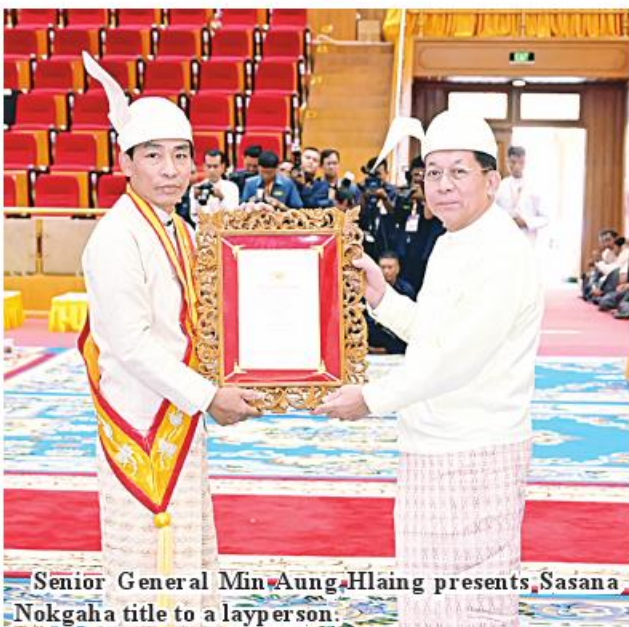
Senior General Min Aung Hlaing presents Sasana Nokgaha title to a layperson.