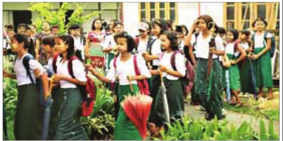
နိုင်ငံတော်က ကျောင်းသား၊ ကျောင်းသူများ စာသင်ကြားမှုမထိခိုက်စေရန် ကြိုးပမ်းဆောင်ရွက်မှုကြောင့် ကျောင်း စတင်ဖွင့်လှစ်သည့် ၁-၆-၂၀၂၃ ရက်တွင် ကျောင်းတက်ရောက်လာမှုကိုတွေ့ရစဉ်။