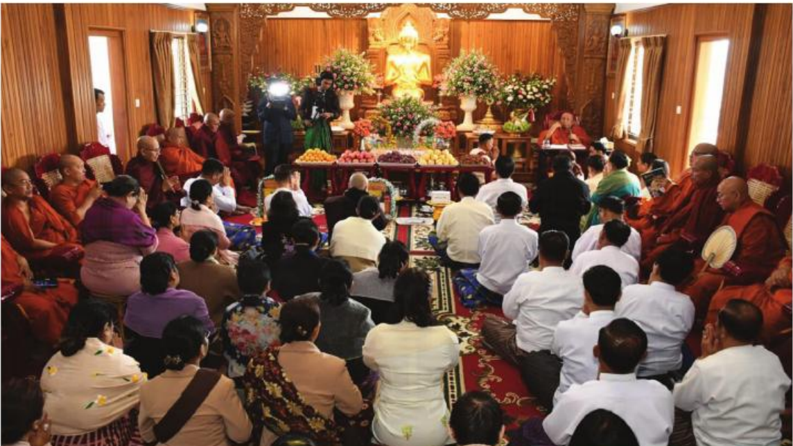
သီတဂူနေရာသီစံကျောင်း(ပြင်ဦးလွင်)သီတဂူစန္ဒြကန္တီ ကျောင်းဆောင်တော်နှင့် တစ်ပါးနေကျောင်းဆောင်တော်များ ကျောင်းလွတ်ပူဇော်မင်္ဂလာအခမ်းအနား ကျင်းပစဉ်။

ဦးစွာ သီတဂူဆရာတော်ကြီး အမှုပြုသော ဆရာတော်၊ သံဃာတော်များက ဘုရားအနေကဇာတင်ပူဇော်ကြသည်။ ထို့နောက် တာဝန်ရှိသူများနှင့် အလှူရှင်များက သီတဂူဆရာတော်ကြီးနှင့် ဆရာတော်၊ သံဃာတော်များအား အရက်ဆွမ်းများ ဆက်ကပ်ကြသည်။ ယင်းနောက် တိုင်းဒေသကြီးဝန်ကြီးချုပ်၊ တိုင်းမှူးနှင့် အလှူရှင်များက သီတဂူဆရာတော်ကြီးထံမှ ဩဝါဒကထာများ နာယူကြည့်ညိကြပြီး နဝကမ္မဝတ္ထုငွေများကို သီတဂူအပြည်ပြည်ဆိုင်ရာသာသနာပြုအဖွဲ့ထံ ဆက်ကပ်လှူဒါန်းကြကာ အနုမောဒနာတရားနာယူကြည့်ညိ၍ ကုသိုလ်ကောင်းမှုအစုစုတို့အတွက် ရေစက်သွန်းချအမျှပေးဝေကြသည်။ ဆက်လက်၍ တိုင်းဒေသကြီးဝန်ကြီးချုပ်၊ တိုင်းမှူးနှင့် တာဝန်ရှိသူများ၊ အလှူရှင်များက သီတဂူဆရာတော်ကြီး အမှုပြုပြီး ဆရာတော်၊ သံဃာတော်တို့အား ဆန်ချိုစေတီတော်ပေါ်၌ ဆွမ်းဆန်စိမ်းများ လောင်းလှူခဲ့ကြောင်း သတင်းရရှိသည်။