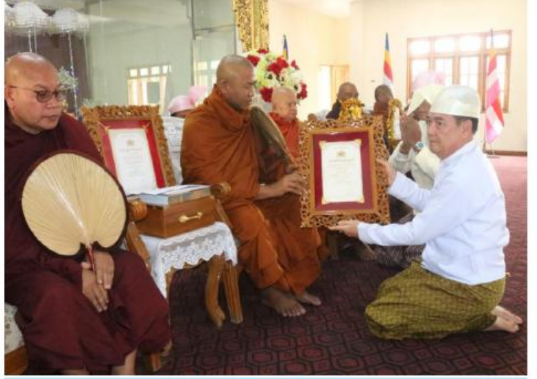
ဆရာတော်ထံ ရန်ိုင်ပြည်နယ်ဝန်ကြီးချုပ် ဦးထိန်လင်းက သာသနာတော်ဆိုင်ရာဘွဲ့တံဆိပ်တော် ဆက်ကပ်ပူဇော်စဉ်။

နေပြည်တော် မတ် ၂၄ ၂၀၂၄ ခုနှစ် သာသနာတော်ဆိုင်ရာဘွဲ့တံဆိပ်တော်များရရှိကြသည့် ပြည်နယ်နှင့် တိုင်းဒေသကြီးအသီးသီးတို့မှ သံယာတော်များ၊ သာသနာ့နွယ်ဝင်သီလရှင်များနှင့် လူပုဂ္ဂိုလ်များအား သာသနာတော်ဆိုင်ရာဘွဲ့တံဆိပ်တော်များ ဆက်ကပ်ပူဇော်ပွဲများနှင့် ဆွမ်းဆန်စိမ်းလောင်းလှူပွဲများကို ယနေ့တွင် တိုင်းဒေသကြီးနှင့် ပြည်နယ်အသီးသီးတို့ရှိ သက်ဆိုင်ရာနေရာများ၌ ပြုလုပ်ရာ တိုင်းဒေသကြီးနှင့် ပြည်နယ်ဝန်ကြီးချုပ်များ၊ တိုင်းမှူးများနှင့် ဌာနဆိုင်ရာ တာဝန်ရှိသူများ၊ စေတနာရှင်အလှူရှင်များ အသီးသီးတက်ရောက်ကြည့်ညိကြသည်။ ဦးစွာ တိုင်းဒေသကြီးနှင့် ပြည်နယ်ဝန်ကြီးချုပ်များ၊ တိုင်းမှူးများနှင့် ဌာနဆိုင်ရာတာဝန်ရှိသူများက သံယာတော်များထံမှ ငါးပါးသီလ ခံယူဆောက်တည်ကြသည်။ ထို့နောက် သံယာတော်များက သမ္မောဒနီယဩဝါဒကထာမြက်ကြားပြီး ပရိတ်တရားများရွတ်ပွားချီးမြှင့်တော်မူကြသည်။ ယင်းနောက် တာဝန်ရှိသူများက သာသနာရေးဆိုင်ရာများလျှောက်ထားပြီး ဘွဲ့ခံဆရာတော်ကြီးများ၊ သံယာတော်များ၊ သာသနာ့နွယ်ဝင်သီလရှင်များနှင့် လူပုဂ္ဂိုလ်တို့အား ဘွဲ့တံဆိပ်တော်များ အသီးသီးဆက်ကပ်လှူဒါန်းချီးမြှင့်ကြသည်။ ထို့နောက် သံယာတော်များထံမှ အနုမောဒနာတရားနာယူကာ လှူဒါန်းမှုအစုစုတို့အတွက် ရေစက်ချအမျှပေးဝေကြသည်။ ထို့ပြင် တိုင်းဒေသကြီးနှင့် ပြည်နယ်အသီးသီးတို့တွင်လည်း တိုင်းဒေသကြီးနှင့် ပြည်နယ်ဝန်ကြီးချုပ်များ၊ တိုင်းမှူးများနှင့် စေတနာရှင်အလှူရှင်များက သံယာတော်များနှင့် သာသနာ့နွယ်ဝင်သီလရှင်များအား သတ်မှတ်နေရာများ၌ ဆွမ်းဆန်စိမ်းနှင့် လှူဖွယ်ပစ္စည်းများ လောင်းလှူပူဇော်ခဲ့ကြကြောင်း သတင်းရရှိသည်။