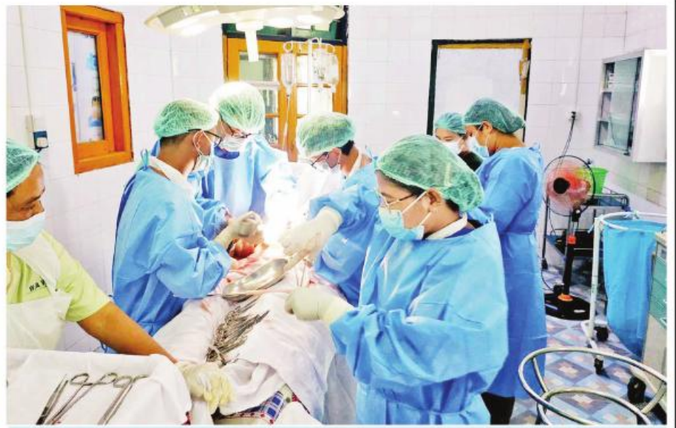
ပေါက်တောမြို့နယ်၌ အထူးကုဆရာဝန်ကြီးများအဖွဲ့ ခွဲစိတ်ကုသပေးစဉ်။