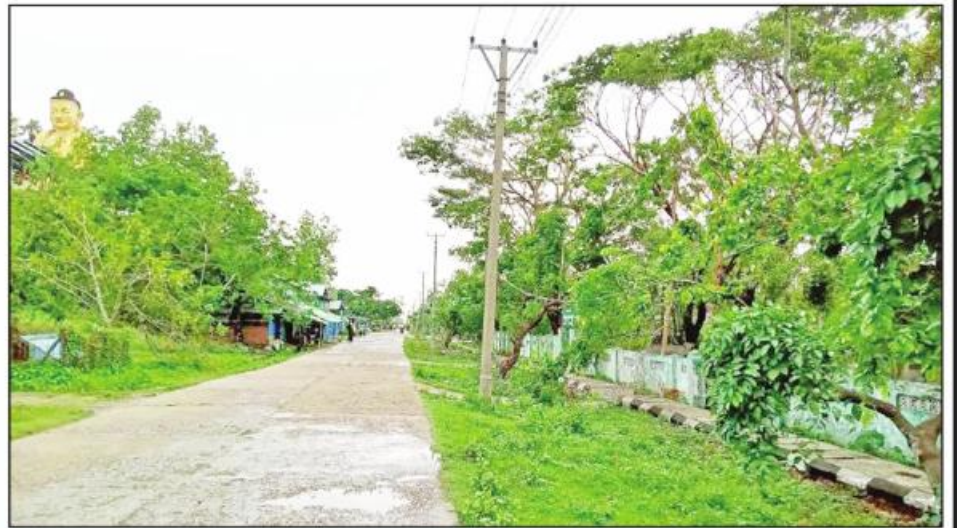
ရခိုင်ပြည်နယ် ပေါက်တောမြို့နယ်အတွင်းရှိ ဓာတ်အားလိုင်းများ ပြုပြင်ပြီးစီးမှုကိုတွေ့ရစဉ်။