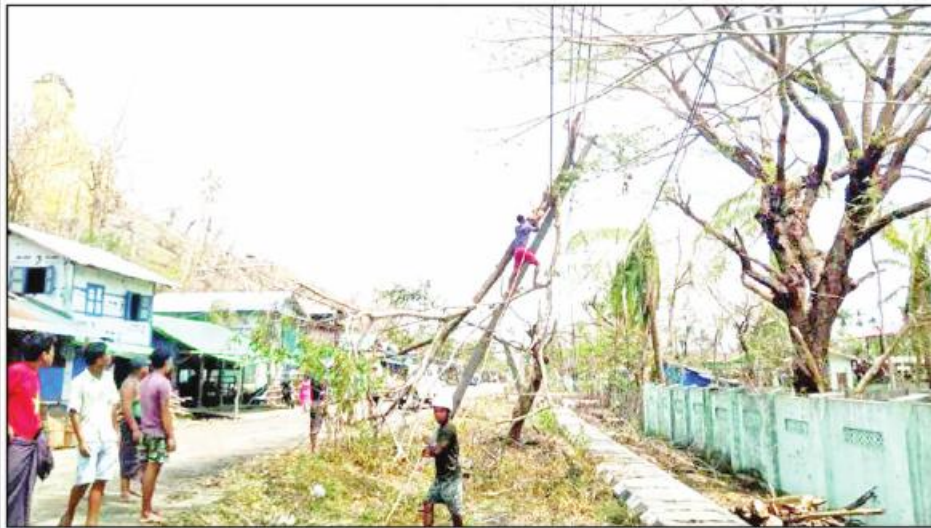
ရခိုင်ပြည်နယ် ပေါက်တောမြို့နယ်အတွင်းရှိ ဓာတ်အားလိုင်းများ ပျက်စီးမှုကိုတွေ့ရစဉ်။