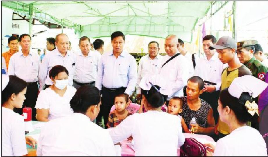
နိုင်ငံတော်စီမံအုပ်ချုပ်ရေးကောင်စီအဖွဲ့ဝင် ဒုတိယဝန်ကြီးချုပ်နှင့် ပြည်ထောင်စုဝန်ကြီး ဝိုင်းချုပ်ကြီးတင်အောင်စန်းနှင့်အဖွဲ့ဝင်များ ၂၀၂၃ ခုနှစ် မေလ ၂၄ ရက်က ပေါက်တောမြို့နယ်အတွင်း အခွဲကွင်းဆင်းဆေးကုသမှုလုပ်ငန်းများဆောင်ရွက်နေမှုအား ကြည့်ရှုအားပေးစဉ်။