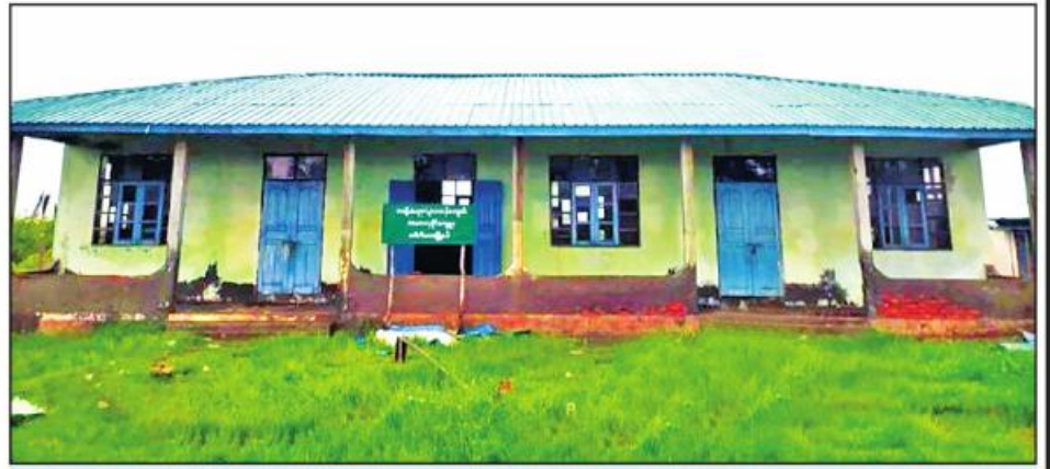
မိုခါမုန်တိုင်းဒဏ်ကြောင့် ပျက်စီးသွားသည့် ပေါက်တောမြို့နယ် အ. မ. ၈ လှိုင်ကျေးရွာကျောင်း ပင်မဆောင် ပြန်လည်ပြုပြင်ပြီးစီးမှုကို တွေ့ရစဉ်။