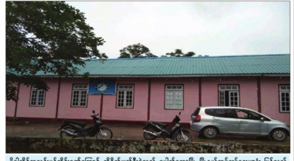
မိုခါဆိုင်ကလုန်းမုန်တိုင်းဒဏ်ကြောင့် ပေါက်တောမြို့ မြို့နယ်အုပ်ချုပ်ရေးမှူးရုံး ထိခိုက်ပျက်စီးမှုကိုတွေ့ရစဉ်။