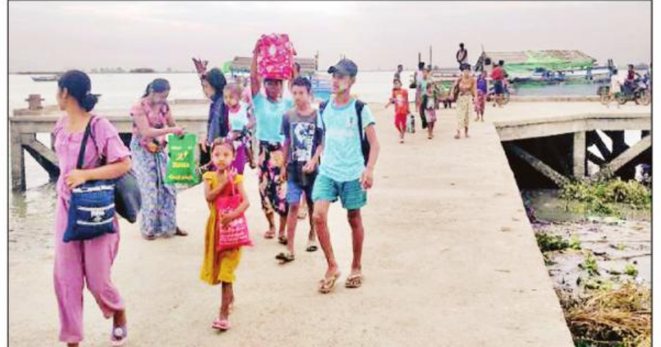
ရခိုင်ပြည်နယ် ပေါက်တောမြို့နယ်၌ မုန်တိုင်းအန္တရာယ်ကျရောက်နိုင်သည့်ကျေးရွာများမှ ပြည်သူများအား မုန်တိုင်းဘေးလွတ်ရာ ယာယီခိုလှုံရာခန်းများသို့ ကြိုတင်ရွှေ့ပြောင်းပေးစဉ်။