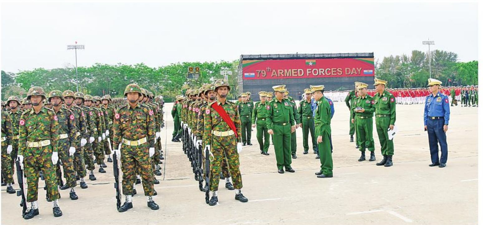
နိုင်ငံတော်စီမံအုပ်ချုပ်ရေးကောင်စီဒုတိယဥက္ကဋ္ဌ ဒုတိယတပ်မတော်ကာကွယ်ရေးဦးစီးချုပ် ကာကွယ်ရေးဦးစီးချုပ်(ကြည်း) ဒုတိယဗိုလ်ချုပ်မှူးကြီးစိုးဝင်း (၇၉)နှစ်မြောက် တပ်မတော်နေ့စစ်ရေးပြအခမ်းအနား၌ ပါဝင်စစ်ရေးပြကြမည့် စစ်ရေးပြစစ်ကြောင်းကြီးများ ဝတ်စုံပြည့်စစ်ရေးပြလေ့ကျင့်နေမှုကို ကြည့်ရှုစစ်ဆေးစဉ်။ ပေးသည်။ တပ်မတော် (ကြည်း၊ ရေ၊ လေ)နှင့် မြန်မာ အမျိုးသမီးတပ်ဖွဲ့ဝင်များ၊ အမျိုးသမီး အထူး လေယာဉ်၊ ရဟတ်ယာဉ်များ ပါဝင်ကြောင်း အဆိုပါ စစ်ရေးပြအခမ်းအနားတွင် နိုင်ငံရဲတပ်ဖွဲ့တို့မှ အရာရှိ၊ စစ်သည်များ၊ တပ်ဖွဲ့ဝင်များ၊ တပ်မတော်(လေ)မှ သတင်းရရှိသည်။

ဒုတိယတပ်မတော် ကာကွယ်ရေးဦးစီးချုပ် ကာကွယ်ရေးဦးစီးချုပ်(ကြည်း) ဒုတိယဗိုလ်ချုပ်မှူးကြီးစိုးဝင်းနှင့်အတူ ကာကွယ်ရေးဝန်ကြီးဌာန ပြည်ထောင်စုဝန်ကြီးဗိုလ်ချုပ်ကြီးတင်အောင်စန်း၊ ညှိနှိုင်းကွပ်ကဲရေးမှူး(ကြည်း၊ ရေ၊ လေ) ဗိုလ်ချုပ်ကြီးမောင်မောင်အေး၊ ကာကွယ်ရေးဦးစီးချုပ်(ရေ) ဒုတိယဗိုလ်ချုပ်ကြီးဖွဲ့ဝင်းမြင့်၊ ကာကွယ်ရေးဦးစီးချုပ်(လေ) ဗိုလ်ချုပ်ကြီးထွန်းအောင်၊ ကာကွယ်ရေးဦးစီးချုပ်ရုံးမှ တပ်မတော်အရာရှိကြီးများ၊ တပ်မတော်နေ့ကျင်းပရေး စီမံခန့်ခွဲရေးကော်မတီဥက္ကဋ္ဌ နေပြည်တော်တိုင်းစစ်ဌာနချုပ် တိုင်းမှူးဗိုလ်ချုပ်စောသန်းလှိုင်နှင့် တာဝန်ရှိသူများက သွားရောက်ကြည့်ရှုစစ်ဆေးကြပြီး နိုင်ငံတော် စီမံအုပ်ချုပ်ရေးကောင်စီ ဒုတိယဥက္ကဋ္ဌ ဒုတိယတပ်မတော်ကာကွယ်ရေးဦးစီးချုပ် ကာကွယ်ရေးဦးစီးချုပ်(ကြည်း)က လိုအပ်သည်များကို တာဝန်ရှိသူများနှင့် ပေါင်းစပ်ညှိနှိုင်းဆောင်ရွက်