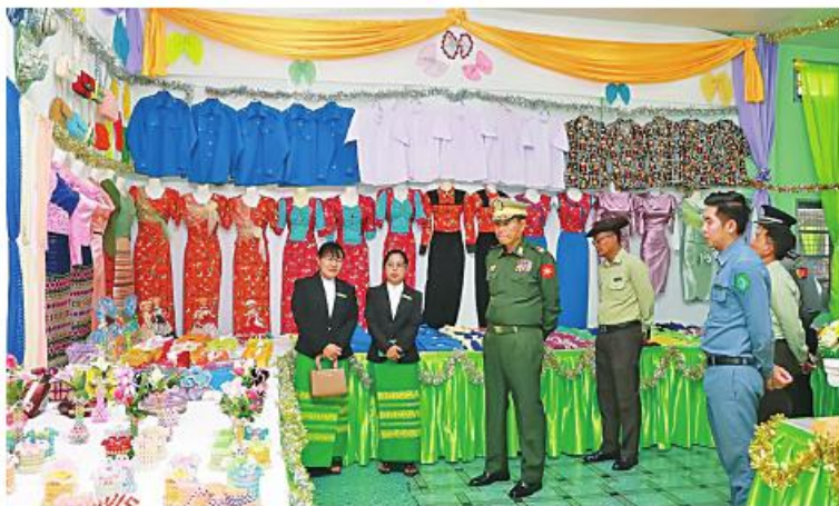
အရှေ့မြောက်တိုင်းစစ်ဌာနချုပ် တိုင်းမှူး ဗိုလ်ချုပ်စိုးတင် စင်းကျင်းပြသထားသည့် ထုတ်ကုန်ပစ္စည်းများနှင့် သင်ထောက်ကူပစ္စည်းများကို လိုက်လံကြည့်ရှုစဉ်။

နေပြည်တော် မတ် ၂၂ နယ်စပ်ရေးရာဝန်ကြီးဌာန ပညာရေး နှင့်လေ့ကျင့်ရေးဦးစီးဌာနက ကြီးမှူးဖွင့်လှစ် သည့် အဆင့်မြင့်အိမ်တွင်းမှု စက်ချုပ် သင်တန်းအမှတ်စဉ်(၆) သင်တန်းဆင်းပွဲ ကို ယနေ့နံနက်ပိုင်းတွင် ရှမ်းပြည်နယ် (မြောက်ပိုင်း) လားရှိုးမြို့ အမျိုးသမီး အိမ်တွင်းမှုအသက်မွေးဝမ်းကျောင်းလုပ်ငန်း ပညာသင်တန်းကျောင်း၌ ပြုလုပ်ရာ အရှေ့မြောက်တိုင်းစစ်ဌာနချုပ် တိုင်းမှူး ဗိုလ်ချုပ်စိုးတင်နှင့် တာဝန်ရှိသူများ၊ မြို့မိ မြို့ဖများ၊ သင်တန်းနည်းပြများ၊ သင်တန်း သူများနှင့်ပိတ်ကြားထားသူများ တက်ရောက် ကြသည်။