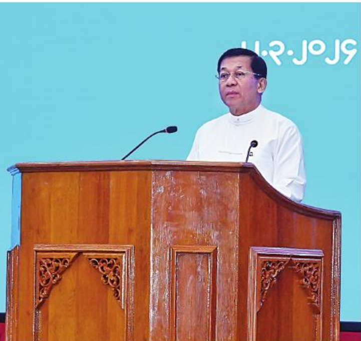
အမျိုးသားအဆင့် ရေအရင်းအမြစ်ကော်မတီဥက္ကဋ္ဌ နိုင်ငံတော်စီမံအုပ်ချုပ်ရေးကောင်စီဥက္ကဋ္ဌ နိုင်ငံတော်ဝန်ကြီးချုပ် ပိုလ်ချုပ်မှူးကြီးမင်းအောင်လှိုင် ကမ္ဘာ့ရေနေ့ ၂၀၂၄ အခမ်းအနားတွင် အမှာစကားပြောကြားစဉ်။

နေပြည်တော် မတ် ၂၂ ကမ္ဘာ့ရေနေ့ ၂၀၂၄ အခမ်းအနားကို ယနေ့ နံနက်ပိုင်းတွင် နေပြည်တော်ရှိ မြန်မာအပြည်ပြည်ဆိုင်ရာကွန်ဗင်းရှင်းဗဟိုဌာန-၂(MICC-II)၌ ကျင်းပပြုလုပ်ရာ အမျိုးသားအဆင့် ရေအရင်းအမြစ်ကော်မတီဥက္ကဋ္ဌ နိုင်ငံတော်စီမံအုပ်ချုပ်ရေးကောင်စီဥက္ကဋ္ဌ နိုင်ငံတော်ဝန်ကြီးချုပ် ပိုလ်ချုပ်မှူးကြီးမင်းအောင်လှိုင် တက်ရောက် အမှာစကားပြောကြားသည်။ အခမ်းအနားသို့ ကောင်စီတွဲဖက်အတွင်းရေးမှူး ဒုတိယပိုလ်ချုပ်ကြီးရဲဝင်းဦး၊ ကောင်စီအဖွဲ့ဝင်များ၊ ပြည်ထောင်စုဝန်ကြီးများ၊ နေပြည်တော်ကောင်စီဥက္ကဋ္ဌ၊ ကာကွယ်ရေးဦးစီးချုပ်ရုံးမှ အဆင့်မြင့်တပ်မတော်အရာရှိကြီးများ၊ နေပြည်တော်တိုင်းစစ်ဌာနချုပ်တိုင်းမှူး၊ ဒုတိယဝန်ကြီးများ၊ အမြဲတမ်းအတွင်းဝန်များ၊ ညွှန်ကြားရေးမှူးချုပ်များ၊ တက္ကသိုလ်ကောလိပ်များမှ ကျောင်းအုပ်ကြီးများနှင့် ပါမောက္ခချုပ်များ၊ ဖိတ်ကြားထားသူများနှင့် တာဝန်ရှိသူများ တက်ရောက်ကြပြီး တိုင်းဒေသကြီးနှင့် ပြည်နယ်ဝန်ကြီးချုပ်များက Video Conferencing ဖြင့် တက်ရောက်ကြသည်။ ဦးစွာ နိုင်ငံတော်စီမံအုပ်ချုပ်ရေးကောင်စီဥက္ကဋ္ဌ နိုင်ငံတော်ဝန်ကြီးချုပ်နှင့် အခမ်းအနားတက်ရောက်လာကြသူများသည် တေးသံရွှင်သန်းမြတ်စိုး၏ “တိမ်တမန်” တေးသီချင်းဖြင့် ဖျော်ဖြေတင်ဆက်မှုကို ကြည့်ရှုအားပေးကြသည်။ ထို့နောက် အမျိုးသားအဆင့်ရေအရင်းအမြစ်ကော်မတီဥက္ကဋ္ဌ စာမျက်နှာ ၁၆ ကော်လံ ၁၂၃