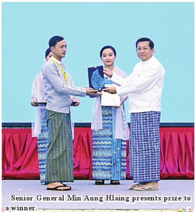
Senior General Min Aung Hlaing presents prize to a winner.

per year. Climate change and human actions are hurting water resources and the natural environment, and water resources are dwindling. Seventy-one percent of the world's surface is covered by water, but 97.5% of global water mass is sea water and only the remaining 2.5% is fresh water. But 68% of fresh water can be found on snowcapped mountains, at the poles and in the form of clouds and vapour, and they are unusable. As only 0.5% of above ground water and 30.1% of underground water are usable, the amount available is too small. Hence, global water resources have