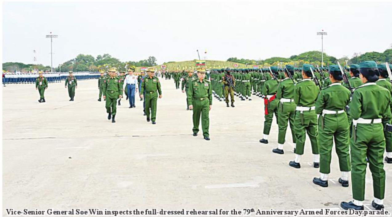
Vice-Senior General Soe Win inspects the full-dressed rehearsal for the 79 th Anniversary Armed Forces Day parade.

Nay Pyi Taw March 22 The military columns that will take part in the 79 th