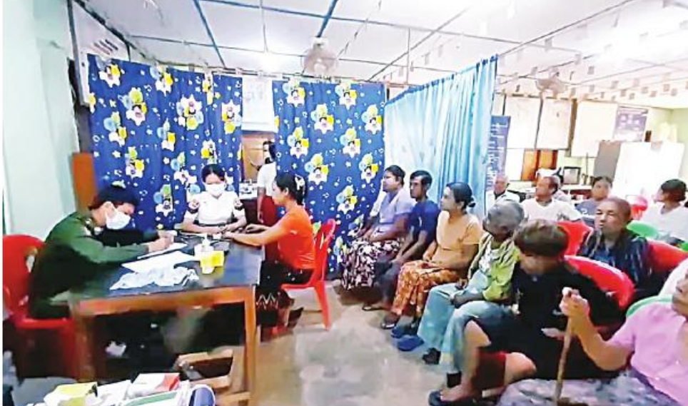
ရန်ကုန်တိုင်း စစ်ဌာနချုပ် နယ်မြေစံ ဆေးကုသရေး အဖွဲ့က ဒေသခံ ပြည်သူများကို ကျန်းမာရေး စောင့်ရှောက်မှု လုပ်ငန်းများ ဆောင်ရွက် ပေးစဉ်။

နေပြည်တော် မတ် ၂၂ ရန်ကုန်တိုင်းဒေသကြီး လှည်းကူးမြို့နယ် တလုတ်ကျွန်းကျေးရွာနှင့် ပတ်ဝန်း ကျင်ကျေးရွာများမှ ဒေသခံပြည်သူများကို ယနေ့နံနက်ပိုင်းတွင် ရန်ကုန်တိုင်းစစ်ဌာန ချုပ် နယ်လှည့်ဆေးကုသရေးအဖွဲ့က အဆိုပါကျေးရွာရှိ တလုတ်ကျွန်းဖွံ့ဖြိုး