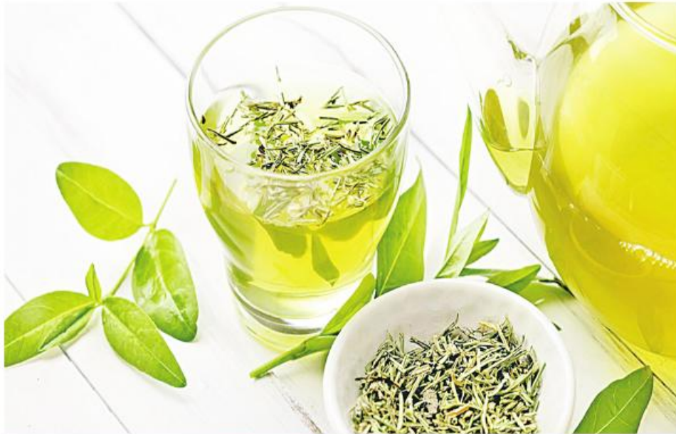
အဆီကျလက်ဖက်စိမ်းရည်(Green Tea)ကို တွေ့ရစဉ်။

ပဲရာဇာ(ပဲနီကလေး)တို့မှာ အဆီကျပြီးပေါ့ပါးသောပဲမျိုးဖြစ်သည်။ နေ့စဉ်စားနိုင်လေ ကောင်းလေဖြစ်သည်။ ပဲရာဇာသည်ပေါ့ပါးသောဂုဏ်(လဟုဂုဏ်)ရှိသည်။ ကုလားပဲသည် လေးလံသောဂုဏ်(ဂရုဂုဏ်)ရှိသည်။ အဆီကျလိုသူ၊ ပိန်လိုသူများမစားသင့်ဟု ဓာတ်ဆရာကြီးများအဆိုရှိသည်။ ပဲရာဇာသည် ဟင်းချိုချက်လျှင်လည်း အလွန်နူးလွယ်၊ ကျက်လွယ်သည်။