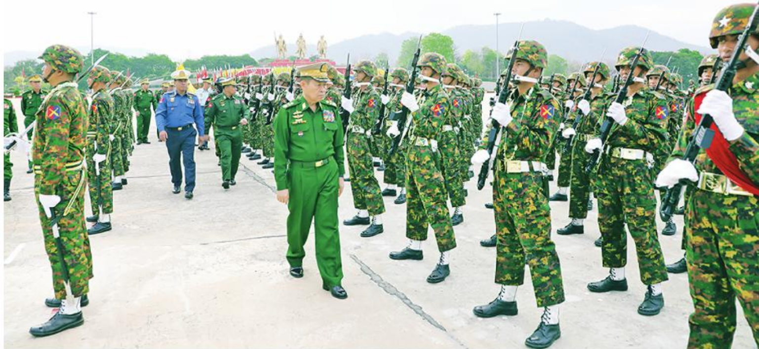
နိုင်ငံတော်စီမံအုပ်ချုပ်ရေးကောင်စီဒုတိယဥက္ကဋ္ဌ ဒုတိယတပ်မတော်ကာကွယ်ရေးဦးစီးချုပ် ကာကွယ်ရေးဦးစီးချုပ်(ကြည်း) ဒုတိယဗိုလ်ချုပ်မှူးကြီးစိုးဝင်း (၇၉)နှစ်မြောက် တပ်မတော်နေ့စစ်ရေးပြအခမ်းအနား၌ ပါဝင်စစ်ရေးပြကြမည့် စစ်ရေးပြစစ်ကြောင်းကြီးများ ဝတ်စုံပြည့်စစ်ရေးပြလေ့ကျင့်နေမှုကို ကြည့်ရှုစစ်ဆေးစဉ်။

နေပြည်တော် မတ် ၂၂ ၂၀၂၄ ခုနှစ် မတ် ၂၇ ရက်တွင် ကျရောက်မည့် (၇၉)နှစ်မြောက် တပ်မတော်နေ့ စစ်ရေးပြအခမ်းအနားတွင် ပါဝင်ချီတက်စစ်ရေးပြကြမည့် စစ်ရေးပြ စစ်ကြောင်းကြီးများသည် ယနေ့နံနက်ပိုင်းတွင် နေပြည်တော် စစ်ရေးပြကွင်း၌ ဝတ်စုံပြည့်စစ်ရေးပြလေ့ကျင့်မှုများ ဆောင်ရွက်ကြသည်။ စစ်ရေးပြလေ့ကျင့်မှုတွင် အနော်ရထာစစ်ကြောင်း၊ ကျန်စစ်သားစစ်ကြောင်း၊ ဘုရင့်နောင်စစ်ကြောင်း၊ အောင်လေယုစစ်ကြောင်း၊ ဆင်ဖြူရှင်စစ်ကြောင်း၊ ဝန္တလစစ်ကြောင်းနှင့် အောင်ဆန်းစစ်ကြောင်းများ ပါဝင်ပြီး စုရပ်ဖြစ်သည့် သစ်တပ်ကွင်းမှ စစ်ရေးပြကွင်းသို့ တပ်မတော်စစ်တီးဝိုင်းအဖွဲ့များ၏ တီးခတ်မှုနှင့်အတူ စစ်ချီသီချင်းများသီဆို၍ ညီညာစွာချီတက်ကြပြီး စစ်ရေးပြအခမ်းအနားအစီအစဉ်အတိုင်း လေ့ကျင့်ဆောင်ရွက်ကြသည်။ ထိုသို့ လေ့ကျင့်နေမှုကို နိုင်ငံတော်စီမံအုပ်ချုပ်ရေးကောင်စီ ဒုတိယဥက္ကဋ္ဌ စာမျက်နှာ ၁၈ ကော်လံ ၁ ☆