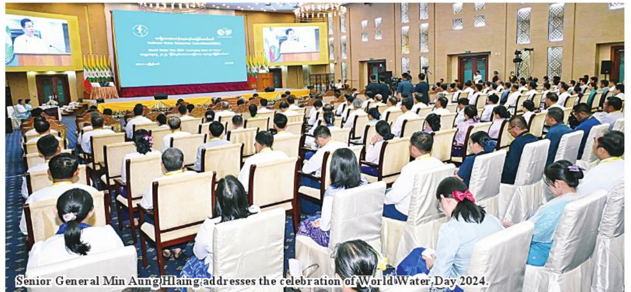
Senior General Min Aung Hlaing addresses the celebration of World Water Day 2024.

is preparing to enact the National Water Law that governs all the water sectors to systematically manage water related sectors. There are 246 dams, 144 diversion dams, 72 lakes, 199 sluice gates and 219 river water pumping stations in the entire country and water is supplied to agricultural farms and households while electricity is generated in some dams. There are a total of 390 river water supply projects that pump water from four major rivers such as the Ayeyarwady, the Chindwin, Thanlwin and Sittaung and other rivers and creeks for nearly 750,000 acres of