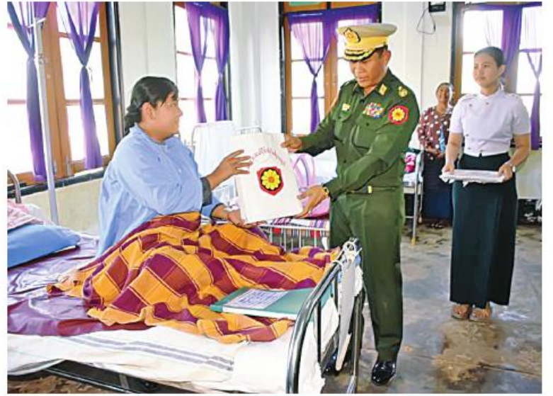
အရှေ့အလယ်ပိုင်းတိုင်းစစ်ဌာနချုပ် တိုင်းမှူး ဗိုလ်ချုပ်မျိုးမင်းထွန်း ဆေးကုသမှု ခံယူနေသူတစ်ဦးကို အာဟာရပြည့်စားသောက်ဖွယ်ရာများနှင့်ထောက်ပံ့ငွေများ ပေးအပ်စဉ်။

သွားရောက်ကြည့်ရှု၍ တစ်ဦးချင်း၏ရောဂါ အနေများကို ရင်းရင်းနှီးနှီးမေးမြန်း အားပေးစကားပြောကြားပြီး အာဟာရပြည့် စားသောက်ဖွယ်ရာများနှင့် ထောက်ပံ့ငွေ