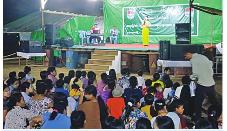
နယ်လှည့်ပြည်သူ့ဆက်ဆံရေးအဖွဲ့များမှ အရာရှိ၊ စစ်သည်၊ စစ်သမီးများက ထားဝယ်တပ်နယ်ရှိ အရာရှိ၊ စစ်သည်၊ မိသားစုဝင်များနှင့် ဌာနဆိုင်ရာဝန်ထမ်းများ စိတ်ပျော်ရွှင်ကြည်နူးချမ်းမြေ့စေရန်အတွက် သီဆိုကပြဖျော်ဖြေစဉ်။

ခေတ်ပေါ်နှင့် ခေတ်ဟောင်းတေးသီချင်း များဖြင့် ဆက်လက်သီဆိုကပြဖျော်ဖြေ ကြရာ အရာရှိ၊ စစ်သည်၊ မိသားစုဝင်များ နှင့် ဌာနဆိုင်ရာဝန်ထမ်းများက စိတ်လက် ပျော်ရွှင်ကြည်နူးချမ်းမြေ့စွာဖြင့် ကြည့်ရှု အားပေး၍ လွတ်လပ်ပေါ့ပါးစွာဖြင့် အတူတကွပါဝင်သီဆိုကြသည်။ ထိုကဲ့သို့ လာရောက်သီဆို ဖျော်ဖြေပေးကြသည့် အဖွဲ့သူအဖွဲ့သားများကို နယ်မြေခံတပ် များက တာဝန်ရှိသူများနှင့် မိသားစုဝင်များ က ဒေသထွက်လက်ဆောင်ပစ္စည်းများ ပေးအပ်ကြပြီး ဒေသထွက်အစားအစာများ ဖြင့် ဧည့်ခံကျွေးမွေးခဲ့ကြကြောင်း သတင်း ရရှိသည်။