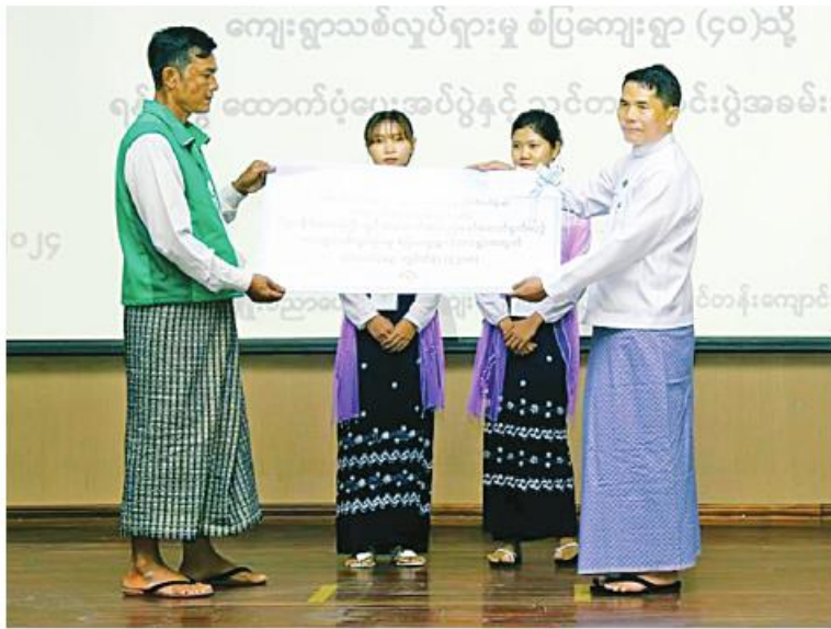
နေပြည်တော် မတ် ၂၂

(၇၉)နှစ်မြောက် တပ်မတော်နေ့ကို ကြိုဆိုရက်ပြုသောအားဖြင့် ကျေးရွာသစ် လှုပ်ရှားမှုစံပြုကျေးရွာများသို့ ရန်ပုံငွေ ထောက်ပံ့ပေးအပ်ပွဲနှင့် ကျေးရွာသစ် လှုပ်ရှားမှု အခြေခံသင်တန်းအမှတ်စဉ် (၁/၂၀၂၄) သင်တန်းဆင်းပွဲအခမ်းအနား ကို ယနေ့ညနေပိုင်းက နေပြည်တော် လေယာ သိရိမြို့နယ်ရှိ စိုက်ပျိုးပညာပေးရေးနှင့် ကျေးလက်ဒေသဖွံ့ဖြိုးတိုးတက်ရေးသင်တန်း