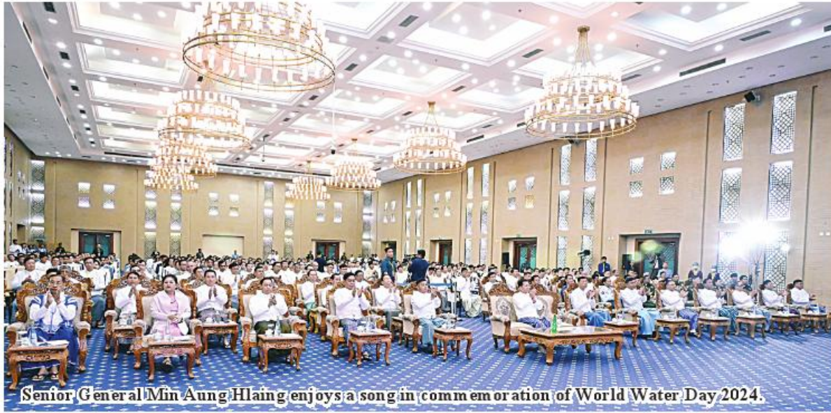
Senior General Min Aung Hlaing enjoys a song in commemoration of World Water Day 2024.