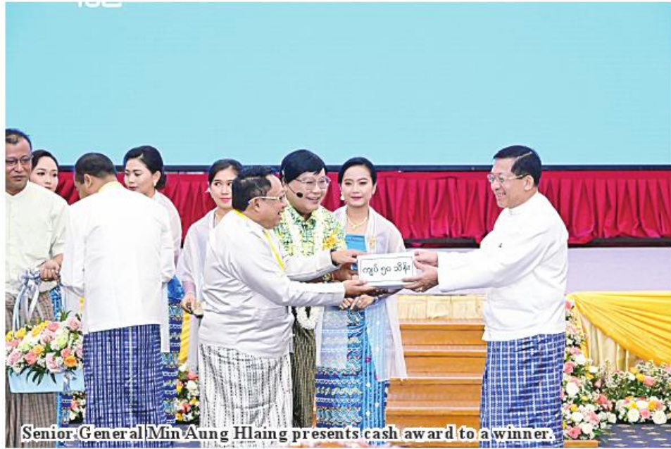
Senior General Min Aung Hlaing presents cash award to a winner.