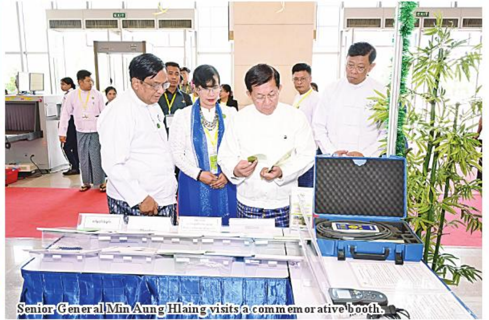
Senior General Min Aung Hlaing visits a commemorative booth.