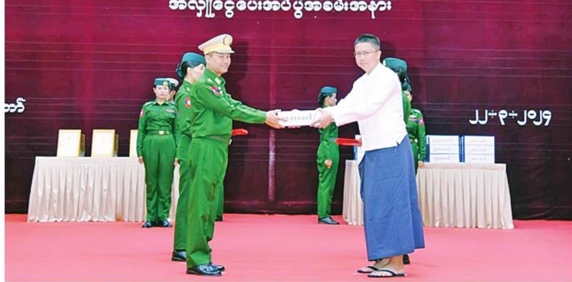
အလှူငွေပေးအပ်ပွဲအခမ်းအနား တပ်မတော်နေ့ကျင်းပရေးဦးစီးကော်မတီဥက္ကဋ္ဌ တပ်မတော်လေ့ကျင့်ရေးအရာရှိချုပ် ဒုတိယဗိုလ်ချုပ်ကြီးထိန်ဝင်းထံ စေတနာရှင် အလှူရှင်တစ်ဦးက အလှူငွေများ ပေးအပ်လှူဒါန်းစဉ်။

နေပြည်တော် မတ် ၂၂ (၇၉)နှစ်မြောက် တပ်မတော်နေ့ကို ကြိုဆိုဂုဏ်ပြုသောအားဖြင့် စေတနာရှင် အလှူရှင်များက ဂုဏ်ပြုအလှူငွေများ ပေးအပ်လှူဒါန်းပွဲကို ယနေ့မုန်းလွဲပိုင်း အဆိုပါအလှူငွေပေးအပ်ပွဲသို့ ညှိနှိုင်း တွင် နေပြည်တော် စစ်ကြောရေးနှင့် ကွပ်ကဲရေးမှူး(ကြည်း၊ရေ၊လေ) ဗိုလ်ချုပ်ကြီး တည်းခိုရေးစခန်းရှိ ဆင်ဖြူရှင်ခန်းမ၌ မောင်မောင်အေး၊ စစ်ရေးချုပ် ဒုတိယ ဗိုလ်ချုပ်ကြီးစိုးမင်းဦး၊ တပ်မတော်နေ့