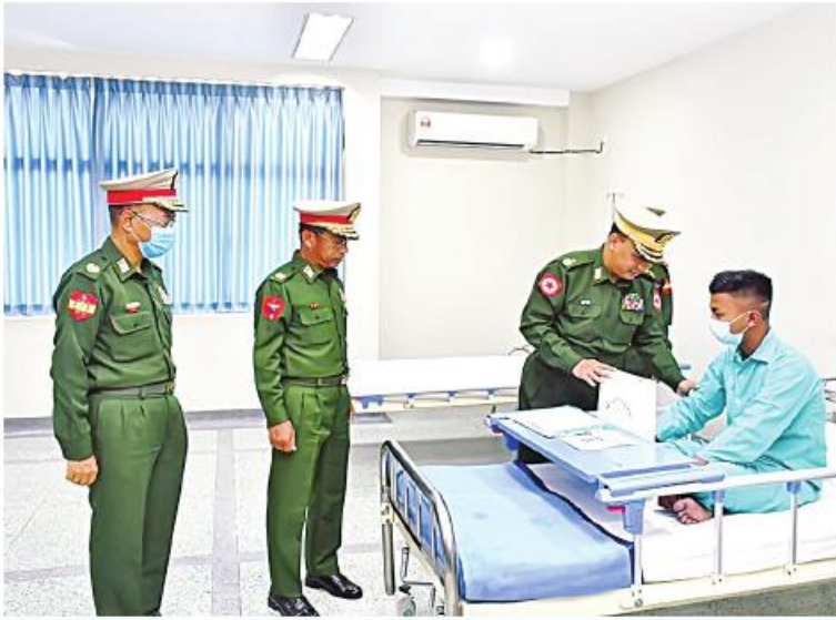
ရန်ကုန်တိုင်းစစ်ဌာနချုပ် တိုင်းမှူး ဗိုလ်ချုပ်ဇော်ဟိန်း ဆေးကုသမှုခံယူနေသူတစ်ဦးကို အာဟာရပြည့်စားသောက်ဖွယ်ရာများနှင့် ထောက်ပံ့ငွေများပေးအပ်စဉ်။

ကချင်ပြည်နယ် တနင်္ဂနွေမြို့ရှိ တပ်မတော် ဆေးရုံ၊ ရှမ်းပြည်နယ်(တောင်ပိုင်း) နမ့်စန်မြို့ရှိ တပ်မတော်ဆေးရုံ၊ ရှမ်းပြည်နယ်(အရှေ့ပိုင်း) ကျိုင်းတုံမြို့ရှိ တပ်မတော် ဆေးရုံ၊ မွန်ပြည်နယ် မော်လမြိုင်မြို့ရှိ တပ်မတော်ဆေးရုံ၊ တနင်္သာရီတိုင်းဒေသကြီး မြိတ်မြို့ရှိ တပ်မတော်ဆေးရုံ၊ ရန်ကုန်တိုင်းဒေသကြီး မင်္ဂလာဒုံမြို့နယ်ရှိ တပ်မတော်အရိုးရောဂါအထူးကုဆေးရုံကြီး (ခုတင်-၅၀၀)နှင့် တပ်မတော်ဆေးရုံကြီး (ခုတင်-၁၀၀၀)၊ စစ်တိုင်းတိုင်းဒေသကြီး ကလေးမြို့ရှိ တပ်မတော်ဆေးရုံတို့၌ တက်ရောက်ဆေးကုသမှု ခံယူနေသော အရာရှိ၊ စစ်သည်၊ မိသားစုဝင်များ၊ မြန်မာနိုင်ငံရဲတပ်ဖွဲ့ဝင်များ၊ ပြည်သူ့စစ် (ဌာန)တပ်ဖွဲ့ဝင်များ၊ စစ်မှုထမ်းဟောင်း အဖွဲ့ဝင်များနှင့် ဒေသခံပြည်သူများကို ယနေ့တွင် တိုင်းစစ်ဌာနချုပ်အသီးသီးမှ တိုင်းမှူးများနှင့် တာဝန်ရှိသူများက