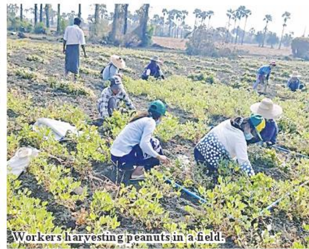
Workers harvesting peanuts in a field.

In addition, the Department of Agriculture for the township instructed the winter peanut farmers in