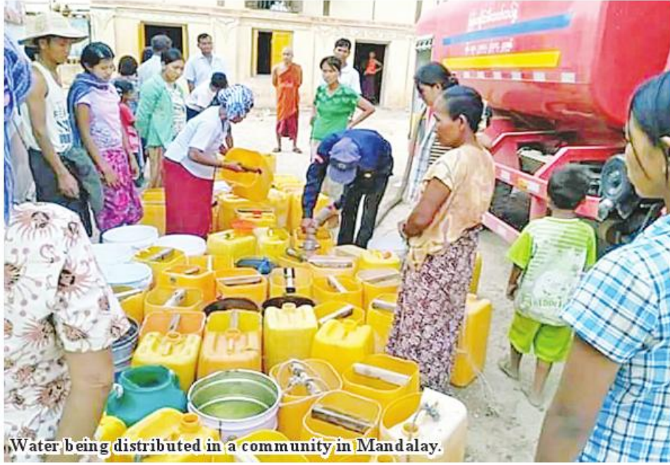
Water being distributed in a community in Mandalay.