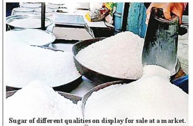
Sugar of different qualities on display for sale at a market.