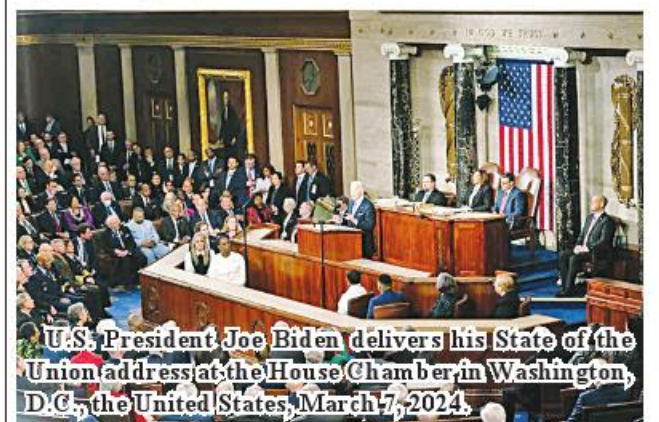
U.S. President Joe Biden delivers his State of the Union address at the House Chamber in Washington, D.C., the United States, March 7, 2024.