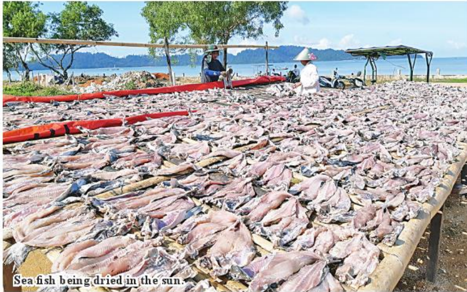
Sea fish being dried in the sun.

Labutta March 19 A total of 84,000 visses of dried sea fish from Labutta Township, Ayeyawady Region was sold to the Yangon market in February, said Daw Tin Tin Nyo, owner of various dried fish wholesale center from Labutta Township. Up to 52,000 visses of dried fish was sold in January in Labutta Township. From February 1 to 29, up to 84,000 dried sea fish were sold to Yangon market.