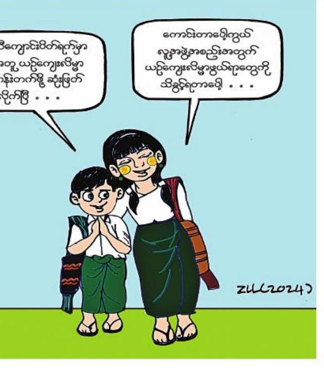
ကျေးရွာစီမံကိန်းအရင်းမပျောက်လည်ပတ်ရန်ပုံငွေကျပ် ၄၁၈ သိန်း လွှဲပြောင်းပေးအပ်ခဲ့သည်။

ကျေးရွာစီမံကိန်း အရင်းမပျောက်လည်ပတ် ရန်ပုံငွေကျပ် ၄၁၈ သိန်း ထုတ်ချေးပေးခဲ့ ကြောင်း သိရသည်။