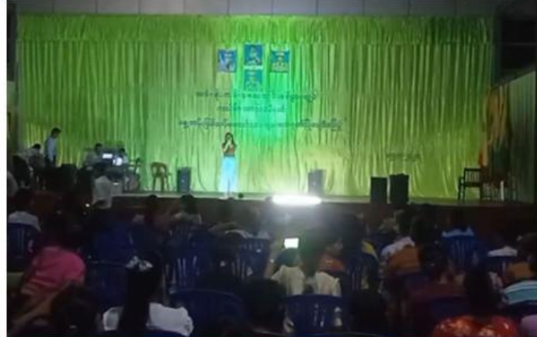
နိုင်ငံတော်ကာကွယ်ရေးနှင့် လုံခြုံရေးတာဝန်များကို စွမ်းစွမ်းတပ်ထမ်းဆောင်လျက်ရှိရာမှ တပ်ရင်းဌာနချုပ်ရှိ မိသားစုဝင်များရှိရာသို့ ပြန်လည်စုဖွဲ့လေ့ကျင့်လျက်ရှိသော တပ်မတော်သားများ စိတ်ပျော်ရွှင်ကြည်နူးချမ်းမြေ့စေရန်အတွက် နယ်လှည့်ပြည်သူ့ဆက်ဆံရေးအဖွဲ့များမှ အရာရှိ၊ ဝန်ထမ်းများက သီဆိုကပြပျော်ပြေစဉ်။

ဖျော်ဖြေလျက်ရှိသည်။ ထိုသို့ သွားရောက်ဂုဏ်ပြုသီဆိုကပြဖျော်ဖြေလျက်ရှိရာ ယနေ့တွင် တနင်္သာရီတိုင်းဒေသကြီး ကလိန်အောင်မြို့ရှိတပ်နယ်ခန်းမ၌ နယ်လှည့်ပြည်သူ့ဆက်ဆံရေးအဖွဲ့များမှ အရာရှိ၊ စစ်သည်၊ စစ်သမီးများက စစ်ချီတေး၊စစ်သည်တေးသီချင်းများ၊ခေတ်ပေါ်နှင့် ခေတ်ဟောင်းတေးသီချင်းများဖြင့် သီဆိုကပြဖျော်ဖြေကြရာ အောင်ပွဲရရွှေတန်းပြန်တပ်မတော်သားများနှင့် မိသားစုဝင်များက စိတ်လက်ပျော်ရွှင်ကြည်နူးချမ်းမြေ့စွာဖြင့်ကြည့်ရှုအားပေး၍ လွတ်လပ်ပေါ့ပါးစွာဖြင့် အတူတကွ ပါဝင်သီဆိုကြသည်။ ထိုကဲ့သို့ လာရောက်သီဆိုဖျော်ဖြေပေးကြသည့် အဖွဲ့သူ၊ အဖွဲ့သားများကို နယ်မြေခွဲတပ်မှ တာဝန်ရှိသူများနှင့် မိသားစုဝင်များက ဒေသထွက်လက်ဆောင်ပစ္စည်းများဖြင့် ဧည့်ခံကျွေးမွေးခဲ့ကြကြောင်း သတင်းရရှိသည်။