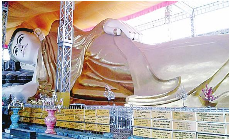
ပဲခူးမြို့ရှိ ရွှေသာလျောင်းရုပ်ပွားတော်ကို ဖူးတွေ့ရစဉ်။