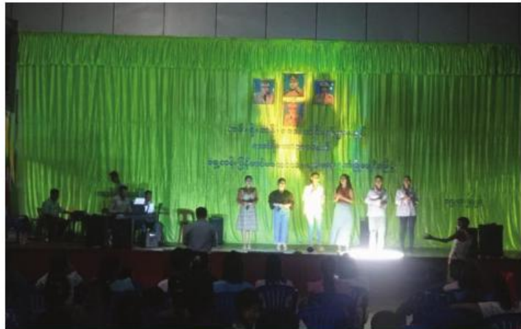
နိုင်ငံတော်ကာကွယ်ရေးနှင့် လုံခြုံရေးတာဝန်များကို စွမ်းစွမ်းတပ်ထမ်းဆောင်လျက်ရှိရာမှ တပ်ရင်းဌာနချုပ်ရှိ မိသားစုဝင်များရှိရာသို့ ပြန်လည်စုဖွဲ့လေ့ကျင့်လျက်ရှိသော တပ်မတော်သားများ စိတ်ပျော်ရွှင်ကြည်နူးချမ်းမြေ့စေရန်အတွက် နယ်လှည့်ပြည်သူ့ဆက်ဆံရေးအဖွဲ့များမှ အရာရှိ၊ ဝန်ထမ်းများက သီဆိုကပြပျော်ပြေစဉ်။

နေပြည်တော် မတ် ၁၉ တိုင်းဒေသကြီးနှင့် ပြည်နယ်အသီးသီးရှိ တိုင်းရင်းသားပြည်သူများ စိတ်အေးချမ်းသာစွာ နေထိုင်လုပ်ကိုင်စားသောက်နိုင်ရေးနှင့် အသက်အနီးအိမ်စည်းစိမ်ဥစ္စာလုံခြုံမှုရှိစေရေးအတွက် နိုင်ငံတော်ကာကွယ်ရေးနှင့် လုံခြုံရေးတာဝန်များကို မိဝေးဖဝေး၊ မိသားစုများနှင့်ဝေးကွာ၍ နေမအားညမနား စွမ်းစွမ်းတပ်တာဝန်ထမ်းဆောင်လျက်ရှိရာမှ တပ်ရင်းဌာနချုပ်ရှိ မိသားစုဝင်များရှိရာသို့ ပြန်လည်စုဖွဲ့လေ့ကျင့်လျက်ရှိသော တပ်မတော်သားများ စိတ်ပျော်ရွှင်ကြည်နူးချမ်းမြေ့စေရန်အတွက် တာကွယ်ရေးဦးစီးချုပ်ရုံး(ကြည်း)ပြည်သူ့ဆက်ဆံရေးနှင့် စိတ်ဓာတ်စစ်ဆင်ရေးညွှန်ကြားရေးမှူးရုံးကွပ်ကဲမှုအောက်ရှိ နယ်လှည့်ပြည်သူ့ဆက်ဆံရေးအဖွဲ့များမှ အရာရှိ၊ စစ်သည်၊ စစ်သမီးများက တိုင်းစစ်ဌာနချုပ်အသီးသီးရှိ ရွှေတန်းစခန်းများနှင့် နယ်မြေခွဲတပ်ရင်း