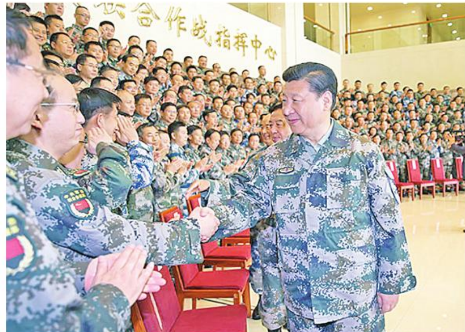
၁၄ ကြိမ်မြောက် အမျိုးသားပြည်သူ့ကွန်ဂရက်တွင် သမ္မတ ရှီကျင့်ဖျင် တက်ရောက်စဉ်။

သမ္မတရှီကျင့်ဖျင်က ၁၄ ကြိမ်မြောက် အမျိုးသားပြည်သူ့ကွန်ဂရက် သို့မဟုတ် တရုတ်နိုင်ငံလွှတ်တော် ဒုတိယအစည်းအဝေး၌ တရုတ်တပ်မတော်နှင့်ပြည်သူ့ရဲတပ်ဖွဲ့ကိုယ်စားလှယ်အဖွဲ့တို့၏ မျက်နှာစုံညီ အစည်းအဝေးတွင် အမှာစကားပြောကြားခဲ့ပြီး ထွန်းသစ်စနယ်ပယ်များတွင် မဟာဗျူဟာစွမ်းရည်များကို ကျယ်ကျယ်ပြန့်ပြန့်မြှင့်တင်ရန် တရုတ်စစ်ဘက်ကို တောင်းဆိုခဲ့သည်။ ခေတ်သစ်စစ်ပွဲတွင် ဉာဏ်ရည်တူ