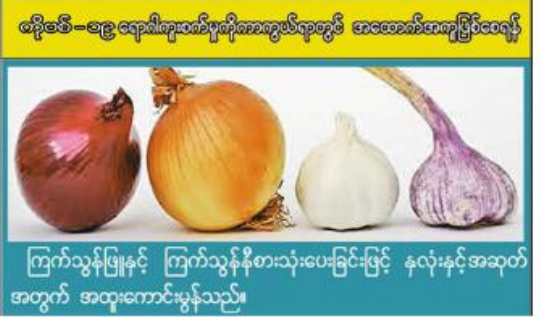
ကြက်သွန်ဖြူနှင့် ကြက်သွန်နီစားသုံးပေးခြင်းဖြင့် နှလုံးနှင့်အဆုတ် အတွက် အထူးကောင်းမွန်သည်။