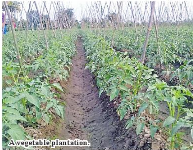
A vegetable plantation.

by townships in Homalin District, there were 3,790 acres in Homalin Township and 121 acres in Mo Paing Lut Sub-Township, totaling 3,911 acres. 206