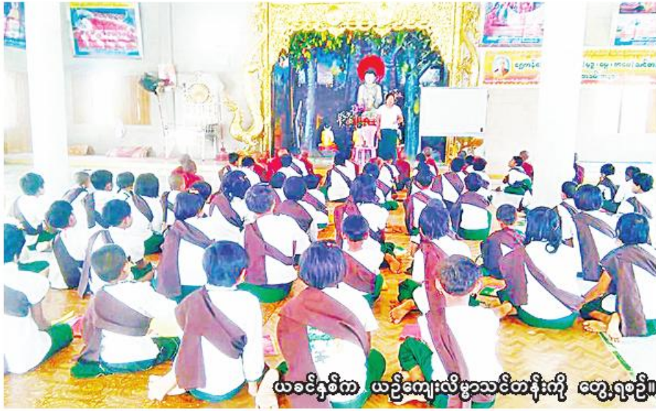
ယခင်နှစ်က ယဉ်ကျေးလိမ္မာသင်တန်းကို တွေ့ရစဉ်။