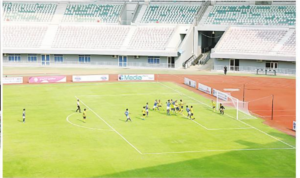
နိုင်ငံတော်စီမံအုပ်ချုပ်ရေးကောင်စီအဖွဲ့ဝင်များ ၂၀၂၃-၂၀၂၄ ခုနှစ် ပြည်နယ်နှင့် တိုင်းဒေသကြီး အသက် ၂၅ နှစ်အောက် အမျိုးသားဘောလုံးပြိုင်ပွဲတွင် ကချင်ပြည်နယ်အသင်းနှင့် တနင်္သာရီတိုင်းဒေသကြီးအသင်းတို့ ယှဉ်ပြိုင်ကစားနေမှုကို ကြည့်ရှုအားပေးစဉ်။