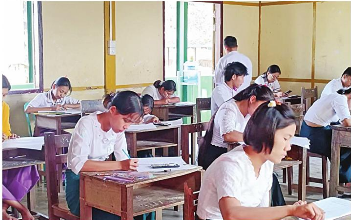
ရခိုင်ပြည်နယ်အတွင်းရှိ အခြေခံပညာအထက်တန်းကျောင်းများ၌ ၂၀၂၃-၂၀၂၄ ပညာသင်နှစ် တက္ကသိုလ်ဝင်စာမေးပွဲ ဖြေဆိုကြသည့် ကျောင်းသား၊ ကျောင်းသူများကို တွေ့ရစဉ်။

နေပြည်တော် မတ် ၁၅ ၂၀၂၃ - ၂၀၂၄ ပညာသင်နှစ် တက္ကသိုလ်ဝင်စာမေးပွဲကို မတ် ၁၁ ရက်တွင် စတင်ကျင်းပလျက်ရှိရာ ယနေ့တွင် ပဉ္စမနေ့အဖြစ် ရူပဗေဒ ဘာသာရပ်နှင့် သမိုင်းဘာသာရပ်တို့ကို တိုင်းဒေသကြီးနှင့် ပြည်နယ်အသီးသီးရှိ အခြေခံပညာ အထက်တန်းကျောင်း များ၌ ကျောင်းသား၊ ကျောင်းသူများ ဝင်ရောက်ဖြေဆိုလျက်ရှိသည်။ ဦးစွာ စာမေးပွဲဖြေဆိုခြင်းမပြုမီ ဆရာ၊ ဆရာမများက ကျောင်းသား၊ ကျောင်းသူများကို စာမေးပွဲဖြေဆိုခွင့် ကတ်များ မှန်၊မမှန်စစ်ဆေးခြင်းများ နှင့် လိုအပ်သည့် စစ်ဆေးမှုများကို စာမေးပွဲ စည်းမျဉ်းစည်းကမ်းများနှင့် အညီ စနစ်တကျဆောင်ရွက်ကြသည်။ ယင်းသို့ ကျောင်းသား၊ ကျောင်းသူများ စာမျက်နှာ ၁၈ ကော်လံ ၁ ☆