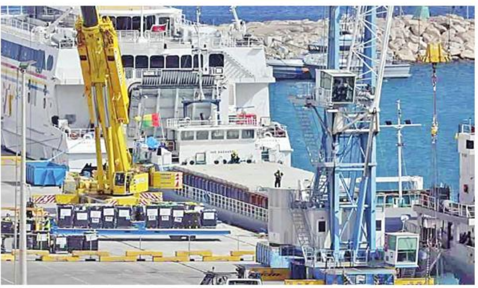
မှတစ်ဆင့် ထပ်မံစေလွှတ်ရန် အငတ်ဘေးနှင့် ရင်ဆိုင်ရမည့် နိုင်ငံတကာပရဟိတအဖွဲ့အစည်းအချိန်တွင် ဂါလာကမ်းမြောင်သို့ အကူအညီများ ပို့ပေးပို့နိုင်ရေးအတွက် နိုင်ငံတကာက ကြိုးပမ်းလျက်ရှိသည်။ ၂၀၂၃ ခုနှစ် အောက်တိုဘာ ၇ ရက်တွင် စတင်ဖြစ်ပွားခဲ့သည့် ဂါလာစစ်ပွဲကြောင့် ဂါလာကမ်းမြောင်ဒေသ၌ သေဆုံးခဲ့ရသော ပါလက်စတိုင်းအရေအတွက်မှာ ၃၁၀၀၀ ကျော်ရှိပြီဖြစ်ကြောင်း သိရသည်။ Ref : Xinhua Trs : KKO

ဂါဇာစီးတီး မတ် ၁၅ စားနပ်ရိက္ခာများ တင်ဆောင်ထားသည့် တွဲတစ်တွဲကို ချိတ်တွဲထားသည့် သင်္ဘောတစ်စီးသည် ယနေ့တွင် ဂါလာကမ်းမြောင်သို့ ရောက်ရှိလာပြီဖြစ်သည်။ အဆိုပါသင်္ဘောသည် ဂါလာကမ်းမြောင်သို့ အကူအညီများပေးအပ်ရာတွင် ရေလမ်းကြောင်းသစ်ဖွင့်ရေးအတွက် ရွှေ့ပြောင်းသင်္ဘောအဖြစ် ဆိုက်ပရပ်စ်မှ ထွက်ခွာလာခဲ့သည့် သင်္ဘောဖြစ်သည်။ ဂါလာကမ်းမြောင်သို့ ရောက်ရှိလာသည့် အဆိုပါသင်္ဘောချိတ်တွဲယူလာသည့် ကုန်တွဲပေါ်တွင် စားနပ်ရိက္ခာတန်ချိန် ၂၀၀ ထိ တင်ဆောင်ထားသည်။ ရွှေ့ပြောင်းခရီးစဉ် အောင်မြင်မှုကြောင့် ဒုတိယမြောက်ရိက္ခာပို့သင်္ဘောတစ်စီးကို ဆိုက်ပရပ်စ်နိုင်ငံမှ တစ်ဆင့် အောင်မြင်မှု ဝါးလကျော်ကြာမြင့်လာပြီဖြစ်သည့် အစွဲအစားမတစ်စစ်ပွဲကြောင့် ဂါလာဒေသနေပြည်သူများ