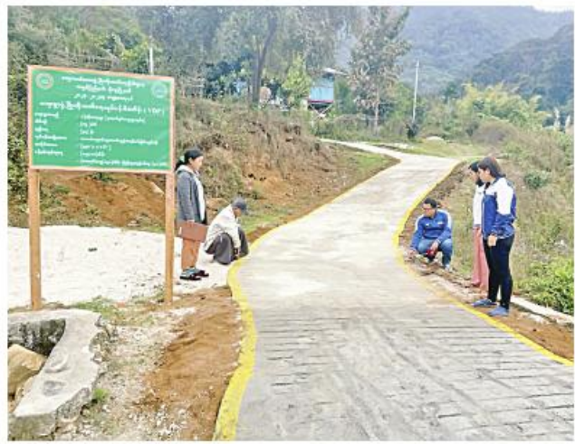
ကျော်စောဦး(မောရမ်းမြေ)

၅၆၀၊ အမြင့် ခြောက်လက်မရှိ ကွန်ကရစ်လမ်းခင်းခြင်းလုပ်ငန်းကို ကျေးရွာဖွံ့ဖြိုးတိုးတက်ရေးလုပ်ငန်းစီမံကိန်းပံ့ပိုးငွေကျပ် ၁၅ သန်း၊ ပြည်သူ့ထည်ဝင်ငွေကျပ် သုည ဒသမ ၄ သန်း စုစုပေါင်း ငွေကျပ် ၁၅ ဒသမ ၄ သန်းအသုံးပြု၍ မြို့နယ်ကျေးလက်ဒေသဖွံ့ဖြိုးတိုးတက်ရေးဦးစီးဌာန၏ နည်းပညာပံ့ပိုးမှုဖြင့် ကျေးရွာသူ၊ ကျေးရွာသားများကိုယ်တိုင် ယခုနှစ် ဖေဖော်ဝါရီလ ပထမပတ်က စတင် ဆောင်ရွက်ခဲ့ရာ ယခုအခါ လုပ်ငန်းများ ရာနှုန်းပြည့်ပြီးစီးပြီဖြစ်ကြောင်း၊ အဆိုပါ ကွန်ကရစ်လမ်းပြီးစီးမှုကြောင့် ဒေသခံပြည်သူများ ရာသီမရွေး အဆင်ပြေစွာ သွားလာအသုံးပြုနိုင်ပြီဖြစ်ကြောင်း သိရသည်။