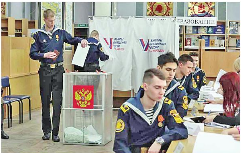
မတ် ၁၅ ရုရှားနိုင်ငံတစ်ဝန်း မဲရုံများ၌ ရုရှားပြည်သူများ ပါဝင်မဲပေးခဲ့ကြကြောင်း သိရသည်။ ရုရှားနိုင်ငံတစ်ဝန်း မဲရုံများ၌ ရုရှားပြည်သူများ ပါဝင်မဲပေးခဲ့ကြကြောင်း သိရသည်။ ရုရှားနိုင်ငံတစ်ဝန်း၌ မဲရုံပေါင်း ၁၀၀၀၀၀ ခန့်ကို ရုရှားအစိုးရက ဖွင့်ပေးထားသည်။ ထို့ပြင် ယခုနှစ် ရုရှားသမ္မတရွေးကောက်ပွဲတွင် ရုရှားမဲဆန္ဒရှင်များအနေဖြင့် ပထမဆုံးအကြိမ်အွန်လိုင်းမှတစ်ဆင့် မဲပေးခွင့်ရခဲ့ကြသည်။ ရုရှားနိုင်ငံသည် ယခုနှစ်သမ္မတရွေးကောက်ပွဲကို ရုရှားထိန်းချုပ်မှုအောက်တွင်ရှိသည့် ယူကရိန်းနယ်မြေများတွင်လည်း ကျင်းပခဲ့သည်။ ယခုနှစ် ရုရှားသမ္မတရွေးကောက်ပွဲ၌ လက်ရှိသမ္မတပူတင်အပါအဝင် သမ္မတလောင်းလေးဦးတို့ ပါဝင်ယှဉ်ပြိုင်လျက်ရှိရာ အသက် ၇၁ နှစ်အရွယ် လက်ရှိသမ္မတ ပူတင်ကသာ ယခုနှစ်ရွေးကောက်ပွဲ၌ ထပ်မံအနိုင်ရရန် သေချာသလောက် ရှိကြောင်း သိရသည်။ Ref : Xinhua Trs : KKO