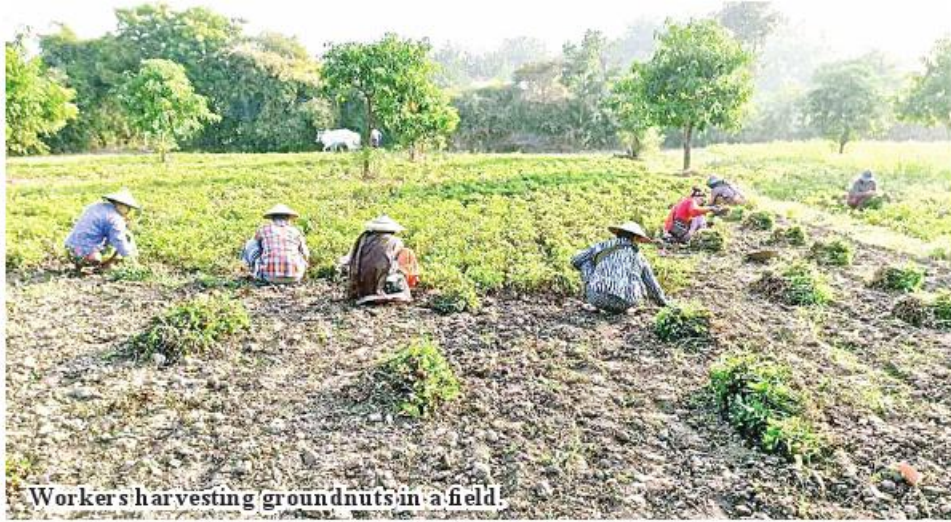
Workers harvesting groundnuts in a field.

Yinmabin March 15 A total of 23,039 acres of winter groundnut has been harvested in Yinmabin District of Sagaing Region, according to the statistics of the district Agriculture Department.