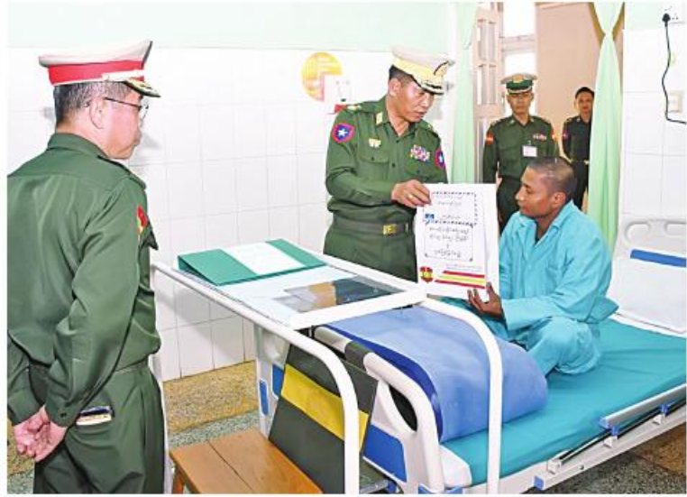
အလယ်ပိုင်းတိုင်းစစ်ဌာနချုပ် တိုင်းမှူး ဝိုလ်ချုပ်ကြည်ခိုင် ဆေးကုသမှုခံယူနေသူတစ်ဦးကို အာဟာရပြည့်စားသောက်ဖွယ်ရာများ ပေးအပ်စဉ်။