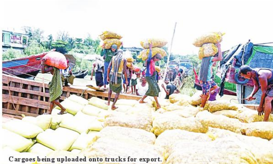
Cargoes being uploaded onto trucks for export.

Nay Pyi Taw March 15 The trade value between Myanmar and Bangladesh through land borders reached US$13.202 million during the period from April 2023 to February 2024 in