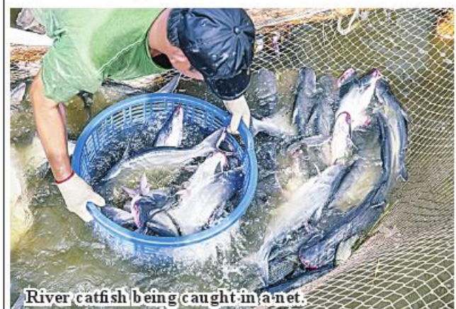
River catfish being caught in a net.