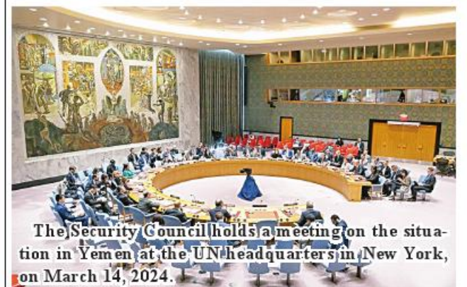
The Security Council holds a meeting on the situation in Yemen at the UN headquarters in New York, on March 14, 2024.

The longer the escalatory environment continues, the more challenging Yemen's mediation space will become. With more interests at play, the parties to the conflict in Yemen are more likely to shift calculations and alter their negotiation agendas. In a worst-case scenario, the parties could decide to engage in risky military adventurism that propels Yemen back into a new cycle of war, he said. Xinhua