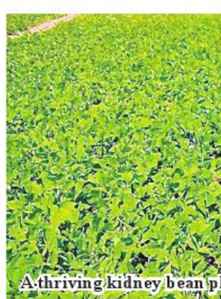
A thriving kidney bean plantation.

Officials from the relevant agriculture departments help local farmers expand sown acreage of kidney bean, high yield, use of GAP system and quality strains of bean, and use of high yield