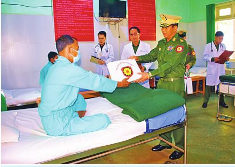
အရှေ့အလယ်ပိုင်းတိုင်းစစ်ဌာနချုပ် တိုင်းမှူး ဝိုလ်ချုပ်မျိုးမင်းထွန်း ဆေးကုသမှုခံယူနေသူတစ်ဦးကို အာဟာရပြည့်စားသောက်ဖွယ်ရာများ ပေးအပ်စဉ်။