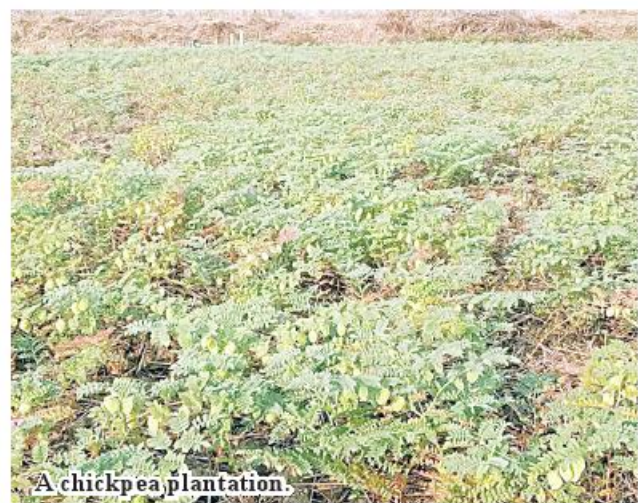
A chickpea plantation.

Personnel of relevant departments cooperate with lo-