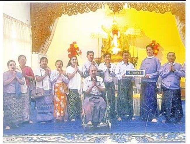
မန္တလေး ရှမ်းမြို့နယ်အစိုးရအဖွဲ့က နယ်စပ်ဒေသများရှိ စီမံကိန်းအစီအစဉ်အား အလှူငွေအားဖြင့် အကူအညီပေးပေးရန်အတွက် အလှူငွေအဖွဲ့အစည်းများနှင့် တွေ့ဆုံဆွေးနွေးရာတွင် ပါဝင်ဆောင်ရွက်နေကြောင်း ပြောပြခဲ့သည်။

ပြည် မတ် ၁၅ ပဲခူးတိုင်းဒေသကြီး ပြည်ခရိုင် ပြည်မြို့နယ် ကျေးလက်ဒေသဖွံ့ဖြိုးတိုးတက်ရေးဦးစီးဌာနက ပုတ်ကုန်းကျေးရွာ၌ မြစ်စမ်းရောင်းကုန်စီမံကိန်းအစီအစဉ်အောက်တွင် ဒေသဖွံ့ဖြိုးရေးလုပ်ငန်းများ ဆောင်ရွက်နေမှုကို ယနေ့နံနက်ပိုင်းက တာဝန်ရှိသူများ ကွင်းဆင်းစစ်ဆေးခဲ့ကြောင်း သိရသည်။