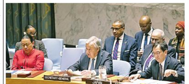
UN Secretary-General Antonio Guterres (C, front) speaks at a Security Council meeting on Sudan, at the UN headquarters in New York, on March 7, 2024.

Deadly clashes have been going on between the Sudanese Armed Forces and the paramilitary Rapid Support Forces in Sudan since April last year. Amid the continued fighting in different parts of the country, Sudan is now home to the world's largest internal displacement crisis, with 6.3 million people seeking safety within the country since the beginning of the conflict. Another 1.7 million people have also fled to neighboring countries, according to the United Nations.