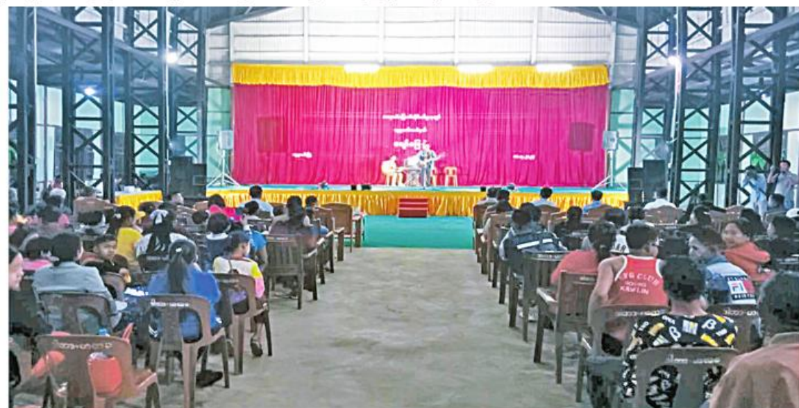
အရာရှိ၊ စစ်သည်၊ မိသားစုဝင်များနှင့် ဌာနဆိုင်ရာဝန်ထမ်းများ စိတ်ပျော်ရွှင်ကြည်နူးချမ်းမြေ့စေရန်အတွက် နယ်လှည့်ပြည်သူ့ဆက်ဆံရေးအဖွဲ့များမှ အရာရှိ၊ စစ်သည်၊ စစ်သမီးများက သီဆိုကပြဖျော်ဖြေခဲ့ခြင်း

အပြင် ဂုဏ်ပြုဖျော်ဖြေလျက်ရှိသည်။ ထိုသို့ သွားရောက်ဂုဏ်ပြုဖျော်ဖြေလျက်ရှိရာ မတ် ၉ ရက်တွင် စစ်ကိုင်းတိုင်းဒေသကြီး ဟုမ္မလင်းတပ်နယ်၌လည်းကောင်း၊ ယနေ့တွင် ကလေးတပ်နယ်၌လည်းကောင်း သက်ဆိုင်ရာတပ်နယ်များမှ အရာရှိ၊ စစ်သည်၊ မိသားစုဝင်များနှင့် ဌာနဆိုင်ရာဝန်ထမ်းများ စိတ်ပျော်ရွှင်ကြည်နူးချမ်းမြေ့စေရန်အတွက် နယ်လှည့်ပြည်သူ့ဆက်ဆံရေးအဖွဲ့များမှ အရာရှိ၊ စစ်သည်၊ စစ်သမီးများက ဟုမ္မလင်းမြို့နှင့် ကလေးမြို့တို့ရှိ သက်ဆိုင်ရာ နယ်မြေခံတပ်ရင်းခန်းမအသီးသီး၌ စစ်ချီတေး၊ စစ်သည်တေး သီချင်းများ၊ ခေတ်ပေါ်နှင့် ခေတ်ဟောင်းတေးသီချင်းများဖြင့် သီဆိုကပြဖျော်ဖြေကြရာ အရာရှိ၊ စစ်သည်၊ မိသားစုဝင်များနှင့် ဌာနဆိုင်ရာဝန်ထမ်းများက စိတ်လက်ပျော်ရွှင်ကြည်နူးချမ်းမြေ့စွာဖြင့် ကြည့်ရှုအားပေး၍ လွတ်လပ်ပေါ့ပါးစွာဖြင့် အတူတကွပါဝင်သီဆိုကြသည်။ ထိုကဲ့သို့ လာရောက်သီဆို