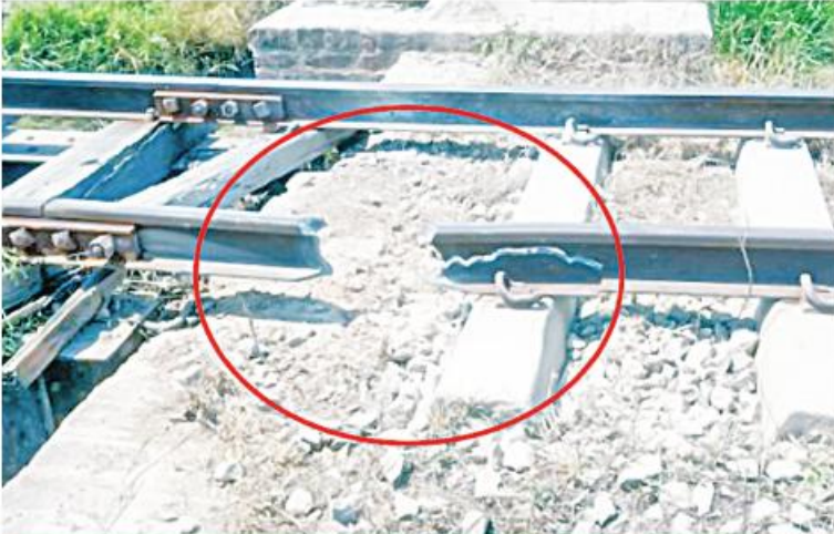
အကြမ်းဖက်သောင်းကျန်းသူများ၏ မိုင်းဖောက်ခွဲမှုကြောင့် ကျောက်ဆည်-မင်းစုဘူတာ အကြား တံတားအမှတ်(၇၃၈)၏ အဆန်ရထားလမ်းပိုင်းပျက်စီးဆုံးရှုံးမှုမှတ်တမ်းဓာတ်ပုံ။

မန္တလေးတိုင်းဒေသကြီး ကျောက်ဆည် မြို့နယ် ရန်ကုန်-မန္တလေး ရထားလမ်းပိုင်း အတွင်း ကျောက်ဆည်-မင်းစုဘူတာအကြား မိုင် ၃၅၃/၂၄ နှင့် ၃၅၄/၁ အကြား တံတား အမှတ် (၇၃၈)၏ အစုန်၊ အဆန် ပေ ၂၀ သံပေါင်တံတားနှင့် ကွန်ကရစ်တံတားများ ပေါ်တွင် ယနေ့နံနက် ၈ နာရီ မိနစ် ၄၀ ခန့် တွင် မိုင်းပေါက်ကွဲမှုဖြစ်ပွားခဲ့ကြောင်း သတင်းအရ နယ်မြေခံလုံခြုံရေးအဖွဲ့က သွားရောက်စစ်ဆေးခဲ့ရာ တံတားများရှိ အရွေ့ဘက်ခြမ်း သံလမ်းများ နှစ်ပေခန့်စီ ပြတ်ထွက်နေပြီး မကွဲသေးသော လက်ကျန် မိုင်းတစ်လုံးကို တွေ့ရှိခဲ့သဖြင့် မင်းစု-