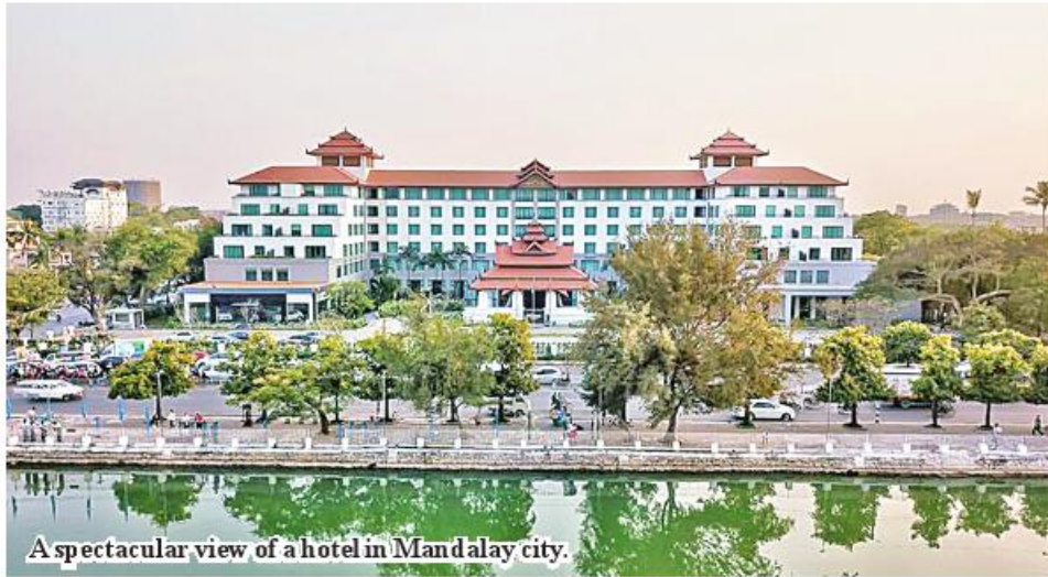
A spectacular view of a hotel in Mandalay city.