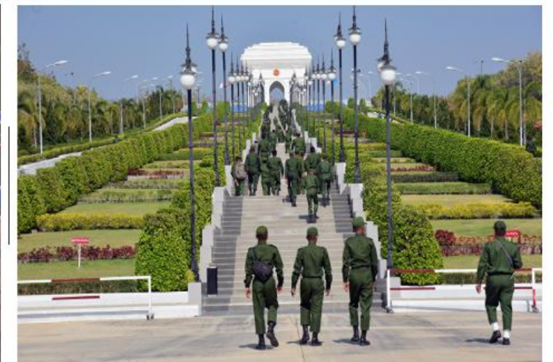
(၇၉)နှစ်မြောက် တပ်မတော်နေ့စစ်ရေးပြအခမ်းအနားတွင် ပါဝင်သည့် စစ်ရေးပြ စစ်ကြောင်းများမှ တပ်မတော်(ကြည်း၊ရေ၊လေ)အရာရှိ၊စစ်သည်များ၊တပ်မတော်(ကြည်း) အမျိုးသမီးစစ်ရေးပြတပ်ခွဲ၊မြန်မာနိုင်ငံရဲတပ်ဖွဲ့ ဝင်များနှင့် မြန်မာနိုင်ငံရဲတပ်ဖွဲ့ အမျိုးသမီး စစ်ရေးပြတပ်ခွဲတို့က သူရဲကောင်းမိမိသို့ သွားရောက်လေ့လာကြည့်ရှုကြစဉ်။

ခမ်းနားထည်ဝါစွာ တည်ထားပူဇော်ထား မုစလိန္နအိုင်နှင့် အခြားသာသနိက သည့် အဂ္ဂိမိပတိသာသနာ့ဝိမာန်တော်ကြီး၊ အဆောက်အအုံများကို ဆက်လက်ဖူးမြော် ကျောက်စာရုံစေတီများ၊ သုဓမ္မာရဇဝင်များ၊ လေ့လာကြည့်ရှုခဲ့ကြသည်။ ပေါ်ပို့ဆောင်၍ ဆေးကုသမှုခံယူစေလျက် ရပ်ကွက်များအတွင်း လက်နက်ကြီးများ ရှိသည်။ အကြောင်းမဲ့ပစ်ခတ်တိုက်ခိုက်ခြင်း၊ တိုက် ပွဲများ ဖော်ဆောင်ခြင်း၊ ဒေသကောင်းစား အဆိုပါဖြစ်စဉ်များနှင့် ပတ်သက်၍ ပွဲများ ဖော်ဆောင်ခြင်း၊ ဒေသကောင်းစား တည်ငြိမ်အေးချမ်းလျက်ရှိသော မြို့၊ ရွာ၊ ရေးဟု သုံးနှုန်း၍ အမှန်တကယ်တွင်