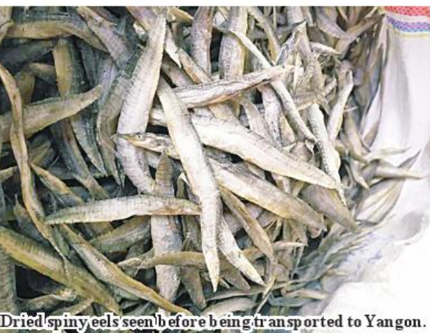
Dried spiny eels seen before being transported to Yangon.