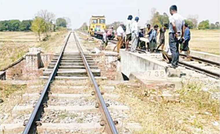
အကြမ်းဖက်သောင်းကျန်းသူများ၏ မိုင်းဖောက်ခွဲမှုကြောင့် ကျောက်ဆည်-မင်းစုဘူတာအကြား တံတားအမှတ်(၇၃၈)၏ အစုန်၊ အဆန်ရထားလမ်းများ ပြန်လည်ပြုပြင် ဆောင်ရွက်နေမှုမှတ်တမ်းဓာတ်ပုံ။

လည်း အကြမ်းဖက်သောင်းကျန်းသူများက နိုင်ငံတော်ပိုင် ရထားစက်ခေါင်း၊ တွဲများ နှင့် ခရီးသည်များ၊ ကုန်စည်များ ထိခိုက် ပျက်စီးစေရေး၊ ပြည်သူများ အသက် အန္တရာယ်ထိခိုက်ပြီး စိတ်မချမ်းမြေ့စေရေး ရထားဖြင့် ခရီးသွားလာမှုမပြုရအောင် ခြိမ်းခြောက်ခြင်းတို့ကို ယုတ်မာပက်စက် သော ရည်ရွယ်ချက်များဖြင့် အကြိမ်ကြိမ် ကျူးလွန်နေကြသောကြောင့် အဆိုပါ အကြမ်းဖက်သောင်းကျန်းသူများ၏ ယုတ်မာ ပက်စက်မှုများအပေါ် ဒေသခံပြည်သူ တစ်ရပ်လုံးက ပြင်းထန်စွာ ဆန့်ကျင် တန်ကြွက်ရှုတ်ချလျက်ရှိကြောင်း သတင်း ရရှိသည်။ (သတင်းစဉ်)