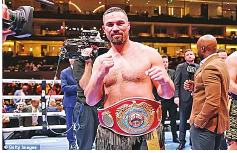
ဂျိုးဆပ်စ် မတ် ၁၀

WBO ယာယီဟဲဗီးဝိတ်တန်းကမ္ဘာ့ချန်ပီယံစိန်ခေါ်ပွဲတွင် အဖြစ် လက်ရှိချန်ပီယံ တရုတ်လက်ဝှေ့သမား ကျီလီကျန်းနှင့် စိန်ခေါ်သူ နယူးဇီလန်လက်ဝှေ့သမား ဂျိုးဆပ်စ်ပါကားတို့ မတ် ၉ ရက်တွင် ဆော်ဒီအာရေဗျနိုင်ငံ ရီယာဒ်မြို့၌ ယှဉ်ပြိုင်ထိုးသတ်ခဲ့ရာ ဂျိုးဆပ်စ်ပါကားက ဒိုင်အမှတ်ဖြင့် အနိုင်ရရှိပြီး ယာယီ ကမ္ဘာ့ဟဲဗီးဝိတ်တန်းချန်ပီယံခံပတ်ကို ဆွတ်ခူးခဲ့ကြောင်း သိရသည်။