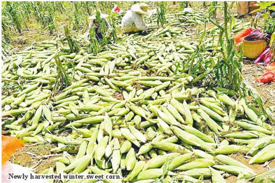
Newly harvested winter sweet corn.

Budalin March 10 A total of 2,593 acres of winter corn planted in Budalin Township, Monywa District, Sagaing Region, have been harvested during the 2023-2024 winter crop planting season, according to the Department of Agriculture for Budalin Township. The corn fields planted in Budalin Township during the 2023-2024 winter crop planting season have been harvested since February