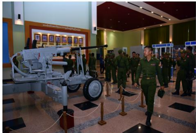
(၇၉)နှစ်မြောက် တပ်မတော်နေ့စစ်ရေးပြအခမ်းအနားတွင် ပါဝင်သည့် စစ်ရေးပြ စစ်ကြောင်းများမှ တပ်မတော်(ကြည်း၊ရေ၊လေ)အရာရှိ၊စစ်သည်များ၊တပ်မတော်(ကြည်း) အမျိုးသမီးစစ်ရေးပြတပ်ခွဲ၊မြန်မာနိုင်ငံရဲတပ်ဖွဲ့ ဝင်များနှင့် မြန်မာနိုင်ငံရဲတပ်ဖွဲ့ အမျိုးသမီး စစ်ရေးပြတပ်ခွဲတို့က တပ်မတော်စစ်သမိုင်းပြတိုက်အတွင်း လေ့လာကြည့်ရှုကြစဉ်။

၂။ ရှေ့ဖုံးမှအဆက် စစ်ရေးပြစစ်ကြောင်းများမှ တပ်မတော် (ကြည်း၊ ရေ၊ လေ) အရာရှိ၊ စစ်သည်များ၊ တပ်မတော်(ကြည်း) အမျိုးသမီးစစ်ရေးပြ တပ်ခွဲ၊ မြန်မာနိုင်ငံရဲတပ်ဖွဲ့ဝင်များနှင့် မြန်မာနိုင်ငံရဲတပ်ဖွဲ့ အမျိုးသမီးစစ်ရေးပြ တပ်ခွဲတို့က နှစ်သုတေသန လာရောက် ဖူးမြော်ကြည်ညိုကြသည်။ အဆိုပါ(၇၉)နှစ်မြောက်တပ်မတော်နေ့ စစ်ရေးပြအခမ်းအနားတွင် ပါဝင်သည့် စစ်ရေးပြစစ်ကြောင်းများမှ ဘုရားဖူးလာ စစ်ရေးပြစစ်ကြောင်းများသည် မာရဝိဇယ ဗုဒ္ဓရုပ်ပွားတော်မြတ်ကြီးအား ဖူးမြော် ကြည်ညိုကြပြီး ဘုရားရင်ပြင်တော်ပတ် လည်၍ စကျင်ကျောက်များအသုံးပြု၍ တည်ဆောက်ထားသည့် ဂန္ဓကုဋ်တိုက်များ အတွင်း လေ့လာကြည့်ရှုကြသည်။ ယင်းနောက် မာရဝိဇယဗုဒ္ဓရုပ်ပွားတော် မြတ်ကြီး ဘက်စုံပြုပြင်မွမ်းမံရန်အတွက် အလှူငွေများ ပေးအပ်လှူဒါန်းကြသည်။ ထို့နောက် ဝိသုကာလက်ရာများဖြင့်