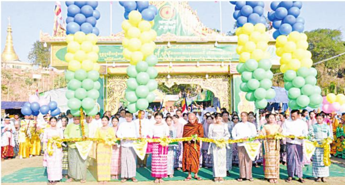
မဟာမက္ခဒူရံသီ ဆံတော်ရှင်မြတ်မော်တင်စေတီတော်မြတ်ကြီး ပုဒ္ဓပူဇော်ပွဲဖွင့်ပွဲအခမ်းအနားကို ရောဂတ်တိုင်းဒေသကြီး ဝန်ကြီးချုပ် ဦးတင်မောင်ဝင်း၊ အနောက်တောင်တိုင်းစစ်ဌာနချုပ် တိုင်းမှူး ဗိုလ်မှူးချုပ်ဝေလင်းနှင့် တာဝန်ရှိသူများက ဖဲကြီးဖြတ်ဖွင့်ပေးခဲ့ခြင်း

ရောဂတ်တိုင်းဒေသကြီး ပုသိမ်ခရိုင် ငပုတောမြို့နယ် ဟိုင်းကြီးကျွန်းမြို့ ဇီးချိုင်ကျေးရွာအုပ်စု မဟာမက္ခဒူရံသီ ဆံတော်ရှင်မြတ်မော်တင်စေတီတော်မြတ်ကြီး ပုဒ္ဓပူဇော်ပွဲဖွင့်ပွဲ၊ ပုဒ္ဓါဘိသေကအနေကဇာတင်မင်္ဂလာနှင့် ကမ္မည်းမော်ကွန်းကျောက်စာတော်ဖွင့်ပွဲ၊ ရင်ပြင်တော်တိုးချဲ့တည်ဆောက်ခြင်းနှင့် ဘက်စုံပြုပြင်မွမ်းမံခြင်း ရေစက်ချမင်္ဂလာကို ယနေ့နံနက်ပိုင်းတွင် အဆိုပါစေတီတော်မြတ်ကြီး၏ တောင်ခြေရှိ မင်္ဂလာမုခ်ဦး၌ ပြုလုပ်ရာ ပုသိမ်မြို့ မရမ်းချိုကျောင်းတိုက် ပဓာနနာယကဆရာတော် တိုင်းဒေသကြီး သံဃနာယကအဖွဲ့၊ ဩဝါဒါစရိယ အဂ္ဂမဟာဂန္ထဝါစကပက္ကတိ အဂ္ဂမဟာသဒ္ဓမ္မဇောတိက ဓဇ ဘဒ္ဒန္တသောဘိတ အမျိုးမျိုးသော သံဃာတော်များ ကြွရောက်တော်မူကြပြီး တိုင်းဒေသကြီးဝန်ကြီးချုပ် ဦးတင်မောင်ဝင်း၊ အနောက်တောင်တိုင်းစစ်ဌာနချုပ် တိုင်းမှူး ဗိုလ်မှူးချုပ်ဝေလင်း၊ တိုင်းဒေသကြီးဝန်ကြီးများ၊ ဌာနဆိုင်ရာတာဝန်ရှိသူများ၊ စေတနာရှင် အလှူရှင်များနှင့် ဖိတ်ကြားထားသူများ တက်ရောက်ကြသည်။ ဦးစွာ မဟာမက္ခဒူရံသီ ဆံတော်ရှင်မြတ်မော်တင်စေတီတော်မြတ်ကြီး ပုဒ္ဓပူဇော်ပွဲဖွင့်ပွဲကို ကျင်းပပြုလုပ်ရာ