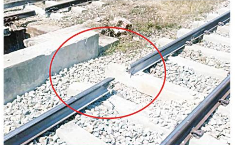
အကြမ်းဖက်သောင်းကျန်းသူများ၏ မိုင်းဖောက်ခွဲမှုကြောင့် ကျောက်ဆည်-မင်းစုဘူတာ အကြား တံတားအမှတ်(၇၃၈)၏ အစုန်ရထားလမ်းပိုင်းပျက်စီးဆုံးရှုံးမှုမှတ်တမ်းဓာတ်ပုံ။