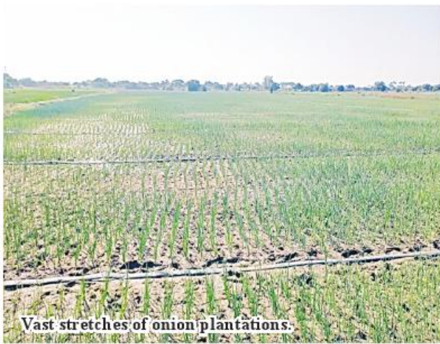
Vast stretches of onion plantations.