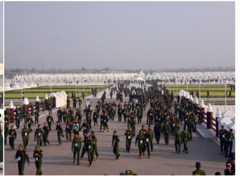
မာရဝိဇယဗုဒ္ဓရုပ်ပွားတော်မြတ်ကြီးအား (၇၉)နှစ်မြောက် တပ်မတော်နေ့စစ်ရေးပြအခမ်းအနားတွင်ပါဝင်သည့် စစ်ရေးပြစစ်ကြောင်းများမှ တပ်မတော်(ကြည်း၊ရေ၊လေ) အရာရှိ၊ စစ်သည်များ၊ တပ်မတော်(ကြည်း) အမျိုးသမီး စစ်ရေးပြတပ်ခွဲ၊ မြန်မာနိုင်ငံရဲတပ်ဖွဲ့ဝင်များနှင့် မြန်မာနိုင်ငံရဲတပ်ဖွဲ့ အမျိုးသမီးစစ်ရေးပြတပ်ခွဲတို့က လာရောက်ဖူးမြော်ကြည်ညိုကြစဉ်။

၂။ ရှေ့ဖုံးမှအဆက် စစ်ရေးပြစစ်ကြောင်းများမှ တပ်မတော် (ကြည်း၊ ရေ၊ လေ) အရာရှိ၊ စစ်သည်များ၊ တပ်မတော်(ကြည်း) အမျိုးသမီးစစ်ရေးပြ တပ်ခွဲ၊ မြန်မာနိုင်ငံရဲတပ်ဖွဲ့ဝင်များနှင့် မြန်မာနိုင်ငံရဲတပ်ဖွဲ့ အမျိုးသမီးစစ်ရေးပြ တပ်ခွဲတို့က နှစ်သုတေသန လာရောက် ဖူးမြော်ကြည်ညိုကြသည်။ အဆိုပါ(၇၉)နှစ်မြောက်တပ်မတော်နေ့ စစ်ရေးပြအခမ်းအနားတွင် ပါဝင်သည့် စစ်ရေးပြစစ်ကြောင်းများမှ ဘုရားဖူးလာ စစ်ရေးပြစစ်ကြောင်းများသည် မာရဝိဇယ ဗုဒ္ဓရုပ်ပွားတော်မြတ်ကြီးအား ဖူးမြော် ကြည်ညိုကြပြီး ဘုရားရင်ပြင်တော်ပတ် လည်၍ စကျင်ကျောက်များအသုံးပြု၍ တည်ဆောက်ထားသည့် ဂန္ဓကုဋ်တိုက်များ အတွင်း လေ့လာကြည့်ရှုကြသည်။ ယင်းနောက် မာရဝိဇယဗုဒ္ဓရုပ်ပွားတော် မြတ်ကြီး ဘက်စုံပြုပြင်မွမ်းမံရန်အတွက် အလှူငွေများ ပေးအပ်လှူဒါန်းကြသည်။ ထို့နောက် ဝိသုကာလက်ရာများဖြင့်