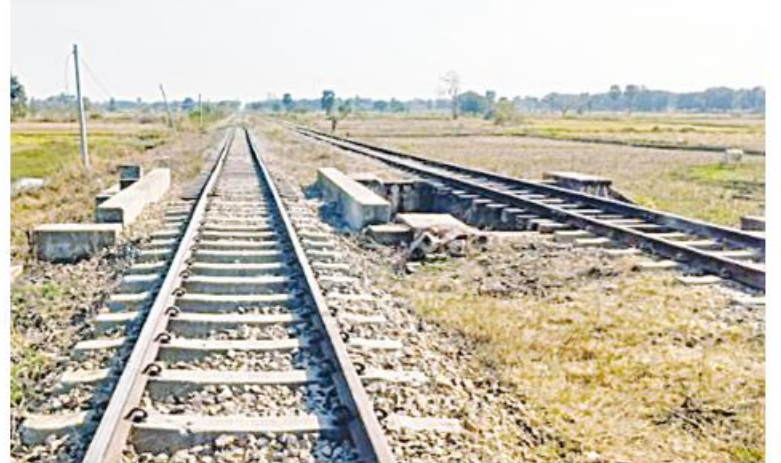
အကြမ်းဖက်သောင်းကျန်းသူများ၏ မိုင်းဖောက်ခွဲမှုကြောင့် ကျောက်ဆည်-မင်းစု ဘူတာအကြား တံတားအမှတ်(၇၃၈)၏ အစုန်၊ အဆန်ရထားလမ်းများ ပြန်လည်ပြုပြင် ဆောင်ရွက်ပြီးစီးမှုမှတ်တမ်းဓာတ်ပုံ။

ရထားဘူတာနယ်မြေအတွင်း ပုံးထောင် မိုင်းခွဲ၊ ဖျက်ဆီးခြင်းအကြိမ် ၁၃၀၊ ရထားလမ်း တံတားများကို မိုင်းခွဲဖျက်ဆီးခြင်း ၄၉ ကြိမ်၊ ဘူတာအဆောက်အအုံနှင့် ဝန်ထမ်းနေအိမ် များကို မီးရှို့ဖျက်ဆီးခြင်း ၁၂ ကြိမ် ကျူးလွန် ခဲ့ကြသည်။ နိုင်ငံတော်အစိုးရအနေဖြင့် အများ ပြည်သူခရီးသွားလာမှုနှင့် ကုန်စည်ပို့ဆောင် မှုအဆင်ပြေချောမွေ့မြန်ဆန်စေရေးအတွက် ရထားလမ်း အခြေခံအဆောက်အအုံများ ပိုမိုကောင်းမွန်လာစေရေး၊ ရထားပို့ဆောင် ရေးစနစ်ကို အဆင့်မြှင့်တင်နေသည့် စီမံကိန်းလုပ်ငန်းများကို ရည်မှန်းချက်ထား ရှိ၍ စီမံဆောင်ရွက်ပေးလျက်ရှိသော်