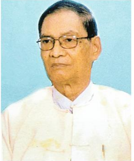
လယ်တွင်းသားစောရမ့်(စည်သူဦးတင်လှိုင်)

ကျောင်းမှာ တက္ကသိုလ်ဝင်တန်း ဒီနှစ်ဖြေတော့မယ့် ဆယ်တန်းကျောင်းသားလေးတစ်ယောက်ဟာ မဂ္ဂဇင်းထဲက နိုင်ငံကျော်စာရေးဆရာရဲ့ “ဘဝစာမေးပွဲ”ဝတ္ထုကို ဖတ်ပြီး စာမေးပွဲမဖြေတော့ပါဘူးတဲ့။