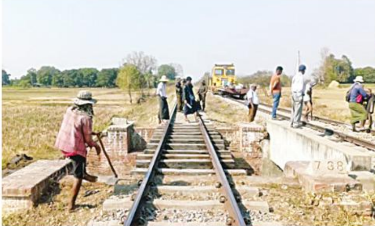
အကြမ်းဖက်သောင်းကျန်းသူများ၏ မိုင်းဖောက်ခွဲမှုကြောင့် ကျောက်ဆည်-မင်းစုဘူတာအကြား တံတားအမှတ်(၇၃၈)၏ အစုန်၊ အဆန်ရထားလမ်းများ ပြန်လည်ပြုပြင် ဆောင်ရွက်နေမှုမှတ်တမ်းဓာတ်ပုံ။