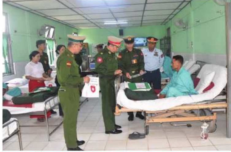
တောင်ပိုင်းတိုင်းစစ်ဌာနချုပ်မှ တာဝန်ရှိသူတစ်ဦးက ဆေးကုသမှုခံယူနေသူ တစ်ဦးကို ရင်းရင်းနှီးနှီးမေးမြန်းအားပေးစကားပြောကြားစဉ်။

နေပြည်တော် မတ် ၈ - ရှမ်းပြည်နယ်(မြောက်ပိုင်း) လားရှိုးမြို့ ရှိ တပ်မတော်ဆေးရုံ၊ ရန်ကုန်တိုင်းဒေသကြီး မင်္ဂလာဒုံမြို့နယ်ရှိ တပ်မတော်ဆေးရုံ၊ ရောဂါအထူးကုဆေးရုံကြီး (ခုတင်-၅၀၀) နှင့် တပ်မတော်ဆေးရုံကြီး (ခုတင်-၁၀၀၀)၊