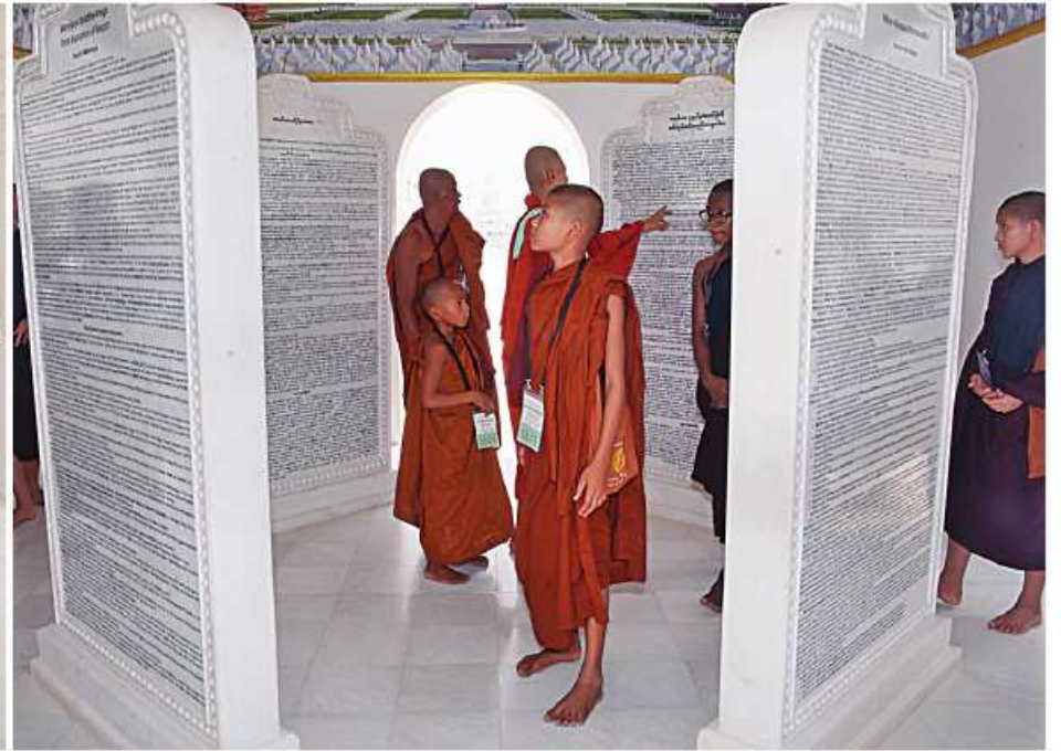
ပဲခူးတိုင်းဒေသကြီး ပဲခူးမြို့နယ်နှင့် သနပ်ပင်မြို့နယ်တို့ရှိ ဆရာတော်၊ သံဃာတော်များ ဂန္ဓကုဋ်တိုက်၊ ကျောက်စာရံစေတီများနှင့် အခြားသာသနိက အဆောက်အအုံများကို လှည့်လည်ကြည့်ရှုစဉ်။

ကျောပုံးမှအဆက် လာရောက်ဖူးမြော် ကြည့်ညိုကြသည်။ ပဲခူးတိုင်းဒေသကြီး ပဲခူးမြို့နယ်နှင့် သနပ်ပင်မြို့နယ်တို့မှ ဘုရားဖူးလာ ဆရာတော်၊ သံဃာတော်များသည် မာရဝိဇယ ဗုဒ္ဓရုပ်ပွားတော်မြတ်ကြီးအား ဖူးမြော်ကြည့်ညိုကြပြီး ဘုရားရင်ပြင် တော်ပတ်လည်၍ စကျင်ကျောက်များ အသုံးပြု၍ တည်ဆောက်ထားသည့် ဂန္ဓကုဋ်တိုက်များအတွင်း လေ့လာကြည့်ရှု ကြသည်။ ယင်းနောက် မာရဝိဇယဗုဒ္ဓရုပ်ပွားတော် မြတ်ကြီး ဘက်စုံပြုပြင်မွမ်းမံရန်အတွက် အလှူငွေများ ပေးအပ်လှူဒါန်းကြသည်။ ထို့နောက် ဝိသုကာလက်ရာများဖြင့် ခမ်းနားထည်ဝါစွာ တည်ထားပူဇော်ထား သည့် အင်္ဂါဓိပတိသာသနာဗိမာန်တော်ကြီး၊ ကျောက်စာရံစေတီများ၊ သုဓမ္မာဇရပ်များ၊ မုစလိန္ဒာတိုင်နှင့် အခြားသာသနိက အဆောက်အအုံများကို ဆက်လက်ဖူးမြော် လေ့လာကြည့်ညိုခဲ့ကြသည်။ ထိုကဲ့သို့ ပဲခူးတိုင်းဒေသကြီး ပဲခူးမြို့နယ် နှင့် သနပ်ပင်မြို့နယ်တို့မှ လာရောက် ဖူးမြော်ကြည့်ညိုကြသည့် ဆရာတော်၊ သံဃာတော်များအား မာရဝိဇယဗုဒ္ဓရုပ်ပွား တော်မြတ်ကြီးဂေါပကအဖွဲ့နှင့် ဗုဒ္ဓရုပ်ပွား တော်မြတ်ကြီး တည်ဆောက်ပူဇော်ခြင်းနှင့် ထိန်းသိမ်းခြင်းလုပ်ငန်းများတွင် ပါဝင် ဆောင်ရွက်ခဲ့ကြသည့် ကျွမ်းကျင်ပညာရှင် များက မာရဝိဇယဗုဒ္ဓရုပ်ပွားတော်မြတ်ကြီး အောင်မြင်စွာ တည်ထားပူဇော်နိုင်ရန် အဆင့်ဆင့်ဆောင်ရွက်ခဲ့ပုံများကို ဝီဒီယို မှတ်တမ်းများဖြင့် ရှင်းလင်းလျှောက်ထား ခဲ့ကြသည်။ ထို့ပြင် မာရဝိဇယဗုဒ္ဓရုပ်ပွားတော်မြတ် ကြီးအား အနယ်နယ်အရပ်ရပ်မှ ရဟန်း ရှင်လူဘုရားဖူးပြည်သူများလည်း လာရောက် ဖူးမြော်ကြည့်ညိုလျက်ရှိကြောင်း သတင်း ရရှိသည်။