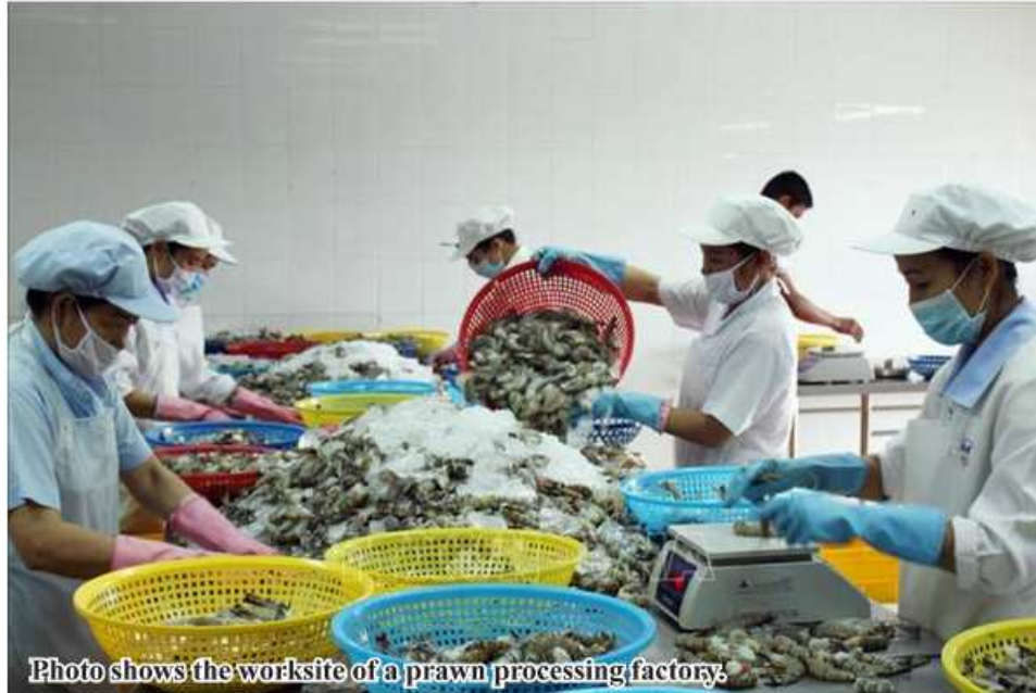
Photo shows the worksite of a prawn processing factory.

Nay Pyi Taw March 8 Myanmar exports more than 300 items of marine products to 45 trade partner countries from April to February in 2023-24 financial