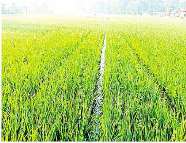
မြောင်းမြ မတ် ၈ ရော့တီတိုင်းဒေသကြီး မြောင်းမြခရိုင် အိမ်မဲမြို့နယ်တွင် နွေသီးနှံစိုက်ပျိုးရာသီ၌ စပါး