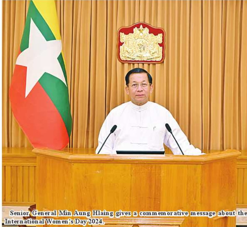
Senior General Min Aung Hlaing gives a commemorative message about the International Women's Day 2024.