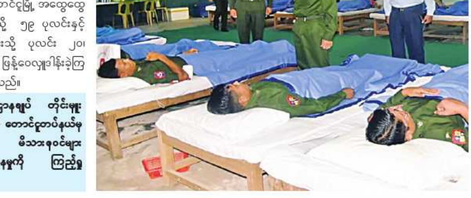
တောင်ပိုင်းတိုင်းစစ်ဌာနချုပ် တိုင်းမှူး ဗိုလ်မှူးချုပ်ကြည်သိုက် တောင်ငူတပ်နယ်မှ အရာရှိ၊ စစ်သည်၊ မိသားစုဝင်များ စုပေါင်းသွေးလှူဒါန်းနေမှုကို ကြည့်ရှု အားပေးစဉ်။

နေပြည်တော် မတ် ၈ ၂၀၂၄ ခုနှစ်မတ် ၂၇ ရက်တွင် ကျောက် မည်(၇၉)နှစ်မြောက် တပ်မတော်နေ့ကို ကြိုဆိုဂုဏ်ပြုသောအားဖြင့် ယနေ့နံနက် ပိုင်းတွင် ပဲခူးတိုင်းဒေသကြီး တောင်ငူမြို့ရှိ နယ်မြေခံ တပ်မတော်ဆေးတပ်ရင်းခန်းမ၌ တောင်ငူတပ်နယ်မှ အရာရှိ၊ စစ်သည်၊ မိသားစုဝင် စုစုပေါင်း ၇၉ ဦးတို့ကစုပေါင်း သွေးလှူဒါန်းကြသည်။ ဦးစွာ တောင်ငူတပ်နယ်မှ အရာရှိ၊ စစ်သည်၊ မိသားစုဝင်များ လှူဒါန်းထား