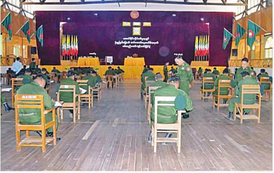
အရှေ့မြောက်တိုင်းစစ်ဌာနချုပ် တိုင်းမှူး ဗိုလ်ချုပ်မှူးတင် (၇၉)နှစ်မြောက် တပ်မတော်နေ့အထိမ်းအမှတ် စစ်သည်တော်ကျင့်ဝတ်ပြိုင်ပွဲတွင် အရာရှိ၊ အရာခံ၊ အကြပ် စစ်သည်များဖြေဆိုနေမှုကို ကြည့်ရှုအားပေးစဉ်။