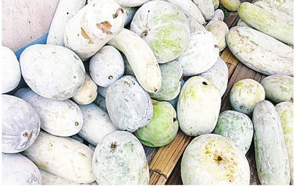
ဆေးဖက်ဝင် ကျောက်ဖရုံသီးများကို တွေ့ရစဉ်။

ပြီးစားသုံးတတ်ကြပါတယ်။ ဟင်းဂလာပင် ပဉ္စငါးပါးကို အရည်ညှစ်ယူပြီး ရေခဲခဲ အကြမ်းပန်းကန်တစ်လုံးစာ မနက်၊ ညတိုက်ပေးရင် ကျောက်ကပ်အဖောရောဂါ၊ ကိုယ်ရောင်ရောဂါတွေ ပျောက်ကင်းစေနိုင်ပါတယ်။ ကျောက်ကပ်အတွက် ကောင်းတဲ့ နောက်ဆေးပင်တစ်မျိုးကတော့ ကန့်ကလာပင်ပါ။ သူကလဲ သဲခုံသောင်ခုံတွေပေါ်မှာ၊ ရေအစိုဓာတ်ရှိတဲ့ ကုန်းမြေတွေပေါ်မှာ ကပ်ပေါက်တဲ့ အပင်မျိုးပါ။ ကန့်ကလာရွက်ကို အရည်ညှစ်ယူပြီး သောက်လို့ရပါတယ်။ အပင်တစ်ပင်လုံးနုတ်ယူပြီး ရေခဲခဲ သုံးခွက် တစ်ခွက်တင် ကျိုသောက်ရင်လဲရပါတယ်။ ကျောက်ကပ်အဖောရောဂါ အတွက် အဖောအရောင်ကျစေတဲ့အပင်