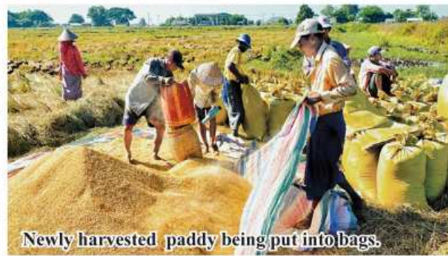
Newly harvested paddy being put into bags.

traders, cargo workers, and truck rental entrepreneurs is convenience. KKL