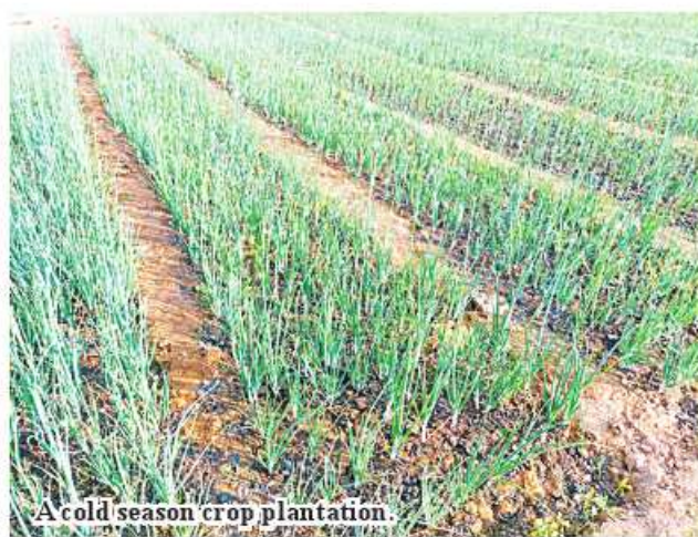
A cold season crop plantation.

Agricultural staff raise farmer awareness of preparing damming facilities, correct agricultural techniques, high per acre yield, high quality of crops and use of pesticides. Kyaw Kyaw Lin