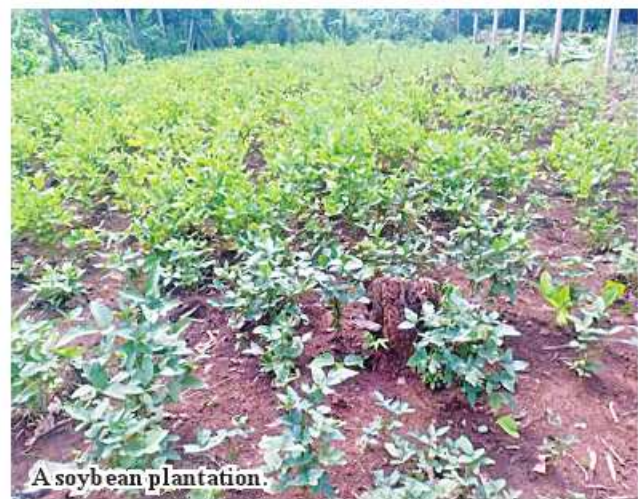
A soybean plantation.

awareness activities to be able to obtain a good variety suitable for the region, to have correct planting method, to control pest, to use fertilizers properly and to improve yield. 206