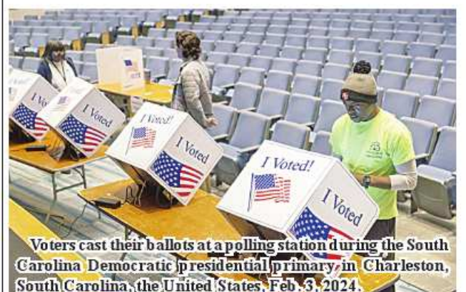
Voters cast their ballots at a polling station during the South Carolina Democratic presidential primary in Charleston, South Carolina, the United States, Feb. 3, 2024.

It is said that the Department of Agriculture for the district is carrying out awareness activities to be able to obtain a good variety suitable for the region, to have correct planting method, to control pest, to use fertilizers properly and to improve yield. 206