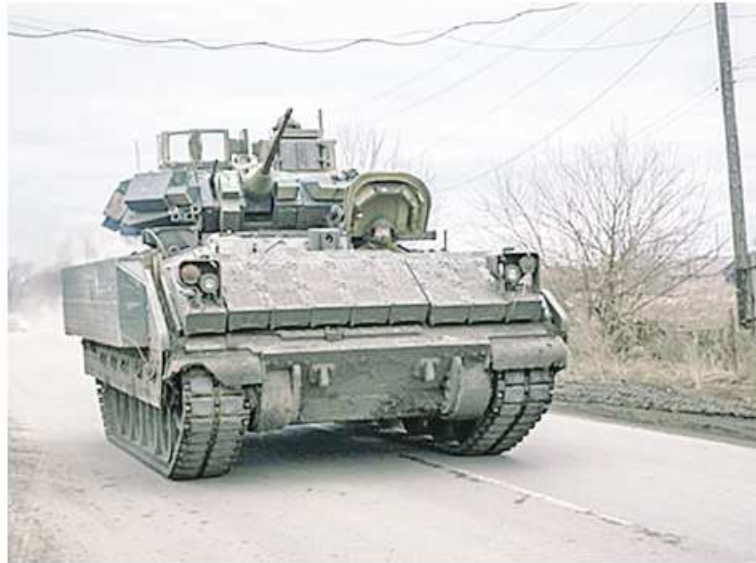
ယူကရိန်းနိုင်ငံသည် အမေရိကန်နိုင်ငံက ပံ့ပိုးပေးအပ်ထားသည့် တင့်ကားများ၊ သံချပ်ကာယာဉ်များနှင့် လေကြောင်းရန်ကာကွယ်ရေးစနစ်များကို ကြုံခိုင်းထိန်းသိမ်း

ရန်၊ လည်ပတ်လုပ်ဆောင်ရန် သို့မဟုတ် ပြုပြင်မွမ်းမံရန် အစီအစဉ်မရှိသကဲ့သို့ လုပ်နိုင်စွမ်းလည်းမရှိကြောင်း ပင်တဂွန် စစ်ဌာနချုပ်မှ စစ်ဆေးရေးမှူး Robert P. Storch က ဝန်ခံထုတ်ဖော်ပြောကြားခဲ့သည်ဟု ရုရှားနိုင်ငံ RT သတင်းဌာနက ဖေဖော်ဝါရီ ၂၁ ရက်တွင် ရေးသားဖော်ပြခဲ့သည်။ ထိုအချက်သည် အမေရိကန်ကပေးသော စစ်လက်နက်စက်စက်ပစ္စည်း ကိရိယာများကို အသုံးပြု၍ ယူကရိန်း၏ ထိရောက်စွာ တိုက်ခိုက်နိုင်စွမ်းကိုပါ ထိခိုက်စေသည် အပြင် လိုအပ်ပါက အခြားသောအမျိုးသား လုံခြုံရေးဆိုင်ရာ ခြိမ်းခြောက်မှုများကို တိုင်တွယ်ဖြေရှင်းရန် အမေရိကန်နိုင်ငံ ကာကွယ်ရေးဝန်ကြီးဌာန၏ တိုက်ပွဲဝင် အသင့်ဖြစ်မှုကိုလည်း အန္တရာယ်ဖြစ်စေ