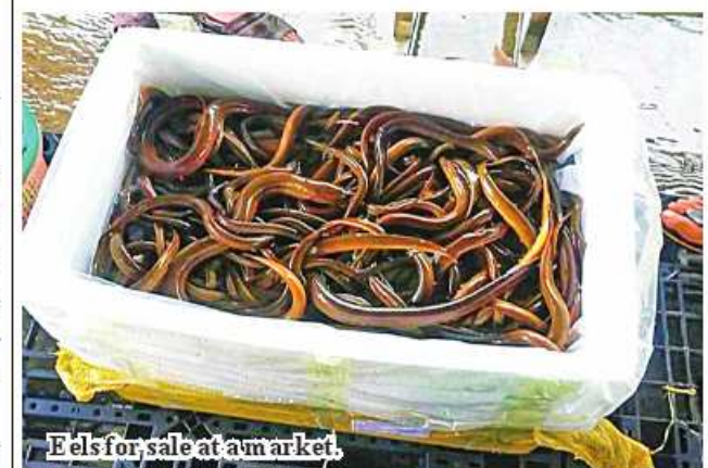
Eels for sale at a market.