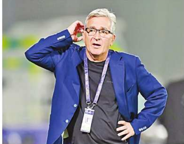
Ref : Sputnik Trs : ML

ပေကျင်း၊ ဖေဖော်ဝါရီ ၂၅ - တရုတ်အသင်းသည် ယခုနှစ် အာရှဖလားပြိုင်ပွဲတွင် အုပ်စု အဆင့်မှ စောစီးစွာထွက်ခွာခဲ့ပြီး နောက် နည်းပြဂုဏ်ကိုပစ်ကို ရာထူးမှထုတ်ပယ်ခဲ့ပြီး ယခုအခါ ခရိုအေးရှားနည်းပြ အိပန်ကိုပစ်ကို နည်းပြသစ်အဖြစ်ခန့်အပ်ခဲ့သည်။ တရုတ်နိုင်ငံဘောလုံးအဖွဲ့ချုပ် သည် ပြီးခဲ့သည့်နှစ်က နည်းပြ ဂုဏ်ကိုပစ်ကို စတင်ခန့်အပ်ခဲ့သော် လည်း ၎င်းအနေဖြင့် ယခုနှစ် အာရှ ဖလားပြိုင်ပွဲတွင် နှစ်ပွဲသာရောက်ခဲ့ပြီး ရလဒ်သာရရှိခဲ့သဖြင့် အုပ်စု အဆင့်မှ စောစီးစွာထွက်ခွာခဲ့ပြီး နောက် နည်းပြဂုဏ်ကိုပစ်ကိုနှင့်လမ်းခွဲ ခွဲပြီး ယခုအခါ ခရိုအေးရှားနည်းပြ အိပန်ကိုပစ်ကို စတင်ခန့်အပ်ခဲ့ ကြောင်း သိရသည်။ အသက် ၆၉ နှစ်ရှိ အိပန်ကိုပစ် သည် ပြီးခဲ့သည့် ၂၀၁၀ ပြည့်နှစ်က တရုတ်လက်ရွေးစင်အသင်းကို လူနန် အသင်းနှင့်အတူ အမှတ်ပေး ဆုဖလားရရှိအောင်စွမ်းဆောင်နိုင်