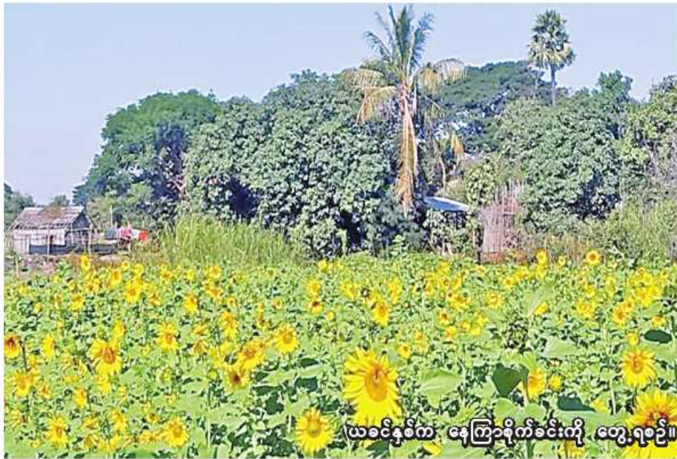
ယခင်နှစ်က နေကြာစိုက်ခင်းကို တွေ့ရစဉ်။

ချောင်းဦး ဖေဖော်ဝါရီ ၂၅ စစ်ကိုင်းတိုင်းဒေသကြီး မုံရွာခရိုင် ချောင်းဦးမြို့နယ်တွင် ဆောင်းသီးနှံစိုက်ပျိုးရာသီ၌ ဆီထွက်သီးနှံ ၂၄၀၀၀ ကေထိ စိုက်ပျိုးပြီးစီးပြီဖြစ်ကြောင်း ချောင်းဦးမြို့နယ် စိုက်ပျိုးရေးဦးစီးဌာန မြို့နယ်ဦးစီးမှူး