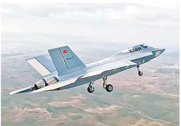
အလွန် အသုံးပြုနိုင်စေရန် ဒီဇိုင်းထုတ်ထားပြီး ပူးတွဲစစ်ဆင်ရေးစွမ်းဆောင်ရည်များအတွက် ထည့်သွင်းစဉ်းစားထုတ်လုပ်ထားခြင်းဖြစ်သည်။ KAAN Turkish Stealth Fighter Prototype Makes Successful First Flight ကို ဘာသာပြန်ဆိုထားပါသည်။

နိုင်ငံတကာကုမ္ပဏီများနှင့် လေယာဉ်ဒီဇိုင်း၊ အင်ဂျင်ပိုင်းဆိုင်ရာ ပူးပေါင်းဆောင်ရွက်မှုများမှ အကျိုးကျေးဇူးများလည်းရရှိနိုင်လိမ့်မည်ဖြစ်သည်။ Supercruise အမြန်နှုန်းရရှိစေမည့် EJ200 အင်ဂျင်အား ရွေးချယ်မှုသည် KAAN ကိုအဆင့်မြင့်စနစ်များတပ်ဆင်အသုံးပြုရန် ရည်မှန်းချက်ထားရှိမှုကို ထင်ဟပ်စေလျက်ရှိပြီး အထူးသဖြင့် Afterburner လောင်ကျွမ်းခြင်းမျိုး မလိုအပ်ဘဲ အသံထက်အမြန်နှုန်း(Supersonic) ဖြင့် ပျံသန်းစစ်ဆင်နိုင်စေမည်ဖြစ်သည်။ KAAN တိုက်လေယာဉ်သည် အမြင့်ဆုံးအမြန်နှုန်း Mach 1.8 နှင့် အမြင့်ပေ ၅၅၀၀၀ ထိ ပျံသန်းနိုင်ရန် ဒီဇိုင်းထုတ်ထားသည်။ အဆိုပါတိုက်လေယာဉ်သည် F-35A အပါအဝင် တူကီယိုလေတပ်၏ လေကြောင်းစွမ်းအားစုများနှင့် အမြန်