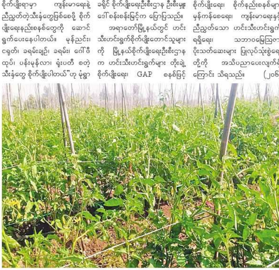
အရာတော်မြို့နယ်တွင် ဆောင်းသီးနှံစိုက်ပျိုးရာသီ၌ ဟင်းသီးဟင်းရွက်ကေ ၁၃၄၀ စိုက်ပျိုးပြီးစီး