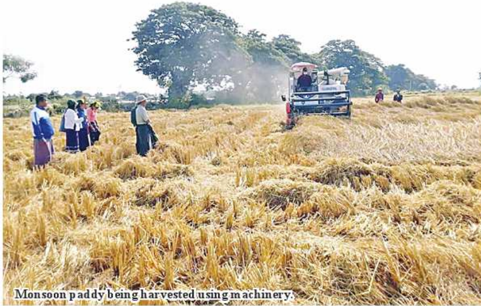
Monsoon paddy being harvested using machinery.

Myothit February 25 Statistics of Tamu District Agriculture Department stated that a total of 12,861 acres of monsoon paddy has