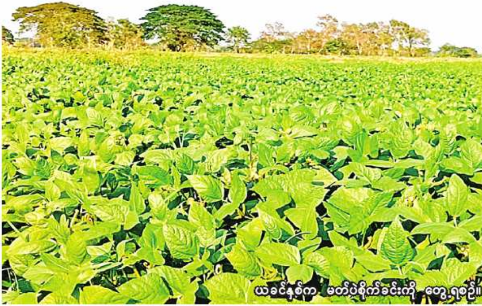
ယခင်နှစ်က မတ်ပဲစိုက်ခင်းကို တွေ့ရစဉ်။