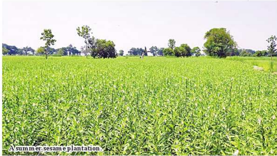
A summer sesame plantation.