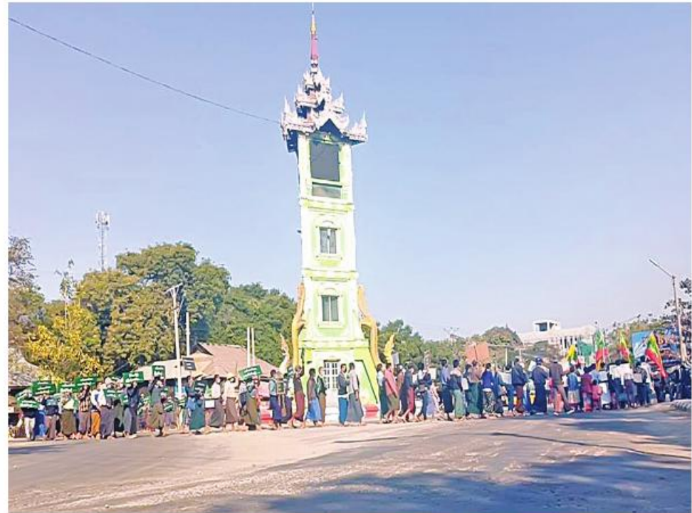
ရောဂါတိုင်းဒေသကြီး ပုသိမ်မြို့၌ ပြည်သူ့စစ်မှုထမ်းဥပဒေကို ကြိုဆိုထောက်ခံပွဲ ပြုလုပ်စဉ်။