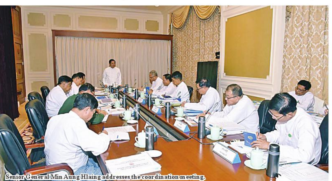
Senior General Min Aung Hlaing addresses the coordination meeting.

Agriculture needs quality seeds, proper land preparation, water supply, and correct methods. The current sown