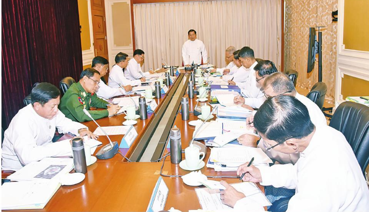
နိုင်ငံတော်စီမံအုပ်ချုပ်ရေးကောင်စီဥက္ကဋ္ဌ နိုင်ငံတော်ဝန်ကြီးချုပ် ဗိုလ်ချုပ်မှူးကြီးမင်းအောင်လှိုင် ဝါသီးနံ၊ ဆီထွက်သီးနံ၊ ကော်ဖီနှင့် အသား၊ နို့ထွက်ပစ္စည်းကဏ္ဍဖွံ့ဖြိုးရေးညှိနှိုင်းဆွေးနွေးပွဲတွင် အမှာစကားပြောကြားစဉ်။

နေပြည်တော် ဖေဖော်ဝါရီ ၁၆ ဝါသီးနံ၊ ဆီထွက်သီးနံ၊ ကော်ဖီနှင့် အသား၊ နို့ထွက်ပစ္စည်းကဏ္ဍဖွံ့ဖြိုးရေးညှိနှိုင်းဆွေးနွေးပွဲကို ယနေ့ နံနက် ၁၀ နာရီတွင် နေပြည်တော်ရှိ နိုင်ငံတော် စီမံအုပ်ချုပ်ရေးကောင်စီ ဥက္ကဋ္ဌရုံးအစည်းအဝေးခန်းမ၌ ကျင်းပပြုလုပ်ရာ နိုင်ငံတော်စီမံအုပ်ချုပ်ရေးကောင်စီဥက္ကဋ္ဌ နိုင်ငံတော်ဝန်ကြီးချုပ် ဗိုလ်ချုပ်မှူးကြီးမင်းအောင်လှိုင် တက်ရောက်ဆွေးနွေးသည်။ ညှိနှိုင်းဆွေးနွေးပွဲသို့ နိုင်ငံတော်စီမံအုပ်ချုပ်ရေးကောင်စီအဖွဲ့ဝင် ဒုတိယဗိုလ်ချုပ်ကြီးညိုစော၊ နိုင်ငံတော်စီမံအုပ်ချုပ်ရေးကောင်စီဥက္ကဋ္ဌရုံး ဝန်ကြီးဌာန(၂) ပြည်ထောင်စုဝန်ကြီး ဦးအောင်နိုင်ဦး၊ စိုက်ပျိုးရေး၊ မွေးမြူရေးနှင့် ဆည်မြောင်းဝန်ကြီးဌာန ပြည်ထောင်စုဝန်ကြီး ဦးမင်းနောင်၊ သမဝါယမနှင့် ကျေးလက်ဖွံ့ဖြိုးရေးဝန်ကြီးဌာန ပြည်ထောင်စုဝန်ကြီး ဦးလှမိုး၊ စက်မှုဝန်ကြီးဌာန ပြည်ထောင်စုဝန်ကြီး ဒေါက်တာချာလီသန်း၊ စာမျက်နှာ ၁၆ ကော်လံ ၁၂