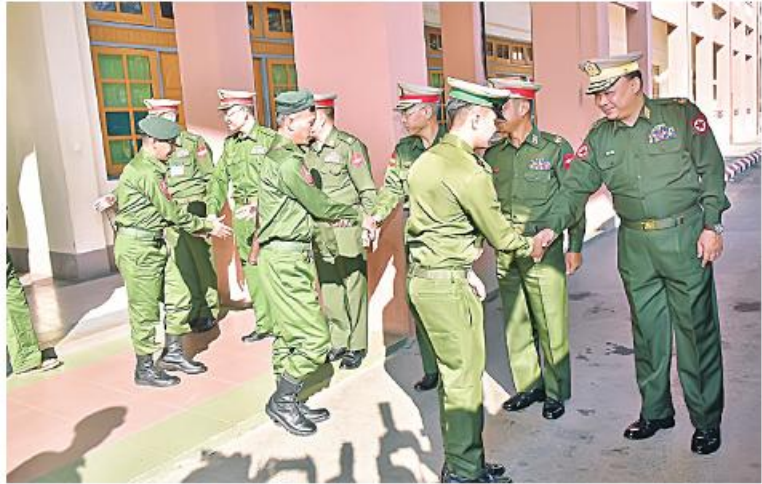
ရန်ကုန်တိုင်းစစ်ဌာနချုပ် တိုင်းမှူး ဗိုလ်ချုပ်မှူးချုပ် ဝေလင်း၊ တပ်မတော်သား အရာရှိ၊ စစ်သည်များကို ရင်းရင်းနှီးနှီး ပို့ဆောင်ပေးခဲ့ခြင်း။

နေပြည်တော် ဖေဖော်ဝါရီ ၁၆ ရာ ရန်ကုန်တိုင်းစစ်ဌာနချုပ် တိုင်းမှူး တွင် ရောဂါတိုင်းဒေသကြီး ချောင်းသာ နိုင်ငံတော်ကာကွယ်ရေး တာဝန်ထမ်းဆောင်စဉ် ထိခိုက်ဒဏ်ရာရရှိရာမှ ဆေးရုံဆေးခန်းများတွင် တက်ရောက်ကုသ၍ ပြန်လည်ကောင်းမွန်လာသည့် တပ်မတော်သား အရာရှိ၊ စစ်သည်များကို အနားယူအပန်းဖြေခရီးစဉ်အဖြစ် ရောဂါတိုင်းဒေသကြီး ချောင်းသာကမ်းခြေသို့ ရန်ကုန်တိုင်းဒေသကြီးမှတစ်ဆင့် မော်တော်ယာဉ်များဖြင့် ယနေ့နံနက်ပိုင်းတွင် ပို့ဆောင်ပေး ရာ ရန်ကုန်တိုင်းစစ်ဌာနချုပ် တိုင်းမှူး တွင် ရောဂါတိုင်းဒေသကြီး ချောင်းသာကမ်းခြေသို့ ရောက်ရှိကြရာ အနောက်တောင်တိုင်းစစ်ဌာနချုပ် တိုင်းမှူး ဗိုလ်မှူးချုပ် ဝေလင်းနှင့် တာဝန်ရှိသူများက ရင်းနှီးနှေးထွေးစွာ ကြိုဆိုခဲ့ကြသည်။ ထို့နောက် တိုင်းမှူးက ချောင်းသာအပန်းဖြေ ဧည့်ရိပ်သာ၌ အမှာစကားပြောကြားပြီး ဒေသထွက်စားသောက်ဖွယ်ရာများဖြင့် တည်ခင်းဧည့်ခံ၍ လက်ဆောင်ပစ္စည်းများ ပေးအပ်ခဲ့ကြောင်း သတင်းရရှိသည်။ ဗိုလ်ချုပ်မှူးကြီးမင်းအောင်လှိုင်က လက်မှတ်ရေးထိုးထုတ်ပြန်ခဲ့ပြီး ဖြစ်သည်။ အဆိုပါ ပြည်သူ့စစ်မှုထမ်းဥပဒေအား ကျင့်သုံးမှုများကို ယနေ့တွင် ရောဂါတိုင်းဒေသကြီး ပုသိမ်မြို့ ကမ်းနားလမ်း ရှုခင်းသာရင်ပြင်၌ လည်းကောင်း၊ မန္တလေးတိုင်းဒေသကြီး တောင်သာမြို့ မြို့နယ်အားကစားကွင်း၌ လည်းကောင်း အသီးသီးပြုလုပ်ကြသည်။