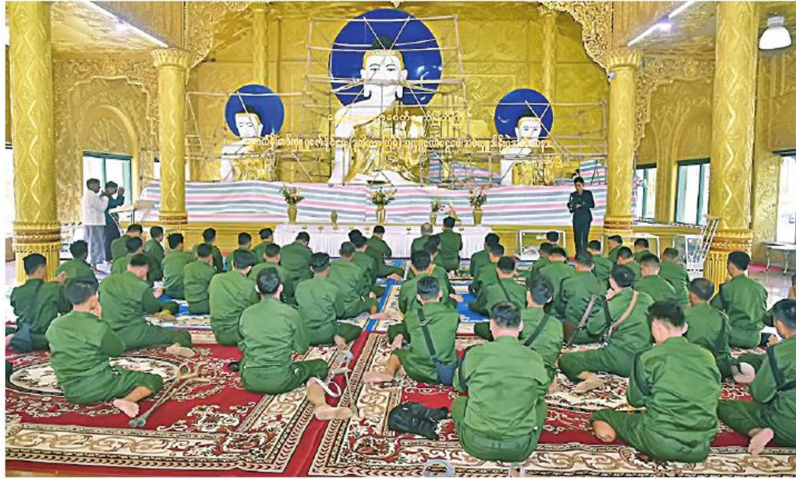
ပုသိမ်မြို့ ရွှေမုဋ္ဌာမြတ်စွာဘုရားအား တပ်မတော်သား အရာရှိ၊ စစ်သည်များ ဖူးမြော်ကြည်ညိုစဉ်။

နေပြည်တော် ဖေဖော်ဝါရီ ၁၆ ရာ ရန်ကုန်တိုင်းစစ်ဌာနချုပ် တိုင်းမှူး တွင် ရောဂါတိုင်းဒေသကြီး ချောင်းသာ နိုင်ငံတော်ကာကွယ်ရေး တာဝန်ထမ်းဆောင်စဉ် ထိခိုက်ဒဏ်ရာရရှိရာမှ ဆေးရုံဆေးခန်းများတွင် တက်ရောက်ကုသ၍ ပြန်လည်ကောင်းမွန်လာသည့် တပ်မတော်သား အရာရှိ၊ စစ်သည်များကို အနားယူအပန်းဖြေခရီးစဉ်အဖြစ် ရောဂါတိုင်းဒေသကြီး ချောင်းသာကမ်းခြေသို့ ရန်ကုန်တိုင်းဒေသကြီးမှတစ်ဆင့် မော်တော်ယာဉ်များဖြင့် ယနေ့နံနက်ပိုင်းတွင် ပို့ဆောင်ပေး ရာ ရန်ကုန်တိုင်းစစ်ဌာနချုပ် တိုင်းမှူး တွင် ရောဂါတိုင်းဒေသကြီး ချောင်းသာကမ်းခြေသို့ ရောက်ရှိကြရာ အနောက်တောင်တိုင်းစစ်ဌာနချုပ် တိုင်းမှူး ဗိုလ်မှူးချုပ် ဝေလင်းနှင့် တာဝန်ရှိသူများက ရင်းနှီးနှေးထွေးစွာ ကြိုဆိုခဲ့ကြသည်။ ထို့နောက် တိုင်းမှူးက ချောင်းသာအပန်းဖြေ ဧည့်ရိပ်သာ၌ အမှာစကားပြောကြားပြီး ဒေသထွက်စားသောက်ဖွယ်ရာများဖြင့် တည်ခင်းဧည့်ခံ၍ လက်ဆောင်ပစ္စည်းများ ပေးအပ်ခဲ့ကြောင်း သတင်းရရှိသည်။ ဗိုလ်ချုပ်မှူးကြီးမင်းအောင်လှိုင်က လက်မှတ်ရေးထိုးထုတ်ပြန်ခဲ့ပြီး ဖြစ်သည်။ အဆိုပါ ပြည်သူ့စစ်မှုထမ်းဥပဒေအား ကျင့်သုံးမှုများကို ယနေ့တွင် ရောဂါတိုင်းဒေသကြီး ပုသိမ်မြို့ ကမ်းနားလမ်း ရှုခင်းသာရင်ပြင်၌ လည်းကောင်း၊ မန္တလေးတိုင်းဒေသကြီး တောင်သာမြို့ မြို့နယ်အားကစားကွင်း၌ လည်းကောင်း အသီးသီးပြုလုပ်ကြသည်။