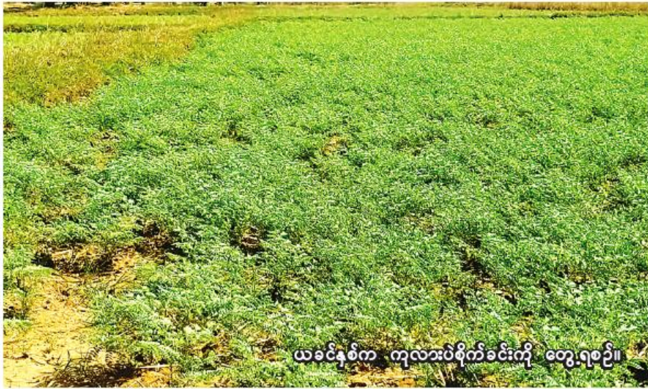
ယခင်နှစ်က ကုလားပဲစိုက်ခင်းကို တွေ့ရစဉ်။

ကောလင်း ဖေဖော်ဝါရီ ၁၆ ၂၀၂၃ခုနှစ် အောက်တိုဘာလမှ စစ်ကိုင်းတိုင်းဒေသကြီး ကောလင်းခရိုင်တွင် ဆောင်းသီးနှံစိုက်ပျိုးရာသီ၌ ကုလားပဲ ၆၉၂၇ ဧက စိုက်ပျိုးပြီးစီးပြီဖြစ်ကြောင်း ကောလင်းခရိုင် စိုက်ပျိုးရေးဦးစီးဌာနမှ သိရသည်။