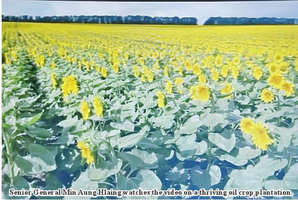
Senior General Min Aung Hlaing watches the video on a thriving oil crop plantation.