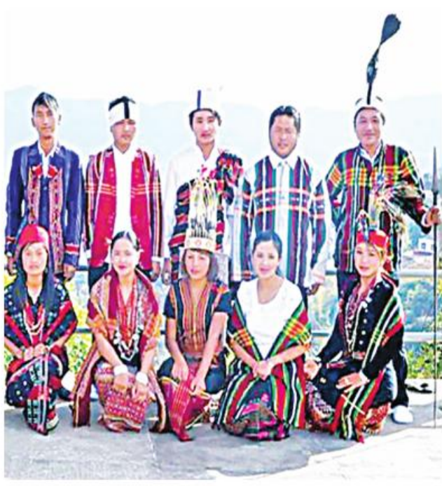
ဟားခါး ဖေဖော်ဝါရီ ၁၆

မိုင်းဆတ်မြို့နယ် နားကောကျေးရွာ၌ နဝမအကြိမ် မြစ်မီးရောင်ကျေးရွာစီမံကိန်းရန်ပုံငွေ ထုတ်ချေး