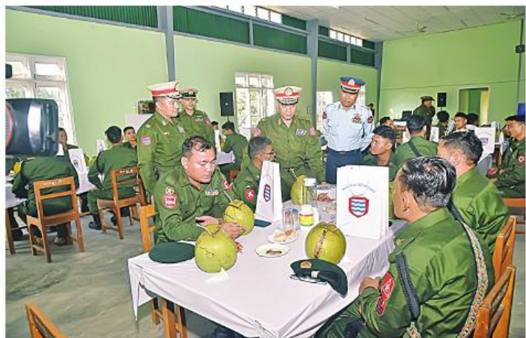
အနောက်တောင်တိုင်းစစ်ဌာနချုပ် တိုင်းမှူး ဗိုလ်မှူးချုပ်ဝေလင်း၊ တပ်မတော်သား အရာရှိ၊ စစ်သည်များကို ဒေသထွက်စားသောက်ဖွယ်ရာများဖြင့် တည်ခင်းဧည့်ခံစဉ်။