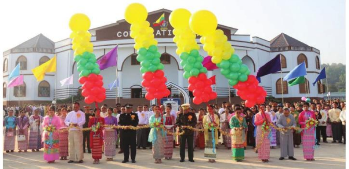
ကြိုဒေသတိုင်းစစ်ဌာနချုပ် တိုင်းမှူး ဗိုလ်ချုပ်အောင်ခိုင်ဝင်းနှင့် တာဝန်ရှိသူများက ဘွဲ့နှင့်သဘင်ခန်းမအဆောက်အအုံသစ် ကို ဖဲကြိုးဖြတ်ဖွင့်လှစ်ပေးစဉ်။

နေပြည်တော် ဖေဖော်ဝါရီ ၁၆ ရှမ်းပြည်နယ်(အရှေ့ပိုင်း) ကျိုင်းတုံမြို့ ရှိ ကျိုင်းတုံတက္ကသိုလ် ဘွဲ့နှင့်သဘင်ခန်းမ အဆောက်အအုံသစ်ဖွင့်ပွဲကို ယနေ့နံနက် ပိုင်းတွင် အဆိုပါတက္ကသိုလ်ရှိ ဘွဲ့နှင့်သဘင် ခန်းမ အဆောက်အအုံ၌ပြုလုပ်ရာ ကြို ဒေသတိုင်းစစ်ဌာနချုပ် တိုင်းမှူး ဗိုလ်ချုပ် အောင်ခိုင်ဝင်းနှင့် အဖွဲ့ဝင်များ၊ ကျိုင်းတုံ တက္ကသိုလ်ပါမောက္ခချုပ်၊ ဌာနဆိုင်ရာ တာဝန်ရှိသူများ၊ ဆရာ၊ ဆရာမများ၊ ကျောင်းသား၊ ကျောင်းသူများနှင့် ဖိတ်ကြား ထားသူများ တက်ရောက်ကြသည်။ ဦးစွာ တိုင်းမှူးနှင့် တာဝန်ရှိသူများက ဘွဲ့နှင့်သဘင်ခန်းမ အဆောက်အအုံသစ် ကို ဖဲကြိုးဖြတ်ဖွင့်လှစ်ပေးပြီး ကမ္ဘာ့ အမွေအနှစ်သမိုင်းများ ပတ်ပျန်းပေးကြကာ ဘွဲ့နှင့်သဘင်ခန်းမ အဆောက်အအုံသစ်၌ ခင်းကျင်းပြသထား သည့် ပြခန်းများကို လှည့်လည်ကြည့်ရှုကြ သည်။ ထို့နောက် တိုင်းမှူးက အဖွင့်အမှာ စကားပြောကြားပြီး ကျိုင်းတုံတက္ကသိုလ် ပါမောက္ခချုပ်က ကျေးဇူးတင်စကား ပြောကြားကာ ဆရာ၊ ဆရာမများနှင့် ကျောင်းသား၊ ကျောင်းသူများက အဆို၊ အကများဖြင့် ဖျော်ဖြေတင်ဆက်ကြသည်။ ယင်းနောက် တိုင်းမှူးက အလှူငွေများ ပေးအပ်လှူဒါန်းရာ ကျိုင်းတုံတက္ကသိုလ် ပါမောက္ခချုပ်က လက်ခံရယူပြီး ဂုဏ်ပြု မှတ်တမ်းလွှာ ပြန်လည်ပေးအပ်သည်။ ထို့နောက် ဘွဲ့နှင့်သဘင်ခန်းမ အဆောက်အအုံသစ် ဖွင့်ပွဲဖြစ်မြောက်ရေး အတွက် အလှူငွေများလှူဒါန်းထားသည့် အလှူရှင်များကို တိုင်းမှူးနှင့် တာဝန်ရှိသူ များက ဂုဏ်ပြုမှတ်တမ်းလွှာများ အသီးသီးပေးအပ်ခဲ့ကြကြောင်း သတင်း ရရှိသည်။