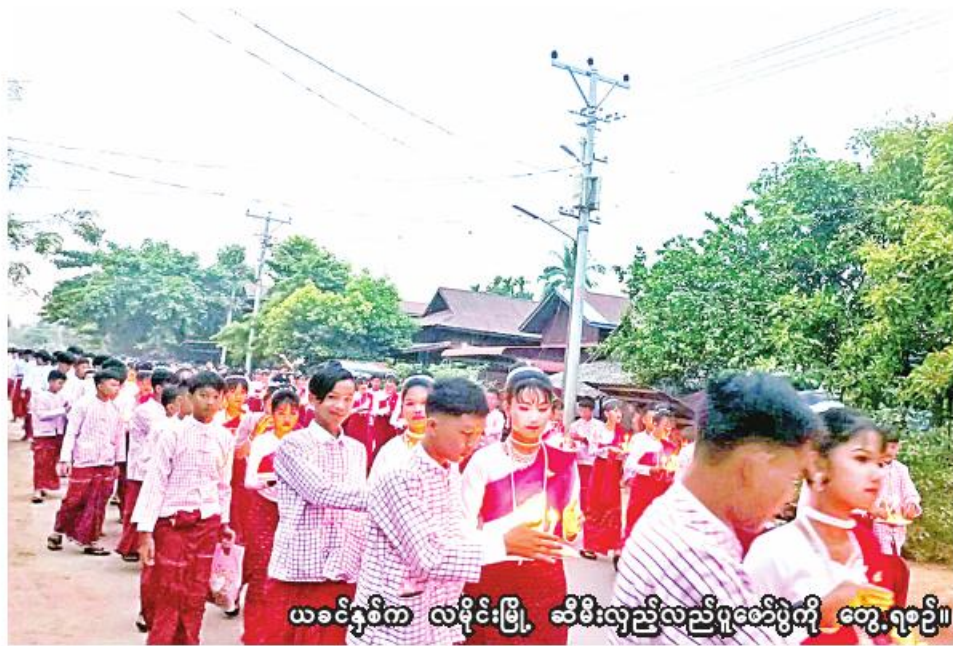
ယခင်နှစ်က လမိုင်းမြို့ ဆီမီးလှည့်လည်ပူဇော်ပွဲကို တွေ့ရစဉ်။

မော်လမြိုင် ဖေဖော်ဝါရီ ၁၆ မွန်ပြည်နယ် မော်လမြိုင်ခရိုင် လမိုင်းမြို့တွင် မွန်တိုင်းရင်းသား ရိုးရာပွဲတော်ဖြစ်သည့် တပို့တွဲလပြည့်ည ဆီမီးလှည့်လည်ပူဇော်ပွဲ ကို တပို့တွဲလပြည့်နေ့ (ဖေဖော်ဝါရီ ၂၄ ရက်)တွင် မွန်တိုင်းရင်းသား၏ ရိုးရာအစဉ်အလာအတိုင်း စည်ကားသိုက်မြိုက်စွာ ကျင်းပသွားမည် ဖြစ်ကြောင်း လမိုင်းမြို့ ဆီမီး