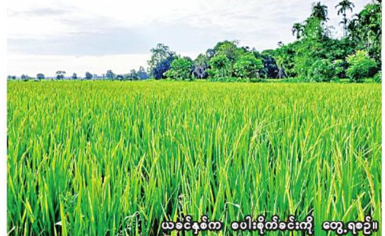
ယခင်နှစ်က စပါးစိုက်ခင်းကို တွေ့ရစဉ်။

ရွှေဘိုခရိုင်တွင် ယခုနှစ် နွေသီးနှံစိုက်ပျိုးရာသီ၌ စပါးစိုက်ပျိုးရန်အတွက် မြို့နယ်အလိုက် လျာထားမှုအနေဖြင့် ရွှေဘိုမြို့နယ်တွင် ၃၂၁၃၇ ဧက၊ ခင်ဦးမြို့နယ်တွင် ၂၃၅၀၀၊ ဝက်လက်မြို့နယ်တွင် ၂၈၀၀၀ နှင့် ကျောက်မြောင်းမြို့နယ်၌တွင် ၆၃ ဧက စုစုပေါင်းဧက ၈၃၇၀၀ ဖြစ်ကြောင်း သိရသည်။