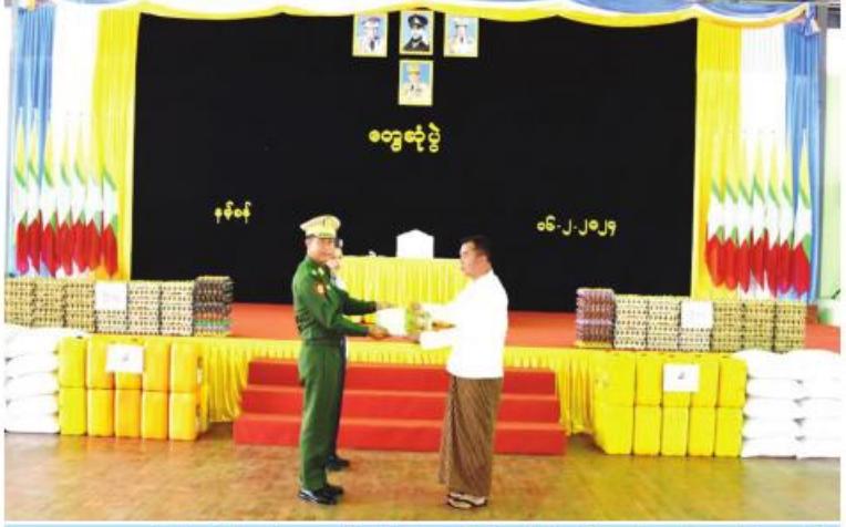
အရှေ့အလယ်ပိုင်းတိုင်းစစ်ဌာနချုပ် တိုင်းမှူး ဗိုလ်ချုပ်မျိုးမင်းထွန်း၊ စစ်မှုထမ်းဟောင်း အဖွဲ့ဝင်များနှင့် မိသားစုဝင်များအတွက် ဆန်၊ ဆီ၊ ဆား၊ ပဲနှင့် အာဟာရဖြည့်စားသောက် ဖွယ်ရာပစ္စည်းများ ပေးအပ်စဉ်။

နေပြည်တော် ဖေဖော်ဝါရီ ၁၆ ရှမ်းပြည်နယ်(တောင်ပိုင်း) နမ့်စန် မြို့နယ်ရှိ စစ်မှုထမ်းဟောင်းအဖွဲ့ဝင် များနှင့် မိသားစုဝင်များ၊ ပြည်သူ့စစ် (ဌာနေ)တပ်ဖွဲ့ဝင်များကို ယနေ့နံနက်ပိုင်း တွင် အရှေ့အလယ်ပိုင်းတိုင်းစစ်ဌာနချုပ် တိုင်းမှူး ဗိုလ်ချုပ်မျိုးမင်းထွန်းနှင့် တာဝန်ရှိသူများက နယ်မြေခံတပ်နယ်ခန်းမ ၌ သွားရောက်တွေ့ဆုံသည်။ ဦးစွာ တိုင်းမှူးက အဖွင့်အမှာစကား ပြောကြားပြီး စစ်မှုထမ်းဟောင်းအဖွဲ့ဝင် များနှင့် မိသားစုဝင်များ၊ ပြည်သူ့စစ်(ဌာနေ) တပ်ဖွဲ့ဝင်များ၏ တင်ပြချက်များအပေါ် လိုအပ်သည်များ ညှိနှိုင်းဆောင်ရွက် ပေးသည်။ ထို့နောက် တိုင်းမှူးနှင့် တာဝန်ရှိသူ များက စစ်မှုထမ်းဟောင်းအဖွဲ့ဝင်များ နှင့် မိသားစုဝင်များ၊ ပြည်သူ့စစ်(ဌာနေ) တပ်ဖွဲ့ဝင်များအတွက် ဆန်၊ ဆီ၊ ဆား၊ ပဲ နှင့် အာဟာရဖြည့်စားသောက်ဖွယ်ရာ ပစ္စည်းများပေးအပ်ပြီး ရင်းရင်းနှီးနှီးလိုက်လံ နှုတ်ဆက်သည်။ ထို့ပြင် နယ်မြေခံဆေးကုသရေးအဖွဲ့ က စစ်မှုထမ်းဟောင်းအဖွဲ့ဝင်များနှင့် မိသားစုဝင်များ၊ ပြည်သူ့စစ်(ဌာနေ) တပ်ဖွဲ့ဝင်များကို လိုအပ်သည်ကျန်းမာရေး စစ်ဆေးပေးနေမှုများကို တိုင်းမှူးနှင့် တာဝန်ရှိသူများက လိုက်လံကြည့်ရှု အားပေးပြီး ဆေးရုံတက်ရောက်ကုသ ရန်လိုအပ်သူများကို နယ်မြေခံတပ်မတော် ဆေးရုံသို့ တက်ရောက်ကုသနိုင်ရေး စီစဉ်ဆောင်ရွက်ပေးခဲ့ကြောင်း သတင်း ရရှိသည်။