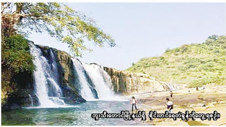
ဘူးသီးတောင်မြို့နယ်ရှိ စိုင်းတင်ရေတံခွန်ကိုတွေ့ရစဉ်။

စိုင်းတင်ချောင်းရဲ့အနီးနားမှာတည်ရှိနေလို့ စိုင်းတင် ရေတံခွန်လို့ ခေါ်တွင်ကြတာဖြစ်တယ်။ စိုင်းတင်