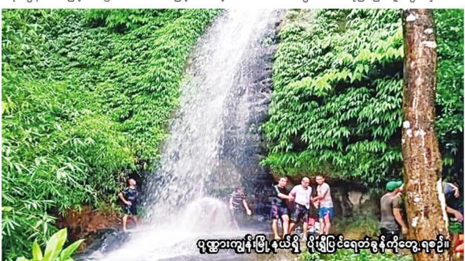
ပုဏ္ဏားကျွန်းမြို့နယ်ရှိ ပိုးရွှံ့ပြင်ရေတံခွန်ကိုတွေ့ရစဉ်။

ပိုးရွှံ့ပြင်ရေတံခွန်က ပုဏ္ဏားကျွန်းမြို့နယ် ပိုးရွှံ့ပြင် ကျေးရွာရဲ့အနီးနားမှာတည်ရှိပါတယ်။ ပုဏ္ဏားကျွန်း မြို့နဲ့ ငါးမိုင်လောက်ပဲဝေးကွာတယ်။ ပိုးရွှံ့ပြင်ရေတံခွန် ကို ရသေ့တောင်-ပုဏ္ဏားကျွန်း ကားလမ်းပေါ်ရှိ ပေါက်တောပြင်ကျေးရွာကနေတစ်ဆင့် စက်တပ်လှေ နဲ့ မိနစ် ၂၀လောက်စီးရင် ရောက်ရှိပါတယ်။ ပိုးရွှံ့ပြင် ရေတံခွန်က အမြင့် ပေ ၅၀လောက်သာ မြင့်မားပေမဲ့