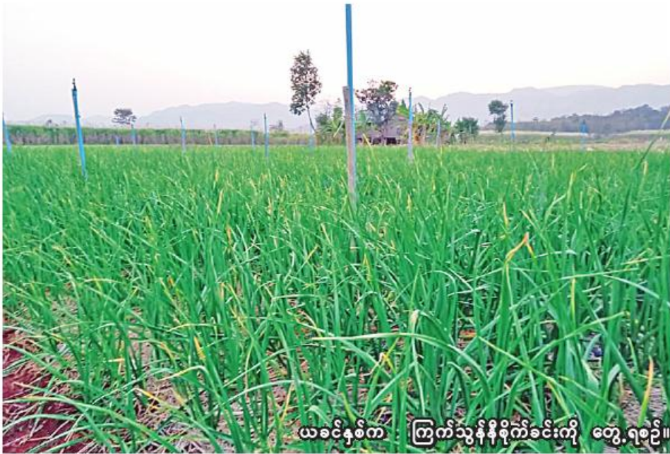
ယခင်နှစ်က ကြက်သွန်နီစိုက်ခင်းကို တွေ့ရစဉ်။