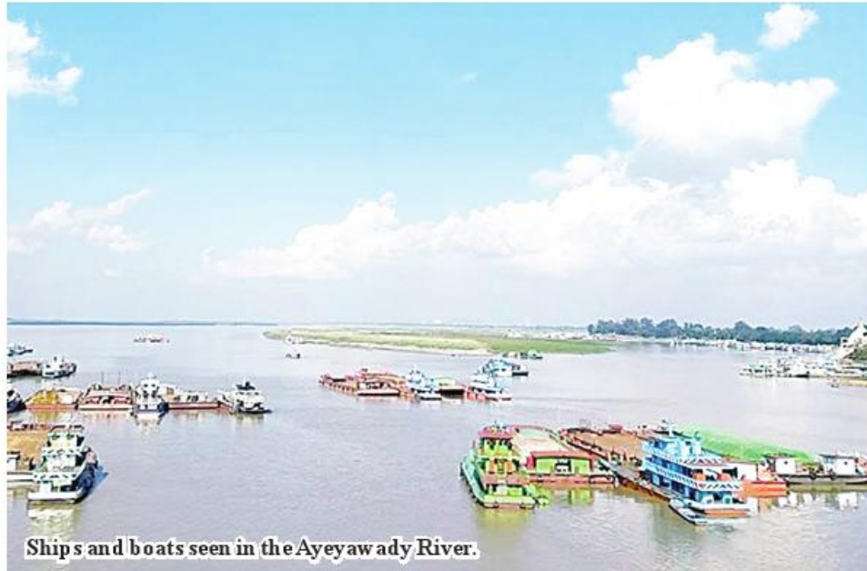
Ships and boats seen in the Ayeyawady River.