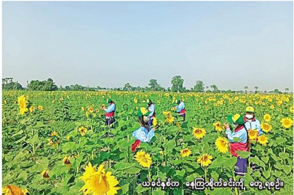
ယခင်နှစ်က နေကြာစိုက်ခင်းကို တွေ့ရစဉ်။

ရေးအတွက် သက်ဆိုင်ရာမြို့နယ် စိုက်ပျိုးရေးဦးစီးဌာနက ပညာပေး သင်တန်းများ အရှိန်မြှင့်တင်ဆောင် ရွက်ခြင်း၊ ဝန်ထမ်းနှင့်နေကြာစိုက်ပျိုး မည့်တောင်သူများ စွမ်းဆောင်ရည် မြှင့်မားရေးအတွက် ပညာပေး သင်တန်းများကို အရှိန်မြှင့်ဆောင် ရွက်ခြင်းတို့ ပြုလုပ်လျက်ရှိကြောင်း သိရသည်။ (၂၀၆)