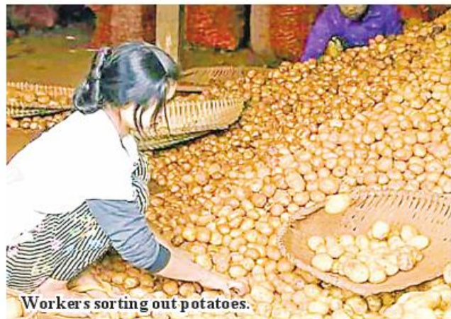
Workers sorting out potatoes.

other crops such as cabbage, cucumber, tomato, white mustard, cow bean, and cauliflowers are also marketable in Mandalay. At present, many trucks carrying green groceries flow into Mandalay on a daily basis. 185