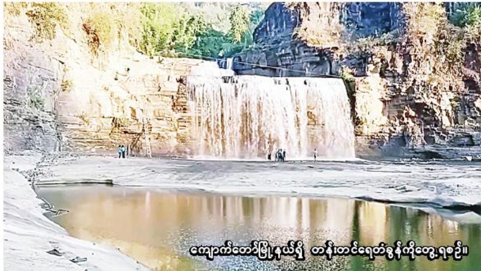
ကျောက်တော်မြို့နယ်ရှိ တန်းတင်ရေတံခွန်ကိုတွေ့ရစဉ်။

ဘဝရဲ့ပျော်ရွှင်ကြည်နူးစရာနဲ့ စိတ်ကျေနပ်မှုကို ရရှိစေတဲ့အရာတွေထဲမှာ ခရီးသွားတာကလဲတစ်ခု အပါအဝင်ဖြစ်လို့ စာရေးသူကတော့ ခရီးသွားရတာကို သဘောကျပါတယ်။ ရေတံခွန်ဆိုတာက သဘာဝက ပေးထားတဲ့ လက်ဆောင်မွန်တစ်ခုဖြစ်ပါတယ်။