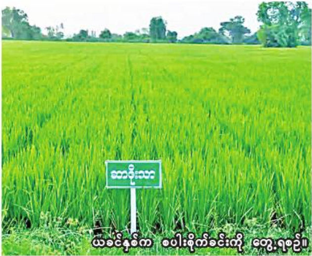
ယခင်နှစ်က စပါးစိုက်ခင်းကို တွေ့ရစဉ်။