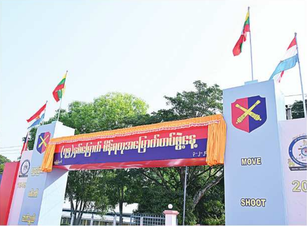
နိုင်ငံတော်စီမံအုပ်ချုပ်ရေးကောင်စီဥက္ကဋ္ဌ တပ်မတော်ကာကွယ်ရေးဦးစီးချုပ် ဝိုင်းချုပ်မှူးကြီးမင်းအောင်လှိုင် (၇၅)နှစ်မြောက် စိန်ရတုအမြောက်တပ်ဖွဲ့နေ့အခမ်းအနားသို့တက်ရောက်ချီးမြှင့်၍ ဂုဏ်ပြုအမှာစကားပြောကြားပွင့်လှစ်ပေးစဉ်။

နေပြည်တော် ဖေဖော်ဝါရီ ၃ (၇၅)နှစ်မြောက် စိန်ရတုအမြောက်တပ်ဖွဲ့နေ့အခမ်းအနားကို ယနေ့နံနက်ပိုင်းတွင် နေပြည်တော်စစ်ကြောရေးနှင့် တည်းခိုရေးစခန်းရှိ ဆင်ဖြူရှင်ခန်းမ၌ကျင်းပပြုလုပ်ရာ နိုင်ငံတော်စီမံအုပ်ချုပ်ရေးကောင်စီဥက္ကဋ္ဌ တပ်မတော်ကာကွယ်ရေးဦးစီးချုပ် ဝိုင်းချုပ်မှူးကြီးမင်းအောင်လှိုင် တက်ရောက်ချီးမြှင့်သည်။ အဆိုပါ(၇၅)နှစ်မြောက် စိန်ရတုအမြောက်တပ်ဖွဲ့နေ့အခမ်းအနားသို့ နိုင်ငံတော်စီမံအုပ်ချုပ်ရေးကောင်စီဥက္ကဋ္ဌ တပ်မတော်ကာကွယ်ရေးဦးစီးချုပ်နှင့်အတူ ကာကွယ်ရေးဦးစီးချုပ်(ရေ) ဒုတိယဝိုင်းချုပ်ကြီးဇွဲဝင်းမြင့်၊ ကာကွယ်ရေးဦးစီးချုပ်(လေ) ဝိုင်းချုပ်ကြီးထွန်းအောင်၊ ကာကွယ်ရေးဦးစီးချုပ်ရုံးမှ အဆင့်မြင့်တပ်မတော်အရာရှိကြီးများ၊ ပြည်ထောင်စုအဆင့်ပုဂ္ဂိုလ်များ၊နေပြည်တော်တိုင်းစစ်ဌာနချုပ် တိုင်းမှူး၊ အငြိမ်းစားအမြောက်တပ်ဖွဲ့ဝင်အရာရှိကြီးများ၊ တာဝန်ရှိသူများနှင့် ဖိတ်ကြားထားသူများ တက်ရောက်ကြသည်။ ဦးစွာ နိုင်ငံတော်စီမံအုပ်ချုပ်ရေးကောင်စီဥက္ကဋ္ဌ တပ်မတော်ကာကွယ်ရေးဦးစီးချုပ်သည် အခမ်းအနားကျင်းပမည့်နေရာသို့ ရောက်ရှိရာ တာဝန်ရှိသူများက ကြိုဆိုနှုတ်ဆက်ကြသည်။ စာမျက်နှာ ၁၆ ကော်လံ ၁၂၃