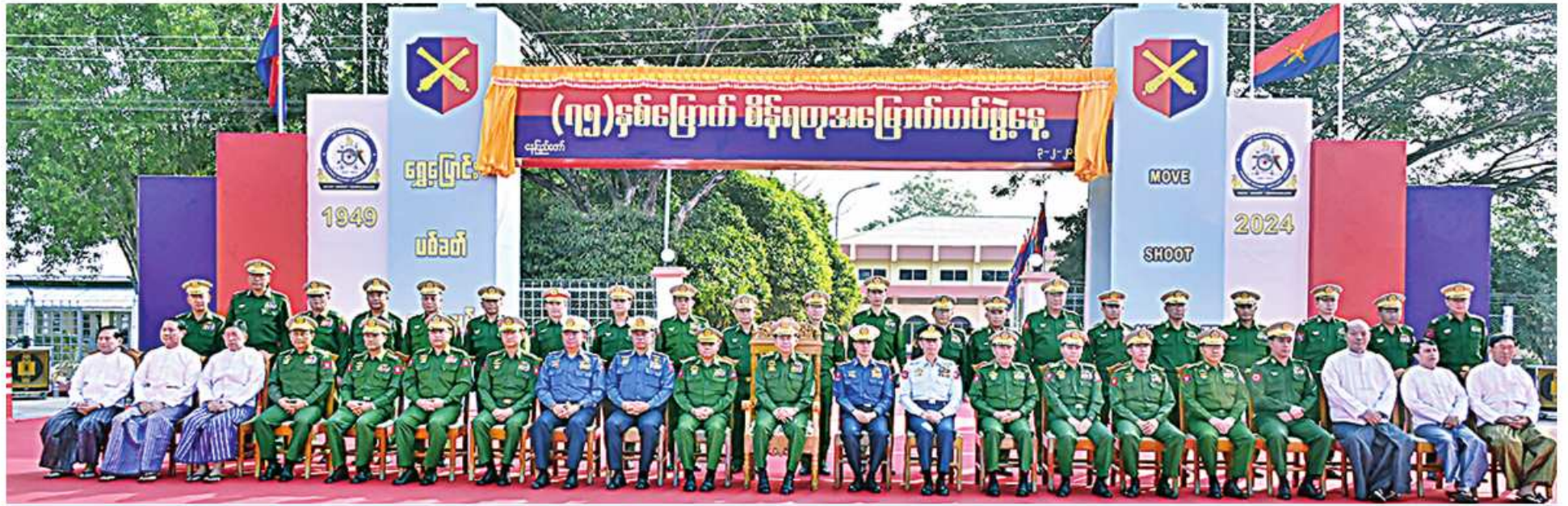
နိုင်ငံတော်စီမံအုပ်ချုပ်ရေးကောင်စီဥက္ကဋ္ဌ တပ်မတော်ကာကွယ်ရေးဦးစီးချုပ် ဗိုလ်ချုပ်မှူးကြီးမင်းအောင်လှိုင် (၇၅)နှစ်မြောက် စိန်ရတုအမြောက်တပ်ဖွဲ့နေ့အခမ်းအနား တက်ရောက်လာကြသူများနှင့်အတူ ဖုပေါင်းမှတ်တမ်းတင် ဘတ်ပုံရိပ်ခဏ်း

စာမျက်နှာ ၁၇ မှအဆက် ဝင်ကြားထည့်ပါစွာ ရုပ်တည်နိုင်ခဲ့ပြီ ဖြစ်ကြောင်း၊ ထို့ကြောင့် စွမ်းရည်ရှိသည့် တပ်၊ စွမ်းအားရှိသည့်တပ်၊ နိုင်ငံတော် ကာကွယ်ရေးအတွက် အားထားရသည့် လက်ရုံးတပ်အဖြစ်တမ်းပြန်နေစေရေးတပ်ဖွဲ့ ဝင်အားလုံးက အားသွန်စွန့်စိုက်ကြိုးပမ်း ကြရန် မှာကြားလိုကြောင်း။