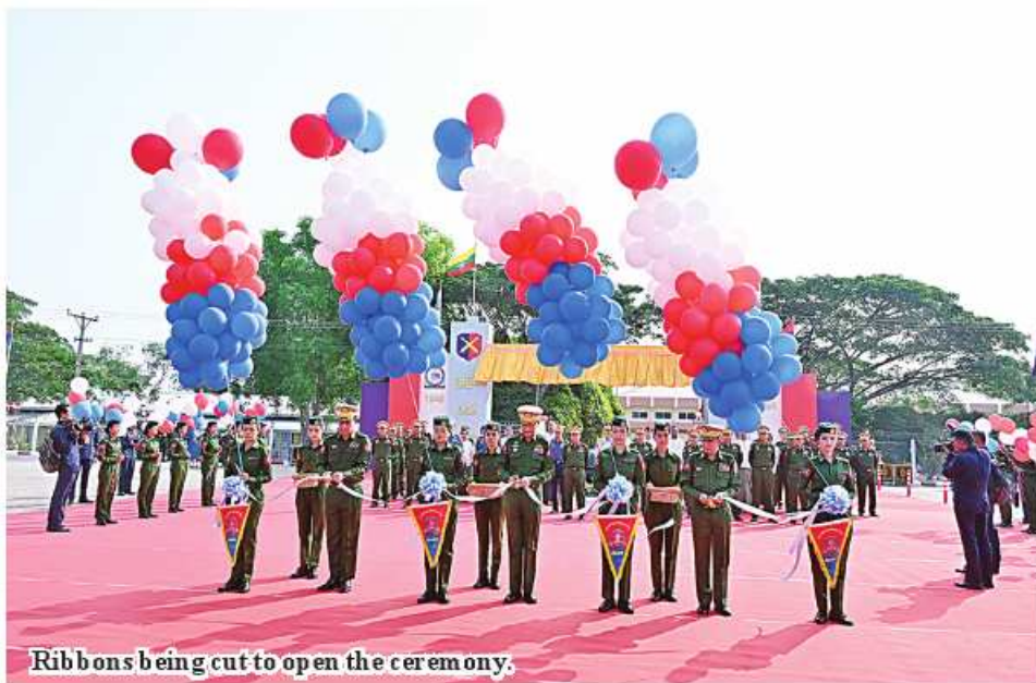
Ribbons being cut to open the ceremony.