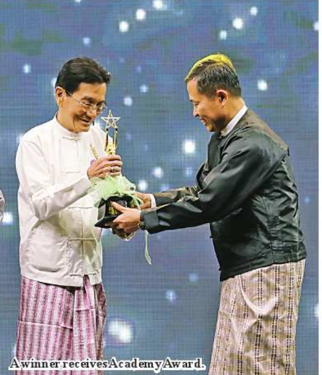
A winner receives Academy Award.

government expressed its gratitude and prayed greater success. In particular, he stressed that while working on national and public affairs, it is important for all those from the literature, film, theatrical and music industries to prioritize organizations over individuals and national affairs over organizations. In that way, they are to work together for the brighter future of their country. Today, the government is implementing two national goals of "prosperity of the country and food security". In order for the country to be prosperous, it is necessary to be self-sufficient in food, and only if we can increase the production and sale of various types of products based on agriculture and livestock,