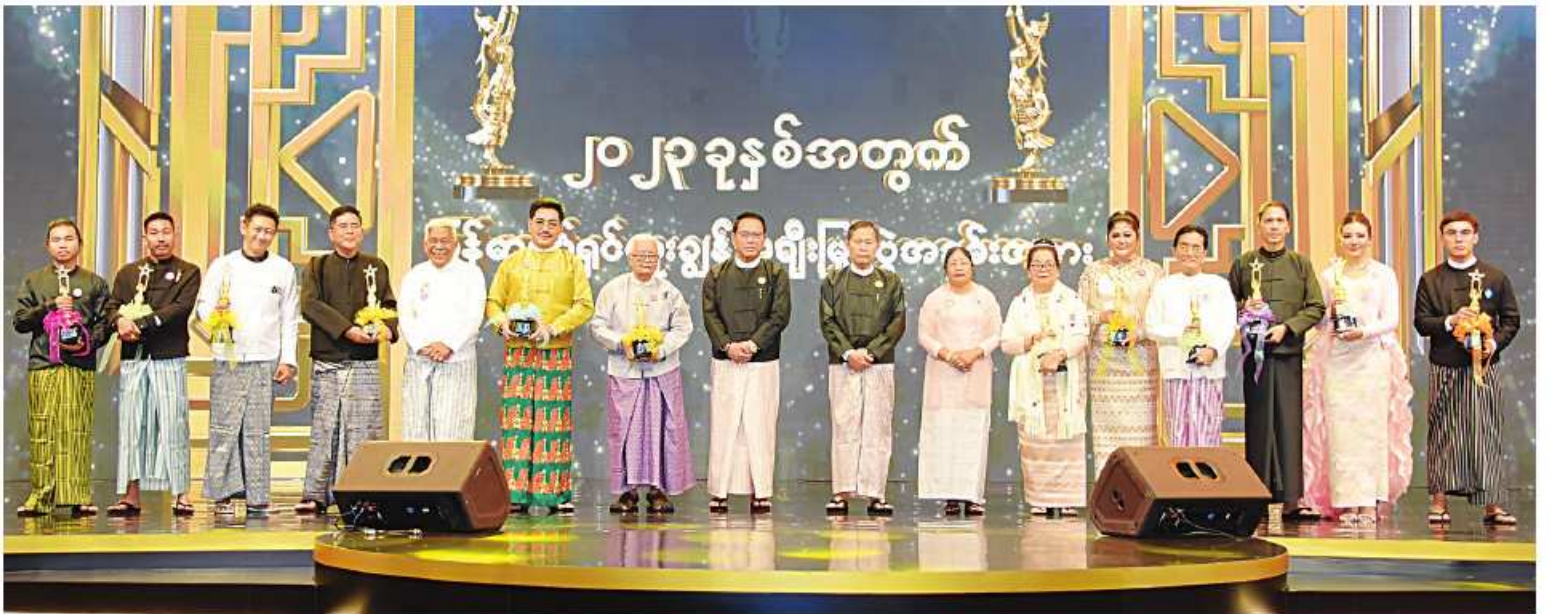
နိုင်ငံတော်စီမံအုပ်ချုပ်ရေးကောင်စီဒုတိယဥက္ကဋ္ဌ ဒုတိယဝန်ကြီးချုပ် ဒုတိယဗိုလ်ချုပ်မှူးကြီးစိုးဝင်းနှင့်ဇနီး ဒေါ်သန်းသန်းနွယ် ၂၀၂၄ ခုနှစ်အတွက် မြန်မာ့ရုပ်ရှင်ထူးချွန် ဆုရရှိသူများနှင့်အတူ စုပေါင်းမှတ်တမ်းတင်ဓာတ်ပုံရိုက်စဉ်။

စစ်အေးခေတ်လွန် ကာလများတွင် အင်အားကြီးနိုင်ငံအချို့သည်အင်အားနည်း သည့် နိုင်ငံငယ်များအပေါ် ၎င်းတို့အလိုကျ လွှမ်းမိုးချုပ်ကိုင်နိုင်ရန်အတွက် နည်းလမ်း ပေါင်းစုံ၊ မဟာဗျူဟာ၊ နည်းဗျူဟာများနှင့် ချဉ်းကပ်ဆောင်ရွက်နေသည့် အထဲတွင် ယဉ်ကျေးမှုအခန်းကဏ္ဍနယ်ပယ်သည်လည်း အဓိကကျပြီး ရိုးရိုးနိုင်ငံယဉ်ကျေးမှုပျက်သုဉ်း ပါက အဆိုပါနိုင်ငံသားများ၏ စိတ်ဓာတ် များပါ ပျက်သုဉ်းမှုကတစ်ဆင့် နိုင်ငံချစ်စိတ်၊ အမျိုးချစ်စိတ်၊ အမျိုးဂုဏ်ကာကွယ်လိုစိတ် များ ဆုံးရှုံးမှုကတစ်ဆင့် အလွယ်တကူ လက်အောက်သြဇာခံနိုင်အဖြစ် ရောက်ရှိ သွားနိုင်သကဲ့သို့ ယနေ့ကဲ့သို့အခြေအနေ မျိုးကိုလည်း ကမ္ဘာ့နိုင်ငံရေးဇာတ်ခုံပေါ် တွင် နမူနာအဖြစ် တွေ့မြင်နေကြရမည်ဖြစ် ကြောင်း၊ အထူးသဖြင့် လူ့အခွင့်အရေး၊ ဒီမိုကရေစီရေးဆိုင်ရာ စကားလုံးများကို ရောင်းကုန်ပစ္စည်းကဲ့သို့ ထည်လဲသုံးပြီး ပဋိပက္ခဖြစ်သည်နှင့်စိုးရိမ်ကြောင်းထိတ်လန့် တုန်လှုပ်မိကြောင်း၊ ငြိမ်းချမ်းစွာပြေငြိမ်းကြ ရန်လိုကြောင်းစသည့် လက်သုံးစကားများ သာပြောပြီး မျက်နှာကြီးရာဟင်းဖတ်ပါဆို သကဲ့သို့ အင်အားကြီးမားသည့်ဘက်ကပင် ရပ်တည်ပြီး ဖိအားပေးအကျပ်ကိုင်မှုများနှင့်