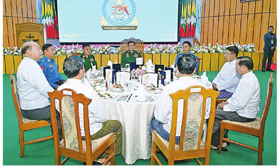
နိုင်ငံတော်စီမံအုပ်ချုပ်ရေးကောင်စီဥက္ကဋ္ဌ တပ်မတော်ကာကွယ်ရေးဦးစီးချုပ် ဗိုလ်ချုပ်မှူးကြီးမင်းအောင်လှိုင်နှင့် အဖွဲ့ဝင်များ (၇၅)နှစ် မြောက် စိန်ရတုအမြောက်တပ်ဖွဲ့နေ့အထိမ်းအမှတ်အဖြစ် တည်ခင်းညှိနှိုင်းသည့် ဂုဏ်ပြုနေ့လယ်စာကို အတူတကွသုံးဆောင်ခဏ်း

ထို့နောက် နိုင်ငံတော်စီမံအုပ်ချုပ်ရေး ကောင်စီဥက္ကဋ္ဌ တပ်မတော်ကာကွယ်ရေး ဦးစီးချုပ်သည် တက်ရောက်လာကြသည့်