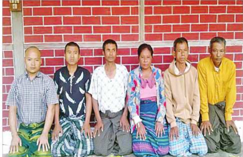
ဖေဖော်ဝါရီ ၂ ရက်တွင် ပဲခူးမြို့နယ် ၁၀ လုံး၏ မှတ်တမ်းဓာတ်ပုံ။