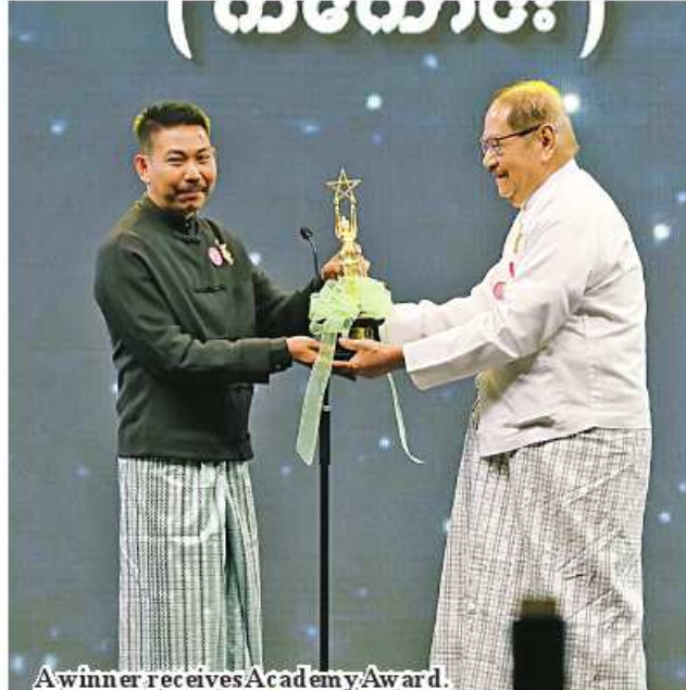
A winner receives Academy Award.

the social and economic life of the people will develop rapidly. The Central Committee for the Development of Micro, Small and Medium Enterprises is headed by the Prime Minister, and the working groups and sub-groups are cooperating with the respective responsible ministries and organizations to carry out at a fast pace. In addition, regional stability and peace, the rule of law and socio-economic life development factors are also basic requirements that will be mandatory. In order to fulfill these requirements, all citizens must have love for the country and their people based on the civic nationalism to shape the future of the country.