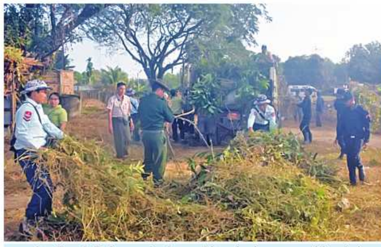
လယ်ဝေးမြို့နယ် ပြည်သူ့ဆေးရုံတွင် ဌာနဆိုင်ရာဝန်ထမ်းများက ဖုပေါင်းသန့်ရှင်းရေး လုပ်ငန်းဆောင်ရွက်ကြခဏ်း

နေပြည်တော် ဖေဖော်ဝါရီ ၃ မိမိတို့၏ နေ့စဉ်လူမှုဘဝ နေထိုင်ဖြတ် သန်းရာတွင် ပတ်ဝန်းကျင်သန့်ရှင်းသပ်ရပ် နေမှသာ ကိုယ်စိတ်နှလုံးချမ်းမြေ့ပြီး မျက်စိပသာဒဖြစ်ဖွယ်ရာ သန့်ရှင်းသာယာ လှပသောမြို့ရွာ Clean City၊ Clean