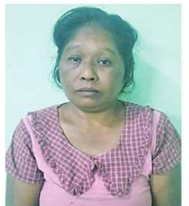
ကေသီ(၅၄)နှစ်(ကျော်ကျော်၏ဇနီး)

ကျင်းပမည်ညတွင် အပြစ်မဲ့ပြည်သူများ ထိတ်လန့်ကြောက်ရွံ့မှုများဖြစ်ပေါ်စေရန် ရည်ရွယ်လျက် ပဲခူးမြို့ပေါ်ရှိ လူစည်ကား သည့်နေရာများအား ၁၀၇ မမရွှေတိုက် ခွဲများဖြင့် ပစ်ခတ်တိုက်ခိုက်ရန် စေခိုင်းခဲ့ ကြောင်းသိမ်းရပ်မြို့အဝင်တွင် ရှိင်းဝေ(ခ) RIထံမှ ၁၀၇ မမရွှေတိုက်ခွဲများကိုသွား ရောက်ယူဆောင်၍ ပြန်လာစဉ် ဖမ်းဆီးခံရ ခြင်းဖြစ်ကြောင်း၊ အဆိုပါ ၁၀၇ မမ ရွှေ တိုက်ခွဲများဖြင့် ပဲခူးမြို့ပေါ်ရှိ လူစည်ကား သည့် စားသောက်ဆိုင်နှင့် လက်ဖက်ရည်