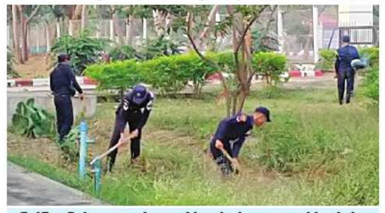
မြိတ်မြို့ ပြည်သူ့ဆေးရုံတွင် ဌာနဆိုင်ရာဝန်ထမ်းများက ဖုပေါင်းသန့်ရှင်းရေး လုပ်ငန်းဆောင်ရွက်ကြခဏ်း

ယင်းသို့ ဆောင်ရွက်ပေးနေမှုများကို သက်ဆိုင်ရာ တိုင်းစစ်ဌာနချုပ်များမှ တာဝန်ရှိသူများက လိုက်လံကြည့်ရှုအား ပေးပြီး လိုအပ်သည်များ ညှိနှိုင်းဆောင် ရွက်ပေးခဲ့ကြကြောင်း သတင်းရရှိသည်။