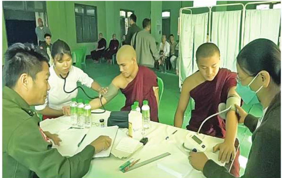
သံဃာတော်များအား အလယ်ပိုင်းတိုင်းစစ်ဌာနချုပ် နယ်မြေစံဆေးကုသရေးအဖွဲ့က ကျန်းမာရေးစောင့်ရှောက်မှုလုပ်ငန်းများ ဆောင်ရွက်ပေးခဲ့ပါသည်။

နေပြည်တော် ဖေဖော်ဝါရီ ၃ မန္တလေးတိုင်းဒေသကြီး အောင်မြေသာစံမြို့နယ် ညောင်ကွဲရပ်ကွက်ရှိ သံဃာတော်များနှင့် ဒေသခံပြည်သူများကို ယနေ့တွင် အလယ်ပိုင်းတိုင်းစစ်ဌာနချုပ် နယ်မြေစံဆေးကုသရေးအဖွဲ့က အဆိုပါရပ်ကွက်ရှိ ရှင်အရဟံ သိမ်နေဝင်ကျောင်းတိုက်၌ ကျန်းမာရေး စောင့်ရှောက်မှုလုပ်ငန်းများ ဆောင်ရွက်ပေးခဲ့သည်။ ထိုသို့ ဆောင်ရွက်ပေးရာတွင်