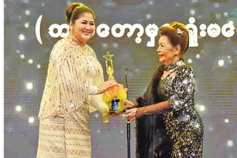
၂၀၂၃ ခုနှစ်အတွက် “ဘယ်တော့မှအရှုံးမပေးဘူး”ဇာတ်ကားဖြင့် အကောင်းဆုံးအမျိုးသမီးဇာတ်ဆောင်ဆုရရှိသူ အကယ်ဒမီများရှင် စိုးမြတ်သူဇာ ဆုလက်ခံရယူစဉ်။