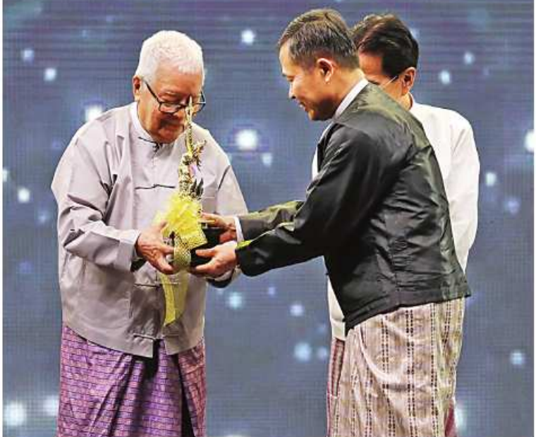
နိုင်ငံတော်စီမံအုပ်ချုပ်ရေးကောင်စီဒုတိယဥက္ကဋ္ဌ ဒုတိယဝန်ကြီးချုပ် ဒုတိယဗိုလ်ချုပ်မှူးကြီးစိုးဝင်း ရုပ်ရှင်တစ်သက်တာထူးချွန်ဆုရ ဒါရိုက်တာအောင်မြင့်မြတ်အား ထူးချွန်ဆုပေးအပ်ချီးမြှင့်စဉ်။

မည်သို့ပင်ဖြစ်စေကာမူ မိမိတို့ချစ်ခင်မြတ်နိုးရသည့် စာမျက်နှာ ၂၀ သို့