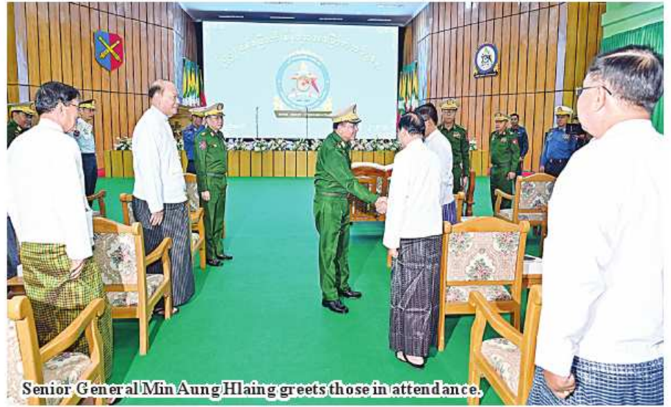
Senior General Min Aung Hlaing greets those in attendance.

also actively taking part in public welfare undertakings, including relief and rehabilitation tasks after the Nargis cyclone in 2008, Mocha cyclone in 2023 and other natural disasters, in addition to serving its normal duties.