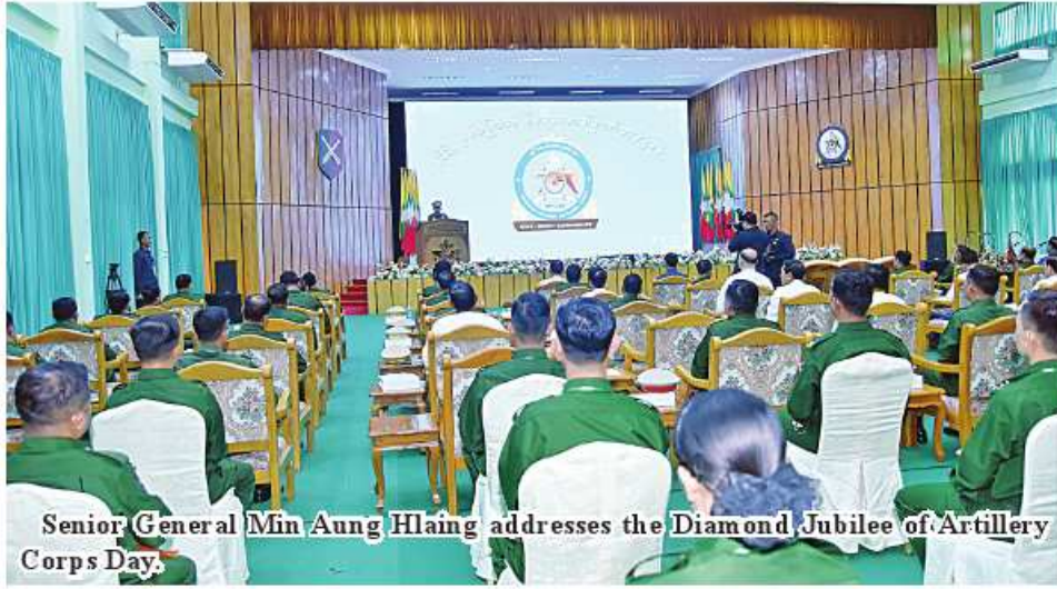
Senior General Min Aung Hlaing addresses the Diamond Jubilee of Artillery Corps Day.