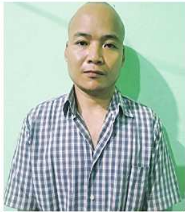
ဦးသောဘန(၁)သာကျော်ဌေး(၃၃)နှစ်