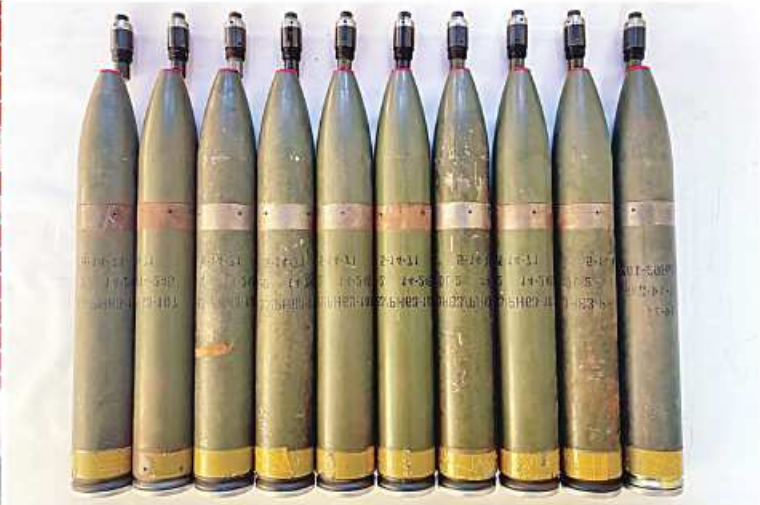
တရားခံ ခြောက်ဦးနှင့်အတူ ဖမ်းဆီးရမိသည့် KIA ထုတ် ရှေ့တိုက်ခွဲ