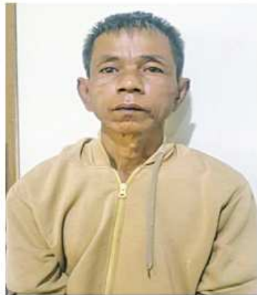
ကျော်ကျော်(၅၄)နှစ်