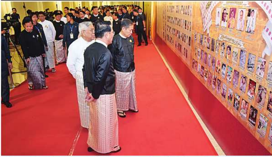
နိုင်ငံတော်စီမံအုပ်ချုပ်ရေးကောင်စီဒုတိယဥက္ကဋ္ဌ ဒုတိယဝန်ကြီးချုပ် ဒုတိယဗိုလ်ချုပ်မှူးကြီးစိုးဝင်း ၁၉၅၂ ခုနှစ်မှ ၂၀၂၂ ခုနှစ်ထိ မြန်မာ့ရုပ်ရှင်ထူးချွန်ဆုရရှိကြသူများ၊ ထူးချွန်ဆုရဓာတ်ကားများနှင့် ထူးချွန်ဆုရ အနုပညာရှင်များ၊ အတတ်ပညာရှင်များ၏ မှတ်တမ်းဓာတ်ပုံများကို ကြည့်ရှုစဉ်။