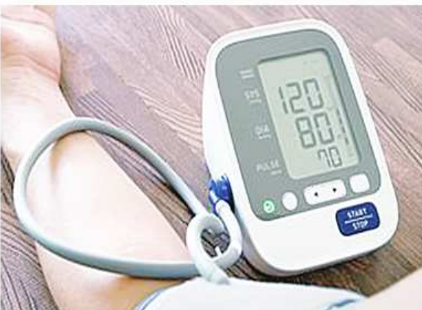
လေ့လာခဲ့ကြသည်။ လေ့လာချက်မှ ပေါ်ထွက်လာ သည့်ရလဒ်များအရ နှလုံးကျွန်းမာ ရေးကို လေ့ကျင့်ခန်းပြုလုပ်ခြင်းဖြင့် သုံးရာခိုင်နှုန်း နှစ်စဉ်လျော့ချထား နိုင်သူများတွင် ဆီးကျိတ်ကင်ဆာ ဖြစ်နိုင်ခြေ ပုံမှန်ထက် ၃၀ ရာခိုင် နှုန်း ပိုနည်းပါးသည်ကို တွေ့ရ ကြောင်း သုတေသနပညာရှင်များ က ပြောကြားသည်။ နှလုံးကျွန်းမာရေးစနစ် မြှင့်တင် နိုင်ပါက ဖြစ်နိုင်ခြေလျော့ချနိုင် မည့် ကင်ဆာရောဂါများထဲတွင် ဆီးကျိတ်ကင်ဆာလည်း ပါဝင် ကြောင်း၊ ဆီးကျိတ်ကင်ဆာရောဂါ သည် အမျိုးသားများ၌ အဖြစ် အများဆုံး ကင်ဆာရောဂါတစ်မျိုး ဖြစ်ကြောင်း သုတေသနပညာရှင် များက သုံးသပ်ထားသည်။ Ref : Russia Today Trs : KKO

၂ ပြိုဟ်တုကိုလွှတ်တင်ရေးအတွက် မြေပြင် ပြင်ဆင်မှုများ ပြုလုပ်နေပြီ ဖြစ်ကြောင်း သိရသည်။ ကွေးရှောင်-၂ ပြိုဟ်တုသည် တရုတ်နိုင်ငံ၏ လကမ္ဘာစူးစမ်းလေ့ လာရေးအစီအစဉ် စတုတ္ထအဆင့် အတွက် ကြားခံသတင်းပို့ ပြိုဟ်တု အဖြစ် တာဝန်ယူမည်ဖြစ်သည်။ လကမ္ဘာ စူးစမ်းလေ့လာရေး အစီအစဉ် စတုတ္ထအဆင့်တွင် တရုတ်နိုင်ငံသည် ချန်အာ-၄၊ ချန် အာ-၆၊ ချန်အာ-၇ နှင့် ချန်အာ-၈ လဆင်းယာဉ်များကို လွှတ်တင်ရန် စီစဉ်ထားကြောင်း သိရသည်။ Ref : Xinhua News Trs : KKO