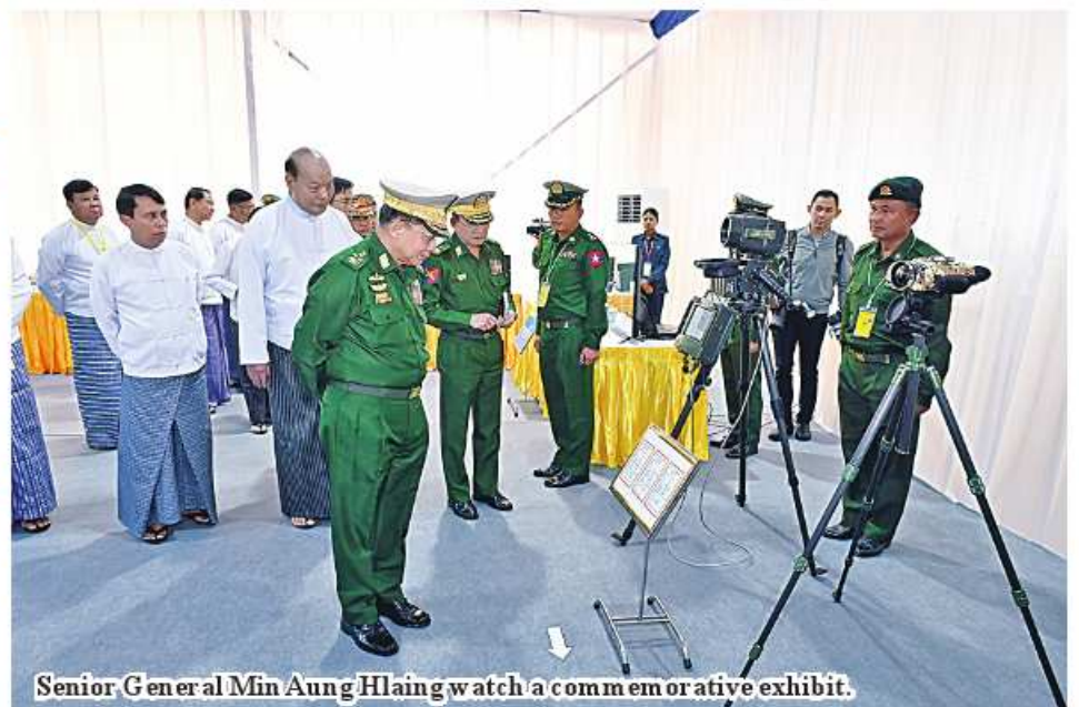
Senior General Min Aung Hlaing watch a commemorative exhibit.