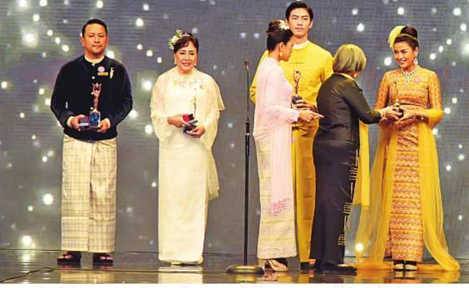
အကယ်ဒမီဆုများရှင် ဆွေဝင်ထိုက်က အကောင်းဆုံး ဝတ်စားဆင်ယင်မှု ဆုရရှိသူ အကယ်ဒမီခန့်စည်သူ၊ အကယ်ဒမီ ခင်သီတာထွန်း၊ ဟင်နရီနှင့် အိဇောပိုတို့ကို ဆုများ ပေးအပ်ချီးမြှင့်စဉ်။

ထူးချွန်ဆုအရေအတွက်ကိုလည်း ၁၉၅၄ ခုနှစ်တွင် ဒါရိုက်တာဆု၊ ၁၉၅၅ ခုနှစ်တွင် အထူးဆု၊ ၁၉၅၆ ခုနှစ်တွင် ရုပ်ရှင်ဇာတ်ပို့ ထူးချွန်ဆု၊ ၁၉၆၂ ခုနှစ်တွင် အမျိုးသား ဇာတ်ပို့ဆုနှင့် အမျိုးသမီးဇာတ်ပို့ဆုများကို တိုးမြှင့်ချီးမြှင့်ခဲ့ပြီး ၁၉၉၀ ပြည့်နှစ်တွင် ရုပ်ရှင် ဇာတ်ညွှန်းဆု၊ ရုပ်ရှင်တေးဂီတဆု၊ ရုပ်ရှင် အသံဆုများကို ထပ်မံတိုးမြှင့်ချီးမြှင့်ခဲ့သဖြင့် မြန်မာ့ရုပ်ရှင်ထူးချွန်ဆု ၁၀ မျိုးအတိအကျ