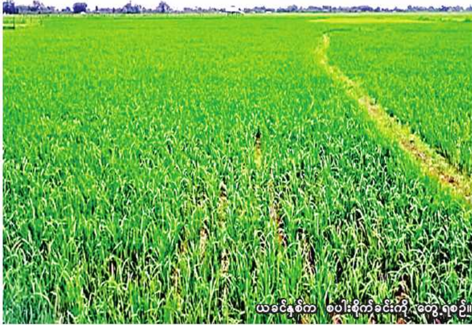
ယခင်နှစ်က စပါးစိုက်ခင်းကို တွေ့ရစဉ်။

မော်လိုက် ဖေဖော်ဝါရီ ၃ စစ်ကိုင်းတိုင်းဒေသကြီး မော်လိုက်ခရိုင် ဖောင်းပြင်မြို့နယ်တွင် နွေသီးနှံစိုက်ပျိုးရာသီ၌ စပါး ၄၃၂၇ ဧက စိုက်ပျိုးပြီးစီးပြီဖြစ်ကြောင်း မော်လိုက်ခရိုင် စိုက်ပျိုးရေးဦးစီးဌာန