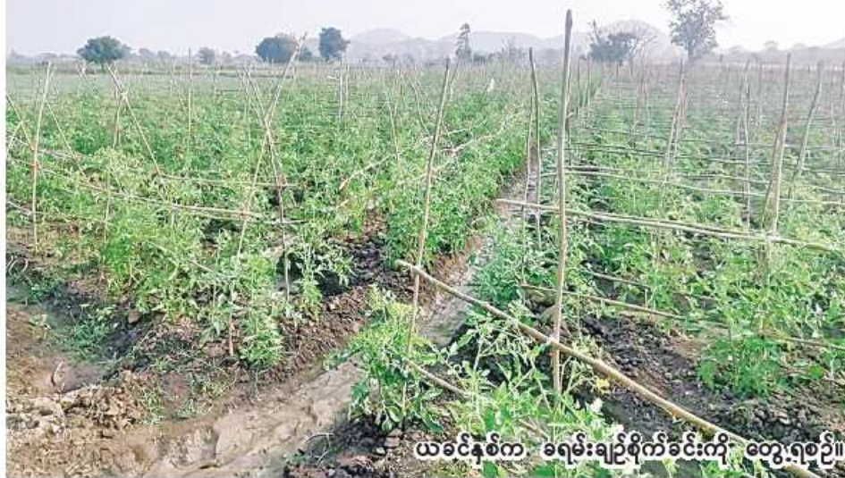
ယခင်နှစ်က ခရမ်းချဉ်စိုက်ခင်းကို တွေ့ရစဉ်။

ဟင်းသီးဟင်းရွက်များကို ကျန်းမာရေးနှင့်ညီညွတ်သည့် သီးနှံဖြစ်စေရန် နည်းပညာပေးခြင်း၊ တောင်သူများ ဟင်းသီးဟင်းရွက်များ တိုးချဲ့စိုက်ပျိုးလာရန်အတွက် နည်းပညာပေးခြင်းများ ဆောင်ရွက်ပေးလျက် ရှိကြောင်း သိရသည်။ (၂၀၆)