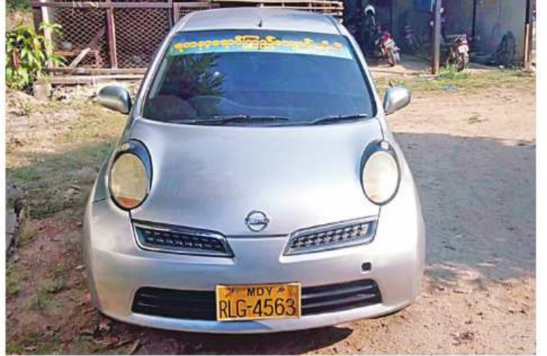
ဖေဖော်ဝါရီ ၂ ရက်တွင် ပဲခူးမြို့နယ် ကမာနတ်ကျေးရွာအနီး ပဲခူး-သနပ်ပင် လမ်းဆုံ တွင် ဖမ်းဆီးရမိသည့် တရားခံ ခြောက်ဦး စီးနင်းလာသည့် မော်တော်ယာဉ်၏ မှတ်တမ်းဓာတ်ပုံ။

အိမ်ပြင်ပ၌ထွန်းသော မီးများကို နေ့အလင်းရောင်ရှိချိန်တွင် ပိတ်ထားခြင်းဖြင့် လျှပ်စစ်ကို ချွေတာပါ။