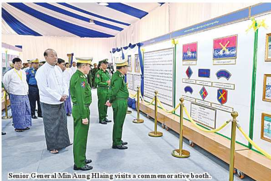
Senior General Min Aung Hlaing visits a commemorative booth.