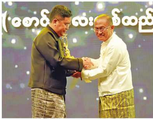
၂၀၂၃ ခုနှစ်အတွက် “စောင်နီလေးတစ်ထည်” ဇာတ်ကားဖြင့် အကောင်းဆုံးရုပ်ရှင်ဒါရိုက်တာဆုရရှိသူ ဒါရိုက်တာတင်အောင်စိုး (ပန်းဖြူတော်) ဆုလက်ခံရယူစဉ်။