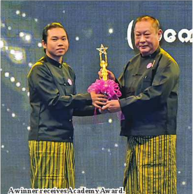
A winner receives Academy Award.