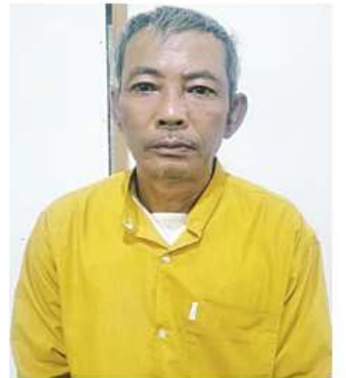
လှဦး(၅၇)နှစ်

နေပြည်တော် ဖေဖော်ဝါရီ ၃ အကြမ်းဖက်အုပ်စုအဖြစ်ကြေညာထားသော CRPH၊ NUG နှင့် ယင်းတို့၏ လက်အောက်ခံ PDF အမည်ခံအကြမ်းဖက်အဖွဲ့များ၊ ယင်းတို့နှင့် ဆက်သွယ်နေသော အဖွဲ့အစည်းများနှင့် လူပုဂ္ဂိုလ်များသည် နိုင်ငံတော်တည်ငြိမ်အေးချမ်းရေးကိုပျက်ပြားစေရန်နှင့် ပြည်သူ့လူထုကိုအကြောက်တရားများဖြစ်ပေါ်စေပြီး အစိုးရယန္တရားများ ပျက်ပြားစေရန်ရည်ရွယ်လျက် နိုင်ငံ့ဝန်ထမ်းများအပါအဝင် အပြစ်မဲ့ပြည်သူများအား