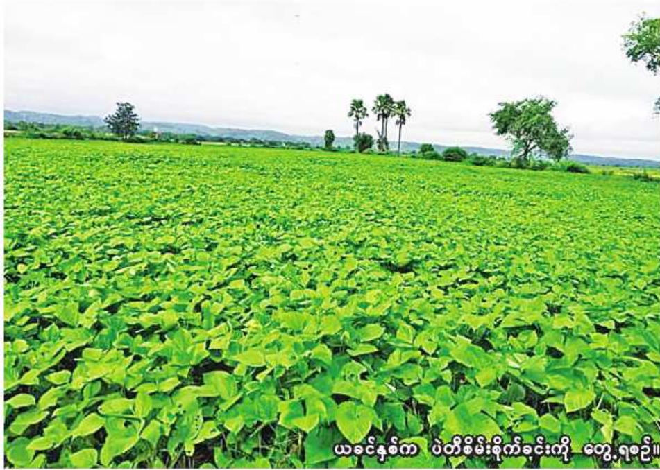
ယခင်နှစ်က ပဲတီစိမ်းစိုက်ခင်းကို တွေ့ရစဉ်။