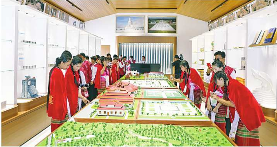
မော်ကွန်းတိုက်၌ မာရဝိဇယဗုဒ္ဓရုပ်ပွားတော်မြတ်ကြီးနှင့် ဗုဒ္ဓဥယျာဉ်တော် ပုံစံငယ်ပြသထားမှုကို ကယားပြည်နယ်တိုင်းရင်းသား ရိုးရာယဉ်ကျေးမှုအဖွဲ့ လေ့လာကြည့်ညိုစဉ်။

ဖြစ်ပါတယ်။ ရုပ်မြင်သံကြားနဲ့ အွန်လိုင်း ပေါ်မှာတော့ တွေ့မြင်နေရတာကြာပါပြီ။ ကိုယ်တိုင်ဖူးမြော်ချင်နေတာလည်း ကြာပါ ပြီ။ အခုလိုအပြင်မှာ ကိုယ်တိုင်ကိုယ်ကျ ဖူးမြော်ရတဲ့အတွက် အတိုင်းမသိဝမ်းသာ ကြည့်ရှုရပါတယ်။ မော်ကွန်းတိုက်မှာဆိုရင် လည်း ပုံစံငယ်တွေကို ခင်းကျင်းပြသထား တာကိုလည်းတွေ့ရပါတယ်။ ဘုရားကြီး တည်ဆောက်ပုံအဆင့်ဆင့်ကို ဂေါပကအဖွဲ့ တ အသေးစိတ်ရှင်းပြတဲ့အတွက်လည်း အထူးပဲကျေးဇူးတင်ရှိပါတယ်။ အခုလို လာရောက်လေ့လာဖူးမြော်နိုင်အောင် စီစဉ် ပေးတဲ့ ကယားပြည်နယ်အစိုးရအဖွဲ့ကို လည်း အထူးပဲကျေးဇူးတင်ပါတယ်။ ကမ္ဘာ့ အလယ်မှာ ဗုဒ္ဓဘာသာနိုင်ငံအနေနဲ့ မာရဝိဇယ ဗုဒ္ဓရုပ်ပွားတော်မြတ်ကြီးကို တည်ထားကိုးကွယ်နိုင်ခဲ့တဲ့အတွက် မြန်မာ နိုင်ငံသားတစ်ယောက်အနေနဲ့ အထူးပင်