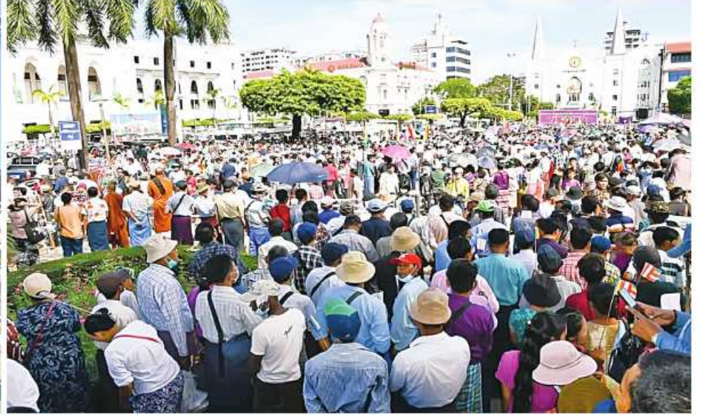
ဘုရားစေတီပုထိုးများနှင့် ဘာသာရေးဆိုင်ရာအဆောက်အအုံများကို ဖျက်ဆီးမှုအပေါ် ရန်ကုန်တိုင်းဒေသကြီး၌ ကန့်ကွက်ရုတ်ချပွဲပြုလုပ်စဉ်။

နေပြည်တော် ဖေဖော်ဝါရီ ၁ အကြမ်းဖက် သောင်းကျန်းသူများက ဘုရားစေတီပုထိုးများ၊ ဗုဒ္ဓဆင်းတုတော်များကို ဖျက်ဆီးစေကာမူ အားကန့်ကွက် ရုတ်ချပွဲများကို တိုင်းဒေသကြီးနှင့် ပြည်နယ်အသီးသီး၌ ကျင်းပပြုလုပ်လျက်ရှိ ရာ ယနေ့နံနက်ပိုင်းတွင် ရန်ကုန်တိုင်း ဒေသကြီး မြို့တော်ခန်းမအရှေ့ မဟာဗန္ဓုလ