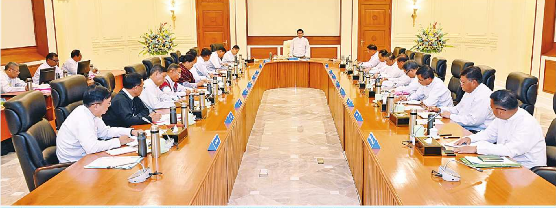
နိုင်ငံတော်စီမံအုပ်ချုပ်ရေးကောင်စီဥက္ကဋ္ဌ နိုင်ငံတော်ဝန်ကြီးချုပ် ဗိုလ်ချုပ်မှူးကြီးမင်းအောင်လှိုင် နိုင်ငံတော်စီမံအုပ်ချုပ်ရေးကောင်စီအစည်းအဝေး(၁/၂၀၂၄)တွင် အမှာစကားပြောကြားစဉ်။ (သတင်းစာမျက်နှာ-၁၆)