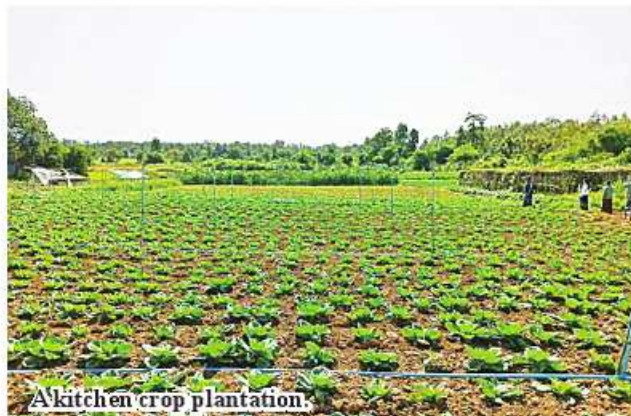
A kitchen crop plantation.

Cabbages from PyinOoLwin and Aungban towns are currently entering the Mandalay market every day and the business is doing well.