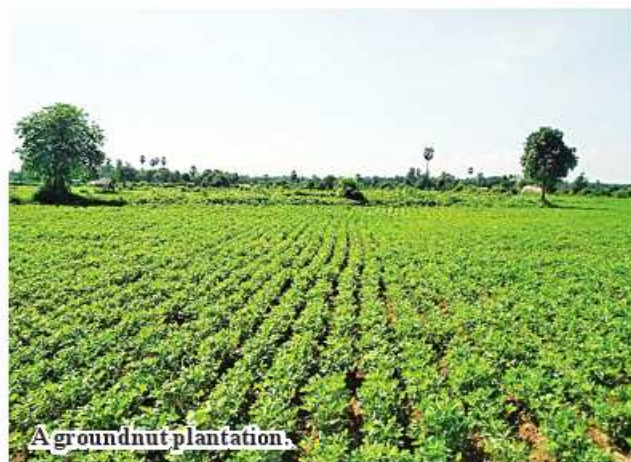
A groundnut plantation.

The department helps local farmers thrive crop plantations of groundnut this year with prevention of pests and weeding. So, staff of the department make field trips to crop plantations. 185