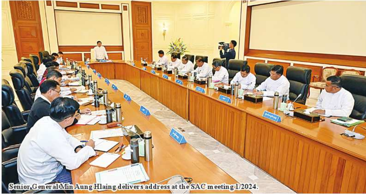
Senior General Min Aung Hlaing delivers address at the SAC meeting 1/2024.