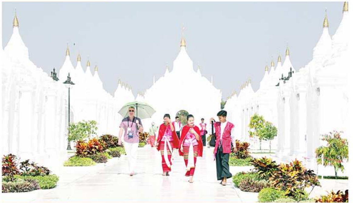
ကျောက်စာရုံစေတီများကို ကယားပြည်နယ်တိုင်းရင်းသားရိုးရာယဉ်ကျေးမှုအဖွဲ့ ကြည့်ရှုလေ့လာကြည့်ညိုစဉ်။

ပြောကြားကြပြီး မာရဝိဇယဗုဒ္ဓရုပ်ပွားတော် မြတ်ကြီး အောင်မြင်စွာတည်ထားပူဇော် နိုင်ရန် အဆင့်ဆင့်ဆောင်ရွက်ခဲ့မှုပီဒီယို မှတ်တမ်းကို ပြသသည်။ ထို့နောက် ကယားပြည်နယ်တိုင်းရင်းသား ရိုးရာယဉ်ကျေးမှုအဖွဲ့က ယခုကဲ့သို့ ရုပ်ပွား တော်မြတ်ကြီးအား အဆင်ပြေချောမွေ့စွာ လာရောက်ဖူးမြော်နိုင်ရေးအတွက် စီစဉ် ဆောင်ရွက်ပေးမှုများနှင့် ရုပ်ပွားတော်မြတ် ကြီး တည်ဆောက်ပူဇော်ခဲ့မှုလုပ်ငန်းစဉ် အဆင့်ဆင့်ကို အသေးစိတ်ရှင်းလင်း ပြောကြားပေးမှုများအပေါ် ကျေးဇူးတင် စကားများပြောကြားကြပြီး ရုပ်ပွားတော် မြတ်ကြီး အောင်မြင်စွာတည်ထားပူဇော်နိုင် ခဲ့မှုအခြေအနေနှင့်စပ်လျဉ်း၍ သိရှိလိုသည် များကိုမေးမြန်းကြရာ တာဝန်ရှိသူများက အသေးစိတ် ပြန်လည်ရှင်းလင်းပြောကြား