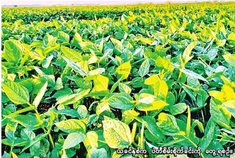
ယခင်နှစ်က ပဲတီစိမ်းစိုက်ခင်းကို တွေ့ရစဉ်။