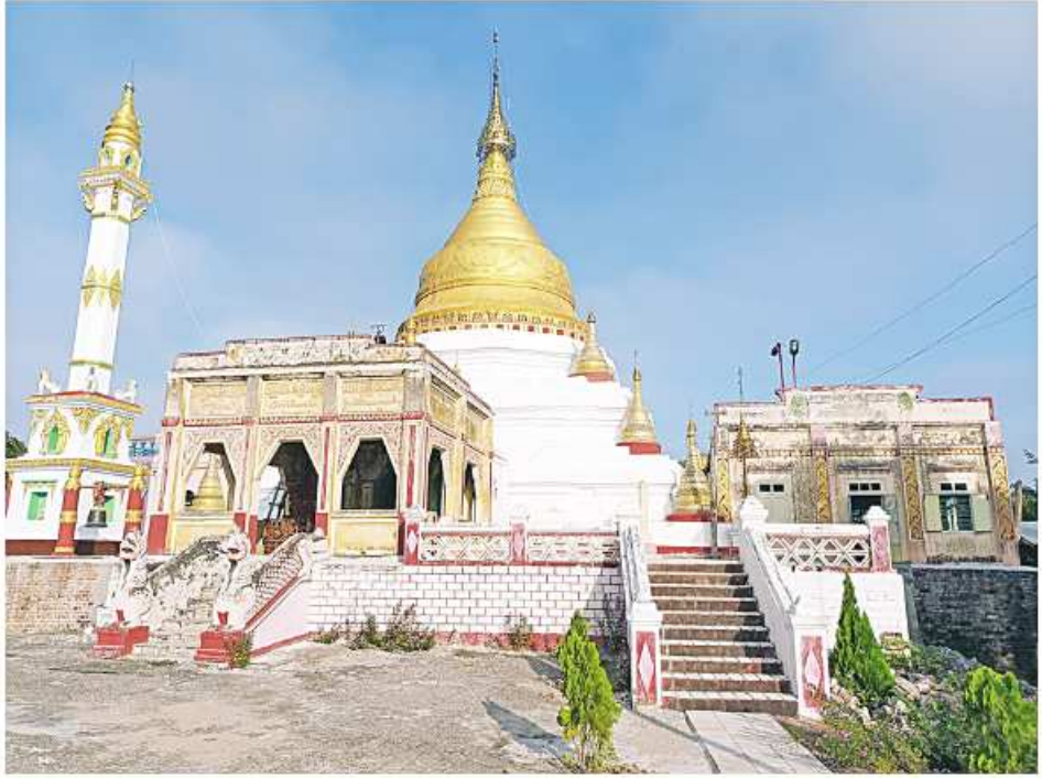
မြစ်သားမြို့နယ်ရှိ မတောင့်မတအောင်သိဒ္ဓိဆူတောင်းပြည့်စေတီတော်ကို တွေ့ရစဉ်။

တောင်ထိပ်ပေါ်မှာ ရှေးဟောင်းစေတီတော်ကြီးတစ်ဆူကို ရွှေရောင်တဝင်းဝင်းနဲ့ ဖူးမြော်မြင်တွေ့နေရတာနဲ့အတူ ရှေးကျကျအုတ်ရေပဲဆောင်ကြီးတွေ၊ တံခွန်တိုင်ကြီးတွေကိုလဲ မြင်တွေ့နေရတယ်။ စေတီတော်ကြီးရဲ့ ကျောက်စာသမိုင်းမှာ ရေးသားဖော်ပြထားချက်အရ ပုဂံပြည်ရှင် အနော်ရထာမင်းကြီးက ရှင်အရဟံမထေရ်မြတ်ရဲ့ ဩဝါဒကိုခံယူပြီး ထေရဝါဒဗုဒ္ဓသာသနာတော်ကြီး အရှည်တည်တံ့ပြန့်ပွားအောင် စွမ်းစွမ်းတပ် ဆောင်ရွက်တော်မူခဲ့တယ်။ အနော်ရထာမင်းကြီးက ကင်းတားဆည်ကြီးကိုတည်ဆောက်ပြီးတဲ့နောက် ပန်းလောင်မြစ်ကြောင်းတစ်လျှောက်နဲ့ တောင်ထိပ်တောင်ခွင် မြေပြင်တစ်လွှားမှာ ဘုရားပုထိုးစေတီ အလီလီတို့ကို တည်ထားကိုးကွယ်တော်မူခဲ့တယ်။ အဲဒီအထဲမှာ အခုမိမိတို့ရောက်ရှိနေတဲ့ မတောင့်မတ အောင်သိဒ္ဓိဆူတောင်းပြည့်စေတီတော်ကြီးလဲ တစ်ဆူအဖြစ် ပါဝင်တော်မူခဲ့တယ်။ စေတီတော်ကြီးကို စတင်တည်ထားခဲ့စဉ်အခါက အရှေ့၊ အနောက်၊ တောင်၊ မြောက် လေးဖက်လေးတန်မှာ အမိုးပြာသား စောင့်တန်းကြီးတွေနဲ့ အုတ်လှေကားတွေကိုလဲ ထည့်သွင်းတည်ဆောက်စေခဲ့တယ်ဆိုပြီး ရေးသားဖော်ပြထားသလို စေတီတော်ကြီးနဲ့အတူ စောင့်တန်းကြီးတွေက နှစ်ကာလကြာမြင့်လာတာကတစ်ကြောင်း၊ ပထမကမ္ဘာစစ်နဲ့ ဒုတိယကမ္ဘာစစ်ဒဏ်တွေကို ခံခဲ့ကြရတာကတစ်ကြောင်းကြောင့် ပျက်စီးယိုယွင်းခဲ့ကြောင်းတို့ကို ရေးသားထားတာ တွေ့ရတယ်။