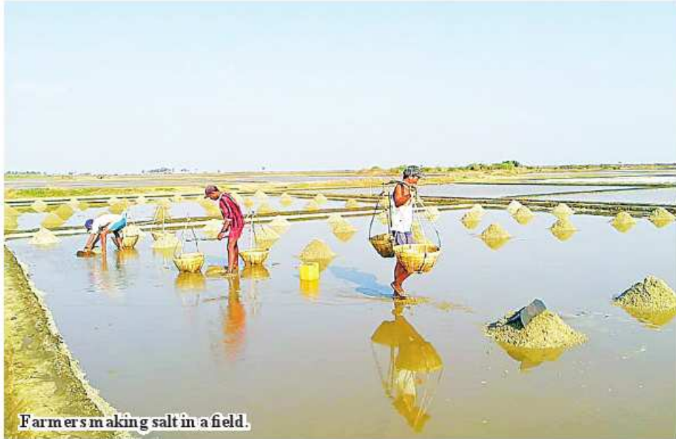
Farmers making salt in a field.

Ngaputaw February 1 A total of 350,000 visses of sun-dried salt was sent from Ngaputaw Township, Ayeyawady Region to oth-