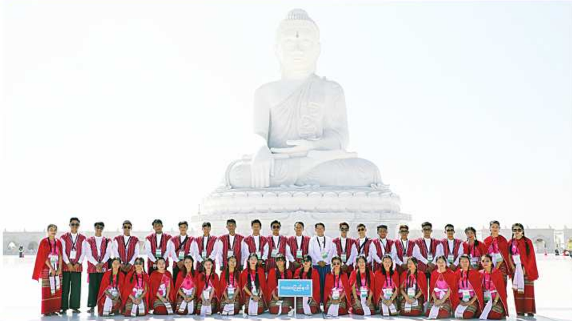
မာရဝိဇယဗုဒ္ဓရုပ်ပွားတော်မြတ်ကြီးအား ကယားပြည်နယ်တိုင်းရင်းသားရိုးရာယဉ်ကျေးမှုအဖွဲ့ ဖူးမြော်ကြည်ညိုပြီး အမှတ်တရ ဖုပေါင်းဓာတ်ပုံရိုက်စဉ်။

နေပြည်တော် ဖေဖော်ဝါရီ ၁ ကယားပြည်နယ် တိုင်းရင်းသားရိုးရာ ယဉ်ကျေးမှုအဖွဲ့စုစုပေါင်း ဦးရေ ၄၀ တို့ သည် ယနေ့နံနက်ပိုင်းတွင် ပြည်ထောင်စု နယ်မြေ နေပြည်တော် ဒေသခံရိပ်သာ နယ် ရှိ ဗုဒ္ဓဥယျာဉ် ဝတ္ထုကံတော်တွင် တည်ထား ပူဇော်သည့် ကမ္ဘာပေါ်ရှိ ထိုင်တော်မူ ကျောက်ဆစ် ဗုဒ္ဓရုပ်ပွားတော်များအနက် ဉာဏ်တော်အမြင့်ဆုံးဖြစ်သည့် မာရဝိဇယ ဗုဒ္ဓရုပ်ပွားတော်မြတ်ကြီးအား လာရောက် ဖူးမြော်ကြည်ညိုကြသည်။ ဦးစွာ ရှင်းလင်းဆောင်၍ မာရဝိဇယ ဗုဒ္ဓရုပ်ပွားတော်မြတ်ကြီး ဂေါပကအဖွဲ့နှင့် ဗုဒ္ဓရုပ်ပွားတော်မြတ်ကြီး တည်ဆောက် ပူဇော်ခြင်းနှင့် ထိန်းသိမ်းခြင်းလုပ်ငန်းများ တွင် ပါဝင်ဆောင်ရွက်ခဲ့ကြသည့် ကျွမ်းကျင် ပညာရှင်များက မာရဝိဇယဘုရားကြီး