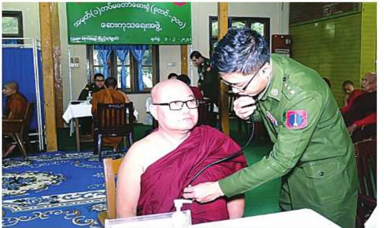
သံဃာတော်များအား မြောက်ပိုင်းတိုင်းစစ်ဌာနချုပ် နယ်လှည့်ဆေးကုသရေးအဖွဲ့က ကျန်းမာရေးစောင့်ရှောက်မှုလုပ်ငန်းများ ဆောင်ရွက်ပေးစဉ်