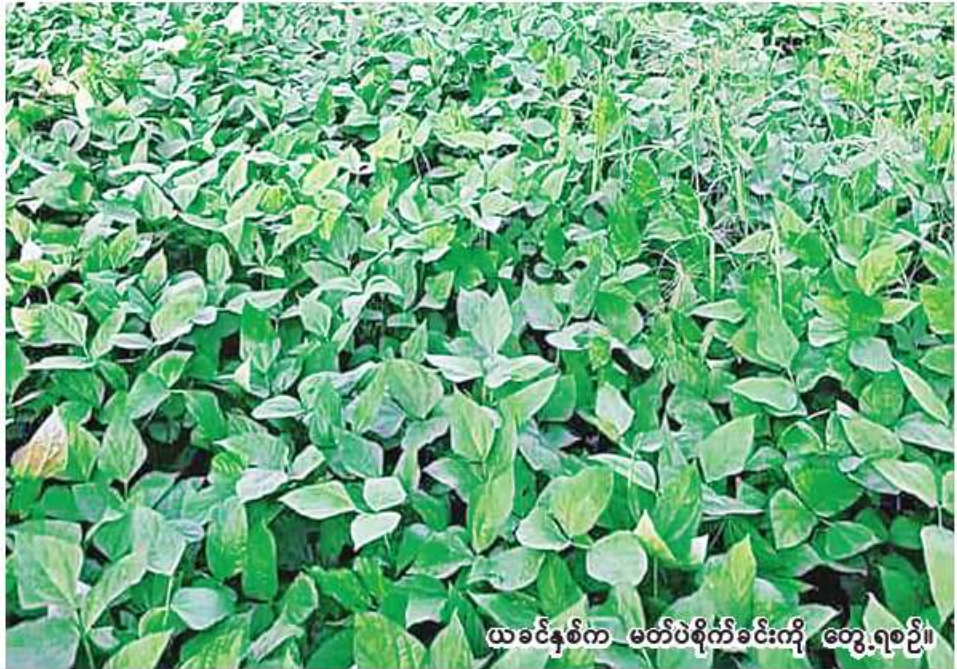
ယခင်နှစ်က မတ်ပဲစိုက်ခင်းကို တွေ့ရစဉ်။