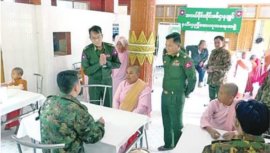
သာသနာ့နွယ်ဝင်သီလရှင်များအား အလယ်ပိုင်းတိုင်းစစ်ဌာနချုပ် နယ်မြေစံ နယ်လှည့်ဆေးကုသရေးအဖွဲ့က ကျန်းမာရေးစောင့်ရှောက်မှုလုပ်ငန်းများ ဆောင်ရွက်ပေးနေမှုကို တာဝန်ရှိသူများ ကြည့်ရှုအားပေးစဉ်။

နေပြည်တော် ၈ ဇူလိုင် ၂၄ တိုင်းဒေသကြီးနှင့်ပြည်နယ်များအတွင်းရှိ သံဃာတော်များ၊ သာသနာ့နွယ်ဝင်သီလရှင်များနှင့် ဒေသခံပြည်သူများကို သက်ဆိုင်ရာ တိုင်းစစ်ဌာနချုပ်အသီးသီးမှ နယ်လှည့်ဆေးကုသရေး အဖွဲ့များက လိုအပ်သည့် ကျန်းမာရေးစောင့်ရှောက်မှုလုပ်ငန်းများ ဆောင်ရွက်ပေးလျက်ရှိရာ ယနေ့တွင် ရန်ကုန်တိုင်းစစ်ဌာနချုပ် နယ်လှည့်ဆေးကုသရေးအဖွဲ့က ရန်ကုန်တိုင်းဒေသကြီး မော်ဘီမြို့နယ် အင်ကြင်းကျွန်းကျေးရွာအုပ်စု ကျောက်ကာကွင်းကျေးရွာနှင့် ပတ်ဝန်းကျင်ကျေးရွာများမှ သံဃာတော် သုံးပါး၊ ဒေသခံပြည်သူ ၁၇၄ ဦးတို့ကို အဆိုပါကျေးရွာရှိ အုပ်ချုပ်ရေးမှူးရုံး၌လည်းကောင်း၊ အလယ်ပိုင်းတိုင်း