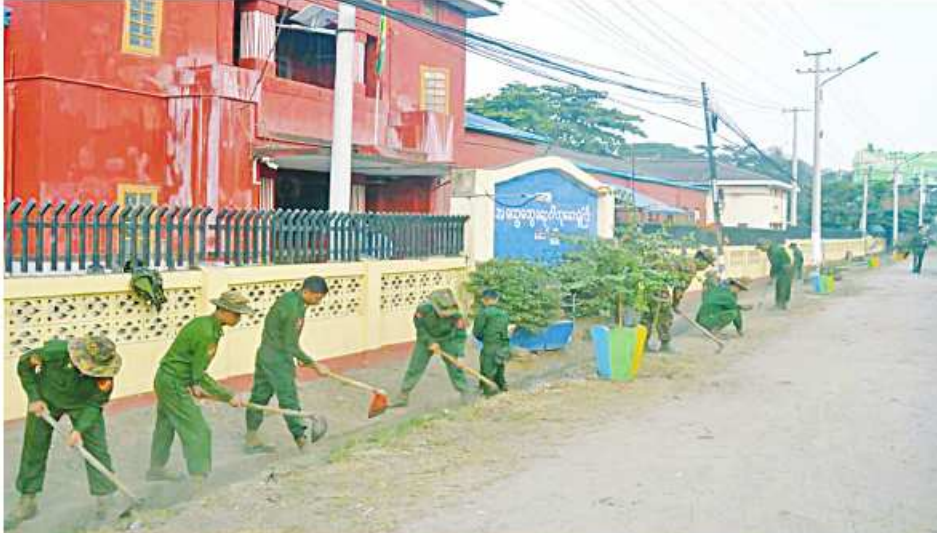
ပဲခူးတိုင်းဒေသကြီး တောင်ငူမြို့ အထွေထွေရောဂါကုဆေးရုံကြီး၌ နယ်မြေစံတပ်မတော်သားများက ရပေါင်းသန့်ရှင်းရေးဆောင်ရွက်ကြစဉ်။