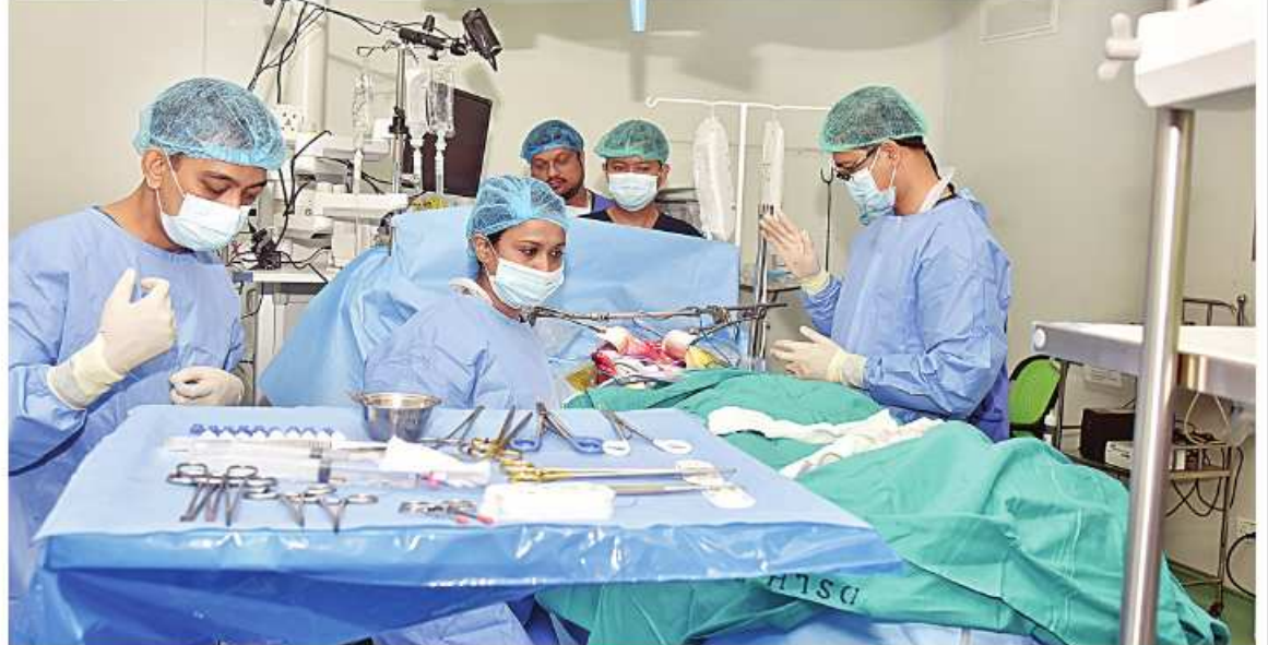
တပ်မတော်မှ အသည်းအစားထိုးခွဲစိတ်ကုသမှုအဖွဲ့နှင့် အနိယဇိုင်ဗဟိုအသည်းအစားထိုးခွဲစိတ်ကုသမှုအဖွဲ့တို့ အသည်းအစားထိုးခွဲစိတ်ကုသမှုလုပ်ငန်း ပထမနေ့ဆောင်ရွက်စဉ်။