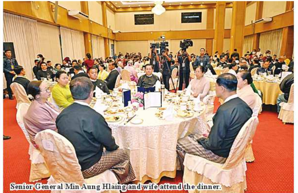
Senior General Min Aung Hlaing and wife attend the dinner.