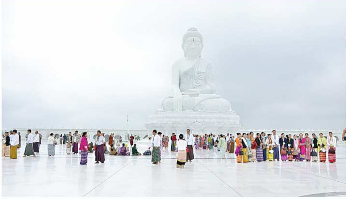
မာရဝိဇယဗုဒ္ဓရုပ်ပွားတော်မြတ်ကြီးအား ဝိဇ္ဇာနှင့်သိပ္ပံတက္ကသိုလ်များမှ ပါမောက္ခချုပ်များ၊ ပညာရေးဒီဂရီကောလိပ်များမှ ကျောင်းအုပ်ကြီးများနှင့် ပဲခူးတိုင်းဒေသကြီးမှ အငြိမ်းစားနိုင်ငံ့ဝန်ထမ်းများ ဖူးမြော်ကြည်ညိုကြစဉ်။