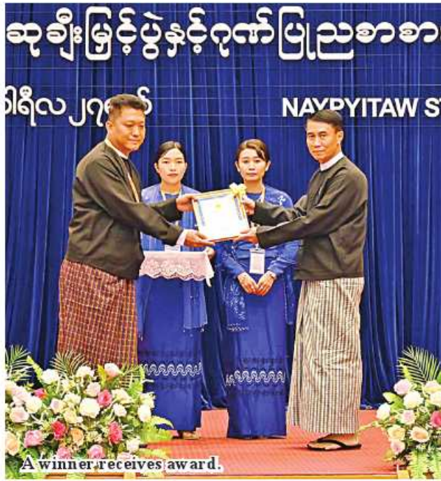
A winner receives award.