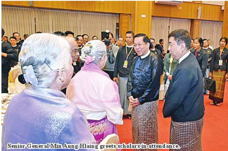
Senior General Min Aung Hlaing greets scholars in attendance.