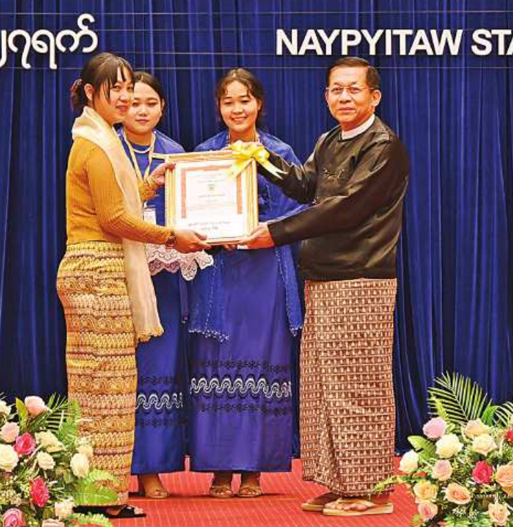
နိုင်ငံတော်စီမံအုပ်ချုပ်ရေးကောင်စီဥက္ကဋ္ဌ နိုင်ငံတော်ဝန်ကြီးချုပ် ဗိုလ်ချုပ်မှူးကြီး မင်းအောင်လှိုင် (၁၇)ကြိမ်မြောက် မြန်မာနိုင်ငံ ဝိဇ္ဇာနှင့်သိပ္ပံပညာရင်းအဖွဲ့ ဆုရရှိသူ ဒေါက်တာထက်ထက်သန်းစိန်ကို ဆုပေးအပ်ချီးမြှင့်စဉ်။