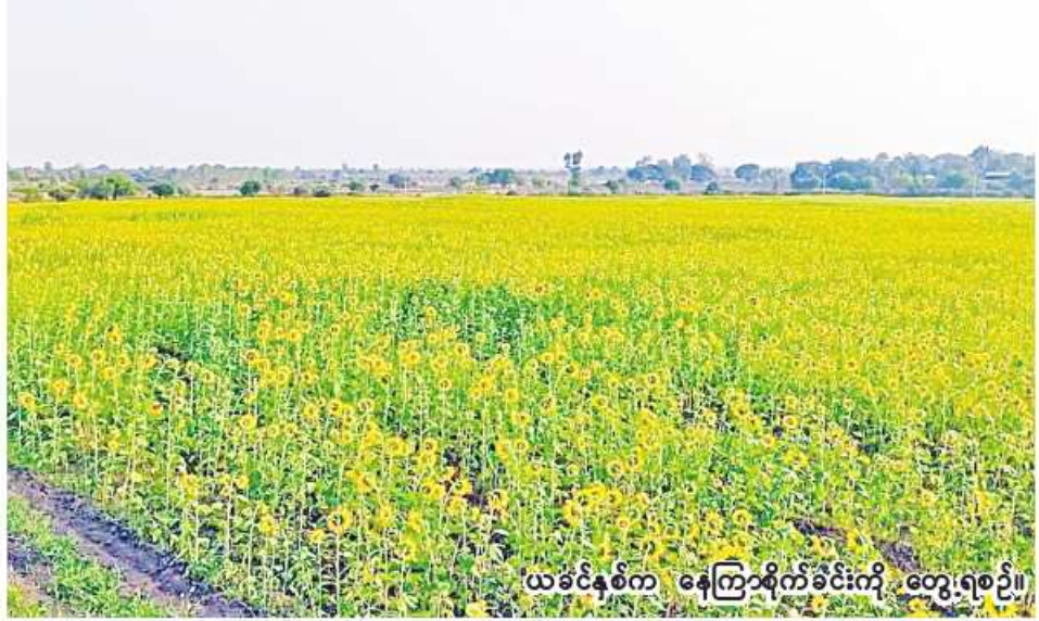
ယခင်နှစ်က နေကြာစိုက်ခင်းကို တွေ့ရစဉ်။