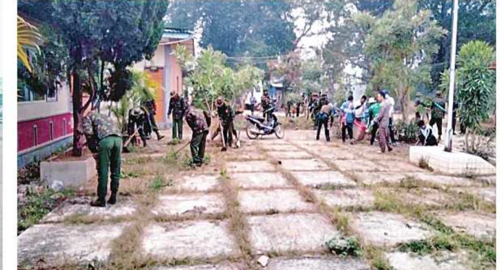
ရမ်းပြည်နယ်(အရှေ့ပိုင်း) မိုင်းတုံမြို့ပြည်သူ့ဆေးရုံ၌ နယ်မြေစံတပ်မတော်သားများက ရပေါင်းသန့်ရှင်းရေးဆောင်ရွက်ကြစဉ်။

နေပြည်တော် ဇန်နဝါရီ ၂၇ မိမိတို့၏ နေ့စဉ်လူမှုဘဝနေထိုင် ဖြတ်သန်းရာတွင် ပတ်ဝန်းကျင်သန့်ရှင်း သပ်ရပ်နေမှုသာ ကိုယ်စိတ်နှလုံးချမ်းမြေ့ ပြီးမျက်စိပသာဒဖြစ်ဖွယ်ရာ သန့်ရှင်း သာယာလှပသော မြို့ရွာ Clean City၊ Clean Village များ ဖြစ်လာမည်ဖြစ်ကာ ကျန်းမာရေးနှင့် ညီညွတ်မျှတမည်ဖြစ် သည့်အတွက် မိမိဒေသ၊ မိမိမြို့ရွာ သန့်ရှင်း သာယာရေးကို ဒေသခံများ၊ ဒေသတွင် တာဝန်ထမ်းဆောင်နေကြသည့် အုပ်ချုပ်