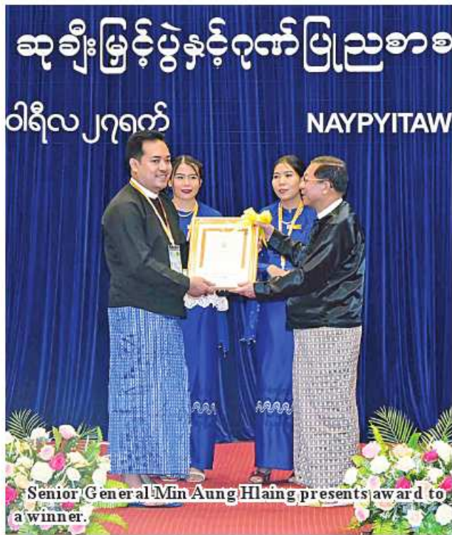
Senior General Min Aung Hlaing presents award to a winner.