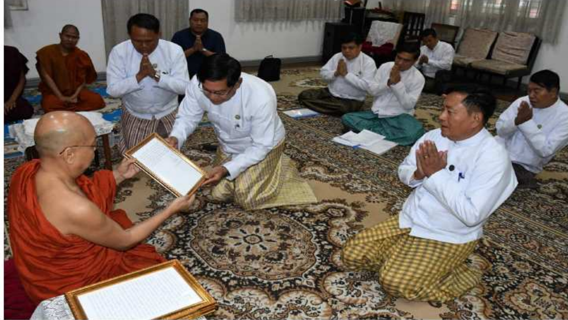
တိပိဋကဓရ တိပိဋကကောဝိဒ ဘွဲ့တံဆိပ်တော်ရရှိတော်မူသော ဆရာတော် ဘဒ္ဒန္တပညာသီရိလင်္ကာရထံ ပြည်ထောင်စုသမ္မတ မြန်မာနိုင်ငံတော် နိုင်ငံတော်စီမံအုပ်ချုပ်ရေးကောင်စီဥက္ကဋ္ဌ နိုင်ငံတော်ဝန်ကြီးချုပ် ဗိုလ်ချုပ်မှူးကြီး သတိုးမဟာသရေစည်သူ သတိုးသီရိ သုဓမ္မမင်းအောင်လှိုင်ထံမှ ဆက်ကပ်ပေးပို့မည့် ဂုဏ်ယူဝမ်းမြောက်ကြောင်းသဝဏ်လွှာကို ရန်ကုန်တိုင်းဒေသကြီးဝန်ကြီးချုပ် ဦးစိုးသိန်း ဆက်ကပ်စဉ်။

ရန်ကုန် ဇန်နဝါရီ ၂၇ (၇၆)ကြိမ်မြောက် တိပိဋကဓရ တိပိဋက ကောဝိဒ ရွေးချယ်ရေးစာမေးပွဲတွင် တိပိဋကဓရ တိပိဋကကောဝိဒ ၁၆ ပါးမြောက် ဘွဲ့တံဆိပ်တော်မြတ် ရရှိတော်မူသည့် ဆရာတော်ထံသို့ ပြည်ထောင်စုသမ္မတ မြန်မာနိုင်ငံတော် နိုင်ငံတော်စီမံအုပ်ချုပ်ရေး ကောင်စီဥက္ကဋ္ဌ နိုင်ငံတော်ဝန်ကြီးချုပ် ဗိုလ်ချုပ်မှူးကြီး သတိုးမဟာသရေစည်သူ သတိုးသီရိသုဓမ္မ မင်းအောင်လှိုင်ထံမှ ဆက်ကပ်ပေးပို့မည့် ဂုဏ်ယူဝမ်းမြောက် ကြောင်း သဝဏ်လွှာဆက်ကပ်မည့်အခမ်း အနားကို ရန်ကုန်တိုင်းဒေသကြီး ဒဂုံ မြို့နယ် မင်းကွန်းတိပိဋကနိကာယကျောင်း တွင်ကျင်းပသည်။ ရွေးဦးစွာ ရန်ကုန်တိုင်းဒေသကြီး ဝန်ကြီးချုပ် ဦးစိုးသိန်း၊ သာသနာရေးနှင့် ယဉ်ကျေးမှုဝန်ကြီးဌာန ဒုတိယဝန်ကြီး ဦးအေးထွန်း၊ တိုင်းဒေသကြီးဝန်ကြီးများက အခမ်းအနားကို နမောတဿသုံးကြိမ်ရွတ်ဆို ဘုရားတန်တော့၍ ဖွင့်လှစ်ပြီး ရန်ကုန်တိုင်း ဒေသကြီးဝန်ကြီးချုပ် ဦးစိုးသိန်းက