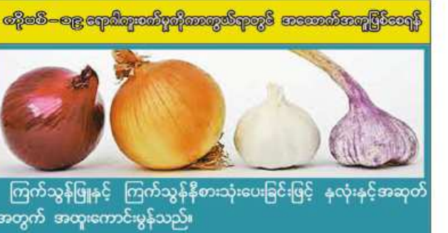
ကြက်သွန်ဖြူနှင့် ကြက်သွန်နီစားသုံးပေးခြင်းဖြင့် နှလုံးနှင့်အဆုတ်အတွက် အထူးကောင်းမွန်သည်။