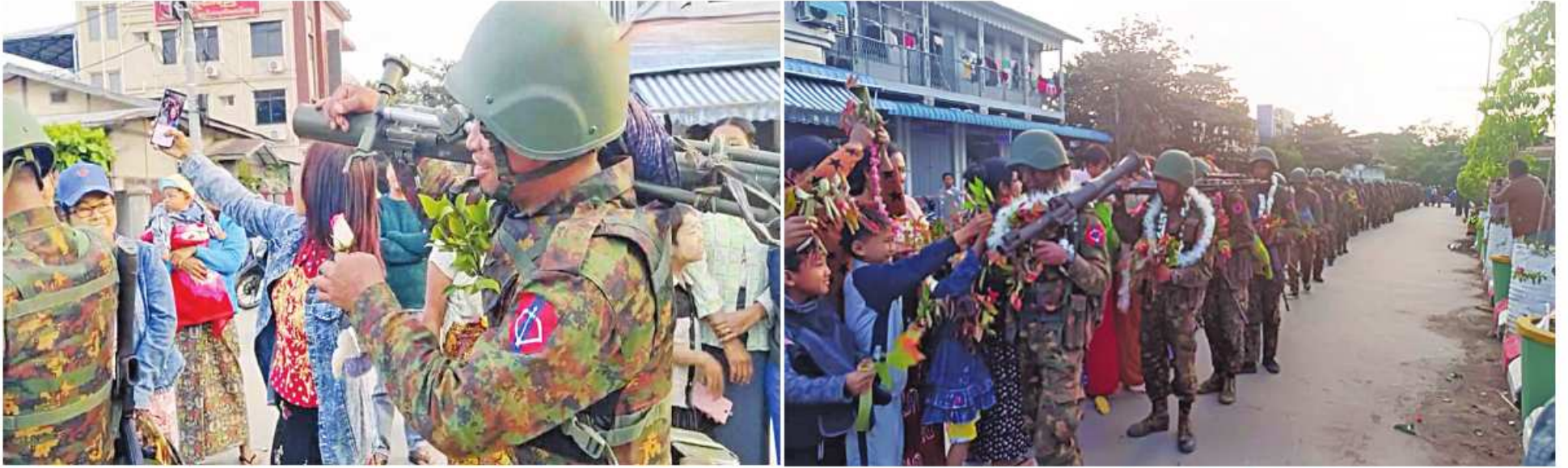
ကန့်ဘလူမြို့နယ်အတွင်း လုံခြုံရေးတာဝန်များထမ်းဆောင်နေသည့် လုံခြုံရေးတပ်ဖွဲ့ဝင်များကို ဒေသခံပြည်သူများက သောင်းသောင်းဖြဖြ ကြိုဆိုကြစဉ်။