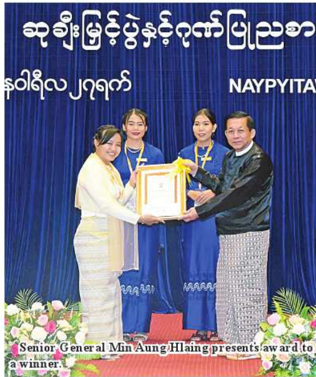
Senior General Min Aung Hlaing presents award to a winner.