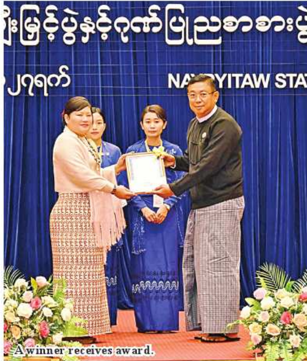
A winner receives award.