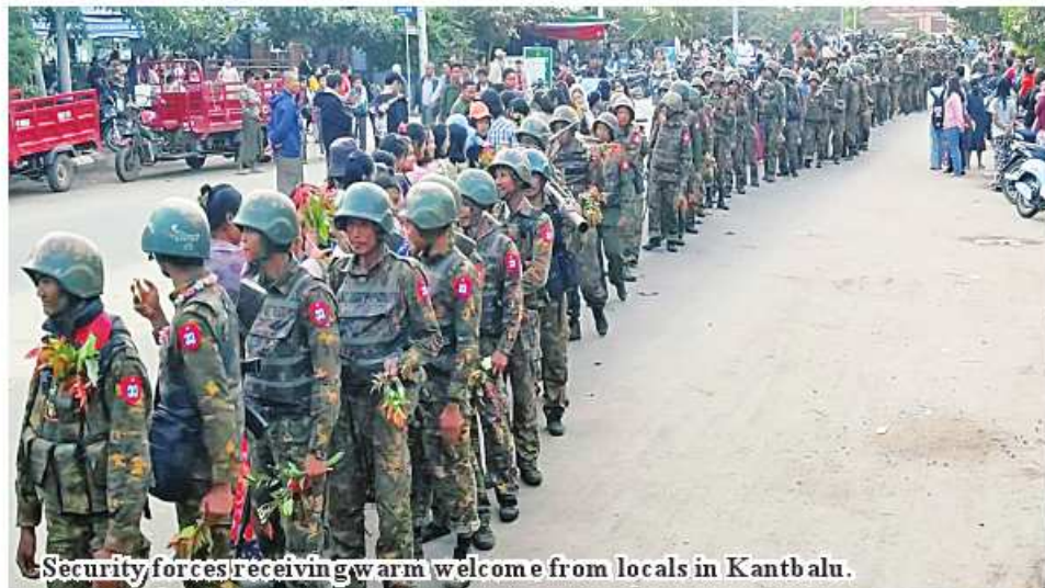
Security forces receiving warm welcome from locals in Kantbalu.