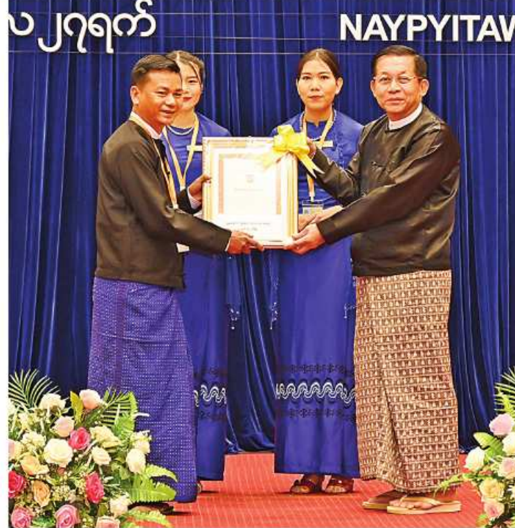
နိုင်ငံတော်စီမံအုပ်ချုပ်ရေးကောင်စီဥက္ကဋ္ဌ နိုင်ငံတော်ဝန်ကြီးချုပ် ဗိုလ်ချုပ်မှူးကြီး မင်းအောင်လှိုင် (၁၇)ကြိမ်မြောက် မြန်မာနိုင်ငံ ဝိဇ္ဇာနှင့်သိပ္ပံပညာရင်းအဖွဲ့ ဆုရရှိသူ ဒေါက်တာဇော်ဇော်သိန်းကို ဆုပေးအပ်ချီးမြှင့်စဉ်။

နေပြည်တော် ဇန်နဝါရီ ၂၃ ပညာရေးဝန်ကြီးဌာန (၂၃) ကြိမ်မြောက် ဝိဇ္ဇာနှင့်သိပ္ပံ သုတေသနညီလာခံ ဆုချီးမြှင့်ပွဲနှင့် ဂုဏ်ပြုညစာစားပွဲအခမ်းအနားကို ယနေ့ညပိုင်းတွင် နေပြည်တော်ရှိ Naypyitaw State Academy ၌ ကျင်းပပြုလုပ်ရာ နိုင်ငံတော်စီမံအုပ်ချုပ်ရေးကောင်စီဥက္ကဋ္ဌ နိုင်ငံတော်ဝန်ကြီးချုပ် ဗိုလ်ချုပ်မှူးကြီး မင်းအောင်လှိုင်နှင့် ဇနီး ဒေါ်ကြူကြူလှတို့ တက်ရောက်ချီးမြှင့်သည်။ အခမ်းအနားသို့ နိုင်ငံတော်စီမံအုပ်ချုပ်ရေးကောင်စီဥက္ကဋ္ဌ နိုင်ငံတော်ဝန်ကြီးချုပ်နှင့်ဇနီးတို့နှင့်အတူ ကောင်စီတွဲဖက်အတွင်းရေးမှူး ဒုတိယဗိုလ်ချုပ်ကြီး ရဲဝင်းဦးနှင့်ဇနီး၊ ကောင်စီအဖွဲ့ဝင်များနှင့်ဇနီးများ၊ ပြည်ထောင်စုအဆင့်ပုဂ္ဂိုလ်များ၊ ပြည်ထောင်စုဝန်ကြီးများနှင့် ဇနီးများ၊ နေပြည်တော်ကောင်စီဥက္ကဋ္ဌ၊ အဆင့်မြင့်တပ်မတော်အရာရှိကြီးများ၊ စာမျက်နှာ ၁၆ ကော်လံ ၅ ပ။