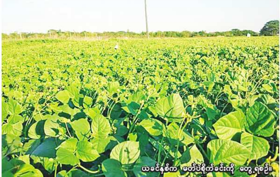
ယခင်နှစ်က မတ်ပဲစိုက်ခင်းကို တွေ့ရစဉ်။