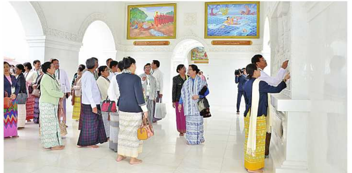
ဝိဇ္ဇာနှင့်သိပ္ပံတက္ကသိုလ်များမှ ပါမောက္ခချုပ်များ၊ ပညာရေးဒီဂရီကောလိပ်များမှ ကျောင်းအုပ်ကြီးများနှင့် ပဲခူးတိုင်းဒေသ ကြီးမှ အငြိမ်းစားနိုင်ငံ့ဝန်ထမ်းများ ဂန္ဓကုဋ်တိုက်အတွင်း ကြည့်ရှုလေ့လာကြည့်ညိုစဉ်။

ဆက်လက်၍ ဘုရားဖူးလာအဖွဲ့များသည် ဘုရားကြီး ဘက်စုံပြုပြင်မွမ်းမံရန်အတွက် အလှူငွေများပေးအပ်လှူဒါန်းကြရာ ဘုရား ဂေါပကအဖွဲ့တာဝန်ရှိသူက ဂုဏ်ပြုမှတ်တမ်း လွှာများ ပြန်လည်ပေးအပ်သည်။ ထို့နောက် ဘုရားဖူးလာအဖွဲ့များသည် မာရဝိဇယ ဗုဒ္ဓရုပ်ပွားတော်မြတ်ကြီးအား သွားရောက်ဖူးမြော်ကြည်ညိုကြပြီး ဘုရား ရင်ပြင်တော်ပတ်လည်၌စကျင်ကျောက်များ အသုံးပြု၍ တည်ဆောက်ထားသည့် ဂန္ဓကုဋ် တိုက်များအတွင်း လေ့လာကြည့်ရှုကြသည်။ ယင်းနောက် ဗုဒ္ဓဥယျာဉ်တော်အတွင်း တည်ဆောက်ထားရှိသည့် မော်ကွန်းတိုက်၌ မာရဝိဇယဗုဒ္ဓရုပ်ပွားတော်မြတ်ကြီးနှင့် ဗုဒ္ဓ ဥယျာဉ်တော်ပုံစံငယ်ပြသထားမှုဗုဒ္ဓဥယျာဉ် တော်အတွင်းကျင်းပပြုလုပ်ခဲ့သည့် မဟာ မင်္ဂလာအခမ်းအနားများတွင် အသုံးပြုခဲ့ သည့် ပစ္စည်းများ၊ ဘုရားရှင်ဓာတ်တော်၊ ရဟန္တာဓာတ်တော်များ ထည့်သွင်းပူဇော်ခဲ့ သည့်ရွှေဖလားများ၊မာရဝိဇယဆင်းတုတော် ကြီးအား အစိတ်အပိုင်း လေးပိုင်းခွဲ၍ တည်ဆောက်ထားသော ဆင်းတုတော်ပုံစံ ငယ်များမြန်မာ့ရိုးရာပန်းဆယ်မျိုးလက်ရာ ပုံစံငယ်များရုပ်ပွားတော်မြတ်ကြီးတည်ထား ပူဇော်မှုမှတ်တမ်းတင်ဓာတ်ပုံများနှင့်အခြား လေ့လာသင့်သည်များကိုလှည့်လည်ကြည့်ရှု ကြသည်။ ဆက်လက်၍ ဗုဒ္ဓဥယျာဉ်တော်အတွင်း အံ့မခန်းဗိသုကာလက်ရာများဖြင့် ခမ်းနား ထည်ဝါစွာတည်ထားပူဇော်ထားသည့်အဂ္ဂါ မိပတိသာသနာ့ဗိမာန်တော်ကြီးကျောက်စာ ရုံစေတီများနှင့်အခြားသာသနိကအဆောက် အအုံများကို ဆက်လက်ဖူးမြော်လေ့လာ ကြည့်ညိုခဲ့ကြသည်။ အလားတူ မာရဝိဇယဗုဒ္ဓရုပ်ပွားတော် မြတ်ကြီးအား အနယ်နယ်အရပ်ရပ်မှရဟန်း ရှင်လူဘုရားဖူးပြည်သူများလည်းလာရောက် ဖူးမြော်ကြည့်ညိုလျက်ရှိကြောင်း သိရှိ ရသည်။ ယနေ့တွင် မာရဝိဇယဗုဒ္ဓရုပ်ပွားတော် မြတ်ကြီးအား လာရောက်ဖူးမြော်ခဲ့ကြသည့် ဝိဇ္ဇာနှင့်သိပ္ပံတက္ကသိုလ်များမှ ပါမောက္ခချုပ် များ၊ ပညာရေးဒီဂရီကောလိပ်များမှ ကျောင်းအုပ်ကြီးများနှင့် ပဲခူးတိုင်းဒေသ