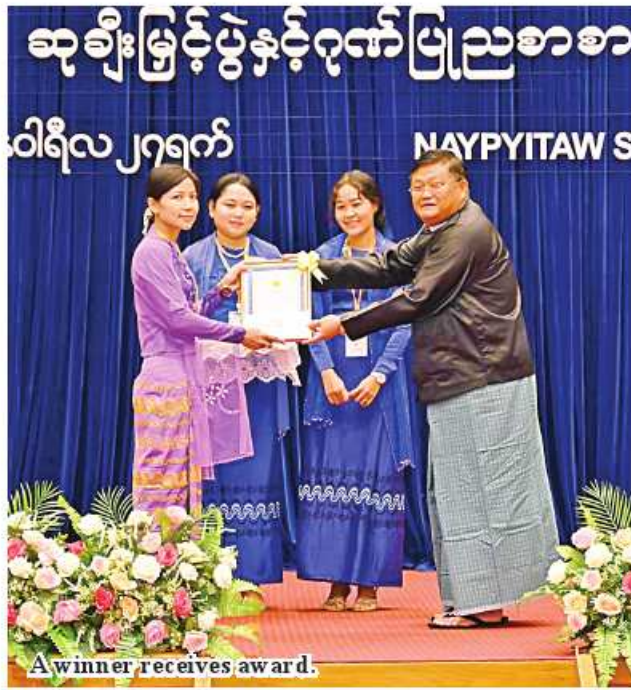
A winner receives award.