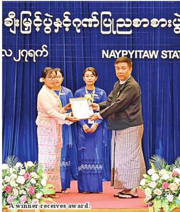
A winner receives award.