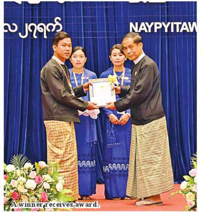
A winner receives award.