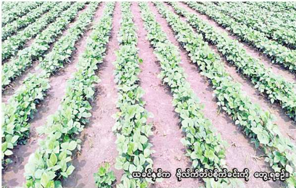
ယခင်နှစ်က ဝိုက်ကိတ်ပဲစိုက်ခင်းကို တွေ့ရစဉ်။

ပုသိမ် ဇန်နဝါရီ ၂၇ ဧရာဝတီတိုင်းဒေသကြီး ပုသိမ်ခရိုင် ကန်ကြီးထောင့်မြို့နယ်တွင် ဆောင်းသီးနှံစိုက်ပျိုးရာသီ၌ ဝိုက်ကိတ်ပဲကေ ၁၁၇၀ စိုက်ပျိုးပြီးစီးပြီဖြစ်ကြောင်း ပုသိမ်ခရိုင် စိုက်ပျိုးရေးဦးစီးဌာန ဦးစီးမှူး ဦးဝင်းစိုးက