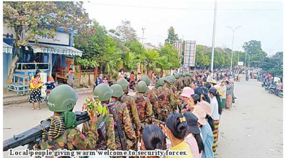
Local people giving warm welcome to security forces.

Nay Pyi Taw January 27 - Armed insurgents and so-called PDFs terrorists have torched state-owned buildings, detained and killed residents who did not support them by accusing them of being inform-