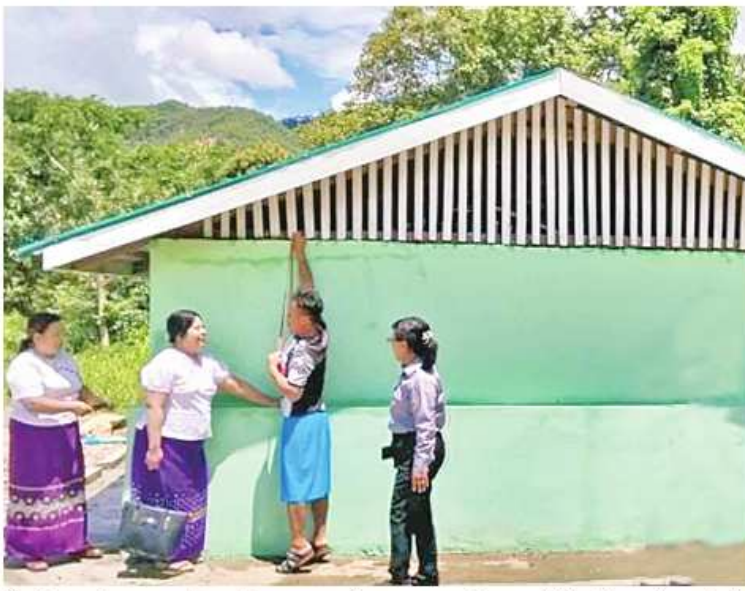
ဦးနှင့် ကျွဲ၊ နွားတိရစ္ဆာန်များအတွက် ကျေးလက်ဒေသဖွံ့ဖြိုးတိုးတက်ရေးဦးစီးဌာနမှ သိရသည်။ မိုင်းတုံမြို့နယ် ကျေးလက်ဒေသဖွံ့ဖြိုးတိုးတက်ရေးဦးစီးဌာနမှ သိရသည်။ ဦးနှင့် ကျွဲ၊ နွားတိရစ္ဆာန်များအတွက် ကျေးလက်ဒေသဖွံ့ဖြိုးတိုးတက်ရေးဦးစီးဌာနမှ သိရသည်။ မိုင်းတုံမြို့နယ် ကျေးလက်ဒေသဖွံ့ဖြိုးတိုးတက်ရေးဦးစီးဌာနမှ သိရသည်။

ရေစုကန်တည်ဆောက်ခြင်းနှင့် အလျား ၂၅ ပေ၊ အနံ သုံးပေ၊ အမြင့် ငါးပေရှိ ကျောက်စီရေတားတံစည်ဆောက်ခြင်း လုပ်ငန်းများကို ၂၀၂၃-၂၀၂၄ ဘဏ္ဍာနှစ် ပြည်ထောင်စုခွင့်ပြုရန်ပုံငွေကျပ် ၅၉ ဒသမ ၄၁၂ သန်းဖြင့် တင်ဒါအောင်မြင်သည့် ချမ်းသာသူကုမ္ပဏီက ၂၀၂၃ ခုနှစ် ဇွန်လ စတင်ဆောင်ရွက်ခဲ့ရာ ယခုအခါ လုပ်ငန်းများ ရာနှုန်းပြည့်ပြီးစီးပြီဖြစ်ကြောင်း သိရသည်။ အဆိုပါ စီမံခန့်ခွဲရေးသွယ်တန်းခြင်းနှင့်ဆက်စပ်လုပ်ငန်းများ ရာနှုန်းပြည့်ဆောင်ရွက်ပြီးစီးမှုကြောင့် မိုးထရွာသစ်ကျေးရွာရှိ အိမ်ခြေ ၀၁၂ အိမ်မှ လူ ၅၂၃