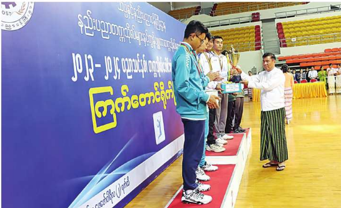
နှင့် ပြိုင်ပွဲဝင်အားကစားသမားများ ကြည့်ရှုအနားကို ဆက်လက်ကျင်းပရာ အမျိုးသမီးပထမဆုကို ကျိုင်းတုံရန်တို့က ရရှိကြရာ မှားကို ရင်းရင်းနှီးနှီး နှုတ်ဆက်အားပေးစကားပြောကြားခဲ့ကြောင်း သတင်းရရှိသည်။ (သတင်းစဉ်)

ယနေ့ Indoor Stadium (C) ရုံတွင် ကြက်တောင်ပြိုင်ပွဲ တတိယနေရာနှင့် ဝိုင်းလှပွဲ ပွဲစဉ်များကိုကျင်းပရာ ပြိုင်ပွဲယှဉ်ပြိုင်ကစားနေမှုများကို သိပ္ပံနှင့်နည်းပညာဝန်ကြီးဌာန ပြည်ထောင်စုဝန်ကြီး ဒေါက်တာမျိုးသိန်းကျော်၊ ဒုတိယဝန်ကြီးဒေါက်တာအောင်လေးယု၊ ညွှန်ကြားရေးမှူးချုပ်များနှင့် တာဝန်ရှိသူများ၊ ပြိုင်ပွဲကျင်းပရေးဦးစီးကော်မတီဝင်များ၊ အုပ်ချုပ်သူ၊ နည်းပြများ