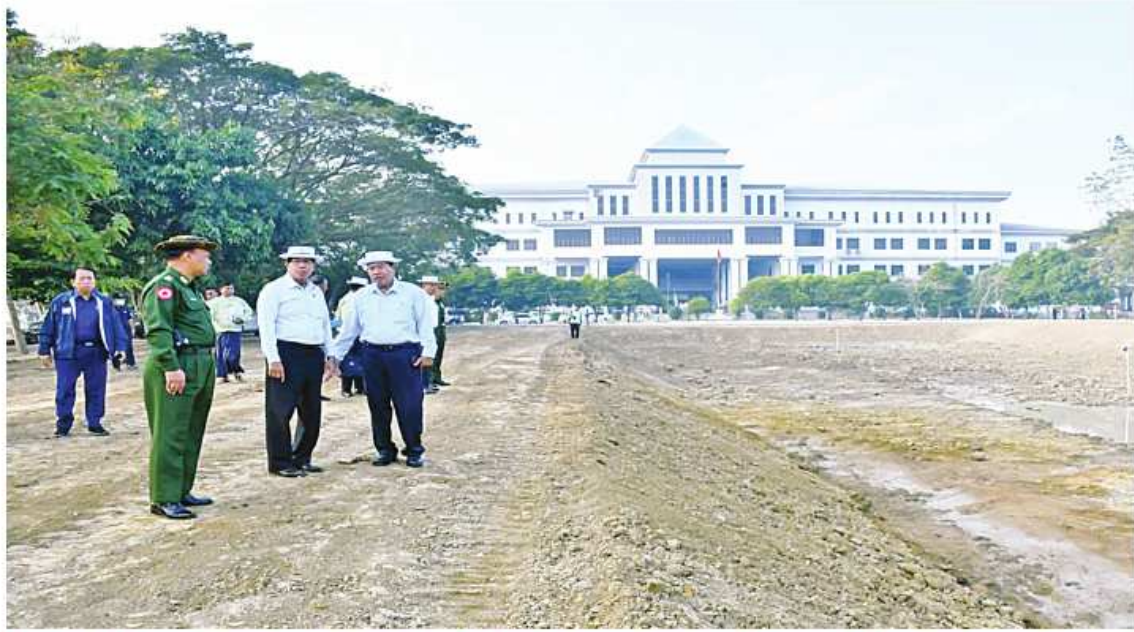
ရန်ကုန်တိုင်းဒေသကြီးဝန်ကြီးချုပ် ဦးစိုးသိန်း၊ ရန်ကုန်တိုင်းစစ်ဌာနချုပ် တိုင်းမှူး ဗိုလ်ချုပ်ဇော်ဟိန်းတို့ တိုင်းဒေသကြီးအတွင်း ဒေသပွံ့ပြုံးရေးလုပ်ငန်းများ ဆောင်ရွက်နေမှုကို ကြည့်ရှုစစ်ဆေးစဉ်။

နေပြည်တော် ဇန်နဝါရီ ၂၄ ရန်ကုန်တိုင်းဒေသကြီးအတွင်း သန့်ရှင်းသာယာလှပရေးအတွက် စီစဉ်ဆောင်ရွက်နေမှုများကို ယနေ့မနက် ၈ နာရီခန့်တွင် ရန်ကုန်တိုင်းဒေသကြီး ဝန်ကြီးချုပ် ဦးစိုးသိန်း၊ ရန်ကုန်တိုင်းစစ်ဌာနချုပ် တိုင်းမှူး ဗိုလ်ချုပ်ဇော်ဟိန်းနှင့် တာဝန်ရှိသူများက သွားရောက်ကြည့်ရှုစစ်ဆေးကြသည်။ ဦးစွာ တိုင်းဒေသကြီး ဝန်ကြီးချုပ်၊ တိုင်းမှူးနှင့် တာဝန်ရှိသူများသည် လှိုင်သာယာ(အရှေ့ပိုင်း)မြို့နယ်(၃)ရပ်ကွက်နှင့် (၅)ရပ်ကွက်အကြား တပင်ရွှေထီးလမ်းဖြတ် သာယာကုန်းချောင်းနှင့် ရန်ကုန်-ညောင်တုန်းလမ်း ရေစုကန်ရေမြောင်းမှ သာယာကုန်း ချောင်းတံတားများသို့ သွားရောက်၍ ရေစီးရေလာအခြေအနေကို ကြည့်ရှုစစ်ဆေးပြီး ရန်ကုန်-ညောင်တုန်းလမ်း ရေစုကန်ရေမြောင်းမှ သာယာကုန်းချောင်းသို့ ဆက်လက် စီးဆင်းရာတွင် ပိတ်ဆို့မှုမရှိစေရေး ချောင်းကို စက်ယန္တရားများဖြင့် တူးဖော်ဆယ်ယူရှင်းလင်းရန်၊ ရေစုကန်ရေမြောင်းနှင့် သာယာကုန်းချောင်းအကြား ရေမြောင်းအတွင်း ပိတ်ဆို့အပိုက်များ ရှင်းလင်းရန်၊ ချောင်း ဝဲယာမြက်ပင်ချွန်များ ရှင်းလင်းရန်တို့ကိုမှာကြားပြီး လိုအပ်သည်များ