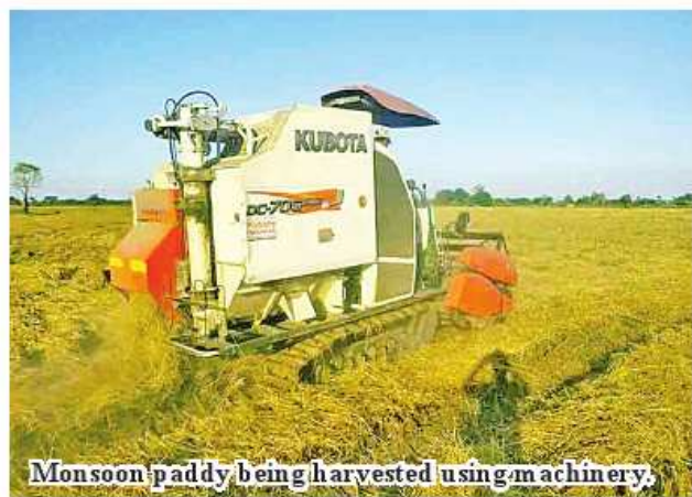
Monsoon paddy being harvested using machinery.