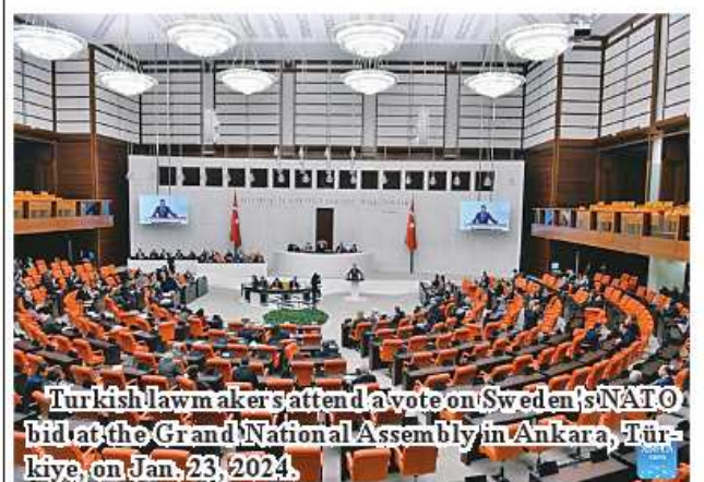
Turkish lawmakers attend a vote on Sweden's NATO bid at the Grand National Assembly in Ankara, Türkiye, on Jan. 23, 2024.

kokku flow into Mandalay market on a daily basis. Apart from onions from Myingyan, the stocks from Monywa, Myittha and Pa-