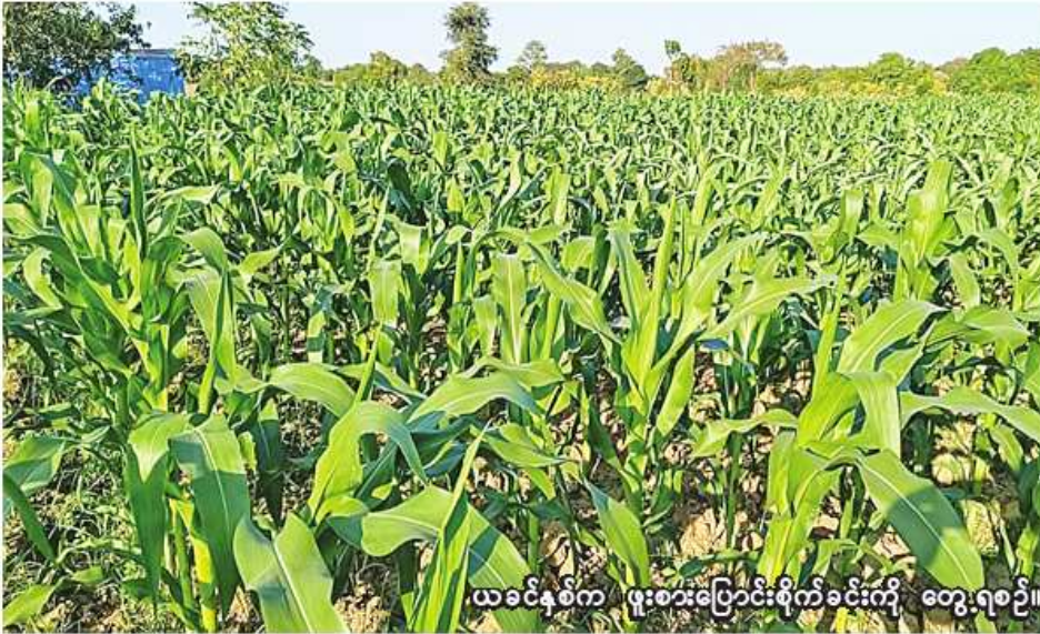
ယခင်နှစ်က ဖူးစားပြောင်းစိုက်ခင်းကို တွေ့ရစဉ်။

စစ်ကိုင်း ဇန်နဝါရီ ၂၄ စစ်ကိုင်းတိုင်းဒေသကြီး စစ်ကိုင်းခရိုင် မြင်းမူမြို့နယ်တွင် ဆောင်းသီးနှံ စိုက်ပျိုးရာသီ၌ အစေ့ထုတ်ပြောင်းနှင့် ဖူးစား ပြောင်း ၇၉၂၅ ဧက စိုက်ပျိုးပြီးစီး