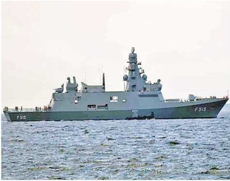
တူကီယိုရေတပ်သည် ၎င်း၏ ရေကြောင်းရေးမစ်ရှင်များကို တိုးမြှင့်လုပ်ဆောင်နိုင်ရန်အတွက် ပထမဆုံးပင်လယ်ပြင်မောင်းဒရုန်းအတွက် ပထမဆုံးပင်လယ်ပြင်မောင်း

ဒရုန်း၊ ပြည်တွင်းထုတ်စစ်သင်္ဘောများကို လက်ခံရရှိခဲ့ကြောင်း The Defense Post သတင်းဌာနက ဇန်နဝါရီ ၂၂ ရက်တွင် ရေးသားဖော်ပြခဲ့သည်။