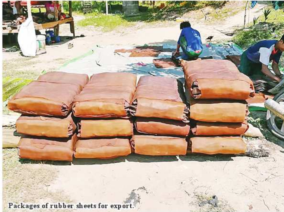
Packages of rubber sheets for export.

Nay Pyi Taw January 24 More than 15,000 tonnes of rubber worth more than US$20 million was exported in December, 2023, according to the Ministry of Commerce. Myanmar's rubber is being exported and sold to foreign customer markets every month via maritime trade routes and border trade routes. In December last year,