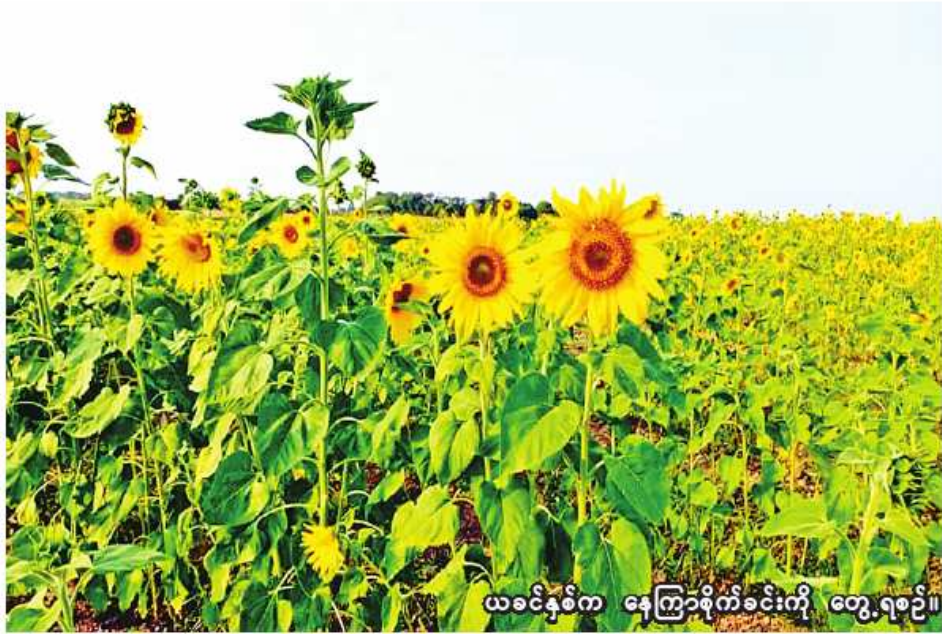
ယခင်နှစ်က နေကြာစိုက်ခင်းကို တွေ့ရစဉ်။