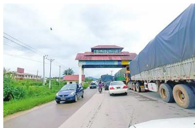
Photo shows the archway of Myawady border trade zone.

Likewise, the value in December 2023 was less than the same period of 2022. In December of 2022-24 financial year, export value reached US$36.771 million and import, US$60.936 million.