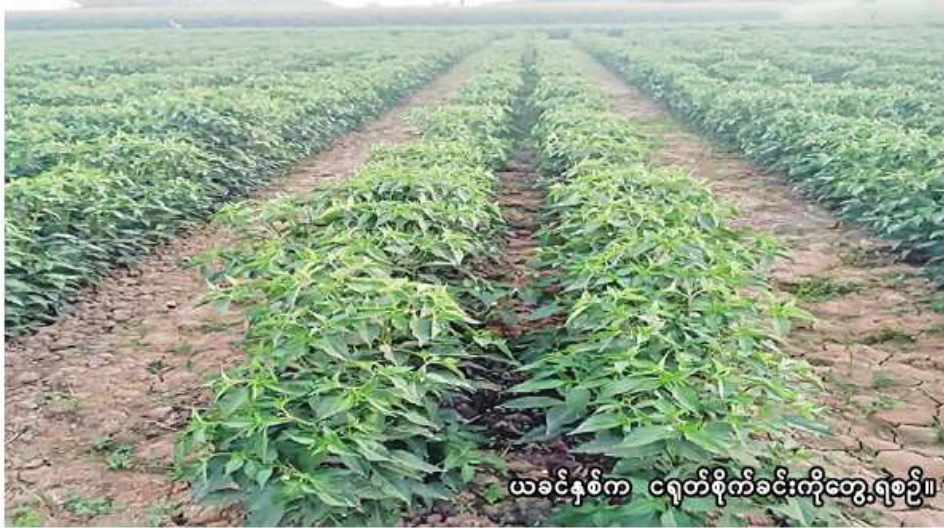
ယခင်နှစ်က ငရုတ်စိုက်ခင်းကိုတွေ့ရစဉ်။

ချောင်းဦး ဇန်နဝါရီ ၂၄ စစ်ကိုင်းတိုင်းဒေသကြီး မုံရွာခရိုင် ချောင်းဦးမြို့နယ်တွင် ဆောင်းသီးနှံစိုက်ပျိုးရာသီ၌ စားဖိုဆောင်သီးနှံ ၁၇၀၉ ဧက စိုက်ပျိုးပြီးစီးပြီဖြစ်ကြောင်း ချောင်းဦးမြို့နယ် စိုက်ပျိုးရေးဦးစီးဌာနမှ သိရသည်။ ဆောင်းသီးနှံ စိုက်ပျိုးရာသီ၌ ချောင်းဦးမြို့နယ်တွင် စားဖိုဆောင်သီးနှံ ဧက ၁၅၅၀ စိုက်ပျိုးရန် လျာထားပြီး ၂၀၂၃ခုနှစ် အောက်