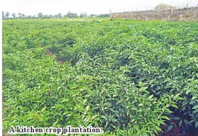
A kitchen crop plantation.

In 2022-23 financial year, the township cultivated 4,193 acres of onions from October to December 2022. 206