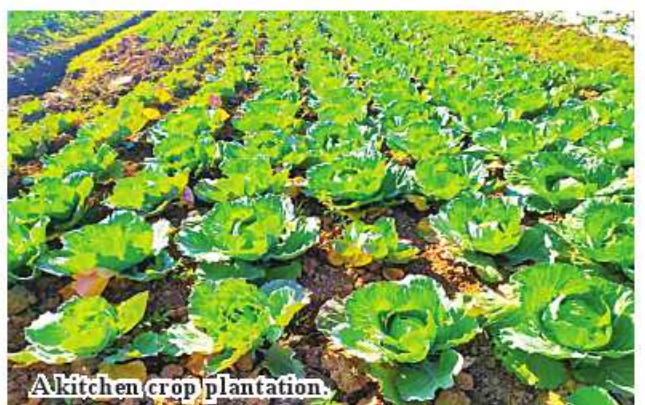
A kitchen crop plantation.