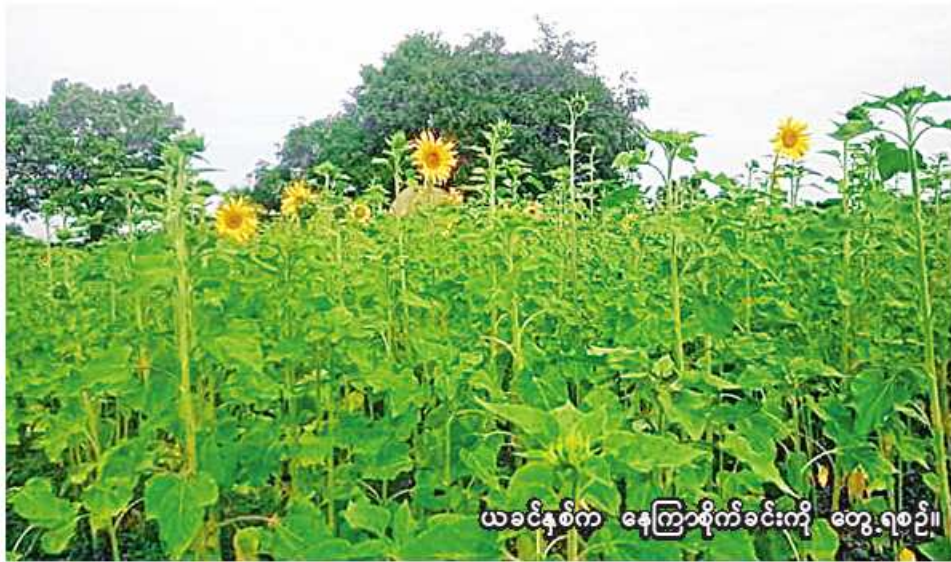
ယခင်နှစ်က နေကြာစိုက်ခင်းကို တွေ့ရစဉ်။