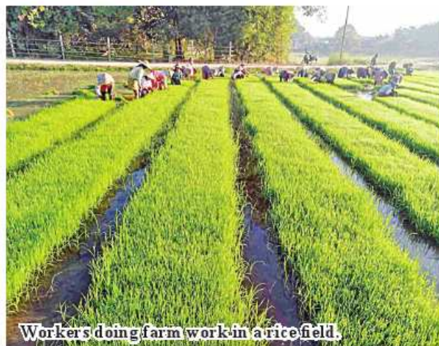
Workers doing farm work in a rice field.

to farmers of more than 11,000 acres of summer paddy in 26 townships of Ayeyawady Region. Such