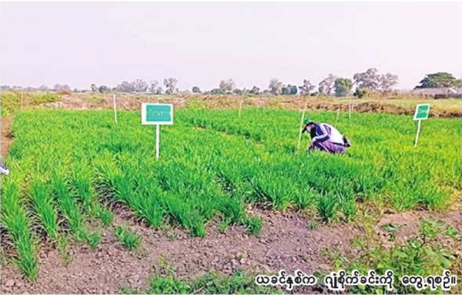
ယခင်နှစ်က ဂျုံစိုက်ခင်းကို တွေ့ရစဉ်။

ခရိုင်၊ စစ်ကိုင်းခရိုင်နှင့် ကသာ ခရိုင်၌ ဂျုံသီးနှံစိုက်ပျိုးပြီး စစ်ကိုင်း ခရိုင်နှင့် မုံရွာခရိုင်တွင် ဂျုံသီးနှံကို အများဆုံးစိုက်ပျိုးကြောင်း၊ ဂျုံစိုက် ပျိုးမှုအနေဖြင့် ဂျုံတစ်ဧကလျှင် ကုန်ကျစရိတ်မှာ ငွေကျပ် သုံးသိန်း ခန့်ရှိပြီး ဂျုံတစ်ဧက စိုက်ပျိုး ပါက ၂၁ တင်း ထွက်ရှိကြောင်း သိရသည်။ (၂၀၆)