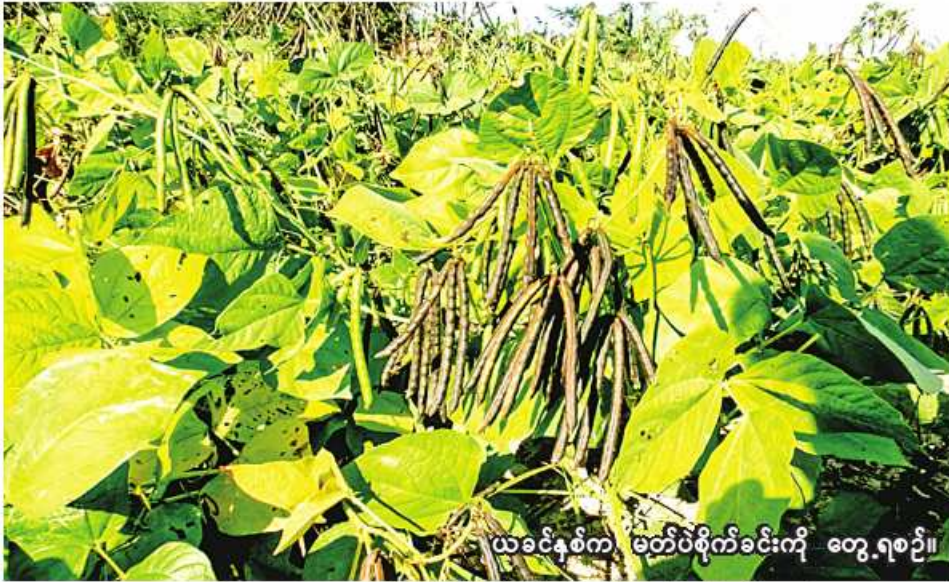
ယခင်နှစ်က မတ်ပဲစိုက်ခင်းကို တွေ့ရစဉ်။