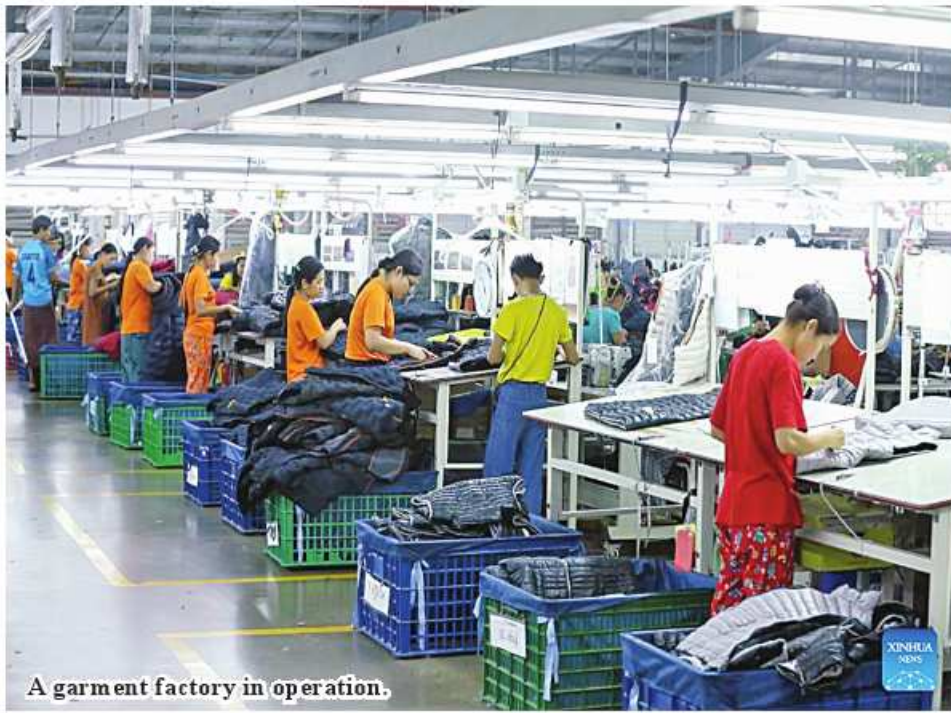
A garment factory in operation.

Nay Pyi Taw January 19 The Trade Department under the Ministry of Commerce stated that Myanmar has earned US$7 billion in export of finished industrial products from 1 April to 31 December of 2023-24 financial year.