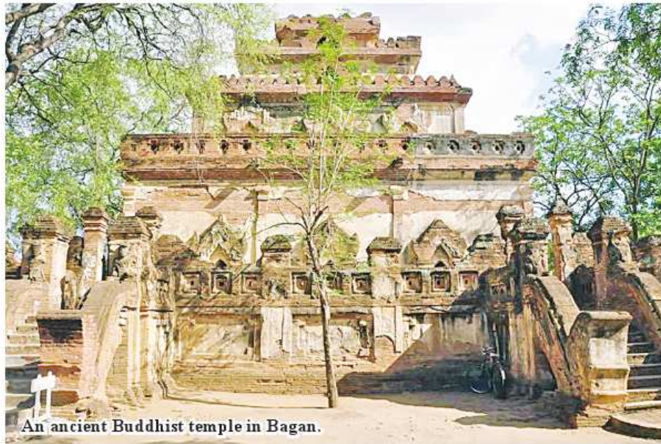
An ancient Buddhist temple in Bagan.

Bagan January 19 The Department of Archaeology and National Museum (Bagan Branch) stated that plans are underway to complete renovation of ancient religious edifices in Bagan ancient cultural zone without losing original