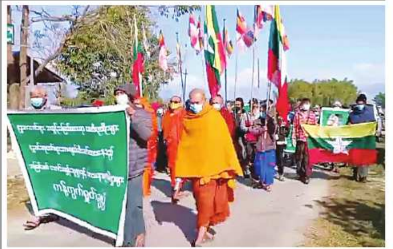
ဘုရားစေတီပုထိုးများနှင့် ဘာသာရေးဆိုင်ရာအဆောက်အအုံများကို ဖျက်ဆီးမှုအပေါ် ပူတာအိုမြို့၌ ကန့်ကွက်ရှုတ်ချပွဲပြုလုပ်စဉ်။