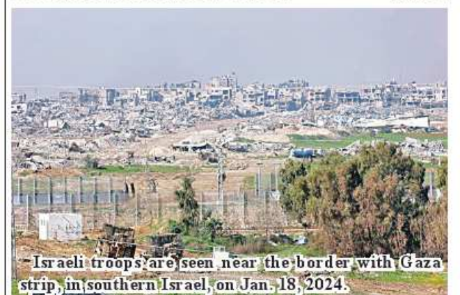
Israeli troops are seen near the border with Gaza strip, in southern Israel, on Jan. 18, 2024.

According to the Gaza-based Health Ministry on Thursday, the Palestinian death toll from the ongoing Israeli attacks on the strip has risen to 24,620. Xinhua