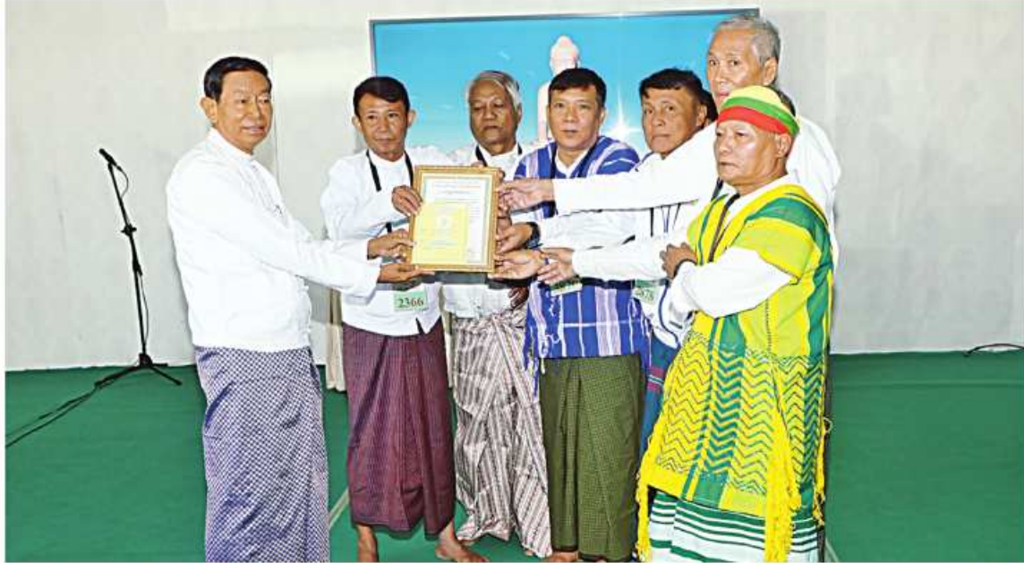
မာရဝိဇယဗုဒ္ဓရုပ်ပွားတော်မြတ်ကြီး ဘက်စုံပြုပြင်မွမ်းမံရန်အတွက် ကရင်ပြည်နယ်အတွင်းရှိ ဘုရားစေတီများမှ ဘဏ္ဍာတော်ထိန်း ဂေါပကအဖွဲ့ဝင်များက အလှူငွေများ ပေးအပ်လှူဒါန်းရာ တာဝန်ရှိသူတစ်ဦးက ဂုဏ်ပြုမှတ်တမ်းလွှာပြန်လည်ပေးအပ်စဉ်။

အပေါ် ကျေးဇူးတင်စကားများပြောကြား ကြသည်။ ယင်းနောက် ဘုရားဖူးလာဂေါပက အဖွဲ့ဝင်များက ရုပ်ပွားတော်မြတ်ကြီး အောင်မြင်စွာ တည်ထားပူဇော်နိုင်ခဲ့မှု အခြေအနေနှင့်စပ်လျဉ်း၍ သိရှိလိုသည် များကို မေးမြန်းကြရာ တာဝန်ရှိသူများ က အသေးစိတ် ပြန်လည်ရှင်းလင်း မြေကြားသည်။