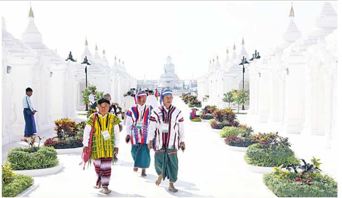
ကရင်ပြည်နယ်အတွင်းရှိ ဘုရားစေတီများမှ ဘဏ္ဍာတော်ထိန်းဂေါပကအဖွဲ့ဝင်များ ကျောက်စာရုံစေတီများကို လှည့်လည် ကြည့်ညိဉ်း

“ကရင်ပြည်နယ်က ဂေါပကအဖွဲ့တွေကို စုစည်းပြီး မာရဝိဇယဘုရားကြီးကို လာရောက်ဖူးမြော်ပို့အတွက် ဂေါပက အဖွဲ့ စုစုပေါင်း ၄၈ ဦးကို ဦးဆောင်ပြီး ကရင်ပြည်နယ်က လာရောက်ခဲ့တာပါ။ အခုလိုလာရောက်ရတာကတော့ အမျိုးသား ရေးစိတ်ဓာတ် ပိုမိုနိုးကြားတက်ကြွစေပို့၊ လက်မှုလက်ရာတွေဖြစ်တဲ့ မြန်မာယဉ်ကျေး မှုလက်ရာတွေကိုလေ့လာနိုင်စေဖို့ ရည်ရွယ် ပြီး လာရောက်ခဲ့တာပါ။ ကျွန်တော့်အနေ နဲ့ကတော့ ဒါပထမဆုံးလာရောက်ဖူးမြော်ရ တာပါ။ အချိန်တိုအတွင်းမှာ စကျင်ကျောက် တုံးကြီးကို ကမ္ဘာ့အကြီးဆုံး ဉာဏ်တော်