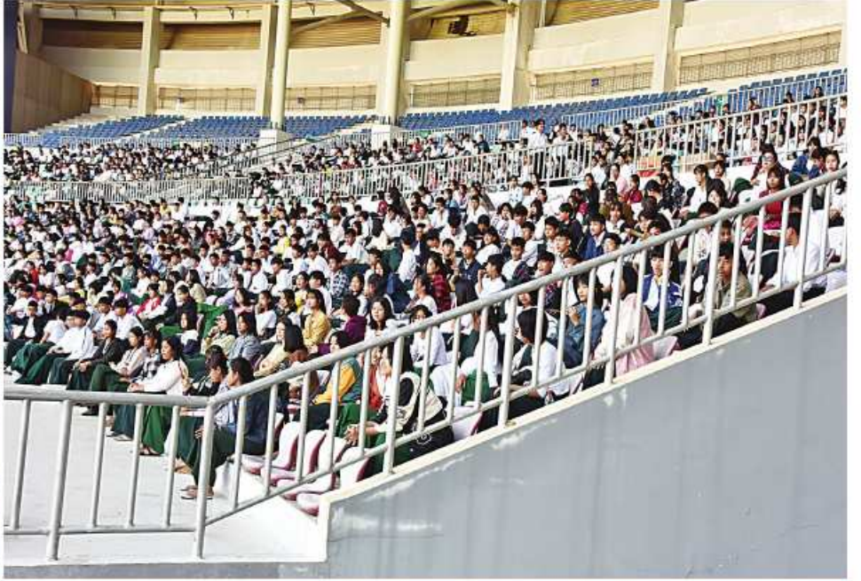
၂၀၂၃-၂၀၂၄ ပညာသင်နှစ် ပညာရေးဝန်ကြီးဌာန တက္ကသိုလ်ပေါင်းစုံဘောလုံးပြိုင်ပွဲ ဗိုလ်လုပွဲသို့ လာရောက်ကြည့်ရှုအားပေးကြသည့် ပရိသတ်များကို တွေ့ရစဉ်။