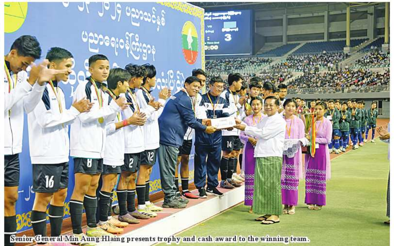
Senior General Min Aung Hlaing presents trophy and cash award to the winning team.

At the prize-presentation ceremony, best goalkeeper award, best defender award, best midfielder award, best striker award, and play-top scorer award, and trophy-winner Mawlamyine zone team.