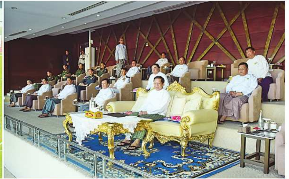
နိုင်ငံတော်စီမံအုပ်ချုပ်ရေးကောင်စီဥက္ကဋ္ဌ နိုင်ငံတော်ဝန်ကြီးချုပ် ဗိုလ်ချုပ်မှူးကြီးမင်းအောင်လှိုင်နှင့် တက်ရောက်လာကြသူများ ၂၀၂၃-၂၀၂၄ ပညာသင်နှစ် ပညာရေးဝန်ကြီးဌာန တက္ကသိုလ်ပေါင်းစုံဘောလုံး ဖြိုင်ပွဲ၏ နောက်ဆုံးပိုင်းလှုပ်အဖြစ် မော်လမြိုင်ဇုန်အသင်းနှင့် မြစ်ကြီးနားဇုန်အသင်းတို့ ယှဉ်ပြိုင်ကစားမှုကို ကြည့်ရှုအားပေးစဉ်။