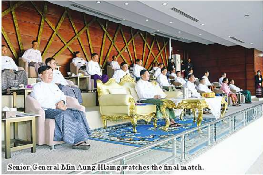
Senior General Min Aung Hlaing watches the final match.