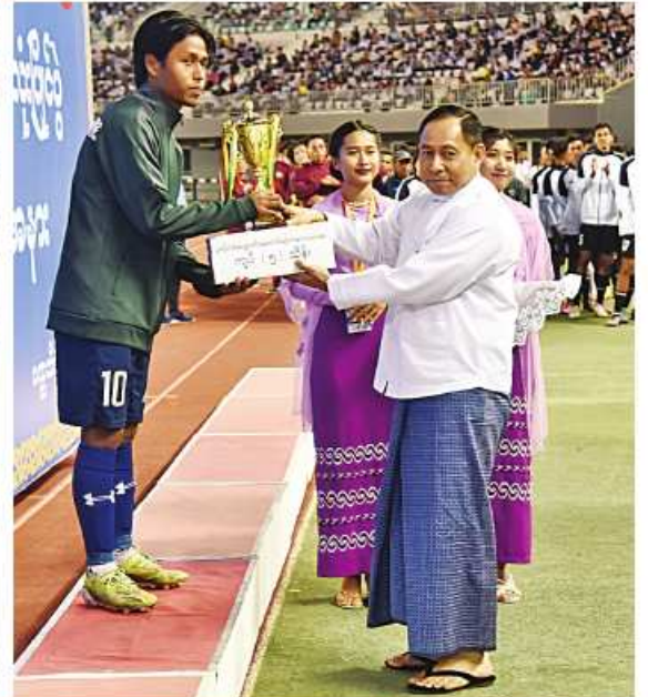
နိုင်ငံတော်စီမံအုပ်ချုပ်ရေးကောင်စီအဖွဲ့ဝင် ဒုတိယဗိုလ်ချုပ်ကြီးရာပြည့်က ပွဲစဉ်တစ်လျှောက်အကောင်းဆုံး အားကစားသမားဆုရရှိသူအား ဆုတံဆိပ်နှင့် ဂုဏ်ပြုဆုငွေ ပေးအပ်ချီးမြှင့်စဉ်။

တက်ရောက်လာကြသူများသည် ၂၀၂၃-၂၀၂၄ ပညာသင်နှစ် ပညာရေးဝန်ကြီးဌာန တက္ကသိုလ်ပေါင်းစုံ ဘောလုံးဖြိုင်ပွဲ၏ နောက်ဆုံးပိုင်းလှုပ်အဖြစ် မော်လမြိုင်ဇုန်အသင်းနှင့် မြစ်ကြီးနားဇုန်အသင်းတို့ ယှဉ်ပြိုင်ကစားမှုကို ကြည့်ရှုအားပေးသည်။ အဆိုပါပွဲစဉ်တွင် နှစ်ဖက်အသင်းများသည် ဗိုလ်လှုပ်သို့ တက်ရောက်လာကြ