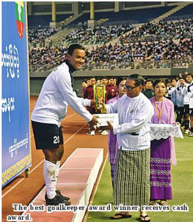
The best goalkeeper award winner receives cash award.