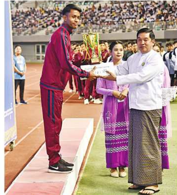
နိုင်ငံတော်စီမံအုပ်ချုပ်ရေးကောင်စီအဖွဲ့ဝင် ဒုတိယဗိုလ်ချုပ်ကြီးညိုစောက ဂိုးသွင်းအများဆုံးကစားသမားဆုရရှိသူအား ဆုတံဆိပ်နှင့် ဂုဏ်ပြုဆုငွေ ပေးအပ်ချီးမြှင့်စဉ်။