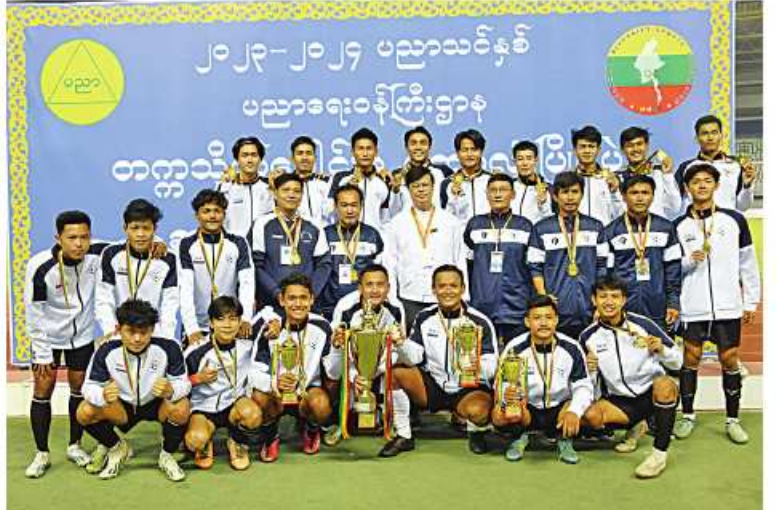
ပထမဆုရရှိသည့် မော်လမြိုင်ရန်အသင်းအား တံခွန်စိုက်ဆုပေးလားနှင့်အတူ တွေ့ရစဉ်။

ဗိုလ်ချုပ်ကြီးအောင်လင်းဒွေးက ပထမဆု ဂုဏ်ပြုဆုငွေများနှင့် တံခွန်စိုက်ဆုပေးလားကို ရရှိသည့် မော်လမြိုင်ရန်အသင်းအား ပေးအပ် ခေးအပ်ချီးမြှင့်သည်။ ဆုပေးပွဲအပြီးတွင် နိုင်ငံတော်စီမံ အုပ်ချုပ်ရေးကောင်စီဥက္ကဋ္ဌ နိုင်ငံတော် ဝန်ကြီးချုပ် ဗိုလ်ချုပ်မှူးကြီးမင်းအောင်လှိုင် နှင့် အဖွဲ့ဝင်များသည် ပြိုင်ပွဲဝင်အားကစား သမားများကို ရင်းရင်းနှီးနှီးနှုတ်ဆက်ခဲ့ ရရှိသည့် မော်လမြိုင်ရန်အသင်းအား ကြောင်း သတင်းရရှိသည်။