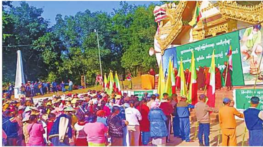
ဘုရားစေတီပုထိုးများ၊ ပုဒ္ဒဆင်းတုတော်များနှင့် ဘာသာရေးဆိုင်ရာ အဆောက်အအုံများကို ဖျက်ဆီးမှုအပေါ် ရမ်းပြည်နယ် (တောင်ပိုင်း) ကွန်ဟိန်းမြို့၌ ကန့်ကွက်ရှုတ်ချပွဲ ပြုလုပ်စဉ်။