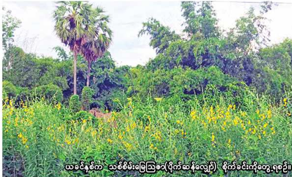
ယခင်နှစ်က သစ်စိမ်းမြေဩဇာ(ပိုက်ဆန်လျှော်) စိုက်ခင်းကိုတွေ့ရစဉ်။