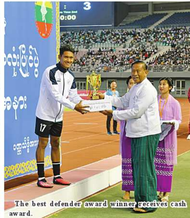
The best defender award winner receives cash award.

Afterwards, Chairman of State Administration Council Prime Minister Senior General Min Aung Hlaing presented honorary cash awards and championship trophy to Mawlamyine zone team.