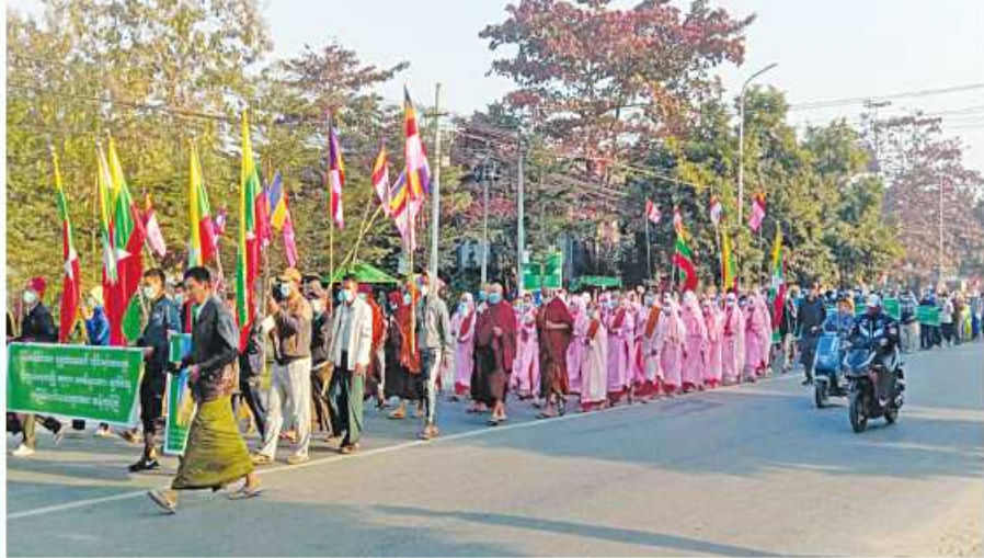
ဘုရားစေတီပုထိုးများ၊ ပုဒ္ဒဆင်းတုတော်များနှင့် ဘာသာရေးဆိုင်ရာ အဆောက်အအုံများကို ဖျက်ဆီးမှုအပေါ် ကချင်ပြည်နယ် ဗန်းမော်မြို့၌ ကန့်ကွက်ရှုတ်ချပွဲ ပြုလုပ်စဉ်။

နေပြည်တော် ၈နိုဝင်ဘာ ၁၈ အကြမ်းဖက် သောင်းကျန်းမှုများက ဘုရားစေတီပုထိုးများ၊ ပုဒ္ဒဆင်းတုတော်များနှင့် ဘာသာရေးဆိုင်ရာအဆောက်အအုံများအား ဖျက်ဆီးစေကာမူ အပေါ် ကန့်ကွက်ရှုတ်ချပွဲများကို တိုင်းဒေသကြီးနှင့် ပြည်နယ်အသီးသီး၌ ပြုလုပ်လျက် ရှိသည်။ ထိုသို့ပြုလုပ်လျက်ရှိရာ ယနေ့တွင် လည်း ကချင်ပြည်နယ် တနင်္ငူမြို့နှင့်ဗန်းမော်မြို့တို့၌လည်းကောင်း၊ ရှမ်းပြည်နယ် (တောင်ပိုင်း) မိုင်းရွှေမြို့နှင့် ကွန်ဟိန်းမြို့တို့၌လည်းကောင်း အသီးသီးပြုလုပ်ကြသည်။ ဦးစွာ ကန့်ကွက်ရှုတ်ချပွဲများသို့ တက်ရောက်လာကြသူများသည် သတ်မှတ် နေရာအသီးသီးမှ ချီတက်စုဝေးကြပြီး သံယာဏ်များနှင့် မျိုးချစ်ပြည်သူ ဦးဆောင်သူများက ပုဒ္ဒဘာသာအပေါ် ဖျက်ဆီးရန် လုပ်ဆောင်နေမှုများကို ကန့်ကွက်ကြောင်း ဟောပြောကြသည်။ ထို့နောက် ကန့်ကွက်ရှုတ်ချပွဲသို့ တက်ရောက်လာကြသူများက “ပုဒ္ဒဘာသာကို စော်ကားဖျက်ဆီးနေကြသည့် အကြမ်းဖက်သမားများအား(ဆန့်ကျင်ကြ)၊ စေတီပုထိုးနှင့်ပုဒ္ဒဆင်းတုတော်များအား ဖျက်ဆီးနေကြသည့် အကြမ်းဖက်သမားများ (ကျရှုံးပါစေ)” စသည့် ကြွေးကြော်သံများ၊ ဆိုင်းဘတ်များ တိုင်ဆောင်၍ ငြိမ်းချမ်းစွာဆန္ဒထုတ်ဖော် ခဲ့ကြကြောင်း သတင်းရရှိသည်။