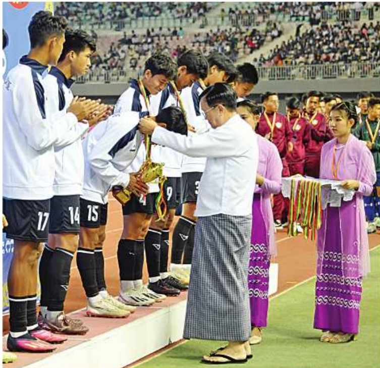
နိုင်ငံတော်စီမံအုပ်ချုပ်ရေးကောင်စီအတွင်းရေးမှူး ဒုတိယဗိုလ်ချုပ်ကြီးအောင်လင်းဒွေးက ပထမဆုရရှိသည့် မော်လမြိုင်ဇုန်အသင်းအား တစ်ဦးချင်းဆုတံဆိပ်များ ပေးအပ်ချီးမြှင့်စဉ်။

ဦးစွာ နိုင်ငံတော်စီမံအုပ်ချုပ်ရေးကောင်စီဥက္ကဋ္ဌ နိုင်ငံတော်ဝန်ကြီးချုပ်နှင့်