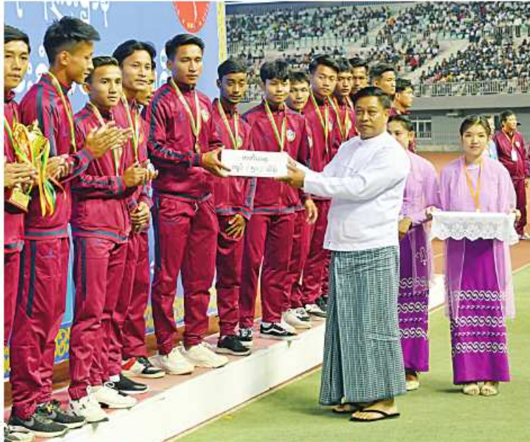
နိုင်ငံတော်စီမံအုပ်ချုပ်ရေးကောင်စီအဖွဲ့ဝင် ဗိုလ်ချုပ်ကြီးတင်အောင်စန်းက တတိယဆုရရှိသည့် ပုသိမ်ဇုန်အသင်းကို တစ်ဦးချင်းဆုတံဆိပ်များနှင့် ဂုဏ်ပြုဆုငွေများ ပေးအပ်ချီးမြှင့်စဉ်။