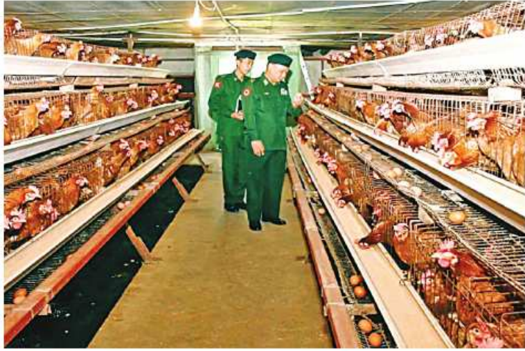
ရန်ကုန်တိုင်းစစ်ဌာနချုပ် တိုင်းမှူး ဗိုလ်ချုပ်ဇော်ဟိန်း အင်းခိန်မြို့နယ်ရှိ အမှတ်(၁) စိုက်ပျိုးမွေးမြူရေးစခန်း(ခေတ်သစ်ကြီးကျန်း)၌ ကြည့်ရှုစစ်ဆေးစဉ်။

နေပြည်တော် ၈နိုဝင်ဘာ ၁၈ ဒေသတွင်း စားရေရိက္ခာဖူလုံစေရန် အထောက်အကူဖြစ်စေရန်အတွက် တိုင်း