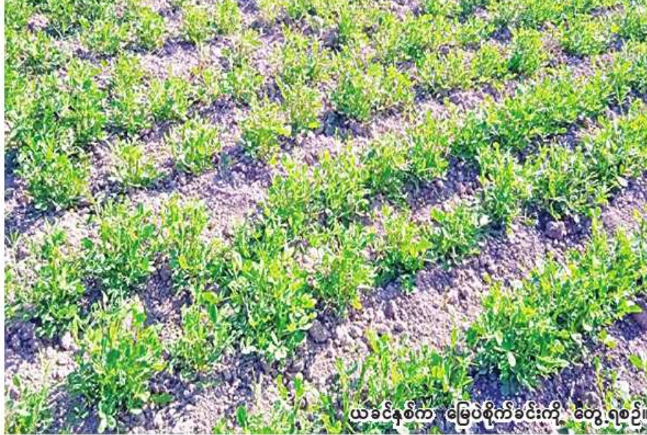
ယခင်နှစ်က မြေပဲစိုက်ခင်းကို တွေ့ရစဉ်။