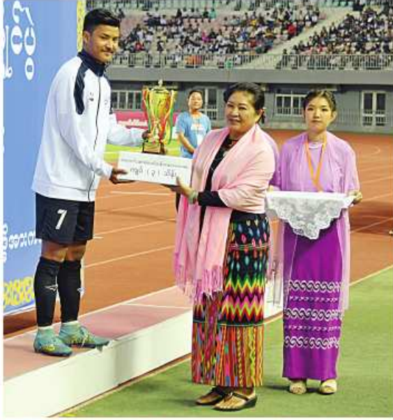
နိုင်ငံတော်စီမံအုပ်ချုပ်ရေးကောင်စီအဖွဲ့ဝင် ဦးဝဏ္ဏမောင်လွင်က အကောင်းဆုံးရှေ့တန်းကစားသမားဆုရရှိသူအား ဆုတံဆိပ်နှင့် ဂုဏ်ပြုဆုငွေ ပေးအပ်ချီးမြှင့်စဉ်။