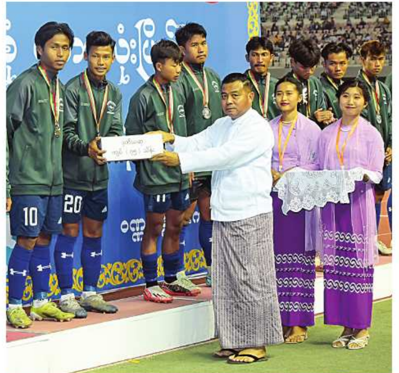
နိုင်ငံတော်စီမံအုပ်ချုပ်ရေးကောင်စီ တွဲဖက်အတွင်းရေးမှူး ဒုတိယဗိုလ်ချုပ်ကြီးရဲဝင်းဦးက ဒုတိယဆုရရှိသည့် မြစ်ကြီးနားဇုန်အသင်းကို တစ်ဦးချင်းဆုတံဆိပ်များနှင့် ဂုဏ်ပြုဆုငွေများ ပေးအပ်ချီးမြှင့်စဉ်။