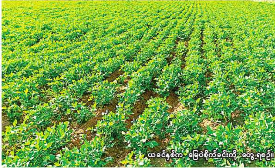
ယခင်နှစ်က မြေပဲစိုက်ခင်းကို တွေ့ရစဉ်။