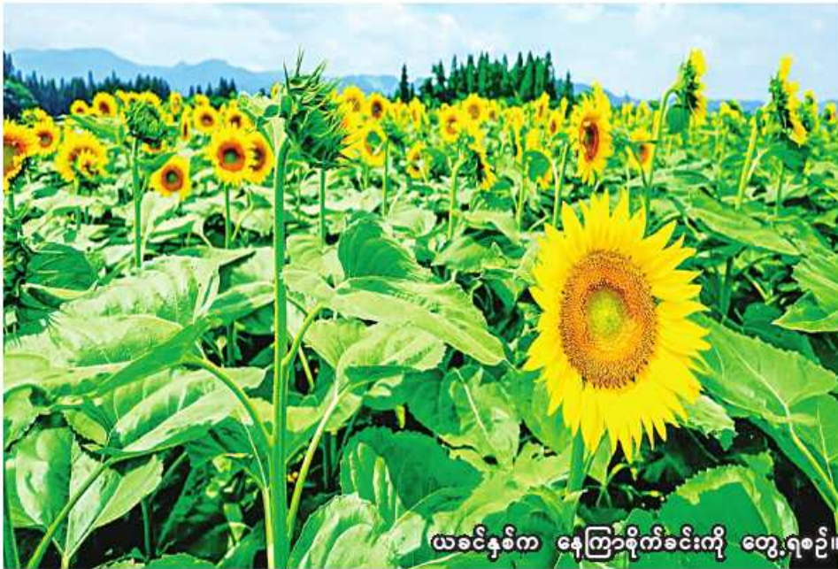
ယခင်နှစ်က နေကြာစိုက်ခင်းကို တွေ့ရစဉ်။