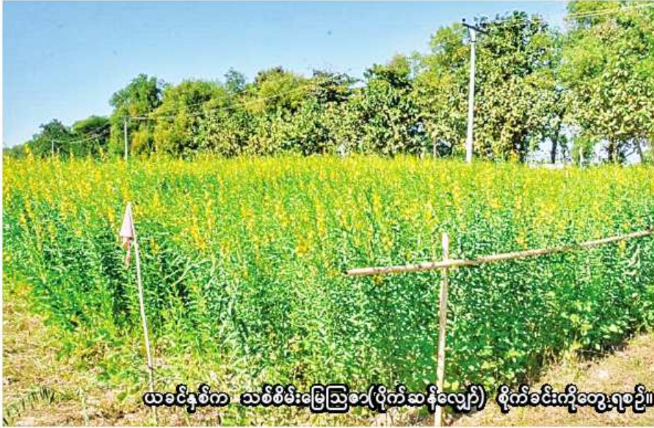
ယခင်နှစ်က သစ်စိမ်းမြေဩဇာ(ပိုက်ဆန်လျော်) စိုက်ခင်းကိုတွေ့ရစဉ်။