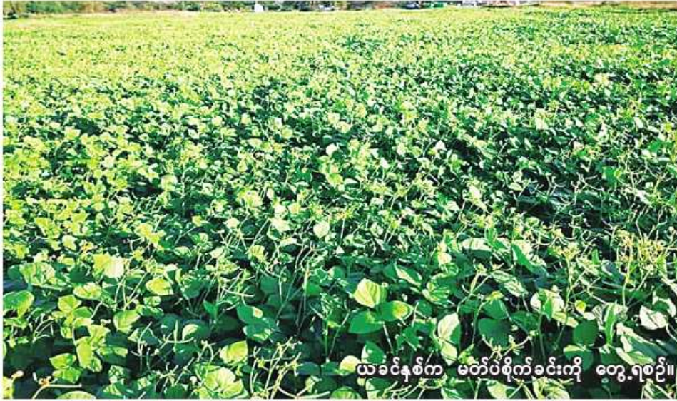
ယခင်နှစ်က မတ်ပဲစိုက်ခင်းကို တွေ့ရစဉ်။