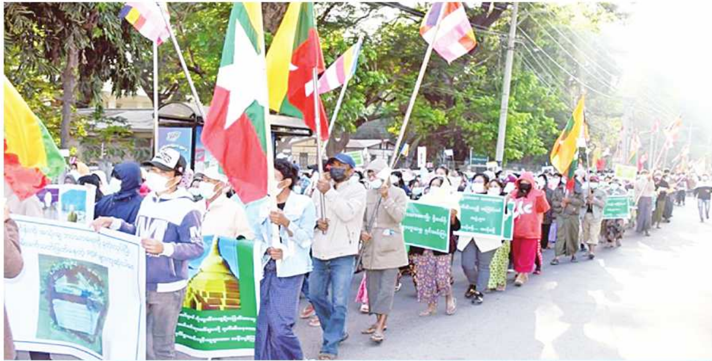
ဘုရားစေတီပုထိုးများနှင့်ဘာသာရေးဆိုင်ရာအဆောက်အအုံများကို ဖျက်ဆီးမှုအပေါ် တိုင်းဒေသကြီးနှင့်ပြည်နယ်အသီးသီးတို့တွင် သံဃာတော်များ၊ သာသနာ့နယ်ဝင် သီလရှင်များနှင့် မျိုးချစ်ပြည်သူများက ကန့်ကွက်ရှုတ်ချပွဲပြုလုပ်စဉ်။

နေပြည်တော် ဇန်နဝါရီ ၁၄ လျက်ရှိသည်။ အကြမ်းဖက်သောင်းကျန်းသူများက ဘုရားစေတီပုထိုးများ၊ ဗုဒ္ဓဆင်းတုတော်များကို ဖျက်ဆီးဖော်ကားမှုအား ကန့်ကွက်ရှုတ်ချပွဲများကို တိုင်းဒေသကြီးနှင့် ပြည်နယ်အသီးသီး၌ ကျင်းပပြုလုပ် ထိုသို့ပြုလုပ်လျက်ရှိရာ ယနေ့တွင် ရော့ဘတ်တိုင်းဒေသကြီး ပုသိမ်မြို့၊ ကမ်းနားလမ်း ရှုခင်းသာရင်ပြင်၌လည်းကောင်း၊ စစ်ကိုင်းတိုင်းဒေသကြီး မုံရွာမြို့၊ ပြည်သူ့အားကစားကွင်း၌လည်းကောင်း၊ မန္တလေးတိုင်းဒေသကြီး မြင်းခြံမြို့၊ ဗိုလ်ချုပ်ကြေးရုပ်ရှေ့၌လည်းကောင်း၊ ပဲခူးတိုင်းဒေသကြီး ပြည်မြို့၊ မြို့သစ်ရပ်ကွက်ရှိ ခရိုင်အားကစားကွင်း၌လည်းကောင်း အသီးသီးကျင်းပပြုလုပ်ကြရာ