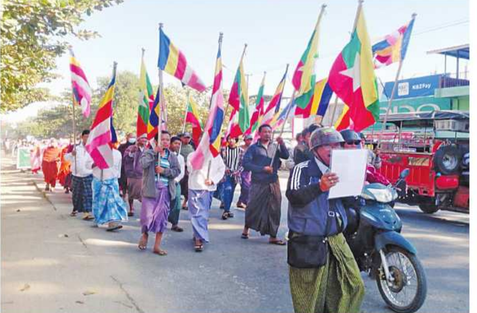
ဘုရား စေတီပုထိုးများနှင့် ဘာသာရေးဆိုင်ရာ အဆောက်အအုံများကို ဖျက်ဆီးမှုအပေါ် တိုင်းဒေသကြီးနှင့် ပြည်နယ်အသီးသီးတွင် သံဃာတော်များ၊ သာသနာ့နွယ်ဝင် သီလရှင်များနှင့် မျိုးချစ်ပြည်သူများက ကန့်ကွက်ရွတ်ချပွဲ ပြုလုပ်စဉ်။