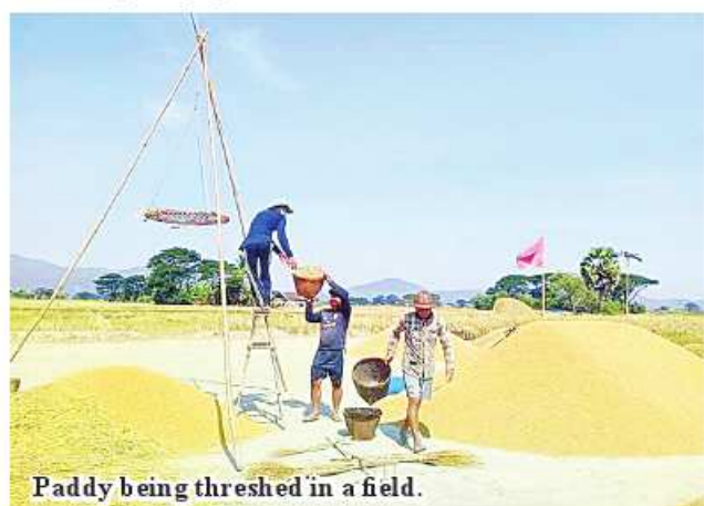
Paddy being threshed in a field.