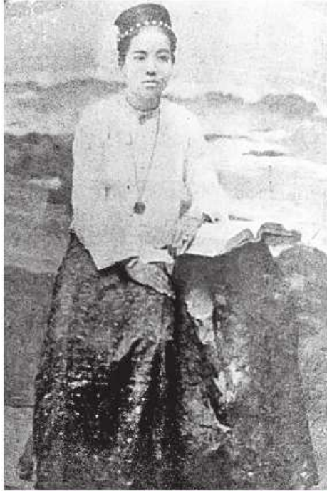
မြခြေကျင်းမငွေမြိုင်

'မြိုင်'ဆိုတာ မြခြေကျင်းမငွေမြိုင်ကို ပြောတာပါ။ မန္တလေးမှာတော့ ဆရာပုတို့၊ မထွေးလေးတို့နာမည်ကျော်သလို မငွေမြိုင်ကလဲ နာမည်ကျော်သူပါ။ မငွေမြိုင်ကို ယောက်ျားတွေက စွဲလမ်းကြပါတယ်။ မငွေမြိုင်နောက်ကို သူလို စွဲလမ်းစရာကောင်းတဲ့ မင်းသမီးမျိုးပေါ်လာတယ်လို့ မကြားမိပါဘူး။