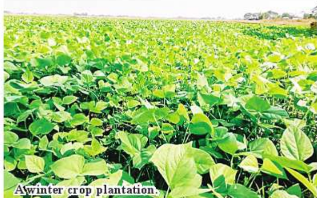
A winter crop plantation.