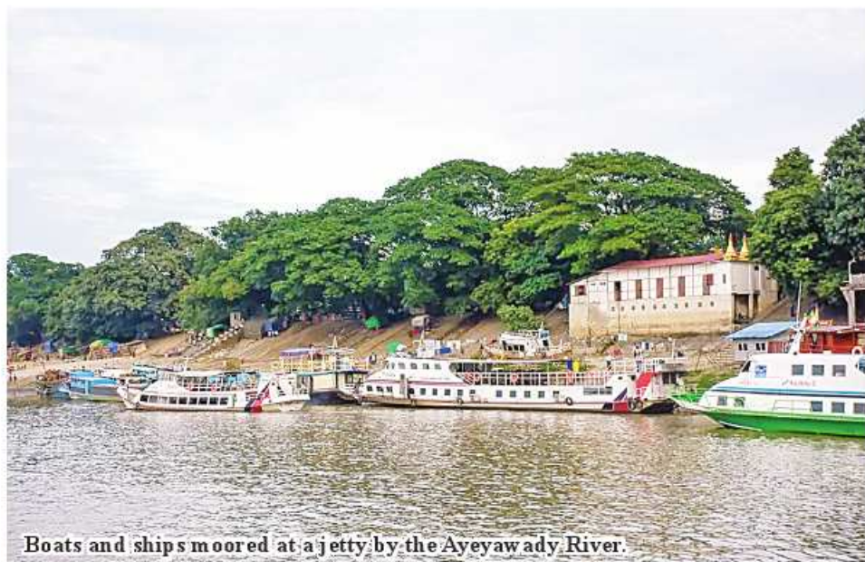
Boats and ships moored at a jetty by the Ayeyawady River.

Mandalay January 14 The Ayeyawady River, the main waterway in Myanmar, is experiencing low tide conditions that affect the movement of passenger and cargo ships.