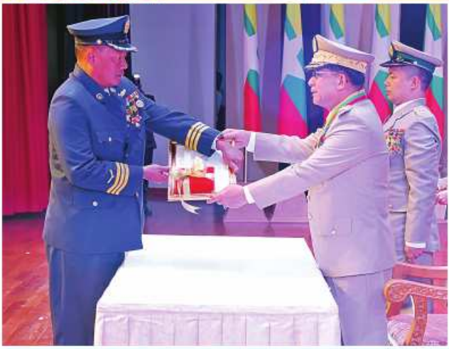
နိုင်ငံတော်စီမံအုပ်ချုပ်ရေးကောင်စီဥက္ကဋ္ဌ တပ်မတော်ကာကွယ်ရေး ဦးစီးချုပ် ပိုင်ချုပ်မျိုးကြီး သတိုးမဟာသရေစည်သူ သတိုးသီရိသုဓမ္မ မင်းအောင်လှိုင်က သူရဲကောင်းမှတ်တမ်းဝင်တံဆိပ်ရရှိသူ ပြန်တမ်းဝင် အမှတ် လေ ၂၄၄ ဒုတိယဗိုလ်မှူးကြီးရဲဦးအား သူရဲကောင်းမှတ်တမ်းဝင် တံဆိပ် ပေးအပ်ချီးမြှင့်စဉ်။