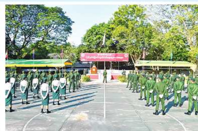
ရန်ကုန်တိုင်းစစ်ဌာနချုပ်၌ (၇၆)နှစ်မြောက် လွတ်လပ်ရေးနေ့စစ်ရေးပြ အခမ်းအနား ကျင်းပစဉ်။

နေပြည်တော် ဇန်နဝါရီ ၄ (၇၆)နှစ်မြောက် လွတ်လပ်ရေးနေ့ စစ်ရေးပြအခမ်းအနားကို ယနေ့ နံနက်ပိုင်းတွင် ကာကွယ်ရေးဦးစီး ချုပ်ရုံး(ကြည်း) ဝင်းအတွင်း၌ အနော်ရထာခန်းမရွှေ့ စစ်ရေးပြ ကွင်း၌ ကျင်းပပြုလုပ်သည်။ အခမ်းအနားသို့ ကာကွယ်ရေး ဦးစီးချုပ်ရုံး(ကြည်း)မှ ဒုတိယ ဗိုလ်ချုပ်ကြီးတေဇကျော်က ကာကွယ် ရေးဦးစီးချုပ်ရုံးမှ တပ်မတော် အရာရှိကြီးများ၊ အရာရှိ၊ အရာခံ၊ အကြပ်၊ စစ်သည်၊ စစ်သမီးများ ပျော်ပွဲရွှင်ပွဲ အားကစားပြိုင်ပွဲ