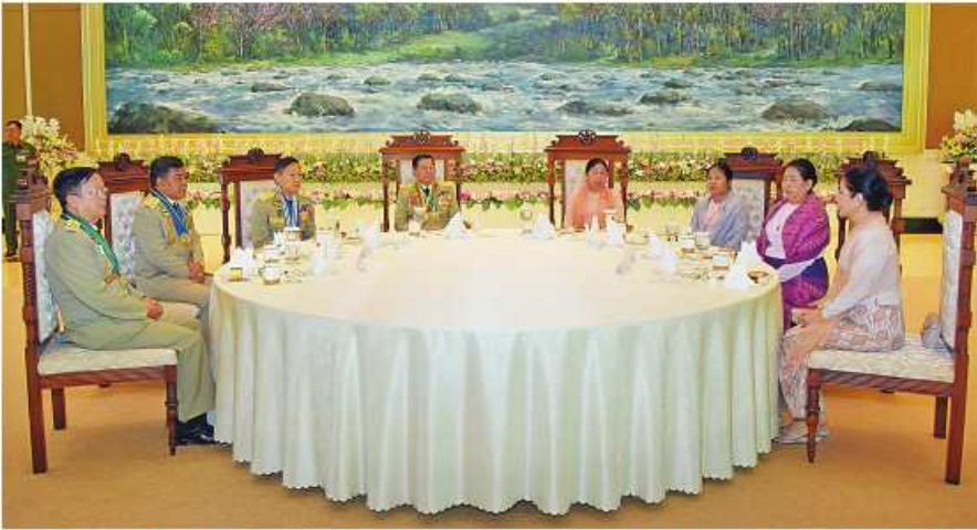
နိုင်ငံတော်စီမံအုပ်ချုပ်ရေးကောင်စီဥက္ကဋ္ဌ တပ်မတော်ကာကွယ်ရေးဦးစီးချုပ် ဗိုလ်ချုပ်မှူးကြီး သတိုးမဟာသရေစည်သူ သတိုးသိရိသုဓမ္မဓင်းအောင်လှိုင်နှင့် ဇနီး ဒေါ်ကြူကြူလှ၊ အဖွဲ့ဝင်များ မြဝတီတေးဂီတအဖွဲ့၏ တေးသီချင်းအကအလှများဖြင့် ဖျော်ဖြေမှုကို ကြည့်ရှုအားပေးစဉ်။

အများစုကလုပ်ဆောင်နိုင်ရန်ခဲယဉ်း သည်တာဝန်များကို စွန့်လွှတ်စွန့်စားမှု အပြည့်ဖြင့် ကျေကျေပွန်ပွန်ထမ်းဆောင်ခဲ့ သူများအတွက် နှစ်စဉ်လွတ်လပ်ရေးနေ့ အခမ်းအနားများတွင် တပ်မတော်စွမ်းရည် သတ္တိနှင့်စွမ်းဆောင်မှုဆိုင်ရာ ဂုဏ်ထူးဆောင် ဘွဲ့၊ တံဆိပ်နှင့် လက်မှတ်များ ချီးမြှင့်ခြင်း အခမ်းအနားများကျင်းပပေးလျက်ရှိရာ ယခု အခမ်းအနားတွင် သူရဲကောင်းမှတ်တမ်းဝင် တံဆိပ်ရရှိသူ ၂၅ ဦးကို ချီးမြှင့်ပေးသွားမည် ဖြစ်ကြောင်း၊ ရဲသူရဲတံဆိပ်ရရှိသူ ကိုးဦး၊ ရဲဗလတံဆိပ်ရရှိသူ ၉၉ ဦး၊ စီမံထူးချွန် တံဆိပ်(ပထမ)ဆင့်ရရှိသူ ၁၄ ဦး၊ စီမံထူးချွန် တံဆိပ်(ဒုတိယ)ဆင့်ရရှိသူ ၂၈ ဦး၊ စီမံထူးချွန် တံဆိပ်(တတိယ)ဆင့်ရရှိသူ ၃၄ ဦး၊ လူမှု ထူးချွန်တံဆိပ်(ပထမ)ဆင့်ရရှိသူ သုံးဦး၊ လူမှု ထူးချွန်တံဆိပ်(ဒုတိယ)ဆင့်ရရှိသူ ခြောက်ဦး၊ လူမှုထူးချွန်တံဆိပ် (တတိယ)ဆင့်ရရှိသူ