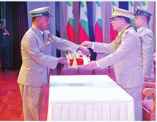
နိုင်ငံတော်စီမံအုပ်ချုပ်ရေးကောင်စီဥက္ကဋ္ဌ တပ်မတော်ကာကွယ်ရေး ဦးစီးချုပ် ပိုင်ချုပ်မျိုးကြီး သတိုးမဟာသရေစည်သူ သတိုးသီရိသုဓမ္မ မင်းအောင်လှိုင်က သူရဲကောင်းမှတ်တမ်းဝင်တံဆိပ်ရရှိသူ ပြန်တမ်းဝင် အမှတ် ကြည်း ၄၉၀၅၂ ဗိုလ်ကြီးထွန်းဝင်းအား သူရဲကောင်းမှတ်တမ်းဝင် တံဆိပ် ပေးအပ်ချီးမြှင့်စဉ်။