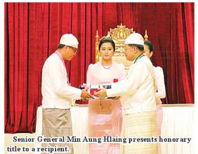
Senior General Min Aung Hlaing presents honorary title to a recipient.