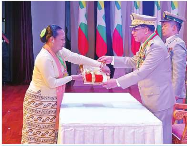
နိုင်ငံတော်စီမံအုပ်ချုပ်ရေးကောင်စီဥက္ကဋ္ဌ တပ်မတော်ကာကွယ်ရေးဦးစီးချုပ် ဗိုလ်ချုပ်မှူးကြီး သတိုးမဟာသရေစည်သူ သတိုးသီရိသုဓမ္မ မင်းအောင်လှိုင်က သူရဲကောင်းမှတ်တမ်းဝင်တံဆိပ်ရရှိသူ ပြန်တမ်းဝင်အမှတ် ကြည်း ၇၄၉၄၄ ဗိုလ်ကြီးရန်လင်းနိုင်ကိုယ်စား မိခင် ဒေါ်မိုးမိုးအား သူရဲကောင်းမှတ်တမ်းဝင်တံဆိပ် ပေးအပ်ချီးမြှင့်စဉ်။