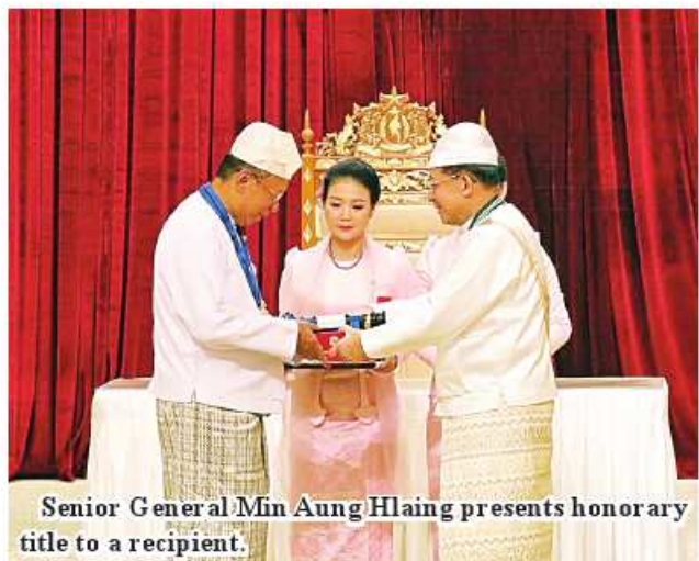
Senior General Min Aung Hlaing presents honorary title to a recipient.