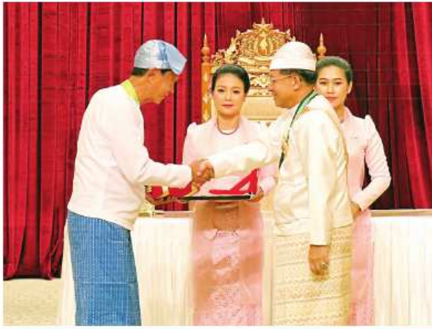
နိုင်ငံတော်စီမံအုပ်ချုပ်ရေးကောင်စီဥက္ကဋ္ဌ နိုင်ငံတော်ဝန်ကြီးချုပ် ဝိုင်းချုပ်မျိုးကြီး သတိုးမဟာသရေစည်သူ သတိုးသီရိသုဓမ္မမင်းအောင်လှိုင် ဝဏ္ဏကျော်ထင်ဘွဲ့ရရှိသူ ဘောလုံးအားကစားသမား ဝိုင်းကြီးတင်အောင် (အငြိမ်းစား)အား ဂုဏ်ထူးဆောင်ဘွဲ့ ချီးမြှင့်အပ်နှင်းစဉ်။

စာမျက်နှာ ၁၇ မှအဆက် စွမ်းဆောင်နိုင်သည့် ပုဂ္ဂိုလ်များ၊ စာပေနှင့် အနုပညာပညာရပ်များတွင် ထူးခြားကောင်းမွန်စွာတတ်မြောက်သူ ပုဂ္ဂိုလ်များ၊ နိုင်ငံတော်လုံခြုံရေး၊ ရပ်ရွာအေးချမ်းသာယာရေးနှင့် တရားဥပဒေစိုးမိုးရေးတို့အတွက် မဆုတ်မနုတ်သော စွမ်းအား၊ လုံ့လ၊ ဝီရိယဖြင့် ကြိုးပမ်းထမ်းဆောင်ကြသည့် ပုဂ္ဂိုလ်များကို ယခုကဲ့သို့ ထူးခြားလေးနက်သည့် (၇၆)နှစ်မြောက် လွတ်လပ်ရေးနေ့ အထိမ်းအမှတ်အဖြစ် ဂုဏ်ထူးဆောင်ဘွဲ့များကို ချီးမြှင့်အပ်နှင်းသွားမည်ဖြစ်ပါကြောင်း။ ယနေ့အခမ်းအနားတွင် သရေစည်သူဘွဲ့ ကိုးဦး၊ စည်သူဘွဲ့ ငါးဦး၊ သူရဘွဲ့ ခြောက်ဦး၊ သီရိပျံချီဘွဲ့ ၄၂ ဦး၊ ဝဏ္ဏကျော်ထင်ဘွဲ့ ၈၃ ဦး၊ အလင်္ကာကျော်စွာဘွဲ့ လေးဦး၊ သိပ္ပံကျော်စွာဘွဲ့ လေးဦး စုစုပေါင်း ၁၅၃ ဦးကို သက်ဆိုင်ရာဂုဏ်ထူးဆောင်ဘွဲ့တံဆိပ်များ ချီးမြှင့်အပ်နှင်းသွားမည်ဖြစ်ပါကြောင်း။ ယခုကဲ့သို့ ဂုဏ်ပြုချီးမြှင့်ခြင်းခံရသည့်အတွက် တွဲဖက်ပုဂ္ဂိုလ်များအနေဖြင့် ဝမ်းမြောက်ဝမ်းသာဖြစ်သကဲ့သို့ တွဲဖက်ပုဂ္ဂိုလ်များအတွက်သာမက သက်ဆိုင်ရာခံစားရခက်ခဲမှုများအတွက်လည်း သားစဉ်မြေးဆက် ဂုဏ်ယူဝင့်ကြားစရာ စာမျက်နှာ ၁၉ သို့