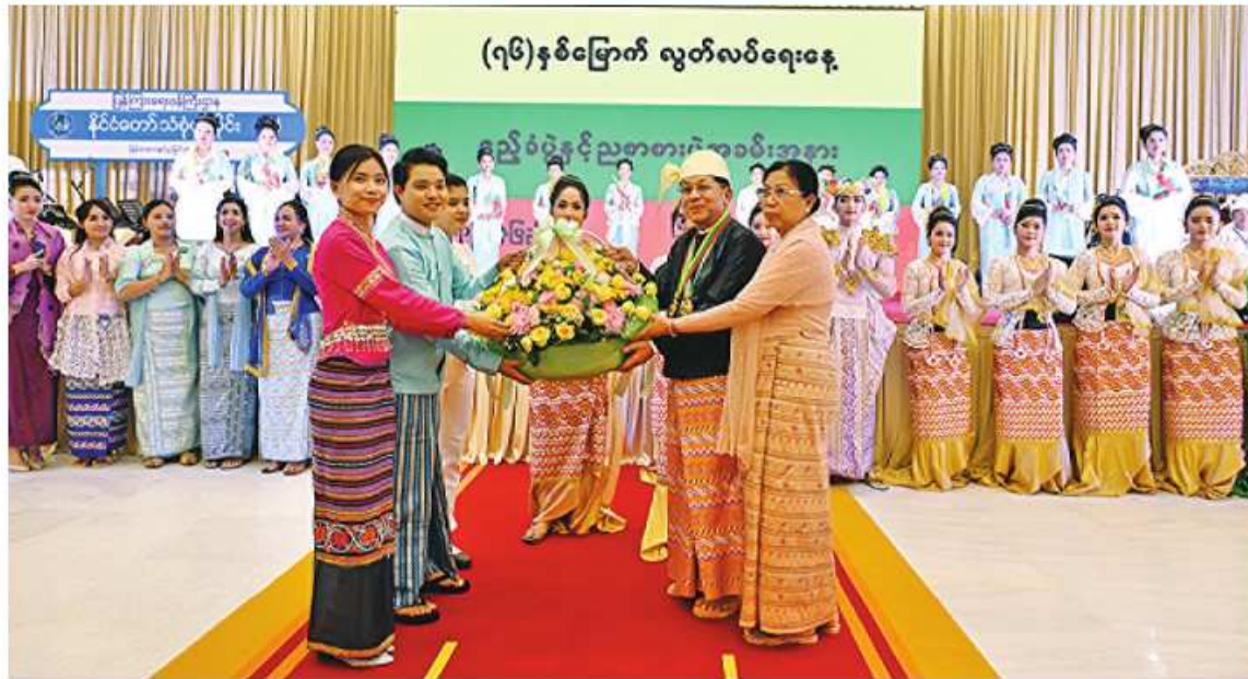
(၇၆)နှစ်မြောက် လွတ်လပ်ရေးနေ့

ပဒေသာကဗျာအပြိုင်တွင် နိုင်ငံတော်စီမံ အုပ်ချုပ်ရေးကောင်စီဥက္ကဋ္ဌ နိုင်ငံတော် ဝန်ကြီးချုပ်နှင့် ဇနီးတို့သည် ဖျော်ဖြေတင် ဆက်ခဲ့ကြသည် ပြန်ကြားရေးဝန်ကြီးဌာန မြန်မာ့အသံနှင့်ရုပ်မြင်သံကြားနှင့် သာသနာ ရေးနှင့် ယဉ်ကျေးမှုဝန်ကြီးဌာန အနုပညာ ဦးစီးဌာနမှ တေးသံရှင်များနှင့် အနုပညာ ရှင်များကို ဂုဏ်ပြုပန်းခြင်းပေးအပ်ပြီး ဂုဏ်ပြုဥပစာစားပွဲအခမ်းအနားသို့ တက်