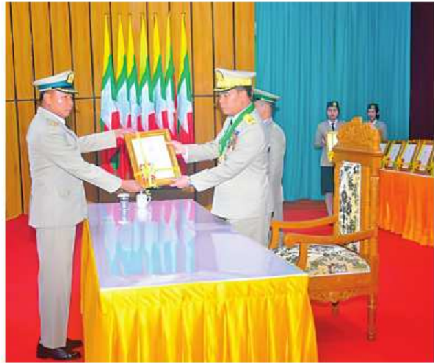
နေပြည်တော်တိုင်းစစ်ဌာနချုပ် တိုင်းမှူး ဗိုလ်ချုပ်စောသန်းလှိုင်က တပ်မတော်စွမ်းရည်သတ္တိဆိုင်ရာ ဂုဏ်ထူးဆောင်ဘွဲ့တံဆိပ်နှင့် လက်မှတ်များ ပေးအပ်စဉ်။