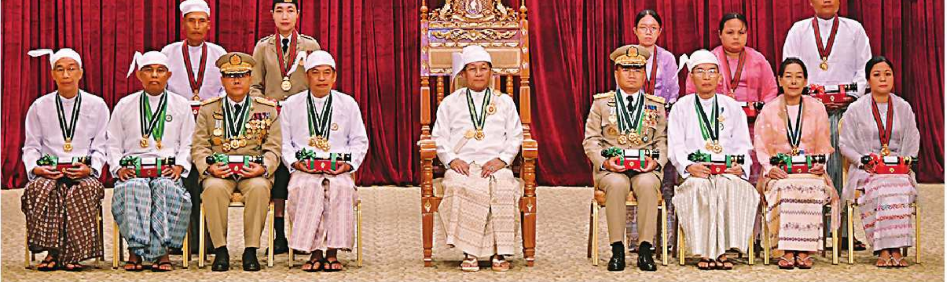
နိုင်ငံတော်စီမံအုပ်ချုပ်ရေးကောင်စီဥက္ကဋ္ဌ နိုင်ငံတော်ဝန်ကြီးချုပ် ဝိုင်းစိန်ဝင်း၊ သတိုးမဟာသရေစည်သူ သတိုးသီရိသုဓမ္မမင်းအောင်လှိုင် ဂုဏ်ထူးဆောင်ဘွဲ့ ရရှိသူများနှင့်အတူ မှတ်တမ်းတင်ပေးပေးခြင်း