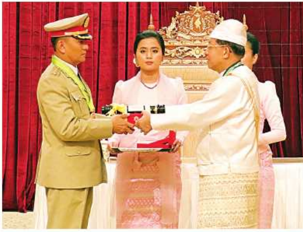
နိုင်ငံတော်စီမံအုပ်ချုပ်ရေးကောင်စီဥက္ကဋ္ဌ နိုင်ငံတော်ဝန်ကြီးချုပ် ဝိုင်းချုပ်မျိုးကြီး သတိုးမဟာသရေစည်သူ သတိုးသီရိသုဓမ္မမင်းအောင်လှိုင် ဝဏ္ဏကျော်ထင်ဘွဲ့ရရှိသူ ကာကွယ်ရေးဝန်ကြီးဌာန ဝိုင်းချုပ်မျိုးကြီးတင်လွင်အား ဂုဏ်ထူးဆောင်ဘွဲ့ ချီးမြှင့်အပ်နှင်းစဉ်။

စာမျက်နှာ ၁၇ မှအဆက် စွမ်းဆောင်နိုင်သည့် ပုဂ္ဂိုလ်များ၊ စာပေနှင့် အနုပညာပညာရပ်များတွင် ထူးခြားကောင်းမွန်စွာတတ်မြောက်သူ ပုဂ္ဂိုလ်များ၊ နိုင်ငံတော်လုံခြုံရေး၊ ရပ်ရွာအေးချမ်းသာယာရေးနှင့် တရားဥပဒေစိုးမိုးရေးတို့အတွက် မဆုတ်မနုတ်သော စွမ်းအား၊ လုံ့လ၊ ဝီရိယဖြင့် ကြိုးပမ်းထမ်းဆောင်ကြသည့် ပုဂ္ဂိုလ်များကို ယခုကဲ့သို့ ထူးခြားလေးနက်သည့် (၇၆)နှစ်မြောက် လွတ်လပ်ရေးနေ့ အထိမ်းအမှတ်အဖြစ် ဂုဏ်ထူးဆောင်ဘွဲ့များကို ချီးမြှင့်အပ်နှင်းသွားမည်ဖြစ်ပါကြောင်း။ ယနေ့အခမ်းအနားတွင် သရေစည်သူဘွဲ့ ကိုးဦး၊ စည်သူဘွဲ့ ငါးဦး၊ သူရဘွဲ့ ခြောက်ဦး၊ သီရိပျံချီဘွဲ့ ၄၂ ဦး၊ ဝဏ္ဏကျော်ထင်ဘွဲ့ ၈၃ ဦး၊ အလင်္ကာကျော်စွာဘွဲ့ လေးဦး၊ သိပ္ပံကျော်စွာဘွဲ့ လေးဦး စုစုပေါင်း ၁၅၃ ဦးကို သက်ဆိုင်ရာဂုဏ်ထူးဆောင်ဘွဲ့တံဆိပ်များ ချီးမြှင့်အပ်နှင်းသွားမည်ဖြစ်ပါကြောင်း။ ယခုကဲ့သို့ ဂုဏ်ပြုချီးမြှင့်ခြင်းခံရသည့်အတွက် တွဲဖက်ပုဂ္ဂိုလ်များအနေဖြင့် ဝမ်းမြောက်ဝမ်းသာဖြစ်သကဲ့သို့ တွဲဖက်ပုဂ္ဂိုလ်များအတွက်သာမက သက်ဆိုင်ရာခံစားရခက်ခဲမှုများအတွက်လည်း သားစဉ်မြေးဆက် ဂုဏ်ယူဝင့်ကြားစရာ စာမျက်နှာ ၁၉ သို့