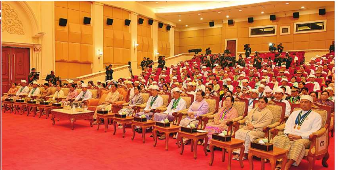
နိုင်ငံတော်စီမံအုပ်ချုပ်ရေးကောင်စီဥက္ကဋ္ဌ နိုင်ငံတော်ဝန်ကြီးချုပ် ဝိုင်းချုပ်မျိုးကြီး သတိုးမဟာသရေစည်သူ သတိုးသီရိသုဓမ္မမင်းအောင်လှိုင် (၇၆)နှစ်မြောက် လွတ်လပ်ရေးနေ့အထိမ်းအမှတ် ဂုဏ်ထူးဆောင်ဘွဲ့များ ချီးမြှင့်အပ်နှင်းခြင်းအခမ်းအနားတွင် အမှာစကားပြောကြားစဉ်။