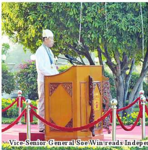
Vice-Senior General Soe Win reads Independence Day message sent by SAC Chairman Prime Minister Senior General Min Aung Hlaing.