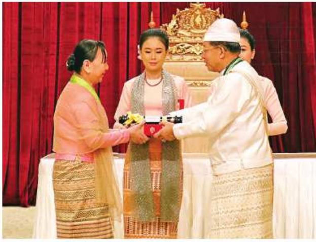
နိုင်ငံတော်စီမံအုပ်ချုပ်ရေးကောင်စီဥက္ကဋ္ဌ နိုင်ငံတော်ဝန်ကြီးချုပ် ဝိုင်းချုပ်မျိုးကြီး သတိုးမဟာသရေစည်သူ သတိုးသီရိသုဓမ္မမင်းအောင်လှိုင် ဝဏ္ဏကျော်ထင်ဘွဲ့ရရှိသူ စီမံကိန်းနှင့်ဘဏ္ဍာရေးဝန်ကြီးဌာန ဒုတိယဝန်ကြီး ဒေါ်သန်းသန်းလင်းအား ဂုဏ်ထူးဆောင်ဘွဲ့ ချီးမြှင့်အပ်နှင်းစဉ်။