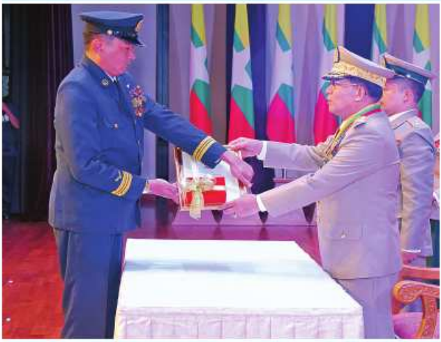
နိုင်ငံတော်စီမံအုပ်ချုပ်ရေးကောင်စီဥက္ကဋ္ဌ တပ်မတော်ကာကွယ်ရေး ဦးစီးချုပ် ပိုင်ချုပ်မျိုးကြီး သတိုးမဟာသရေစည်သူ သတိုးသီရိသုဓမ္မ မင်းအောင်လှိုင်က သူရဲကောင်းမှတ်တမ်းဝင်တံဆိပ်ရရှိသူ ပြန်တမ်းဝင် အမှတ် လေ ၃၀၇၅ ဗိုလ်မှူးခင်မောင်ထွန်းအား သူရဲကောင်းမှတ်တမ်းဝင် တံဆိပ် ပေးအပ်ချီးမြှင့်စဉ်။