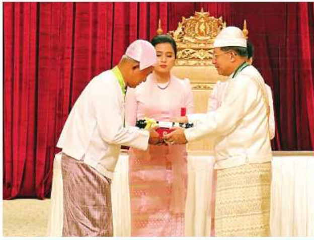
နိုင်ငံတော်စီမံအုပ်ချုပ်ရေးကောင်စီဥက္ကဋ္ဌ နိုင်ငံတော်ဝန်ကြီးချုပ် ဝိုင်းချုပ်မျိုးကြီး သတိုးမဟာသရေစည်သူ သတိုးသီရိသုဓမ္မမင်းအောင်လှိုင် ဝဏ္ဏကျော်ထင်ဘွဲ့ရရှိသူ နိုင်ငံခြားရေးဝန်ကြီးဌာန သံအမတ်ကြီး (အငြိမ်းစား) ဦးစင်မောင်အေးအား ဂုဏ်ထူးဆောင်ဘွဲ့ ချီးမြှင့်အပ်နှင်းစဉ်။