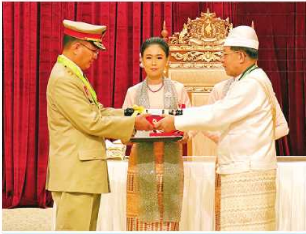
နိုင်ငံတော်စီမံအုပ်ချုပ်ရေးကောင်စီဥက္ကဋ္ဌ နိုင်ငံတော်ဝန်ကြီးချုပ် ဝိုင်းချုပ်မျိုးကြီး သတိုးမဟာသရေစည်သူ သတိုးသီရိသုဓမ္မမင်းအောင်လှိုင် ဝဏ္ဏကျော်ထင်ဘွဲ့ရရှိသူ ကာကွယ်ရေးဝန်ကြီးဌာနမှ အမြဲတမ်းအတွင်းဝန် ဝိုင်းချုပ်မျိုးအောင်ကျော်ဟိုအား ဂုဏ်ထူးဆောင်ဘွဲ့ ချီးမြှင့်အပ်နှင်းစဉ်။