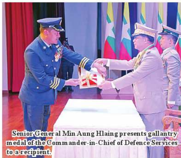
Senior General Min Aung Hlaing presents gallantry medal of the Commander-in-Chief of Defence Services to a recipient.

Today, due to the concepts of multi-faceted warfare, battles are no longer fought only in the jungles, but also in urban areas, making the front lines more