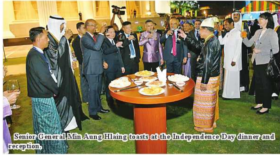
Senior General Min Aung Hlaing toasts at the Independence Day dinner and reception.

senior officers from the Office of the Commander-in-Chief of Defence Services, deputy ministers, ambassadors and charges d'affaires of foreign embassies, honorary consuls, winners of honorary awards