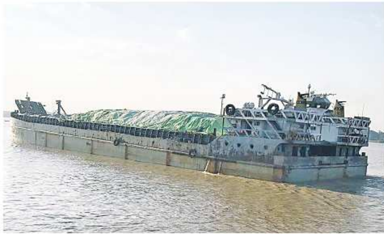
(သတင်းစဉ်)

နေပြည်တော် ၈ ဇန်နဝါရီ ၄ သည် လျှပ်စစ်စွမ်းအားဝန်ကြီးဌာန၊ ဆန်၊ စားအုန်းဆီနှင့် စားသောက် အမျိုးသား သဘာဝဘေးအန္တရာယ် လူမှုဝန်ထမ်း၊ ကယ်ဆယ်ရေးနှင့် ပြည်လည် ကုန်များ၊ ကျန်းမာရေးသုံးပစ္စည်းများ ဆိုင်ရာ စီမံခန့်ခွဲမှုကော်မတီ၏ နေရာချထားရေးဝန်ကြီးဌာန၊ မြန်မာ နှင့် ဆေးဝါးများ စုစုပေါင်း ၂၀၇၄ ဒသမ ညွှန်ကြားမှုအရ ပို့ဆောင်ဆက်သွယ်ရေး နိုင်ငံ အမျိုးသမီးများနှင့် ကလေးသူငယ် ၇၅ တန် တင်ဆောင်၍ ယနေ့နံနက် လုပ်ငန်းကော်မတီ၏ စီစဉ်ကြီးကြပ်မှုဖြင့် များဘဝ မြင့်တင်ရေးအသင်းတို့မှ ၇ နာရီ မိနစ် ၅၀ တွင် The Myanmar Terminal (TMT) ဆိပ်ခံတံတားမှ ပေးပို့သည့် ပြန်လည်ထူထောင်ရေး ပစ္စည်းများ၊ ရခိုင်ပြည်နယ်အစိုးရအဖွဲ့က စစ်တွေမြို့သို့ ထွက်ခွာသွားကြောင်း မှာယူသည့် လမ်းမီးတိုင်၊ မီးလုံး၊ သတင်းရရှိသည်။