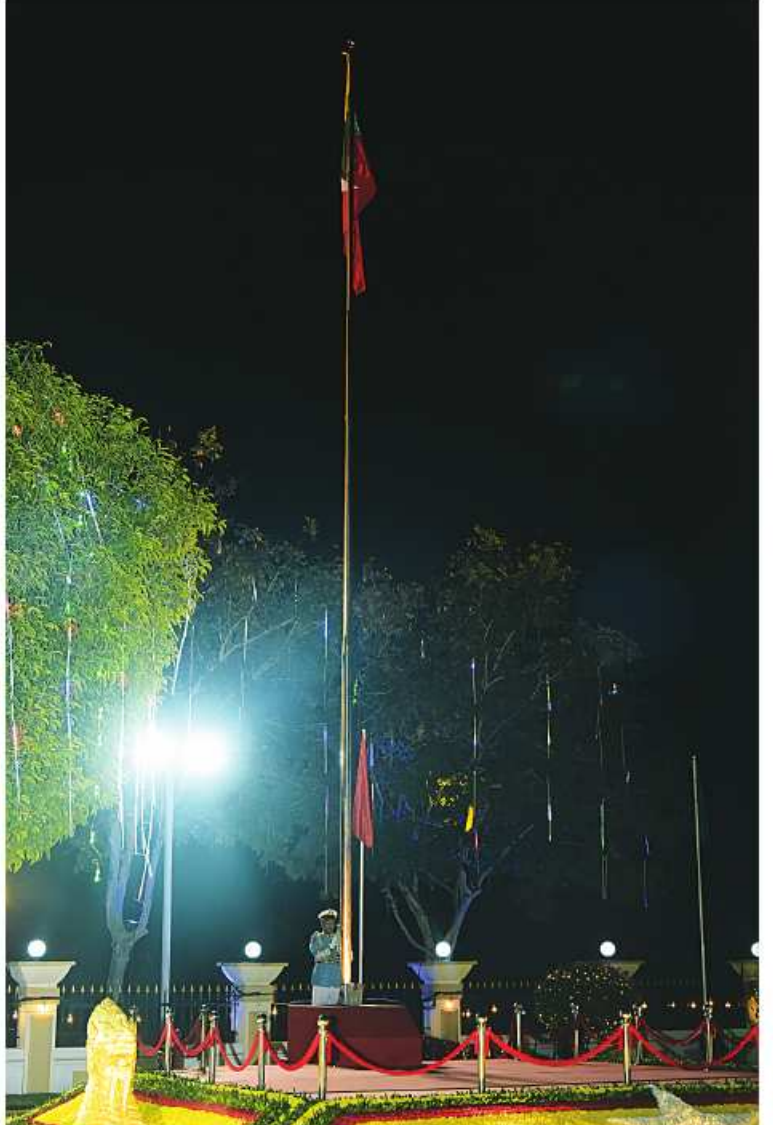
(၇၆)နှစ်မြောက် လွတ်လပ်ရေးနေ့နိုင်ငံတော်အလံတင်အခမ်းအနားတွင် အလံတင်တပ်စုက နိုင်ငံတော်အလံကို လွှင့်တင်စဉ်။