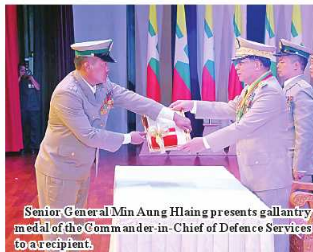
Senior General Min Aung Hlaing presents gallantry medal of the Commander-in-Chief of Defence Services to a recipient.

ranks and heirs who would accept honorary medals and certificates. In his honorary address, the Senior General said every year on 4 January, Tatmadaw gallantry titles/medals and certificates are conferred on soldiers who served the national defence duty brilliantly and courageously in the interest of the nation and people with loving kindness, attachment, and royalty upon