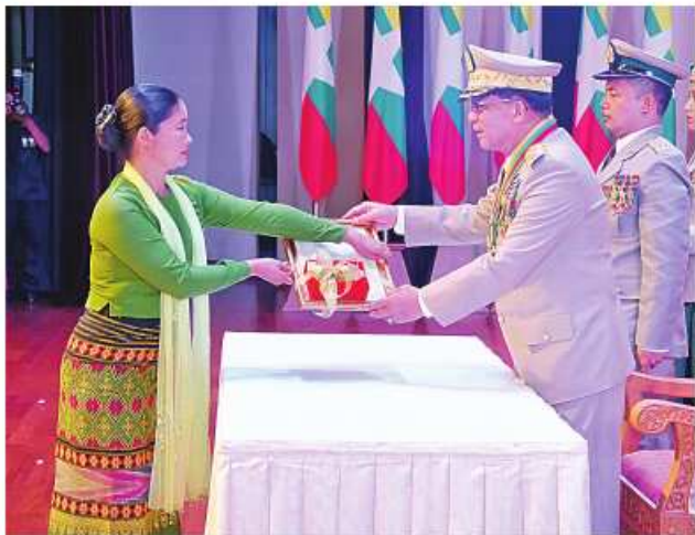
နိုင်ငံတော်စီမံအုပ်ချုပ်ရေးကောင်စီဥက္ကဋ္ဌ တပ်မတော်ကာကွယ်ရေးဦးစီးချုပ် ဗိုလ်ချုပ်မှူးကြီး သတိုးမဟာသရေစည်သူ သတိုးသီရိသုဓမ္မ မင်းအောင်လှိုင်က သူရဲကောင်းမှတ်တမ်းဝင်တံဆိပ်ရရှိသူ ကိုယ်ပိုင်အမှတ် ၇၅၉၂၇၇ ဒုတိယအရာခံဗိုလ်မြင့်စော်ကိုယ်စား ဇနီး ဒေါ်အေးအေးသင်းအား သူရဲကောင်းမှတ်တမ်းဝင်တံဆိပ် ပေးအပ်ချီးမြှင့်စဉ်။