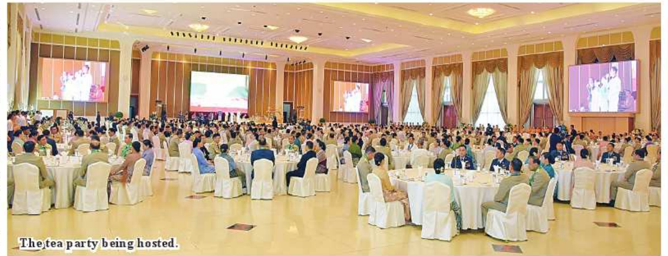
The tea party being hosted.

those present. Afterwards, the Senior General and his party hosted a tea party for the recipients of the honorary medals of the Tatmadaw, and the Myawady band performed dances and songs. After the ceremony, the Senior General and his party cordially greeted the recipients of the honorary medals. 100