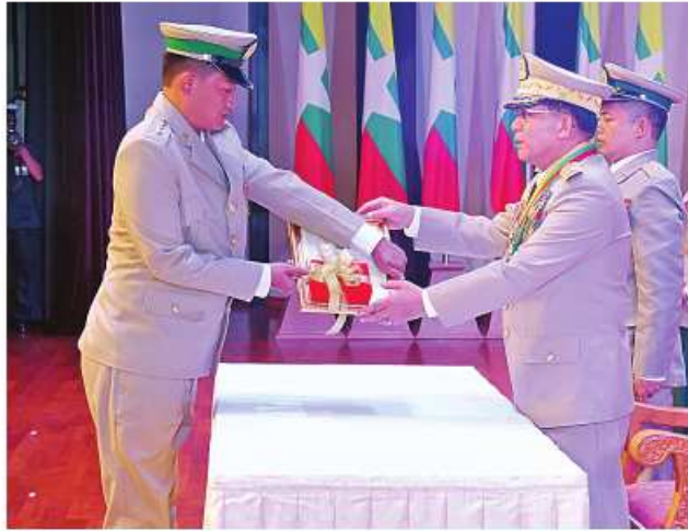
နိုင်ငံတော်စီမံအုပ်ချုပ်ရေးကောင်စီဥက္ကဋ္ဌ တပ်မတော်ကာကွယ်ရေးဦးစီးချုပ် ဗိုလ်ချုပ်မှူးကြီး သတိုးမဟာသရေစည်သူ သတိုးသီရိသုဓမ္မ မင်းအောင်လှိုင်က သူရဲကောင်းမှတ်တမ်းဝင်တံဆိပ်ရရှိသူ ပြန်တမ်းဝင်အမှတ် ကြည်း ၇၅၆၁၇ ဗိုလ်ကြီးမြိုးမြင့်မြတ်အား သူရဲကောင်းမှတ်တမ်းဝင်တံဆိပ် ပေးအပ်ချီးမြှင့်စဉ်။