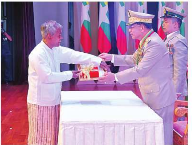
နိုင်ငံတော်စီမံအုပ်ချုပ်ရေးကောင်စီဥက္ကဋ္ဌ တပ်မတော်ကာကွယ်ရေးဦးစီးချုပ် ဗိုလ်ချုပ်မှူးကြီး သတိုးမဟာသရေစည်သူ သတိုးသီရိသုဓမ္မ မင်းအောင်လှိုင်က သူရဲကောင်းမှတ်တမ်းဝင်တံဆိပ်ရရှိသူ ကိုယ်ပိုင်အမှတ် တတ-၁၂၄၇၂၀ ဒုတိယတပ်ကြပ်တင်လင်းအောင်ကိုယ်စား မိခင် ဦးကျော်မြင့်အောင်အား သူရဲကောင်းမှတ်တမ်းဝင်တံဆိပ် ပေးအပ်ချီးမြှင့်စဉ်။