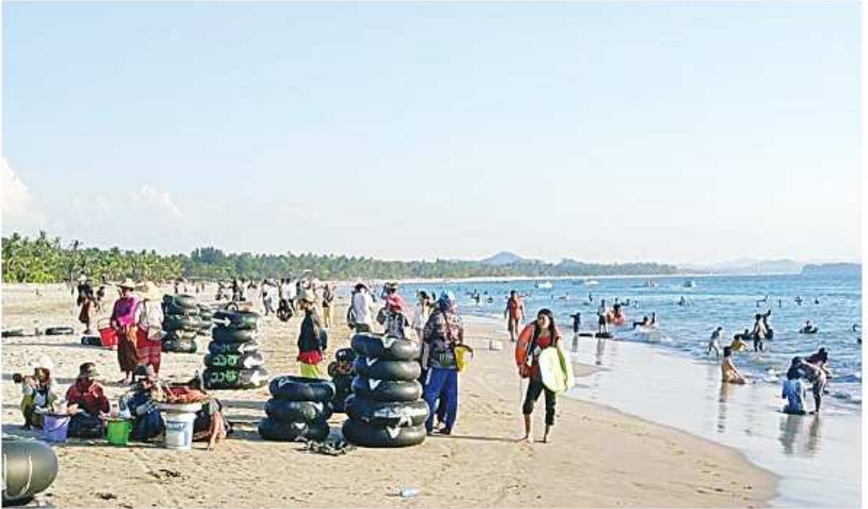
ဧရာဝတီတိုင်းဒေသကြီး ဈေးင်းသာကမ်းခြေ၌ လာရောက်အပန်းဖြေသူများဖြင့် ဧည့်ကားလျက်ရှိစဉ်။

ထို့ပြင် တန်ခိုးကြီးဘုရား လျက်ရှိသည်။ အထိမ်းအမှတ် ဂုဏ်ပြုမီးအလှထွန်းညှိခြင်းများ ဆောင်ရွက်ကြရာ အလားတူ နေပြည်တော် ကောင်စီနယ်မြေ၊ ရန်ကုန်၊ မန္တလေး၊ လာရောက်ကြည့်ရှုသူ မိဘပြည်သူများဖြင့် စည်ကားများပြားလျက်ရှိကြောင်း သတင်းရရှိသည်။