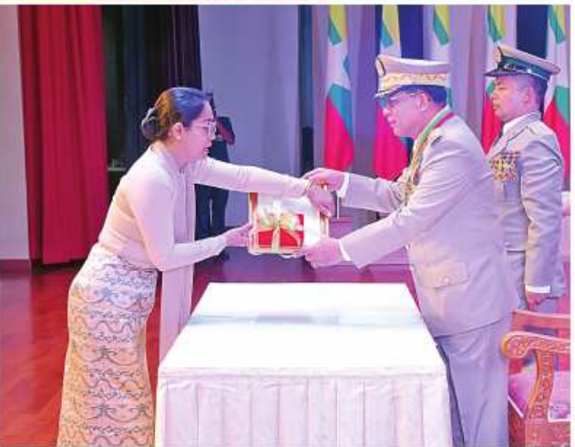
နိုင်ငံတော်စီမံအုပ်ချုပ်ရေးကောင်စီဥက္ကဋ္ဌ တပ်မတော်ကာကွယ်ရေး ဦးစီးချုပ် ပိုင်ချုပ်မျိုးကြီး သတိုးမဟာသရေစည်သူ သတိုးသီရိသုဓမ္မ မင်းအောင်လှိုင်က သူရဲကောင်းမှတ်တမ်းဝင်တံဆိပ်ရရှိသူ ပြန်တမ်းဝင် အမှတ် ကြည်း ၄၉၃၅၃ ဗိုလ်မှူးရဲကျော်သူကိုယ်စား ဇနီးဒေါ်ခင်ယုထွန်း အား သူရဲကောင်းမှတ်တမ်းဝင်တံဆိပ် ပေးအပ်ချီးမြှင့်စဉ်။