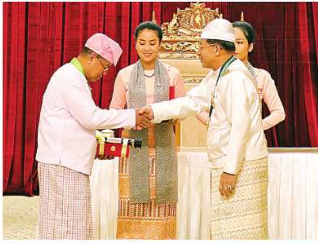
နိုင်ငံတော်စီမံအုပ်ချုပ်ရေးကောင်စီဥက္ကဋ္ဌ နိုင်ငံတော်ဝန်ကြီးချုပ် ဝိုင်းချုပ်မျိုးကြီး သတိုးမဟာသရေစည်သူ သတိုးသီရိသုဓမ္မမင်းအောင်လှိုင် ဝဏ္ဏကျော်ထင်ဘွဲ့ရရှိသူ မြန်မာနိုင်ငံတော်ဗဟိုဘဏ် ဒုတိယဥက္ကဋ္ဌ(အငြိမ်းစား) ဦးနေအေးအား ဂုဏ်ထူးဆောင်ဘွဲ့ ချီးမြှင့်အပ်နှင်းစဉ်။