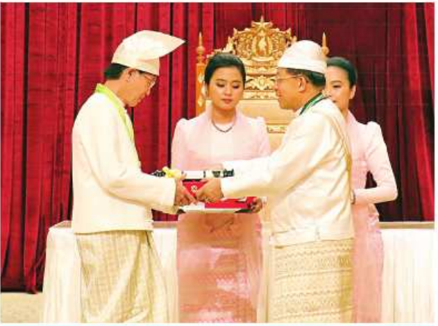
နိုင်ငံတော်စီမံအုပ်ချုပ်ရေးကောင်စီဥက္ကဋ္ဌ နိုင်ငံတော်ဝန်ကြီးချုပ် ဝိုင်းစိန်ဝင်း၊ သတိုးမဟာသရေစည်သူ သတိုးသီရိသုဓမ္မမင်းအောင်လှိုင် ဝဏ္ဏကျော်ထင်ဘွဲ့ ရရှိသူ ကျွန်းဘားအားကစားသမား ဦးမြင့်အောင်အား ဂုဏ်ထူးဆောင်ဘွဲ့ ချီးမြှင့်အပ်နှင်းခြင်း