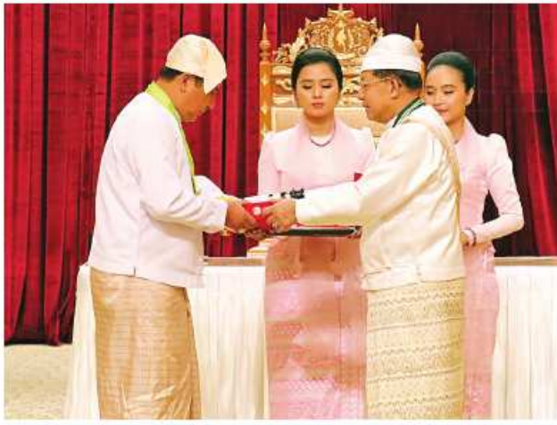
နိုင်ငံတော်စီမံအုပ်ချုပ်ရေးကောင်စီဥက္ကဋ္ဌ နိုင်ငံတော်ဝန်ကြီးချုပ် ဝိုင်းချုပ်မျိုးကြီး သတိုးမဟာသရေစည်သူ သတိုးသီရိသုဓမ္မမင်းအောင်လှိုင် ဝဏ္ဏကျော်ထင်ဘွဲ့ရရှိသူ နိုင်ငံတော်စီမံအုပ်ချုပ်ရေးကောင်စီရုံး ဒုတိယဝန်ကြီး ဦးစင်လတ်အား ဂုဏ်ထူးဆောင်ဘွဲ့ ချီးမြှင့်အပ်နှင်းစဉ်။