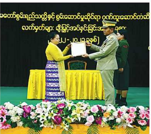
အလယ်ပိုင်းတိုင်းစစ်ဌာနချုပ် တိုင်းမှူး ဗိုလ်ချုပ်ကြည်နိုင်က တပ်မတော်စွမ်းရည်သတ္တိဆိုင်ရာ ဂုဏ်ထူးဆောင်ဘွဲ့တံဆိပ်နှင့် လက်မှတ်များ ပေးအပ်စဉ်။