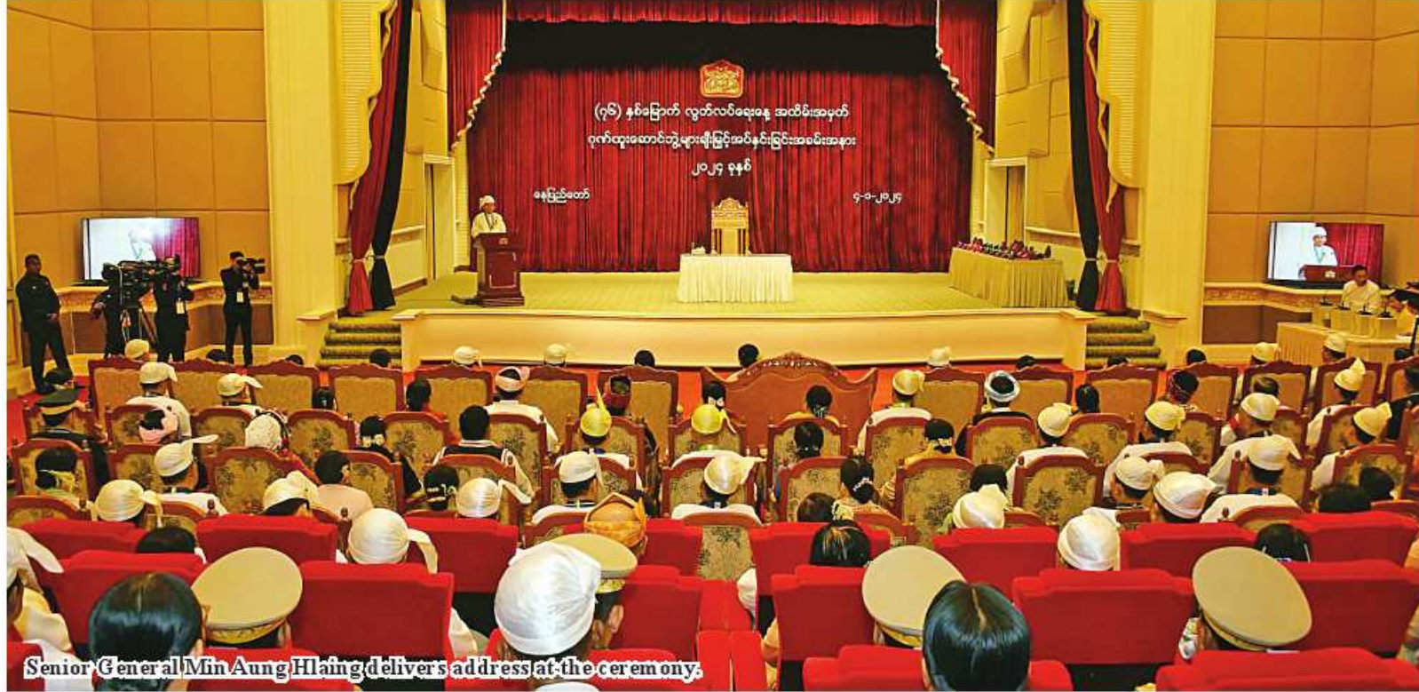
Senior General Min Aung Hlaing delivers address at the ceremony.

While striving for ensuring perpetuity of the Union, it is necessary to specially emphasize nation-building endeavour processes such as peace and stability of the whole Union, rule of law, promotion of State economy, enhancement of socio-economic life of the entire people, and cementing genuine, disciplined multiparty democratic system.