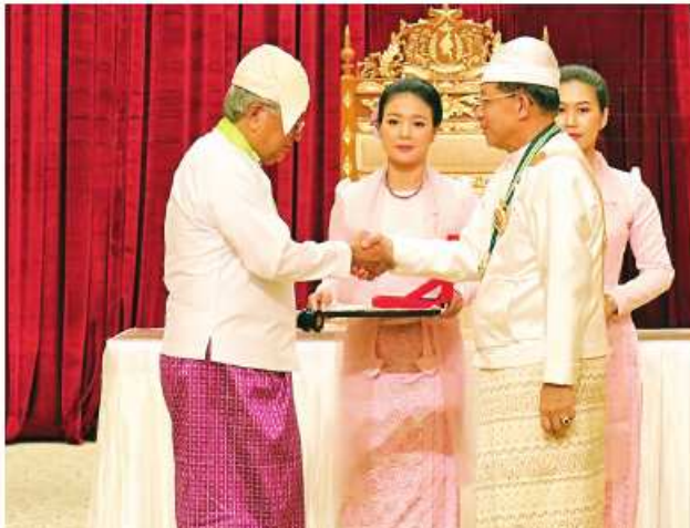
နိုင်ငံတော်စီမံအုပ်ချုပ်ရေးကောင်စီဥက္ကဋ္ဌ နိုင်ငံတော်ဝန်ကြီးချုပ် ဝိုင်းချုပ်မျိုးကြီး သတိုးမဟာသရေစည်သူ သတိုးသီရိသုဓမ္မမင်းအောင်လှိုင် ဝဏ္ဏကျော်ထင်ဘွဲ့ရရှိသူ နိုင်ငံခြားရေးဝန်ကြီးဌာန သံအမတ်ကြီး (အငြိမ်းစား) ဦးဝင်းလှိုင်အား ဂုဏ်ထူးဆောင်ဘွဲ့ ချီးမြှင့်အပ်နှင်းစဉ်။