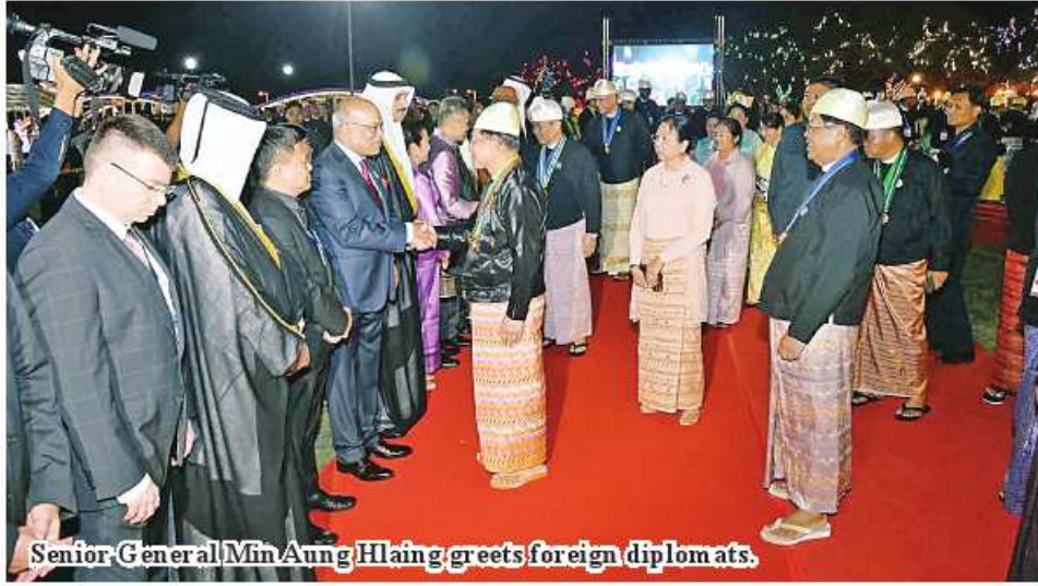
Senior General Min Aung Hlaing greets foreign diplomats.