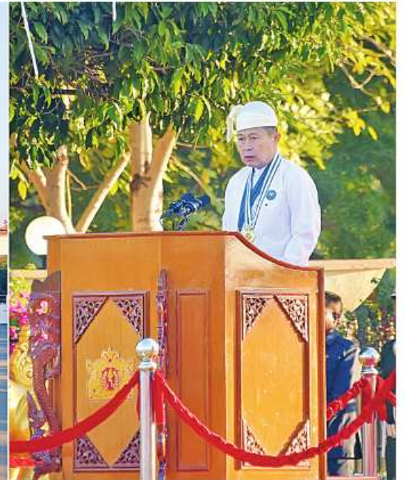
နိုင်ငံတော်စီမံအုပ်ချုပ်ရေးကောင်စီဒုတိယဥက္ကဋ္ဌ ဒုတိယဝန်ကြီးချုပ် ဒုတိယဗိုလ်ချုပ်မှူးကြီး သီရိပျံချီ မဟာသရေစည်သူစိုးဝင်းက နိုင်ငံတော်စီမံအုပ်ချုပ်ရေးကောင်စီဥက္ကဋ္ဌ နိုင်ငံတော်ဝန်ကြီးချုပ် ဗိုလ်ချုပ်မှူးကြီး သတိုးမဟာသရေစည်သူ သတိုးသီရိသုဓမ္မမင်းအောင်လှိုင်ထံမှ (၇၆)နှစ်မြောက် လွတ်လပ်ရေးနေ့အခမ်းအနားသို့ပေးပို့သည့်သဝဏ်လွှာကို ဖတ်ကြားစဉ်။

နေပြည်တော် ဇန်နဝါရီ ၄ ၂၀၂၄ခုနှစ် (၇၆)နှစ်မြောက် လွတ်လပ်ရေးနေ့ နိုင်ငံတော်အလံတင်အခမ်းအနားနှင့် နိုင်ငံတော်အလံအလေးပြုပွဲအခမ်းအနားကို ယနေ့နံနက်ပိုင်းတွင် နေပြည်တော် မြို့တော်ခန်းမရွှေရင်ပြင်၌ ကျင်းပပြုလုပ်သည်။ အခမ်းအနားကို အမျိုးသားအကျိုးစီးပွားနှင့် အမျိုးသားနိုင်ငံရေးဖြစ်သည် ပြည်ထောင်စုမပြိုကွဲရေး၊ တိုင်းရင်းသားစည်းလုံးညီညွတ်မှုမပြိုကွဲရေးနှင့် အချုပ်အခြာအာဏာ တည်တံ့ခိုင်မြဲရေးဟူသည့် ဒို့တာဝန်အရေးသုံးပါးကို ထိန်းသိမ်းဆောင်ရွက်ရေး၊ ခေတ်မီဖွံ့ဖြိုးတိုးတက်ပြီး ဒီမိုကရေစီ နှင့် ဖယ်ဒရယ်စနစ်ကိုအခြေခံသည့် ပြည်ထောင်စုစနစ် တည်ဆောက်ရာတွင် အသိပညာ၊ အတတ်ပညာ၊ ပင်ကိုအရည်အသွေး၊ စွမ်းရည်များနှင့် ပြည့်စုံသည့် လူ့စွမ်းအားအရင်းအမြစ်များ မွေးထုတ်ပေးနိုင်သည့် ဘက်စုံပညာရေးကဏ္ဍကိုမြှင့်တင်ကြိုးပမ်းဆောင်ရွက်ရေး၊ ဥပဒေနှင့်အညီ လွတ်လပ်၍ တရားမျှတသည့်ရွေးကောက်ပွဲကျင်းပနိုင်ရေးနှင့် တစ်နိုင်လုံးအကြားအလပ်မရှိ ဆန္ဒမေးပိုင်ခွင့်ရရှိစေရေး အတွက်ကြိုးပမ်းဆောင်ရွက်ရေး၊ အကြမ်းဖက်ဖြစ်စဉ်များ အားလုံးချုပ်ငြိမ်းပြီး