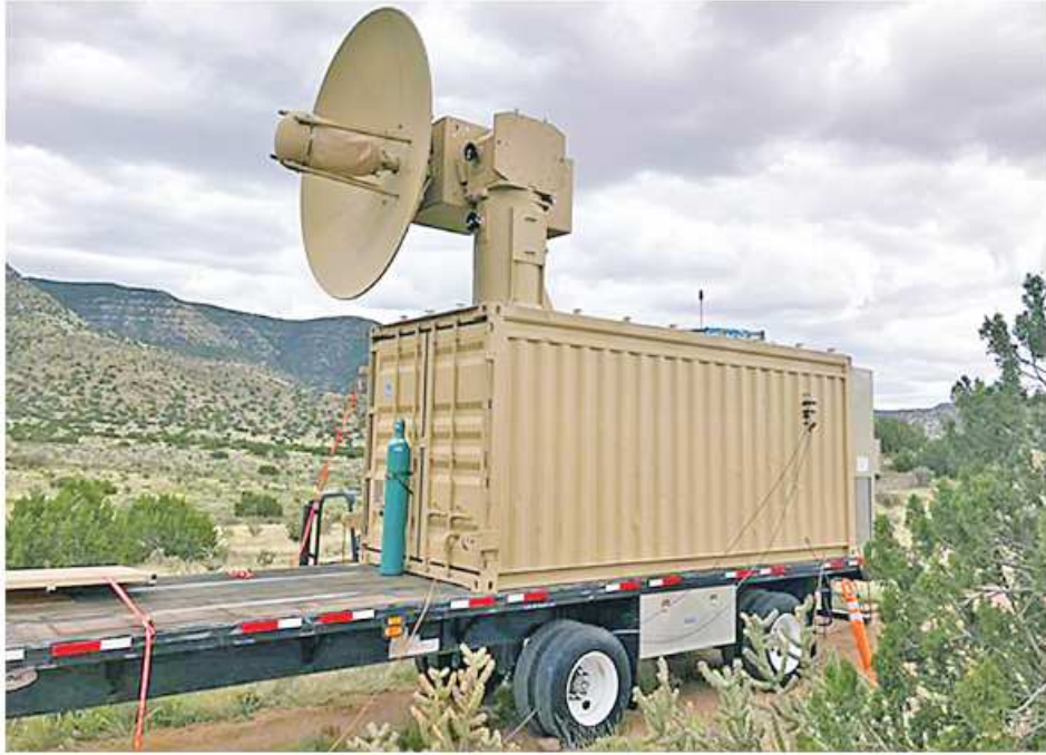
အမေရိကန်နိုင်ငံထုတ် THOR မိုက်ခရိုဝေ့ဒရုန်းကို တွေ့ရစဉ်။

အမေရိကန်နိုင်ငံ ပင်တဂွန်စစ်ဌာနချုပ်သည် ဒရုန်းများ၏ ခြိမ်းခြောက်မှုကို ပျက်ပြယ်စေရန် မိုက်ခရိုဝေ့ဒရုန်းတန်ပြန်လက်နက်များ အသုံးပြုနိုင်ရေး အမေရိကန်စစ်ဘက် ကြိုးပမ်းခဲ့ကြောင်း ရုရှားနိုင်ငံပိုင် Sputnik သတင်းဌာနက ရေးသားဖော်ပြထားသည်။