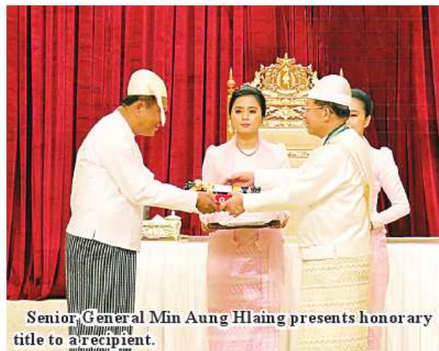
Senior General Min Aung Hlaing presents honorary title to a recipient.