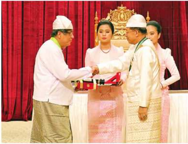
နိုင်ငံတော်စီမံအုပ်ချုပ်ရေးကောင်စီဥက္ကဋ္ဌ နိုင်ငံတော်ဝန်ကြီးချုပ် ဝိုင်းချုပ်မျိုးကြီး သတိုးမဟာသရေစည်သူ သတိုးသီရိသုဓမ္မမင်းအောင်လှိုင် ဝဏ္ဏကျော်ထင်ဘွဲ့ရရှိသူ ဘောလုံးအားကစားသမား ဦးအေးမောင်ကြီးအား ဂုဏ်ထူးဆောင်ဘွဲ့ ချီးမြှင့်အပ်နှင်းစဉ်။