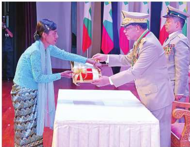
နိုင်ငံတော်စီမံအုပ်ချုပ်ရေးကောင်စီဥက္ကဋ္ဌ တပ်မတော်ကာကွယ်ရေးဦးစီးချုပ် ဗိုလ်ချုပ်မှူးကြီး သတိုးမဟာသရေစည်သူ သတိုးသီရိသုဓမ္မ မင်းအောင်လှိုင်က သူရဲကောင်းမှတ်တမ်းဝင်တံဆိပ်ရရှိသူ ပြန်တမ်းဝင်အမှတ် လေ ၄၃၄၉ ဗိုလ်ကြီးအောင်မြိုးကျော်ကိုယ်စား မိခင်ဒေါ်အေးအေးခိုင်အား သူရဲကောင်းမှတ်တမ်းဝင်တံဆိပ် ပေးအပ်ချီးမြှင့်စဉ်။