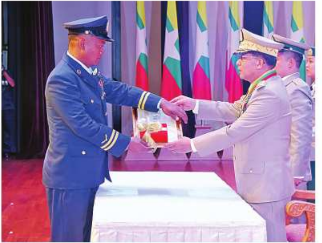
နိုင်ငံတော်စီမံအုပ်ချုပ်ရေးကောင်စီဥက္ကဋ္ဌ တပ်မတော်ကာကွယ်ရေးဦးစီးချုပ် ဗိုလ်ချုပ်မှူးကြီး သတိုးမဟာသရေစည်သူ သတိုးသီရိသုဓမ္မ မင်းအောင်လှိုင်က သူရဲကောင်းမှတ်တမ်းဝင်တံဆိပ်ရရှိသူ ပြန်တမ်းဝင်အမှတ် လေ ၃၅၀၅ ဗိုလ်ကြီးရဲလင်းကျော်အား သူရဲကောင်းမှတ်တမ်းဝင်တံဆိပ် ပေးအပ်ချီးမြှင့်စဉ်။