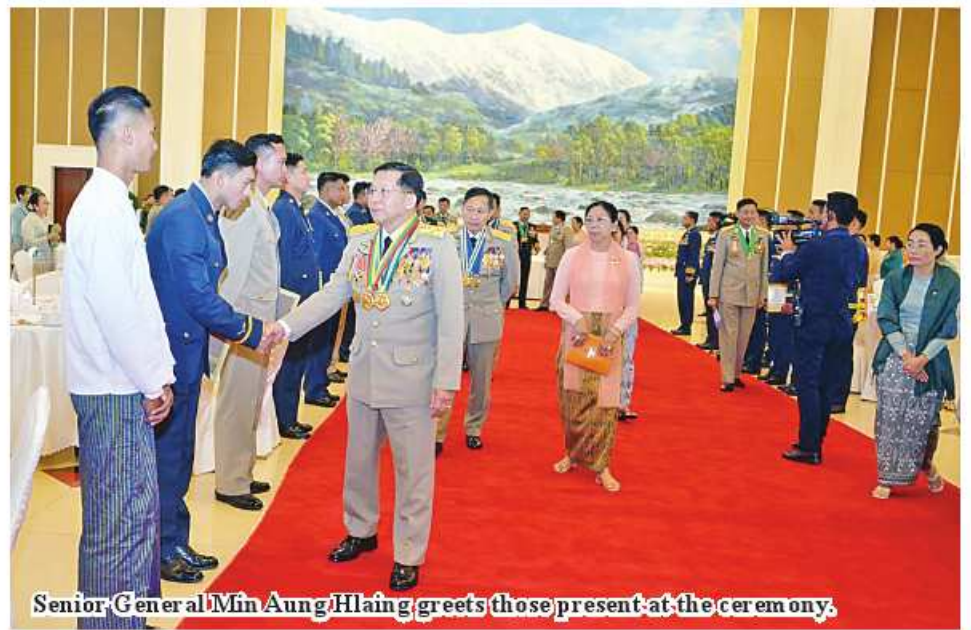
Senior General Min Aung Hlaing greets those present at the ceremony.

As in the past, the powerful colonial countries are still trying to dominate and manipulate the small countries by applying political, economic and social means for their own interest. First, they use technology and