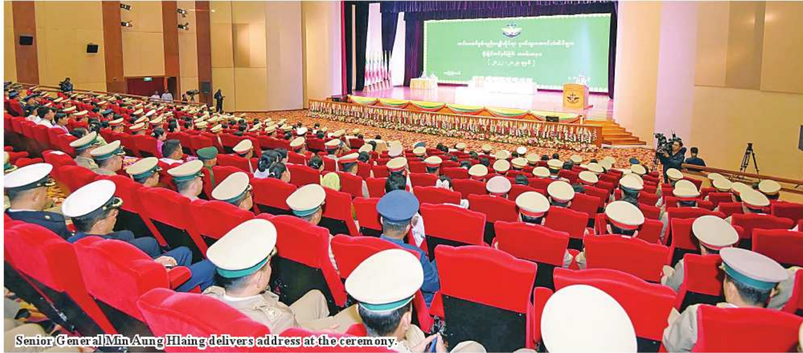
Senior General Min Aung Hlaing delivers address at the ceremony.

relations with every human and country. Even though the country is adhering to the said policy, there were attempts to threaten its independence and sovereignty. In this regard, the Tatmadaw had to launch many historic battles against the destructive acts in accord with its fine traditions. Soldiers who fearlessly took part in the battles with the conviction "the brave die but once, and with honour" go down in the annals of history as the real heroes. They will never be forgotten and their names will ever shine.