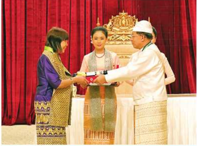
နိုင်ငံတော်စီမံအုပ်ချုပ်ရေးကောင်စီဥက္ကဋ္ဌ နိုင်ငံတော်ဝန်ကြီးချုပ် ဝိုင်းစိန်ဝင်း၊ သတိုးမဟာသရေစည်သူ သတိုးသီရိသုဓမ္မမင်းအောင်လှိုင် ဝဏ္ဏကျော်ထင်ဘွဲ့ ရရှိသူ မြေးစုနီပစ်အားကစားသမား ဒေါ်သန်းသန်းအား ဂုဏ်ထူးဆောင်ဘွဲ့ ချီးမြှင့်အပ်နှင်းခြင်း