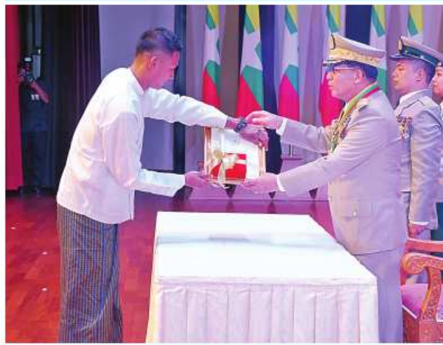
နိုင်ငံတော်စီမံအုပ်ချုပ်ရေးကောင်စီဥက္ကဋ္ဌ တပ်မတော်ကာကွယ်ရေး ဦးစီးချုပ် ပိုင်ချုပ်မျိုးကြီး သတိုးမဟာသရေစည်သူ သတိုးသီရိသုဓမ္မ မင်းအောင်လှိုင်က သူရဲကောင်းမှတ်တမ်းဝင်တံဆိပ်ရရှိသူ ပြန်တမ်းဝင် အမှတ် ကြည်း ၇၂၂၄၇ ဗိုလ်မှူးစိုးလှိုင်ဝင်းသန့်ကိုယ်စား အစ်ကိုဖြစ်သူ ဦးအောင်စိုးမင်းသန့်အား သူရဲကောင်းမှတ်တမ်းဝင်တံဆိပ် ပေးအပ်ချီးမြှင့်စဉ်။