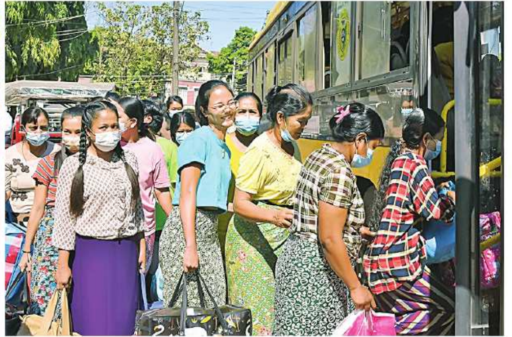
နိုင်ငံတစ်ဝန်းရှိ အကျဉ်းထောင်၊ အချုပ်ထောင်၊ စခန်းအသီးသီးမှ ပြစ်ဒဏ်ကျခံနေရသည့် အကျဉ်းသား၊အကျဉ်းသူများ လွတ်ငြိမ်းချမ်းသာခွင့်ဖြင့် ပြန်လည်လွတ်မြောက်လာမှုကို တွေ့ရစဉ်။

နေပြည်တော် ၈နိုဝင်ဘာ ၄ ပြည်ထောင်စုသမ္မတ မြန်မာနိုင်ငံတော် နိုင်ငံတော် စီမံအုပ်ချုပ်ရေးကောင်စီသည် ယနေ့တွင်ကျရောက်သည့် (၇၆)နှစ်မြောက် လွတ်လပ်ရေးနေ့ အထိမ်းအမှတ်နေ့ကို ဂုဏ်ပြုသောအားဖြင့် ပြည်သူ့လူထု နှလုံးစိတ်ဝမ်းအေးချမ်းစေရန်နှင့် လူမှုရေးအရ ဝေဖန်မှုများကို နှိမ်နင်းမှုများ ပြုလုပ်ခဲ့သည့် အကျဉ်းထောင်၊ အချုပ်ထောင်၊ စခန်းအသီးသီးတွင် ပြစ်ဒဏ်ကျခံနေရသည့် အကျဉ်းသား၊ အကျဉ်းသူ ၉၇၆၆ ဦးနှင့် နိုင်ငံခြားသားအကျဉ်းသား၊ အကျဉ်းသူ ၁၁၄ ဦး စုစုပေါင်း ၉၇၆၆ဦး တို့ကို ရာဇဝတ်ကျင့်ထုံးဥပဒေပုဒ်မ ၄၀၁၊ ပုဒ်မ ၃၅(၁)အရ နောက်တစ်ကြိမ်ပြစ်မှုထပ်မံ ကျူးလွန်ပါက ၎င်းပြစ်ဒဏ်အပြင် ယခု ကျခံရန်ကျန်ရှိသော ပြစ်ဒဏ်များကိုပါ ဆက်လက်ကျခံပါမည်ဟူသော စည်းကမ်း သတ်မှတ်ချက်များဖြင့် ယင်းတို့ကျခံရန် ကျန်ရှိသော ပြစ်ဒဏ်များကို လျှော့ပေါ့၍ လွတ်ငြိမ်းခွင့်ပြုလိုက်ကြောင်း သိရှိရသည်။ နိုင်ငံတော်အနေဖြင့် ပြစ်မှုကျူးလွန်ခဲ့သည့် အကျဉ်းသား၊အကျဉ်းသူများကို ၎င်းတို့ကျူးလွန်ခဲ့သည့်ပြစ်မှုများအရ အကျဉ်းထောင်အတွင်း ပြစ်ဒဏ်များချမှတ်ခဲ့သော်လည်း အကျဉ်းထောင်နှင့်အကျဉ်းစခန်းများအတွင်း လူမှုရေး၊ ကျန်းမာရေးဆိုင်ရာများ နှင့်အခြားရသင့်သည့် လူ့အခွင့်အရေးစံချိန်စံညွှန်းများနှင့်အညီ ကောင်းမွန်ပြည့်စုံစွာ ဆောင်ရွက်ပေးထားသည်အတွက် ယခုပြန်လည်လွတ်မြောက်လာသည့် အချိန်တွင် ကျန်းမာရေးနှင့်လျက်ရှိပြီးလာရောက်ကြိုဆိုသည့် မိဘဆွေမျိုးများကလည်း ဝမ်းပန်းတသာဖြင့် ကြိုဆိုခဲ့ကြကြောင်း သတင်းရရှိသည်။