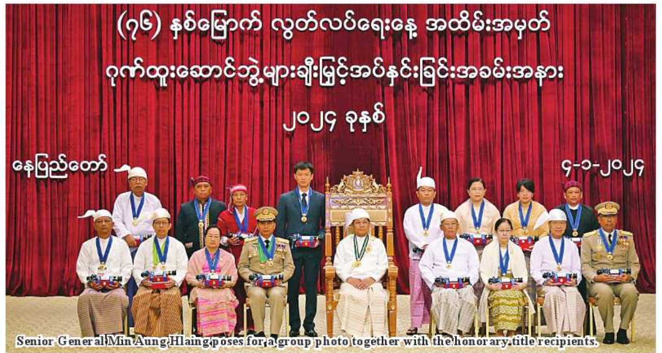
Senior General Min Aung Hlaing poses for a group photo together with the honorary title recipients.

country in the global community on a grand scale on 4 January 1948. Hence, today