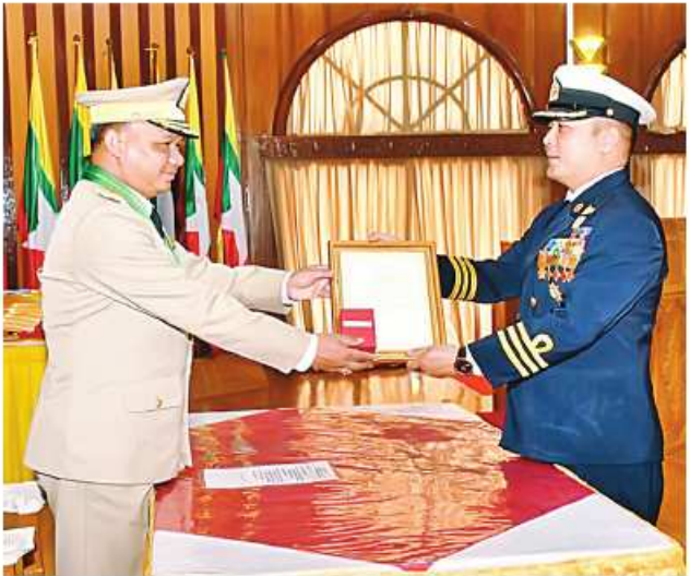
ရန်ကုန်တိုင်းစစ်ဌာနချုပ် တိုင်းမှူး ဗိုလ်ချုပ်စောဟိန်းက တပ်မတော်စွမ်းရည်သတ္တိဆိုင်ရာ ဂုဏ်ထူးဆောင်ဘွဲ့တံဆိပ်နှင့် လက်မှတ်များ ပေးအပ်စဉ်။