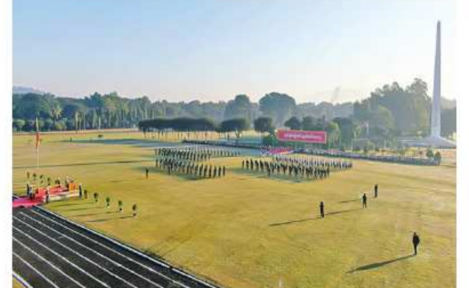
အလယ်ပိုင်းတိုင်းစစ်ဌာနချုပ်၌ (၇၆)နှစ်မြောက် လွတ်လပ်ရေးနေ့စစ်ရေးပြ အခမ်းအနား ကျင်းပစဉ်။

ထို့နောက် တိုင်းစစ်ဌာနချုပ် များအလိုက် (၇၆)နှစ်မြောက် လွတ်လပ်ရေးနေ့ အထိမ်းအမှတ် ပျော်ပွဲရွှင်ပွဲ အားကစားပြိုင်ပွဲများကို ကျင်းပပြုလုပ်ပြီး အားကစားပြိုင်ပွဲ များအလိုက် ဆုရရှိသူများကို တိုင်းမှူးများနှင့် တာဝန်ရှိသူများက ဆုများ အသီးသီးပေးအပ်ခဲ့ကြ ကြောင်း သတင်းရရှိသည်။