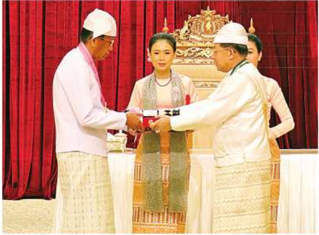
နိုင်ငံတော်စီမံအုပ်ချုပ်ရေးကောင်စီဥက္ကဋ္ဌ နိုင်ငံတော်ဝန်ကြီးချုပ် ဝိုင်းစိန်ဝင်း၊ သတိုးမဟာသရေစည်သူ သတိုးသီရိသုဓမ္မမင်းအောင်လှိုင် သိပ္ပံကျော်စွာဘွဲ့ ရရှိသူ ပို့ဆောင်ရေးနှင့်ဆက်သွယ်ရေး ဝန်ကြီးဌာန ဒုတိယဝန်ကြီး ဦးအောင်မြင်အား ဂုဏ်ထူးဆောင်ဘွဲ့ ချီးမြှင့်အပ်နှင်းခြင်း