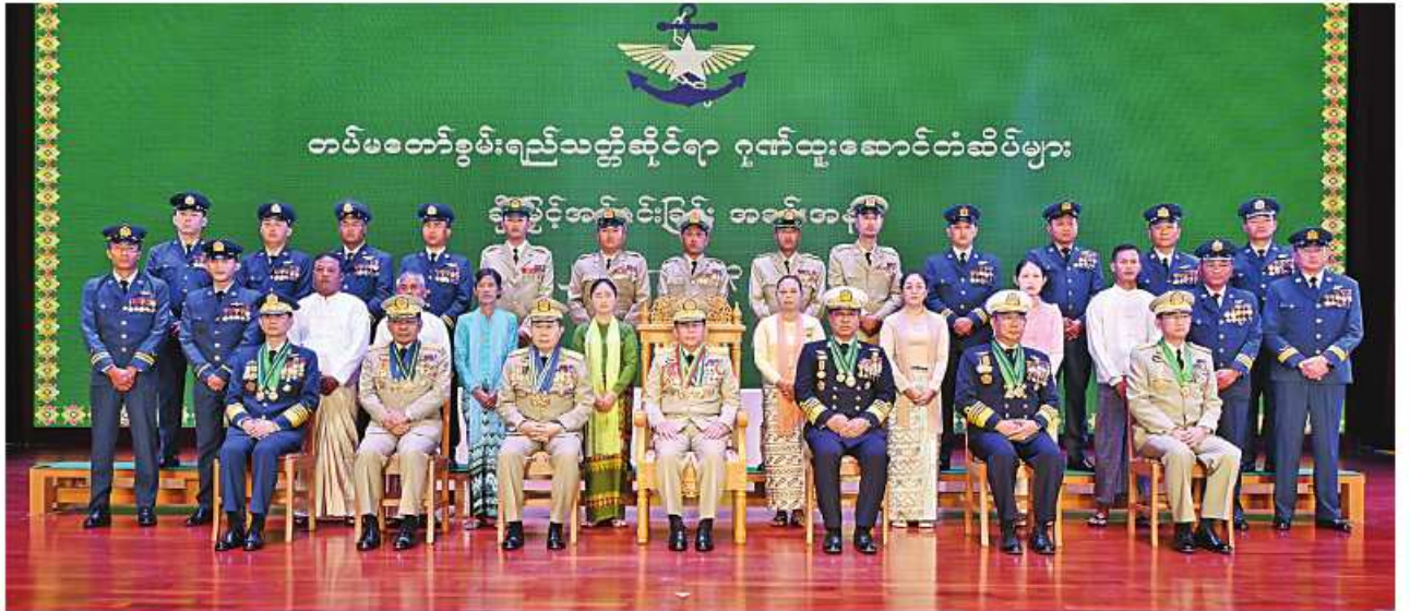
နိုင်ငံတော်စီမံအုပ်ချုပ်ရေးကောင်စီဥက္ကဋ္ဌ တပ်မတော်ကာကွယ်ရေးဦးစီးချုပ် ဗိုလ်ချုပ်မှူးကြီး သတိုးမဟာသရေစည်သူ သတိုးသီရိသုဓမ္မ မင်းအောင်လှိုင်နှင့် အဖွဲ့ဝင်များ၊ တပ်မတော်စွမ်းရည်သတ္တိဆိုင်ရာ ဂုဏ်ထူးဆောင်တံဆိပ်များရရှိခဲ့သည့် အရာရှိ စစ်သည်များ၊ အမွေခံများနှင့်အတူ အမှတ်တရပေါင်းစာတံပုံရိုက်စဉ်။