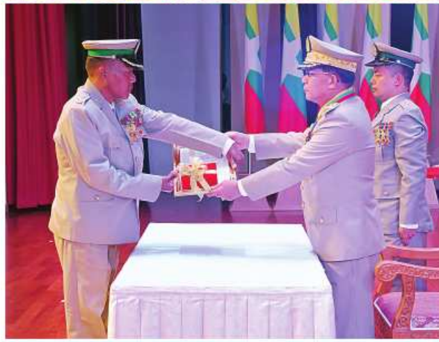
နိုင်ငံတော်စီမံအုပ်ချုပ်ရေးကောင်စီဥက္ကဋ္ဌ တပ်မတော်ကာကွယ်ရေး ဦးစီးချုပ် ပိုင်ချုပ်မျိုးကြီး သတိုးမဟာသရေစည်သူ သတိုးသီရိသုဓမ္မ မင်းအောင်လှိုင်က သူရဲကောင်းမှတ်တမ်းဝင်တံဆိပ်ရရှိသူ ပြန်တမ်းဝင် အမှတ် ကြည်း ၃၇၂၀၆ ဒုတိယဗိုလ်မှူးကြီးလှိုင်မျိုးထွန်းအား သူရဲကောင်း မှတ်တမ်းဝင်တံဆိပ် ပေးအပ်ချီးမြှင့်စဉ်။

နိုင်ငံတော်စီမံအုပ်ချုပ်ရေး ကောင်စီဥက္ကဋ္ဌ တပ်မတော်ကာကွယ်ရေး ဦးစီးချုပ် ပိုင်ချုပ်မျိုးကြီး သတိုးမဟာသရေစည်သူ သတိုးသီရိသုဓမ္မ မင်းအောင်လှိုင် တပ်မတော် စွမ်းရည်သတ္တိဆိုင်ရာ ဂုဏ်ထူးဆောင်တံဆိပ်များ ချီးမြှင့်အပ်နှင်းခြင်း အခမ်းအနားတွင် ဂုဏ်ပြုအမှာစကား ပြောကြားစဉ်။