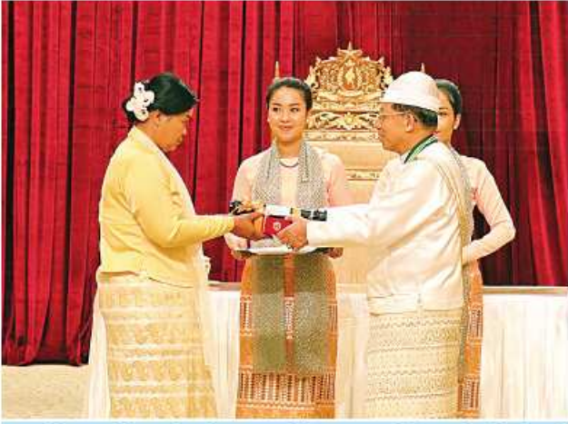
နိုင်ငံတော်စီမံအုပ်ချုပ်ရေးကောင်စီဥက္ကဋ္ဌ နိုင်ငံတော်ဝန်ကြီးချုပ် ဝိုင်းစိန်ဝင်း၊ သတိုးမဟာသရေစည်သူ သတိုးသီရိသုဓမ္မမင်းအောင်လှိုင် အလင်္ကာကျော်စွာဘွဲ့ ရရှိသူ စာရေးဆရာ ဦးညိုမြ (ကိုယ်စား)(မြေး) ဒေါ်သိန်းသိန်းစောအား ဂုဏ်ထူးဆောင်ဘွဲ့ ချီးမြှင့်အပ်နှင်းခြင်း