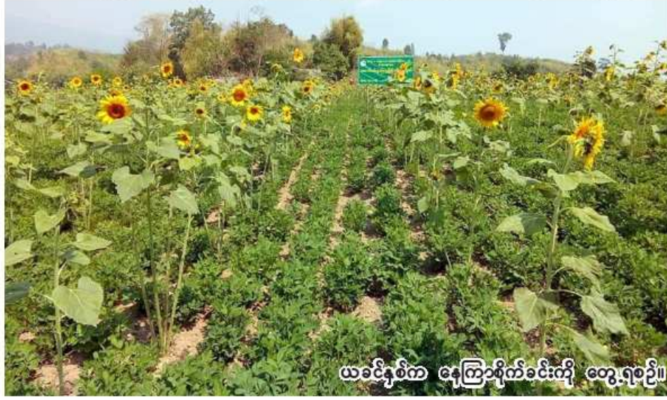
ယခင်နှစ်က နေကြာစိုက်ခင်းကို တွေ့ရစဉ်။

စစ်ကိုင်းတိုင်းဒေသကြီး စစ်ကိုင်းခရိုင် မြောင်မြို့နယ်တွင် ဆောင်းသီးနှံစိုက်ပျိုးရာသီ၌ နေကြာ ၁၂၉၈၇ ဧက စိုက်ပျိုးပြီးစီးပြီးဖြစ်ကြောင်း စစ်ကိုင်းခရိုင် စိုက်ပျိုးရေးဦးစီးဌာန ဦးစီးမှူး ဒေါ်သီတာလွင်က ပြောပြခဲ့သည်။