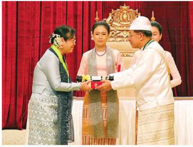
နိုင်ငံတော်စီမံအုပ်ချုပ်ရေးကောင်စီဥက္ကဋ္ဌ နိုင်ငံတော်ဝန်ကြီးချုပ် ဝိုင်းချုပ်မျိုးကြီး သတိုးမဟာသရေစည်သူ သတိုးသီရိသုဓမ္မမင်းအောင်လှိုင် ဝဏ္ဏကျော်ထင်ဘွဲ့ရရှိသူ အမျိုးသားစီမံကိန်းနှင့် စီးပွားရေးဖွံ့ဖြိုးတိုးတက်မှုဝန်ကြီးဌာန ဒုတိယဝန်ကြီး(အငြိမ်းစား) ဒေါ်လှလှသိန်းအား ဂုဏ်ထူးဆောင်ဘွဲ့ ချီးမြှင့်အပ်နှင်းစဉ်။