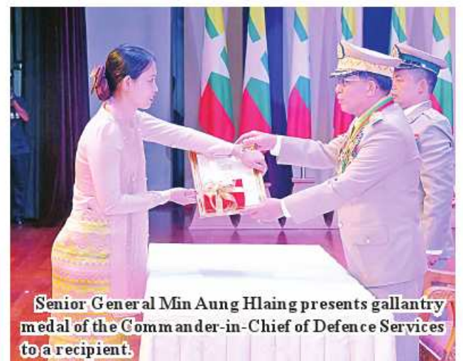
Senior General Min Aung Hlaing presents gallantry medal of the Commander-in-Chief of Defence Services to a recipient.