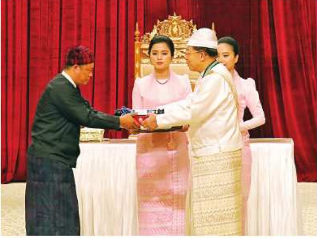
နိုင်ငံတော်စီမံအုပ်ချုပ်ရေးကောင်စီဥက္ကဋ္ဌ နိုင်ငံတော်ဝန်ကြီးချုပ် ဝိုင်းစိန်ဝင်း၊ သတိုးမဟာသရေစည်သူ သတိုးသီရိသုဓမ္မမင်းအောင်လှိုင် သီရိပျံချဘွဲ့ ရရှိသူ ကဗျင်္ဂကျော်စွာဘွဲ့ ရရှိသူ (အငြိမ်းစား) ဒုပါစော့ရစ်(ကိုယ်စား) (မြေး)ဦးဆိုင်အောင်အား ဂုဏ်ထူးဆောင်ဘွဲ့ ချီးမြှင့်အပ်နှင်းခြင်း