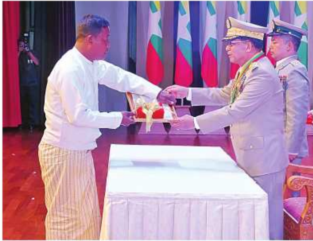
နိုင်ငံတော်စီမံအုပ်ချုပ်ရေးကောင်စီဥက္ကဋ္ဌ တပ်မတော်ကာကွယ်ရေးဦးစီးချုပ် ဗိုလ်ချုပ်မှူးကြီး သတိုးမဟာသရေစည်သူ သတိုးသီရိသုဓမ္မ မင်းအောင်လှိုင်က သူရဲကောင်းမှတ်တမ်းဝင်တံဆိပ်ရရှိသူ ပြန်တမ်းဝင်အမှတ် ကြည်း ၇၇၉၀၇ ဗိုလ်ကြီးဝေလင်းစိုးကိုယ်စား မိခင် ဦးအောင်သိုက်အား သူရဲကောင်းမှတ်တမ်းဝင်တံဆိပ် ပေးအပ်ချီးမြှင့်စဉ်။