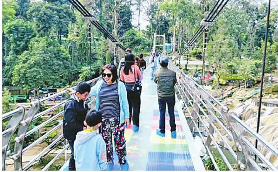
မန္တလေးတိုင်းဒေသကြီး ပြင်ဦးလွင်မြို့ရှိ ပွဲကောက်ရေတံခွန် အပန်းဖြေစခန်း၌ လာရောက်အပန်းဖြေသူများဖြင့် ဧည့်ကားလျက်ရှိစဉ်။

နေပြည်တော် ဧပြီ ၄ ယနေ့သည် မြန်မာတစ်မျိုးသားလုံး ဝမ်းသာပျော်ရွှင်မဆုံးဖြစ်ရသော (၇၆)နှစ်မြောက် လွတ်လပ်ရေးနေ့