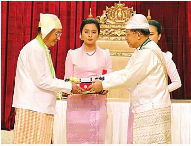
နိုင်ငံတော်စီမံအုပ်ချုပ်ရေးကောင်စီဥက္ကဋ္ဌ နိုင်ငံတော်ဝန်ကြီးချုပ် ဝိုင်းချုပ်မျိုးကြီး သတိုးမဟာသရေစည်သူ သတိုးသီရိသုဓမ္မမင်းအောင်လှိုင် ဝဏ္ဏကျော်ထင်ဘွဲ့ရရှိသူ စွမ်းအင်ဝန်ကြီးဌာန၊ အလုပ်သမား၊ အလုပ်အကိုင်နှင့် လူမှုဖူလုံရေးဝန်ကြီးဌာန ဒုတိယဝန်ကြီး(အငြိမ်းစား) ဦးထင်အောင်အား ဂုဏ်ထူးဆောင်ဘွဲ့ ချီးမြှင့်အပ်နှင်းစဉ်။