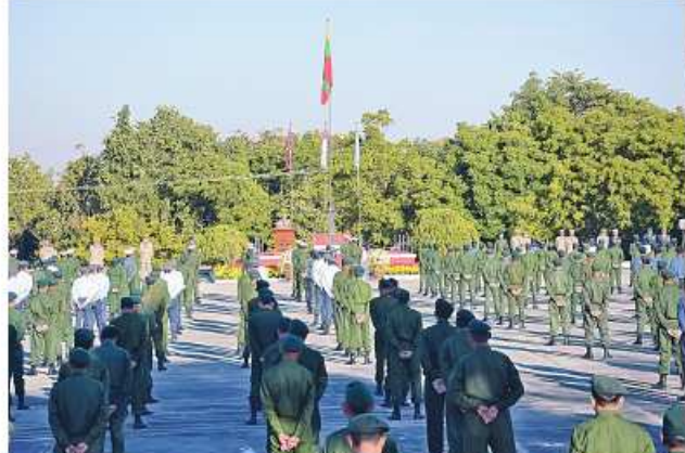
ကာကွယ်ရေးဦးစီးချုပ်ရုံး(ကြည်း) ဝင်းအတွင်း၌ (၇၆)နှစ်မြောက် ပျော်ပွဲရွှင်ပွဲ အားကစားပြိုင်ပွဲများ ကျင်းပစဉ်။