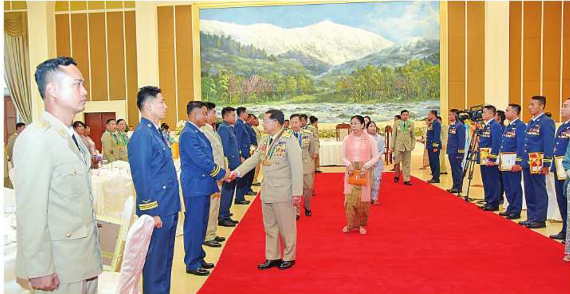
နိုင်ငံတော်စီမံအုပ်ချုပ်ရေးကောင်စီဥက္ကဋ္ဌ တပ်မတော်ကာကွယ်ရေးဦးစီးချုပ် ဗိုလ်ချုပ်မှူးကြီး သတိုးမဟာသရေစည်သူ သတိုးသိရိသုဓမ္မဓင်းအောင်လှိုင်နှင့် ဇနီး ဒေါ်ကြူကြူလှတို့က တပ်မတော်စွမ်းရည်သတ္တိဆိုင်ရာဂုဏ်ထူးဆောင်တံဆိပ်များ ချီးမြှင့်ခံရသူ များနှင့် အမွေခံများကို ရင်းရင်းနှီးနှီးနှုတ်ဆက်စဉ်။

အရာခံပိုလ် တစ်ဦး၊ ဒုတိယတပ်ကြပ် တစ်ဦး တို့အား ဆုတံဆိပ်များ အသီးသီးပေးအပ် ချီးမြှင့်သည်။