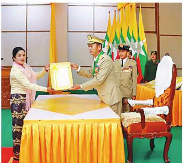
အရှေ့မြောက်တိုင်းစစ်ဌာနချုပ် တိုင်းမှူး ဗိုလ်ချုပ်ခိုင်ခိုင်ဦးက တပ်မတော်စွမ်းရည်သတ္တိဆိုင်ရာ ဂုဏ်ထူးဆောင်ဘွဲ့တံဆိပ်နှင့် လက်မှတ်များ ပေးအပ်စဉ်။

ဆောင်ဘွဲ့တံဆိပ်နှင့် လက်မှတ်များ ရရှိကြသူများကို နိုင်ငံတော် စီမံအုပ်ချုပ်ရေး ကောင်စီဥက္ကဋ္ဌ တပ်မတော်ကာကွယ်ရေးဦးစီးချုပ် ကိုယ်စား တိုင်းမှူးများနှင့် တာဝန်ရှိသူများက တပ်မတော်စွမ်းရည်သတ္တိဆိုင်ရာ ဂုဏ်ထူးဆောင်ဘွဲ့တံဆိပ်နှင့် လက်မှတ်များ ပေးအပ်ခဲ့ကြသည်။ ထို့နောက် တိုင်းမှူးများနှင့် တာဝန်ရှိသူများသည် တပ်မတော် စွမ်းရည်သတ္တိဆိုင်ရာ ဂုဏ်ထူးဆောင်ဘွဲ့တံဆိပ်နှင့် လက်မှတ်များ ရရှိကြသူများနှင့်အတူ အမှတ်တရ စုပေါင်း ဓာတ်ပုံရိုက်ခဲ့ကြပြီး လက်ဖက်ရည်ပိုင်းဖြင့် တည်ခင်းညှော်ခဲ့ကြကြောင်း သတင်းရရှိသည်။