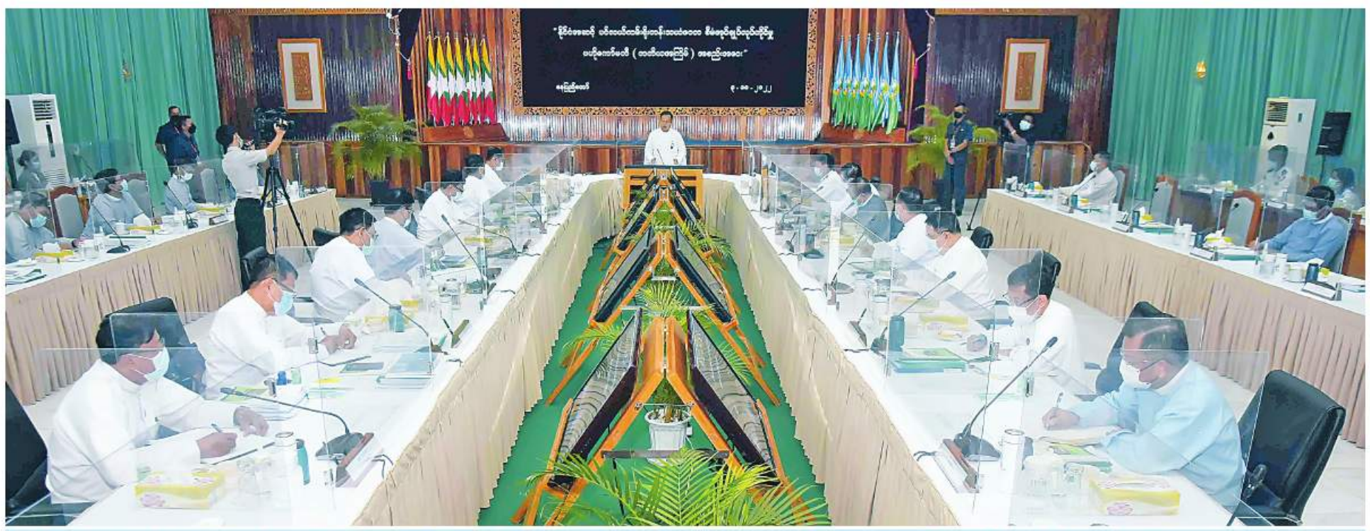
နိုင်ငံအဆင့် ပင်လယ်ကမ်းရိုးတန်းသယ်ယာပို့ဆောင်ရေးစီမံအုပ်ချုပ်လုပ်ကိုင်မှုပဟိုကော်မတီဥက္ကဋ္ဌ နိုင်ငံတော်စီမံအုပ်ချုပ်ရေးကောင်စီဒုတိယဥက္ကဋ္ဌ ဒုတိယဝန်ကြီးချုပ် ဒုတိယဗိုလ်ချုပ်မှူးကြီးစိုးဝင်း နိုင်ငံအဆင့် ပင်လယ်ကမ်းရိုးတန်းသယ်ယာပို့ဆောင်ရေးစီမံအုပ်ချုပ်လုပ်ကိုင်မှုပဟိုကော်မတီ၏ တတိယအကြိမ်အစည်းအဝေးတွင် အမှာစကားပြောကြားစဉ်။

နေပြည်တော် အောက်တိုဘာ ၃ - နိုင်ငံအဆင့် ပင်လယ်ကမ်းရိုးတန်း သယ်ယာပို့ဆောင်ရေးစီမံအုပ်ချုပ်လုပ်ကိုင်မှု ပဟိုကော်မတီ၏ တတိယအကြိမ် အစည်းအဝေးကို ယနေ့ မွန်းလွဲ ၂ နာရီတွင် နေပြည်တော်ရှိ သယ်ယာပို့ဆောင်ရေးကောင်စီ ဝန်ကြီးဌာန အကြောင်းခန်းမ၌ ကျင်းပရာ နိုင်ငံအဆင့်ပင်လယ်ကမ်းရိုးတန်းသယ်ယာပို့ဆောင်ရေးစီမံအုပ်ချုပ်လုပ်ကိုင်မှု ပဟိုကော်မတီဥက္ကဋ္ဌ နိုင်ငံတော်စီမံအုပ်ချုပ်ရေးကောင်စီ ဒုတိယဥက္ကဋ္ဌ ဒုတိယဝန်ကြီးချုပ် ဒုတိယဗိုလ်ချုပ်မှူးကြီး စိုးဝင်း တက်ရောက်အမှာစကားပြောကြားသည်။ အစည်းအဝေးသို့ ပဟိုကော်မတီဝင် ပြည်ထောင်စုဝန်ကြီး ဦးခင်မောင်ရီ၊ ဒုတိယဝန်ကြီးများ၊ အမြဲတမ်းအတွင်းဝန်များ၊ညွှန်ကြားရေးမှူးချုပ်များ၊ကာကွယ်ရေးဦးစီးချုပ်ရုံး(ရေ)မှ တာဝန်ရှိသူများ တက်ရောက်ကြပြီး တိုင်းဒေသကြီးနှင့် ပြည်နယ်ဝန်ကြီးချုပ်များနှင့် တာဝန်ရှိသူများက ဝီဒီယိုကွန်ဖရင့်စနစ်ဖြင့် တက်ရောက်ကြသည်။ အစည်းအဝေးတွင် ပဟိုကော်မတီဥက္ကဋ္ဌ နိုင်ငံတော်စီမံအုပ်ချုပ်ရေးကောင်စီဒုတိယဥက္ကဋ္ဌ ဒုတိယဝန်ကြီးချုပ် ဒုတိယဗိုလ်ချုပ်မှူးကြီး စိုးဝင်းက အမှာစကားပြောကြားရာတွင် ယနေ့ကျင်းပသည့် အစည်းအဝေးကို