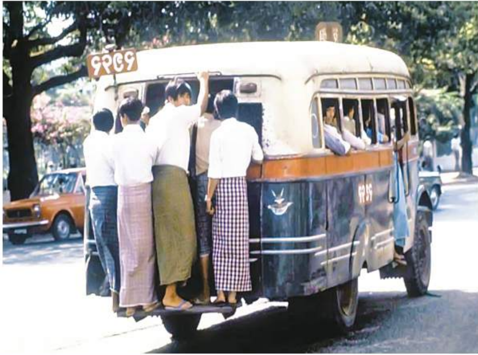
အနှစ် ၂၀ စီမံကိန်းကာလအတွင်းက ပြေးဆွဲခဲ့သောဘတ်စကားတစ်စီး။