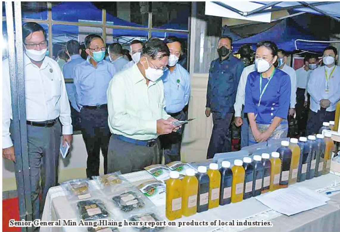
Senior General Min Aung Hlaing hears report on products of local industries.