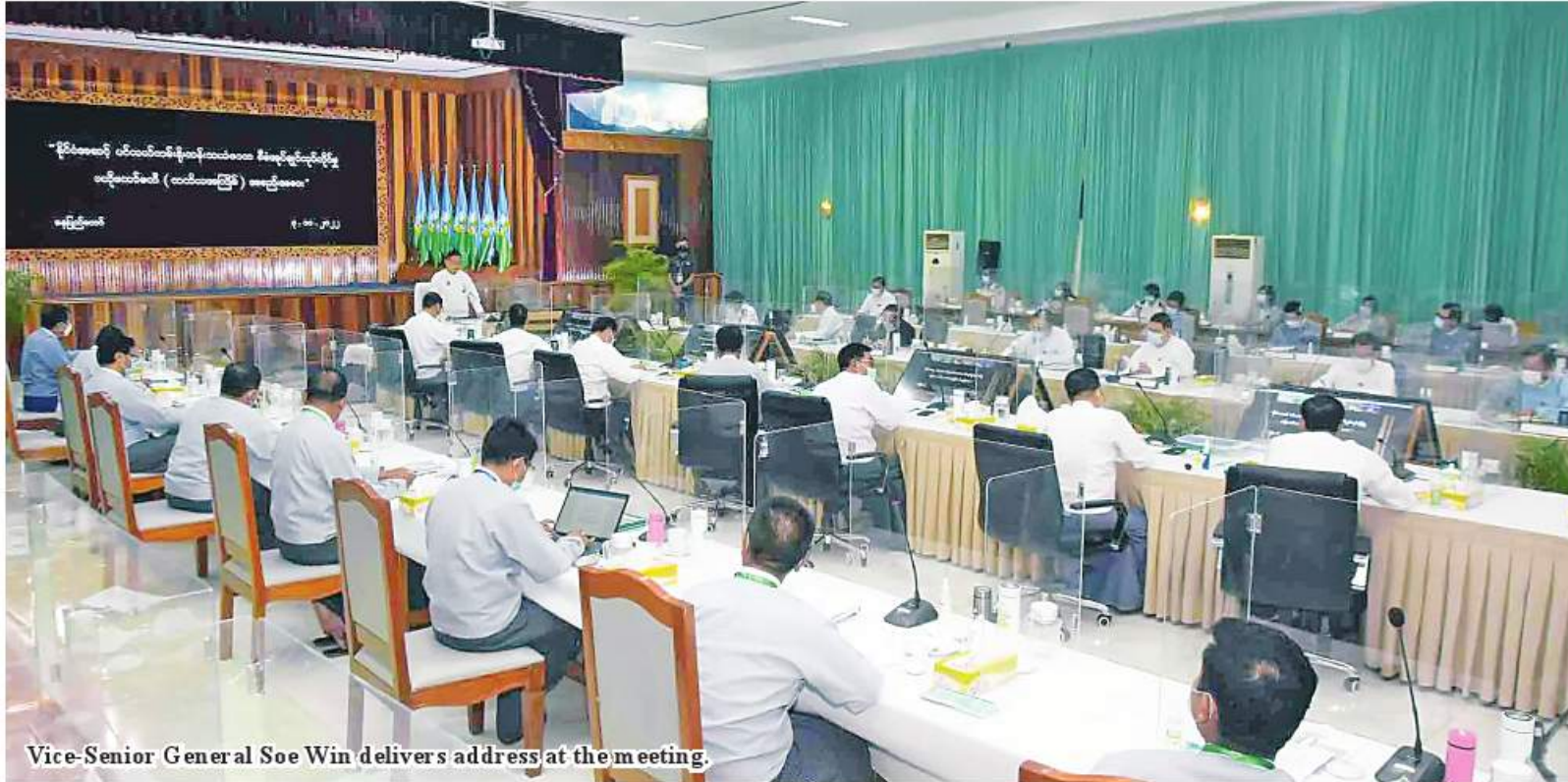
Vice-Senior General Soe Win delivers address at the meeting.