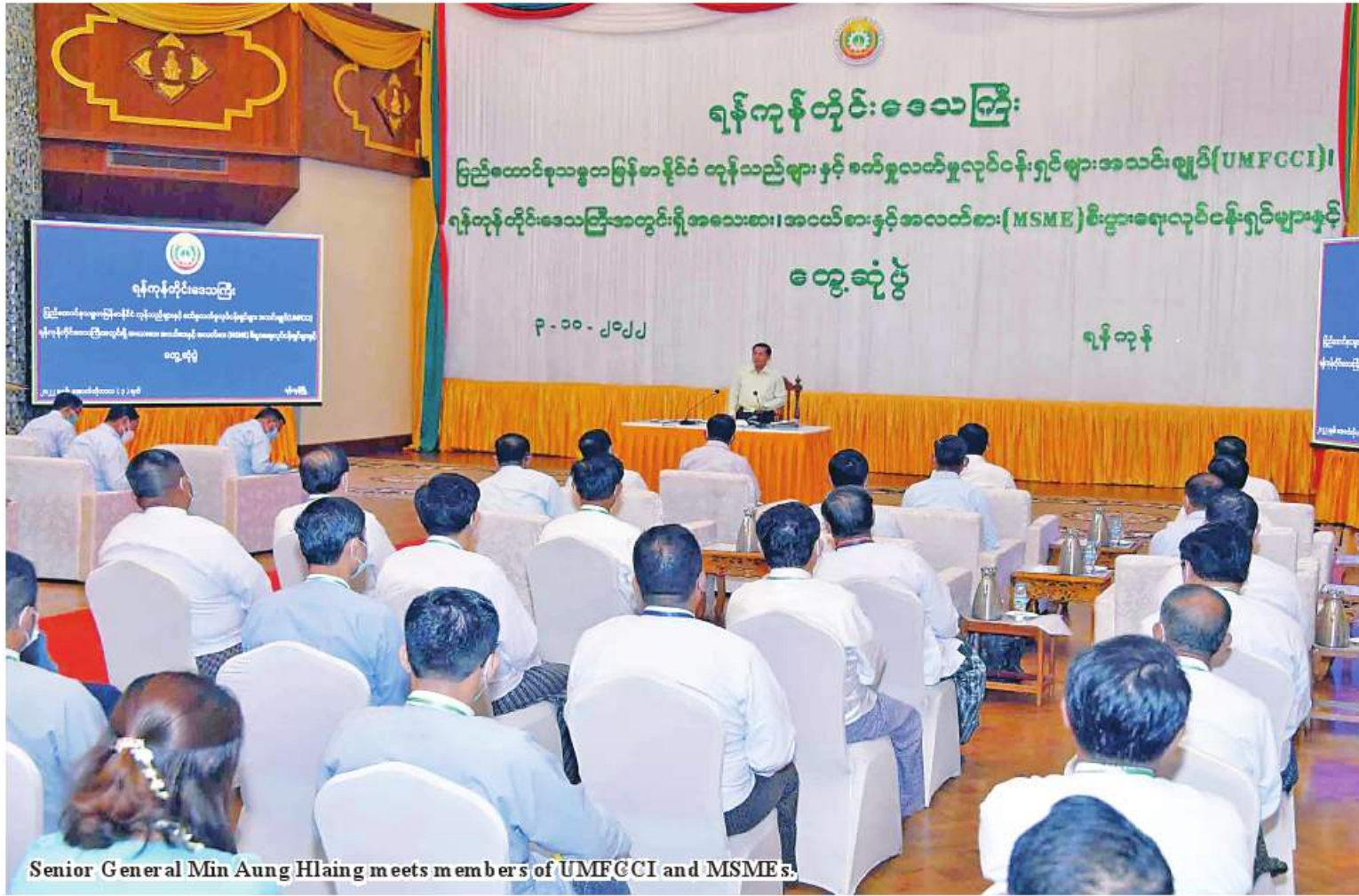
Senior General Min Aung Hlaing meets members of UMFCCI and MSMEs.

Nay Pyi Taw October 3 Chairman of State Administration Council Prime Minister Senior General Min Aung Hlaing met entrepreneurs of Union of Myanmar Federation of Chambers of Commerce and Industry (UMFCCI) and MSMEs of Yangon Region at Zeyathiri Villa in Yangon this morning and discussed economic development.