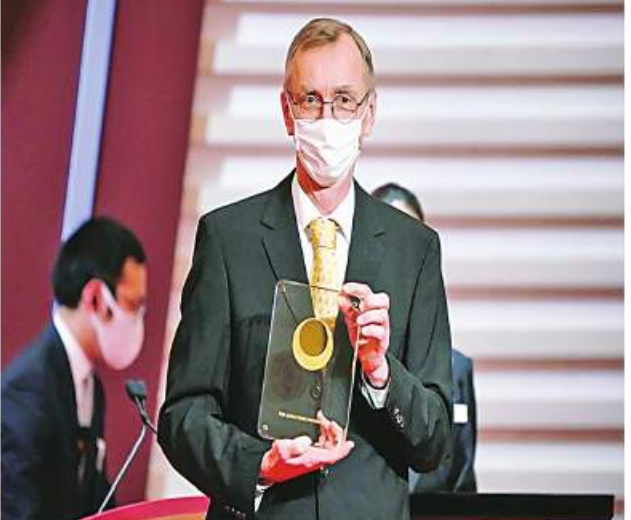
ဆွဲဒင်နိုင်ငံ ကာရိုလင်စကာအင်စတီတုန်းအဖွဲ့က ရွေးချယ်ပေးခဲ့ခြင်းဖြစ်ကြောင်း သိရသည်။ KKO

တော့ဟုမ်း အောက်တိုဘာ ၃ ၂၀၂၂ ခုနှစ်၏ ဆေးပညာနိပယ်ဆုကို ဆွဲဒင်မျိုးဝီလီယံပညာရှင် ဆပင်တီပါးဘိုးက ယနေ့တွင် ရရှိခဲ့ကြောင်း ရိုက်တာသတင်းဌာနက ဖော်ပြခဲ့သည်။ ဆပင်တီပါးဘိုးသည် ယခုအခါ ကွယ်ပျောက်သွားပြီဖြစ်သော ရှေးလူများမှ ယနေ့ခေတ်လူများဆင့်ကဲပြောင်းလဲလာမှုနှင့်ပတ်သက်၍ ပိုမိုနားလည်လာစေရန်အထောက်အကူပြုခဲ့သည့် မျိုးဝီလီယံဆိုင်ရာရှာဖွေတွေ့ရှိမှုများအတွက် ယခုနှစ်ဆေးပညာနိပယ်ဆုကို ရရှိခဲ့ခြင်းဖြစ်သည်။ ဆပင်တီပါးဘိုးသည်နီယွန်ဒါးပဲလ် ရှေးလူများ၏ မျိုးဝီလီယံကူးများကို အစဉ်လိုက်လေးချပေးခဲ့သူဖြစ်ပြီး ဒီနီဆိုမင်ခေါ် လူသားမျိုးစိတ် တစ်မျိုးတည်ရှိခဲ့မှုကိုလည်း ဖော်ထုတ်ပေးနိုင်ခဲ့သူဖြစ်သည်။ သိပ္ပံပညာရှင် ဆပင်တီပါးဘိုးသည် ဆေးပညာနိပယ်ဆုအတွက် ဆွဲဒင်ကရောင်းငွေ ၁၀ သန်း(အမေရိကန်ဒေါ်လာ ၉၀၀၃၅၇ ဒေါ်လာ) ရရှိမည်ဖြစ်သည်။ ဆပင်တီပါးဘိုး ရရှိခဲ့သော ဆေးပညာနိပယ်ဆုသည် ယခုနှစ်နိပယ်ဆုရာသီ၏ ပထမဆုံးနိပယ်ဆုဖြစ်ကြောင်း သိရသည်။ ဆေးပညာ နိပယ်ဆုရှင်ကို