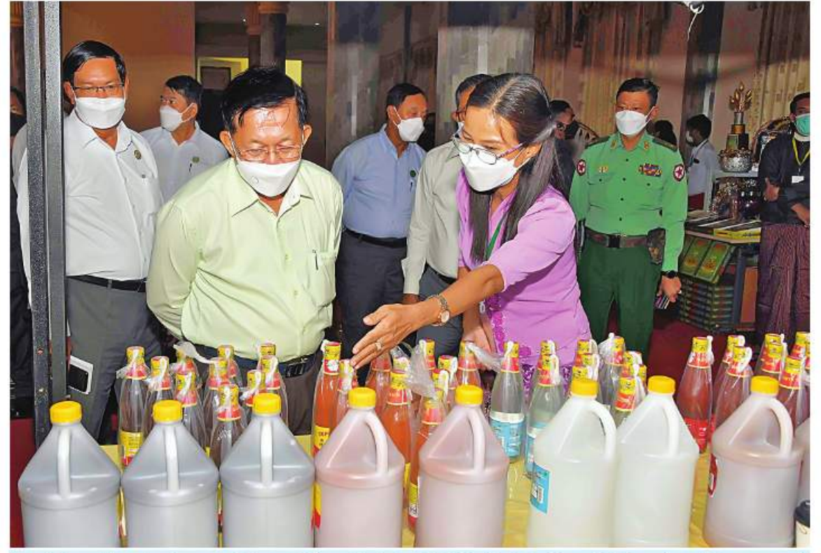
နိုင်ငံတော်စီမံအုပ်ချုပ်ရေးကောင်စီဥက္ကဋ္ဌ နိုင်ငံတော်ဝန်ကြီးချုပ် ဝိုလ်ချုပ်မှူးကြီးမင်းအောင်လှိုင် ဓင်းကျင်းပြသထားသည့် ဓားသောက်ကုန်နှင့် လူသုံးကုန်ပစ္စည်းများကို ကြည့်ရှုလေ့လာစဉ်။

ဆောင်ရွက်နိုင်မည်ဆိုပါက ဈေးကွက် လည်ပတ်မှုများ ပိုမိုကောင်းမွန်လာမည်ဖြစ် ကြောင်း၊ မိမိ၏ဗဟိုဒဏ္ဍန်းပစ္စည်းများကို ပစ္စည်းပိုမိုကောင်းမွန်ရမည်ဖြစ်ကြောင်း၊ ဈေးကွက်ကို ရရှိအောင်ဆောင်ရွက်ရမည် ဖြစ်ကြောင်း၊ ဝင်ငွေပိုမိုရရှိရေး များများ ရောင်းနိုင်ရန်လိုကြောင်း၊ နိုင်ငံတကာနှင့် ကုန်သွယ်မှုများဆောင်ရွက်နိုင်ရန်အတွက်