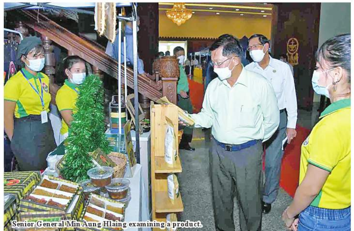
Senior General Min Aung Hlaing examining a product.

MSME industries are established with the aim of meeting the local demands. The Senior General said he will continue discussions to seek the export opportunities. The loans in Covid-19 period will be set under a period to pay back it to the State for their difficulties, and arrangements will be made for them to deliver the capitals. But, as the government's efforts is to disburse loans as capital for development of their businesses, See Page 13