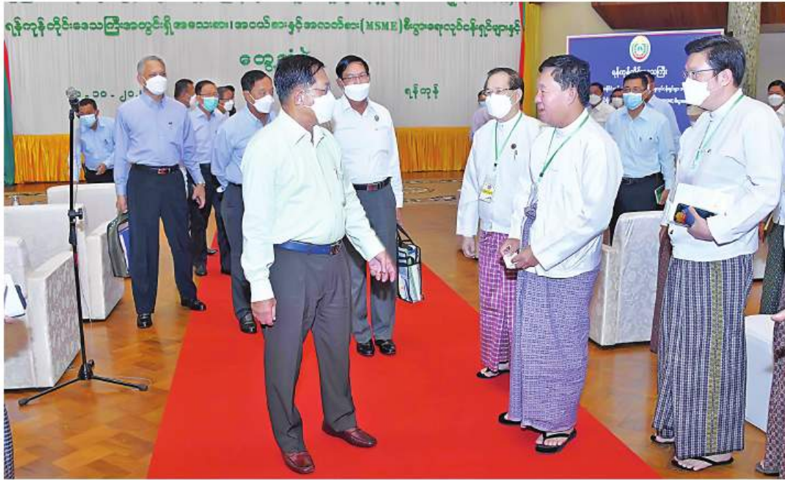
နိုင်ငံတော်စီမံအုပ်ချုပ်ရေးကောင်စီဥက္ကဋ္ဌ နိုင်ငံတော်ဝန်ကြီးချုပ် ဝိုလ်ချုပ်မှူးကြီးမင်းအောင်လှိုင် ပြည်ထောင်စုသမ္မတမြန်မာနိုင်ငံ ကုန်သည်များနှင့် စက်မှုလက်မှုလုပ်ငန်းရှင်များအသင်းချုပ် (UMFCCI)နှင့် ရန်ကုန်တိုင်းဒေသကြီးအတွင်းရှိ အသေးစား၊ အငယ်စားနှင့် အလတ်စားစီးပွားရေး(MSME) လုပ်ငန်းရှင်များအား ရင်းရင်းနှီးနှီးနှုတ်ဆက်စဉ်။

စာမျက်နှာ ၁၇ မှအဆက် ဆောင်ရွက်နိုင်ရေးအတွက်လည်း ကြိုးပမ်း ဆောင်ရွက်လျက်ရှိကြောင်း၊ ခိုက်ပျိုးရေး၊ ကျန်းမာရေး၊ ပညာရေးလုပ်ငန်းများတွင် လည်း နျူကလီးယားစွမ်းအင်အသုံးပြုနိုင် ရေး ညှိနှိုင်းဆောင်ရွက်လျက်ရှိကြောင်း။