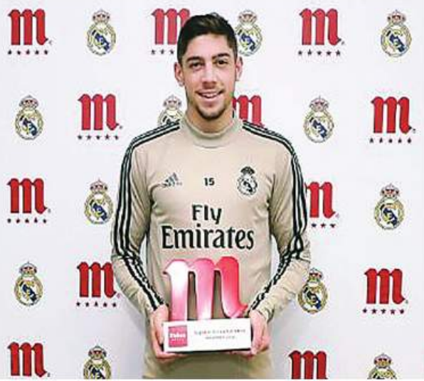
မက်ဒရစ် အောက်တိုဘာ ၃ သမားဆုကို စပိန်လာလီဂါဘောလုံးအဖွဲ့ချုပ် အသင်းက ပေးအပ်သည့် စပိန်လာလီဂါ ပြိုင်ပွဲ၏ စက်တင်ဘာလအတွက် တစ်လတာအကောင်းဆုံး ကစား

အသက် ၂၄ နှစ်ရှိ ဗယ်ဟာဒီ သည် ပြီးခဲ့သည့် ၂၀၁၆ ခုနှစ်က ကလပ် အက်သလက်တီကိုပီနာရှိ အသင်းမှ ရိုးရဲလ်မက်ဒရစ်အသင်းသို့ ပြောင်းရွှေ့ကစားခဲ့သော်လည်း ရိုးရဲလ်မက်ဒရစ်အသင်းက စားသမားဘဝ အစပိုင်းကာလများတွင် ရိုးရဲလ်မက်ဒရစ် ကက်စတီလာ အသင်းနှင့် ဒီပို့တီဗိုအသင်းတို့တွင် ကစားခဲ့ရပြီး ၂၀၁၈ ခုနှစ်မှ ရိုးရဲလ်မက်ဒရစ်အသင်းနှင့် ပြန်လည်ပူးပေါင်းခဲ့ခြင်းဖြစ်သည်။