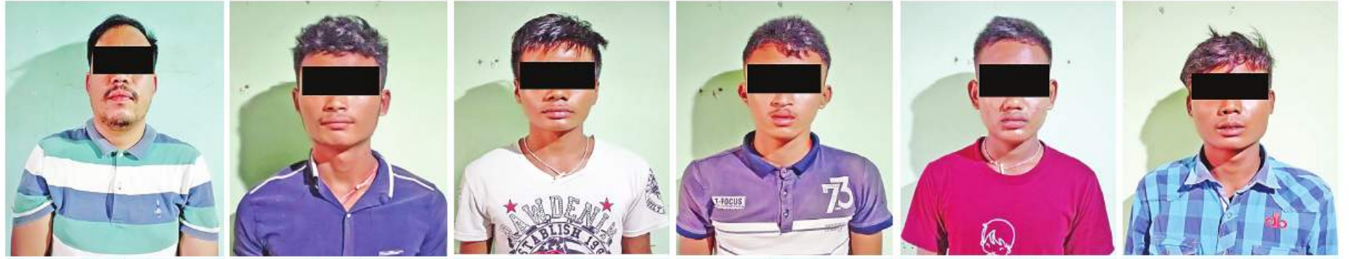
လှိုင်မင်းထွန်း