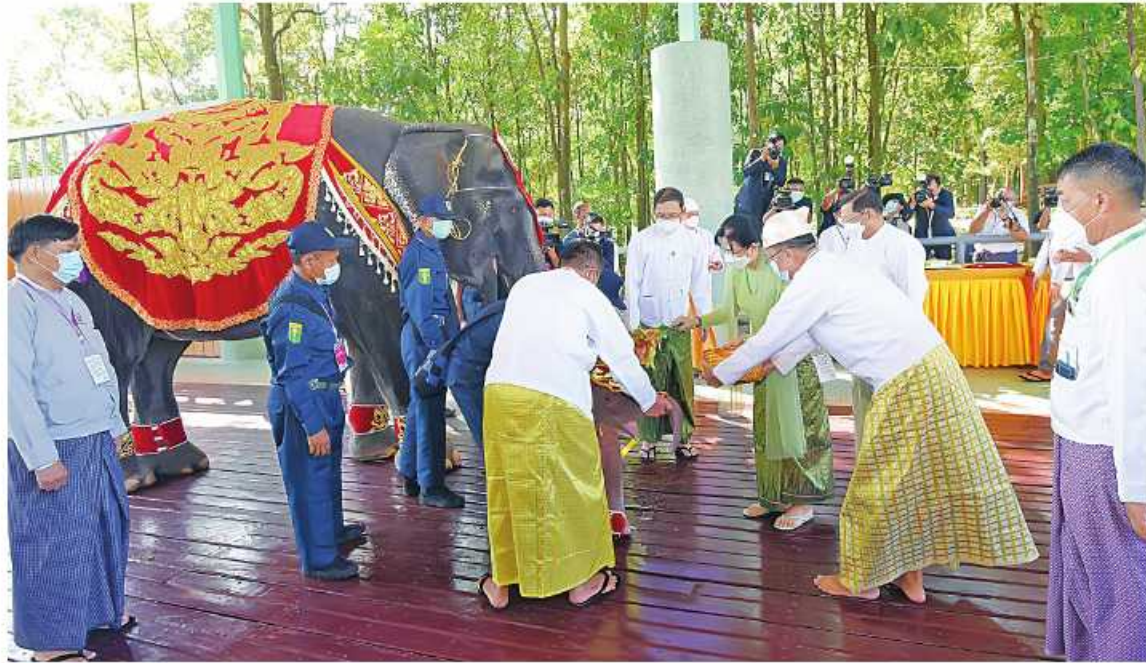
နိုင်ငံတော်စီမံအုပ်ချုပ်ရေးကောင်စီဥက္ကဋ္ဌ နိုင်ငံတော်ဝန်ကြီးချုပ် ဗိုလ်ချုပ်မှူးကြီးမင်းအောင်လှိုင်နှင့် ဧည့်သည်အဖြစ် အဖွဲ့ဝင်များနှင့်အတူ ရတနာပုံဆင်ဖြူတော်လေးကို အဖွဲ့နဲ့သရုပ်ဆောင်ပေးပေးခဲ့ခြင်း။

စာမျက်နှာ ၁၇ မှအဆက် အဖော်ဆင်များကို အစာအာဟာရများ ကျွေးမွေးခဲ့ကြသည်။ အဆိုပါ ရတနာပုံဆင်ဖြူတော်လေး “ရတနာပုံ” (တိုင်းပြည်က ချစ်ခင်မြတ်နိုး၍ နိုင်ငံတော်၏ သာယာဝပြောဖော်ရွှင်