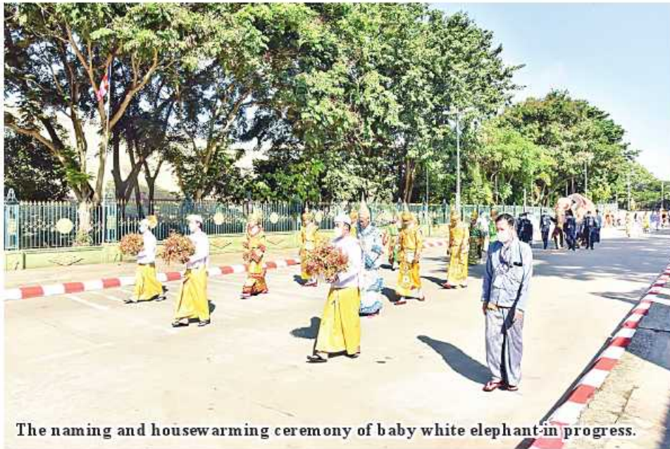
The naming and housewarming ceremony of baby white elephant in progress.