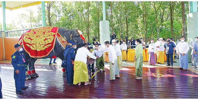
နိုင်ငံတော် စီမံအုပ်ချုပ်ရေး ကောင်စီဥက္ကဋ္ဌ နိုင်ငံတော်ဝန်ကြီးချုပ် ဝင်းအောင်လှိုင်နှင့် ဝေါ်ကြွကြွလှတို့က ရတနာဆင်ဖြူတော်လေးကို အထွတ်ထွေအောင်ပေးခဲ့ခြင်း