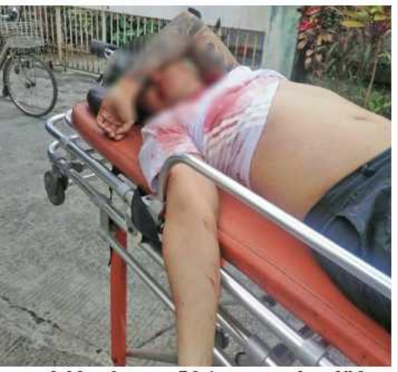
သတင်းများရရှိပါက သက်ဆိုင်ရာသို့ များအမြန်ဆုံး အေးချမ်းတည်ငြိမ်ရေး ဝိုင်းဝန်းကာကွယ် တိုက်ဖျက်ကြရန်နှင့် လျှို့ဝှက်စွာ သတင်းပေးတိုင်ကြားနိုင်ပါ ကြောင်း၊ သတင်းပေးသူနှင့် ဖမ်းဆီးပေးသူ များကို ထိုက်တန်စွာ လျှို့ဝှက်၍ ဆုငွေ များချီးမြှင့်ပေးလျက်ရှိကြောင်းနှင့် မြို့ရွာ အပ်ပါသည်။

စာမျက်နှာ ၂၃ မှအဆက် ဝိုင်းဝန်းကာကွယ် တိုက်ဖျက်ကြရန်နှင့် ဆက်စပ်တရားခံများကို အမြန်ဆုံး ဖမ်းဆီးရမိရေးအတွက် ၎င်းတို့ပုန်းခိုရာ နေရာများ၊ လှုပ်ရှားသွားလာနေထိုင်မှု