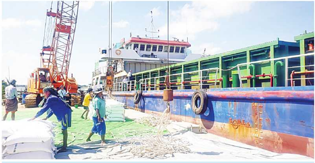
ဘင်္ဂလားဒေ့ရှ်နိုင်ငံသို့ တင်ပို့မည့်ဆန်များကို MV MCL-7 ပင်လယ်ကူးသင်္ဘောပေါ်သို့ တင်ဆောင်စဉ်။

ရန်ကုန် အောက်တိုဘာ ၃၀ မြန်မာ့ဆန်များ ပြည်ပသို့ တင်ပို့ခြင်းမှ နိုင်ငံခြားဝင်ငွေရရှိစေပြီး တောင်သူနှင့်ရင်းနှီး မြှုပ်နှံသူများ စီးပွားရေးအခွင့်အလမ်းတိုး တက်စေရန် နိုင်ငံတော်က စီမံဆောင်ရွက်ပေး လျက်ရှိရာ စီးပွားရေးနှင့်ကူးသန်းရောင်းဝယ် ရေးဝန်ကြီးဌာနနှင့် ဘင်္ဂလားဒေ့ရှ်နိုင်ငံတို့ အကြား ဆန်ရောင်းဝယ်မှုဆိုင်ရာ G to G သဘောတူစာချုပ်အရ ဆန်တန်ချိန်နှစ်သိန်း တင်ပို့သွားမည်ဖြစ်ရာ ရော့တတီတိုင်းဒေသ ကြီး ပုသိမ်စက်မှုမြို့တော်ဆိပ်ကမ်းမှ ပထမ ဆုံးအကြိမ်အဖြစ် ဆန်တန်ချိန် ၂၆၅၀ ကို အောက်တိုဘာ ၂၈ ရက်မှစ၍ MV MCL- 7ပင်လယ်ကူးသင်္ဘောဖြင့် တိုက်ရိုက်တင်ပို့ရန် ဆောင်ရွက်နေကြောင်း သိရသည်။ မြန်မာနိုင်ငံနှင့် ဘင်္ဂလားဒေ့ရှ်နိုင်ငံတို့ အကြား ဆန်တန်ချိန် နှစ်သိန်း တင်ပို့ရန် စာမျက်နှာ ၂၄ ကော်လံ ၄ နှ