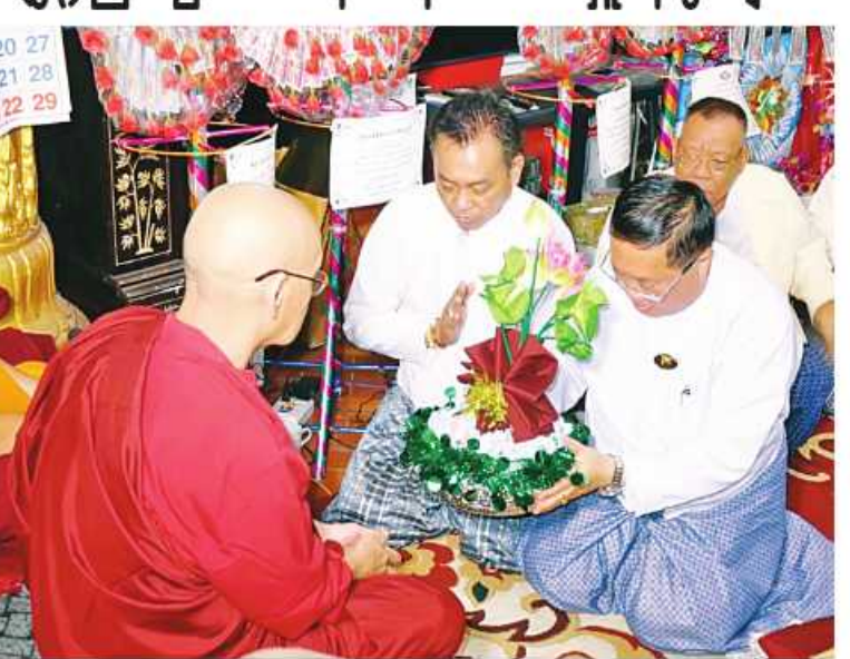
ဆရာတော်ထံ ရှမ်းပြည်နယ်ဝန်ကြီးချုပ် ဒေါက်တာကျော်ထွန်း ကထိန် လျာသင်တန်းနှင့် လှူဖွယ်ပစ္စည်းများ ဆက်ကပ်လျှင်ဒါန်းစဉ်။