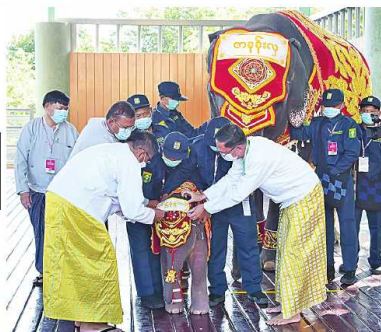
တာဝန်ရှိသူများက ရတနာဆင်ဖြူတော်လေး၏ ဘွဲ့နာမတော်ပြန်ပေးခဲ့ပြီး ရတနာဆင်ဖြူတော်လေးကို နှစ်ကင်းထက်တွင် ဆင်ဖြူနာမတော်ပြန်ပေးခဲ့ခြင်း

၂၀ ရှေ့ပျံ့အသက် တာဝန်ရှိသူများက ရှေ့ပြောင်းပေးကြပြီး ကောင်စီဝင်များက ရတနာဆင်ဖြူတော်လေးကို အထွတ်ထွေအောင်ပေးရက် အခါအထူးတော်အခမ်းအနားတွင် ရတနာဆင်ဖြူတော်လေးကို အထွတ်ထွေအောင်ပေးခဲ့ခြင်း