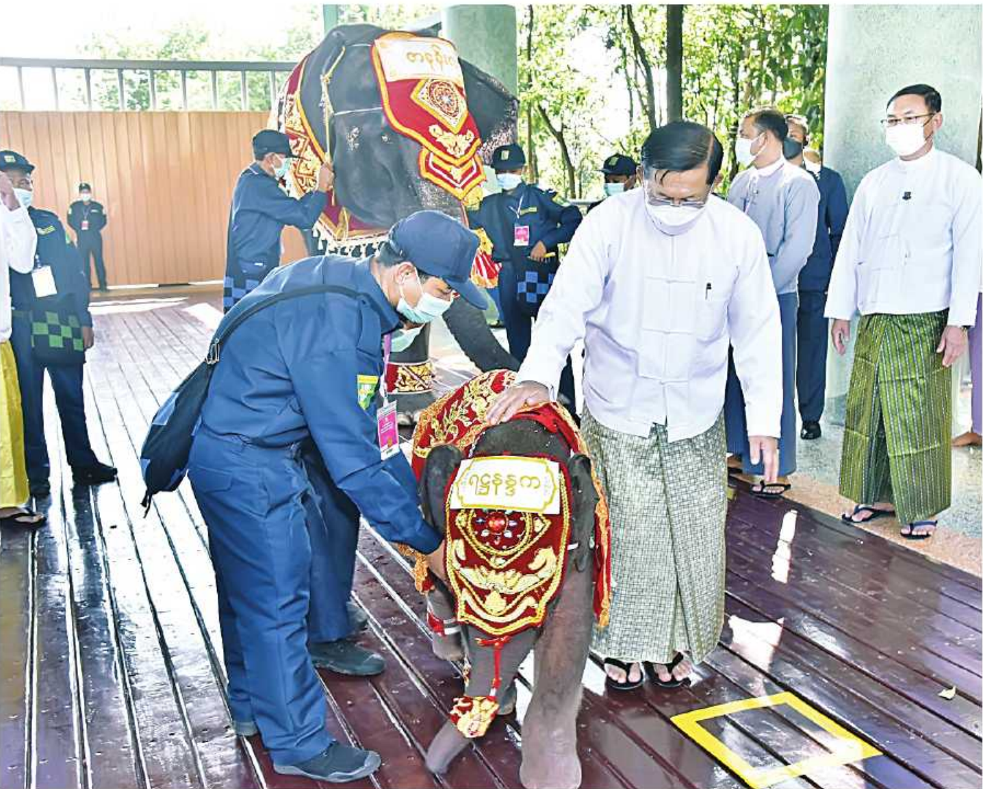
ရတနာဆင်ဖြူတော်လေး “ရတနာပုံ”အား ဘွဲ့နာမံတော်ကို ဦးကင်းထက်တွင် ဆင်ဖြူအုပ်နှင်းပေးမှုအား တွေ့ရစဉ်။

ဦးစွာ အနန္တရာယိကမင်္ဂလာ အနန္တရာယိကင်းမင်္ဂလာကို ကျင်းပပြုလုပ်ရာ ရတနာဆင်ဖြူတော်လေးက ဥပဒေရေးရာဌာနအထောက်အကူပြု ဝတ္ထုကံမြေအတွင်းရှိ ရတနာဆင်ဖြူတော်ဆောင်တွင် နေပြည်တော်စီမံအုပ်ချုပ်ရေးကောင်စီဥက္ကဋ္ဌ နိုင်ငံတော်ဝန်ကြီးချုပ်၊