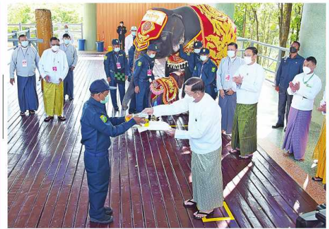
နိုင်ငံတော် စီမံအုပ်ချုပ်ရေး ကောင်စီဥက္ကဋ္ဌ နိုင်ငံတော်ဝန်ကြီးချုပ် ဝင်းအောင်လှိုင်နှင့် ဝေါ်ကြွကြွလှတို့က ရတနာဆင်ဖြူတော်လေးကို အထွတ်ထွေအောင်ပေးခဲ့ခြင်း