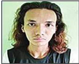
သန်းထွဋ်ပိုင်(ခ)ကိုခိုင် (ခ)ကျိုးမိုက်