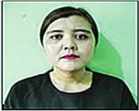
ပန်းဆီဆီကျော်(ခ) အိန္ဒြာ