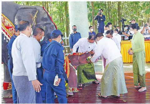
နိုင်ငံတော် စီမံအုပ်ချုပ်ရေး ကောင်စီဥက္ကဋ္ဌ နိုင်ငံတော်ဝန်ကြီးချုပ် ဝင်းအောင်လှိုင်နှင့် ဝေါ်ကြွကြွလှတို့က အထွတ်ထွေအောင်ပေးရက် အခါအထူးတော်အခမ်းအနားတွင် ရတနာဆင်ဖြူတော်လေးကို အထွတ်ထွေအောင်ပေးခဲ့ခြင်း