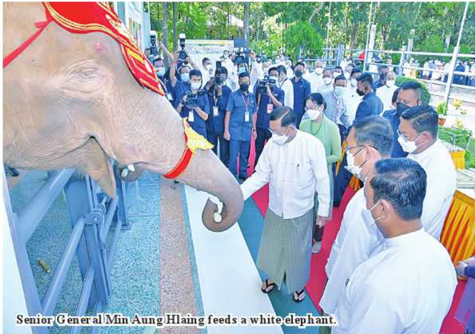
Senior General Min Aung Hlaing feeds a white elephant.