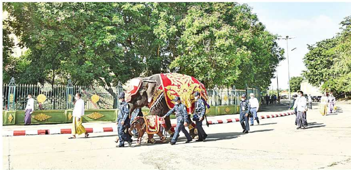
ဥပ္ပါတသန္တိ စေတီတော် ဗြဟ္မစာရ ရတနာဆင်ဖြူတော်လေးက လက်ယာရန် လှည့်လာညီ ပူဇော်ခဲ့ခြင်း