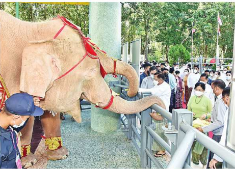
နိုင်ငံတော် စီမံအုပ်ချုပ်ရေး ကောင်စီဥက္ကဋ္ဌ နိုင်ငံတော်ဝန်ကြီးချုပ် ဝင်းအောင်လှိုင်နှင့် ဝေါ်ကြွကြွလှတို့က ရတနာဆင်ဖြူတော်လေးကို အထွတ်ထွေအောင်ပေးခဲ့ခြင်း