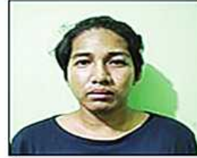
သန်းထက်စင်(ခ)မိုးဇော်