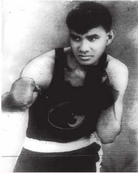
ရွှေဘိုဘာမထီခင်အောင်

“ခင်အောင် မင်း သဲအိတ်တွေခွဲနိုင်သေးလား” “ခွဲနိုင်သေးတယ်ဆရာ” ကျွန်တော်က မဆိုင်းမတွဲပြောလိုက်၏။ ဆရာကြီး ကျားဘညိမ်းက ခေါင်းတလေးတဆတ်ဆတ်နှင့် ပြုံး ထွေထွေအမူအရာကလေးဖြင့်-