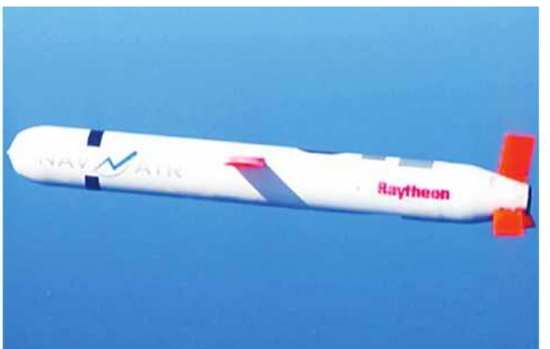
ဂျပန်အစိုးရသည် ယခုနှစ်ကုန်တွင် အရေးကြီးသော ရေရှည်လုံခြုံရေးလမ်းညွှန် ချက်ကို ပြင်ဆင်တည်းဖြတ်မှုများပြုလုပ်ချိန် တွင် တန်ပြန်တိုက်ခိုက်နိုင်စွမ်းပိုင်ဆိုင်ထား ကြောင်း ကြေညာရန် မျှော်မှန်းထားသည်။ Japan 'Studying' US Tomahawk Cruise Missile Purchase ကို အာသာပြန်ဆိုပါသည်။

၍ အကွာအဝေးအတွင်းတွင် ရှိနေမည် ဖြစ်ကြောင်း အမည်မသိအစိုးရသတင်း ရင်းမြစ်များကို ကိုးကား၍ သတင်းစာ ကဆိုသည်။ အခြား ဂျပန်မီဒီယာများကလည်း ဂျပန်နိုင်ငံအစိုးရသည် Tomahawk ခရုဇ်ခုံးကျည်ဝယ်ယူရန် လေ့လာနေသည် ဟု ရေးသားဖော်ပြခဲ့ကြသည်။ နိုင်ငံအစိုးရဝန်ကြီးများသည် ဖြစ်နိုင် ခြေကို လေ့လာနေကြသော်လည်း တစ်စုံ တစ်ရာမဆုံးဖြတ်ရသေးကြောင်း ဂျပန် နိုင်ငံ ထိပ်တန်းအစိုးရပြောရေးဆိုခွင့်ရှိသူ Hirokazu Matsuno က ပြော ကြားခဲ့သည်။ Matsuno ၏မှတ်ချက်ပြုပြီး နာရီပိုင်း အကြာတွင် မြောက်ကိုရီးယားသည် နောက် ထပ် အမျိုးအစားမသိ ပဲ့ထိန်းခုံးကျည်ကို