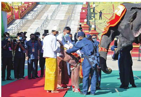
နိုင်ငံတော်စီမံအုပ်ချုပ်ရေးကောင်စီဥက္ကဋ္ဌ နိုင်ငံတော်ဝန်ကြီးချုပ် ဝင်းအောင်လှိုင်နှင့် ဝေါ်ကြွကြွလှတို့က အထွတ်ထွေအောင်ပေးရက် အခါအထူးတော်အခမ်းအနားတွင် ရတနာဆင်ဖြူတော်လေးကို အထွတ်ထွေအောင်ပေးခဲ့ခြင်း