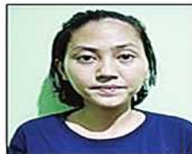
ရွန်းလဲ့ဝေ(ခ)ဟာနာ(ခ) နောခိုင်