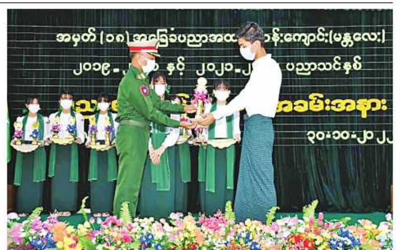
အလယ်ပိုင်းတိုင်းစစ်ဌာနချုပ်မှ တာဝန်ရှိသူတစ်ဦးက ၂၀၁၉-၂၀၂၀ ပညာသင် နှစ်၊ ၂၀၂၁-၂၀၂၂ ပညာသင်နှစ် တက္ကသိုလ်ဝင်စာမေးပွဲတွင် ထူးချွန်စွာအောင်မြင်ခဲ့ကြ သည့် ကျောင်းသား၊ ကျောင်းသူများကို ဆုများပေးအပ်ချီးမြှင့်ခဲ့ခြင်း။

ကျောင်းသား၊ ကျောင်းသူများ၊ ဆရာ၊ ဆရာမ များ၊ ကျောင်းသားမိဘများနှင့် ဖိတ်ကြား ထားသူများ တက်ရောက်ကြသည်။ ဦးစွာ တိုင်းစစ်ဌာနချုပ်မှ တာဝန်ရှိသူ တစ်ဦးက ဂုဏ်ပြုအမှာစကားပြောကြားပြီး ကျောင်းအုပ်ချုပ်မှုတာဝန်ခံ အရာရှိက ပညာရေးဆိုင်ရာများ ရှင်းလင်းပြောကြား သည်။ ထို့နောက် ဆုပေးပွဲကိုဆက်လက် ပြုလုပ်ရာ ၂၀၁၉-၂၀၂၀ ပညာသင်နှစ်နှင့် ၂၀၂၁-၂၀၂၂ပညာသင်နှစ် တက္ကသိုလ်ဝင် စာမေးပွဲတွင် ထူးချွန်စွာအောင်မြင်ခဲ့ကြ သည့် ခြောက်ဘာသာဂုဏ်ထူးရှင် တစ်ဦး၊ ငါးဘာသာဂုဏ်ထူးရှင် ငါးဦး၊ လေး ဘာသာဂုဏ်ထူးရှင် ငါးဦး၊ သုံးဘာသာ ဂုဏ်ထူးရှင် ရှစ်ဦး၊ နှစ်ဘာသာဂုဏ်ထူးရှင် ၁၂ ဦး၊ တစ်ဘာသာဂုဏ်ထူးရှင် ၃၃ ဦး၊ ဆရာ၊ ဆရာမများ KG တန်းမှ Grade-10 ထိ ဆုရရှိကြသူများနှင့် ၂၀၁၉-၂၀၂၀ ပညာသင်နှစ်နှင့် ၂၀၂၁-၂၀၂၂ ပညာသင် နှစ် တိုင်းဒေသကြီးနှင့် ပြည်နယ်အဆင့်၊ မြို့နယ်အဆင့် အားကစားပြိုင်ပွဲများတွင် ထူးချွန်ဆုရရှိသူ ၁၃ ဦးတို့အား တာဝန်ရှိသူ များက ဆုများအသီးသီးပေးအပ်ချီးမြှင့်ခဲ့ ကြကြောင်း သတင်းရရှိသည်။