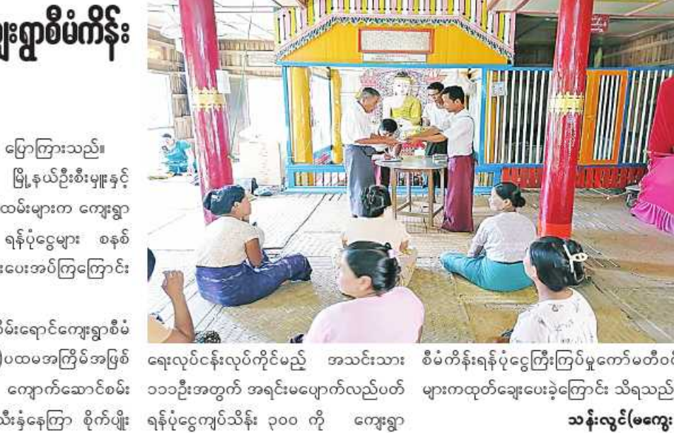
ရေးလုပ်ငန်းလုပ်ကိုင်မည့် အသင်းသားများကထုတ်ချေးပေးခဲ့ကြောင်း သိရသည်။

ထိုသို့ထုတ်ချေးပေးရာတွင် ဆင်ပေါင်ဝဲမြို့နယ် ကျေးလက်ဒေသဖွံ့ဖြိုးတိုးတက်ရေးဦးစီးဌာန မြို့နယ်ဦးစီးမှူး ဦးဇော်မင်းဦးက ကျေးလက်နေပြည်သူများ၏ လူမှုစီးပွားဘဝများ ဖွံ့ဖြိုးလာစေရန် နေကြာအပါအဝင် ဆီထွက်သီးနှံစိုက်ပျိုးသော တောင်သူများ လိုအပ်လျက်ရှိသည့် မျိုးစေ့၊ သွင်းအားစုနှင့် စိုက်ပျိုးစရိတ်များ ဝယ်ယူသုံးစွဲနိုင်ရန် အတိုးနှုန်းသက်သာစွာဖြင့် အရင်းမပျောက်လည်ပတ်ရန်ပုံငွေများ ထုတ်ချေးပေးခြင်းဖြစ်ကြောင်း ပြောကြားသည်။ ဆက်လက်၍ မြို့နယ်ဦးစီးမှူးနှင့် စီမံကိန်းတာဝန်ခံဝန်ထမ်းများက ကျေးရွာကော်မတီဝင်များကို ရန်ပုံငွေများ စနစ်တကျ လွှဲပြောင်းပေးအပ်ကြကြောင်း သိရသည်။ ထို့နောက် မြစ်ရေကူးစက်မှုစီမံကိန်း(ဆီထွက်သီးနှံ)ပထမအကြိမ်အဖြစ် ဆင်ပေါင်ဝဲမြို့နယ် ကျောက်ဆောင်စမ်းကျေးရွာရှိ ဆီထွက်သီးနှံနေကြာ စိုက်ပျိုးရေးလုပ်ငန်းလုပ်ကိုင်မည့် အသင်းသားများကထုတ်ချေးပေးခဲ့ကြောင်း သိရသည်။