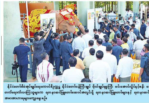
နိုင်ငံတော်စီမံအုပ်ချုပ်ရေးကောင်စီဥက္ကဋ္ဌ နိုင်ငံတော်ဝန်ကြီးချုပ် ဝင်းအောင်လှိုင်နှင့် ဝေါ်ကြွကြွလှတို့က အထွတ်ထွေအောင်ပေးရက် အခါအထူးတော်အခမ်းအနားတွင် ရတနာဆင်ဖြူတော်လေးကို အထွတ်ထွေအောင်ပေးခဲ့ခြင်း