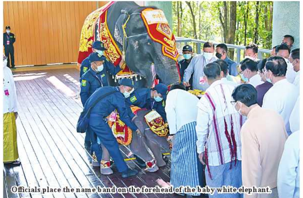
Officials place the name band on the forehead of the baby white elephant.