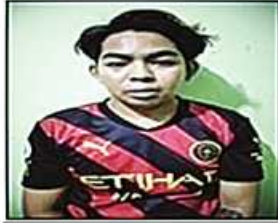
ဥက္ကာဖြိုး(ခ)ဖရန့်(ခ)အုပ်ကြီး