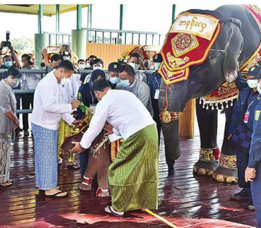
နိုင်ငံတော်စီမံအုပ်ချုပ်ရေးကောင်စီဥက္ကဋ္ဌ နိုင်ငံတော်ဝန်ကြီးချုပ် ဝင်းအောင်လှိုင်နှင့် ဝေါ်ကြွကြွလှတို့က အထွတ်ထွေအောင်ပေးရက် အခါအထူးတော်အခမ်းအနားတွင် ရတနာဆင်ဖြူတော်လေးကို အထွတ်ထွေအောင်ပေးခဲ့ခြင်း