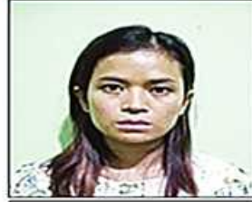
စင်မေလတ်(ခ) ရတီ(ခ)ပေရယ်