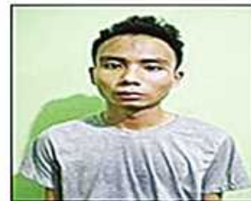
နေရှင်း(ခ)ရှင်းထက်