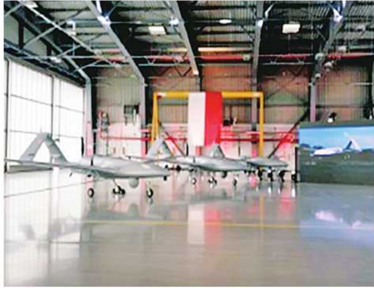
ပိုလန်တပ်မတော်သည် ပထမဆုံး ဖောင်းသုမဲ့တိုက်ခိုက်ရေးလေယာဉ် (UCAV) ခြောက်စင်းကို Bayraktar TB2 ဖောင်းသုမဲ့တိုက်ခိုက် ယခုနှစ် အောက်တိုဘာ ၂၈ ရက်တွင်

Polish MoD က ထုတ်ဝေသော Tweet တစ်ခုအရ လက်ခံရရှိခဲ့ကြောင်း သိရသည်။ Bayraktar TB2 သည် အလယ် အလတ်အမြင့်ပုံလေထဲတွင် ကြာရှည် ပျံသန်းနိုင်စွမ်းရှိသော (MALE) အမျိုးအစား ဖောင်းသုမဲ့တိုက်ခိုက်ရေးလေယာဉ် (UCAV) အမျိုးအစားဖြစ်ပြီး အဝေးမှ ထိန်းချုပ်လုပ်ဆောင်နိုင်သလို စစ်ဆင်ရေး များကို အလိုအလျောက်ပျံသန်းလုပ်ဆောင် နိုင်စွမ်းရှိသည်။ Baykar Makina Sanayiye Ticaret A. S. က ထုတ်လုပ်ပြီး အဓိကအားဖြင့် တူရကီစစ်ဘက်အတွက် ရည်ရွယ်ထုတ်လုပ် ထားခြင်းလည်းဖြစ်သည်။ အဆိုပါ ဖောင်း သုမဲ့လေယာဉ်ကို လက်နက်များ တပ်ဆင် အသုံးပြု၊ တိုက်ခိုက်ခြင်းအပါအဝင် မြေပြင် ထိန်းချုပ်ရေးစခန်းရှိ တပ်ဖွဲ့ဝင်များက