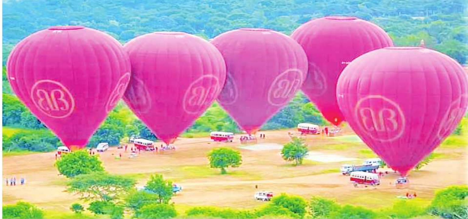
နိုင်ငံခြားခရီးသွားများ ပုဂံဒေသ၏အလှကို ဝေဟင်မှ ကြည့်ရှုအပန်းဖြေခံစားနိုင်ရန် ကုမ္ပဏီတစ်ရပ် ဝန်ဆောင်မှုပေးနေစဉ်။

ရန်ကုန် အောက်တိုဘာ ၂၀ ၂၀၂၂ ခုနှစ်၏ ပွင့်လင်းခရီးသွားရာသီ အစဖြစ်သော နိုဝင်ဘာလဆန်းပိုင်းမှစ၍ ပုဂံဒေသသို့ နိုင်ငံခြားခရီးသွားများ ပိုမိုဝင်ရောက်လာနိုင်မှုကို ရည်မှန်း၍ ခရီးသွားကဏ္ဍမြှင့်တင်မှုအနေဖြင့် ပုဂံယဉ်ကျေးမှုဒေသ၏ သဘာဝအလှကို ဝေဟင်မှ ကြည့်ရှုခံစားနိုင်ရန် ပုဂံဒေသရှိ ဟိုတယ်များနှင့် မိုးပျံပူဖောင်းကုမ္ပဏီများ ကြိုတင်ပြင်ဆင်မှုများ ဆောင်ရွက်ထားကြောင်း သိရသည်။ မြန်မာ့ယဉ်ကျေးမှု အမွေအနှစ်၏ အသည်းနှလုံးဟု တင်စားထားသော ပုဂံယဉ်ကျေးမှုဒေသ၏ ရှုခင်းအလှကို မိုးပျံပူဖောင်းစီးနင်း၍ ကြည့်ရှုခံစားနိုင်ရန် ပုဂံဒေသရှိ မိုးပျံပူဖောင်းကုမ္ပဏီအချို့က သီတင်းကျွတ်လပြည့်နေ့မှ စတင်ကာ ခရီးသွားဝန်ဆောင်မှုကို စတင်ခဲ့ခြင်းဖြစ်သည်။ စာမျက်နှာ ၂၀ ကော်လံ ၁ ☆