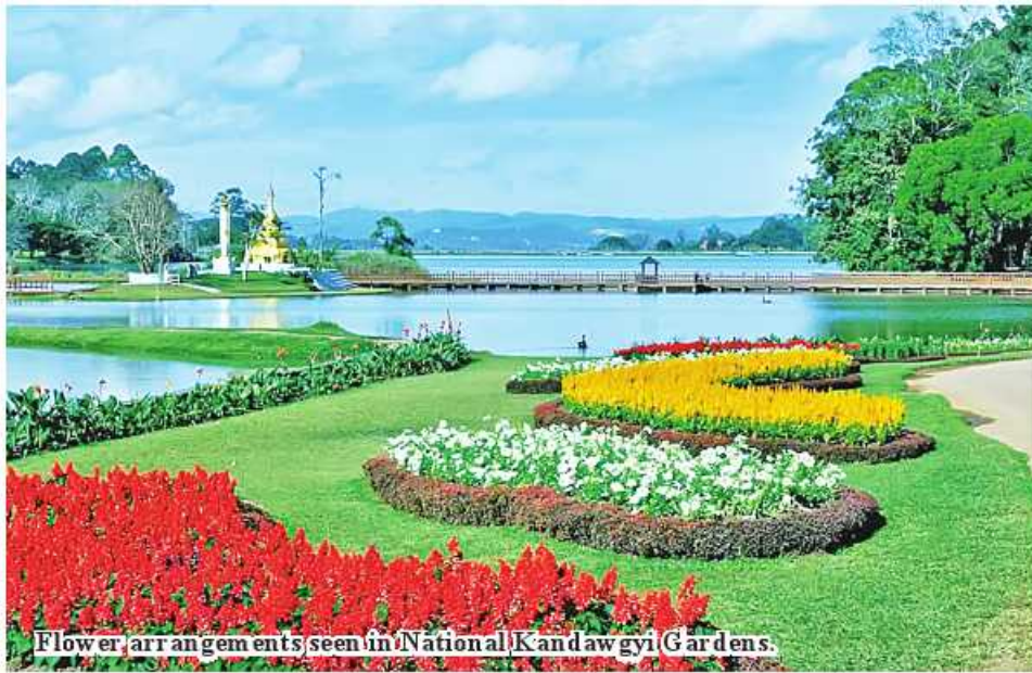
Flower arrangements seen in National Kandawgyi Gardens.

PyinOoLwin October 20 The 15 th flowery festival will take place at National Kandawgyi Garden in PyinOoLwin Township of Mandalay Region on a grander