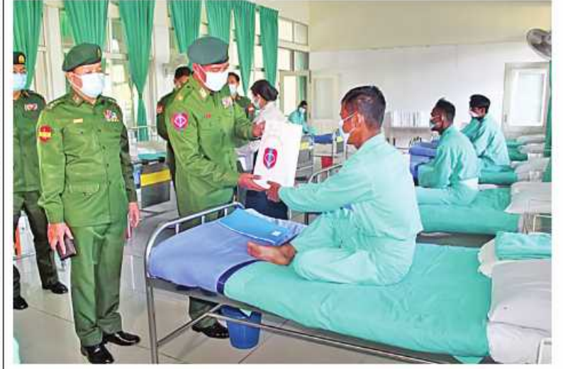
အနောက်မြောက်တိုင်းစစ်ဌာနချုပ် တိုင်းမှူး ဗိုလ်မှူးချုပ်သန်းထိုက် မုံရွာမြို့ရှိ တပ်မတော်ဆေးရုံ၌ တက်ရောက်ကုသမှုခံယူနေသူတစ်ဦးကို စားသောက်ဖွယ်ရာများ ပေးအပ်စဉ်။

နေပြည်တော် အောက်တိုဘာ ၂၀ စစ်တိုင်းတိုင်းဒေသကြီး မုံရွာမြို့ရှိ တပ်မတော်ဆေးရုံ၌ တက်ရောက်ကုသမှု ခံယူလျက်ရှိသော အရာရှိ၊ စစ်သည်၊ မိသားစုများ၊ စစ်မှုထမ်းဟောင်းအဖွဲ့ဝင် များ၊ မြန်မာနိုင်ငံရဲတပ်ဖွဲ့ဝင်များနှင့် ဒေသခံပြည်သူများကို ယနေ့တွင် အနောက် မြောက်တိုင်းစစ်ဌာနချုပ် တိုင်းမှူး ဗိုလ်မှူးချုပ်သန်းထိုက်နှင့် အဖွဲ့ဝင်များက