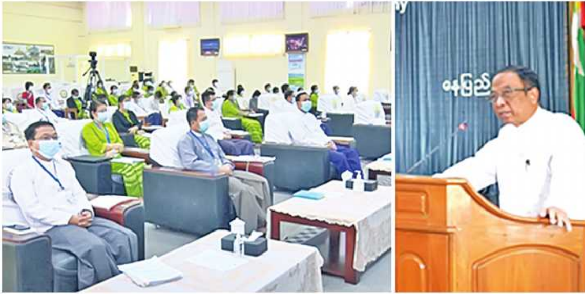
ဟိုတယ်နှင့်ခရီးသွားလာရေးဝန်ကြီးဌာန ပြည်ထောင်စုဝန်ကြီး ဒေါက်တာဌေးအောင် ခရီးသွားလုပ်ငန်းနှင့် ဆန်းသစ်တီထွင်ဖန်တီးနိုင်စွမ်းရှိသော စီးပွားရေးခေါင်းစဉ်ဖြင့်ကျင်းပသည့် အသိပညာပေးဆွေးနွေးပွဲတွင် အမှာစကားပြောကြားစဉ်။

နေပြည်တော် အောက်တိုဘာ ၂၀ ဟိုတယ်နှင့်ခရီးသွားလာရေးဝန်ကြီးဌာန ပြည်ထောင်စုဝန်ကြီး ဒေါက်တာဌေးအောင် သည် မြန်မာနိုင်ငံဟိုတယ်နှင့်ခရီးသွားလုပ်ငန်းများ၏ ဆန်းသစ်တီထွင်မှု၊ အသေးစား၊ အငယ်စားနှင့် အလတ်စား စီးပွားရေးလုပ်ငန်းများ၏ ဆန်းသစ်တီထွင်မှုနှင့် အလုပ်အကိုင်အခွင့်အလမ်းများ ဖွံ့ဖြိုးတိုးတက်စေရန်ရည်ရွယ်၍ ယနေ့ နံနက်ပိုင်းတွင် ဝန်ကြီးဌာန ကျောက်စိမ်းခန်းမ၌ Hybrid စနစ်ဖြင့် ကျင်းပသော ခရီးသွားလုပ်ငန်းနှင့် ဆန်းသစ်တီထွင်ဖန်တီးနိုင်စွမ်းရှိသော စီးပွားရေးခေါင်းစဉ်ဖြင့် ကျင်းပသည့် အသိပညာပေးဆွေးနွေးပွဲသို့ တက်ရောက်သည်။ ဆွေးနွေးပွဲသို့ ဝန်ကြီးဌာနမှ ညွှန်ကြားရေးမှူးချုပ်များနှင့် အရာထမ်းများ၊ စက်မှုဝန်ကြီးဌာနနှင့် အလုပ်သမားဝန်ကြီးဌာနတို့မှ ဖိတ်ကြားထားသူများ၊ မြန်မာနိုင်ငံခရီးသွားလုပ်ငန်းအဖွဲ့ချုပ် ဥက္ကဋ္ဌနှင့် ညီနောင်အသင်းများမှ တာဝန်ရှိပုဂ္ဂိုလ်များ၊ တက္ကသိုလ်၊ ကောလိပ်များမှ ဆရာ၊ ဆရာမများ၊ တိုင်းဒေသကြီးနှင့် ပြည်နယ်ရုံးခွဲများမှ တာဝန်ခံများ တက်ရောက်ကြသည်။ ဆွေးနွေးပွဲ၌ ပြည်ထောင်စုဝန်ကြီးက