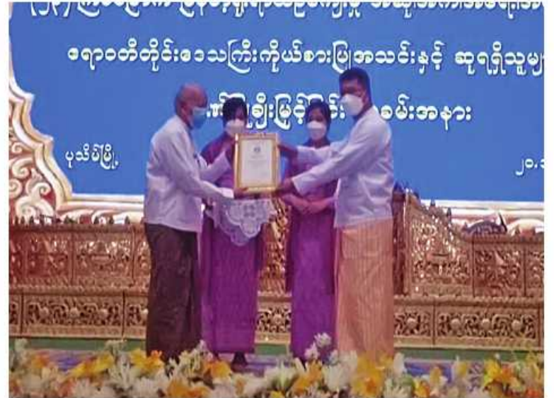
ရောဝတီတိုင်းဒေသကြီးဝန်ကြီးချုပ် ဦးတင်မောင်ဝင်း တိုင်းဒေသကြီးကိုယ်စားပြုအသင်းမှ ဘာသာရပ်အလိုက် ပညာရှင်ကြီးများနှင့် အသင်းနည်းပြများကို ဂုဏ်ပြုမှတ်တမ်းလွှာ ပေးအပ်ချီးမြှင့်စဉ်။

နေပြည်တော် အောက်တိုဘာ ၂၀ ဦးစွာ တိုင်းဒေသကြီးဝန်ကြီးချုပ်က (၂၃)ကြိမ်မြောက် မြန်မာ့ရိုးရာယဉ်ကျေးမှု အဆို၊ အက၊ အရေး၊ အတီး(ပဟိုအဆင့်) ပြိုင်ပွဲတွင် ဝင်ရောက်ယှဉ်ပြိုင်ခဲ့သည့် ရောဝတီတိုင်းဒေသကြီးကိုယ်စားပြုအသင်းနှင့် ဆုရရှိသူများအား ဂုဏ်ပြုဆုချီးမြှင့်ခြင်းကို ယနေ့နေ့လယ်ပိုင်းတွင် ပုသိမ်မြို့၊ မြို့တော်ခန်းမ၌ပြုလုပ်ရာ ရောဝတီတိုင်းဒေသကြီးဝန်ကြီးချုပ် ဦးတင်မောင်ဝင်း၊ အနောက်တောင်တိုင်းစစ်ဌာနချုပ် ဒုတိယတိုင်းမှူး ဝိုလ်မှူးချုပ်အောင်ခင်ဇော်နှင့် ဌာနဆိုင်ရာတာဝန်ရှိသူများ၊ ပြိုင်ပွဲဝင်များနှင့် ဖိတ်ကြားထားသူများ တက်ရောက်ကြသည်။ ဦးစွာ တိုင်းဒေသကြီးဝန်ကြီးချုပ်က ဂုဏ်ပြုအမှာစကားပြောကြားပြီး တိုင်းဒေသကြီးကိုယ်စားပြုအသင်းမှ ဘာသာရပ်အလိုက် ပညာရှင်ကြီးများနှင့် အသင်းနည်းပြများကို ဂုဏ်ပြုမှတ်တမ်းလွှာပေးအပ်ရာ တာဝန်ရှိသူ တစ်ဦးက လက်ခံရယူသည်။ ထို့နောက် (၂၃)ကြိမ်မြောက် မြန်မာ့ရိုးရာယဉ်ကျေးမှု အဆို၊ အက၊ အရေး၊ အတီး(ပဟိုအဆင့်)ပြိုင်ပွဲတွင် ဝင်ရောက်ယှဉ်ပြိုင်ခဲ့သည့် တိုင်းဒေသကြီးကိုယ်စားပြုအသင်းမှ ဆုရရှိခဲ့သူများကို တိုင်းဒေသကြီးဝန်ကြီးချုပ်၊ ဒုတိယတိုင်းမှူးနှင့် တာဝန်ရှိသူများက ဂုဏ်ပြုဆုများ ပေးအပ်ချီးမြှင့်ကြသည်။ ထို့နောက် တာဝန်ရှိသူတစ်ဦးက ကျေးဇူးတင်စကားပြန်လည်ပြောကြားသည်။ ယင်းနောက် တိုင်းဒေသကြီးဝန်ကြီးချုပ်နှင့် အဖွဲ့ဝင်များသည် တိုင်းဒေသကြီးကိုယ်စားပြုအသင်းမှ ဆုရရှိသူများ၏ ဖျော်ဖြေမှုများကို ကြည့်ရှုအားပေးခဲ့ကြကြောင်း သတင်းရရှိသည်။