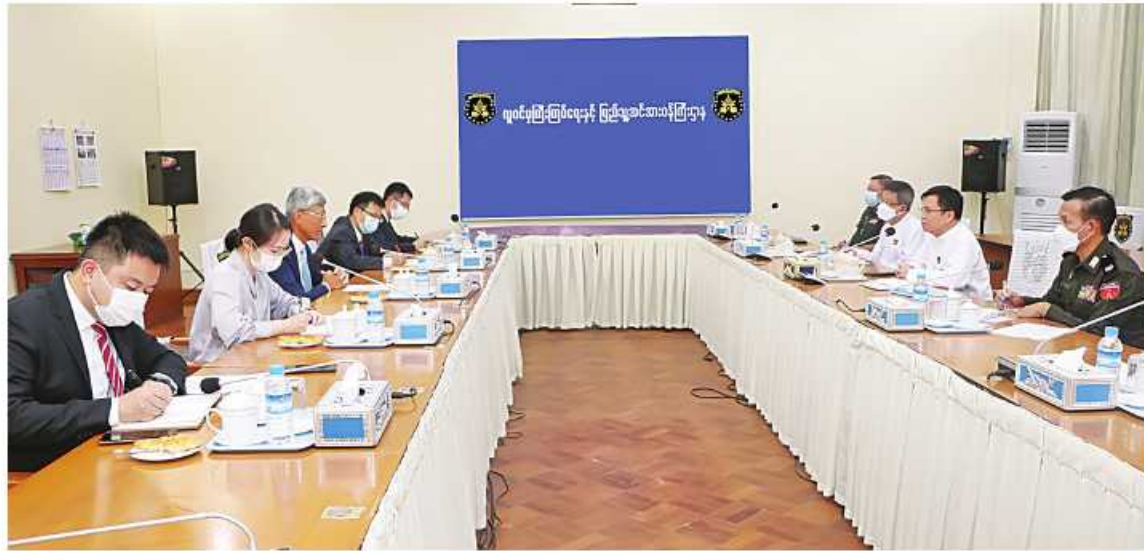
လူဝင်မှုကြီးကြပ်ရေးနှင့် ပြည်သူ့အင်အားဝန်ကြီးဌာန ပြည်ထောင်စုဝန်ကြီး ဦးမြင့်ကြိုင် မြန်မာနိုင်ငံဆိုင်ရာ တရုတ်ပြည်သူ့သမ္မတနိုင်ငံ သံအမတ်ကြီး Mr. Chen Hai နှင့်အဖွဲ့ကို လက်ခံတွေ့ဆုံစဉ်။

နေပြည်တော် အောက်တိုဘာ ၂၀ ကိုဗစ်-၁၉ ရောဂါ ကာကွယ်ဆေးနှင့် ပစ္စည်းများ ထောက်ပံ့ပေးမှုနှင့် ဘက်လားဒေ့ရှ်နိုင်ငံသို့ နေရပ်စွန့်ခွာသွားသူများပြန်လည်လက်ခံရေးလုပ်ငန်းစဉ်တွင် ပံ့ပိုးကူညီဆောင်ရွက်ပေးမှု၊ မြန်မာနိုင်ငံရှိ တရုတ်ကုန်သည်ကြီးများအသင်းနှင့် တရုတ်နယ်ပွားများနှင့် ပတ်သက်၍ ဥပဒေနှင့်အညီ ပံ့ပိုးကူညီဆောင်ရွက်ပေးနိုင်ရေး အခြေအနေများ၊ နယ်စပ်ဒေသအပါအဝင် မြန်မာ-တရုတ်နှစ်နိုင်ငံ လူဝင်မှုကြီးကြပ်ရေးလုပ်ငန်းများ အကျိုးတူပူးပေါင်းဆောင်ရွက်နိုင်ရေးအခြေအနေများနှင့်စပ်လျဉ်း၍ ရင်းနှီးပွင့်လင်းစွာ အမြင်ချင်းဖလှယ်ဆွေးနွေးခဲ့ကြသည်။ တွေ့ဆုံပွဲသို့ ဒုတိယဝန်ကြီး ဦးငွေလှိုင်နှင့် တာဝန်ရှိသူများ တက်ရောက်ခဲ့ကြကြောင်း သတင်းရရှိသည်။ (သတင်းစဉ်)