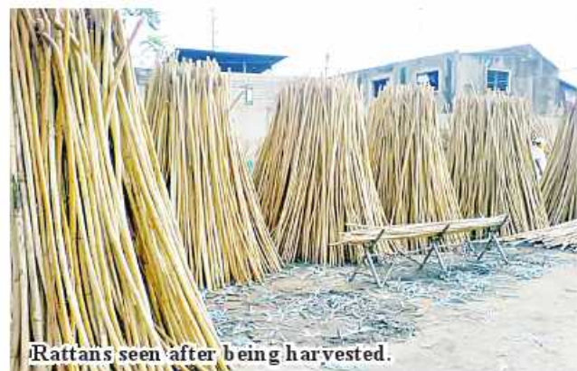
Rattans seen after being harvested.

There are more than 70 companies engaging in production of handiworks made of rattan and bamboo, earning some US$10 million of income per year. 336