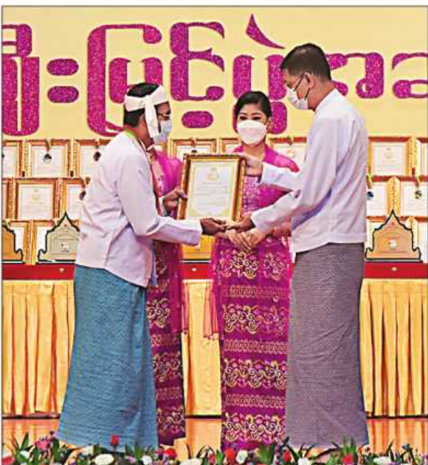
နိုင်ငံတော်စီမံအုပ်ချုပ်ရေးကောင်စီဝင် ဗိုလ်ချုပ်ကြီးမြထွန်းဦး ဆုရရှိသူ တစ်ဦးအား ဂုဏ်ပြုဆုတံဆိပ်နှင့် ဂုဏ်ပြုမှတ်တမ်းလွှာပေးအပ်ချီးမြှင့်စဉ်။