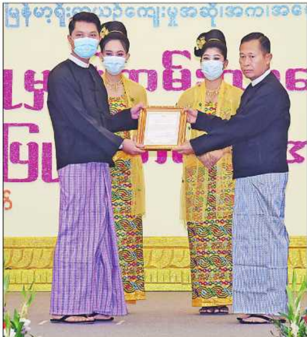
(၂၃)ကြိမ်မြောက် မြန်မာ့ရိုးရာယဉ်ကျေးမှု အဆို၊ အက၊ အရေး၊ အတီးပြိုင်ပွဲ ကျင်းပရေးဦးစီးကော်မတီနာယက နိုင်ငံတော်စီမံအုပ်ချုပ်ရေးကောင်စီဒုတိယ ဥက္ကဋ္ဌ ဒုတိယဝန်ကြီးချုပ် ဒုတိယဗိုလ်ချုပ်မှူးကြီးစိုးဝင်း အခမ်းအနားမှူး တစ်ဦးအား ဂုဏ်ပြုမှတ်တမ်းလွှာပေးအပ်ချီးမြှင့်စဉ်။