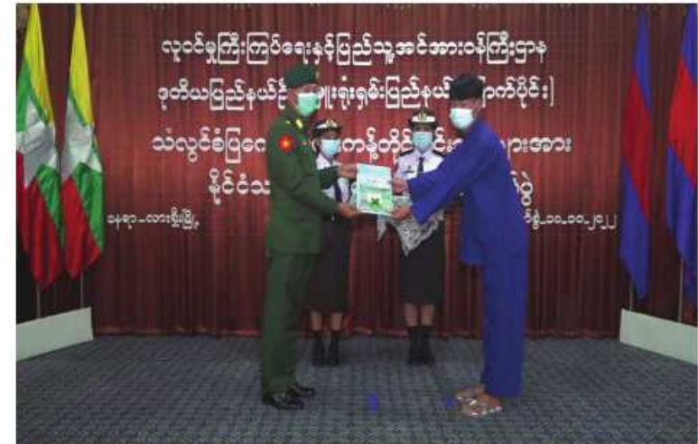
အရှေ့မြောက်တိုင်းစစ်ဌာနချုပ် တိုင်းမှူး ဗိုလ်ချုပ်နိုင်နိုင်ဦး လားရှိုးမြို့အတွင်းရှိ ဒေသခံကိုးကန့်တိုင်းရင်းသားပြည်သူတစ်ဦးကို နိုင်ငံသားစိစစ်ရေးကတ်ပြား ပေးအပ်စဉ်။

ရမ်းပြည်နယ်(မြောက်ပိုင်း) လားရှိုးမြို့ အတွင်းရှိ ဒေသခံကိုးကန့်တိုင်းရင်းသား ပြည်သူများအား ပန်းခင်းစီမံချက် အဆင့်(၂)ဖြင့် နိုင်ငံသားစိစစ်ရေးကတ်ပြား များ အခမဲ့ဆောင်ရွက်ပေးခြင်းကို ယနေ့ နေ့လယ်ပိုင်းတွင် လူဝင်မှုကြီးကြပ်ရေးနှင့် ပြည်သူ့အင်အားဝန်ကြီးဌာန ဥတိယ ပြည်နယ်ဦးစီးမှူးရုံး သစ္စာခန်းမ၌ပြုလုပ်ရာ အရှေ့မြောက်တိုင်းစစ်ဌာနချုပ် တိုင်းမှူး ဗိုလ်ချုပ်နိုင်နိုင်ဦးနှင့်အဖွဲ့ဝင်များ၊ ဥတိယ ပြည်နယ်ရဲတပ်ဖွဲ့မှူး၊ ခရိုင်ပြည်နယ်စီမံ အုပ်ချုပ်ရေးအဖွဲ့မှ တာဝန်ရှိသူများ၊ “ဝ” ယဉ်ကျေးမှုနှင့် ပလောင်ယဉ်ကျေးမှုတို့မှ တာဝန်ရှိသူများ၊ ဖိတ်ကြားထားသော ဧည့်သည်တော်များနှင့် ဒေသခံကိုးကန့် တိုင်းရင်းသားပြည်သူများ တက်ရောက် ကြသည်။