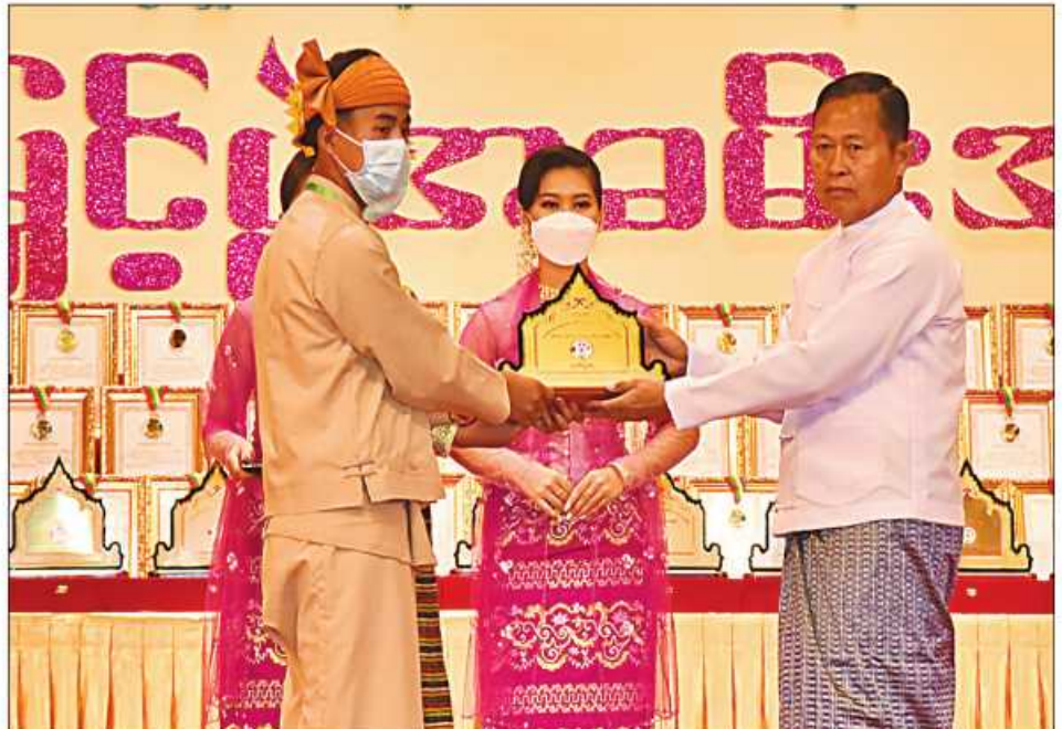
(၂၃)ကြိမ်မြောက် မြန်မာ့ရိုးရာယဉ်ကျေးမှု အဆို၊ အက၊ အရေး၊ အတီးပြိုင်ပွဲကျင်းပရေးဦးစီးကော်မတီနာယက နိုင်ငံတော်စီမံအုပ်ချုပ်ရေးကောင်စီဥက္ကဋ္ဌ ဒုတိယဝန်ကြီးချုပ် ဒုတိယဗိုလ်ချုပ်မှူးကြီးစိုးဝင်း ရှမ်းပြည်နယ် တိုင်းရင်းသားရိုးရာနှင့် ကျေးလက်ရိုးရာယဉ်ကျေးမှုအဖွဲ့အား ဂုဏ်ပြုဆုပေးအပ်ချီးမြှင့်စဉ်။