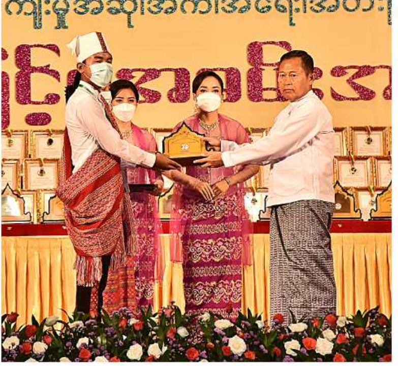
(၂၃)ကြိမ်မြောက် မြန်မာ့ရိုးရာယဉ်ကျေးမှု အဆို၊ အက၊ အရေး၊ အတီးပြိုင်ပွဲကျင်းပရေးဦးစီးကော်မတီနာယက နိုင်ငံတော်စီမံအုပ်ချုပ်ရေးကောင်စီဒုတိယဥက္ကဋ္ဌ ဒုတိယဝန်ကြီးချုပ် ဒုတိယဝန်ကြီးချုပ်မှူးကြီးစိုးဝင်းက တိုင်းဒေသကြီးနှင့် ပြည်နယ်များမှ တိုင်းရင်းသားရိုးရာနှင့် ကျေးလက်ရိုးရာ ယဉ်ကျေးမှုအဖွဲ့များကို ဂုဏ်ပြုဆုများပေးအပ်ချီးမြှင့်စဉ်။

ကြသည့် တိုင်းဒေသကြီးနှင့် ပြည်နယ်များမှ ပြိုင်ပွဲဝင်များ၏ ကြိုးစားအားထုတ်မှုကိုလည်း တန်ဖိုးထားအသိအမှတ်ပြုပါကြောင်း။ မြန်မာ့ရိုးရာယဉ်ကျေးမှု အဆို၊ အက၊ အရေး၊ အတီးပြိုင်ပွဲကြီးကို နိုင်ငံတော်အနေဖြင့် အချိန်အား၊ လူအား၊ ဓနငွေကြေး အင်အားများနှင့် ကျင်းပပေးနေခြင်းသည် မြန်မာနိုင်ငံအတွင်း စုစည်းနေထိုင်ကြသည့်