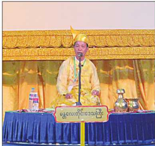
မန္တလေးတိုင်းဒေသကြီး