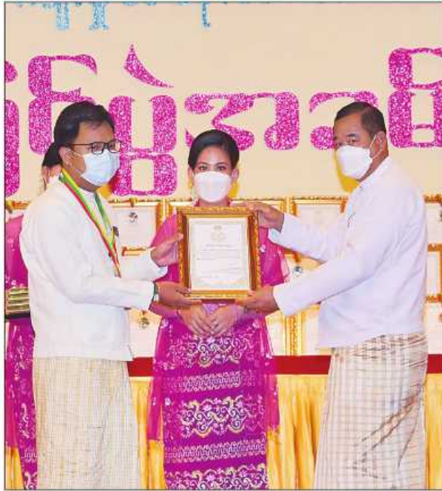
ပြည်ထောင်စုဝန်ကြီး ဒုတိယဗိုလ်ချုပ်ကြီးထွန်းထွန်းနောင် ဆုရရှိသူတစ်ဦးအား ဂုဏ်ပြုဆုတံဆိပ်နှင့် ဂုဏ်ပြုမှတ်တမ်းလွှာပေးအပ်ချီးမြှင့်စဉ်။