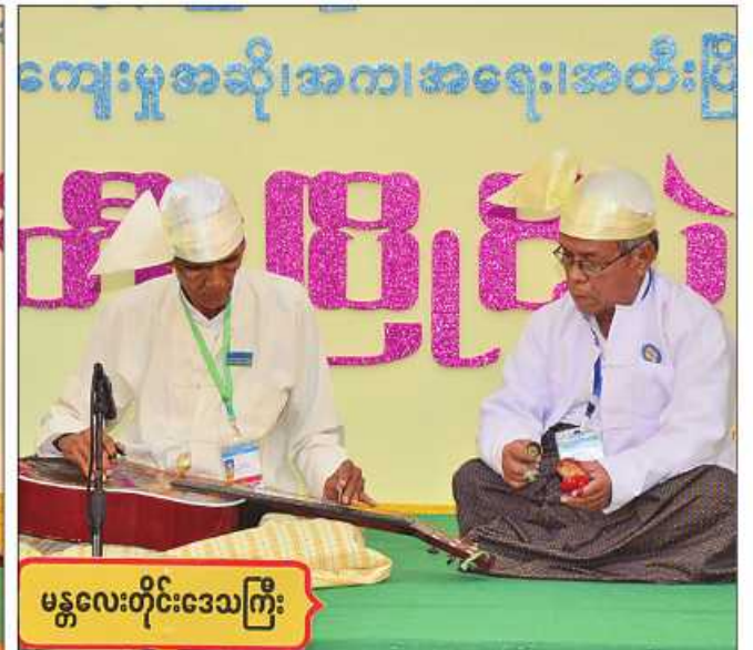
မန္တလေးတိုင်းဒေသကြီး