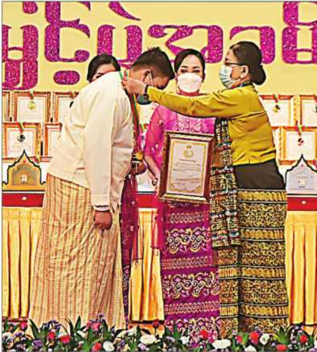
နိုင်ငံတော်စီမံအုပ်ချုပ်ရေးကောင်စီဝင် ဒေါ်အေးနုစိန် ဆုရရှိသူတစ်ဦးအား ဂုဏ်ပြုဆုတံဆိပ်နှင့် ဂုဏ်ပြုမှတ်တမ်းလွှာပေးအပ်ချီးမြှင့်စဉ်။