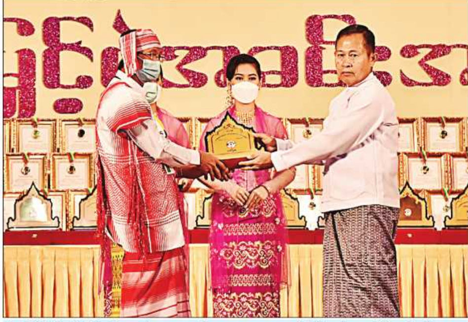
(၂၃)ကြိမ်မြောက် မြန်မာ့ရိုးရာယဉ်ကျေးမှု အဆို၊ အက၊ အရေး၊ အတီးပြိုင်ပွဲကျင်းပရေးဦးစီးကော်မတီနာယက နိုင်ငံတော်စီမံအုပ်ချုပ်ရေးကောင်စီဥက္ကဋ္ဌ ဒုတိယဝန်ကြီးချုပ် ဒုတိယဗိုလ်ချုပ်မှူးကြီးစိုးဝင်း ပဲခူးတိုင်းဒေသကြီး တိုင်းရင်းသားရိုးရာနှင့် ကျေးလက်ရိုးရာယဉ်ကျေးမှုအဖွဲ့အား ဂုဏ်ပြုဆုပေးအပ်ချီးမြှင့်စဉ်။