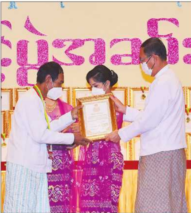
ပြည်ထောင်စုဝန်ကြီး ဦးခင်မောင်ရီ ဆုရရှိသူတစ်ဦးအား ဂုဏ်ပြုဆုတံဆိပ်နှင့် ဂုဏ်ပြုမှတ်တမ်းလွှာပေးအပ်ချီးမြှင့်စဉ်။