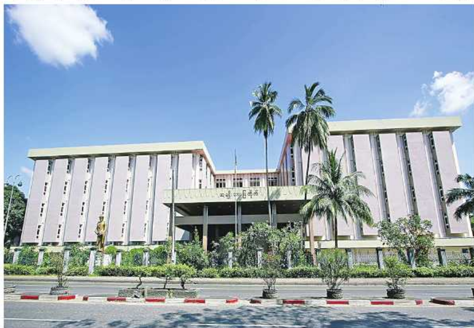
အမျိုးသားပြတိုက်(ရန်ကုန်)ကို တွေ့ရစဉ်။

ဒေသဆိုင်ရာအဆင့်(Regional Level)၊ ကမ္ဘာလုံး ဆိုင်ရာအဆင့်(Global Level)ထိ ချိတ်ဆက်၍ ဆောင်ရွက်လာနိုင်သည့်အမျှ နိုင်ငံတကာအာရုံစိုက် မှုရရှိစေခြင်း၊ မြန်မာနိုင်ငံ၏ ယဉ်ကျေးမှုအမွေအနှစ် များကို လာရောက်လေ့လာလိုသူများ ပို၍များလာနိုင် ခြင်း၊ (၄) ကမ္ဘာ့အမွေအနှစ် စာရင်းဝင်ဒေသအဖြစ် တိုးမြှင့်တင်ရန်နှင့် မီဒီယာအသွင် ထိရောက် သောပညာရေးဆောင်ရွက်မှုကြောင့် လူထုနှင့်နိုင်ငံတကာ တို့က မြန်မာ့ရှေးဟောင်းအမွေအနှစ်နှင့် သုတေသန ပညာရပ်များကို ကျယ်ပြန့်စွာသိမြင်လာနိုင်ခြင်း၊ (၅) ပြတိုက်နှင့်စာကြည့်တိုက်များ ခင်းကျင်းပြသမှုစနစ်တွင် ခေတ်မီနည်းစနစ်များ အစားထိုးဆောင်ရွက်ခြင်းဖြင့် နိုင်ငံတကာအဆင့်မီပြတိုက်နှင့် စာကြည့်တိုက်များ ပေါ်ထွန်းလာစေခြင်း၊ (၆) ရှေးဟောင်းဝတ္ထုပစ္စည်း များ ပိုမိုရှာဖွေဖော်ထုတ်၊ စုဆောင်း၊ ပြသလာနိုင် သည့်အမျှ မြန်မာ့အမျိုးသားတို့၏ အမျိုးဂုဏ်