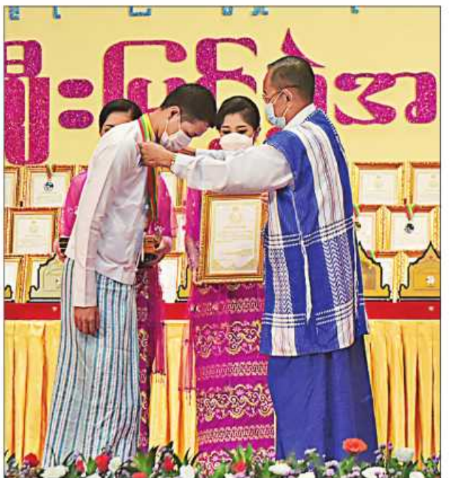
နိုင်ငံတော်စီမံအုပ်ချုပ်ရေးကောင်စီဝင် မန်းငြိမ်းမောင် ဆုရရှိသူတစ်ဦးအား ဂုဏ်ပြုဆုတံဆိပ်နှင့် ဂုဏ်ပြုမှတ်တမ်းလွှာပေးအပ်ချီးမြှင့်စဉ်။