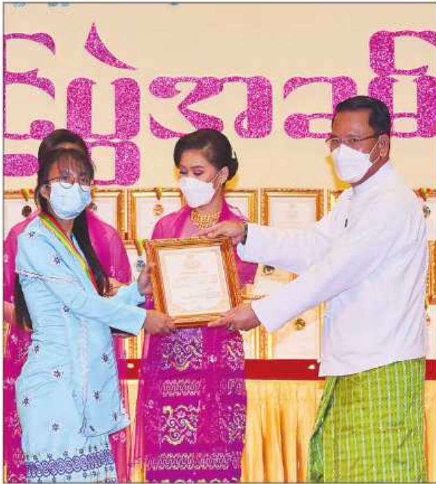
ပြည်ထောင်စုဝန်ကြီး ဦးမောင်မောင်အုန်း ဆုရရှိသူတစ်ဦးအား ဂုဏ်ပြုဆုတံဆိပ်နှင့် ဂုဏ်ပြုမှတ်တမ်းလွှာပေးအပ်ချီးမြှင့်စဉ်။