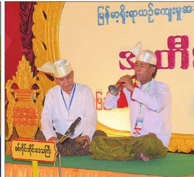
ဝင်တိုင်းတိုင်းဒေသကြီး