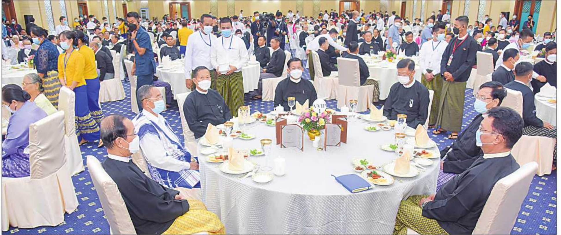
နိုင်ငံတော်စီမံအုပ်ချုပ်ရေးကောင်စီဥက္ကဋ္ဌ နိုင်ငံတော်ဝန်ကြီးချုပ် ဗိုလ်ချုပ်မှူးကြီးမင်းအောင်လှိုင်နှင့် အခမ်းအနားတက်ရောက်သူများ သာသနာရေးနှင့်ယဉ်ကျေးမှုဝန်ကြီးဌာန အနုပညာဦးစီးဌာနမှအနုပညာရှင်များ၏ ကပြဖျော်ဖြေမှုကို ကြည့်ရှုအားပေးစဉ်။