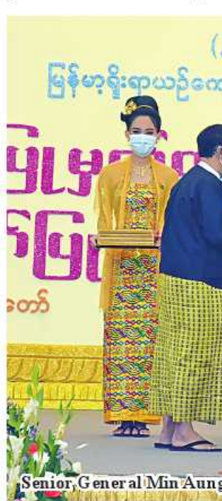
Senior General Min Aung Hlaing greets a recipient.

heritage and national characteristics; and To ensure a strong and dynamic Union spirit, the genuine spirit of patriotism - in building a