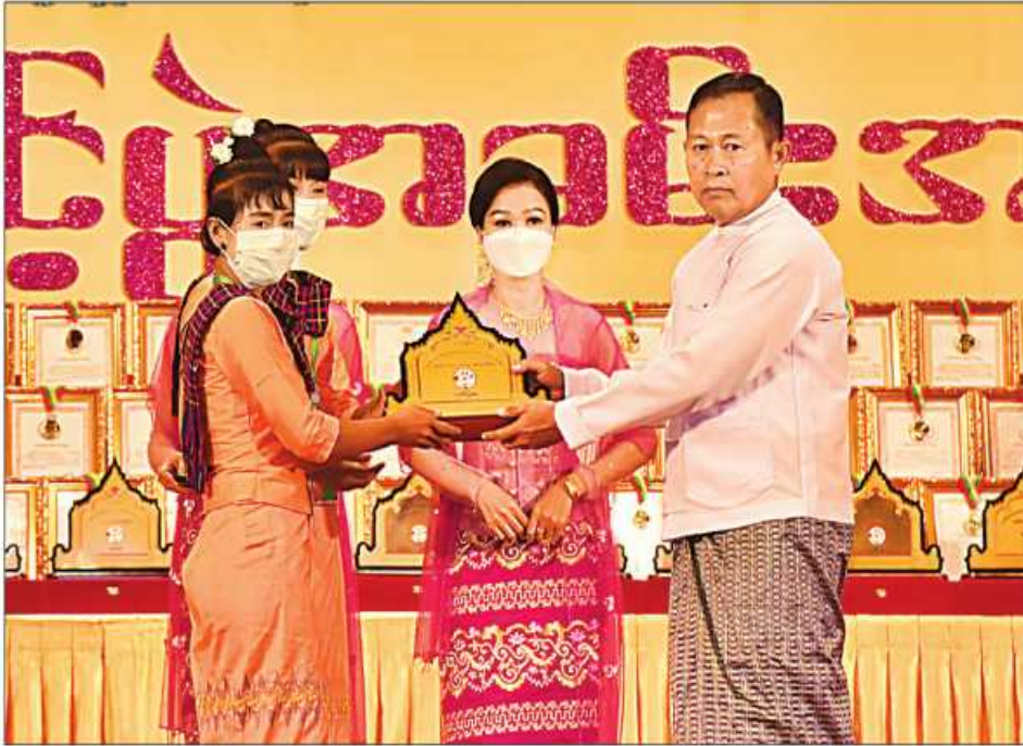
(၂၃)ကြိမ်မြောက် မြန်မာ့ရိုးရာယဉ်ကျေးမှု အဆို၊ အက၊ အရေး၊ အတီးပြိုင်ပွဲကျင်းပရေးဦးစီးကော်မတီနာယက နိုင်ငံတော်စီမံအုပ်ချုပ်ရေးကောင်စီဥက္ကဋ္ဌ ဒုတိယဝန်ကြီးချုပ် ဒုတိယဗိုလ်ချုပ်မှူးကြီးစိုးဝင်း မကွေးတိုင်း ဒေသကြီး တိုင်းရင်းသားရိုးရာနှင့် ကျေးလက်ရိုးရာယဉ်ကျေးမှုအဖွဲ့အား ဂုဏ်ပြုဆုပေးအပ်ချီးမြှင့်စဉ်။