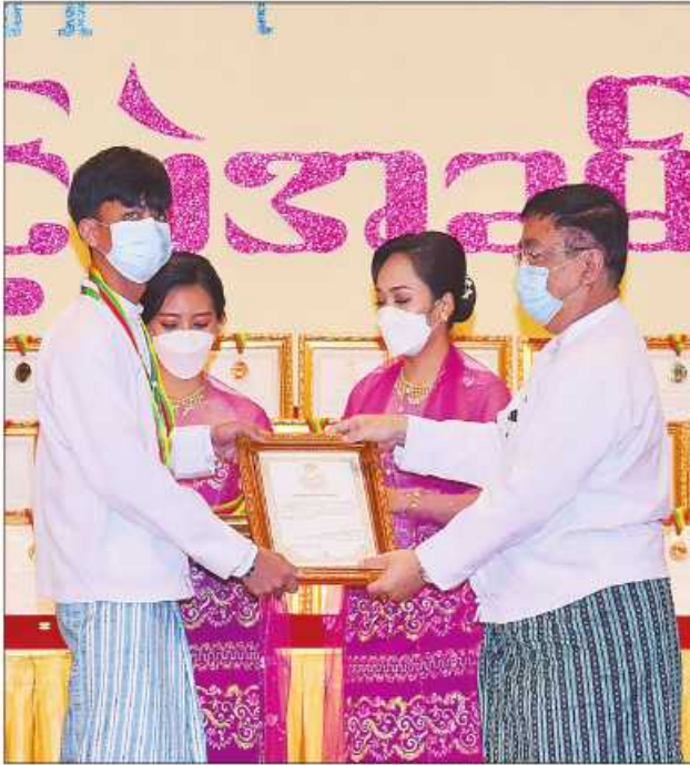
ပြည်ထောင်စုဝန်ကြီး ဒေါက်တာညွန့်ဖေ ဆုရရှိသူတစ်ဦးအား ဂုဏ်ပြု ဆုတံဆိပ်နှင့် ဂုဏ်ပြုမှတ်တမ်းလွှာပေးအပ်ချီးမြှင့်စဉ်။