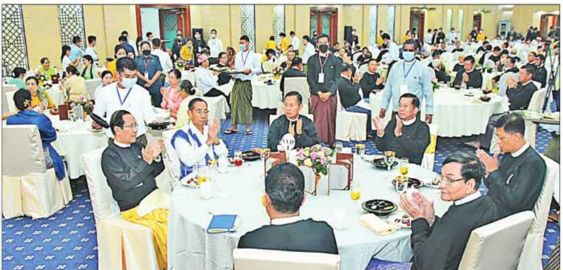
နိုင်ငံတော်စီမံအုပ်ချုပ်ရေးကောင်စီဥက္ကဋ္ဌ နိုင်ငံတော်ဝန်ကြီးချုပ် ဗိုလ်ချုပ်မှူးကြီးမင်းအောင်လှိုင်နှင့်တက်ရောက်လာကြသူများက ဂုဏ်ပြုညစာသုံးဆောင်နေစဉ်အတွင်း သာသနာရေးနှင့်ယဉ်ကျေးမှုဝန်ကြီးဌာန၊ အနုပညာဦးစီးဌာနမှ အနုပညာရှင်များ၏ တေးသံသာများဖြင့် သီဆို၊ တီးမှုတ်၊ ကပြဖျော်ဖြေမှုကို ကြည့်ရှုအားပေးစဉ်။