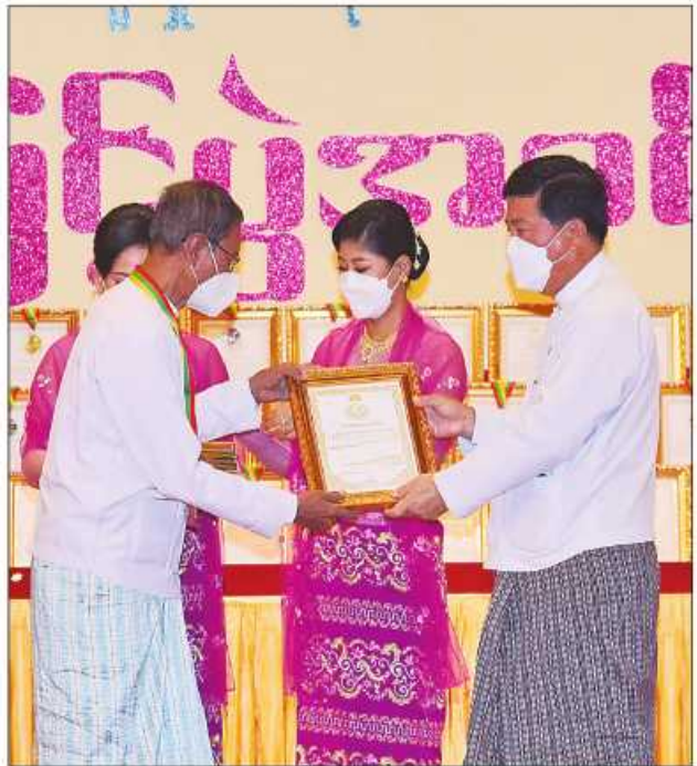
ပြည်ထောင်စုဝန်ကြီး ဒေါက်တာပွင့်ဆန်း ဆုရရှိသူတစ်ဦးအား ဂုဏ်ပြုဆုတံဆိပ်နှင့် ဂုဏ်ပြုမှတ်တမ်းလွှာပေးအပ်ချီးမြှင့်စဉ်။