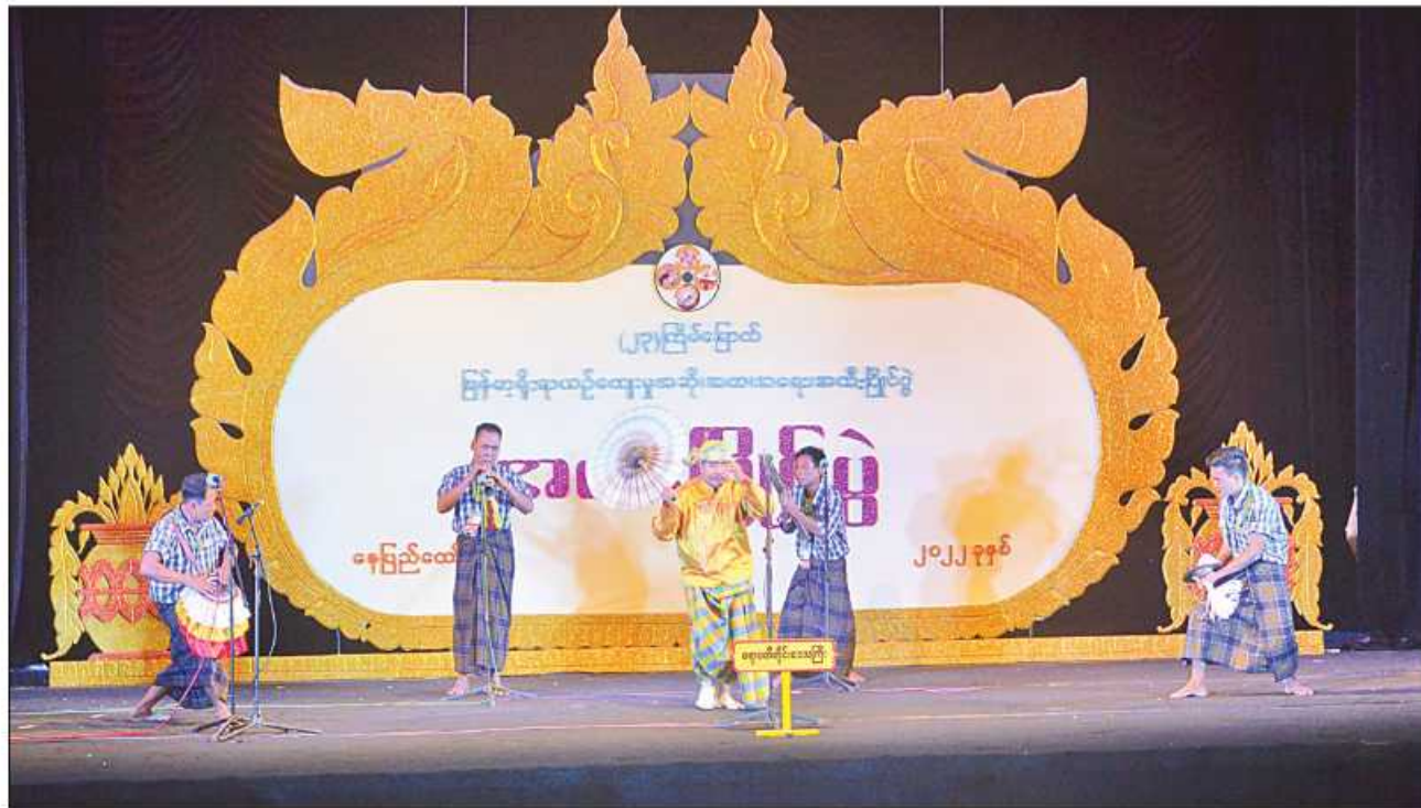
ဧရာဝတီတိုင်းဒေသကြီး