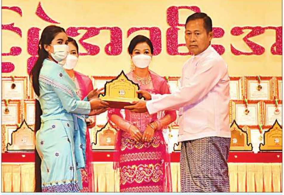
(၂၃)ကြိမ်မြောက် မြန်မာ့ရိုးရာယဉ်ကျေးမှု အဆို၊ အက၊ အရေး၊ အတီးပြိုင်ပွဲကျင်းပရေးဦးစီးကော်မတီနာယက နိုင်ငံတော်စီမံအုပ်ချုပ်ရေးကောင်စီဥက္ကဋ္ဌ ဒုတိယဝန်ကြီးချုပ် ဒုတိယဗိုလ်ချုပ်မှူးကြီးစိုးဝင်း ရန်ကုန်တိုင်း ဒေသကြီး တိုင်းရင်းသားရိုးရာနှင့် ကျေးလက်ရိုးရာယဉ်ကျေးမှုအဖွဲ့အား ဂုဏ်ပြုဆုပေးအပ်ချီးမြှင့်စဉ်။