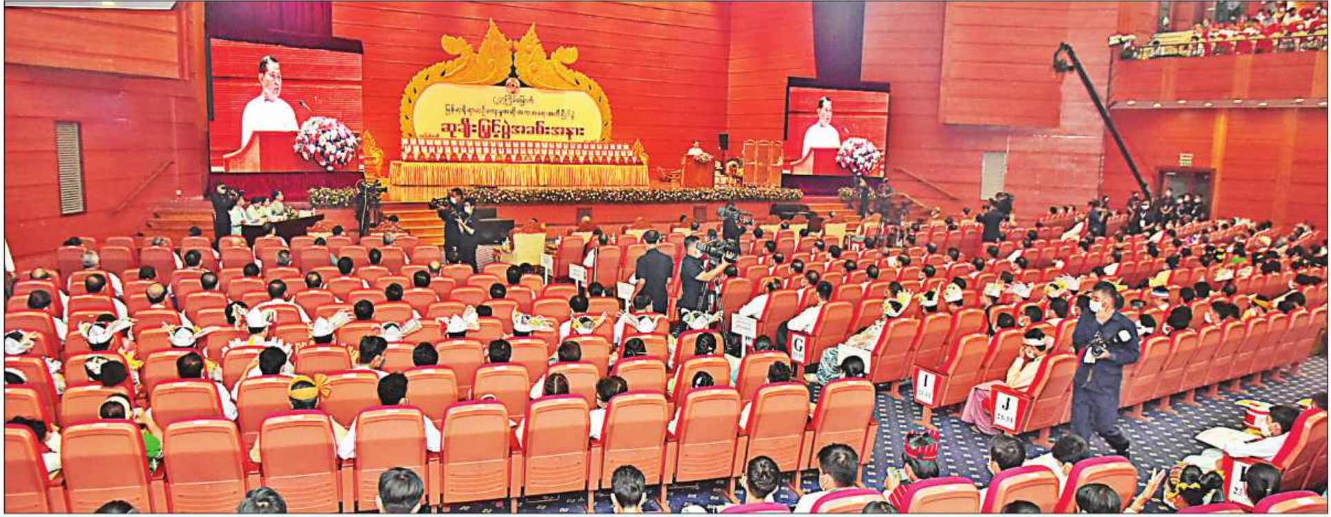
(၂၃)ကြိမ်မြောက် မြန်မာ့ရိုးရာယဉ်ကျေးမှု အဆို၊ အက၊ အရေး၊ အတီးပြိုင်ပွဲကျင်းပရေးဦးစီးကော်မတီနာယက နိုင်ငံတော်စီမံအုပ်ချုပ်ရေးကောင်စီဥက္ကဋ္ဌ ဒုတိယဝန်ကြီးချုပ် ဒုတိယဗိုလ်ချုပ်မှူးကြီးစိုးဝင်း (၂၃)ကြိမ်မြောက် မြန်မာ့ရိုးရာယဉ်ကျေးမှု အဆို၊ အက၊ အရေး၊ အတီးပြိုင်ပွဲ ဆုချီးမြှင့်ပွဲအခမ်းအနားတွင် အမှာစကားပြောကြားစဉ်။