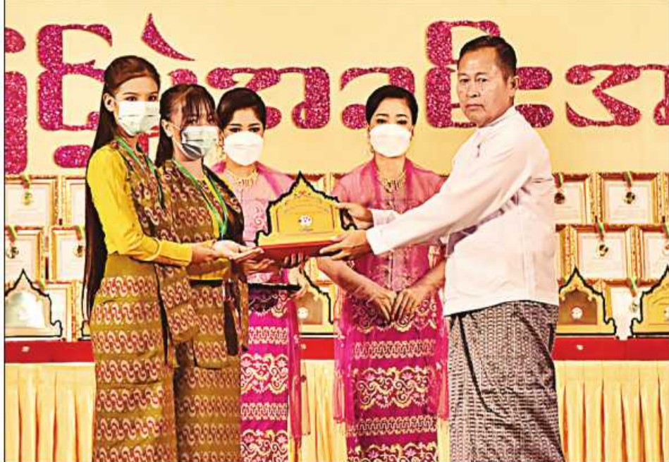
(၂၃)ကြိမ်မြောက် မြန်မာ့ရိုးရာယဉ်ကျေးမှု အဆို၊ အက၊ အရေး၊ အတီးပြိုင်ပွဲကျင်းပရေးဦးစီးကော်မတီနာယက နိုင်ငံတော်စီမံအုပ်ချုပ်ရေးကောင်စီဥက္ကဋ္ဌ ဒုတိယဝန်ကြီးချုပ် ဒုတိယဗိုလ်ချုပ်မှူးကြီးစိုးဝင်း စစ်ကိုင်းတိုင်း ဒေသကြီး တိုင်းရင်းသားရိုးရာနှင့် ကျေးလက်ရိုးရာယဉ်ကျေးမှုအဖွဲ့အား ဂုဏ်ပြုဆုပေးအပ်ချီးမြှင့်စဉ်။