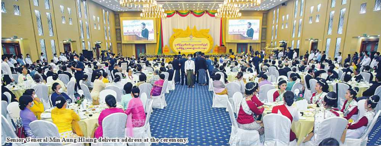
Senior General Min Aung Hlaing delivers address at the ceremony.

Nay Pyi Taw October 18 Certificate presentation ceremony and dinner in honour of 23 rd Myanmar Traditional Cultural Performing Arts Competitions were held at Myanmar International Convention Centre 2 here this evening attended by Chairman of State Administration Council Prime Minister Senior General Min Aung Hlaing.