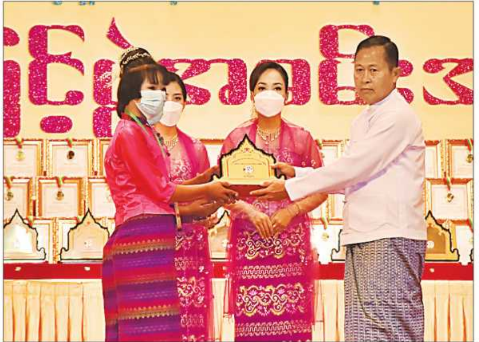
(၂၃)ကြိမ်မြောက် မြန်မာ့ရိုးရာယဉ်ကျေးမှု အဆို၊ အက၊ အရေး၊ အတီးပြိုင်ပွဲကျင်းပရေးဦးစီးကော်မတီနာယက နိုင်ငံတော်စီမံအုပ်ချုပ်ရေးကောင်စီဥက္ကဋ္ဌ ဒုတိယဝန်ကြီးချုပ် ဒုတိယဗိုလ်ချုပ်မှူးကြီးစိုးဝင်း မန္တလေးတိုင်း ဒေသကြီး တိုင်းရင်းသားရိုးရာနှင့် ကျေးလက်ရိုးရာယဉ်ကျေးမှုအဖွဲ့အား ဂုဏ်ပြုဆုပေးအပ်ချီးမြှင့်စဉ်။