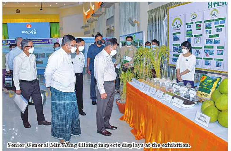
Senior General Min Aung Hlaing inspects displays at the exhibition.

strong as they exercise multi-party democracy while some others are also economically powerful despite practicing other political