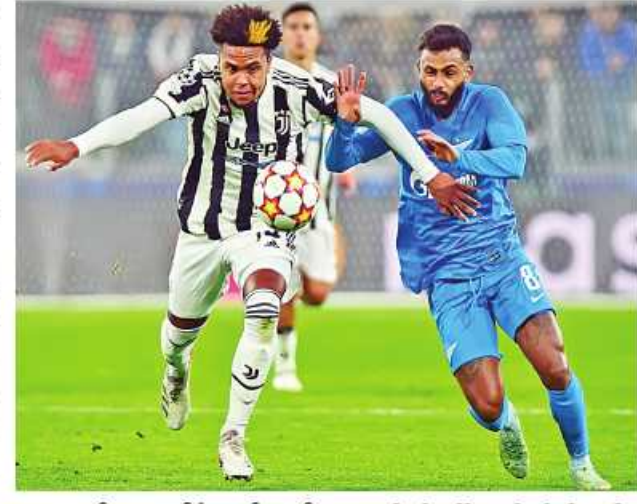
အရွှေ့တွင် ထပ်မံရောင်းချရန် စာရင်းတင်သွင်းခဲ့ပြီးနောက် ပရီးမီးယားလိဂ်ကလပ် စပါးအသင်း

သာ ပြုလုပ်နိုင်ခဲ့သဖြင့် စာချုပ်သက်တမ်းတိုးရန် တမ်းလွမ်းမှု မပြုလုပ်ဘဲ လာမည့် ဇန်နဝါရီ အပြောင်းအရွှေ့ ကာလတွင် ရောင်းချရန်ဆုံးဖြတ်ထားကြောင်း အသင်းဘုတ်အဖွဲ့က အတည်ပြု ပြောကြားခဲ့သည်။ ဂျူပင်တပ် အသင်းသည် မက်ကင်နီကို ပြီးခဲ့သည့် နွေရာသီ အပြောင်းအရွှေ့ကာလကတည်းက အသင်း၏ ဘဏ္ဍာရေးအကျပ်အတည်းကို ဖြေရှင်းနိုင်ရန်အတွက် ရောင်းချရန် ပြင်ဆင်ခဲ့သော်လည်း တမ်းလွမ်းမည်အသင်း မရှိသဖြင့် အသင်းတွင် ဆက်လက်ကျန်ရှိခဲ့ပြီး လာမည့် ဆောင်းရာသီအပြောင်း