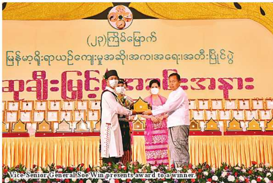
Vice-Senior General Soe Win presents award to a winner.

working committees, region- and state-level organizing committees, members of the penal of judges and all the enthusiastic youths who took part in the competition. He also expressed his belief that such a national-level performing arts competitions will turn out outstanding and promising artistes who will preserve traditional cultural heritage. Then, the Deputy Prime Minister gave away the prizes of honour to the cultural troupes of various indigenous peoples from the regions and states. The prize-giving ceremony was also attended by members of the State Administration Council, the Union Chief Justice, the Chairman of the Union Election Commission, Union Ministers, Union-level officials, Supreme Court Judges, members of the Constitutional Tribunal, UEC members, deputy ministers and members of the Union Civil Service Board. 100