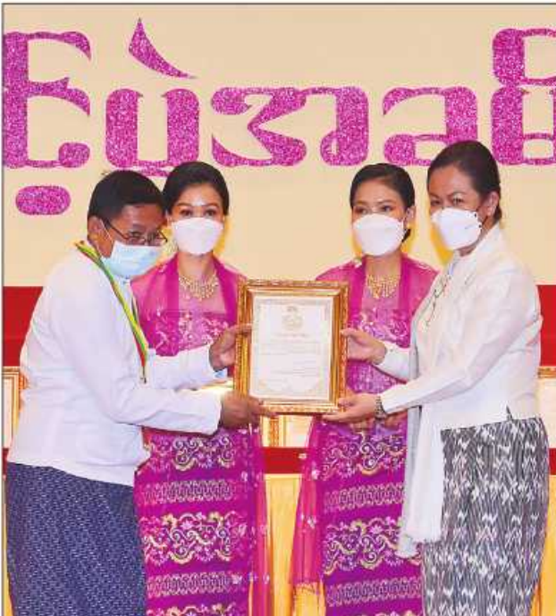
ပြည်ထောင်စုဝန်ကြီး ဒေါက်တာသက်သက်ခိုင် ဆုရရှိသူတစ်ဦးအား ဂုဏ်ပြု ဆုတံဆိပ်နှင့် ဂုဏ်ပြုမှတ်တမ်းလွှာပေးအပ်ချီးမြှင့်စဉ်။