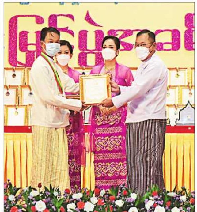
နိုင်ငံတော်စီမံအုပ်ချုပ်ရေးကောင်စီဝင် ဒုတိယဗိုလ်ချုပ်ကြီးစိုးထွဋ် ဆုရရှိသူ တစ်ဦးအား ဂုဏ်ပြုဆုတံဆိပ်နှင့် ဂုဏ်ပြုမှတ်တမ်းလွှာပေးအပ်ချီးမြှင့်စဉ်။