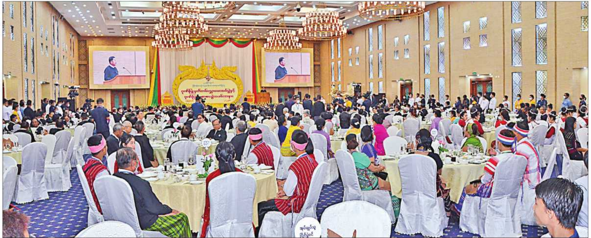
နိုင်ငံတော်စီမံအုပ်ချုပ်ရေးကောင်စီဥက္ကဋ္ဌ နိုင်ငံတော်ဝန်ကြီးချုပ် ဗိုလ်ချုပ်မှူးကြီးမင်းအောင်လှိုင် (၂၃)ကြိမ်မြောက် မြန်မာ့ရိုးရာယဉ်ကျေးမှုအဆို၊ အက၊ အရေး၊ အတီးပြိုင်ပွဲ ဂုဏ်ပြုမှတ်တမ်းလွှာပေးအပ်ပွဲနှင့်ဂုဏ်ပြုညစာစားပွဲအခမ်းအနားတွင် ဂုဏ်ပြုအမှာစကားပြောကြားစဉ်။