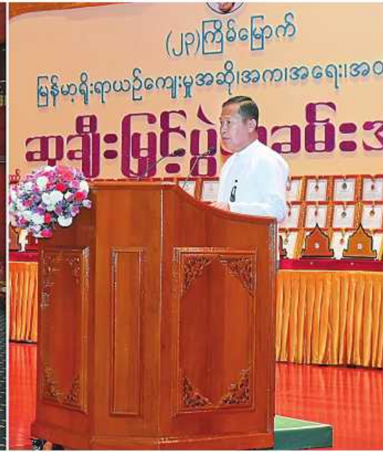
(၂၃)ကြိမ်မြောက် မြန်မာ့ရိုးရာယဉ်ကျေးမှု အဆို၊ အက၊ အရေး၊ အတီး ပြိုင်ပွဲကျင်းပရေး ဦးစီးကော်မတီနာယက နိုင်ငံတော်စီမံအုပ်ချုပ်ရေး ကောင်စီဒုတိယဥက္ကဋ္ဌ ဒုတိယဝန်ကြီးချုပ် ဒုတိယဝန်ကြီးချုပ်မှူးကြီးစိုးဝင်း (၂၃)ကြိမ်မြောက် မြန်မာ့ရိုးရာယဉ်ကျေးမှု အဆို၊ အက၊ အရေး၊ အတီးပြိုင်ပွဲ ဆုချီးမြှင့်ပွဲအခမ်းအနားတွင် အမှာစကားပြောကြားစဉ်။