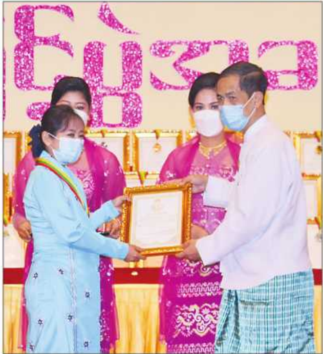
ပြည်ထောင်စုဝန်ကြီး ဦးကိုကိုလှိုင် ဆုရရှိသူတစ်ဦးအား ဂုဏ်ပြုဆုတံဆိပ်နှင့် ဂုဏ်ပြုမှတ်တမ်းလွှာပေးအပ်ချီးမြှင့်စဉ်။