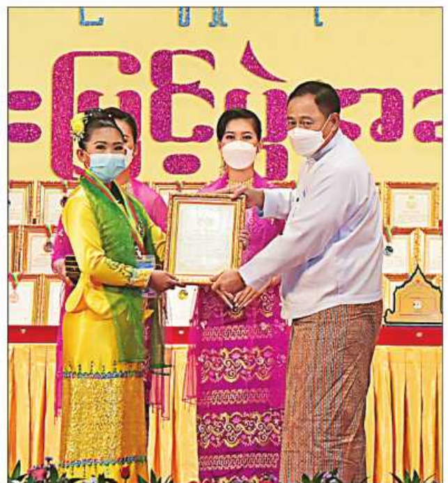
နိုင်ငံတော်စီမံအုပ်ချုပ်ရေးကောင်စီဝင် ဒုတိယဗိုလ်ချုပ်ကြီးရာပြည့် ဆုရရှိသူ တစ်ဦးအား ဂုဏ်ပြုဆုတံဆိပ်နှင့် ဂုဏ်ပြုမှတ်တမ်းလွှာပေးအပ်ချီးမြှင့်စဉ်။