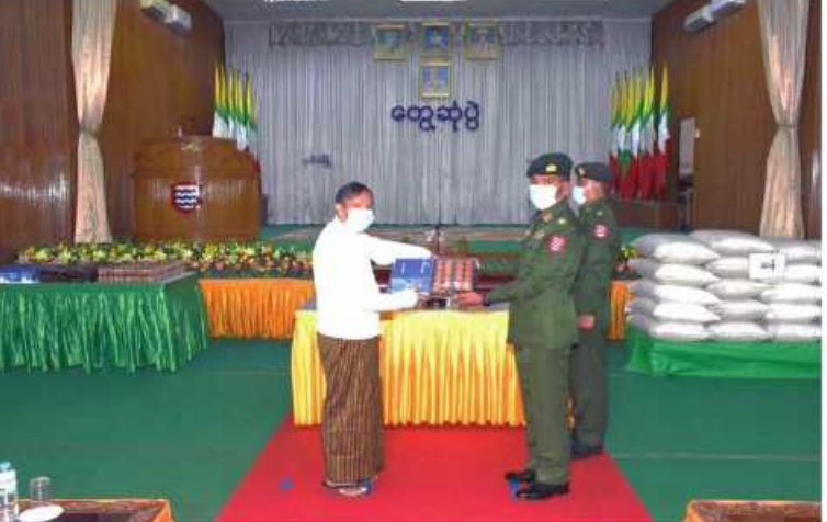
အနောက်တောင်တိုင်းစစ်ဌာနချုပ် တိုင်းမှူး ဗိုလ်မှူးချုပ်ကြည်ခိုင် စစ်မှုထမ်းဟောင်း အဖွဲ့ဝင်တစ်ဦးကို စားသောက်ဖွယ်ရာများနှင့် ကိုပစ်-၁၉ အထောက်အကူပြုပစ္စည်း များပေးအပ်စဉ်။

နေပြည်တော် အောက်တိုဘာ ၁၈ ရောဂါတိုင်းဒေသကြီးအတွင်းရှိ မြို့နယ် ၂၆ မြို့နယ်မှ စစ်မှုထမ်းဟောင်း အဖွဲ့ဝင်များနှင့် မိသားစုဝင်များကို ယနေ့နံနက်ပိုင်းတွင် အနောက်တောင်တိုင်း စစ်ဌာနချုပ် တိုင်းမှူး ဗိုလ်မှူးချုပ်ကြည်ခိုင် နှင့် အဖွဲ့ဝင်များက တိုင်းစစ်ဌာနချုပ်ရှိ ရောဂါတိုင်းဒေသကြီး တွေ့ဆုံသည်။ ထိုသို့တွေ့ဆုံရာတွင် တိုင်းမှူးက အမှာစကားပြောကြားပြီး စစ်မှုထမ်းဟောင်း အဖွဲ့ဝင်များနှင့် မိသားစုဝင်များ၏ ကြည့်ရှုအားပေးခဲ့ကြောင်း သတင်း တင်ပြချက်များအပေါ် လိုအပ်သည်များ ညှိနှိုင်းဆောင်ရွက်ပေးပြီး စားသောက် ဖွယ်ရာများနှင့် ကိုပစ်-၁၉ အထောက် အကူပြုပစ္စည်းများပေးအပ်ရာ တာဝန်ရှိသူ များက အသီးသီးလက်ခံရယူကြသည်။ ထို့နောက် စစ်မှုထမ်းဟောင်းအဖွဲ့ဝင် များနှင့် မိသားစုဝင်များအား နယ်မြေခံ မေးအဖွဲ့က ကျန်းမာရေးစောင့်ရှောက်မှု လုပ်ငန်းများ ဆောင်ရွက်ပေးသည်။ ထိုသို့ ဆောင်ရွက်ပေးနေမှုများကို တိုင်းမှူးနှင့်အဖွဲ့ဝင်များက လိုက်လံ ကြည့်ရှုအားပေးခဲ့ကြောင်း သတင်း ရရှိသည်။