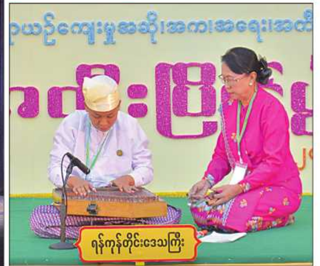
ရန်ကင်းတိုင်းဒေသကြီး