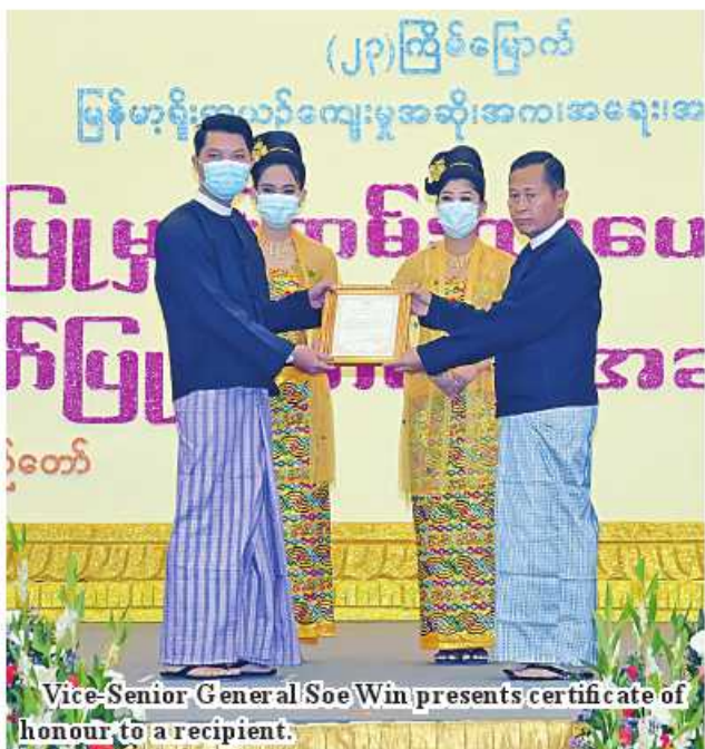
Vice-Senior General Soe Win presents certificate of honour to a recipient.

In 1840s, Polish pianist Chopin created the song on nights when West Palace Queen Ma Mya Gale wrote classic song "Chit Tha Hmya Ko" according to the records.