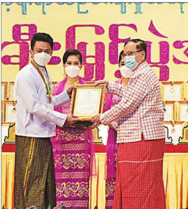
နိုင်ငံတော်စီမံအုပ်ချုပ်ရေးကောင်စီဝင် ဒေါက်တာဗညားအောင်မိုး ဆုရရှိသူ တစ်ဦးအား ဂုဏ်ပြုဆုတံဆိပ်နှင့် ဂုဏ်ပြုမှတ်တမ်းလွှာပေးအပ်ချီးမြှင့်စဉ်။