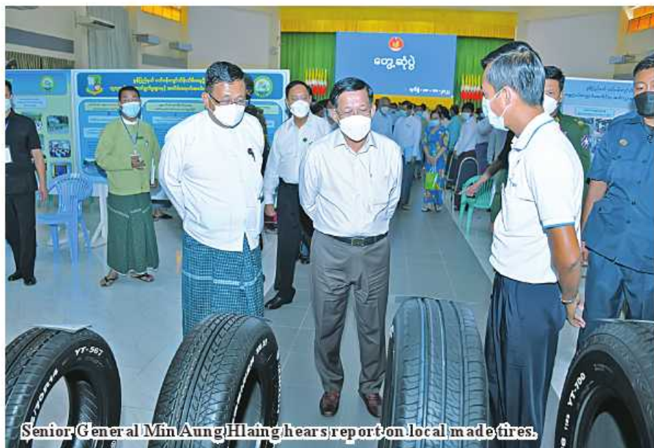
Senior General Min Aung Hlaing hears report on local made tires.

greater efforts for economic progress as Mon State has good prospects for industries and services, necessary assistance to be rendered by respective ministries, occasional State disbursements of loans with low interest rates, coordinated measures for approval of loans in accord with the requirements, the need for businesspeople to settle their debts within the prescribed period as the State will be able to circulate and cover spending only if its debts are settled, providing of assistance after forming cooperative syndicates for the rural people to improve their income and rural develop-