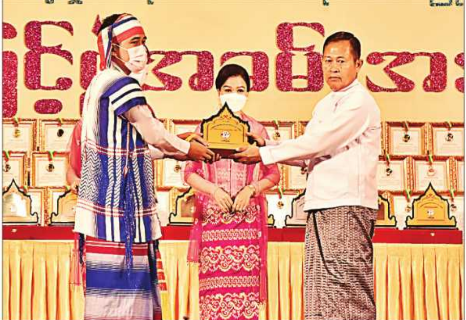
(၂၃)ကြိမ်မြောက် မြန်မာ့ရိုးရာယဉ်ကျေးမှု အဆို၊ အက၊ အရေး၊ အတီးပြိုင်ပွဲကျင်းပရေးဦးစီးကော်မတီနာယက နိုင်ငံတော်စီမံအုပ်ချုပ်ရေးကောင်စီဥက္ကဋ္ဌ ဒုတိယဝန်ကြီးချုပ် ဒုတိယဗိုလ်ချုပ်မှူးကြီးစိုးဝင်း ကရင်ပြည်နယ် တိုင်းရင်းသားရိုးရာနှင့် ကျေးလက်ရိုးရာယဉ်ကျေးမှုအဖွဲ့အား ဂုဏ်ပြုဆုပေးအပ်ချီးမြှင့်စဉ်။