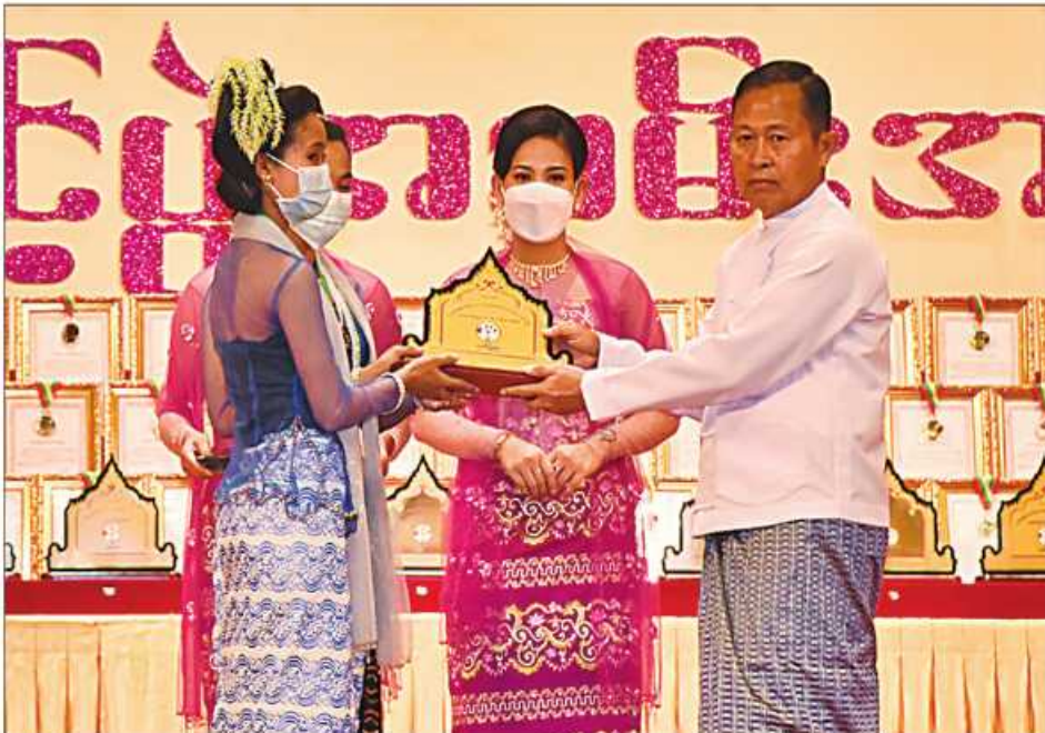
(၂၃)ကြိမ်မြောက် မြန်မာ့ရိုးရာယဉ်ကျေးမှု အဆို၊ အက၊ အရေး၊ အတီးပြိုင်ပွဲကျင်းပရေးဦးစီးကော်မတီနာယက နိုင်ငံတော်စီမံအုပ်ချုပ်ရေးကောင်စီဥက္ကဋ္ဌ ဒုတိယဝန်ကြီးချုပ် ဒုတိယဗိုလ်ချုပ်မှူးကြီးစိုးဝင်း ရခိုင်ပြည်နယ် တိုင်းရင်းသားရိုးရာနှင့် ကျေးလက်ရိုးရာယဉ်ကျေးမှုအဖွဲ့အား ဂုဏ်ပြုဆုပေးအပ်ချီးမြှင့်စဉ်။