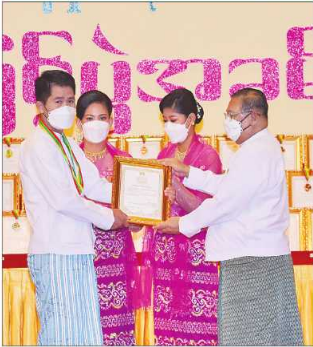
ပြည်ထောင်စုဝန်ကြီး ဦးဝဏ္ဏမောင်လွင် ဆုရရှိသူတစ်ဦးအား ဂုဏ်ပြုဆုတံဆိပ်နှင့် ဂုဏ်ပြုမှတ်တမ်းလွှာပေးအပ်ချီးမြှင့်စဉ်။