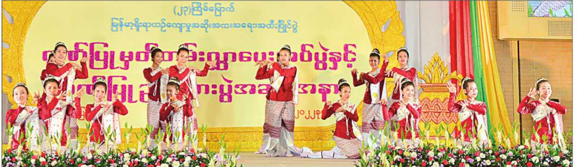
(၂၃)ကြိမ်မြောက် မြန်မာ့ရိုးရာယဉ်ကျေးမှု အဆို၊ အက၊ အရေး၊ အတီးပြိုင်ပွဲ ဂုဏ်ပြုမှတ်တမ်းလွှာပေးအပ်ပွဲနှင့် ဂုဏ်ပြုညစာစားပွဲအခမ်းအနားတွင် သာသနာရေးနှင့်ယဉ်ကျေးမှုဝန်ကြီးဌာန အနုပညာဦးစီးဌာနမှ အနုပညာရှင်များ သီဆိုကပြဖျော်ဖြေစဉ်။