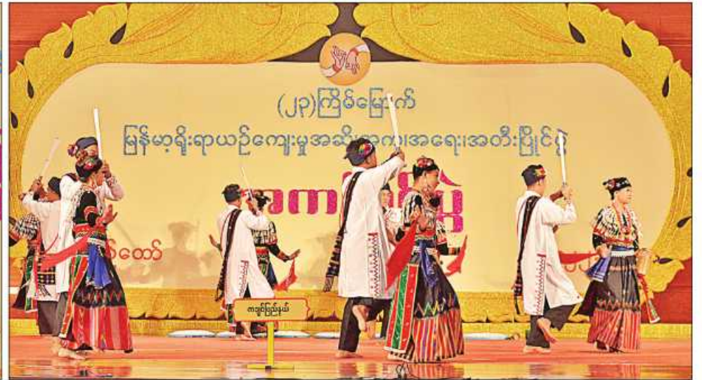
ကယားပြည်နယ်