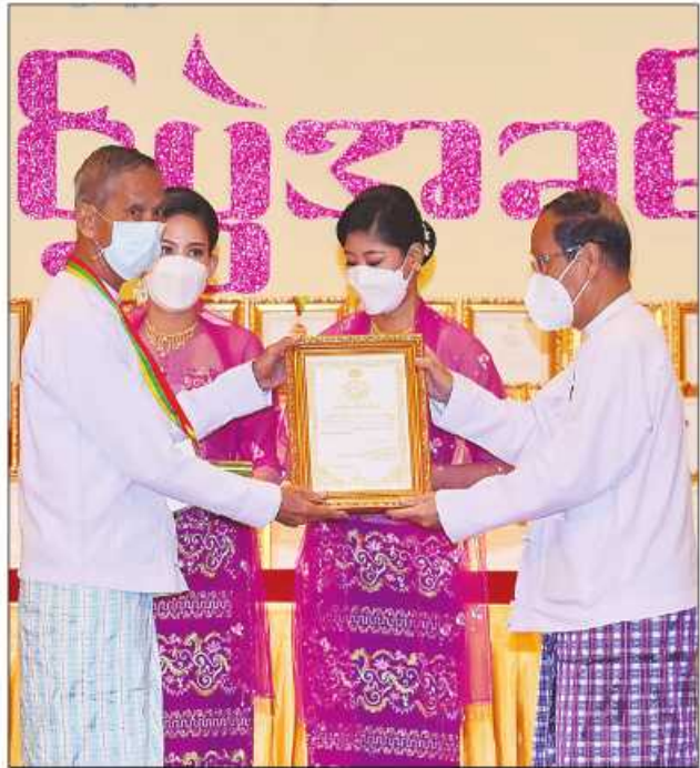
ပြည်ထောင်စုဝန်ကြီး ဦးကိုကို ဆုရရှိသူတစ်ဦးအား ဂုဏ်ပြုဆုတံဆိပ်နှင့် ဂုဏ်ပြုမှတ်တမ်းလွှာပေးအပ်ချီးမြှင့်စဉ်။