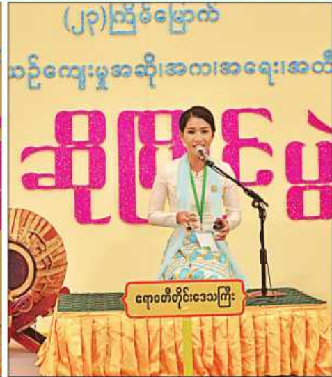
ဧရာဝတီတိုင်းဒေသကြီး