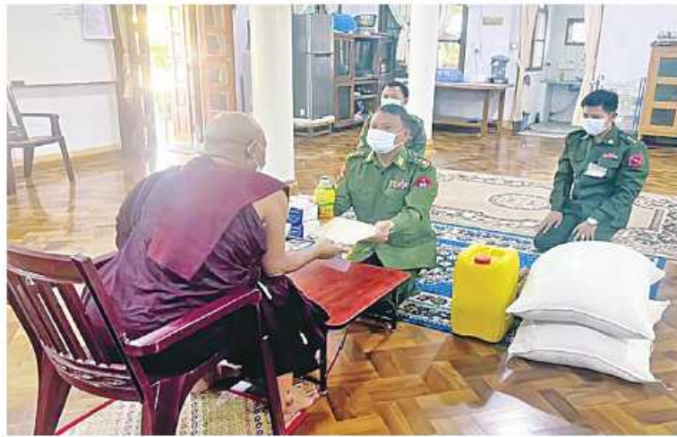
ရန်ကုန်တိုင်းဒေသကြီး လှည်းကူးမြို့နယ် စရပ်ကွင်းကျေးရွာရှိ စမ်းရေဖျားတောရတပ်ဦးကျောင်းတိုက်ဆရာတော်ထံ အင်းတိုင်တပ်နယ်မှ တာဝန်ရှိသူများက ဆွမ်းဆန်တော်၊ ဆီနှင့် လှူဖွယ်ပစ္စည်းများ ဆက်ကပ်လှူဒါန်းစဉ်။

နေပြည်တော် အောက်တိုဘာ ၁၈ ကိုဗစ်-၁၉ ရောဂါ ကြိုတင်ကာကွယ်ရေး လုပ်ငန်းများဆောင်ရွက်နေသည့် ကာလအတွင်း ဆွမ်းကိစ္စရပ်များ အဆင်ပြေစေရန် ရည်ရွယ်၍ တပ်မတော်(ကြည်း၊ ရေ၊ လေ) အရာရှိ၊ စစ်သည်၊ အရာထမ်း၊ အမှုထမ်းများနှင့် စေတနာရှင်အလှူရှင်များက မြို့နယ်အသီးသီးရှိ ဘုန်းတော်ကြီးကျောင်းများ၊ သာသနာ့နယ်ဝင် သီလရှင်ကျောင်းများ၊ ဘာသာရေးကျောင်းများနှင့် ဘိုးဘွားရိပ်သာများသို့ ဆွမ်းဆန်တော်၊ ဆီ၊ ဆား၊ ပဲ အမည်လေးမျိုးနှင့် လှူဖွယ်ပစ္စည်းများ လှူဒါန်းခြင်း၊ နေ့ဆွမ်းများဆက်ကပ်လှူဒါန်းခြင်းနှင့် လိုအပ်သည့် ကျန်းမာရေးစစ်ဆေးကုသပေးခြင်းများကို ဆောင်ရွက်လျက် ရှိသည်။