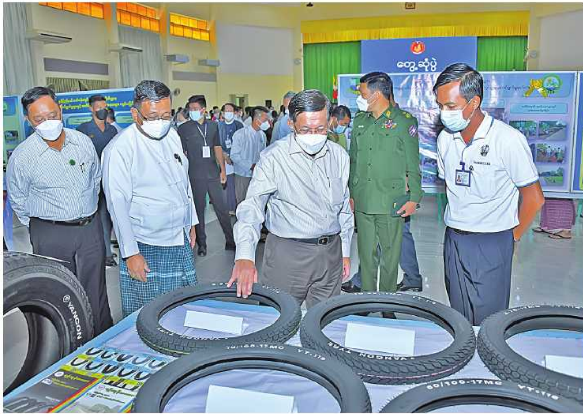
နိုင်ငံတော်စီမံအုပ်ချုပ်ရေးကောင်စီဥက္ကဋ္ဌ နိုင်ငံတော်ဝန်ကြီးချုပ် ဝင်းကျင်းပြသထားသည့် ထုတ်ကုန်ပစ္စည်းများကို ကြည့်ရှုလေ့လာစစ်ဆေးစဉ်။