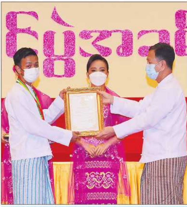
ပြည်ထောင်စုရာထူးဝန်အဖွဲ့ဥက္ကဋ္ဌ ဒေါက်တာမောင်မောင်ခိုင် ဆုရရှိသူတစ်ဦး အား ဂုဏ်ပြုဆုတံဆိပ်နှင့် ဂုဏ်ပြုမှတ်တမ်းလွှာပေးအပ်ချီးမြှင့်စဉ်။