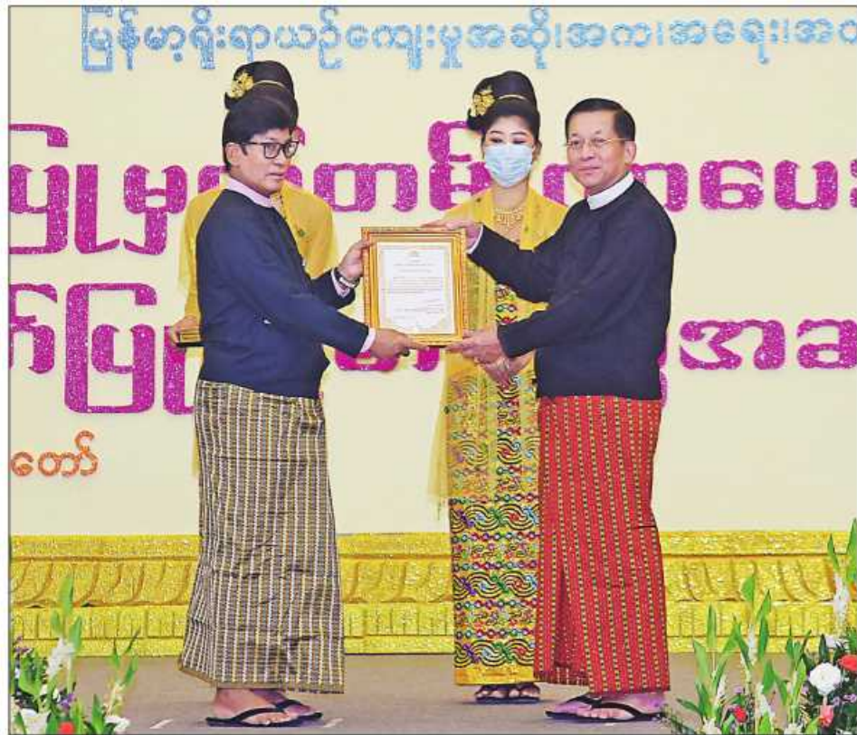
နိုင်ငံတော်စီမံအုပ်ချုပ်ရေးကောင်စီဥက္ကဋ္ဌ နိုင်ငံတော်ဝန်ကြီးချုပ် ဗိုလ်ချုပ်မှူးကြီးမင်းအောင်လှိုင် အတီးအကဖြတ်လုပ်ငန်းအဖွဲ့ကိုယ်စား ဥက္ကဋ္ဌ ဦးအောင်ကိန်းအား ဂုဏ်ပြုမှတ်တမ်းလွှာချီးမြှင့်စဉ်။