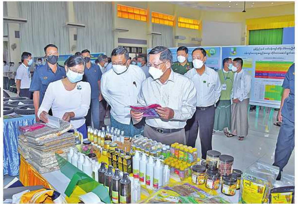
နိုင်ငံတော်စီမံအုပ်ချုပ်ရေးကောင်စီဥက္ကဋ္ဌ နိုင်ငံတော်ဝန်ကြီးချုပ် ဝိုလ်ချုပ်မှူးကြီးမင်းအောင်လှိုင် စင်းကျင်းပြသထားသည့် ဒေသရိုးရာလက်မှုထုတ်ကုန်ပစ္စည်းများကို ကြည့်ရှုလေ့လာစဉ်။