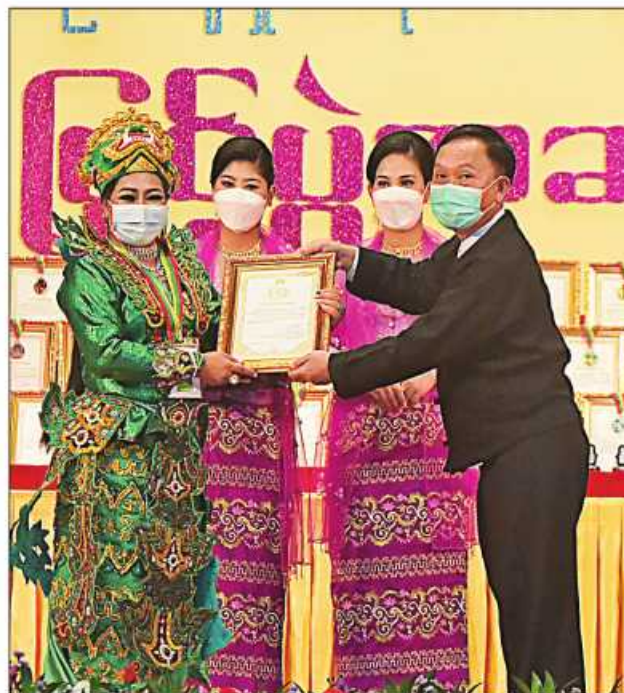
နိုင်ငံတော်စီမံအုပ်ချုပ်ရေးကောင်စီဝင် ဦးရွှေကြိမ်း ဆုရရှိသူတစ်ဦးအား ဂုဏ်ပြု ဆုတံဆိပ်နှင့် ဂုဏ်ပြုမှတ်တမ်းလွှာပေးအပ်ချီးမြှင့်စဉ်။