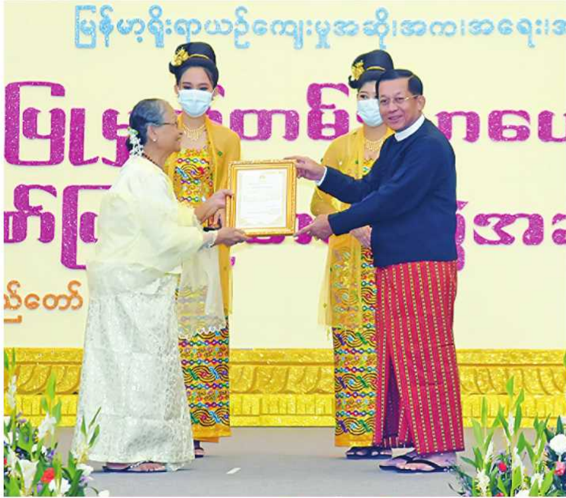
နိုင်ငံတော်စီမံအုပ်ချုပ်ရေးကောင်စီဥက္ကဋ္ဌ နိုင်ငံတော်ဝန်ကြီးချုပ် ဗိုလ်ချုပ်မှူးကြီးမင်းအောင်လှိုင်က အဆိုအကပြတ် လုပ်ငန်းအဖွဲ့ ကိုယ်စား ဥက္ကဋ္ဌ ဒေါ်သင်းသင်းမြတ်အား ဂုဏ်ပြုမှတ်တမ်းလွှာ ပေးအပ်ချီးမြှင့်စဉ်။

နိုင်ငံတော်စီမံအုပ်ချုပ်ရေးကောင်စီဥက္ကဋ္ဌ နိုင်ငံတော်ဝန်ကြီးချုပ် ဗိုလ်ချုပ်မှူးကြီးမင်းအောင်လှိုင် တက်ရောက်ချီးမြှင့်