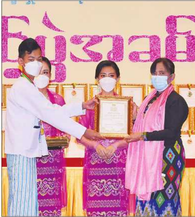
ပြည်ထောင်စုဝန်ကြီး ဒေါက်တာသီတာဦး ဆုရရှိသူတစ်ဦးအား ဂုဏ်ပြုဆုတံဆိပ်နှင့် ဂုဏ်ပြုမှတ်တမ်းလွှာပေးအပ်ချီးမြှင့်စဉ်။