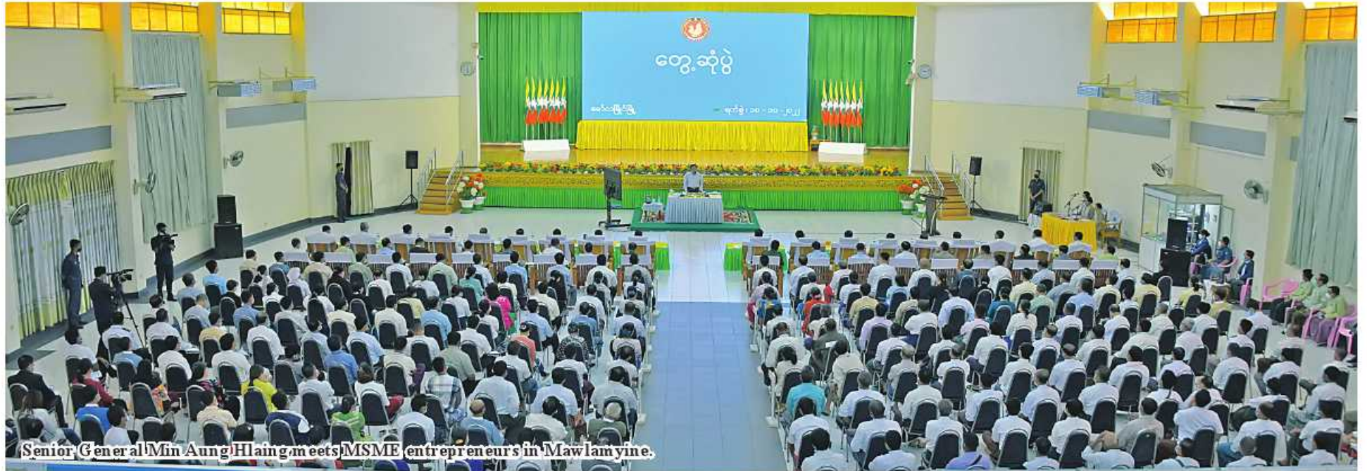
Senior General Min Aung Hlaing meets MSME entrepreneurs in Mawlamyine.

Nay Pyi Taw October 18 Chairman of the State Administration Council Prime Minister Senior General Min Aung Hlaing met MSME entrepreneurs from Mon State at the state hall in Mawlamyine this morning to discuss regional economic progress.