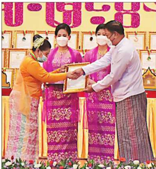
နိုင်ငံတော်စီမံအုပ်ချုပ်ရေးကောင်စီဝင် ဗိုလ်ချုပ်ကြီးတင်အောင်စန်း ဆုရရှိသူ တစ်ဦးအား ဂုဏ်ပြုဆုတံဆိပ်နှင့် ဂုဏ်ပြုမှတ်တမ်းလွှာပေးအပ်ချီးမြှင့်စဉ်။