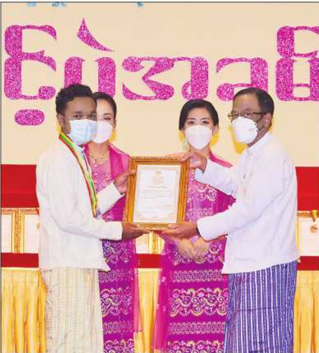
ပြည်ထောင်စုဝန်ကြီး ဒေါက်တာဌေးအောင် ဆုရရှိသူတစ်ဦးအား ဂုဏ်ပြု ဆုတံဆိပ်နှင့် ဂုဏ်ပြုမှတ်တမ်းလွှာပေးအပ်ချီးမြှင့်စဉ်။