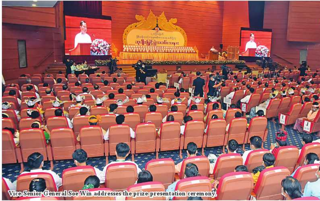
Vice-Senior General Soe Win addresses the prize-presentation ceremony.

Nay Pyi Taw October 18 State Administration Council Vice-Chairman Deputy Prime Minister Vice-Senior General Soe Win, in his capacity as the patron of the leading committee on organizing the competition, addressed the prize-giving ceremony of the 23 rd Myan-