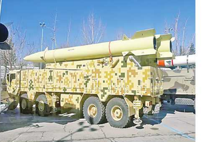
Iran plans to deliver Russia ballistic missiles ကို ဘာသာပြန်ဆို with Fateh-110 and Zolfaghar ထားပါသည်။

Zolfaghar သည် အီရန်ထုတ်ယာဉ်တင် Single-stage အစိုင်အခဲလောင်စာသုံးတာတိုပစ်ပဲ့ထိန်းခုံးကျည် SRBM (Short-Range Ballistic Missile) အမျိုးအစားပင်ဖြစ်သည်။ ၂၀၁၆ ခုနှစ် စက်တင်ဘာလတွင် အီရန်စစ်ရေးပြအခမ်းအနားတစ်ခုအတွင်း ထုတ်ဖော်ပြသခဲ့သည်။ အီရန်စစ်ဘက် သတင်းရင်းမြစ်များအရ Zolfaghar ခုံးကျည်သည် အကွာအဝေး ကီလိုမီတာ ၇၀၀ ထိ တိုက်ခိုက်နိုင်စွမ်းရှိသည်ဟု ဆိုသည်။ ၂၀၁၉ ခုနှစ် ဖေဖော်ဝါရီလတွင် အီရန်နိုင်ငံသည် ကီလိုမီတာ ၁၀၀၀ အကွာအဝေးရှိသော Dezful missile ဟု အမည်ပေးထားသည့် Zolfaghar ခုံးကျည်၏ တာဝေးပစ်စားရင်းအသစ်ကို ထုတ်ဖော်ပြသခဲ့သည်။