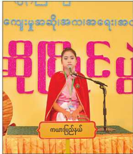
ကယားပြည်နယ်