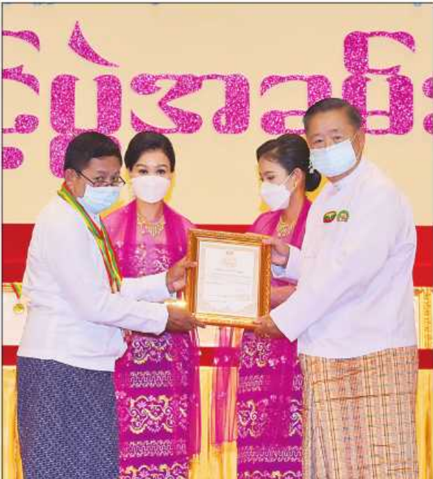
ပြည်ထောင်စုဝန်ကြီး ဦးစောထွန်းအောင်မြင့် ဆုရရှိသူတစ်ဦးအား ဂုဏ်ပြု ဆုတံဆိပ်နှင့် ဂုဏ်ပြုမှတ်တမ်းလွှာပေးအပ်ချီးမြှင့်စဉ်။