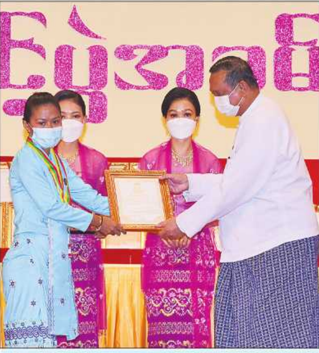
ပြည်ထောင်စုဝန်ကြီး ဦးရွှေလေး ဆုရရှိသူတစ်ဦးအား ဂုဏ်ပြုဆုတံဆိပ်နှင့် ဂုဏ်ပြုမှတ်တမ်းလွှာပေးအပ်ချီးမြှင့်စဉ်။