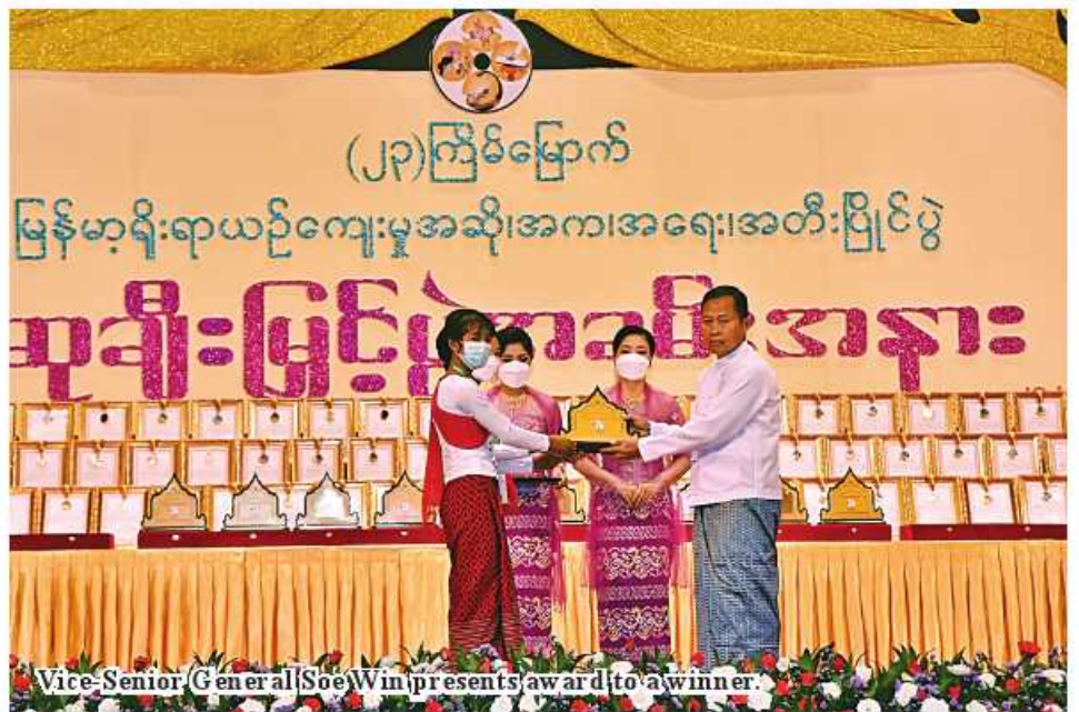
Vice-Senior General Soe Win presents award to a winner.