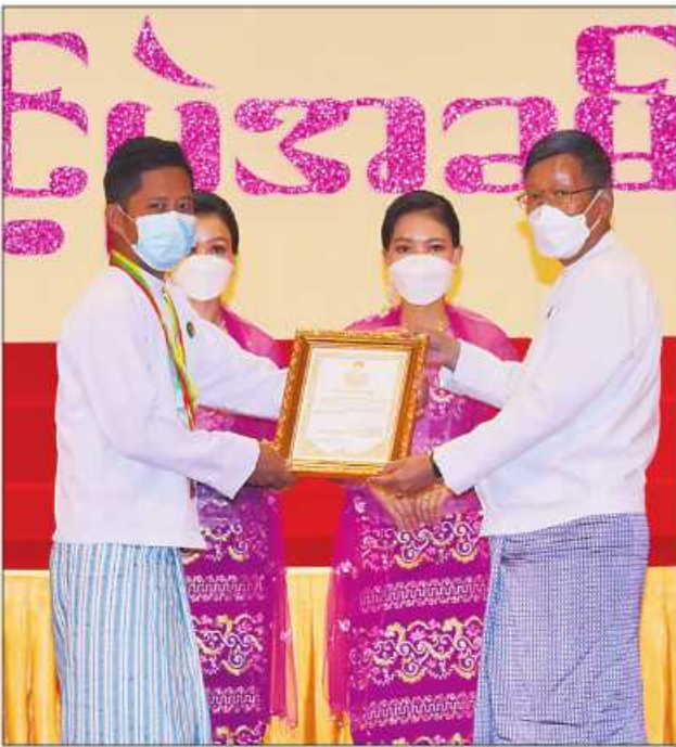
နေပြည်တော်ကောင်စီဥက္ကဋ္ဌ ဦးတင်ဦးလွင် ဆုရရှိသူတစ်ဦးအား ဂုဏ်ပြု ဆုတံဆိပ်နှင့် ဂုဏ်ပြုမှတ်တမ်းလွှာပေးအပ်ချီးမြှင့်စဉ်။