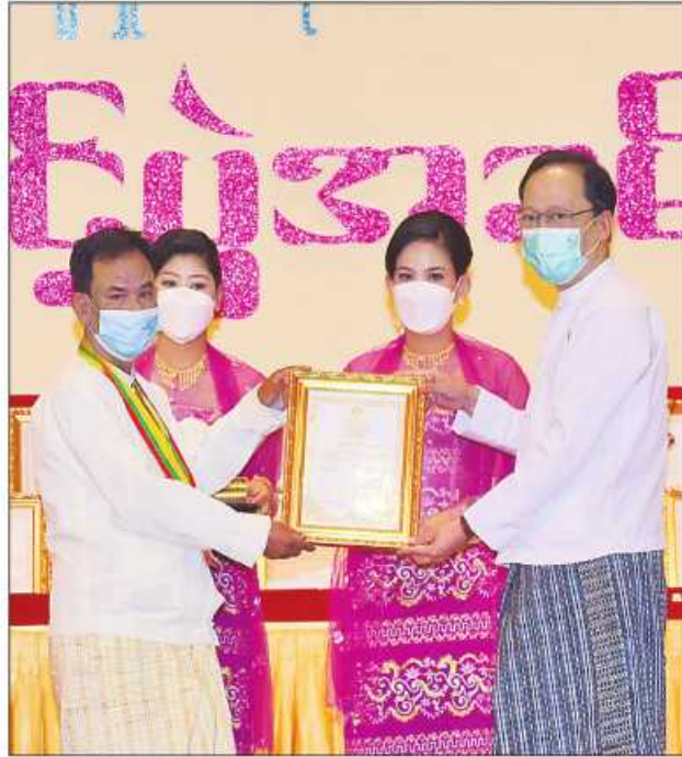
ပြည်ထောင်စုဝန်ကြီး ဒေါက်တာသက်ခိုင်ဝင်း ဆုရရှိသူတစ်ဦးအား ဂုဏ်ပြု ဆုတံဆိပ်နှင့် ဂုဏ်ပြုမှတ်တမ်းလွှာပေးအပ်ချီးမြှင့်စဉ်။