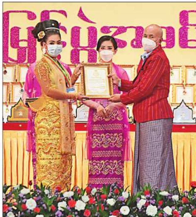
နိုင်ငံတော်စီမံအုပ်ချုပ်ရေးကောင်စီဝင် စောဒန်နီယယ် ဆုရရှိသူတစ်ဦးအား ဂုဏ်ပြုဆုတံဆိပ်နှင့် ဂုဏ်ပြုမှတ်တမ်းလွှာပေးအပ်ချီးမြှင့်စဉ်။