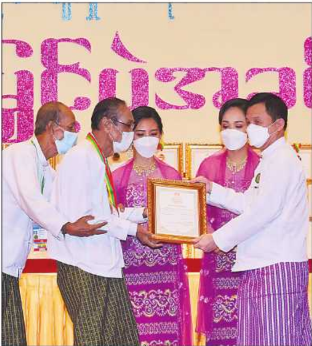
ပြည်ထောင်စုဝန်ကြီး ဦးမြင့်ကြိုင်ဆုရရှိသူတစ်ဦးအား ဂုဏ်ပြုဆုတံဆိပ်နှင့် ဂုဏ်ပြုမှတ်တမ်းလွှာပေးအပ်ချီးမြှင့်စဉ်။