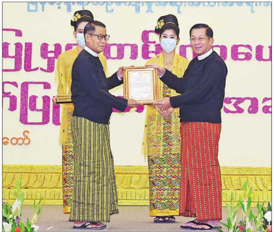
နိုင်ငံတော်စီမံအုပ်ချုပ်ရေးကောင်စီဥက္ကဋ္ဌ နိုင်ငံတော်ဝန်ကြီးချုပ် ဗိုလ်ချုပ်မှူးကြီးမင်းအောင်လှိုင် အရေးအကဖြတ်လုပ်ငန်းအဖွဲ့ကိုယ်စား အတွင်းရေးမှူး ဦးမင်းယုအား ဂုဏ်ပြုမှတ်တမ်းလွှာချီးမြှင့်စဉ်။