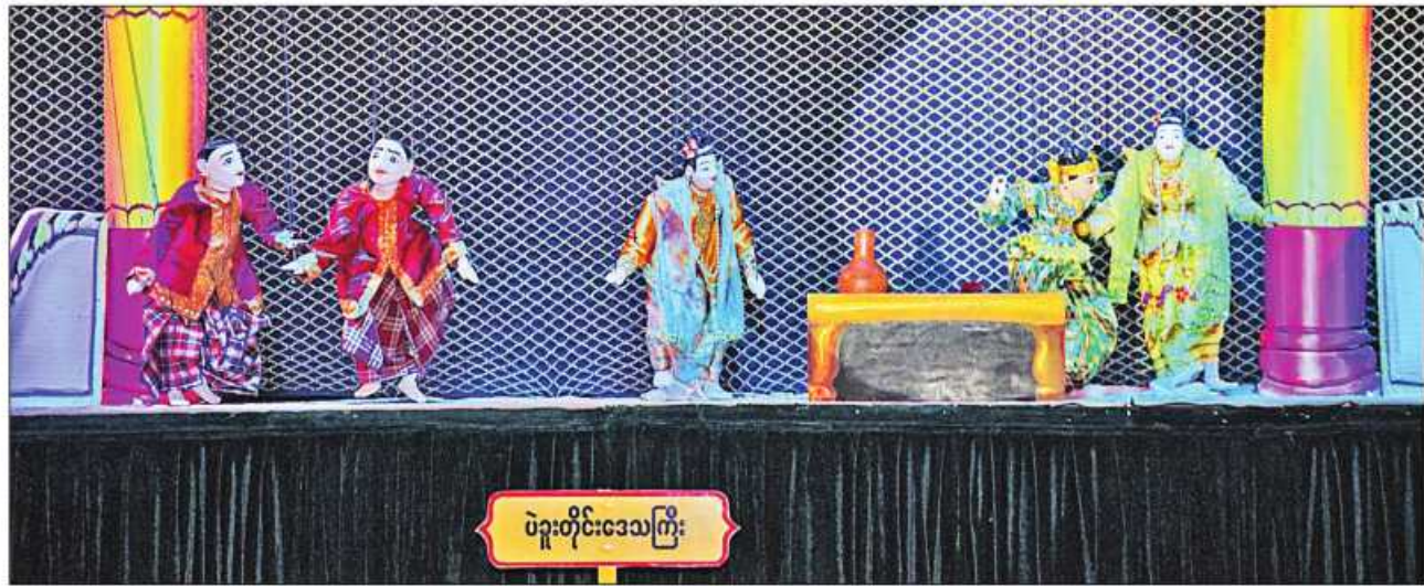
ပဲခူးတိုင်းဒေသကြီး