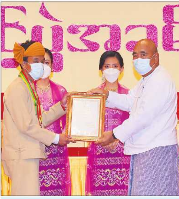
ပြည်ထောင်စုစာရင်းစစ်ချုပ် ဦးတင်ဦး ဆုရရှိသူတစ်ဦးအား ဂုဏ်ပြုဆုတံဆိပ်နှင့် ဂုဏ်ပြုမှတ်တမ်းလွှာပေးအပ်ချီးမြှင့်စဉ်။