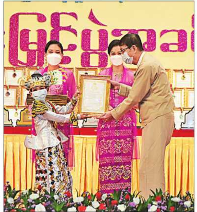
နိုင်ငံတော်စီမံအုပ်ချုပ်ရေးကောင်စီဝင် ဦးစိုင်းလုံးဆိုင် ဆုရရှိသူတစ်ဦးအား ဂုဏ်ပြုဆုတံဆိပ်နှင့် ဂုဏ်ပြုမှတ်တမ်းလွှာပေးအပ်ချီးမြှင့်စဉ်။