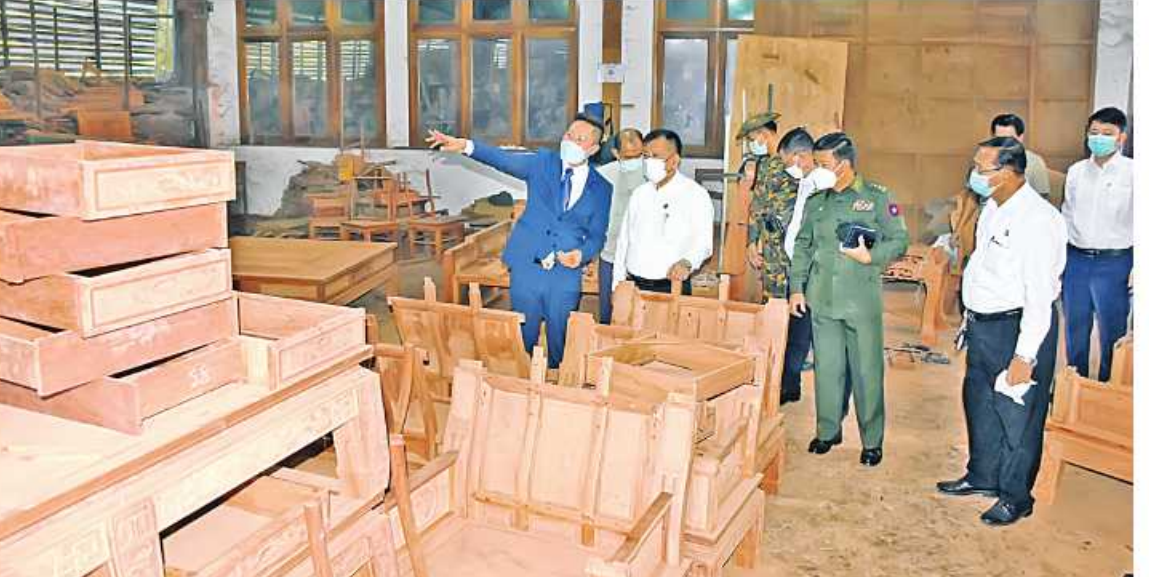
မန္တလေးတိုင်းဒေသကြီးဝန်ကြီးချုပ် ဦးမောင်ကို မန္တလေးစက်မှုဇုန်(၁)ရှိ မြစ်ဝါသစ်အချောထည်စက်ရုံ၏ ကုန်ထုတ်လုပ်မှု အခြေအနေများကို လှည့်လည်ကြည့်ရှုစဉ်။

တိုးတက်စေရန်အတွက် မန္တလေးတိုင်းဒေသကြီးအတွင်း၌ ဖွင့်လှစ်သင်ကြားပေးနေသော သက်မွေးဝမ်းကျောင်းများတွင် သက်ဆိုင်သည့် သင်တန်းများကို တက်ရောက်နိုင်ရေး အလုပ်ရှင်နှင့် ဝန်ထမ်းများ ပေါင်းစပ်ဆောင်ရွက်ရန်လိုကြောင်းသို့မှသာ အရည်အချင်းပြည့်မီသည့် ကျွမ်းကျင်လုပ်သားများ ဖြစ်လာမည်ဖြစ်ကြောင်း ပြောကြားပြီး ရင်းရင်းနှီးနှီးနှုတ်ဆက်သည်။ အဆိုပါ မြစ်ဝါသစ်အချောထည်စက်ရုံကို ၁၉၉၉ ခုနှစ်ကစတင်ခဲ့ပြီး ထုတ်လုပ်မှု အနေဖြင့် ပါကေး၊ ပရိဘောဂပစ္စည်း၊ တံခါး၊ ဆက်တီမျိုးစုံတို့ကို ထုတ်လုပ်လျက်ရှိပြီး ပြည်တွင်းပြည်ပနိုင်ငံများသို့ တင်ပို့လျက်ရှိသည်။ ဆက်လက်၍ တိုင်းဒေသကြီးဝန်ကြီးချုပ်နှင့်အဖွဲ့သည် ပုသိမ်မြို့နယ် ဘုံတက်ကုန်းကျေးရွာအုပ်စု သန့်စင်ကုန်းကျေးရွာရှိ ၂၀၂၀ ပြည့်နှစ်က စတင်ဖွင့်လှစ်ခဲ့သည့် မန္တလေးမြို့တော်စည်ပင်သာယာရေးကော်