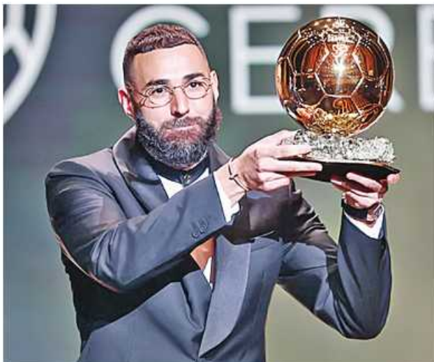
ပဲရစ် အောက်တိုဘာ ၁၈ က ဆွတ်ခူးခဲ့ကြောင်း ဒေးလီး ၂၀၂၂ ကမ္ဘာ့အကောင်းဆုံး မေးလ်သတင်းဌာနက ယနေ့တွင် ကစားသမားဆုဖြစ်သည့် Ballon d'Or ဆုကို ပြင်သစ်အသင်းနှင့် ရီးရဲလ်မက်ဒရစ်အသင်းမှ ဘင်ဇီးမား ၂၀၂၁-၂၀၂၂ ဘောလုံးရာသီက

ရီးရဲလ်မက်ဒရစ်အသင်းနှင့် အတူ အမှတ်အဖြစ် ပထမဆုံးအကြိမ်ပေး အကောင်းဆုံး ခြေစွမ်းပြကစားနိုင် ခဲ့ပြီး ရီးရဲလ်မက်ဒရစ်အသင်းကို ဆုံးတိုက်စစ်ကစားသမားဆု The Gerd Muller ဆုကို ဘာစီလိုနာ ဆုလေး၊ ဥရောပစူပါဖလား၊ ကမ္ဘာ့ချန်ပီယံ ကလပ်ဖလားတို့ ဆွတ်ခူးနိုင်ခဲ့ရာတွင် အဓိကနေရာမှ ခြေစွမ်းပြကစားနိုင်ခဲ့ပြီး ပြိုင်ပွဲစုံ၌ စုစုပေါင်းသွင်းဂိုး ၄၄ ဂိုး သွင်းယူ နိုင်ခဲ့သည့်အတွက် ကမ္ဘာ့အကောင်း ဆုံးကစားသမား Ballon d'Or အကြိမ် ပေးအပ်ချီးမြှင့်သည့် Socrates Awardကို ဘိုင်ယန် မြူးနစ်အသင်းတိုက်စစ်ကစားသမား မာနေ၊ကမ္ဘာ့တစ်နှစ်တာအကောင်း ဆုံးကလပ်အသင်းဆုကို မန်စီးစီး အသင်းကလည်းကောင်း အသီးသီး ဆွတ်ခူးနိုင်ခဲ့ကြကြောင်း သိရသည်။ ထို့ပြင် အခြားဆုများဖြစ်သည့် ကမ္ဘာ့အကောင်းဆုံးသမားဆုဖြစ် သည့် Yachine Trophy ဆုကို ရီးရဲလ်မက်ဒရစ်အသင်းမှ ဂိုးသမား ကော့တိုက်၊ ဂက်စ်မူလာအထိမ်း