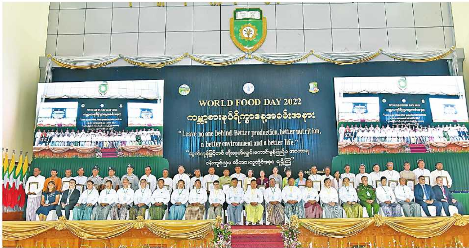
နိုင်ငံတော်စီမံအုပ်ချုပ်ရေးကောင်စီဒုတိယဥက္ကဋ္ဌ ဒုတိယဝန်ကြီးချုပ် ဒုတိယဗိုလ်ချုပ်မှူးကြီးစိုးဝင်း အစမ်းအမှားတက်ရောက်လာကြသူများနှင့်အတူ မှတ်တမ်းတင် ဓာတ်ပုံရိုက်ခင်း