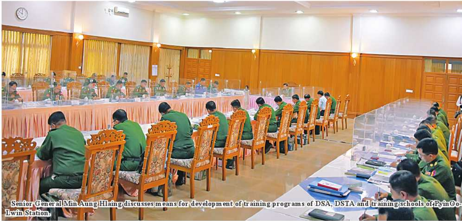
Senior General Min Aung Hlaing discusses means for development of training programs of DSA, DSTA and training schools of PyinOoLwin Station.