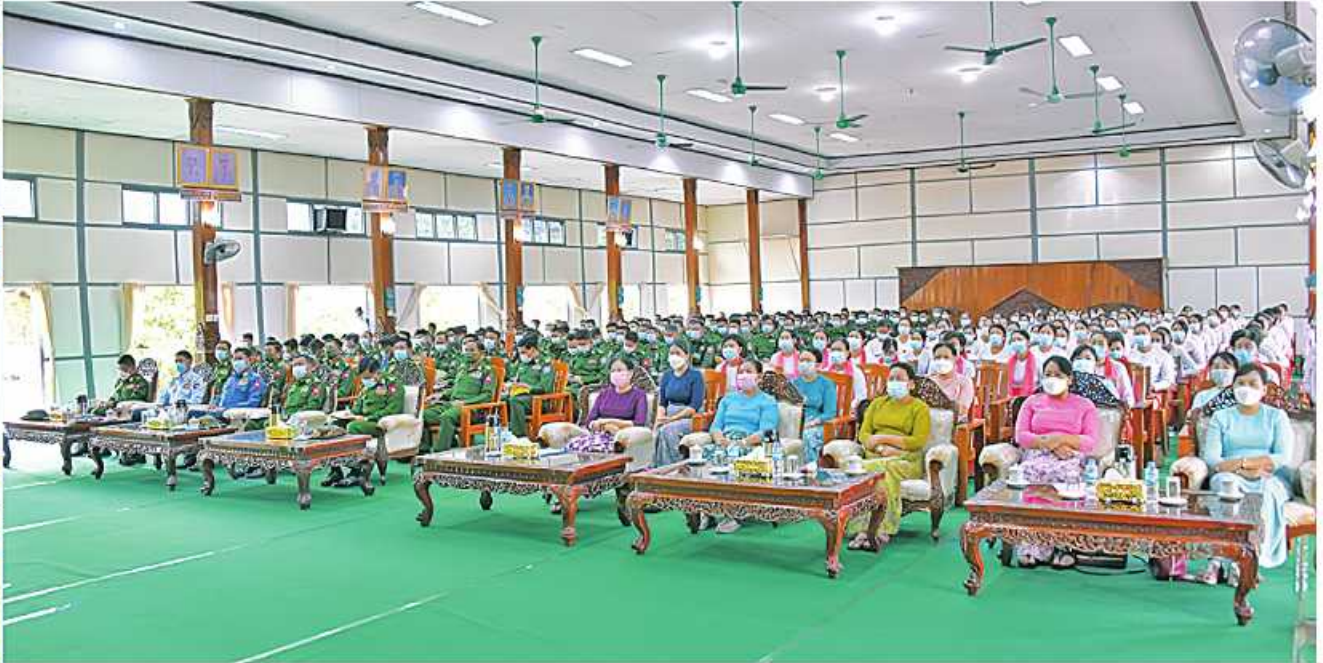
နိုင်ငံတော်စီမံအုပ်ချုပ်ရေးကောင်စီဥက္ကဋ္ဌ တပ်မတော်ကာကွယ်ရေးဦးစီးချုပ် ဗိုလ်ချုပ်မှူးကြီးမင်းအောင်လှိုင် အရှေ့တောင်တိုင်းစစ်ဌာနချုပ် မော်လမြိုင်တပ်နယ်မှ အရာရှိ၊ စစ်သည်၊ မိသားစုများကို တွေ့ဆုံအမှာစကားပြောကြားစဉ်။

နေပြည်တော် အောက်တိုဘာ ၁၆ မည်သည့်အလုပ်ကို လုပ်ကိုင်သည်ဖြစ်စေ ခွန်အားစိုက်ထုတ်ဆောင်ရွက်ပါက အောင်မြင်မှုကို ရရှိမည်ဖြစ်သဖြင့် အားပြည့်အင်ပြည့်ဖြင့် အားထည့်ဆောင်ရွက်တတ်သည့် အလေ့အကျင့်ကို မွေးမြူဆောင်ရွက်ကြရန်လိုကြောင်း၊ တစ်ဦးချင်း အားထည့်ဆောင်ရွက်ခြင်းနှင့် စုစည်းညီညွတ်သည့် အားဖြင့် ဆောင်ရွက်ခြင်းသည် တပ်တွင်းစည်းလုံးညီညွတ်မှုကို ပိုမိုအောင်မြင်စေမည်ဖြစ်ကြောင်းနှင့် နိုင်ငံတော်ကာကွယ်ရေးတာဝန်များကို ထမ်းဆောင်ရာတွင်လည်း စုစည်းညီညွတ်သည့်အားကို ရရှိစေမည်ဖြစ်ကြောင်းဖြင့် နိုင်ငံတော်စီမံအုပ်ချုပ်ရေးကောင်စီဥက္ကဋ္ဌ တပ်မတော်ကာကွယ်ရေးဦးစီးချုပ် ဗိုလ်ချုပ်မှူးကြီးမင်းအောင်လှိုင်က ယနေ့မုန်းလွဲပိုင်းတွင် အရှေ့တောင်တိုင်းစစ်ဌာနချုပ် မော်လမြိုင်တပ်နယ်မှ အရာရှိ၊ စစ်သည်၊ မိသားစုများကို တွေ့ဆုံအမှာစကားပြောကြားစဉ် ထည့်သွင်းပြောကြားသည်။ အဆိုပါတွေ့ဆုံပွဲသို့ နိုင်ငံတော်စီမံအုပ်ချုပ်ရေးကောင်စီဥက္ကဋ္ဌ တပ်မတော်ကာကွယ်ရေးဦးစီးချုပ်နှင့်အတူ ဇနီး ဒေါ်ကြူကြူလှ၊ ညှိနှိုင်းကွပ်ကဲရေးမှူးကြီး၊ ဇေ၊ လေ) ဗိုလ်ချုပ်ကြီးမောင်မောင်အေးနှင့် ဇနီး၊ ကာကွယ်ရေးဦးစီးချုပ်(ဇေ) ဗိုလ်ချုပ်ကြီးမိုးအောင်နှင့်ဇနီး၊ စာမျက်နှာ ၁၆ ကော်လံ ၁ B