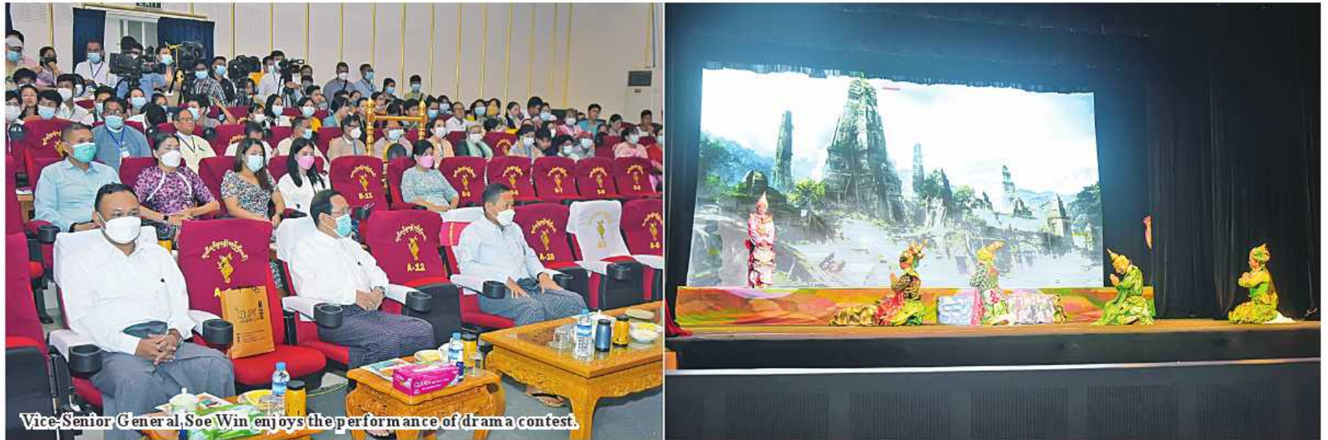
Vice-Senior General Soe Win enjoys the performance of drama contest.

Nay Pyi Taw October 16 Deputy Prime Minister Vice-Senior General Soe Win watched the Ramayana play contest at the audition hall of the Ministry of Religious Affairs and Culture in Nay Pyi Taw today. The Vice-Senior General, together with Union Minister for Religious Affairs and Culture U Ko Ko, the Nay Pyi Taw Command commander, deputy ministers and officials and judges of the contest, enjoyed the amateur level (first class) of the Ramayana drama contest in which the Ramayana drama troupe representing Mandalay Region contested with a combination of singing, crying and talking acting, dances and other artistic skills. The amateur level (first class) of the Ramayana drama contest had been held since 12 October with the participating troupes from Yangon, Magway, Ayeyawady, Bago and Mandalay regions. 100