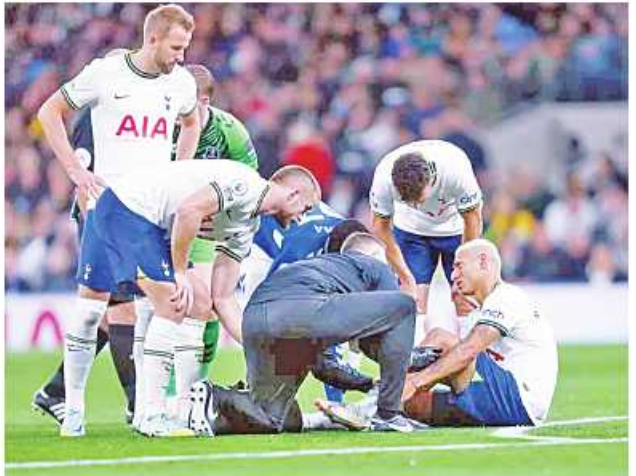
တစ်လခန့် အနားယူရမည်ဖြစ်၍ နိုင်သည်ဟု သတင်းများထွက်ပေါ် တရားဦးအသင်းနှင့် ကစားရမည့် ကမ္ဘာ့ဖလားပွဲစဉ်များကိုပါ လွဲချော် လျက်ရှိကြောင်း သိရသည်။ ML

ကွန်တီလက်အောက်တွင် ပုံစံ ကောင်းရရှိနေသော်လည်း အဲဗာတန် အသင်းကို နှစ်ဂိုး ဂိုးမရှိဖြင့် အနိုင် ရရှိခဲ့သည့်ပွဲစဉ်တွင် ခြေသလုံး ကြွက်သား ဒဏ်ရာရရှိခဲ့သော ကြောင့် လာမည့် အောက်တိုဘာ ၂၀ ရက်တွင် ကစားရမည့် မန်ယူ အသင်းနှင့်ပွဲစဉ်ကို လွဲချော်မည်ဖြစ် ကြောင်း နည်းပြကွန်တီက အတည် ပြုပြောကြားခဲ့သည်။ လက်ရှိတွင် ၎င်း၏ဒဏ်ရာကို လိုအပ်သည့် စစ်ဆေးမှုများပြုလုပ် နေသဖြင့် တိကျသည့် ရလဒ်ထွက် ပေါ်လာခြင်း မရှိသေးသော်လည်း ဆေးအဖွဲ့၏ ခန့်မှန်းချက်အရ ဒဏ်ရာ ပြန်လည်သက်သာရန်