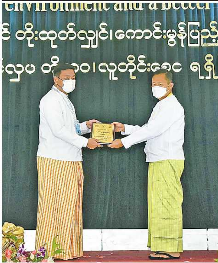
နိုင်ငံတော်စီမံအုပ်ချုပ်ရေးကောင်စီဒုတိယဥက္ကဋ္ဌ ဒုတိယဝန်ကြီးချုပ် ဒုတိယ ဝန်ကြီးချုပ်များကြီးစိုးဝင်း ထူးချွန်ဆုရရှိသူတစ်ဦးကို ဆုပေးအပ်ချီးမြှင့်စဉ်။

စာမျက်နှာ ၂၀ မှအဆက် တစ်ကိုယ်ရည်သန်ရွှင်းရေး၊ ပတ်ဝန်းကျင် ညစ်ညမ်းမှုကာကွယ်ရေးတို့ကို ဌာန၊ အဖွဲ့အစည်းများနှင့် ပူးပေါင်းဆောင်ရွက် စေခြင်း၊ တစ်နိုင်တစ်ပိုင် အိမ်တွင်းမှု ကုန်ထုတ်လုပ်ငန်းများကို နည်းပညာ၊ အရင်းအနှီး၊ ဈေးကွက်ရရှိစေရေး လူမှုအဖွဲ့အစည်းများနှင့် ညှိနှိုင်းပေးခြင်း လုပ်ငန်းများဆောင်ရွက်ပေးလျက်ရှိကြောင်း။ ထို့ပြင် ကိုဗစ်-၁၉ ကပ်ရောဂါကြောင့် ထိခိုက်ခဲ့ရသည့် စီးပွားရေးဖွံ့ဖြိုးမှုကို ပြန်လည်မြှင့်တင်နိုင်ရန်၊ ငွေကြေးမတည် ငြိမ်မှုကြောင့် ရိုက်ခတ်လျက်ရှိသည့် အကျိုးဆက်များမှ ကာကွယ်နိုင်ရန်၊ ကုန်ဈေးနှုန်း တည်ငြိမ်ရေးအတွက် ဈေးကွက်လိုအပ်ချက်နှင့် ပြည်တွင်း ထုတ်လုပ်မှုဟန်ချက်ညီစေရန် ပြည်နယ် များနှင့် အခြားဖွံ့ဖြိုးမှု နောက်ကျနေသေး သောဒေသများဖွံ့ဖြိုးအောင် ဆောင်ရွက် ပေးခြင်းဖြင့် မြို့ပြနှင့် ကျေးလက်ကွာဟမှုကို လျှော့ချပေးနိုင်ရေးအတွက် နိုင်ငံစီးပွား မြှင့်တင်ရေးရန်ပုံငွေအဖြစ် ငွေကွပ်ဘီလီယံ ၄၀၀ ထူထောင်ပြီး အကျိုးတူလယ်ယာ စနစ်ကို တိုင်းဒေသကြီးများနှင့် မြစ်မီးရောင် စိုက်ပျိုး၊ မွေးမြူရေး စီမံကိန်းများကို ပြည်နယ်များနှင့် ကိုယ်ပိုင်အုပ်ချုပ်ခွင့်ရ