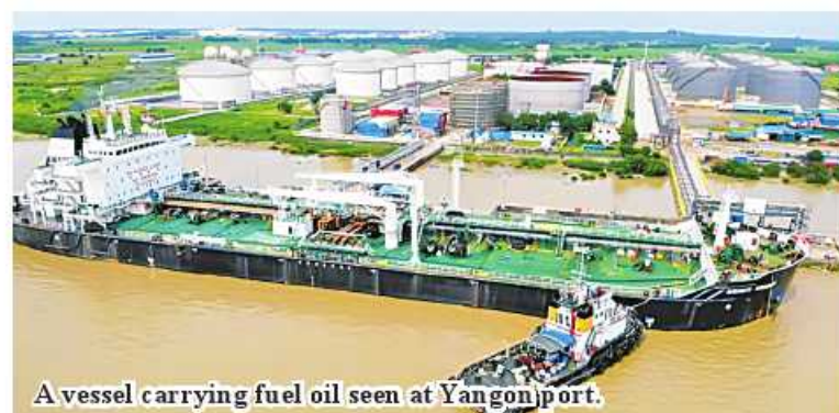
A vessel carrying fuel oil seen at Yangon port.