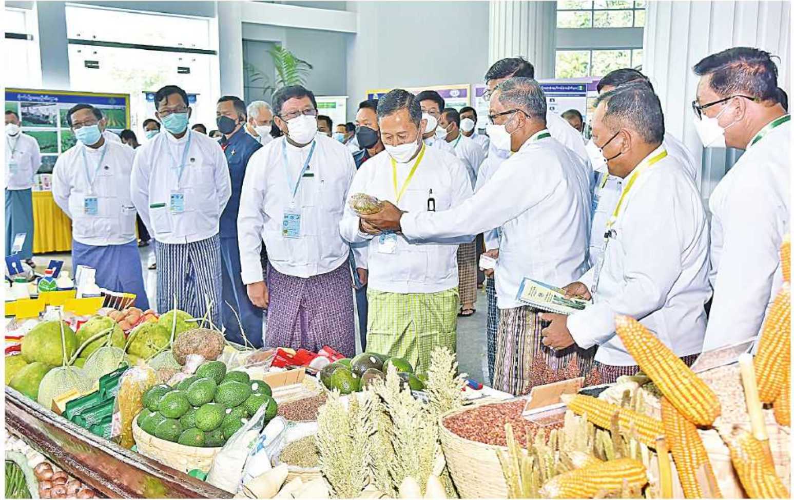
နိုင်ငံတော်စီမံအုပ်ချုပ်ရေးကောင်စီဒုတိယဥက္ကဋ္ဌ ဒုတိယဝန်ကြီးချုပ် ဒုတိယဝန်ကြီးချုပ်များကြီးစိုးဝင်းက စင်းကျင်းပြသထားမှုများကို လှည့်လည်ကြည့်ရှုစဉ်။

ဆောင်းပါးပြိုင်ပွဲတွင် ဆုရရှိသူများကို ဆုများပေးအပ်မည့် အခြေအနေများကို ရှင်းလင်းတင်ပြသည်။ ယင်းနောက် ကုလသမဂ္ဂ စားနပ်ရိက္ခာ နှင့်စိုက်ပျိုးရေးအဖွဲ့ညွှန်ကြားရေးမှူးချုပ် ၏ World Food Day 2022 Video Message နှင့် ကမ္ဘာ့စားနပ်ရိက္ခာနေ့ အထိမ်းအမှတ် မှတ်တမ်း Video Clip ကို ပြသသည်။ ထို့နောက် နိုင်ငံတော်စီမံအုပ်ချုပ်ရေး ကောင်စီ ဒုတိယဥက္ကဋ္ဌ ဒုတိယဝန်ကြီးချုပ် ဒုတိယဝန်ကြီးချုပ်များကြီးစိုးဝင်း၊ ပြည်ထောင်စု ဝန်ကြီးများဖြစ်ကြသည့် ဦးတင်ထွဋ်ဦး၊ ဦးလှစိုးနှင့် ဦးခင်မောင်ရီတို့က ကမ္ဘာ့ စားနပ်ရိက္ခာနေ့အထိမ်းအမှတ် စိုက်ပျိုးရေး၊ မွေးမြူရေးနှင့် သစ်တောကဏ္ဍဆိုင်ရာ ထူးချွန်ဆုရရှိသူများကို ဆုများပေးအပ် ချီးမြှင့်ကြပြီး တက်ရောက်လာကြသူများ နှင့်အတူ မှတ်တမ်းတင်ဓာတ်ပုံရိုက်ကြသည်။ ယင်းနောက် နိုင်ငံတော်စီမံအုပ်ချုပ်ရေး ကောင်စီ ဒုတိယဥက္ကဋ္ဌ ဒုတိယဝန်ကြီးချုပ် သည် အဖွဲ့ဝင်များနှင့်အတူ မြန်မာနိုင်ငံ စားနပ်ရိက္ခာဖူလုံရေးဆိုင်ရာမှတ်တမ်းနှင့် ပိုစတာများကို ကြည့်ရှုခဲ့ကြကြောင်း သိရသည်။