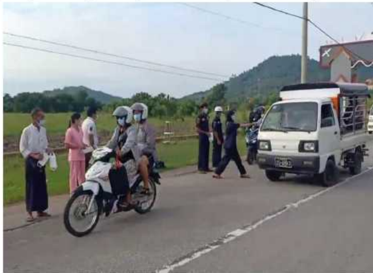
တနင်္သာရီတိုင်းဒေသကြီး မြိတ်မြို့၌ တာဝန်ရှိသူများက ဒေသခံပြည်သူများလက်ဝယ် အရောက် Mask များကို အခမဲ့ပေးဝေလှူဒါန်းစဉ်။

ထို့ပြင် ကိုဗစ်-၁၉ ရောဂါ ထိန်းချုပ် ကာကွယ်ရာတွင် အထောက်အကူဖြစ်စေ ရန်အတွက် Mask များကို ပြည်သူများ လက်ဝယ်အရောက် တိုင်းစစ်ဌာနချုပ် အသီးသီးမှ တာဝန်ရှိသူများက အခမဲ့ ပေးဝေလှူဒါန်းလျက်ရှိရာ ယနေ့တွင်