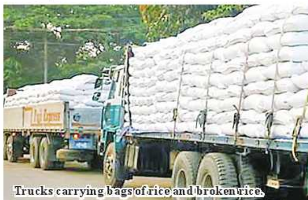
Trucks carrying bags of rice and broken rice.

Nay Pyi Taw October 16 More than 900,000 tons of rice and broken rice were exported, earning over US$310 million from April 1 to the end of September 2022 in 2022-2023 FY, according to reports from the Ministry of Commerce. Myanmar has been exporting and selling rice and broken rice to foreign markets on a weekly and monthly basis. In this way, 517,573.900 tons of rice worth US$189.783 million and 387,201.200 tons of broken rice worth US$126.209 million were exported. During the six-month period, the rice that was exported and sold to 38 countries in the foreign customer market included parboiled rice, rice and broken rice. In the last week of September, the arrival of rice from all areas to the Bayintnaung commodity market was only about 50,000 bags of rice per day, but since the first week of October, the arrival of rice is increased to 100,000 bags per day. The prices of rice and broken rice may change depending on the fluctuation of foreign exchange rates. 336