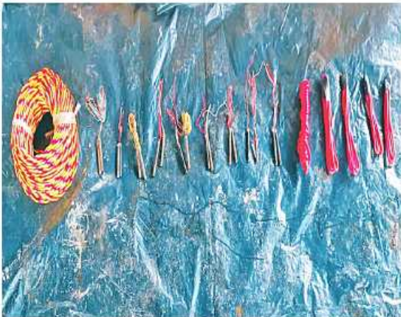
သိမ်းဆည်းရစ် ကရင်ပြည်နယ် ဖာပွန်မြို့နှင့် ကမမောင်းမြို့သွားကားလမ်းတစ်လျှောက် NUG နှင့် PDF အမည်ခံ အကြမ်းဖက် သမားများထောင်ထားသည့် ငါးဂါလန်ပုံးဖြင့်ပြုလုပ်ထားသည့် ဒေသန္တရလက်လုပ်ဆွဲမိုင်းများ၊ စနက်တံများနှင့်ဆက်စပ်ပစ္စည်း များကိုတွေ့ရစဉ်။

နေပြည်တော် အောက်တိုဘာ ၁၆ - လျက်ရှိသည့် ပြည်သူ့လူထုများနှင့် ထိခိုက်ဒဏ်ရာရရှိစေရန်နှင့် လမ်းပန်း NUGနှင့်PDFအမည်ခံအကြမ်းဖက် တရားဥပဒေစိုးမိုးရေးအတွက် ဆောင်ရွက် ဆက်သွယ်မှုများ လုံခြုံရေးမေ့မိမှုမရှိစေရေး ရည်ရွယ်ချက်များဖြင့် အများပြည်သူ