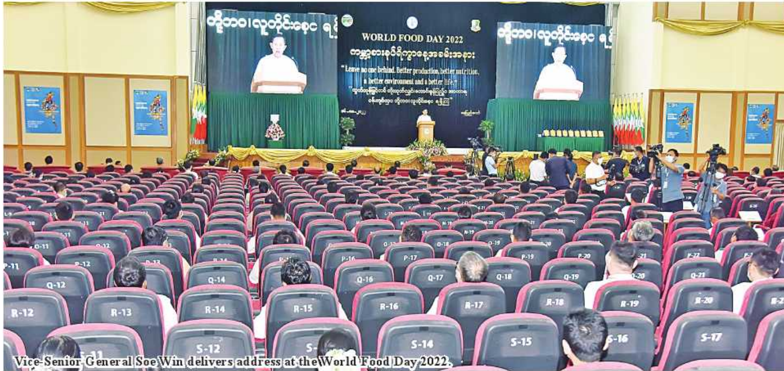
Vice-Senior General Soe Win delivers address at the World Food Day 2022.

Nay Pyi Taw October 16 The World Food Day 2022 was marked yesterday morning in the Convocation Hall of Yezin University of Agriculture, with an address by State Administration Council Vice Chairman Deputy Prime Minister Vice-Senior General Soe Win.