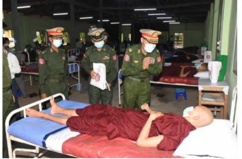
သံဃာတော်များနှင့် လူပုဂ္ဂိုလ်များ၏ ဒါနဥပပါရမီ စုပေါင်းသွေးလှူဒါန်းနေမှုကို အနောက်တောင်တိုင်းစစ်ဌာနချုပ် ဒုတိယတိုင်းမှူး ဗိုလ်မှူးချုပ်အောင်ခင်ဇော် ကြည့်ရှု အားပေးစဉ်။