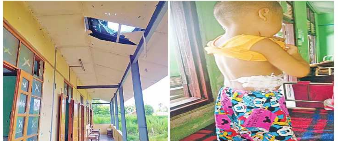
PDF အမည်ခံအကြမ်းဖက်သမားများက Drone ယာဉ် အသုံးပြု၍ လက်လုပ်ပုံးများ ရမ်းသန်းဖြုတ်ချတိုက်ခိုက်ခဲ့ခြင်း ကြောင့် ပခုက္ကူမြို့နယ် ဘုန်းကံကျေးရွာ အလယ်တန်းကျောင်း စာသင်ဆောင်မျက်နှာကြက်နှင့် သွပ်မိုးများပေါက်ပြဲပျက်စီး နေမှုနှင့် အသက် လေးနှစ်အရွယ် ကလေးငယ်တစ်ဦး ထိခိုက်ဒဏ်ရာရရှိမှုကိုတွေ့ရစဉ်။

နေပြည်တော် အောက်တိုဘာ ၁၆ - မကွေးတိုင်းဒေသကြီး ပခုက္ကူမြို့နယ် ဘုန်းကံကျေးရွာအတွင်းသို့ ယနေ့ နံနက်ပိုင်းတွင် PDF အမည်ခံ အကြမ်းဖက် သမားများက Drone ယာဉ်အသုံးပြု၍ လက်လုပ်ပုံးများ ရမ်းသန်းဖြုတ်ချ တိုက်ခိုက်ခဲ့ခြင်းကြောင့် အမြစ်ပဲ့ပြည်သူ အသက် လေးနှစ်အရွယ် ကလေးငယ် တစ်ဦး ထိခိုက်ဒဏ်ရာရရှိခဲ့ကြောင်း သိရှိ ရသည်။ ဖြစ်စဉ်မှာ ပခုက္ကူမြို့နယ် ဘုန်းကံ ကျေးရွာအတွင်းသို့ ယနေ့ နံနက် ၉ နာရီ မိနစ် ၃၀ ခန့်တွင် PDF အမည်ခံ အကြမ်း ဖက်သမားများက Drone ယာဉ် တစ်စီး အသုံးပြု၍ လက်လုပ်ပုံး နှစ်လုံးအား ရမ်းသန်းဖြုတ်ချ တိုက်ခိုက်ခဲ့ကြောင်း၊ ထိုသို့တိုက်ခိုက်ခြင်းကြောင့် ဘုန်းကံ ကျေးရွာ အလယ်တန်းကျောင်းအတွင်း ကျရောက်ပေါက်ကွဲခဲ့ပြီး အလျား ပေ ၁၂၀၊ အနံ ပေ ၆၀ရှိ စာသင်ဆောင်၏ မျက်နှာ ကြက်နှင့် သွပ်မိုးများပေါက်ပြဲပျက်စီး ခဲ့ပြီး ကျေးရွာတွင် နေထိုင်လျက်ရှိသော အသက် လေးနှစ်အရွယ် ကလေးငယ် တစ်ဦး ပုံးစထိမှန်ဒဏ်ရာများရရှိခဲ့သည်။ ဒဏ်ရာရ ကလေးငယ်အား ဘုန်းကံ ကျေးရွာ ကျေးလက်ဆေးပေးခန်း၌ လိုအပ် သည့်ဆေးဝါးကုသမှုများ ဆောင်ရွက်ပေး ခဲ့သည်။ ထိုသို့ ကျေးရွာအတွင်း လက်လုပ် ပုံးများ ရမ်းသန်းဖြုတ်ချတိုက်ခိုက်ခဲ့ သော PDF အမည်ခံ အကြမ်းဖက်သမား များကို အမြန်ဆုံးဖမ်းဆီးရမိရေး လုံခြုံရေးတပ်ဖွဲ့ဝင်များက ပိတ်ဆို့စစ်ဆေး ရှာဖွေလျက်ရှိကြောင်း သတင်းရရှိသည်။