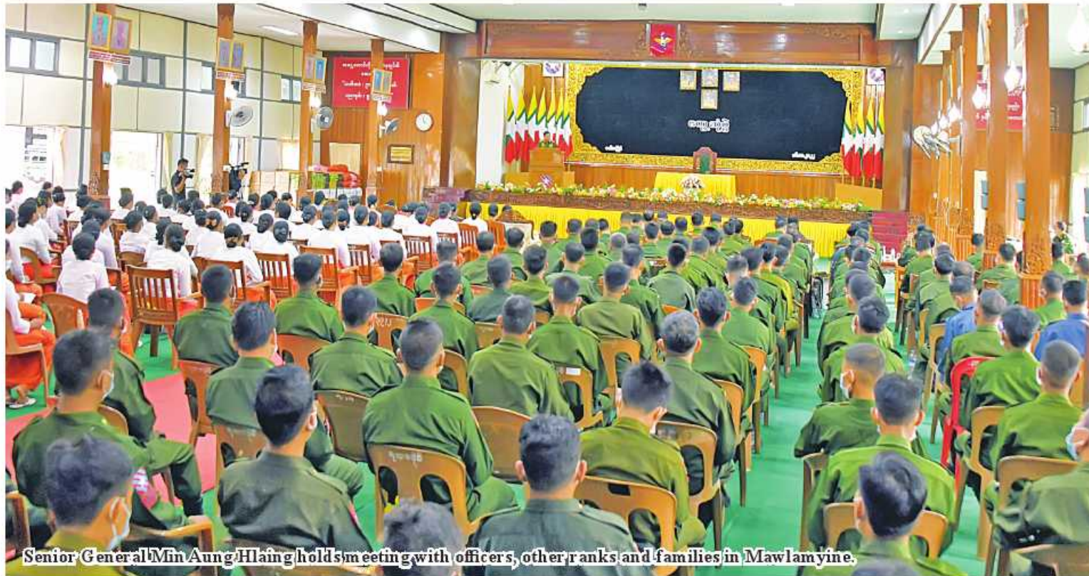
Senior General Min Aung Hlaing holds meeting with officers, other ranks and families in Mawlamyine.