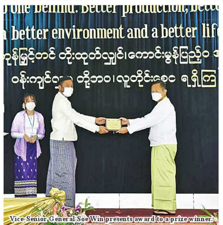
Vice-Senior General Soe Win presents award to a prize winner.