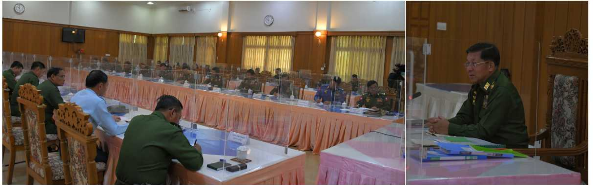
နိုင်ငံတော်စီမံအုပ်ချုပ်ရေးကောင်စီဥက္ကဋ္ဌ တပ်မတော်ကာကွယ်ရေးဦးစီးချုပ် ဝိုင်းချုပ်မှူးကြီးမင်းအောင်လှိုင် ပြင်ဦးလွင်တပ်နယ်ရှိ စစ်တက္ကသိုလ်၊ တပ်မတော်နည်းပညာတက္ကသိုလ်နှင့် လေ့ကျင့်ရေးကျောင်းများ၏ လေ့ကျင့်ရေးဆိုင်ရာညှိနှိုင်းအစည်းအဝေးတွင် လမ်းညွှန်မှာကြားစဉ်။

နေပြည်တော် အောက်တိုဘာ ၁၆ ပြင်ဦးလွင်တပ်နယ်ရှိ စစ်တက္ကသိုလ်၊ တပ်မတော် နည်းပညာတက္ကသိုလ်နှင့် လေ့ကျင့်ရေးကျောင်းများ၏ လေ့ကျင့်ရေးဆိုင်ရာညှိနှိုင်းအစည်းအဝေးကို ယနေ့ မွန်းလွဲပိုင်းတွင် ပြင်ဦးလွင်မြို့ရှိ တပ်မတော်ဧည့်ဂေဟာအစည်းအဝေးခန်းမ၌ ကျင်းပပြုလုပ်ရာ နိုင်ငံတော်စီမံအုပ်ချုပ်ရေးကောင်စီဥက္ကဋ္ဌ တပ်မတော်ကာကွယ်ရေးဦးစီးချုပ် ဝိုင်းချုပ်မှူးကြီးမင်းအောင်လှိုင် တက်ရောက်၍ လိုအပ်သည်များလမ်းညွှန်မှာကြားသည်။