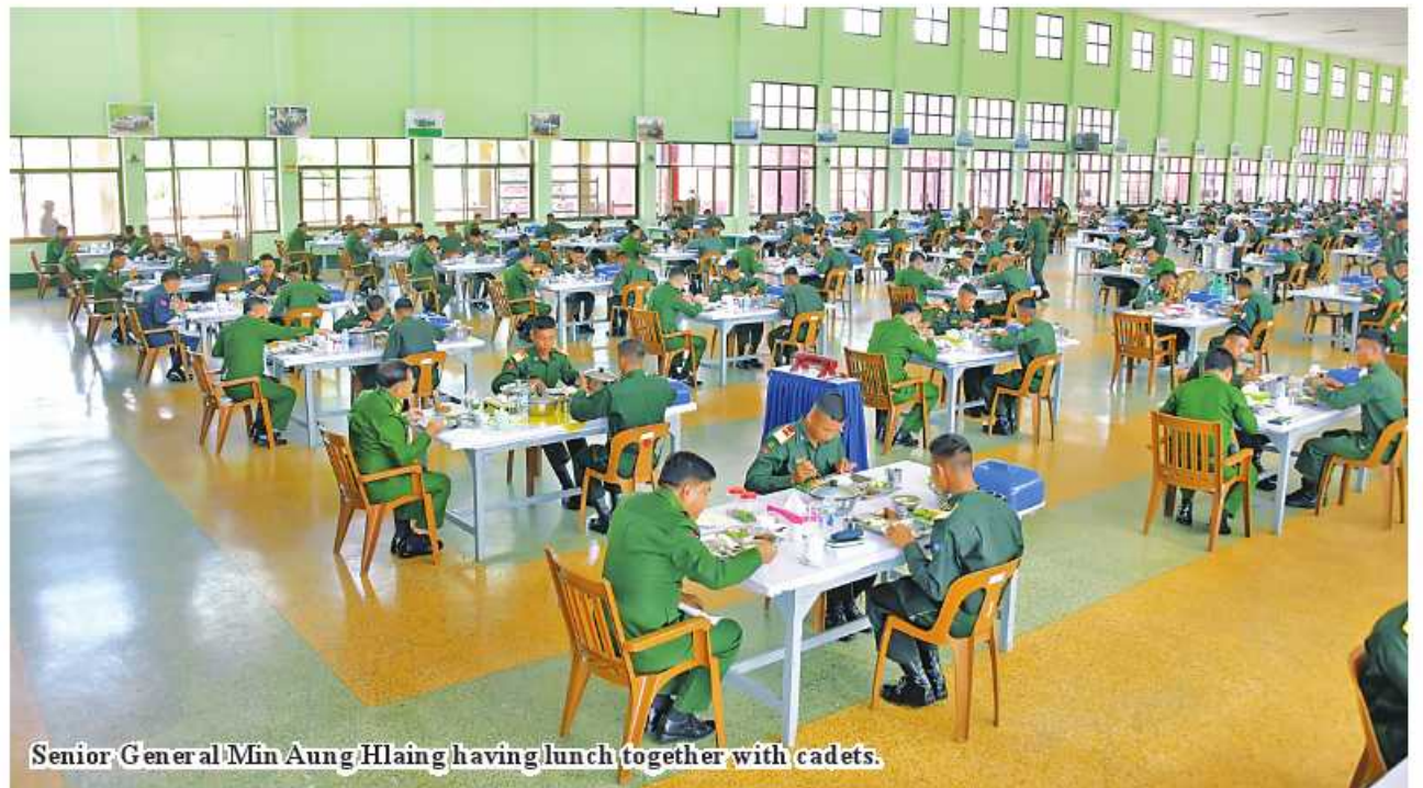
Senior General Min Aung Hlaing having lunch together with cadets.

At the local military hospital in PyinOoLwin, the Senior General cordially comforted the officers, other ranks, members of Myanmar