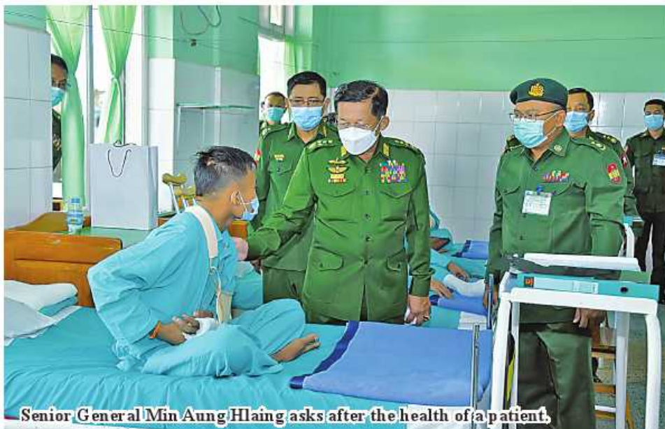
Senior General Min Aung Hlaing asks after the health of a patient.

Police Force and members of people's militia (local) who were injured in discharging duties of stabil-