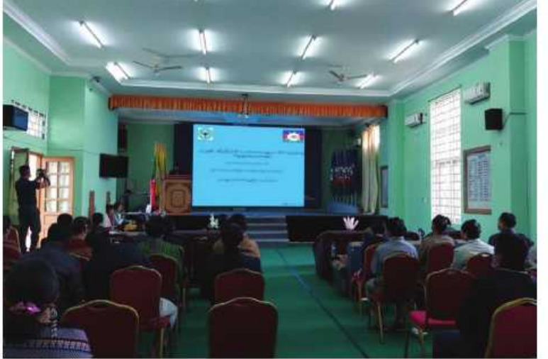
ချင်းပြည်နယ်တွင် ၂၀၂၂ ခုနှစ် အပြည်ပြည်ဆိုင်ရာ သဘာဝဘေးအန္တရာယ် ထိခိုက်ဆုံးရှုံးနိုင်ခြေလျော့ချရေးနေ့ အခမ်းအနားကျင်းပစဉ်။

နေပြည်တော် အောက်တိုဘာ ၁၃ ရှိသူများ တက်ရောက်ကြသည်။ ချင်းပြည်နယ်တွင် ၂၀၂၂ ခုနှစ် ပြည်နယ်ဝန်ကြီးချုပ်က အဖွင့် အပြည်ပြည်ဆိုင်ရာ သဘာဝဘေးအန္တရာယ် အမှာစကားပြောကြားသည်။ ထို့နောက် ထိခိုက်ဆုံးရှုံးနိုင်ခြေ လျော့ချရေးနေ့ ၂၀၂၂ ခုနှစ် အပြည်ပြည်ဆိုင်ရာသဘာဝ ဘေးအန္တရာယ်ထိခိုက်ဆုံးရှုံးနိုင်ခြေလျော့ချ အဖွဲ့ရုံး အစည်းအဝေးခန်းမ၌ ပြုလုပ်ရာ ရေးနေ့အထိမ်းအမှတ် စာစီစာကုံးပြိုင်ပွဲ တွင် ဆုရရှိသူများကို ပြည်နယ်ဝန်ကြီးချုပ်၊ အနောက်မြောက်တိုင်း စစ်ဌာနချုပ် ဒုတိယတိုင်းမှူးနှင့် တာဝန်ရှိသူတို့က ဆုများ အသီးသီးပေးအပ်ချီးမြှင့်ခဲ့ကြ ပြည်နယ်ဝန်ကြီးများ၊ ဌာနဆိုင်ရာတာဝန် ကြောင်း သတင်းရရှိသည်။