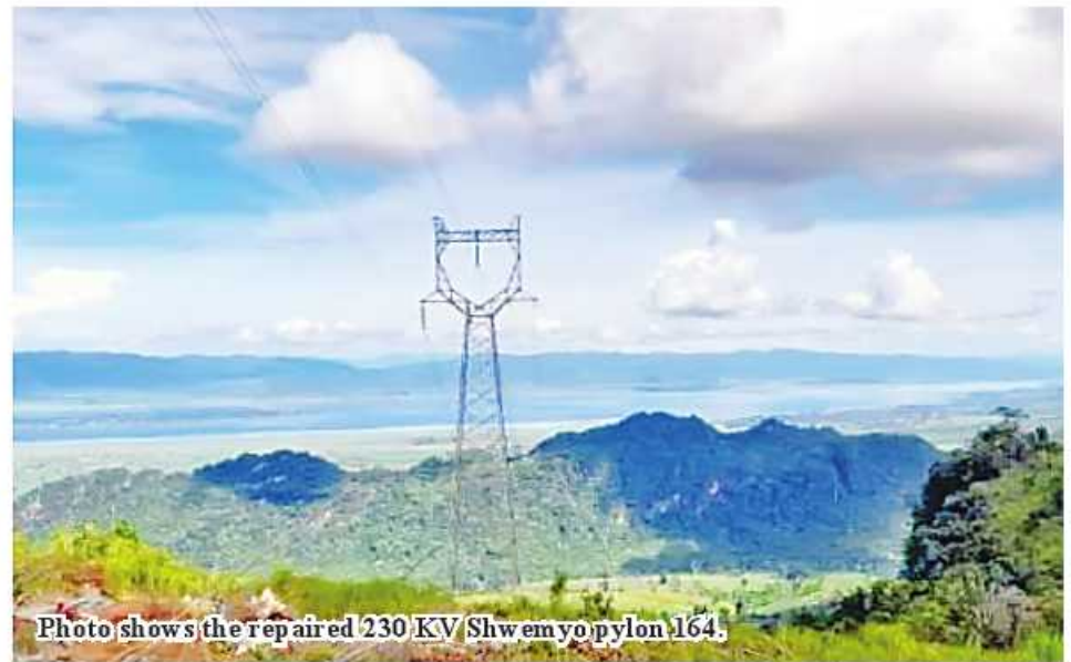
Photo shows the repaired 230 KV Shwemyo pylon 164.