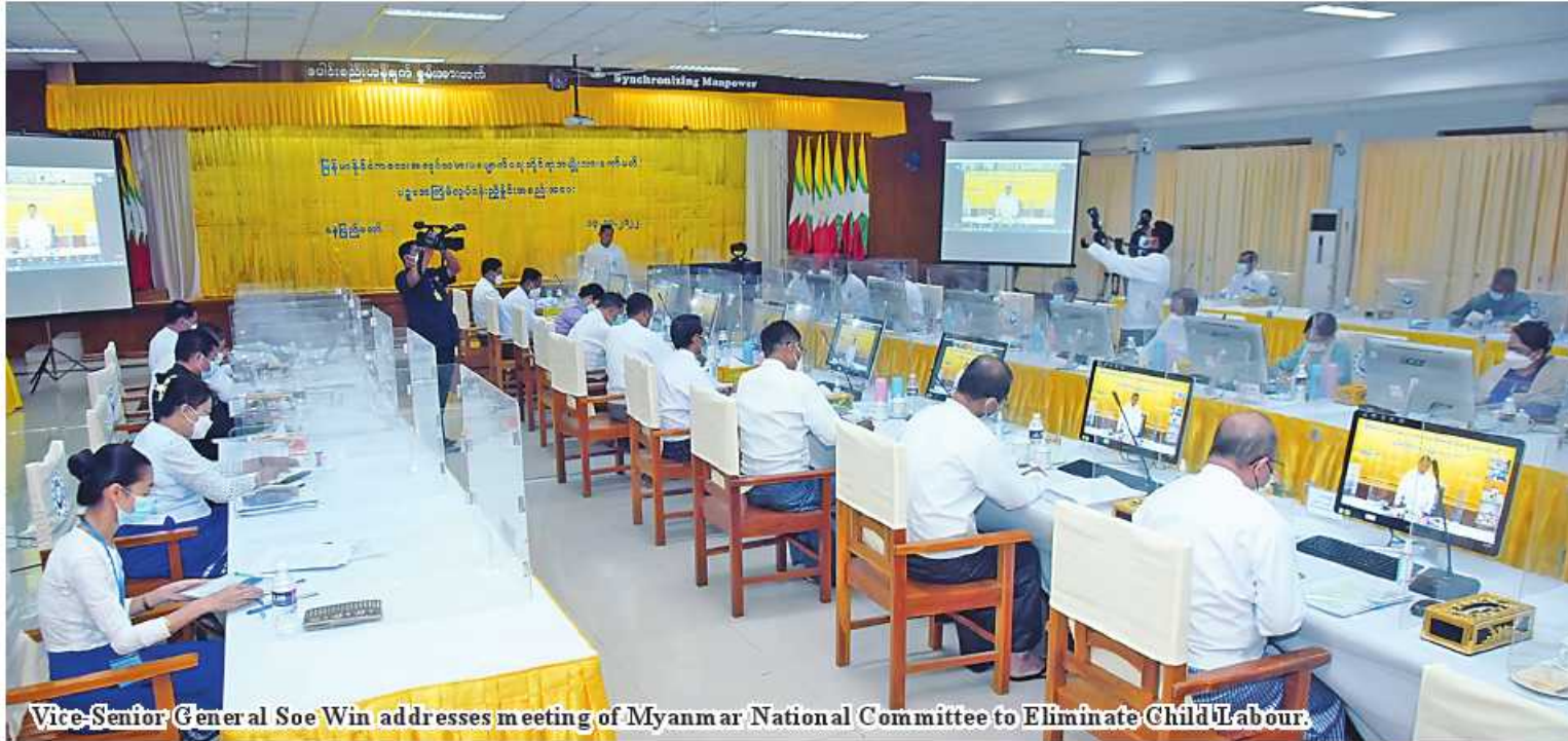
Vice-Senior General Soe Win addresses meeting of Myanmar National Committee to Eliminate Child Labour.

Nay Pyi Taw October 13 Myanmar National Committee to Eliminate Child Labour held fifth work coordination meeting at the Labour Ministry here at 2 pm addressed by Chairman of the committee Vice Chairman of State Administration Council Deputy Prime Minister Vice-Senior General Soe Win.