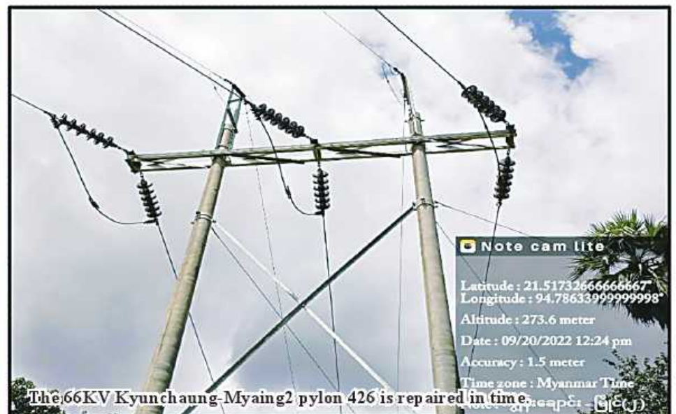
The 66KV Kyunchaung-Myaing2 pylon 426 is repaired in time.

Note cam lite Latitude : 21.5173266666667 Longitude : 94.78633999999998 Altitude : 273.6 meter Date : 09/20/2022 12:24 pm Accuracy : 1.5 meter Time zone : Myanmar Time