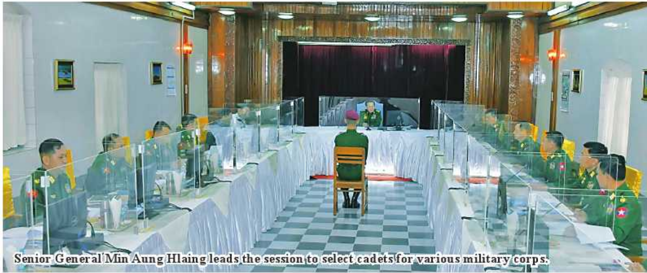
Senior General Min Aung Hlaing leads the session to select cadets for various military corps.

Nay Pyi Taw October 13 Chairman of the State Administration Council Commander-in-Chief of Defence Services Senior General Min Aung Hlaing attended the choice of arms for cadets of the 65th Intake of Defence Services Academy at the DSA in PyinOoLwin.