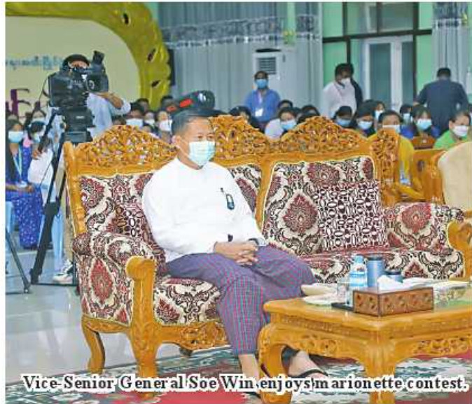
Vice-Senior General Soe Win enjoys marionette contest.