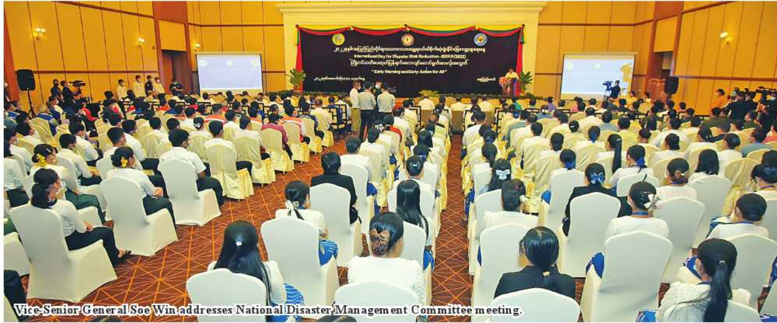
Vice-Senior General Soe Win addresses National Disaster Management Committee meeting.