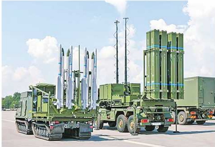
ဂျာမနီနိုင်ငံ Diehl Defence ကုမ္ပဏီမှ ထုတ်လုပ်သော ပထမဆုံး IRIS-T လေကြောင်းရန်ကာကွယ်ရေး ခုံးကျည်