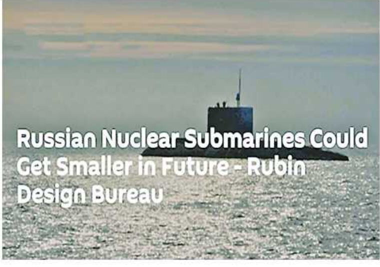
Russian Nuclear Submarines Could Get Smaller in Future - Rubin Design Bureau

ကုမ္ပဏီသည် တစ်နှစ်လျှင် ပရောဂျက် 636 Varshavyanka ချွန်ကလီးယားမဟုတ်သော ရေငုပ်သင်္ဘောနှစ်စီးကိုတည်ဆောက်နိုင်စွမ်းရှိသည်ဟု Sputnik သို့ ပြောကြားခဲ့သည်။ Varshavyanka ဟူသောအမည်သည် ဝါဆောစာချုပ်ကို ရည်ညွှန်းသည်။ ဒီဇယ်လျှပ်စစ်သုံးတိုက်ခိုက်ရေးရေငုပ် သင်္ဘောအမျိုးအစားကို Warsaw Pact နိုင်ငံများသို့ တင်ပို့ရန်အတွက် ကနဦးတီထွင်ထုတ်လုပ်ခဲ့သည်။ ဆိုဗီယက်ယူနီယံပြိုကွဲပြီးနောက် အဖွဲ့ခွဲ၏ဖွံ့ဖြိုးတိုးတက်မှု၏နောက်ဆုံးအဆင့်များကို ဤအတန်းအစားအတွက် အဓိကပို့ကုန်ဖောက်သည်ဖြစ်သည့် တရုတ်နိုင်ငံမှ ငွေကြေးထောက်ပံ့ခဲ့သည်။ Russian Nuclear Submarines Could Get Smaller in Future - Rubin Design Bureau ကို အသိပြန်ဆိုပါသည်။