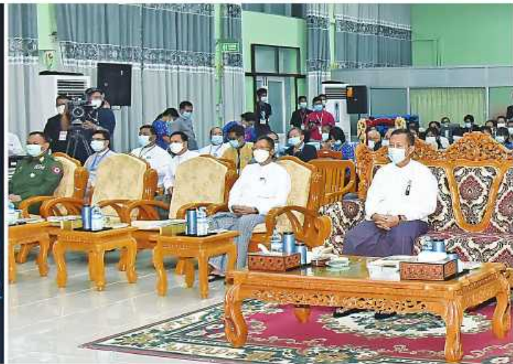
(၂၃)ကြိမ်မြောက် မြန်မာ့ရိုးရာယဉ်ကျေးမှု အဆိုအက၊အရေးအတီးပြိုင်ပွဲ ကျင်းပရေး ဦးစီးကော်မတီနာယက နိုင်ငံတော် စီမံအုပ်ချုပ်ရေးကောင်စီ ဒုတိယဥက္ကဋ္ဌ ဒုတိယဝန်ကြီးချုပ် ဒုတိယဗိုလ်ချုပ်မှူးကြီးစိုးဝင်း ရုပ်စုံသဘင်အဖွဲ့လိုက်ပြိုင်ပွဲ ယှဉ်ပြိုင်မှုကို ကြည့်ရှုအားပေးစဉ်။

နေပြည်တော် အောက်တိုဘာ ၁၃ (၂၃)ကြိမ်မြောက် မြန်မာ့ရိုးရာယဉ်ကျေးမှု အဆိုအက၊အရေးအတီးပြိုင်ပွဲကျင်းပရေး ဦးစီးကော်မတီနာယက နိုင်ငံတော်စီမံအုပ်ချုပ်ရေးကောင်စီ ဒုတိယဥက္ကဋ္ဌ ဒုတိယဝန်ကြီးချုပ် ဒုတိယဗိုလ်ချုပ်မှူးကြီးစိုးဝင်းသည် ယနေ့ညနေပိုင်းတွင် သာသနာရေးနှင့် ယဉ်ကျေးမှုဝန်ကြီးဌာနရှိ ယဉ်ကျေးမှုရတနာခန်းမ၌ကျင်းပသည့် ရုပ်စုံသဘင်အဖွဲ့လိုက်ပြိုင်ပွဲသို့ တက်ရောက်ကြည့်ရှုအားပေးသည်။ အဆိုပါရုပ်စုံသဘင်အဖွဲ့လိုက် ဝါသနာရှင်အဆင့်(ပထမတန်း)ပြိုင်ပွဲတွင် စစ်ကိုင်းတိုင်းဒေသကြီးကိုယ်စားပြု ဇေယျာသီရိ ရုပ်စုံအဖွဲ့က “ငါးပါးအတွဲရာ” ဇာတ်တော်ကြီးကို ကကြီးကတက်စုံလင်စွာဖြင့် သရုပ်ဖော်ယှဉ်ပြိုင်ခဲ့ကြပြီး ပြိုင်ပွဲကျင်းပရေး