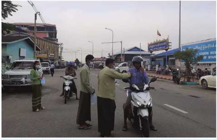
မြိတ်မြို့နယ်၌ တာဝန်ရှိသူများက ဒေသခံပြည်သူများ၏ လက်ဝယ်အရောက် Mask များကို အခမဲ့ပေးဝေလျှော့ဒါန်းစဉ်။

နေပြည်တော် အောက်တိုဘာ ၁၃ ကိုဗစ်-၁၉ ရောဂါ ကာကွယ်၊ ထိန်းချုပ်၊ ကုသရေးဆောင်ရွက်ရာတွင် ကာကွယ် ဆေးထိုးနှံခြင်းသည် အဓိကအခန်းကဏ္ဍ တွင်ပါဝင်သည့် လုပ်ငန်းတစ်ရပ်ဖြစ်သော ကြောင့် တိုင်းဒေသကြီးနှင့် ပြည်နယ် အသီးသီးတို့၌ ကာကွယ်ဆေးထိုးနှံခြင်းကို အင်တိုက်အားတိုက် ဆောင်ရွက်လျက်ရှိရာ ယနေ့တွင် ရန်ကုန်တိုင်းဒေသကြီး တာမွေမြို့နယ်၌ ဒေသခံပြည်သူ ၆၉ ဦး၊ ဧရာဝတီတိုင်းဒေသကြီးအတွင်းရှိ မြို့နယ် ၂၆မြို့နယ်တို့၌ ဒေသခံပြည်သူ ၂၁၆၃ ဦး၊ ရခိုင်ပြည်နယ်နှင့် ချင်းပြည်နယ်အတွင်းရှိ မြို့နယ် သုံးမြို့နယ်တို့၌ ဒေသခံပြည်သူ ၁၁၇၂ ဦး၊ မန္တလေးတိုင်းဒေသကြီးအတွင်းရှိ ခရိုင် ၃ခုစီမှ ဒေသခံပြည်သူ ၃၉၉၇ ဦး တို့ကို တပ်မတော်မှ ဆေးအဖွဲ့များက ပြည်သူဆေးရုံများမှ ဆရာဝန်များ၊ သက်ဆိုင်ရာ ကျန်းမာရေးဝန်ထမ်းများ၊ စေတနာ့ဝန်ထမ်းများနှင့်ပူးပေါင်း၍ ကိုဗစ်-၁၉ ရောဂါ ကာကွယ်ဆေးထိုးနှံပေးခြင်းများ