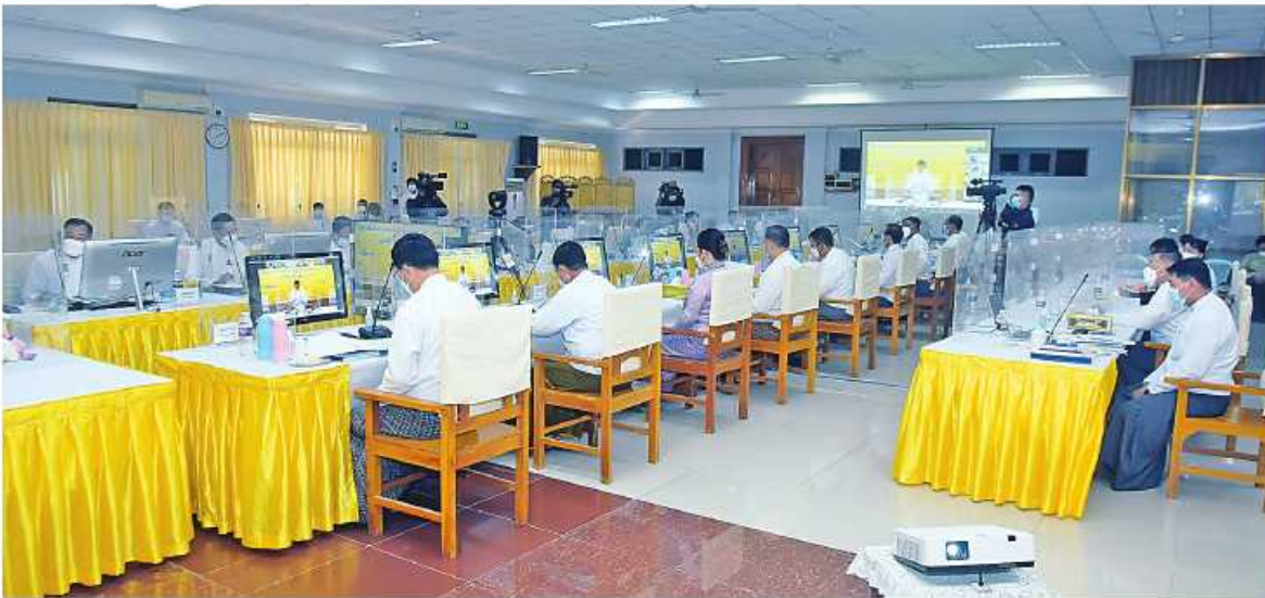
နိုင်ငံတော်စီမံအုပ်ချုပ်ရေးကောင်စီဒုတိယဥက္ကဋ္ဌ ဒုတိယဝန်ကြီးချုပ် ဒုတိယပိုင်ချုပ်မှူးကြီးစိုးဝင်း မြန်မာနိုင်ငံကလေးအလုပ်သမားပျောက်ရေးဆိုင်ရာ အမျိုးသားကော်မတီ ပဋိပက္ခအကြိမ်လုပ်ငန်းညှိနှိုင်းအစည်းအဝေးတွင် အမှာစကားပြောကြားစဉ်။