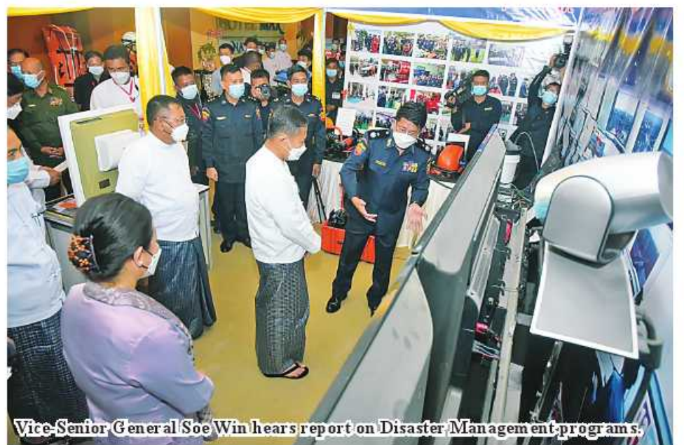
Vice-Senior General Soe Win hears report on Disaster Management programs.