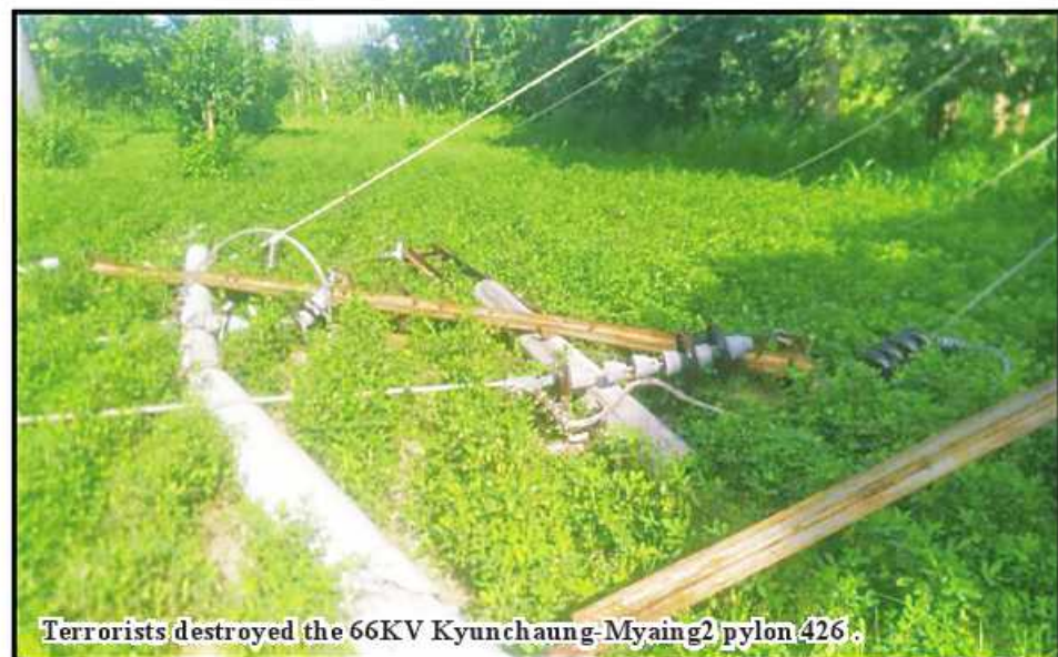
Terrorists destroyed the 66KV Kyunchaung-Myaing2 pylon 426.