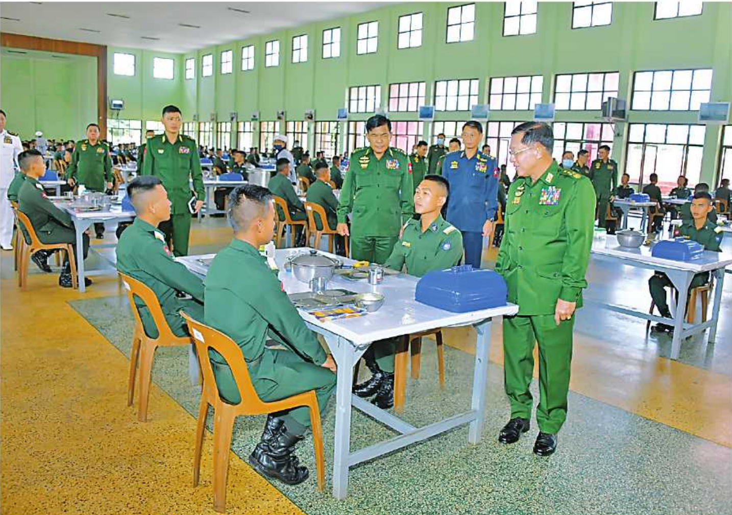
နိုင်ငံတော်စီမံအုပ်ချုပ်ရေးကောင်စီဥက္ကဋ္ဌ တပ်မတော်ကာကွယ်ရေးဦးစီးချုပ် ပိုလ်ချုပ်မှူးကြီးမင်းအောင်လှိုင် သင်တန်းသားပိုလ်လောင်းများကို ရင်းရင်းနှီးနှီး လိုက်လံနှုတ်ဆက်၍ အားပေးစကားပြောကြားစဉ်။

နေပြည်တော် အောက်တိုဘာ ၁၃ နိုင်ငံတော်စီမံအုပ်ချုပ်ရေးကောင်စီ ဥက္ကဋ္ဌ တပ်မတော်ကာကွယ်ရေးဦးစီးချုပ် ပိုလ်ချုပ်မှူးကြီးမင်းအောင်လှိုင်သည် ယနေ့နံနက်ပိုင်းတွင် ပြင်ဦးလွင်မြို့ စစ်တက္ကသိုလ်၌ ပြုလုပ်သည့် စစ်တက္ကသိုလ် ပိုလ်လောင်းသင်တန်း အမှတ်စဉ်(၆၅) စစ်လက်ရုံးရွေးချယ်ပွဲသို့ ဆက်လက်တက်ရောက်စိစစ်ရွေးချယ်သည်။ အဆိုပါစစ်လက်ရုံးရွေးချယ်ပွဲသို့ နိုင်ငံတော်စီမံအုပ်ချုပ်ရေးကောင်စီဥက္ကဋ္ဌ တပ်မတော်ကာကွယ်ရေးဦးစီးချုပ်နှင့်အတူ ညှိနှိုင်းကွပ်ကဲရေးမှူးကြီး(ကြည်း၊ ရေ၊ လေ) ပိုလ်ချုပ်ကြီးမောင်မောင်အေး၊ ကာကွယ်ရေးဦးစီးချုပ်(ရေ) ပိုလ်ချုပ်ကြီးမိုးအောင်၊ ကာကွယ်ရေးဦးစီးချုပ်(လေ) ပိုလ်ချုပ်ကြီးထွန်းအောင်၊ ကာကွယ်ရေးဦးစီးချုပ်မှူး တပ်မတော်အရာရှိကြီးများ၊ အလယ်ပိုင်းတိုင်းစစ်ဌာနချုပ် တိုင်းမှူး၊ ပိုလ်ချုပ်ကိုကိုဦး၊ စစ်တက္ကသိုလ်ကျောင်းအုပ်ကြီးနှင့် တာဝန်ရှိသူများ တက်ရောက်ကြပြီး ပိုလ်လောင်းများကို တစ်ဦးချင်းစီ တွေ့ဆုံမေးမြန်း၍ စာပေပညာ၊ စစ်ပညာဘာသာရပ်အလိုက် ထူးချွန်ထက်မြက်မှု၊ ဝါသနာနှင့် ကြိုးစားအားထုတ်မှုများအပေါ် မူတည်၍ သင့်လျော်သည့် တပ်မတော်(ကြည်း၊ ရေ၊ လေ) စစ်လက်ရုံးအသီးသီးအတွက် စိစစ်ရွေးချယ်ပေးခဲ့ကြသည်။ စာမျက်နှာ ၁၆ ကော်လံ ၁