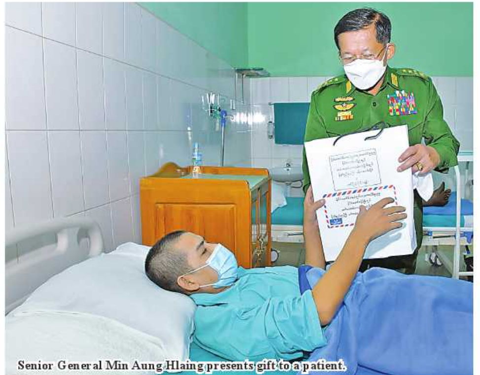
Senior General Min Aung Hlaing presents gift to a patient.

ity of the State, security, prevalence of law and order and asked about individual injuries and medical treatments. Then, the Senior General fulfilled their needs and presented foodstuffs.