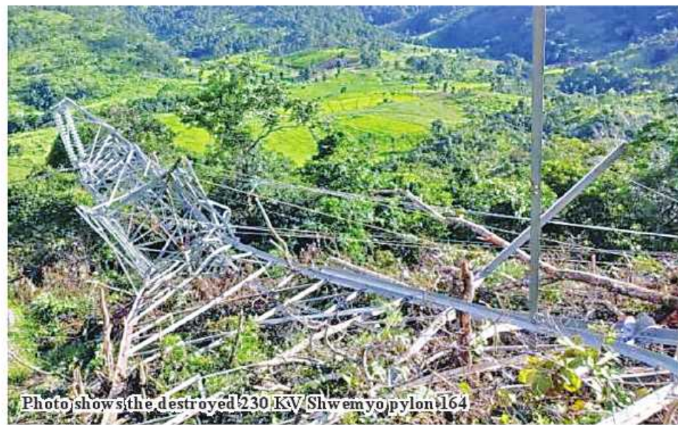
Photo shows the destroyed 230 KV Shwemyo pylon 164.