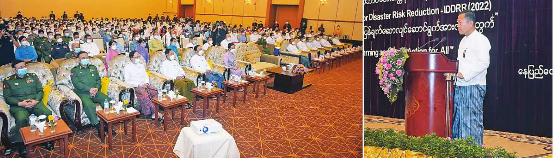
အမျိုးသားသဘာဝဘေးအန္တရာယ်ဆိုင်ရာစီမံခန့်ခွဲမှုကော်မတီဥက္ကဋ္ဌ နိုင်ငံတော်စီမံအုပ်ချုပ်ရေးကောင်စီဒုတိယဥက္ကဋ္ဌ ဒုတိယဝန်ကြီးချုပ် ဒုတိယပိုလ်ချုပ်မှူးကြီးစိုးဝင်း ၂၀၂၂ ခုနှစ် အပြည်ပြည်ဆိုင်ရာသဘာဝဘေးအန္တရာယ်ထိခိုက်ဆုံးရှုံးနိုင်ခြေလျှော့ချရေးနေ့အထိမ်းအမှတ်အခမ်းအနားတွင် အမှာစကားပြောကြားစဉ်။

နေပြည်တော် အောက်တိုဘာ ၁၃ ခွဲတွင် နေပြည်တော်ရှိ Max Hotel ၌ ကျင်းပရာ ဒုတိယပိုလ်ချုပ်မှူးကြီးစိုးဝင်း တက်ရောက်အမှာစကားပြောကြားသည်။ ၂၀၂၂ ခုနှစ် အပြည်ပြည်ဆိုင်ရာသဘာဝဘေးအန္တရာယ် ထိခိုက်ဆုံးရှုံးနိုင်ခြေလျှော့ချရေးနေ့အထိမ်းအမှတ်အခမ်းအနားသို့ ပြည်ထောင်စုဝန်ကြီးများ၊ နေပြည်တော်တိုင်းစစ်ဌာနချုပ် တိုင်းမှူး၊ ဒုတိယဝန်ကြီးများ၊ အမြဲတမ်းအတွင်းဝန်များ၊ ညွှန်ကြားရေးမှူးချုပ်များ၊ UN, INGO, NGOs နှင့် CSO များ၊ ကျောင်းသား၊ ကျောင်းသူများနှင့် တာဝန်ရှိသူများ စာမျက်နှာ ၁၆ ကော်လံ ၁ ✪