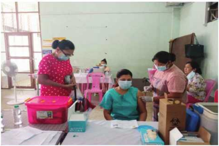
ရန်ကုန်တိုင်းဒေသကြီး တာမွေမြို့နယ်၌ ဒေသခံပြည်သူများကို ကိုဗစ်-၁၉ ရောဂါ ကာကွယ်ဆေးထိုးနှံပေးစဉ်။

ကာကွယ်ရာတွင် အထောက်အကူဖြစ်စေ ရန်အတွက် Mask များကို ပြည်သူများ လက်ဝယ်အရောက် တိုင်းစစ်ဌာနချုပ် အသီးသီးမှ တာဝန်ရှိသူများက အခမဲ့ ပေးဝေလျှော့ဒါန်းလျက်ရှိရာ ယနေ့တွင် တနင်္သာရီတိုင်းဒေသကြီး မြိတ်မြို့အပါအဝင် မြို့နယ် လေးမြို့နယ်၊ ရန်ကုန်တိုင်းဒေသကြီး အတွင်းရှိ မြို့နယ် ၄၄မြို့နယ်တို့မှ စာသင် ကျောင်းများ၊ ဈေးများ၊ လမ်းများ၊ မြို့ အဝင်ဂိတ်များနှင့် လူစည်ကားရာနေရာ များတွင် နယ်မြေခံတပ်မတော်သားများက ခရိုင်၊ မြို့နယ်စီပံ့ပိုးပေးအဖွဲ့မှ တာဝန် ရှိသူများ၊ ဌာနဆိုင်ရာဝန်ထမ်းများ၊ တာဝန်ရှိသူများ၊ ပရဟိတအဖွဲ့များနှင့် ပူးပေါင်း၍ ကိုဗစ်-၁၉ ရောဂါကာကွယ်ရေး အတွက် အသိပညာပေးဆောင်ရွက်ခြင်း၊ Mask များတပ်ဆင်ပြီး သွားလာကြရန် လှုံ့ဆော်ခြင်းနှင့် Mask များကို ဒေသခံ ပြည်သူများလက်ဝယ်အရောက် အခမဲ့ ပေးဝေလျှော့ဒါန်းခဲ့ကြကြောင်း သတင်း ရရှိသည်။