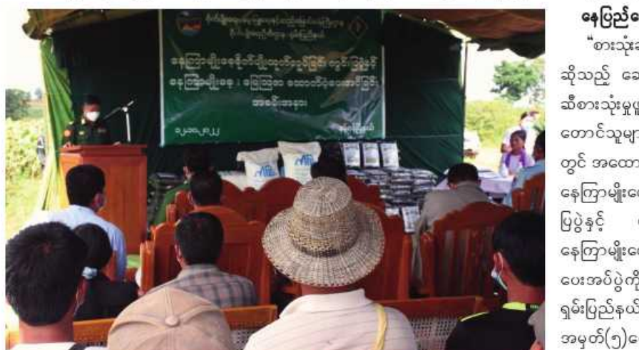
အရှေ့အလယ်ပိုင်းတိုင်းစစ်ဌာနချုပ် တိုင်းမှူး ဗိုလ်ချုပ်မျိုးမင်းထွန်း နေကြာမျိုးစေ့ စိုက်ပျိုးထုတ်လုပ်ခြင်း ကွင်းပြပွဲနှင့် နေကြာမျိုးစေ့၊ မြေဩဇာထောက်ပံ့ပေးအပ်ခြင်း အခမ်းအနားတွင် အမှာစကားပြောကြားစဉ်။

နေပြည်တော် အောက်တိုဘာ ၁၂ “စားသုံးဆီဖူလုံဖို့ နေကြာသီးနှံစိုက်ကြစို့” ဆိုသည့် ဆောင်ပုဒ်နှင့်အညီ ဒေသတွင်း ဆီစားသုံးမှုလုံလုံလျော့နည်း နေကြာစိုက် တောင်သူများကို နေကြာစိုက်ပျိုးရာ တွင် အထောက်အကူဖြစ်စေရန်ရည်ရွယ်၍ နေကြာမျိုးစေ့စိုက်ပျိုးထုတ်လုပ်ခြင်း ကွင်း ပြပွဲနှင့် နေကြာစိုက်တောင်သူများကို နေကြာမျိုးစေ့နှင့် မြေဩဇာထောက်ပံ့ ပေးအပ်ပွဲကို ယနေ့ နေ့လယ်ပိုင်းက ရှမ်းပြည်နယ်(တောင်ပိုင်း) နမ့်စန်မြို့နယ် အမှတ်(၅)ကျေးရွာအုပ်စု အမှတ်(၁၀) ကျေးရွာရှိ နေကြာမျိုးစေ့ထုတ်စိုက်ခင်း၌ ကျန်းမာရေးဆိုင်ရာလမ်းညွှန်ချက်များနှင့် အညီပြုလုပ်ရာ အရှေ့အလယ်ပိုင်းတိုင်း