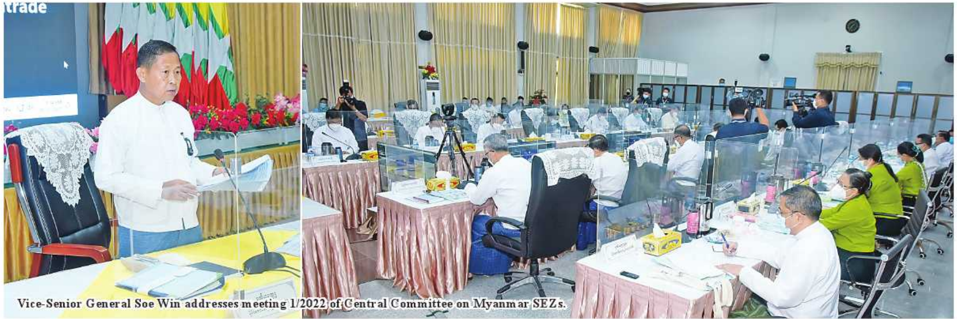
Vice-Senior General Soe Win addresses meeting 1/2022 of Central Committee on Myanmar SEZs.