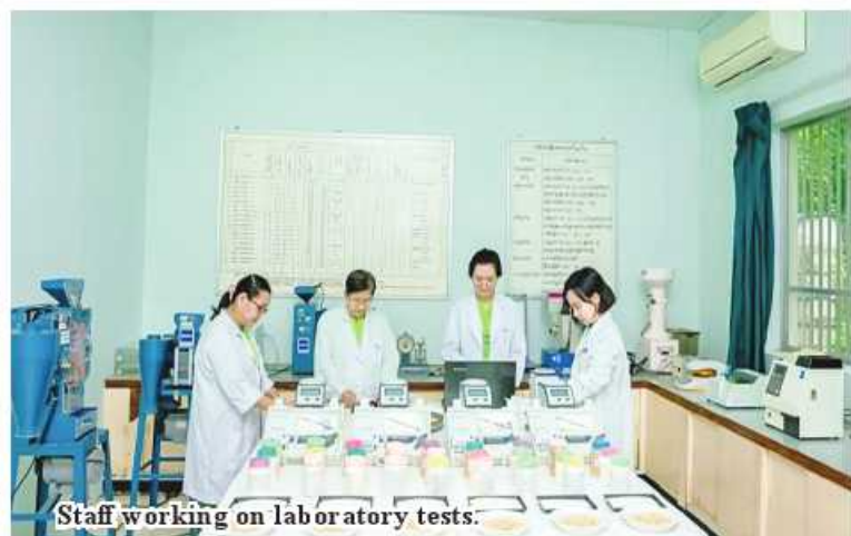
Staff working on laboratory tests.