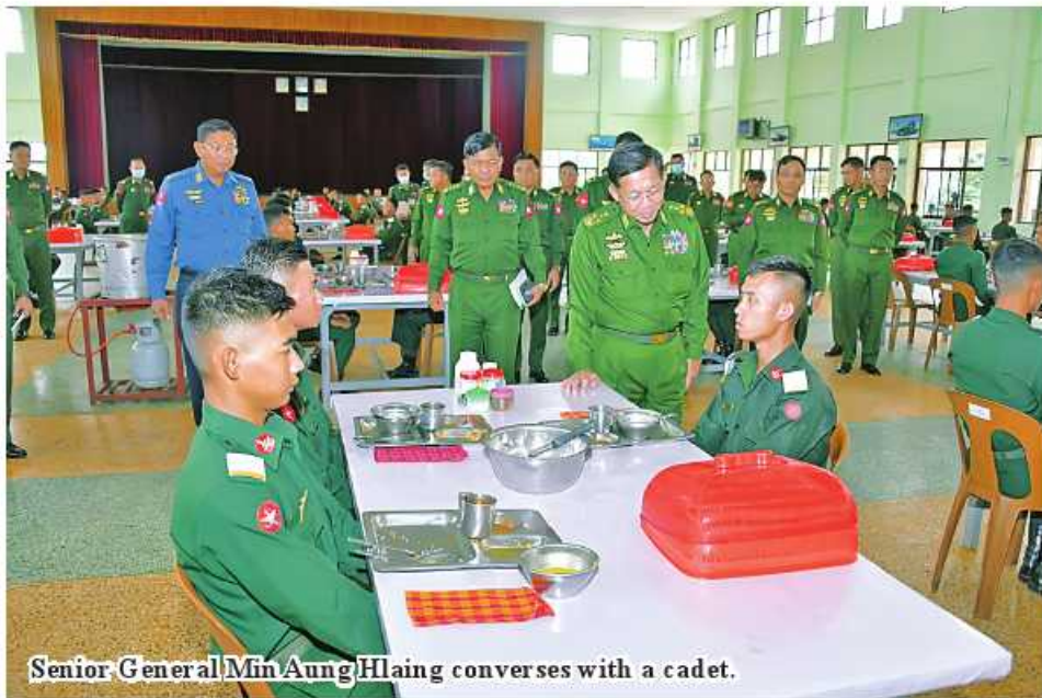
Senior General Min Aung Hlaing converses with a cadet.

of DSA and officials. They continued there.