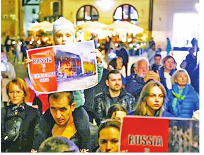
ပြည်ပတွင် ဖြန့်ကြက်လုပ်ဆောင်ထားခြင်း လည်းဖြစ်သည်။ Poland urges citizens to leave Belarus ကို ဘာသာပြန်ဆိုပါသည်။

သည် ဤစစ်ပွဲတွင် ပါဝင်သူများမဟုတ်ဟု ပိုလန်က အခိုင်အမာပြောဆိုခဲ့သည်။ အရှေ့ဥရောပနိုင်ငံသည် ရုရှားနှင့် ၎င်း၏ မဟာမိတ်ဘီလာရုစ်နိုင်ငံကို ဆန့်ကျင် သည့်စီးပွားရေးနှင့် စစ်ရေးဆောင်ရွက်မှု များကိုပင် အပြင်းထန်ဆုံးထောက်ခံအား ပေးသည် နိုင်ငံများထဲမှ တစ်နိုင်ငံဖြစ် သည်။ ရုရှားနိုင်ငံသားများကို ဝီလာ ထုတ်ပေးခြင်းရပ်တန့်ခဲ့သည့် ပထမဆုံး EU နိုင်ငံများထဲက တစ်နိုင်ငံဖြစ်ပြီး သမ္မတ Andrzej Duda က ၎င်းနိုင်ငံ အနေဖြင့် အမေရိကန်နိုင်ငံ၏ နျူကလီးယား မျှဝေရေးအစီအစဉ်တွင် ပါဝင်သင့် သည်ဟု ပြီးခဲ့သောသီတင်းပတ်က အကြံ ပြုခဲ့သည်။ ၎င်းတွင် ဝါရှင်တန်က NATO မဟာမိတ်များပိုင်နက်တွင် ကိုယ် ပိုင်နျူကလီးယားများကို စခန်းချကာ နျူ ကလီးယား တိုက်ပွဲဝင်အသင့်ဖြစ်ရေးကို