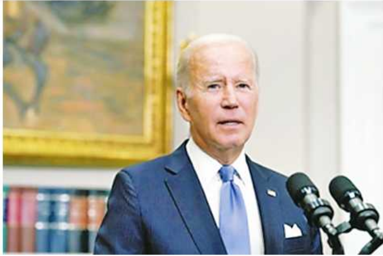
အမေရိကန်သမ္မတ ဂျိုးဘိုင်ဒင်က ယူကရိန်းသမ္မတ ဝီလ်ဇ်ဆွန်နှင့် အောက်တိုဘာ ၁၀ ရက်က ဖုန်းဖြင့်ဆွေးနွေးခဲ့စဉ်

အပ်သွားရန် အာမခံချက်ပေးခဲ့ကြောင်း ဝါရှင်တန် အိမ်ဖြူတော်၏ ထုတ်ပြန်ချက်တွင်ပါရှိသည်။ ယူကရိန်းတွင် ကိယာ့စ်မြို့အပါအဝင် နေရာအနှံ့ ရုရှား၏ ခိုးကျွပ်ပစ်လွှတ် တိုက်ခိုက်မှုကို အမေရိကန်သမ္မတက ရှုတ်ချကြောင်း ထုတ်ပြန်ချက်တွင် ဖော်ပြထားသည်။ “အဆင့်မြင့်လေကြောင်းရန်ကာကွယ် ရေးစနစ်တွေအပါအဝင် ယူကရိန်းနိုင်ငံ ကို ခုခံကာကွယ်ဖို့ လိုအပ်တဲ့အထောက် အပံ့တွေ ဆက်လက်ပေးအပ်သွားမယ်လို့ သမ္မတဘိုင်ဒင်က ကတိပြုခဲ့ပါတယ်”ဟု အိမ်ဖြူတော်ထုတ်ပြန်ချက်တွင် ဖော်ပြ ထားသည်။ ရုရှားအတွက် အရေးယူဇာဏ် ခတ်ပိတ်ဆို့မှုများ ဆက်လက်ချမှတ်ရန် မဟာမိတ်များ၊ လုပ်ဖော်ကိုင်ဖက်များနှင့်