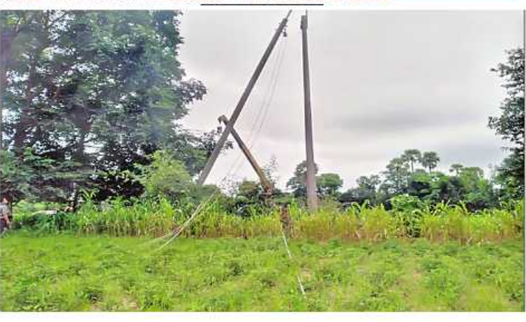
၆၆ ကေဇွိ ကျွန်းချောင်း- မြိုင်(၂) ဓာတ်အားလိုင်း တိုင်အမှတ်(၄၂၇) Sus; တိုင်အား ပြန်လည်ဖြင့်ဖြင့် ပြီးစီးမှုကိုတွေ့ရစဉ်။