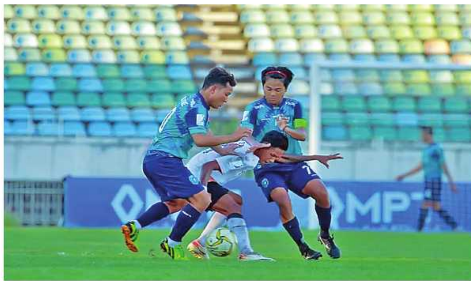
လန်ဒန် အောက်တိုဘာ ၁၂

မြန်မာနေရှင်နယ်လိဂ်ပြိုင်ပွဲ ပွဲစဉ်(၁၅)အဖြစ် ယနေ့ ညနေ ၇နာရီခွဲက ရန်ကုန်မြို့ သုဝဏ္ဏ အားကစားကွင်း၌ ရန်ကုန်ယူနိုက်တက်အသင်းနှင့် မြဝတီအက်ဖ်စီအသင်းတို့ ယှဉ်ပြိုင်ကစားခဲ့ရာ ရန်ကုန်ယူနိုက်တက် အသင်းက