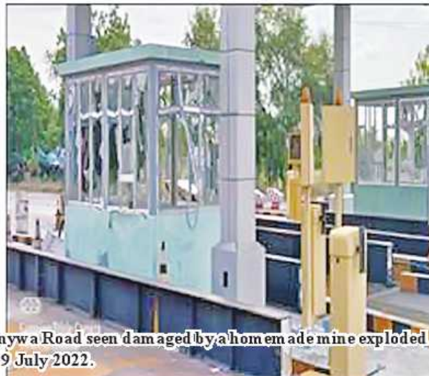
Toll gate, entrance to Myintmu town, on Mandalay-Monywa Road seen damaged by a homemade mine exploded by terrorists by the name of CRPH, NUG and PDF on 9 July 2022.