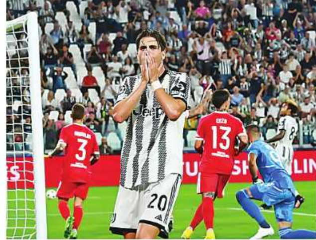
သည် ပလာဟိုပစ်ကို ကမ်းလှမ်း အထက်ရရှိမှသာ ရောင်းချသွားသည်အသင်းများအတွက် အနည်းမည်ဟု တုံ့ပြန်ပြောကြားခဲ့ကြောင်း သိရသည်။ ML

မက္ကာဘီဟိုင်ဗာ အသင်းတို့နှင့် ကစားခဲ့ရသော်လည်း တစ်ပွဲသာ အနိုင်ရရှိထားသဖြင့် အမှတ်ပေး ဇယား အဆင့်(၃) တွင် ရောက်ရှိနေပြီး အုပ်စုအဆင့်မှလွတ်မြောက်ရန် မသေချာသဖြင့် အသင်းမှ အဓိက တိုက်စစ်မှူး ပလာဟိုပစ်အနေဖြင့် ဇန်နဝါရီ အပြောင်းအရွှေ့ကာလတွင် အသင်းပြောင်းရွှေ့နိုင်သည်ဟု သတင်းများ ထွက်ပေါ်လျက် ရှိသည်။ သို့သော် ဂျူပင်တပ်အသင်း တာဝန်ရှိသူများက ရလဒ်ပိုင်း ကျဆင်းနေသည့် နည်းပြ အယ်လီဂရီနိုကို ဆက်လက်ထောက်ခံခဲ့ပြီး အသင်းမှထွက်ခွာရန် ဆန္ဒရှိနေ