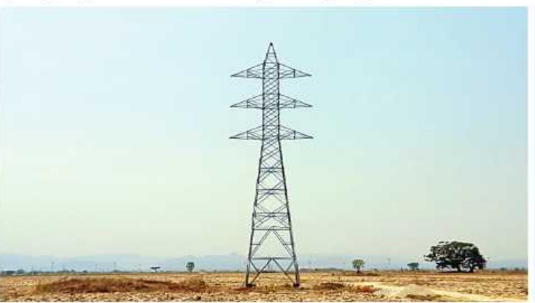
ဖျက်ဆီးခဲ့သော ၁၃၂ ကေဇွိ ထိလူးချောင်း(၂)- တံကျစ် ဓာတ်အားလိုင်းအား ပြန်လည်ဖြင့်ဖြင့် ပြီးစီးမှုကိုတွေ့ရစဉ်။