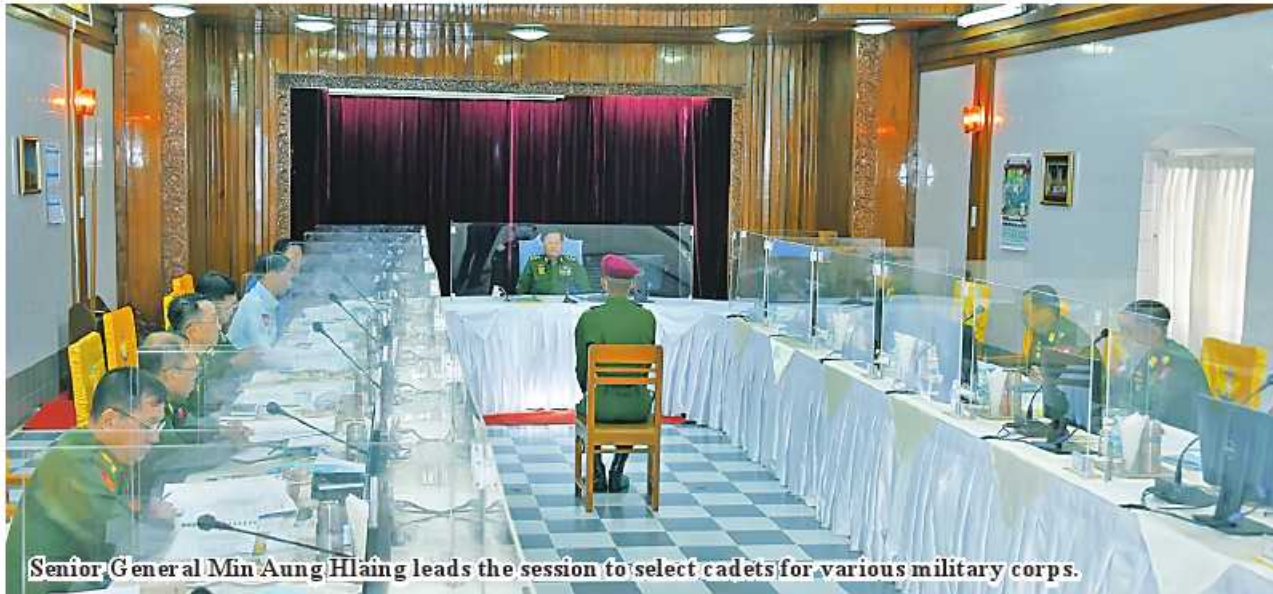
Senior General Min Aung Hlaing leads the session to select cadets for various military corps.

of Defence Services Academy at DSA in Pyin Oo Lwin met with cadets individually and chose suitable corps of the Tatmadaw (Army, Navy and Air) for the cadets depending on outstanding performances in literature and military subjects, sharpening, hobby and efforts.