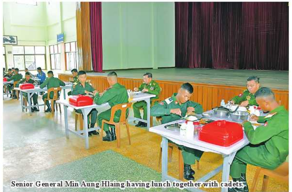
Senior General Min Aung Hlaing having lunch together with cadets.