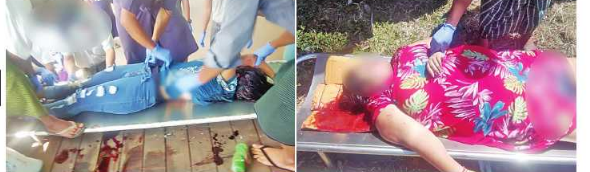
KNLA တပ်မဟာ(၁)နှင့် PDF အမည်ခံအကြမ်းဖက်သမားများ၏ပစ်ခတ်မှုကြောင့် သေဆုံးခဲ့သည့်ဘုရားဖူးပြည်သူ ဗုတ်တမ်းဓာတ်ပုံ။

KNLA တပ်မဟာ(၁)နှင့် PDF အမည်ခံ အကြမ်းဖက်သမား ဖူးပေါင်းအဖွဲ့အနေဖြင့် စစ်ရေးနှင့်မသက်ဆိုင်သည့် အများပြည်သူ အေးချမ်းစွာဖြင့် ဘုရားဖူးကုသိုလ်ယူလျက် ရှိသော သာသနာ့နယ်မြေအတွင်း ရက်စက် မိုက်မဲစွာ အကြမ်းဖက်လုပ်ရပ်လုပ်ဆောင် မှုကို ဆောင်ရွက်ခဲ့ခြင်းဖြစ်ပြီး ဂျီနီဗာ တွန်ဇင်းရှင်းများနှင့် အပြည်ပြည်ဆိုင်ရာ ဥပဒေတို့အရ စစ်ရာဇဝတ်မှု(War Crime) ကျူးလွန်ရာရောက်ပြီး အဆိုပါစစ်ရာဇဝတ် မှုများအတွက် အကြမ်းဖက်မှုတိုက်ဖျက်ရေး ဥပဒေ၊ ရာဇသတ်ကြီးနှင့်သက်ဆိုင်ရာ တည်ဆဲဥပဒေများဖြင့် ၎င်းတို့အပေါ် ထိရောက်စွာ အရေးယူနိုင်ရေး လုံခြုံရေး တပ်ဖွဲ့ဝင်များက အကြမ်းဖက်ချေမှုန်းရေး ဆောင်ရွက်မှု (Counter-terrorism Action) ဆောင်ရွက်သွားမည်ဖြစ်ကြောင်း နှင့် အများပြည်သူများအနေဖြင့် အကြမ်း ဖက်အဖွဲ့၏ လှုပ်ရှားမှုသတင်းများရရှိပါက လုံခြုံရေးတပ်ဖွဲ့ဝင်များထံသို့ လျှို့ဝှက်စွာ သတင်းပေးတိုင်ကြားရန် အသိပေးသတင်း ထုတ်ပြန်အပ်ပါသည်။