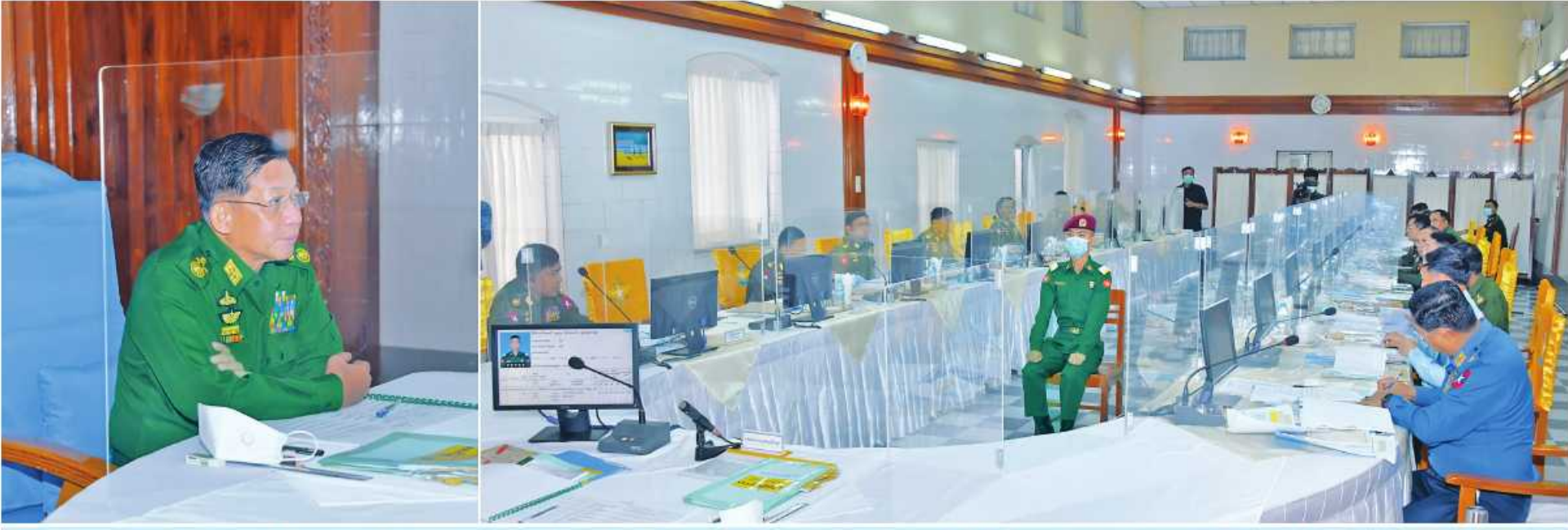
နိုင်ငံတော်စီမံအုပ်ချုပ်ရေးကောင်စီဥက္ကဋ္ဌ တပ်မတော်ကာကွယ်ရေးဦးစီးချုပ် ပိုလ်ချုပ်မှူးကြီးမင်းအောင်လှိုင် စစ်တက္ကသိုလ် ပိုလ်လောင်းသင်တန်းအမှတ်စဉ်(၆၅) စစ်လက်ရုံးရွေးချယ်ပွဲသို့ တက်ရောက်စိစစ်ရွေးချယ်စဉ်။

နေပြည်တော် အောက်တိုဘာ ၁၂ စစ်တက္ကသိုလ်၌ ပြုလုပ်သည့် စစ်တက္ကသိုလ် စီမံအုပ်ချုပ်ရေးကောင်စီဥက္ကဋ္ဌ တပ်မတော် ပိုလ်ချုပ်မှူးကြီးမင်းအောင်လှိုင်၊ ကာကွယ်ရေးဦးစီးချုပ် နိုင်ငံတော်စီမံအုပ်ချုပ်ရေးကောင်စီ ဥက္ကဋ္ဌ ပိုလ်လောင်းသင်တန်းအမှတ်စဉ်(၆၅) စစ်လက်ရုံး ကာကွယ်ရေးဦးစီးချုပ်နှင့်အတူ ညှိနှိုင်းကွပ်ကဲ (လေ) ပိုလ်ချုပ်ကြီးထွန်းအောင်၊ ကာကွယ်ရေး တပ်မတော်ကာကွယ်ရေးဦးစီးချုပ် ပိုလ်ချုပ်မှူးကြီး ရွေးချယ်ပွဲသို့ တက်ရောက်စိစစ်ရွေးချယ်သည်။ ရေးမှူး (ကြည်း၊ ရေ၊ လေ) ပိုလ်ချုပ်ကြီး ဦးစီးချုပ်မှ တပ်မတော်အရာရှိကြီးများ၊ မင်းအောင်လှိုင်သည် ယနေ့တွင် ပြင်ဦးလွင်မြို့ အဆိုပါစစ်လက်ရုံးရွေးချယ်ပွဲသို့ နိုင်ငံတော် မောင်မောင်အေး၊ ကာကွယ်ရေးဦးစီးချုပ်(ရေ) စာမျက်နှာ ၁၆ ကော်လံ ၁၆