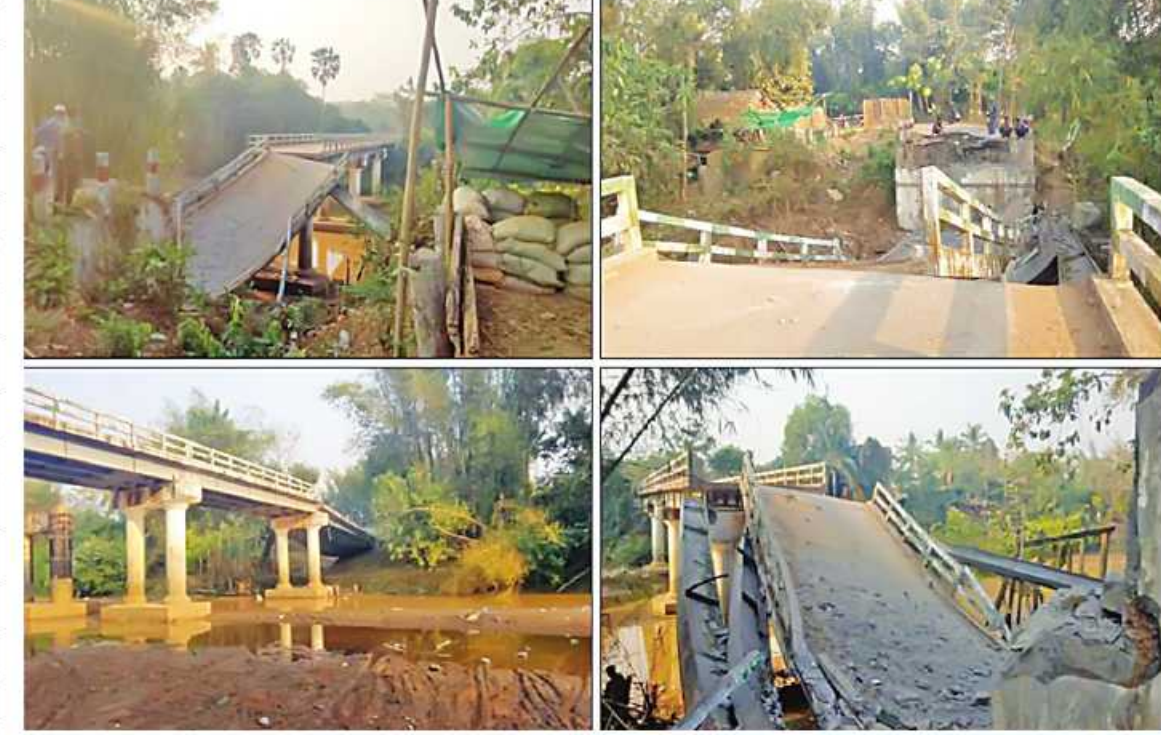
၂၀၂၂ ခုနှစ် မတ် ၃ ရက်တွင် NUG၊ CRPH၊ PDF အမည်ခံအကြမ်းဖက်သမားများက ပဲခူးတိုင်းဒေသကြီး ရွှေကျင်မြို့နယ်ရှိ ဝင်းကံတံတားကို မိုင်းခွဲပျက်ဆီးထားမှု မှတ်တမ်းဓာတ်ပုံ။