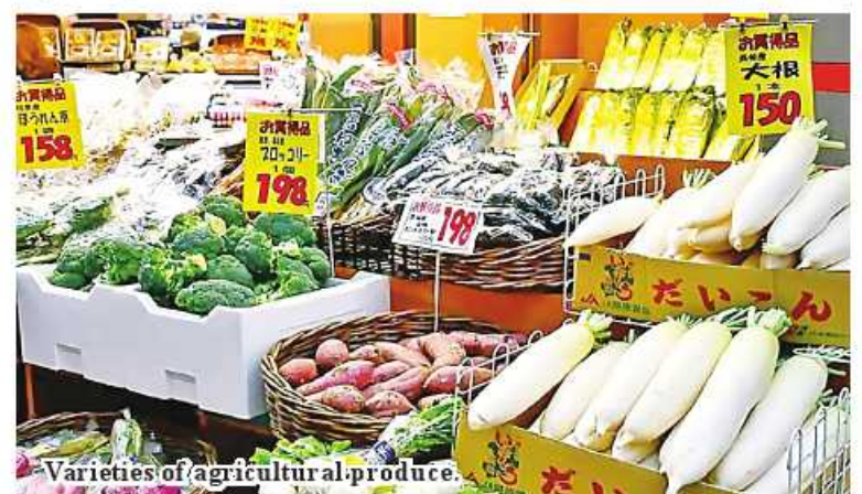
Varieties of agricultural produce.