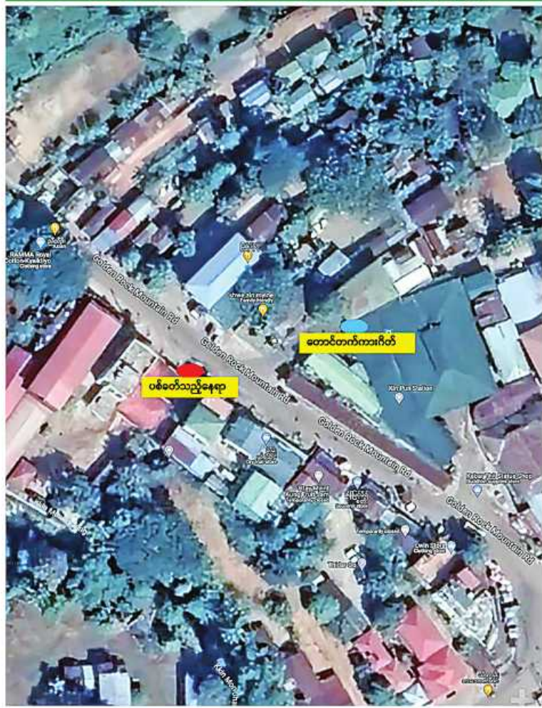
နေပြည်တော် အောက်တိုဘာ ၁၂ ကျိုက်ထီးရိုး ဆံတော်ရှင်မြတ်စွာဘုရား မွန်ပြည်နယ် ကျိုက်ထိုမြို့နယ်ရှိ ကင်မွန်းချောင်း တောင်တက်ကားဂိတ်ကို

KNLA တပ်မဟာ(၁) နှင့် NUG ၊ CRPH တို့၏လက်ဝေခံ PDF အမည်ခံ အကြမ်းဖက်သမားများက ကျိုက်ထီးရိုးဘုရား၊ ကင်မွန်းချောင်းတောင်တက် ကားဂိတ် အား လက်နက်ကြီး၊ လက်နက်ငယ် များဖြင့် အကြောင်းမဲ့ရက်စက်မိုက်မဲစွာလာရောက်ပစ်ခတ် သည့်နေရာပြပုံ