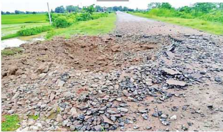
၂၀၂၂ ခုနှစ် ဇူလိုင် ၁ ရက်တွင် NUG၊ CRPH၊ PDF အမည်ခံအကြမ်းဖက်သမားများက ကျောက်ကြီးမြို့နယ် ကျောက်ကြီး-နတ်သံကွင်း ကားလမ်း မိုင်တိုင်(၁၄၂/၁၄၃)ကြား ကားလမ်းကို မိုင်းထောင်ဖောက်ခွဲထားမှု မှတ်တမ်းဓာတ်ပုံ။

နိုင်ငံတော်အစိုးရအနေဖြင့် ဒေသဖွံ့ဖြိုးတိုးတက်ရေး၊ လမ်းပန်းဆက်သွယ်လွယ်ကူချောမွေ့စေရေးဆောင်ရွက်နေမှုများအပေါ် PDF အမည်ခံ အကြမ်းဖက်သမားများက ယခုကဲ့သို့ လမ်း၊တံတားများကို မိုင်းထောင်ဖောက်ခွဲ၊ မီးရှို့ဖျက်ဆီးခြင်းများလုပ်ဆောင်နေမှုအပေါ် ပြည်သူလူထုတစ်ရပ်လုံးအနေဖြင့် ပူးပေါင်းကာကွယ်သွားကြရန်နှင့် အကြမ်းဖက်သမားများ၏ လှုပ်ရှားမှုသတင်းများရရှိပါက နီးစပ်ရာလုံခြုံရေးတပ်ဖွဲ့ဝင်များထံသို့ လျှို့ဝှက်စွာဆက်သွယ်သတင်းပေးပို့ကာ အကြမ်းဖက်သမားများရပ်တည်မှုရှိနိုင်သည်အထိ ပိုင်းဝန်းပူးပေါင်းဆောင်ရွက်သွားကြရန် မေတ္တာရပ်ခံ သတင်းထုတ်ပြန်အပ်ပါသည်။