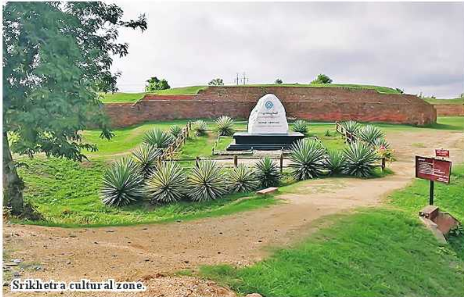
Srikhetra cultural zone.

Pyay October 11 Thaung Pyae hill has been chosen to build as a view point tower, where the entire world heritage