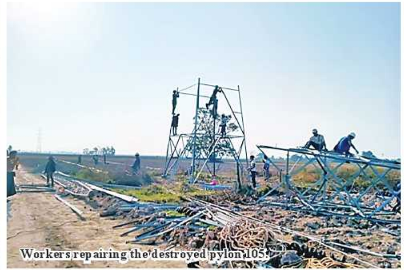
Workers repairing the destroyed pylon 105.