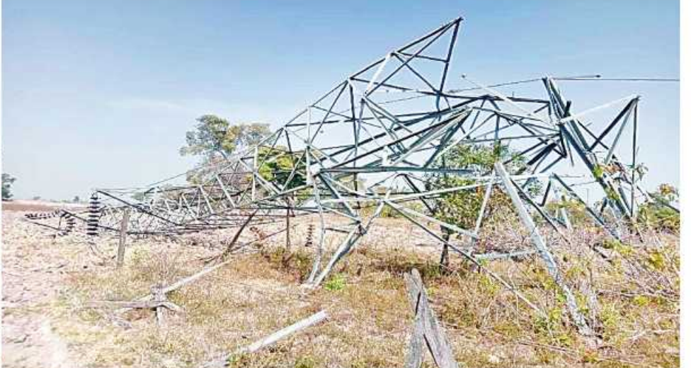
၁၃၂ ကေစီ ဘီလူးချောင်း(၂)-တီကျစ်ဓာတ်အားလိုင်း ဖျက်ဆီးခံရသည့် တာဝါတိုင်အမှတ်(၁၀၁၊၁၀၂၊၁၀၃၊၁၀၄၊၁၀၅)ပြိုလဲပျက်စီးနေသည့် မှတ်တမ်းဓာတ်ပုံ။