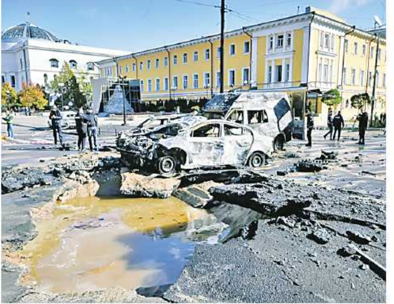
တစ်လျှောက် မီးလောင်မှုဖြစ်ပွားခဲ့ပြီး နောက်နှစ်ရက်အကြာ ပေါ်ပေါက်လာခဲ့ခြင်း လည်းဖြစ်သည်။ ပေါက်ကွဲမှုအတွက် ယူကရိန်းတာဝန်ရှိသူများက တိုက်ခိုက်တာဝန်ယူခဲ့သော်လည်း အောက်တိုဘာ ၉ ရက်တွင် ရုရှားသမ္မတဗလာဒီမာပူတင်က အဆိုပါကရိုင်း

ဘက်ရှိ Lviv မြို့အပါအဝင် အခြား ယူကရိန်းမြို့ အများအပြားကိုပစ်မှတ်ထားခဲ့သည်။ တိုက်ခိုက်မှုအပြီးတွင် ယူကရိန်းအာဏာပိုင်များက Lviv၊ Poltava၊ Sumy၊ Kharkov နှင့် Ternopol ဒေသများတွင် လျှပ်စစ်မီးပြတ်နေကြောင်း အစီရင်ခံတင်ပြထားပြီး နိုင်ငံ၏အခြားဒေသများတွင် လျှပ်စစ်ဓာတ်အားပြတ်တောက်သွားခဲ့ကြောင်း ပြောကြားခဲ့သည်။ ရုရှားသမ္မတ ဗလာဒီမာပူတင်က ရုရှားအပေါ် အကြမ်းဖက်တိုက်ခိုက်မှုအသစ်များ ကြံစည်လုပ်ဆောင်ပါက ၎င်းကို တန်ပြန်ရန် ခြိမ်းခြောက်မှုများကို ပြင်းပြင်းထန်ထန် တုံ့ပြန်သွားမည်ဟု အောက်တိုဘာ ၁၀ ရက်တွင် သတိပေးခဲ့သည်။ တိုက်ခိုက်မှုများသည် အောက်တိုဘာ ၈ ရက်က ကရိုင်းမီးယားတံတားကို လှုပ်ခတ်သွားသည့် အားပြင်းသော ပေါက်ကွဲမှုကြောင့် လူသုံးဦးသေဆုံးပြီး လမ်းအပိုင်းတစ်စိတ်တစ်ပိုင်း ပြိုကျကာ ကားလမ်းနှင့်အပြိုင် မီးရထားလမ်း