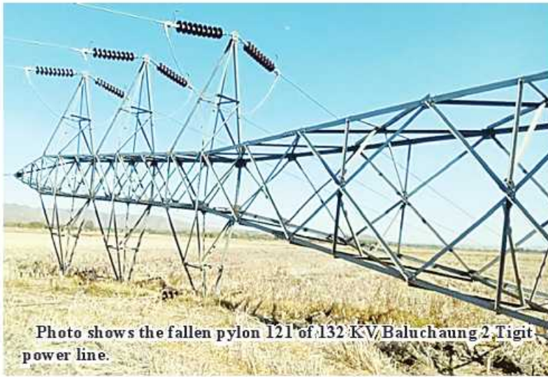
Photo shows the fallen pylon 121 of 132 KV Baluchaung 2 Tigit power line.

Till today 19 pylons of nine 66 KV power lines, 45 pylons of six 230 KV and 132 KV power lines were destroyed due to terrorists' mines and arson attacks as follows: