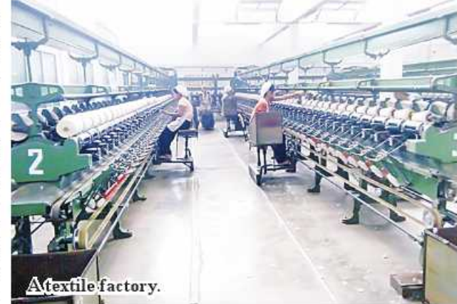
A textile factory.

The required amounts of cotton are 200,000 viss of A level cotton for No. 1 Textile Factory (Shwetaung), 500,000 viss of A level cotton each for No. 7 Textile Factory (Myittha) and No. 8 Textile Factory (Pyawbwe) and 500,000 viss of B level cotton for Cotton Mill Branch (Yamethin) and 3 million viss of A level cot-