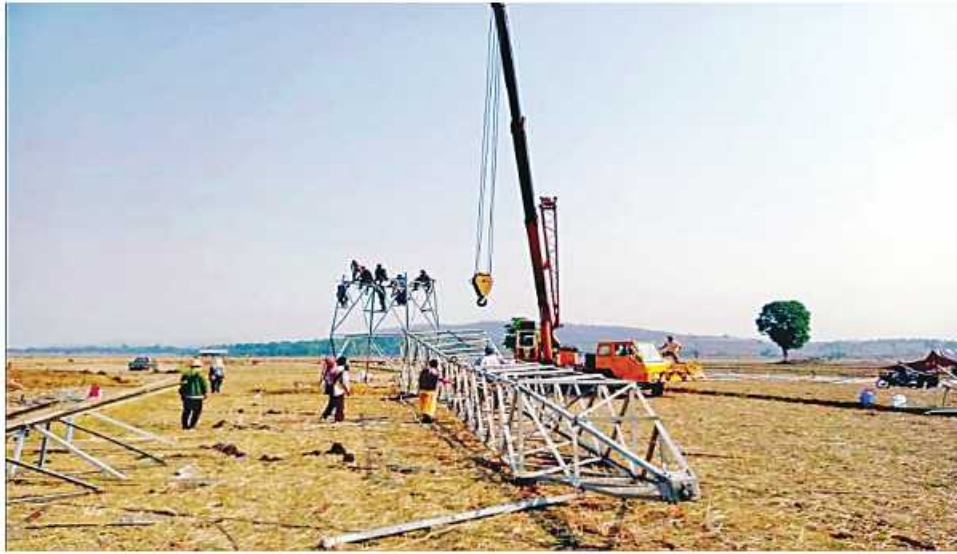
၁၃၂ ကေစီ ဘီလူးချောင်း(၂)-တီကျစ်ဓာတ်အားလိုင်း တာဝါတိုင်အမှတ်(၁၀၁) ပြန်လည်ပြုပြင်နေသည့် မှတ်တမ်းဓာတ်ပုံ။