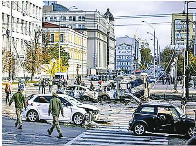
ရုရှားစစ်ဘက်သည် နိုင်ငံ၏အခြေခံ အဆောက်အအုံများကို အောက်တိုဘာ ၁၀ ရက် နံနက်ပိုင်းက တိုက်ခိုက်ခဲ့ပြီးနောက် အနည်းဆုံး လူ ၁၀ ဦးကျော် သေဆုံး