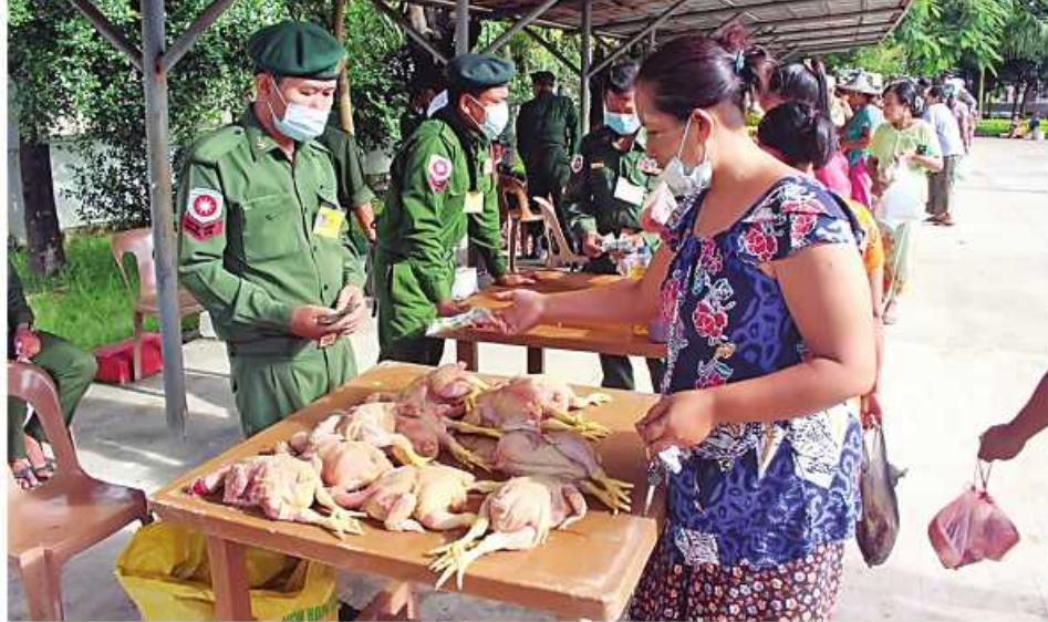
ရခိုင်ပြည်နယ် စစ်တွေမြို့၌ နယ်မြေခံတပ်မတော်သားများက ဟင်းသီးဟင်းရွက်များနှင့် တပ်မတော်စက်ရုံထုတ် အသား၊ ငါးဘူးများနှင့်စားသောက်ကုန်ပစ္စည်းများကို ပြင်ပပေါက်ဈေးထက် သက်သာသောဈေးနှုန်းဖြင့် ရောင်းချပေးစဉ်။