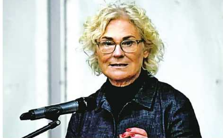
ယူကရိန်းနိုင်ငံတစ်ဝန်းရှိ မြို့အများစုမှာ ပစ်ခတ်တိုက်ခိုက်ခံခဲ့ရပြီးနောက် IRIS-T အပြားကို ရုရှားတို့က ခုံးကျည်များဖြင့် SLM လေကြောင်းရန်ကာကွယ်ရေး

စနစ် လေးစုံအနက်မှ ပထမဆုံးသော လေကြောင်းရန်ကာကွယ်ရေးစနစ်တစ်စုံကို ရက်အနည်းငယ်အတွင်း ယူကရိန်းနိုင်ငံသို့ လွှဲပြောင်းပေးအပ်သွားမည်ဟု ဂျာမနီကာကွယ်ရေးဝန်ကြီး Christine Lambrecht က ပြောကြားခဲ့သည်။ “Kyiv နဲ့ အခြားမြို့တော်တော်များများကို ခုံးကျည်နဲ့ပစ်ခတ်မှုဟာ ယူကရိန်းကို လေကြောင်းရန်ကာကွယ်ရေးစနစ်တွေ မြန်မြန်ဆန်ဆန်ပို့ဆောင်ဖို့ ဘယ်လောက် အရေးကြီးတယ်ဆိုတာ ရှင်းရှင်းလင်းလင်း သိသာထင်ရှားပါတယ်”ဟု ဂျာမနီကာကွယ်ရေးဝန်ကြီး