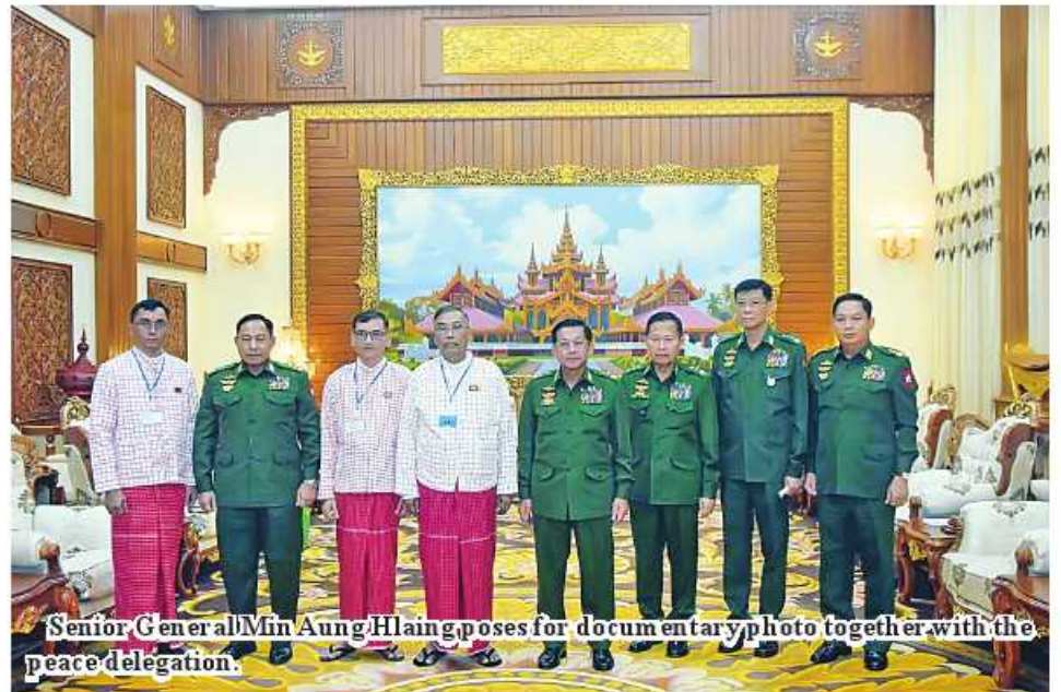
Senior General Min Aung Hlaing poses for documentary photo together with the peace delegation.

on peace issues and regional development. After the talk, the Senior General presented gifts to the Vice-Chairman of the New Mon State Party (NMSP) and party and posed for documentary photos together with the attendees. The delegation led by the Vice-Chairman of the New Mon State Party (NMSP) will hold peace talks with the Peace Talks Team and the National Solidarity and Peacemaking Negotiation Committee formed with council members by the State Administration Council. 100