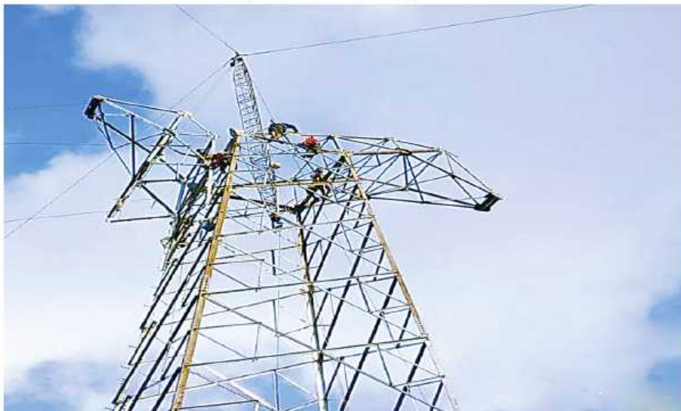
ကေစီ ၂၃၀ ဘီလူးချောင်း(၂)-ရွှေမြို့ဓာတ်အားလိုင်း တာဝါတိုင်အမှတ်(၁၆၅) တိုင်ကျိုးပြုပြင်သည့် မှတ်တမ်းဓာတ်ပုံ။