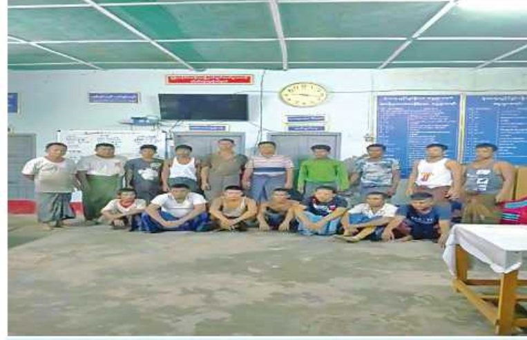
စစ်တွေမြို့ ဆတ်ရိုးကျရပ်ကွက်အတွင်း တရားမဝင်လောင်းကစားပြုလုပ်စဉ် ဖမ်းဆီးရမိသူများကို ဖော်တော်ဆိုင်ကယ်များနှင့်အတူ တွေ့ရစဉ်။

လျက်ရှိကြောင်းနှင့် အဆိုပါနေရာ တစ်ဝိုက်ကို လုံခြုံရေးတပ်ဖွဲ့ဝင်များက လိုအပ်သည့် လုံခြုံရေးလုပ်ငန်းများ ဆက်လက် ဆောင်ရွက်လျက်ရှိကြောင်း သတင်းရရှိသည်။