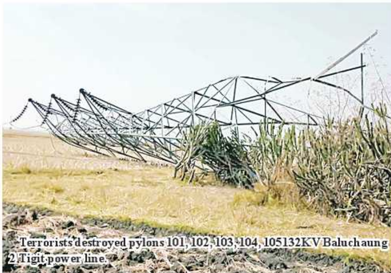
Terrorists destroyed pylons 101, 102, 103, 104, 105 132KV Baluchaung 2 Tigit power line.