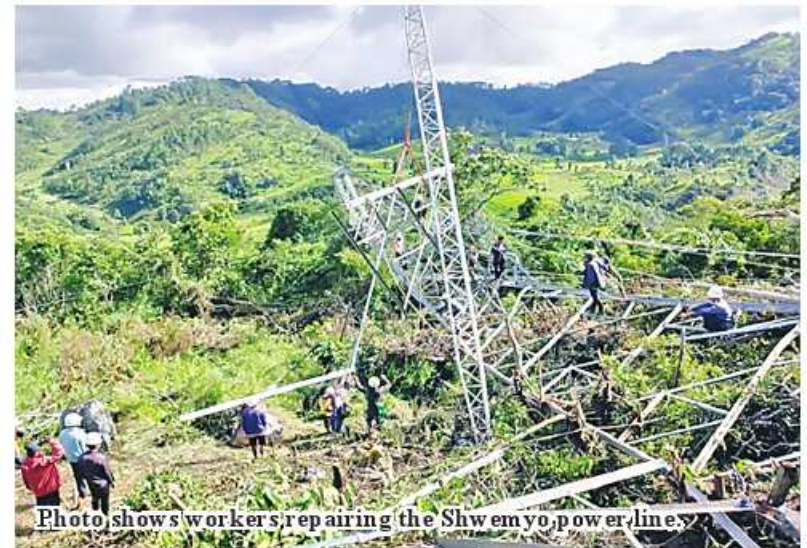
Photo shows workers repairing the Shwemyo power line.