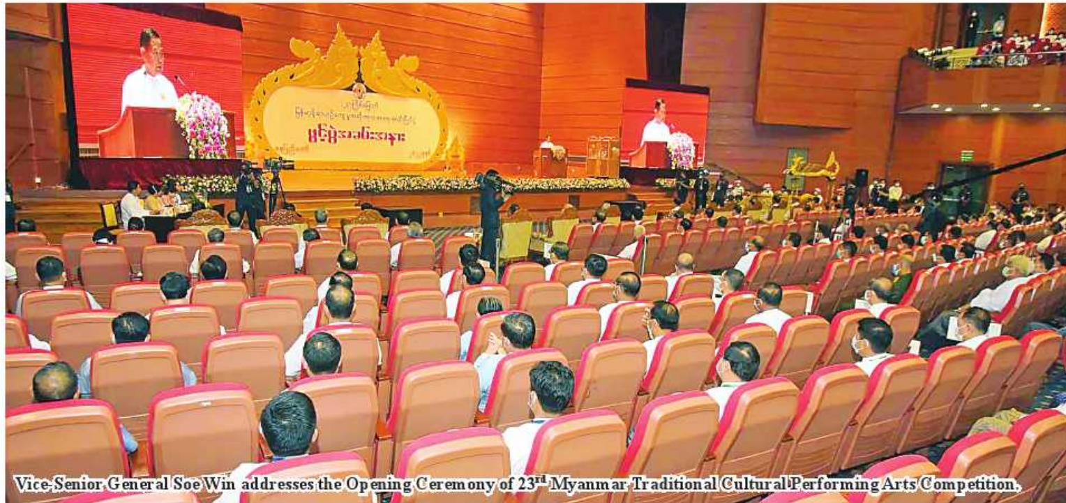
Vice-Senior-General Soe Win addresses the Opening Ceremony of 23 rd Myanmar Traditional Cultural Performing Arts Competition.

Nay Pyi Taw October 11 The Opening Ceremony of the 23 rd Myanmar Traditional Cultural Performing Arts Competition was held in accordance with the restrictions for prevention and control of COVID-19 at the Myanmar International Convention Centre-2 in Nay Pyi Taw at 9 am today and Vice Chairman of State Administration Council Deputy Prime Minister Vice Senior General Soe Win delivered an address at the ceremony. Also present at the occasion were members of the SAC, the chairperson of the Constitutional Tribunal, the chairman of the Union Election Commission, union ministers, union level officials, judges of the Supreme Court of the Union, members of the Constitutional Tribunal, members of the UEC, the commander of the Nay Pyi