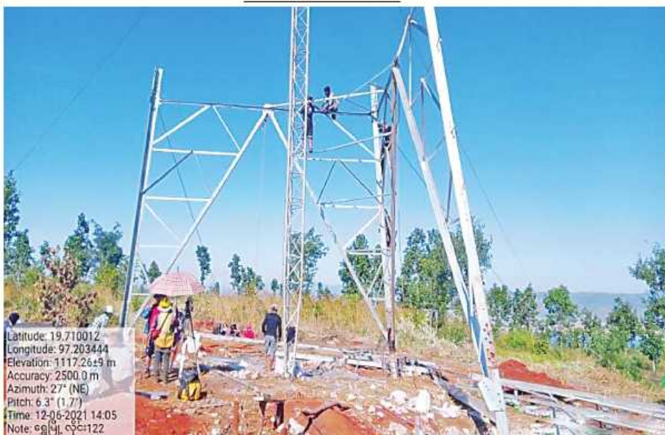
၁၈-၁၁-၂၀၂၁ ရက်တွင် ပြုလုပ်ပျက်စီးခဲ့သည့် ကေစီ ၂၃၀ ဘီလူးချောင်း(၂)-ရွှေမြို့ဓာတ်အားလိုင်း တာဝါတိုင်အမှတ်(၁၂၂)ကို ပြန်လည်ပြုပြင်နေသည့် မှတ်တမ်းဓာတ်ပုံ။