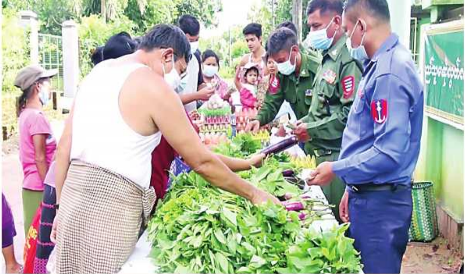
ဧရာဝတီတိုင်းဒေသကြီး ပုသိမ်မြို့၌ နယ်မြေခံတပ်မတော်သားများက ဟင်းသီးဟင်းရွက်များနှင့် တပ်မတော်စက်ရုံထုတ် အသား၊ ငါးဘူးများနှင့်စားသောက်ကုန်ပစ္စည်းများကို ပြင်ပပေါက်ဈေးထက် သက်သာသောဈေးနှုန်းဖြင့် ရောင်းချပေးစဉ်။

ကြက်ဥ၊ ဘဲဥ၊ နို့ထွက်ပစ္စည်းများ၊ ဟင်းသီးဟင်းရွက်များ၊ ကြက်သွန်နီ၊ ကြက်သွန်ဖြူနှင့် တပ်မတော်စက်ရုံများမှထုတ်လုပ်သည့် ခေါက်ဆွဲခြောက်၊ ဘီစကွတ်နှင့် စည်သွပ်ဘူးများ စသည်စားသောက်ကုန်ပစ္စည်းများကို ပြင်ပပေါက်ဈေးထက်သက်သာသောဈေးနှုန်းများဖြင့် ရောင်းချပေးခဲ့ကြောင်း သတင်းရရှိသည်။