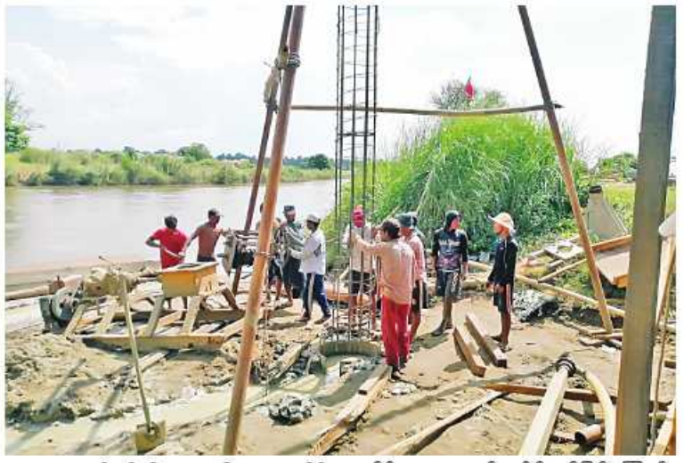
ကျေးရွာများရှိ စိုက်ကေ ၁၆၀ မှ ထွက်ရှိ တင်ပို့ ရောင်းချနိုင်မည်ဖြစ်ကြောင်း သောသီးနှံများကို ဈေးကွက်သို့ တိုက်ရိုက် သိရသည်။ ကျော်စောဦး(မောရမ်းမြေ)

ဆောင်ရွက်ကြရန် မှာကြားခဲ့သည်။ ပန်းမော်မြို့နယ် ကျေးရွာချင်းဆက် နန့်ကျရီ ချောင်းကူးတံတားအမျိုးအစား သည် RC ကမ်းတပ်ခုံ၊ သံပေါင်ရက်မ၊ သစ်သားကြမ်းခင်းဖြစ်ပြီး အတိုင်းအတာ အားဖြင့် အရှည်ပေ ၁၈၀၊ အကျယ် ၁၄ ပေ၊ အမြင့် ၁၄ လက်မဖြစ်ကြောင်း၊ ယခုနှစ် စက်တင်ဘာလပထမပတ်တွင် လုပ်ငန်းများ စတင်ဆောင်ရွက်ခဲ့ရာ လက်ရှိတွင် တိုးပိုင် အုတ်မြစ်လုပ်ငန်းများ ပြီးစီးပြီဖြစ်ကြောင်း၊ အဆိုပါလုပ်ငန်းများ ရာနှုန်းပြည့်ပြီးစီးပါက