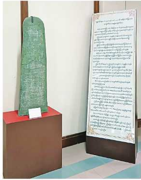
ပုဂံရှေးဟောင်းသုတေသနပြုတိုက်တွင်ပြသထားသည့် ကျွန်ုပ်တို့အဖို့တော်ပြန်တမ်းကျောက်စာ။

သမိုင်းပညာရှင်များက အေဒီ ကိုးရာစုမှ ၁၃ ရာစုထိ ထွန်းကားစည်ပင်ခဲ့သည့် ပုဂံခေတ်ကိုစည်းလုံးညီညွတ်သော ပထမမြန်မာနိုင်ငံတော်ဟု သတ်မှတ်ခဲ့ကြသည်။ နှစ်ပေါင်း ၁၀၀၀ ကျော် ကြာမြင့်ခဲ့ပြီဖြစ်သည့် ပုဂံသမိုင်းသည် နှုတ်ပြောစကားများ၊ ဒဏ္ဍာရီများ၊ ပါဏိနိပါတ်များ ရောထွေးနေသဖြင့် ပါမောက္ခဦးဖေမောင်တင်က “ပုဂံရာဇဝင်အကြောင်းပြောလျှင် တုတ်ထမ်းပြီးပြောရမည်ဟုဆိုကြ၏။ အငြင်းအခန်ဖြစ်ကြပြီး ရှိကြ၊ ပုတ်ကြဖြစ်တတ်သည်ကို ဆိုလိုသည်”ဟု ရေးသားခဲ့သည်။