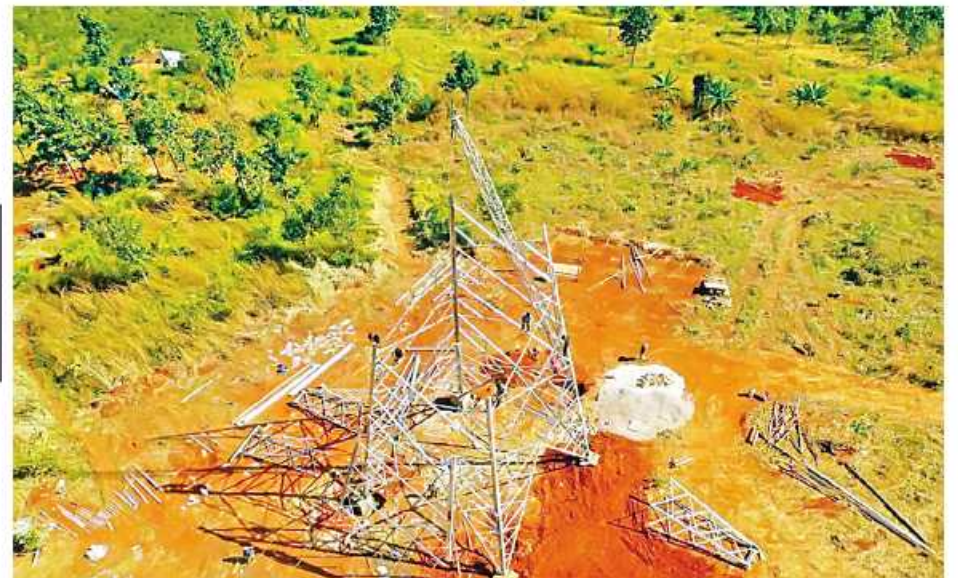
၁၈-၁၁-၂၀၂၁ ရက်တွင် ပြုလုပ်ပျက်စီးခဲ့သည့် ကေစီ ၂၃၀ ဘီလူးချောင်း(၂)- ရွှေမြို့ဓာတ်အားလိုင်း တာဝါတိုင်အမှတ်(၁၂၁)ကို ပြန်လည်ပြုပြင်နေသည့် မှတ်တမ်းဓာတ်ပုံ။