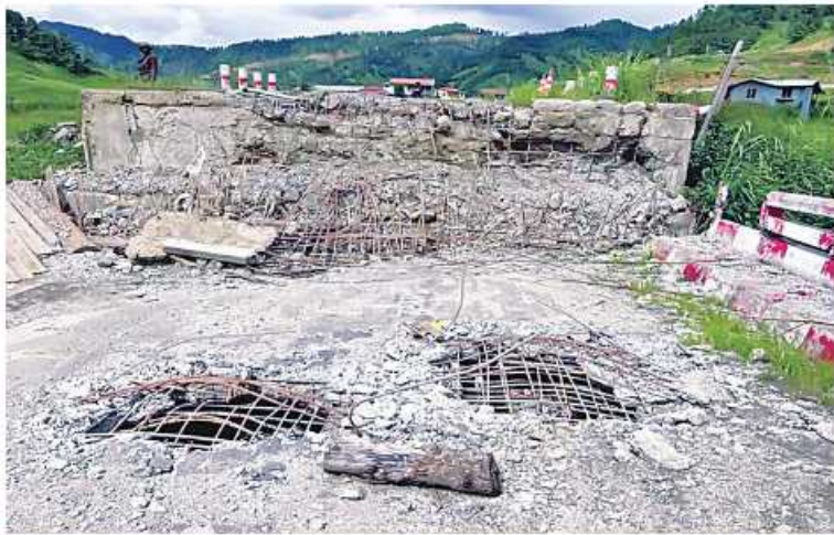
၂၀၂၁ ခုနှစ် အောက်တိုဘာ ၂၂ရက်တွင် ချင်းပြည်နယ် ဟားခါးမြို့နှင့် ထန်တလန်မြို့ကြားရှိ သီးမြစ်တံတားကို CDF အမည်ခံအကြမ်းဖက်အဖွဲ့များက မိုင်းထောင်ဖောက်ခွဲဖျက်ဆီးခဲ့သဖြင့် တံတားပျက်စီးခဲ့မှု မှတ်တမ်းဓာတ်ပုံ။

နေပြည်တော် အောက်တိုဘာ ၁၁ - NUG နှင့် PDF အမည်ခံ အကြမ်းဖက် သမားများသည် အေးချမ်းစွာနေထိုင်လျက် ရှိသည့် ပြည်သူလူထုများနှင့် တရားဥပဒေ စိုးမိုးရေးအတွက် ဆောင်ရွက်နေသည့် အုပ်ချုပ်ရေးတာဝန်ရှိသူများကို ထိခိုက် ဒဏ်ရာရရှိစေရန်နှင့်လမ်းပန်းဆက်သွယ်မှု များ လုံခြုံချောမွေ့မှုမရှိစေရေး ရည်ရွယ် ချက်များဖြင့် အများပြည်သူအသုံးပြုသည့်