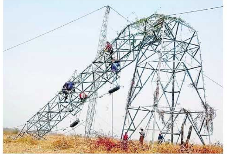
၁၃၂ ကေစီ ဘီလူးချောင်း(၂)-တီကျစ်ဓာတ်အားလိုင်း ပြုလုပ်တာဝါတိုင်အမှတ် (၁၀၈၊၁၀၉)တို့ကို ပြန်လည်ဖြုတ်သိမ်းခြင်း မှတ်တမ်းဓာတ်ပုံ။

၂၃၀ နှင့် ၁၃၂ ကေစီ မဟာဓာတ်အားလိုင်းများ၏ ပျက်စီးဆုံးရှုံးမှု ခန့်မှန်းတန်ဖိုး(၄,၀၃၄. ၇၀၅ ကျပ်သန်း)