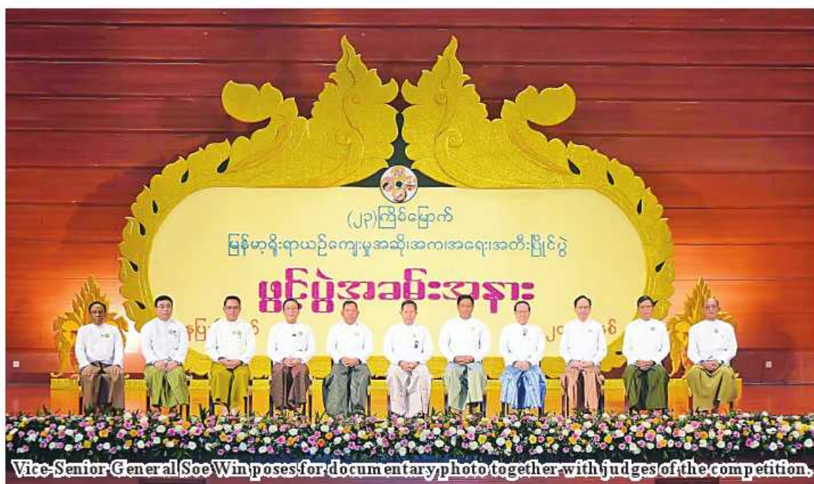
Vice-Senior-General Soe Win poses for documentary photo together with judges of the competition.

as previous competitions at township, district, state and regional and national levels.