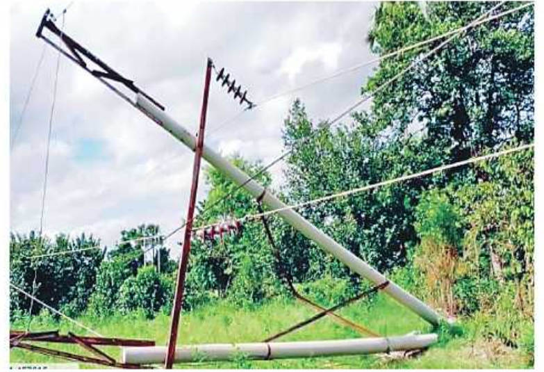
၆၆ ကေစီ ကျွန်းချောင်း-မြိုင်(၂) ဓာတ်အားလိုင်း တိုင်အမှတ်(၃၅၆)SUS;တိုင် ဖျက်ဆီးခံရသည့် မှတ်တမ်းဓာတ်ပုံ။