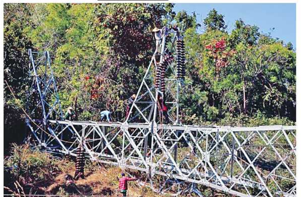
၂၁-၁၂-၂၀၂၁ ရက်တွင် ပြုလုပ်ပျက်စီးခဲ့သည့် ကေစီ ၂၃၀ ဘီလူးချောင်း(၂)-ရွှေမြို့ဓာတ်အားလိုင်း တာဝါတိုင်အမှတ်(၁၅၃)ကို ပြန်လည်ပြုပြင်နေသည့် မှတ်တမ်းဓာတ်ပုံ။

စာမျက်နှာ ၂၃ မှအဆက် အပေါ် PDF အမည်ခံ အကြမ်းဖက် နေမှုအပေါ် ပြည်သူလူထုတစ်ရပ်လုံး အကြမ်းဖက်သမားများ၏ လှုပ်ရှားမှု အကြမ်းဖက်သမားများရပ်တည်မှု မရှိနိုင် တိုင်းဒေသကြီးနှင့် ပြည်နယ်များရှိ သမားများက ယခုကဲ့သို့ လျှပ်စစ် အနေဖြင့် နိုင်ငံတော်ဖွံ့ဖြိုးတိုးတက် ကျေးလက်ဒေသများပါမကျန် မီးရရှိ တာဝါတိုင်များကို မိုင်းထောင်ဖောက် ရေးနှင့် တည်ငြိမ်အေးချမ်းရေးအတွက် လုံခြုံရေးတပ်ဖွဲ့ဝင်များထံသို့ ရေးရည်ရွယ် ဆောင်ရွက်နေမှုများ ခွဲ၊မီးရှို့ဖျက်ဆီးခြင်းများ လုပ်ဆောင် ပူးပေါင်း ကာကွယ်သွားကြရန်နှင့် စွာ ဆက်သွယ်သတင်းပေးပို့၍ အပ်ပါသည်။