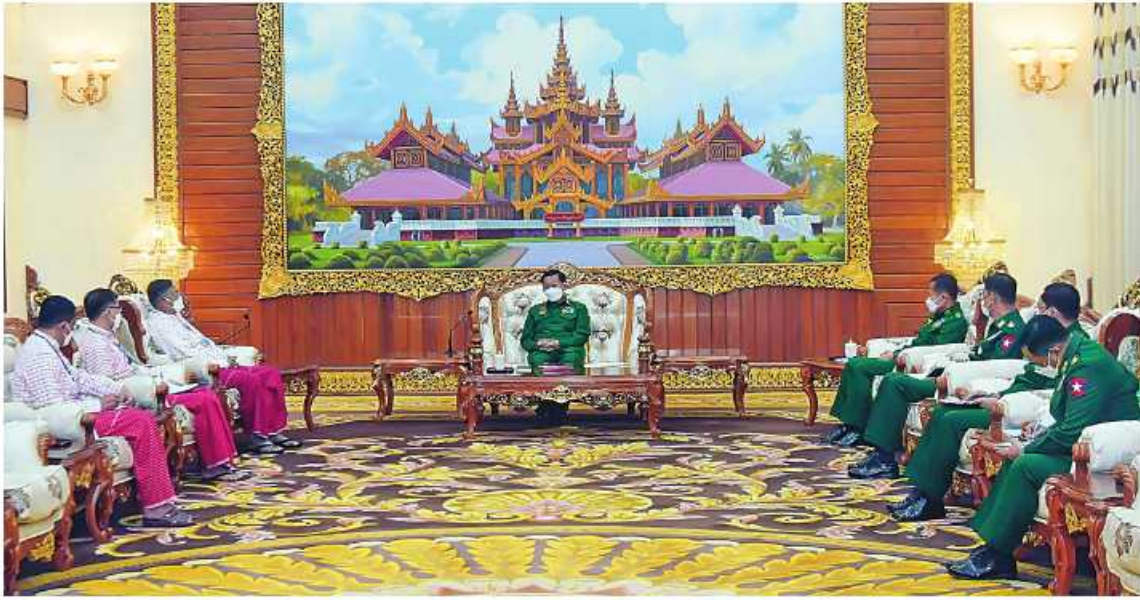
နိုင်ငံတော်စီမံအုပ်ချုပ်ရေးကောင်စီဥက္ကဋ္ဌ (NMSF) ဒုတိယဥက္ကဋ္ဌ နိုင်အောင်မင်း ကိုစွရပ်များ ဆွေးနွေးစဉ်။

၂။ ရှေ့မှူးအဆက် နိုင်ငံရေးအရပြန်ပေါ်နေသည့် သဘောထားကွဲလွဲမှုများကို မည်သည့်ကန့်သတ်ချက်မျှမထားရှိဘဲ တွေ့ဆုံဆွေးနွေးအပြောရန် ဖိတ်ခေါ်ဆွေးနွေးခြင်းဖြစ်သည်။ အခြေအနေများ၊ ဖွဲ့စည်းပုံအခြေခံဥပဒေ(၂၀၀၈ ခုနှစ်)နှင့် တစ်နိုင်ငံလုံးပစ်ခတ်တိုက်ခိုက်မှု ရပ်စဲရေးသဘောတူစာချုပ်(NCA)တို့ကိုအခြေခံ၍ ငြိမ်းချမ်းရေးလမ်းကြောင်းကို ဆက်လက်ဖော်ဆောင်သွားမည်ဖြစ်သည်။ အခြေအနေများ၊ စစ်မှန်၍ စည်းကမ်းပြည့်ဝသည့် ပါတီရုံးခိုကရေစီ ဝန်ထမ်းများနှင့် ဝန်ထမ်းများအဖွဲ့အစည်းများကို နိုင်ငံရေးမျှော်မှန်းချက်အဖြစ် ကြိုးပမ်းဆောင်ရွက်လျက်ရှိသည့် အခြေအနေများ၊ ငြိမ်းချမ်းရေးတွေ့ဆုံဆွေးနွေးရာတွင် တိုင်းရင်းသားလက်နက်ကိုင်အဖွဲ့များ၏တောင်းဆိုချက်များ၊ ဒေသနှင့် တိုင်းပြည်အတွက် အမှန်တကယ်လိုအပ်