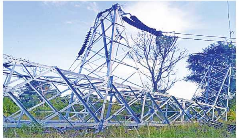
၃-၁-၂၀၂၂ ရက်တွင် ကေစီ ၂၃၀ ဘီလူးချောင်း(၂)-ရွှေမြို့ဓာတ်အားလိုင်း တာဝါတိုင်အမှတ်(၉၀) ပြုလုပ်ပျက်စီးခဲ့သည့် မှတ်တမ်းဓာတ်ပုံ။