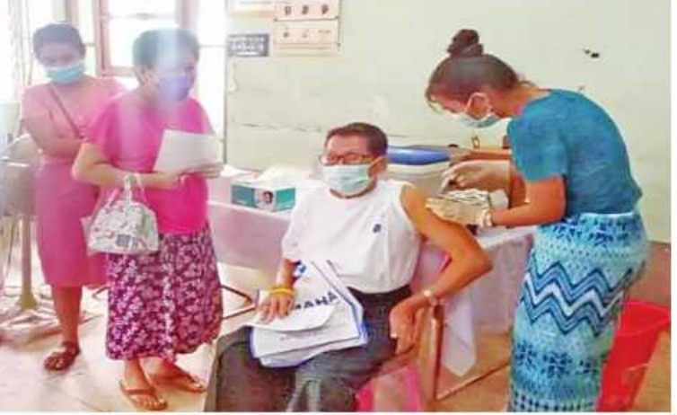
ရန်ကုန်တိုင်းဒေသကြီး တာမွေမြို့နယ်အတွင်းရှိ ဒေသပြည်သူများကို ကိုဗစ်-၁၉ ရောဂါ ကာကွယ်ဆေးထိုးနှံပေးစဉ်

ထို့ပြင် ကိုဗစ်-၁၉ ရောဂါ ထိန်းချုပ်တာကွယ်ရာတွင် အထောက်အကူဖြစ်စေရန်အတွက် Mask များကို ပြည်သူများ လက်ဝယ်အရောက် တိုင်းစစ်ဌာနချုပ် အသီးသီးမှတာဝန်ရှိသူများက အခမဲ့ပေးဝေလျှော့နည်းလျက်ရှိရာ ယနေ့တွင် တနင်္သာရီတိုင်းဒေသကြီး ဘုတ်ပြင်းမြို့၊ ရန်ကုန်တိုင်းဒေသကြီးအတွင်းရှိ မြို့နယ် ၄၄ မြို့နယ်၊ ရောဂါတိုင်းဒေသကြီး ဖျာပုံမြို့၊ မကွေးတိုင်းဒေသကြီး ချောက်မြို့နယ်တို့ရှိ စာသင်ကျောင်းများ၊ ဈေးများ၊ လမ်းများ၊ မြို့အဝင်ဂိတ်များနှင့် လူစည်ကားရာနေရာများတွင် နယ်မြေခွဲတပ်မတော်သားများက ခရိုင်၊ မြို့နယ်စီမံအုပ်ချုပ်ရေးအဖွဲ့မှ တာဝန်ရှိသူများ၊ ဌာနဆိုင်ရာဝန်ထမ်းများ၊ တာဝန်ရှိသူများ၊ ပရဟိတအဖွဲ့များနှင့် ပူးပေါင်း၍ ကိုဗစ်-၁၉ ရောဂါ တာကွယ်ဆေးအတွက် အသိပညာပေးဆောင်ရွက်ခြင်း၊ Mask များ တပ်ဆင်ပြီးသွားလာကြရန် လှုံ့ဆော်ခြင်းနှင့် Mask များကို ဒေသပြည်သူများ လက်ဝယ်အရောက် အခမဲ့ပေးဝေလျှော့နည်းခဲ့ကြကြောင်း သတင်းရရှိသည်။