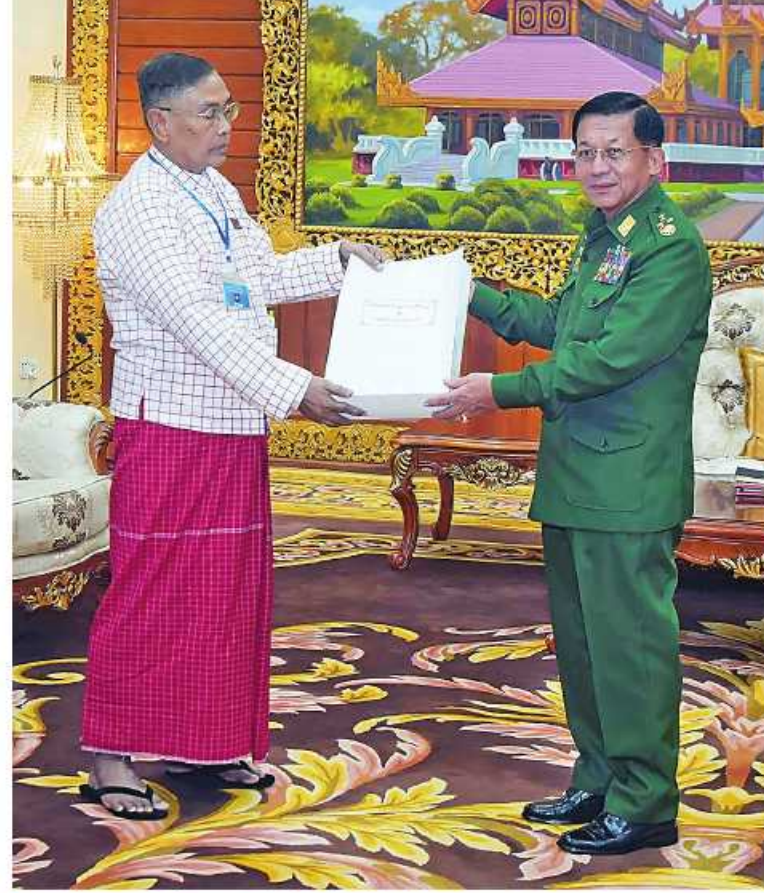
နိုင်ငံတော်စီမံအုပ်ချုပ်ရေးကောင်စီဥက္ကဋ္ဌ တပ်မတော်ကာကွယ်ရေးဦးစီးချုပ် ဝိုလ်ချုပ်မျိုးကြီးမင်းအောင်လှိုင်က မွန်ပြည်သစ်ပါတီ(NMSP)ဒုတိယဥက္ကဋ္ဌနိုင်အောင်မင်းအား အမှတ်တရလက်ဆောင်ပစ္စည်း ပေးအပ်စဉ်။

ပေးအပ်ခဲ့ပြီး တက်ရောက်လာသူများနှင့်အတူ စုပေါင်းဓာတ်ပုံရိုက်ကြသည်။ အဆိုပါ မွန်ပြည်သစ်ပါတီ (NMSP) ဒုတိယဥက္ကဋ္ဌ ဦးဆောင်သည့်အဖွဲ့သည် နိုင်ငံတော်စီမံအုပ်ချုပ်ရေးကောင်စီမှ ဖွဲ့စည်းပေးထားသည့် ကောင်စီဝင်များပါဝင်သည့် ငြိမ်းချမ်းရေးဆွေးနွေးရေးအဖွဲ့၊ အမျိုးသားစည်းလုံးညီညွတ်ရေးနှင့် ငြိမ်းချမ်းရေးဆွေးနွေးမှု ညှိနှိုင်းရေးကော်မတီတို့နှင့် ငြိမ်းချမ်းရေးဆွေးနွေးမှုများကို ဆက်လက်ပြုလုပ်သွားမည်ဖြစ်ကြောင်း သတင်းရရှိသည်။