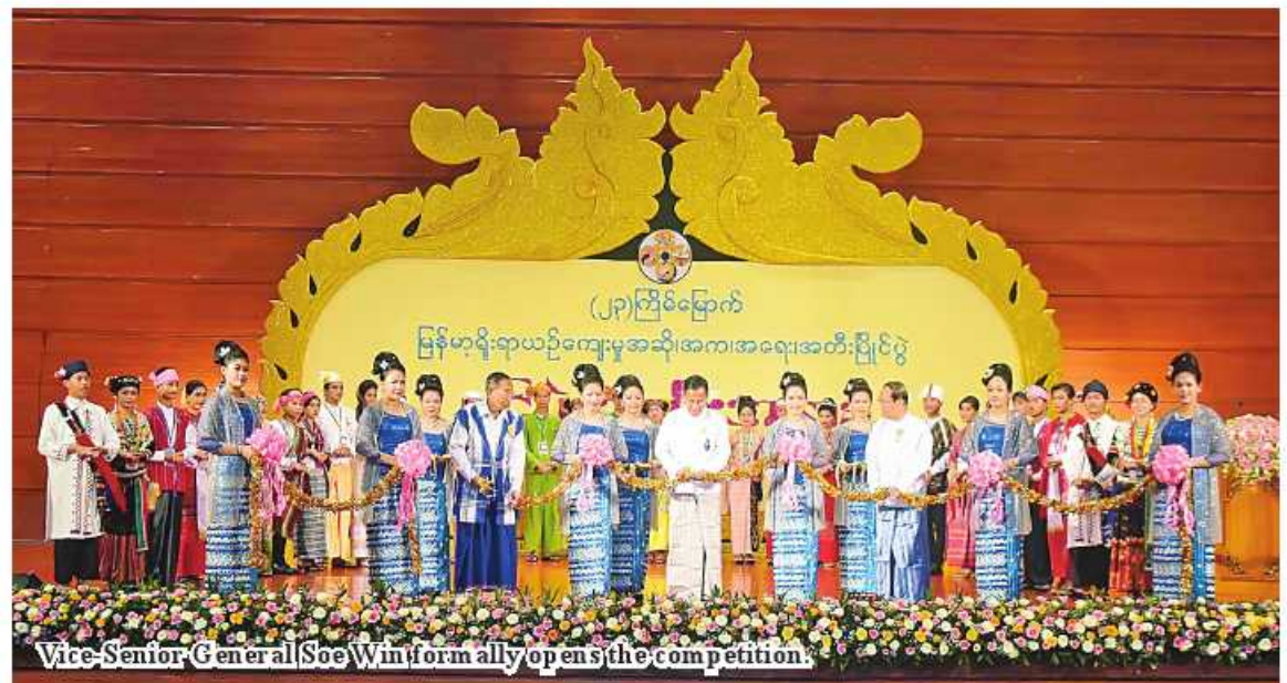
Vice-Senior-General Soe Win formally opens the competition.

The civilization of Pyu state cities along the River Ayeyawady, the lifeblood of Myanmar, is the earliest evidence. Scholars regarded the earlier Pyu Period as 200 BC, Beikthano, Maingmaw, Tagaung, Halin, and Sri Ksetra were the ancient Pyu city states of significance. Pyu people were skilled in irrigation for cultivation and various kinds of handicrafts. They were able to make coils, jewel ornaments, gold foils,