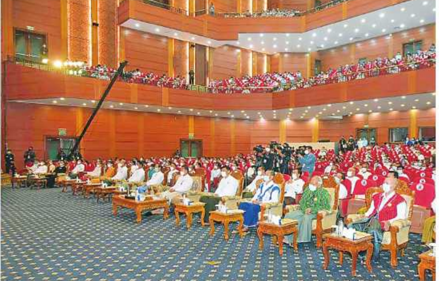
(၂၃)ကြိမ်မြောက် မြန်မာ့ရိုးရာယဉ်ကျေးမှု အဆို၊ အက၊ အရေး၊ အတီးပြိုင်ပွဲကျင်းပရေးဦးစီးကော်မတီနာယက နိုင်ငံတော်စီမံအုပ်ချုပ်ရေးကောင်စီဒုတိယဥက္ကဋ္ဌ ဒုတိယဝန်ကြီးချုပ် ဒုတိယဗိုလ်ချုပ်မှူးကြီးစိုးဝင်း (၂၃)ကြိမ်မြောက် မြန်မာ့ရိုးရာယဉ်ကျေးမှု အဆို၊ အက၊ အရေး၊ အတီးပြိုင်ပွဲဖွင့်ပွဲတွင် ဖွင့်ပွဲဂုဏ်ပြုတေးသီချင်းဖြင့် ဖျော်ဖြေတင်ဆက်မှုကို ကြည့်ရှုအားပေးစဉ်။

နေပြည်တော် အောက်တိုဘာ ၁၁ - အပြည်ပြည်ဆိုင်ရာ ကွန်ဗင်းရှင်းဗဟိုဌာန-၂၅ အုပ်ချုပ်ရေးကောင်စီဒုတိယဥက္ကဋ္ဌ ဒုတိယဝန်ကြီးချုပ် ကောင်စီဝင်များ၊ နိုင်ငံတော်ဖွဲ့စည်းပုံအခြေခံဥပဒေ (၂၃)ကြိမ်မြောက် မြန်မာ့ရိုးရာယဉ်ကျေးမှု ကိုဗစ်-၁၉ ရောဂါကာကွယ်ထိန်းချုပ်ရေးဆိုင်ရာ ဒုတိယဗိုလ်ချုပ်မှူးကြီးစိုးဝင်း တက်ရောက်အမှာ ဆိုင်ရာခုံရုံးဥက္ကဋ္ဌ၊ ပြည်ထောင်စုရွေးကောက်ပွဲ အဆို၊ အက၊ အရေး၊ အတီးပြိုင်ပွဲ ဖွင့်ပွဲအခမ်းအနား စည်းမျဉ်းစည်းကမ်းများနှင့်အညီကျင်းပရာ ပြိုင်ပွဲ စကားပြောကြားသည်။ ကော်မရှင်ဥက္ကဋ္ဌ၊ ပြည်ထောင်စုဝန်ကြီးများ၊ ကို ယနေ့နံနက် ၉ နာရီတွင် နေပြည်တော်ရှိ မြန်မာ ကျင်းပရေးဦးစီးကော်မတီနာယက နိုင်ငံတော်စီမံ အခမ်းအနားသို့ နိုင်ငံတော်စီမံအုပ်ချုပ်ရေး စာမျက်နှာ ၁၆ ကော်လံ ၁ ☆