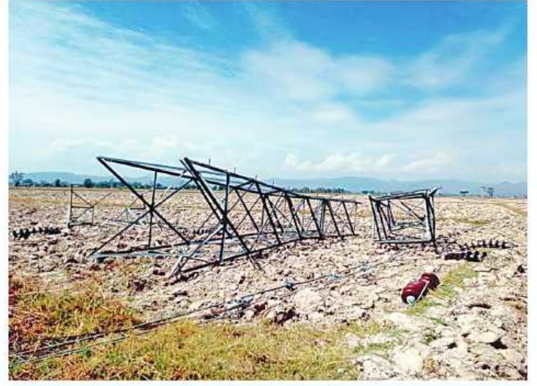
၁၃၂ ကေစီ ဘီလူးချောင်း(၂)-တီကျစ်ဓာတ်အားလိုင်း တာဝါတိုင်အမှတ် (၉၆)မှ (၁၀၉)အထိ ပြိုလဲပျက်စီးနေမှု မှတ်တမ်းဓာတ်ပုံ။