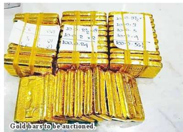
Gold bars to be auctioned.