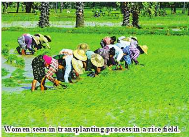
Women seen in transplanting process in a rice field.

More than K40 billion has been delivered to farmers from 23 townships in 2022—Amarapura, Patheingyi, PyinOoLwin, Madaya, Singu, Thabeikkyin, Kyaukse, Singaing, TadaU, Myittha, Meiktila, Wundwin, Mahlaing, Thazi, Myingyan, Taungtha, Natogyi, Ngazun, Yamethin, Pyawbwe, NyaungU and Kyaukpadaung townships. 185