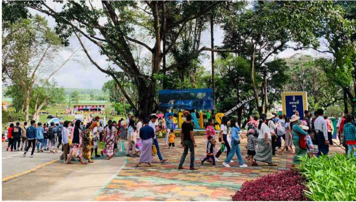
မန္တလေးတိုင်းဒေသကြီး ပြင်ဦးလွင်မြို့ရှိ ပွဲကောက်ရေတံခွန်အပန်းဖြေစခန်း ( BE.FALLS) တွင် အနယ်နယ်အရပ်ရပ်မှ လာရောက်အပန်းဖြေသူများဖြင့် စည်ကားများပြားနေမှုကိုတွေ့ရစဉ်။

ပြင်ဦးလွင် အောက်တိုဘာ ၉ မြို့ရှိ ပွဲကောက်ရေတံခွန်အပန်းဖြေစခန်း အရပ်ရပ်မှ လာရောက်အပန်းဖြေသူ မန္တလေးတိုင်းဒေသကြီး ပြင်ဦးလွင် (BE.FALLS) တွင် အနယ်နယ် များဖြင့် စည်ကားများပြားလျက်ရှိကြောင်း လည်လည်ကြည့်ရှု အပန်းဖြေရာတွင်