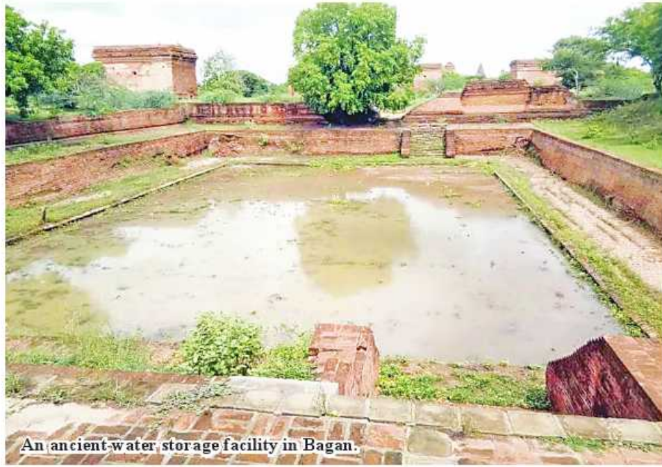
An ancient water storage facility in Bagan.