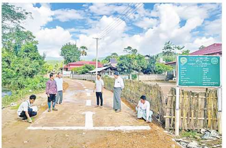
များကိုယ်တိုင် ထည့်ဝင်ငွေကျပ် ၄ ဒသမ ၁၅ သန်း အသုံး ပြုပြီးစီးပြီဖြစ်ကြောင်း စတင်ဆောင်ရွက်ခဲ့ရာ ယနေ့တွင် ၇၀ သိရသည်။ မောင်ခိုင်

နှင့်အညီ အချိန်မီပြီးစီးရေး ဆောင်ရွက် ကြရန် ဆွေးနွေးမှာကြားသည်။ အဆိုပါ ဝမ်ရဲန်းကျေးရွာတွင် ကျေးရွာ တွင်း ကွန်ကရစ်လမ်းခင်းခြင်းလုပ်ငန်းကို ကျေးရွာဖွံ့ဖြိုးတိုးတက်ရေးလုပ်ငန်းစီမံကိန်း ပံ့ပိုးရန်ပုံငွေကျပ် ၁၀ သန်း၊ ကျေးရွာပြည်သူ ထည့်ဝင်ငွေကျပ် ၄ ဒသမ ၁၅ သန်း အသုံး ပြုကာ ကျေးရွာလူထုလုပ်အားများ၊ ကျေး လက်ဒေသဖွံ့ဖြိုးတိုးတက်ရေးဦးစီးဌာနမှ ဝန်ထမ်းများ၏နည်းပညာပံ့ပိုးမှု၊ အနီးကပ် ကြီးကြပ်မှုဖြင့် ကျေးရွာသူ၊ ကျေးရွာသား