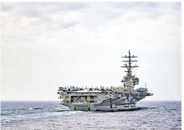
မြောက်ကိုရီးယားနိုင်ငံ၏မြို့တော်ဘက်မှ ဖျံတက်လာကာ ၂၁၇ မိုင် (ကိုလိုမီတာ ၃၅၀)နှင့် အခြားတစ်စင်းမှာ ၄၉၇ မိုင် (ကိုလိုမီတာ ၈၀၀)အကွာထိ ဖျံသန်းခဲ့ရာ ၂၂ မိနစ်ကြာမြင့်ခဲ့ကြောင်း ၎င်းတို့က ပြောကြားခဲ့သည်။ US redeploy aircraft carrier to Korea ကို တာသာပြန်ဆိုပါသည်။

အမေရိကန် လေယာဉ်တင်သင်္ဘောနှင့် ၎င်း၏ ထောက်ပံ့ရေးသင်္ဘောများကို တစ်ဖန် ပြန်လည်စေလွှတ်ခဲ့ခြင်းလည်း ဖြစ်သည်။ မြောက်ကိုရီးယားနိုင်ငံ၏ ပဲ့ထိန်းခုံးကျည်စစ်ဓားသစ်ပစ္စည်းများသည် အရှေ့ပင်လယ်ဖြစ်သည့် ဂျပန်လေပိုင်နက်ထဲသို့ ဖြတ်ကျော်ဝင်ရောက်လာသည်ကို တွေ့ရှိခဲ့ရပြီး အမေရိကန်၊ တောင်ကိုရီးယား၊ နှင့်ဂျပန်တို့က ချက်ချင်းပြစ်တင်ရှုတ်ချခဲ့ကြသည်။ မြောက်ကိုရီးယားနိုင်ငံသည် အောက်တိုဘာ ၆ ရက် အစောပိုင်းတွင် တာတိုပစ်ပဲ့ထိန်းခုံးကျည်နှစ်စင်းစမ်းသပ်ပစ်လွှတ်ခဲ့ပြီး နောက်ထပ် လက်နက်စစ်ဓားသစ်ပစ္စည်းလေယာဉ်တင် သင်္ဘောဖြန့်ကြက်တပ်စခန်းချထားမှုကို တုံ့ပြန်ခဲ့ကြောင်း တောင်ကိုရီးယား စစ်ဘက်တာဝန်ရှိသူများက ပြောကြားခဲ့သည်။ ခုံးကျည်တစ်စင်းသည်