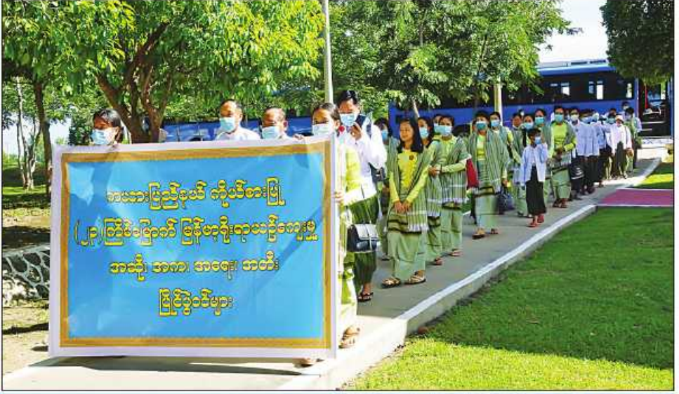
(၂၃)ကြိမ်မြောက် မြန်မာ့ရိုးရာယဉ်ကျေးမှု အဆိုအက၊အရေးအတီးပြိုင်ပွဲသို့ ဝင်ရောက်ယှဉ်ပြိုင်ကြမည့် တိုင်းဒေသကြီးနှင့် ပြည်နယ်ကိုယ်စားပြု ပြိုင်ပွဲဝင်အဖွဲ့များ နေပြည်တော်သို့ ရောက်ရှိလာကြစဉ်။

နေပြည်တော် အောက်တိုဘာ ၉ ယနေ့နံနက်ပိုင်းမှစတင်၍ တည်းခိုနေထိုင်ကြမည့် များက ကိုဗစ်-၁၉ ရောဂါစစ်ဆေးခြင်းများဆောင် စေရေးအတွက် ပြင်ဆင်ဆောင်ရွက်ပေးကြသည်။ ၂၀၂၂ ခုနှစ် (၂၃)ကြိမ်မြောက် မြန်မာ့ရိုးရာ နေပြည်တော်စစ်ကြောင်းရေးနှင့် တည်းခိုရေစခန်းသို့ ရွက်ပေးပြီး သတ်မှတ်ထားသည့်တည်းခိုဆောင်များ (၂၃)ကြိမ်မြောက် မြန်မာ့ရိုးရာယဉ်ကျေးမှု ယဉ်ကျေးမှု အဆို၊ အက၊ အရေး၊ အတီးပြိုင်ပွဲသို့ အလိုက် နေရာချထားပေးကာ စုဖွဲ့ပေးထားသည့် အဆို၊ အက၊ အရေး၊ အတီးပြိုင်ပွဲသို့ ဝင်ရောက် ဝင်ရောက်ယှဉ်ပြိုင်ကြမည့် တိုင်းဒေသကြီးနှင့် ပြည်နယ် ဆက်ကော်မတီများအလိုက် တာဝန်ရှိသူများက ယှဉ်ပြိုင်ကြမည့် တိုင်းဒေသကြီးနှင့် ပြည်နယ် ပြည်နယ်ကိုယ်စားပြု ပြိုင်ပွဲဝင်အဖွဲ့များသည် များကို ပြည်သူ့ကျန်းမာရေးဦးစီးဌာနမှ ဝန်ထမ်း ပြိုင်ပွဲဝင်များ နေထိုင်စားသောက်ရေး အဆင်ပြေ ကိုယ်စားပြု စာမျက်နှာ ၁၆ ကော်လံ ၄ ☆