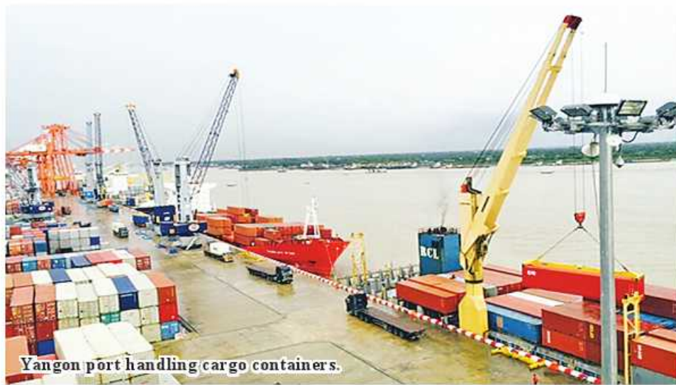
Yangon port handling cargo containers.