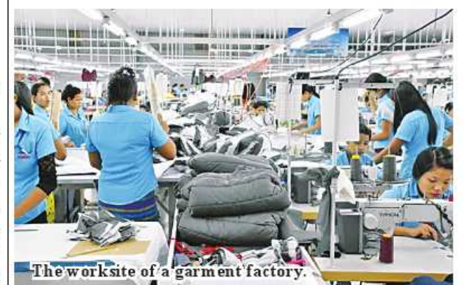
The worksite of a garment factory.

The association distributes the fuel to regions and states depending on the volume of inventory of fuel. Some regions and states are importing fuel through border land. ASH