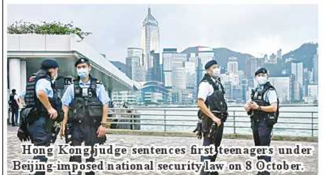
Hong Kong judge sentences first teenagers under Beijing-imposed national security law on 8 October.

The judge also capped the length of their sentence to three years. How long they remain in custody will remain at the discretion of authorities. BBC