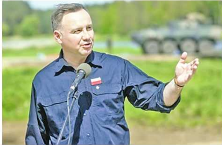
ရုရှားနိုင်ငံ၏ ခြိမ်းခြောက်မှုတိုးလာနေသည့်အခြေအနေတွင် ပိုလန်နိုင်ငံသည် ၎င်း၏ပိုင်နက်ပေါ်တွင် အမေရိကန် ဗျူကလီးယားလက်နက်များ တပ်ဖြန့်မည် အကြောင်း အမေရိကန်နှင့်ဆွေးနွေးမှုများ ပြုလုပ်ခဲ့သည်ဟု ပိုလန်နိုင်ငံသမ္မတ An-

drzej Duda က ပြောကြားလိုက်သည်။ “အဓိကပြဿနာက ဗျူကလီးယားလက်နက် မပိုင်ဆိုင်တာပါ။ မဝေးတော့ တဲ့အနာဂတ်မှာ ပိုလန်နိုင်ငံအနေနဲ့ ဗျူကလီးယားပိုင်ဆိုင်နိုင်ဖို့ အရိပ်အယောင် မရှိဘူး။ အမေရိကန်အနေနဲ့ ဒီလိုဖြစ်နိုင်ခြေကို စဉ်းစားပေးနေသလားဆိုတာ အမေရိကန် ခေါင်းဆောင်တွေနဲ့ စကားပြောပြီးပါပြီ။ ပွင့်ပွင့်လင်းလင်းပြောရမဲ့ကိစ္စဖြစ်ပြီး သူတို့ဘက်က တံခါးဖွင့်ထားဆဲပါ”ဟု Duda က အောက်တိုဘာ ၅ ရက်တွင် Gazeta Polska သတင်းဌာနနှင့် တွေ့ဆုံမေးမြန်းခန်းတွင် ပြောကြားခဲ့သည်။ သို့သော် အိမ်ဖြူတော်သည် ဤပြဿနာပေါ်ပေါက်လာသည်ကို သတိမထားမိသေးပါဘူးဟု အမေရိကန်အရာရှိ