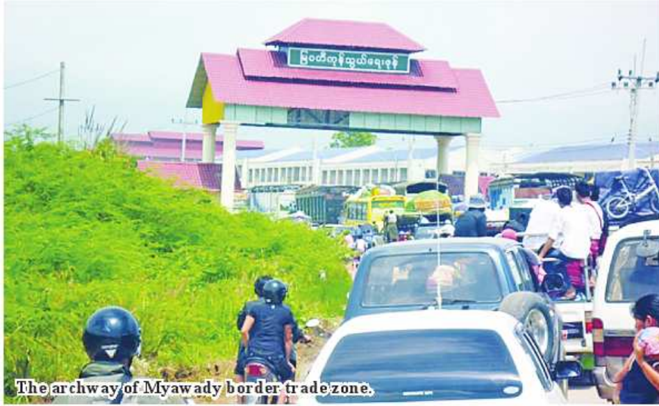
The archway of Myawady border trade zone.

Nay Pyi Taw December 28 Myanmar's border trade camps could handle trade volume with more than US$1.7 billion of trade surplus within eight month period in 2023-24 financial year, according to the Ministry of Commerce. Myanmar operates border