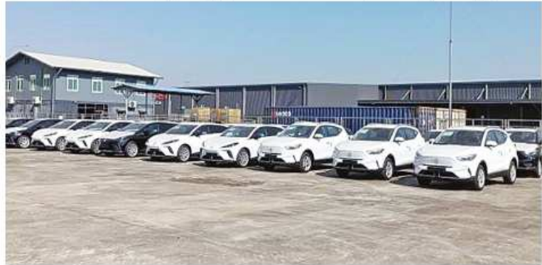
မော်တော်ယာဉ်များသည် ရန်ကုန်ဆိပ်ကမ်း လုပ်နည်းနှင့်အညီ ထုတ်ယူခွင့်ပြုခဲ့ကြောင်း သို့ရောက်ရှိလာရာ ယနေ့တွင် လုပ်ထုံး သတင်းရရှိသည်။ (သတင်းစဉ်)

နေပြည်တော် ဒီဇင်ဘာ ၂၀ အမျိုးသားအဆင့်လျှပ်စစ်သုံးယာဉ်နှင့် ဆက်စပ်လုပ်ငန်းများ ဖွံ့ဖြိုးတိုးတက်ရေး ဦးဆောင်ကော်မတီ၏ ခွင့်ပြုချက်ဖြင့် Innogen Myanmar Co., Ltd က တင်သွင်းလာသော တရုတ်နိုင်ငံထုတ် GAC Toyota BZ4X အမျိုးအစား လျှပ်စစ်သုံး မော်တော်ယာဉ်များ၊ NPK Motors Co., Ltd က တင်သွင်းလာသော တရုတ်နိုင်ငံထုတ် MG, MGZSEV နှင့် MG, MG4 (Mulan) အမျိုးအစား လျှပ်စစ်သုံး