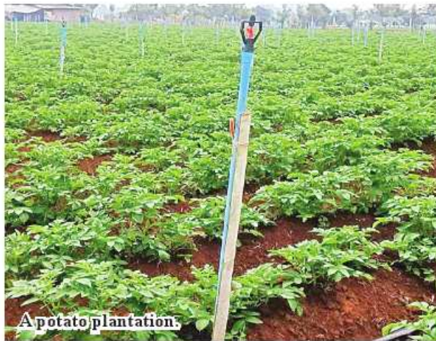
A potato plantation.

In the previous 2021-2022 winter crop growing season, 640 acres were grown in Mawlaik District, 585 acres in Tamu District, 145