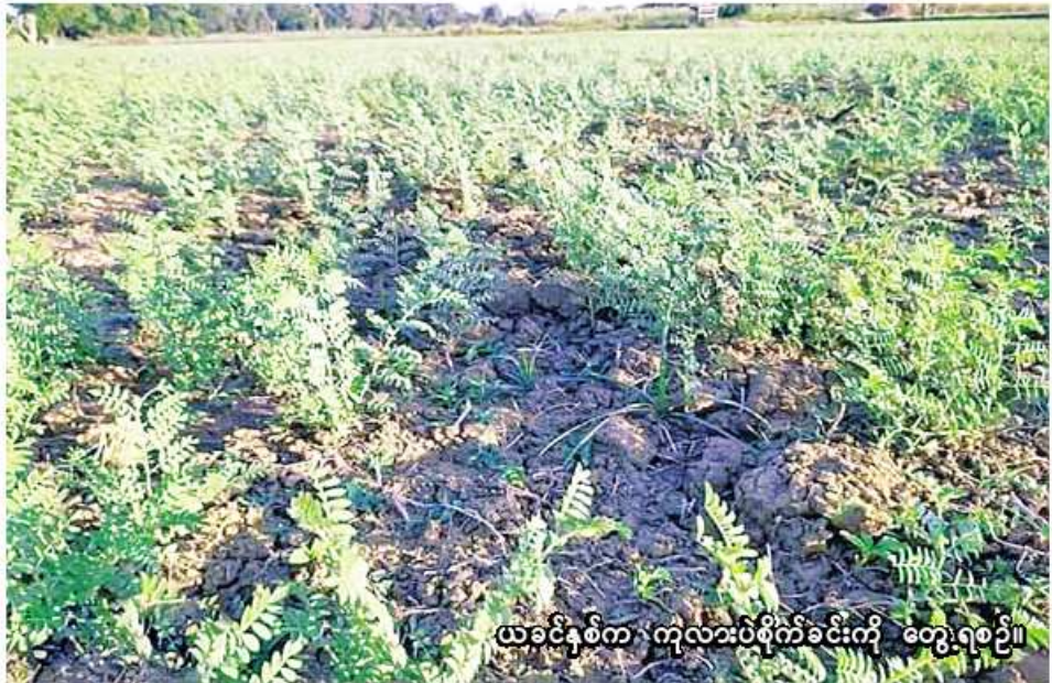
ယခင်နှစ်က ကုလားပဲစိုက်ခင်းကို တွေ့ရစဉ်။