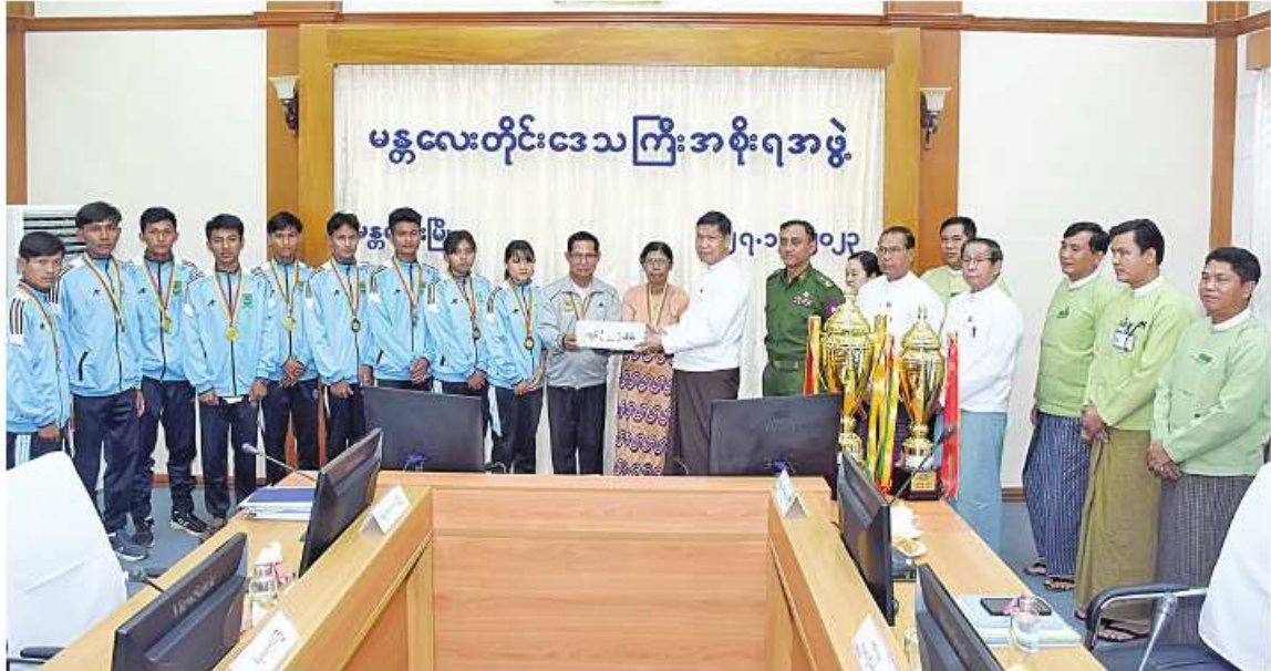
မန္တလေး ဒီဇင်ဘာ ၂၀ ၂၀၂၃-၂၀၂၄ ပညာသင်နှစ် ပညာရေးဒီဂရီကောလိပ်ပေါင်းစုံအားကစားပြိုင်ပွဲတွင် တံခွန်စိုက်ဆုရရှိခဲ့သည့် မန္တလေးရန်ကင်းအားကစားသမားများကို မန္တလေးတိုင်းဒေသကြီးအစိုးရအဖွဲ့က ထပ်ဆင့်ဂုဏ်ပြုအဖွဲ့ရုံး နှစ်ထပ်ဆောင်အစည်းအဝေးခန်းမ ခြင်းအခမ်းအနားကို ဒီဇင်ဘာ ၂၇ ရက် ညနေပိုင်းက မန္တလေးတိုင်းဒေသကြီးအစိုးရအဖွဲ့ရုံး နှစ်ထပ်ဆောင်အစည်းအဝေးခန်းမ