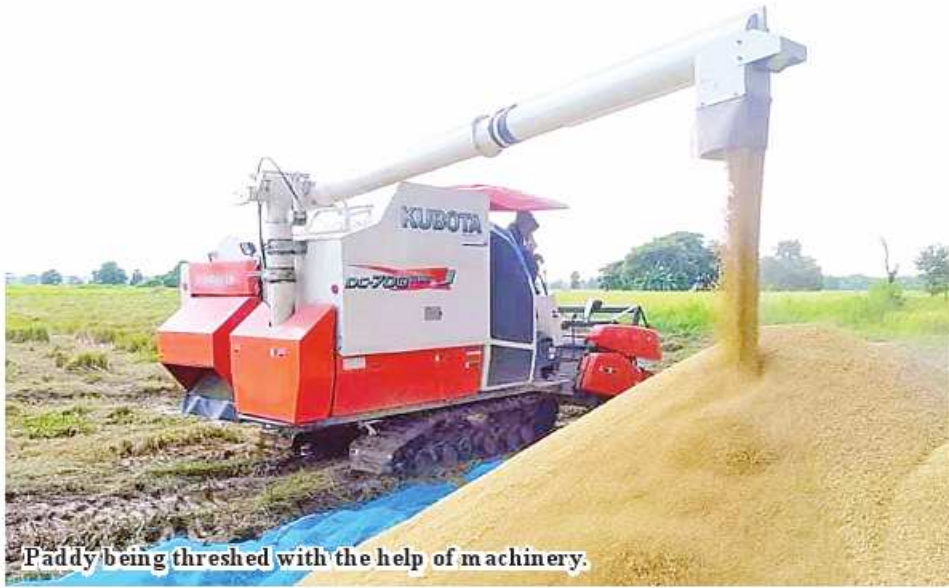
Paddy being threshed with the help of machinery.

Patheingyi December 28 Paddy was harvested starting from the second week of October this year, and so far they have harvested 317,805 acres. The monsoon paddy was harvested starting from the second week of October this year, and so far they have harvested 317,805 acres.