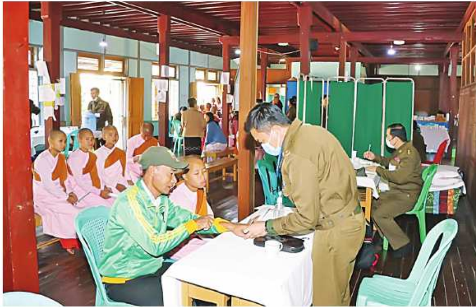
သာသနာ့ဇွယ်ဝင် သီလရှင်များအား အလယ်ပိုင်းတိုင်း ဝန်ဌာနချုပ် နယ်လှည့်ဆေးကုသရေးအဖွဲ့က ကျန်းမာရေးစောင့်ရှောက်မှု လုပ်ငန်းများ ဆောင်ရွက်ပေးစဉ်။

နေပြည်တော် ဒီဇင်ဘာ ၂၀ - သက်ဆိုင်ရာ တိုင်းစစ်ဌာနချုပ်အသီးသီးမှ နယ်လှည့်ဆေးကုသရေး အဖွဲ့များက လိုအပ်သည့် ကျန်းမာရေးစောင့်ရှောက်မှု လုပ်ငန်းများ ဆောင်ရွက်ပေးလျက်ရှိရာ