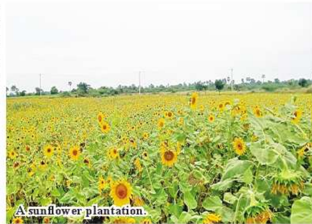
A sunflower plantation.

For the 2023-2024 fiscal year, 2,930 acres of sunflowers have been cultivated in YeU District. According to the township-wise cultivation plan for sunflower this fiscal year, there will be 3,698 acres in YeU Township and 3,187 acres in Debayin Township, totaling 15,184 acres.