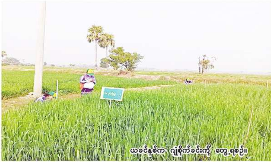
ယင်းမာပင်ခရိုင်တွင် ဂျုံစိုက်ခင်းကို တွေ့ရစဉ်။

ယင်းမာပင် ဒီဇင်ဘာ ၂၀ စစ်ကိုင်းတိုင်းဒေသကြီး ယင်းမာပင်ခရိုင်တွင် ယခုနှစ် ဆောင်းသီးနှံ စိုက်ပျိုးရာသိ၌ ဂျုံ ၂၉၃၄ ဧက စိုက်ပျိုးပြီးစီးပြီဖြစ်ကြောင်း ယင်းမာပင်ခရိုင် စိုက်ပျိုးရေးဦးစီးဌာနမှ သိရသည်။ ယင်းမာပင်ခရိုင်တွင် ယခုနှစ် ဆောင်းသီးနှံ စိုက်ပျိုးရာသိ၌ ဂျုံ