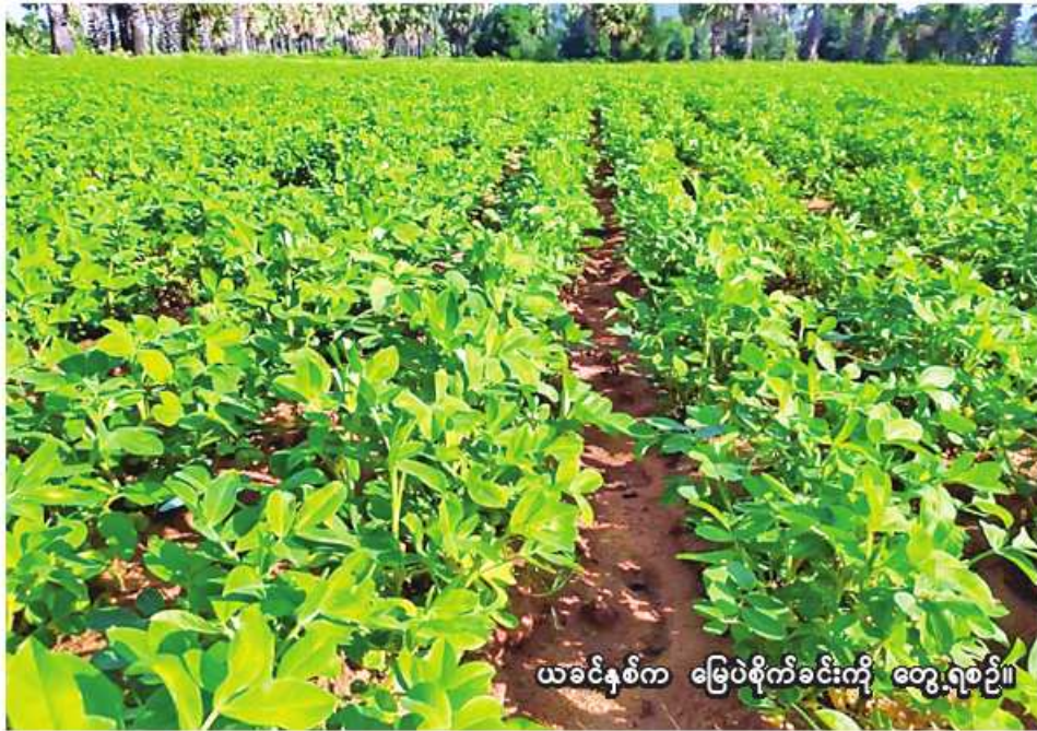
ယခင်နှစ်က မြေပဲစိုက်ခင်းကို တွေ့ရစဉ်။