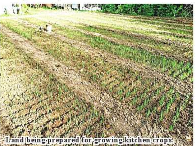
Land being prepared for growing kitchen crops.