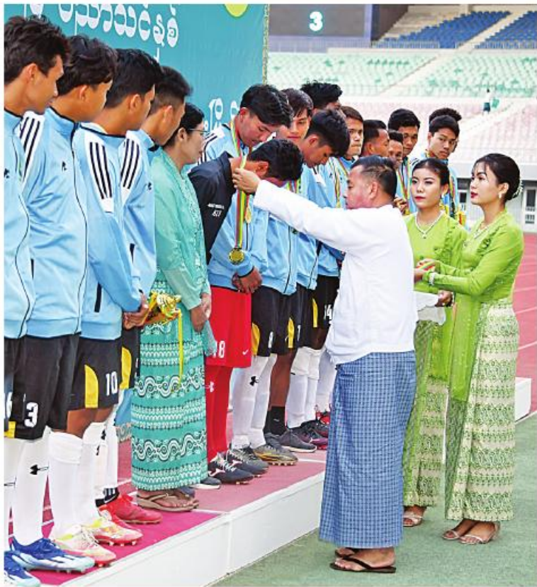
နိုင်ငံတော်စီမံအုပ်ချုပ်ရေးကောင်စီ တွဲဖက်အတွင်းရေးမှူး ဒုတိယဗိုလ်ချုပ်ကြီးရဲဝင်းဦး ပထမဆုရရှိသည့် မန္တလေးစုန်(ခ)အသင်းအား တစ်ဦးချင်းဆုတံဆိပ်များကို ပေးအပ် ချီးမြှင့်စဉ်။

၂၃ ရှေ့မှူးမှအဆက် တပ်မတော် အဆင့်မြင့်အရာရှိကြီးများ၊ ဒုတိယဝန်ကြီးများ၊ နေပြည်တော်ကောင်စီ ဝင်များ၊ အမြဲတမ်းအတွင်းဝန်များ၊ ညွှန်ကြားရေးမှူးချုပ်များ၊ ပါမောက္ခချုပ် များ၊ ဒုတိယညွှန်ကြားရေးမှူးချုပ်များ၊ ပြိုင်ပွဲကျင်းပရေးကော်မတီဝင်များနှင့်တာဝန် ရှိသူများ၊ ပြိုင်ပွဲဝင်အသင်းများမှ အုပ်ချုပ် သူနှင့် နည်းပြများ၊ အားကစားသမားများ၊ ပညာရေးဒီဂရီကောလိပ်များမှ ကျောင်းသား၊ ကျောင်းသူများနှင့် ဆရာ၊ ဆရာမများ၊ ဝန်ကြီး ဌာနများမှ ဝန်ထမ်းမိသားစုများ၊ အားကစား