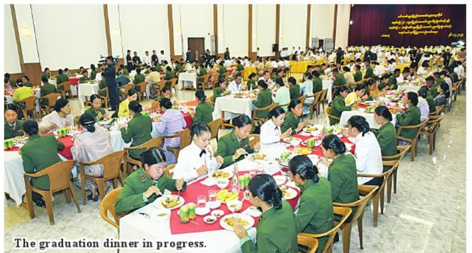
The graduation dinner in progress.