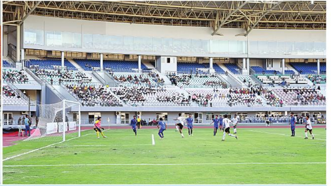
နိုင်ငံတော်စီမံအုပ်ချုပ်ရေးကောင်စီဥက္ကဋ္ဌ နိုင်ငံတော်ဝန်ကြီးချုပ် ဗိုလ်ချုပ်မှူးကြီးမင်းအောင်လှိုင် ၂၀၂၃-၂၀၂၄ ပညာသင်နှစ် ပညာရေးဒီဂရီကောလိပ်ပေါင်းစုံအားကစားပြိုင်ပွဲ အမျိုးသားဘောလုံးပြိုင်ပွဲ၏ နောက်ဆုံးပိုင်းလှည့်ပွဲဖြစ် မန္တလေးစုန်(က)အသင်းနှင့် မန္တလေးစုန်(ခ)အသင်းတို့ ယှဉ်ပြိုင်ကစားမှုကို ကြည့်ရှုအားပေးစဉ်။