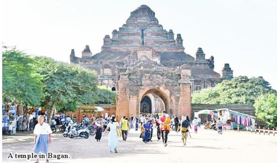
A temple in Bagan.