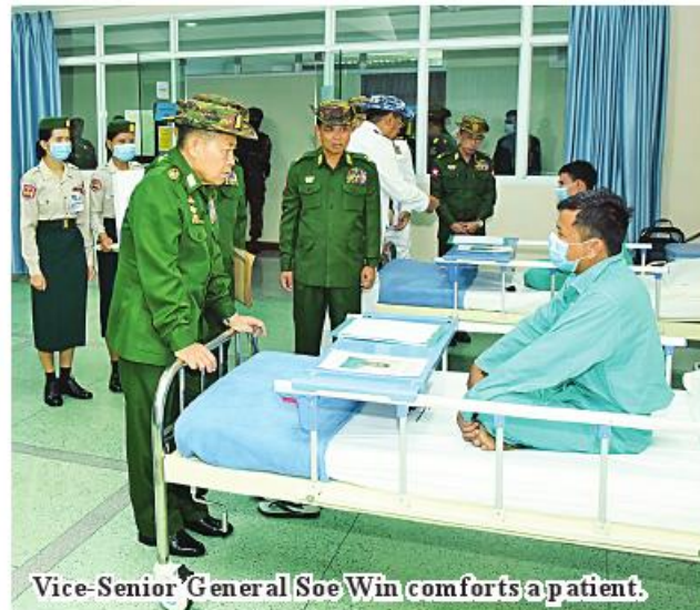
Vice-Senior General Soe Win comforts a patient.

of their health condition and comforted them. They provided the patients with foodstuffs.