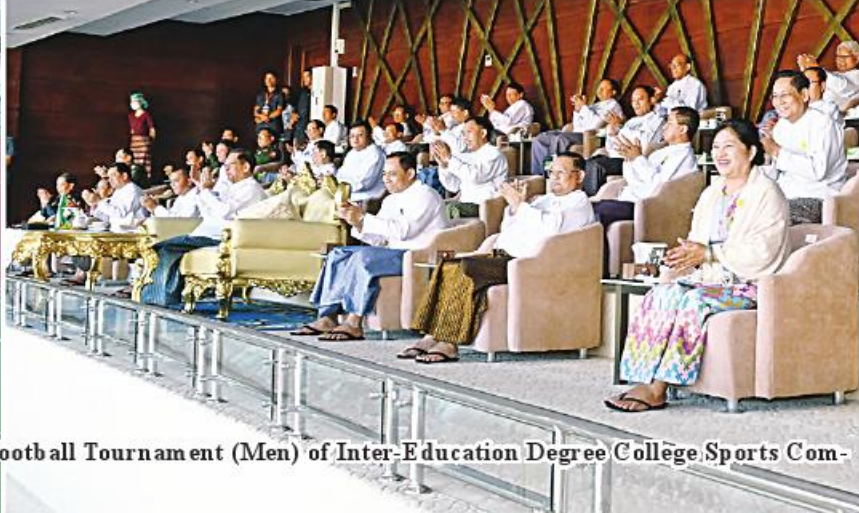
Senior General Min Aung Hlaing watches the final match of Football Tournament (Men) of Inter-Education Degree College Sports Competition.