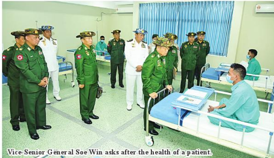
Vice-Senior General Soe Win asks after the health of a patient.