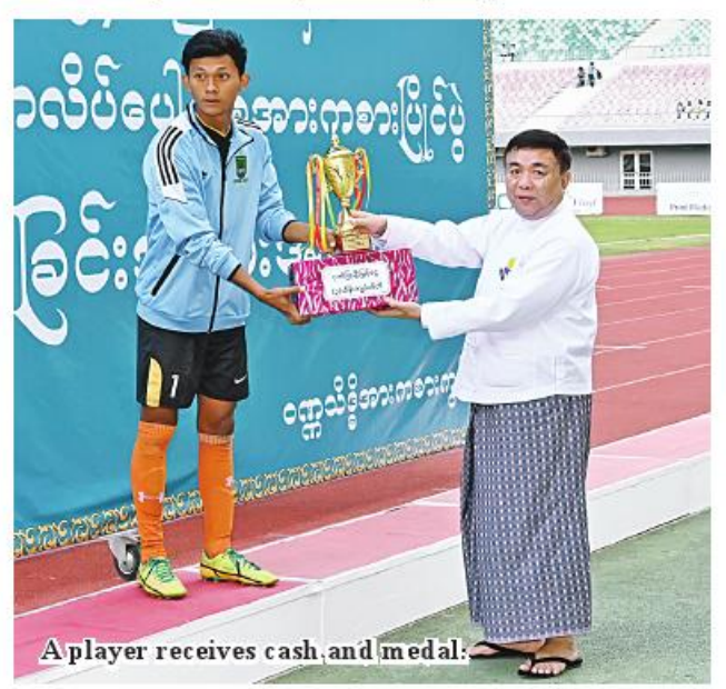
A player receives cash and medal.

After the award ceremony, the Senior General and party cordially greeted the competing athletes. 100