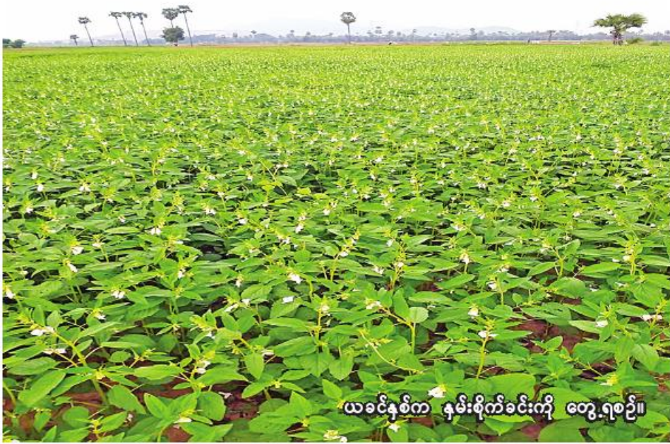
ယခင်နှစ်က နှမ်းစိုက်ခင်းကို တွေ့ရစဉ်။