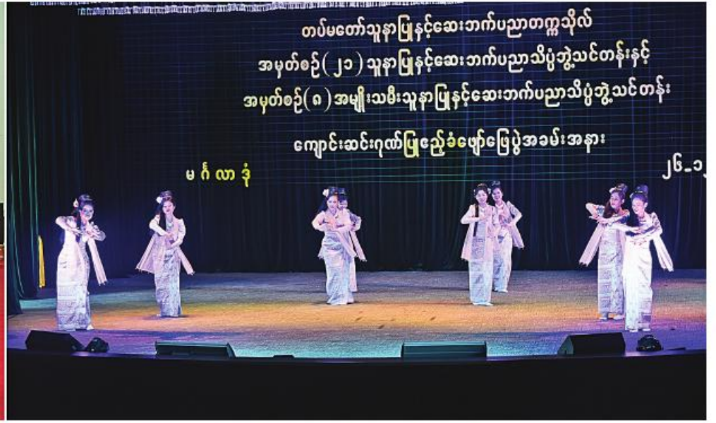
နိုင်ငံတော်စီမံအုပ်ချုပ်ရေးကောင်စီ ဒုတိယဥက္ကဋ္ဌ ဒုတိယတပ်မတော်ကာကွယ်ရေးဦးစီးချုပ် ကာကွယ်ရေးဦးစီးချုပ်(ကြည်း) ဒုတိယဗိုလ်ချုပ်မှူးကြီးစိုးဝင်း၊ ဧည့်သည် သူနာပြုများနှင့်အတူ ဖြည့်သွင်းဆက်ဆံရေးနှင့် စိတ်ဓာတ်စစ်ဆေးရေးညွှန်ကြားရေးမှူးရုံး ကွပ်ကဲမှုအောက် မြဝတီတေးဂီတအဖွဲ့၏ ဂုဏ်ပြုဖော်ပြတင်ဆက်မှုများကို ကြည့်ရှုအားပေးစဉ်။

စာမျက်နှာ ၁၇ မှအဆက် လူနာများအပေါ် ကုသမှုပေးရာတွင် မှန်ကန် ထိရောက်မှုရှိသည် စစ်ဆေးဖော်ထုတ်မှုများ နှင့် ကောင်းမွန်ပြည့်စုံသည့် ကျန်းမာရေး ပြုစုစောင့်ရှောက်ကုသမှုများ ပေးနိုင်ရန် အတွက်စဉ်ဆက်မပြတ် လေ့လာဆည်းပူး နေရမည်ဖြစ်ကြောင်း၊ ထို့ပြင် မိမိတို့ တတ်ကျွမ်းထားသည့် အထူးပြုဘာသာရပ် အလိုက် သုတေသနလုပ်ငန်းများကို ဆက်လက် ဆောင်ရွက်နေရမည်အပြင် လူနာများ၏ ကောင်းကျိုးအတွက် အခြား သော ဆေးပညာရပ်ဌာနများနှင့် ပူးပေါင်း ဆောင်ရွက်ကာ ပြီးပြည့်စုံသည့် ကုသမှုများ ပေးသွားကြရန်လိုအပ်ကြောင်း၊ တာဝန်ကျ ရာနယ်မြေ ဒေသအသီးသီးကို ရောက်ရှိ သွားရန်တွင် တပ်မတော်သားများနှင့် မိသားစုဝင်များကိုသာမက ဒေသတွင်း ပြည်သူလူထု၏ ကျန်းမာရေးစောင့်ရှောက် မှုလုပ်ငန်းများကိုပါ ဆောင်ရွက်သွားကြ ရမည်ဖြစ်ကြောင်း၊ ထိုသို့ဆောင်ရွက်သည့် နေရာတွင် စေတနာ့အညီပြောင်းလဲနေသည့် ဆေးပညာရပ်များကို ဆက်လက်လေ့လာ ဆည်းပူးကာ ကျန်းမာရေးစောင့်ရှောက်မှု လုပ်ငန်းစဉ်ဖြစ်သည့် ပြုစုကုသရေး၊ ရောဂါရှာဖွေရေး၊ တားဆီးကာကွယ်ရေး၊ ကျန်းမာရေး မြှင့်တင်ပေးရေးနှင့်ပြန်လည် သန်စွမ်းရေးလုပ်ငန်းစဉ်များကို မေတ္တာ ဓေတနာ အရင်းခံပြီး နိုင်ငံသားကောင်း ဆေးဝန်ထမ်းတပ်ဖွဲ့ဝင်များပီပီ ကျောသား၊ ရင်သားမခွဲဖြားဘဲ စိတ်ကောင်းစေတနာ ကောင်းများဖြင့် ဆောင်ရွက်ပေးသွားကြရန် တိုက်တွန်းမှာကြားလိုကြောင်း။