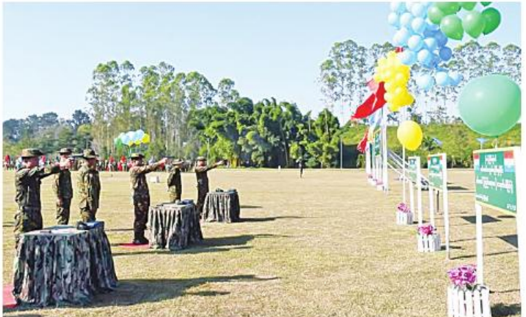
(၆၁) ကြိမ်မြောက် တပ်မတော်ကာကွယ်ရေးဦးစီးချုပ်ခိုင်း တပ်မတော် (ကြည်း၊ ရေ၊ လေ) သေနတ်ပစ်ပျံင်ပွဲ ဖွင့်ပွဲကျင်းပစဉ်။

တိုင်းစစ်ဌာနချုပ် ကိုယ်စားပြု အမျိုးသမီး အသင်းတို့၏ ထိလဲပြားပစ်ခတ်စဉ် သရုပ်ပြပစ်ခတ်ခြင်းကို ကြည့်ရှုအားပေး ကြပြီး ဂုဏ်ပြုဆုငွေများ ချီးမြှင့်ပေး အပ်သည်။ အဆိုပါ (၆၁) ကြိမ်မြောက် တပ်မတော် ကာကွယ်ရေးဦးစီးချုပ်ခိုင်း တပ်မတော် (ကြည်း၊ ရေ၊ လေ) သေနတ်ပစ်ပျံင်ပွဲကို ပြိုင်ပွဲဝင်အသင်း ၂၈ သင်းဖြင့် ၂၀၂၄ ခုနှစ် ဇန်နဝါရီ ၆ ရက်ထိ ယှဉ်ပြိုင်ပစ်ခတ်သွား မည်ဖြစ်ကြောင်း သတင်းရရှိသည်။