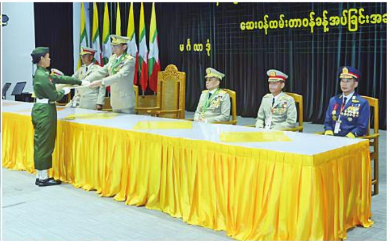
ကာကွယ်ရေးဦးစီးချုပ်ရုံး(ကြည်း) စစ်ရေးချုပ် ဒုတိယဗိုလ်ချုပ်ကြီးစိုးမင်းဦးက ကျောင်းဆင်း သင်တန်းသား၊ သင်တန်းသူ တစ်ဦးချင်းစီအား ဆေးဝန်ထမ်းတာဝန် ခန့်အပ်လွှာများ ပေးအပ်စဉ်။

နေပြည်တော် ဒီဇင်ဘာ ၂၆ တပ်မတော်သူနာပြုနှင့် ဆေးဘက် ပညာတက္ကသိုလ် သူနာပြုနှင့် ဆေးဘက် ပညာသိပ္ပံဘွဲ့သင်တန်း အမှတ်စဉ်(၂၁)နှင့်