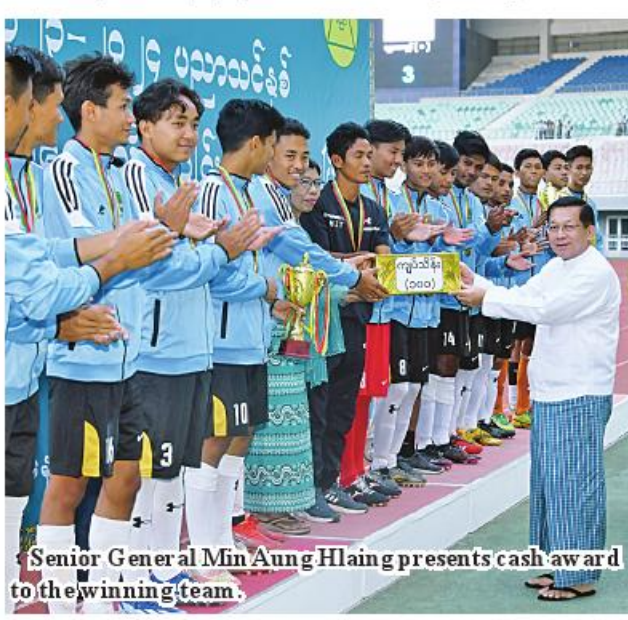
Senior General Min Aung Hlaing presents cash award to the winning team.

sure on each other and at the 59th minute of the game, Mandalay Zone (A) scored the first equalizing goal and scored the second equalizing goal in the 74th minute. However, at the end of 90 minutes, Mandalay Zone (B) won the Mandalay Zone (A) by 3-2,