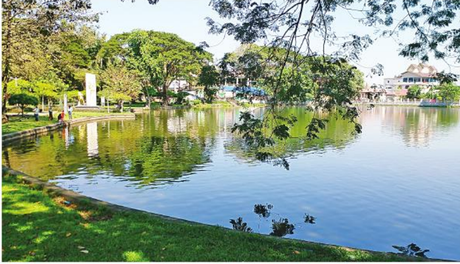
ရွှေတိဂုံစေတီမြောက်ဘက်မုခ်ရို သွေးဆေးကန်ကို တွေ့ရစဉ်။

တစ်ချိန်က မွန်တိုင်းရင်းသားများနေထိုင်ခဲ့သည့် တံငါရွာငယ်နေရာ၌ ၁၇၅၅ ခုနှစ် မေ ၂ ရက်တွင် အလောင်းမင်းတရား ဦးအောင်လေယျက ၇၅ ကေ ကျယ်ဝန်းသော မြို့သစ်ကိုတည်ကာ ရန်ကုန်ဟုအမည် ပေးခဲ့သည်။ ရန်ကုန်မြို့သည် နှစ် ၂၇၀ နီးပါးအတွင်း အဆင့်ဆင့်တိုးတက်ဖွံ့ဖြိုးခဲ့ရာ လက်ရှိအချိန်တွင် ကမ္ဘာ့အဆင့်မီမြို့ကြီးတစ်မြို့အဖြစ် ထင်ရှားလျက်ရှိ နေပေသည်။