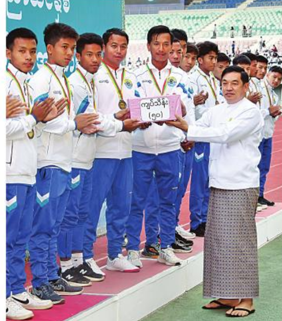
နိုင်ငံတော်စီမံအုပ်ချုပ်ရေးကောင်စီအဖွဲ့ဝင် ဒုတိယဗိုလ်ချုပ်ကြီး ညိုစော တတိယဆုရရှိသည့် ရန်ကုန်စုန်(က)အသင်းကို တစ်ဦးချင်း ဆုတံဆိပ်များနှင့် ဂုဏ်ပြုဆုငွေများ ပေးအပ်ချီးမြှင့်စဉ်။

ပိုင်းကို ဆက်လက်ယှဉ်ပြိုင်ကစားကြရာ ပွဲကစားချိန် မိနစ် ၅၀ တွင် မန္တလေးစုန် (ခ)အသင်းက တတိယဂိုးကို ထပ်မံသွင်းယူ နိုင်ခဲ့သည်။ ယင်းနောက် တစ်ဖက်နှင့်တစ်ဖက် အပြန်အလှန်ပိအားပေးကစားကြပြီး ပွဲကစား ချိန် ၅၉ မိနစ်တွင် မန္တလေးစုန်(က)အသင်း က ပထမဆုံးချေပဂိုးကို ပြန်လည်သွင်းယူ နိုင်ခဲ့ပြီး ပွဲကစားချိန် ၇၄ မိနစ်တွင် ဒုတိယ ချေပဂိုးကို စာမျက်နှာ ၂၀ သို့