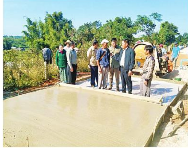
မြို့ထက်အောင်(ပျော်ဘွယ်)

ဘာလပထမပတ်က စတင် ဆောင်ရွက်ခဲ့ရာ ယခုအခါ လုပ်ငန်းများ ၇၀ ရာခိုင်နှုန်းပြီးစီးပြီဖြစ်ကြောင်း လားရှိုးမြို့နယ် ကျေးလက်ဒေသဖွံ့ဖြိုးတိုးတက်ရေး ဦးစီးဌာနမှ သိရသည်။