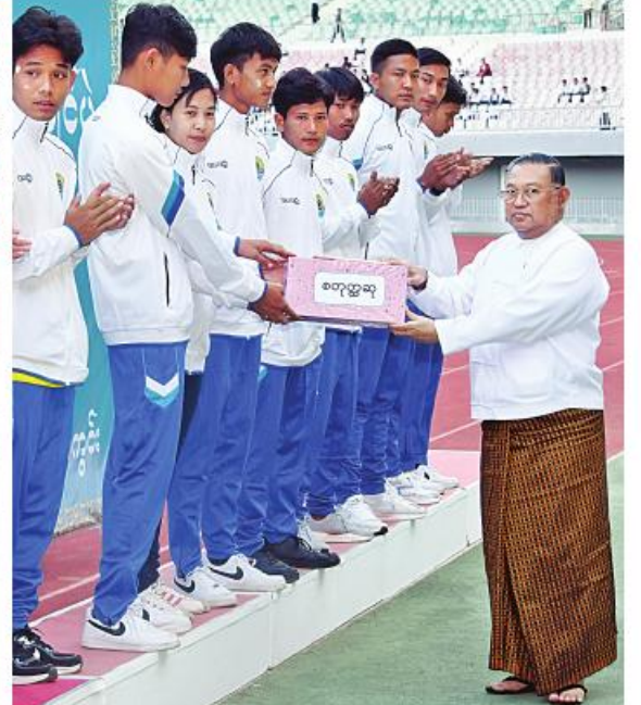
နိုင်ငံတော်စီမံအုပ်ချုပ်ရေးကောင်စီအဖွဲ့ဝင် ဦးဝဏ္ဏမောင်လွင် နှစ်သိမ့်ဆုရရှိသည့် ရန်ကုန်စုန်(ခ)အသင်းကို ဂုဏ်ပြုဆုငွေများ ပေးအပ်ချီးမြှင့်စဉ်။