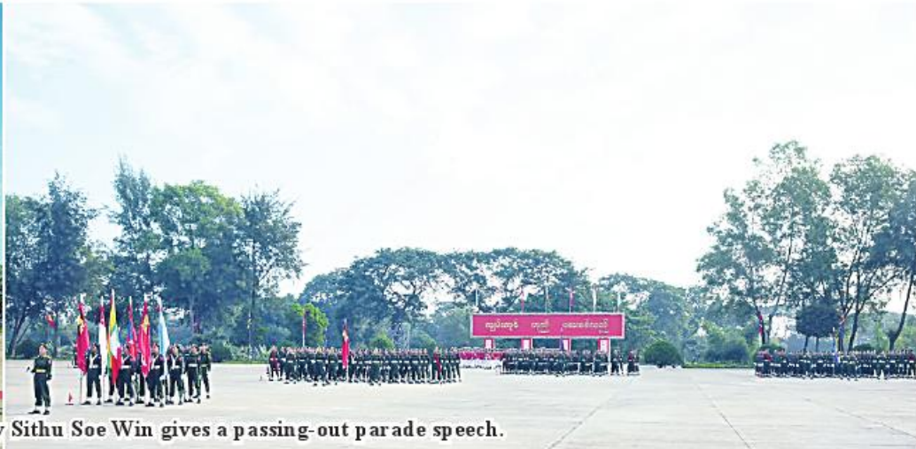
Vice-Senior General Thiri Pyanchi Maha Thray Sithu Soe Win gives a passing-out parade speech.