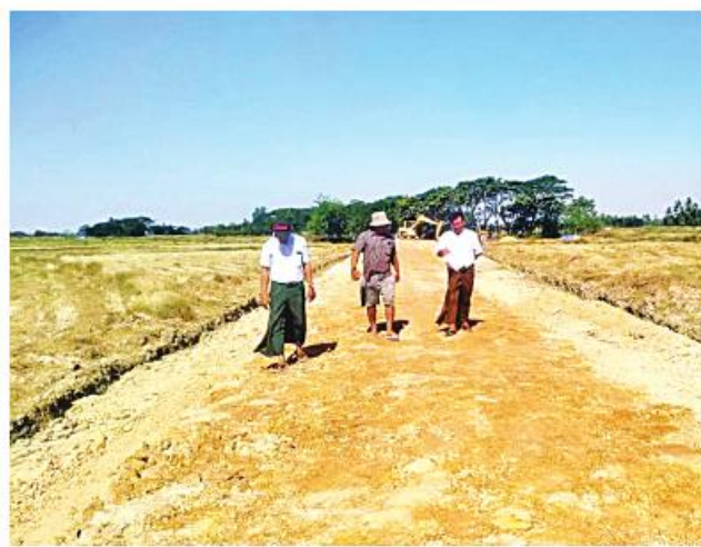
ကျော်စောဦး(မောရမ်းမြေ)

၁၂ ပေ၊ အမြင့် ကိုးလက်မရှိ ကုန်ထုတ်လမ်းဂဝံကျောက်ခင်းခြင်းလုပ်ငန်းကို တင်ဒါအောင်မြင်သည့် Ayar Princess ကုမ္ပဏီက ယခုနှစ် ဒီဇင်ဘာလ ၃ တိယပတ်တွင် စတင်ဆောင်ရွက်ခဲ့ရာ ယခုအခါ လုပ်ငန်းများ ၃၅ ရာခိုင်နှုန်းပြီးစီးပြီဖြစ်ကြောင်း၊ အဆိုပါဂဝံကျောက်ခင်းခြင်းလုပ်ငန်း ဆောင်ရွက်ပြီးစီးပါက ထန်းတပင်ကျေးရွာမှ ဒေသခံပြည်သူများ ရာသီမရွေး သွားလာအသုံးပြုနိုင်မည်ဖြစ်ကာ ဒေသထွက်ကုန်ပစ္စည်းများကိုလည်း ကုန်ကျစရိတ်သက်သာစွာဖြင့် ဈေးကွက်သို့ တင်ပို့ရောင်းချနိုင်မည်ဖြစ်ကြောင်း ကျေးမျိုးမြို့နယ် ကျေးလက်ဒေသဖွံ့ဖြိုးတိုးတက်ရေးဦးစီးဌာနမှ သိရသည်။