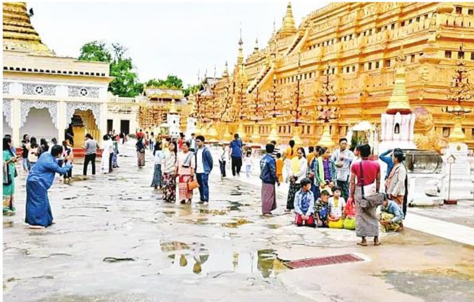
ညောင်ဦး ဒီဇင်ဘာ ၂၆

မန္တလေးတိုင်းဒေသကြီး ညောင်ဦးမြို့နယ် ပုဂံရှေးဟောင်းယဉ်ကျေးမှုနယ်မြေသို့ ခရစ္စမတ်ပိတ်ရက်တွင် အနယ်နယ်အရပ်ရပ်မှ ဘုရားဖူးပြည်သူဦးရေ ၂၀၀၀၀ ကျော် လာရောက်ခဲ့ကြောင်း ဟိုတယ်နှင့် ခရီးသွားညွှန်ကြားမှု