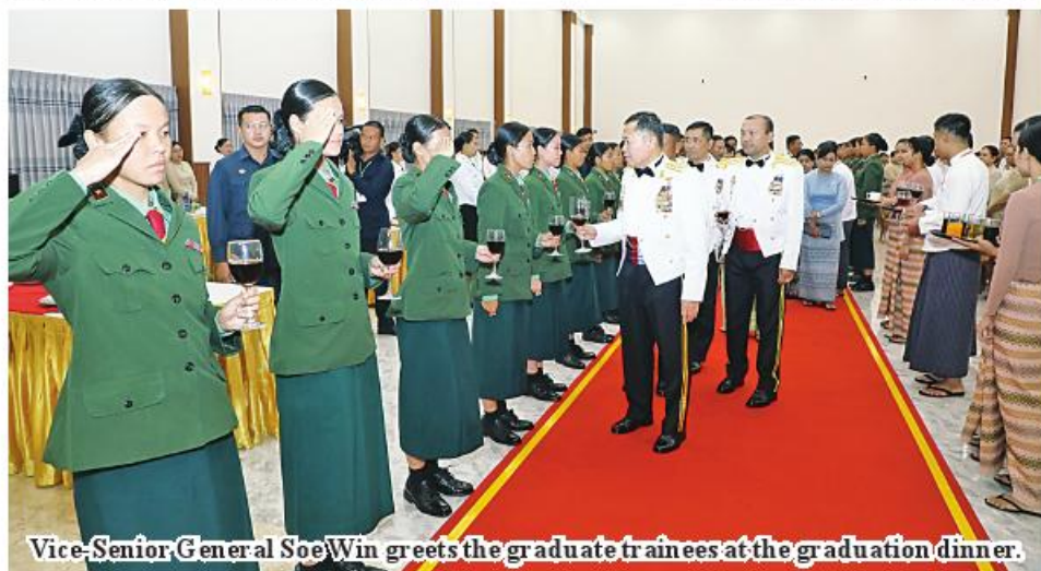
Vice-Senior General Soe Win greets the graduate trainees at the graduation dinner.