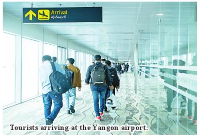
Tourists arriving at the Yangon airport.

form tourists. In addition to identifying new destinations, tourism promotion programs were carried out to attract many local travellers to visit domestic destinations. Therefore, since October 2021, Myanmar's tourism industry has started to improve. International flights were allowed