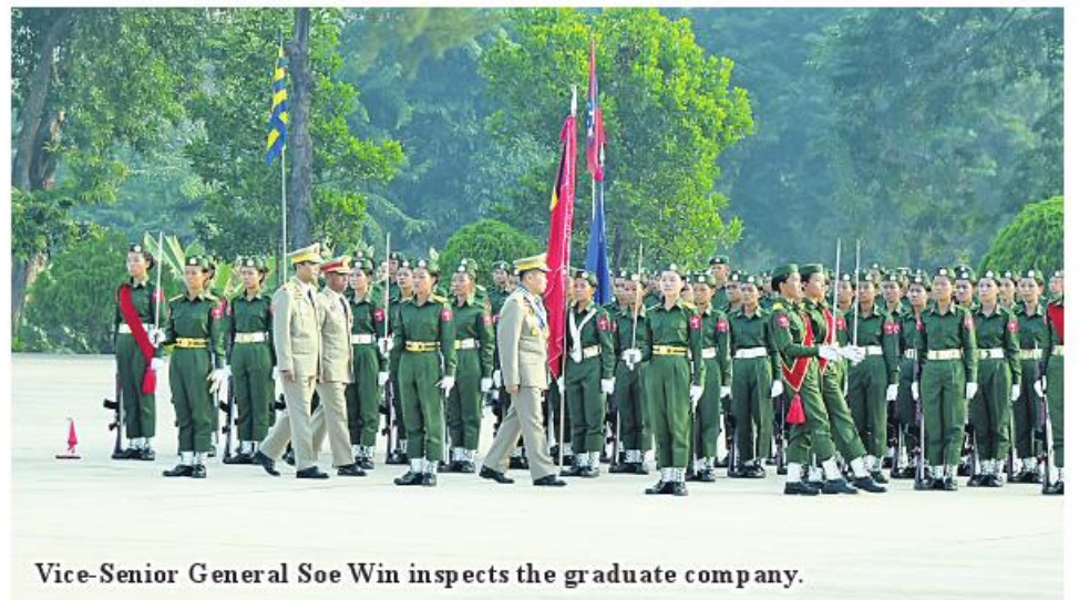
Vice-Senior General Soe Win inspects the graduate company.

They need to try hard to become skillful persons in western medical science as well as traditional medical science by raising health awareness to Tatmadaw fami-