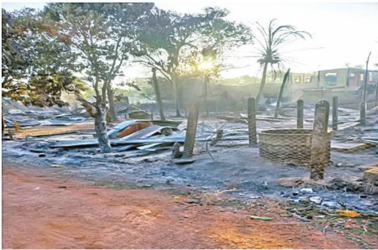
ကျောက်ရိတ်မြို့ အမှတ်(၅)ရပ်ကွက် မီးလောင်ပျက်စီးမှု မှတ်တမ်းဓာတ်ပုံ။

နေပြည်တော် ဒီဇင်ဘာ ၂၆ ကရင်ပြည်နယ် ကျောက်ရိတ်မြို့ အမှတ်(၅)ရပ်ကွက်အတွင်းရှိ လူနေအိမ်များကို KKO (ခွဲထွက်)အဖွဲ့နှင့် PDF အမည်ခံအကြမ်းဖက်သမားများ ပူးပေါင်းအဖွဲ့က မီးရှို့ဖျက်ဆီးခဲ့ကြောင်း သိရှိရသည်။ ဖြစ်စဉ်မှာ ကျောက်ရိတ်မြို့ အမှတ်(၅)ရပ်ကွက်အတွင်းသို့ ယနေ့နံနက် ၅ နာရီ ၄၅ မိနစ်ခန့်တွင် KKO (ခွဲထွက်)အဖွဲ့နှင့် PDF အမည်ခံအကြမ်းဖက်သမားများ ပူးပေါင်းအဖွဲ့ ရောက်ရှိလာပြီး လူနေအိမ်များကို မီးရှို့ဖျက်ဆီးကာ ပြန်လည်ထွက်ခွာသွားခဲ့ကြောင်း သိရှိရသည်။ အဆိုပါ