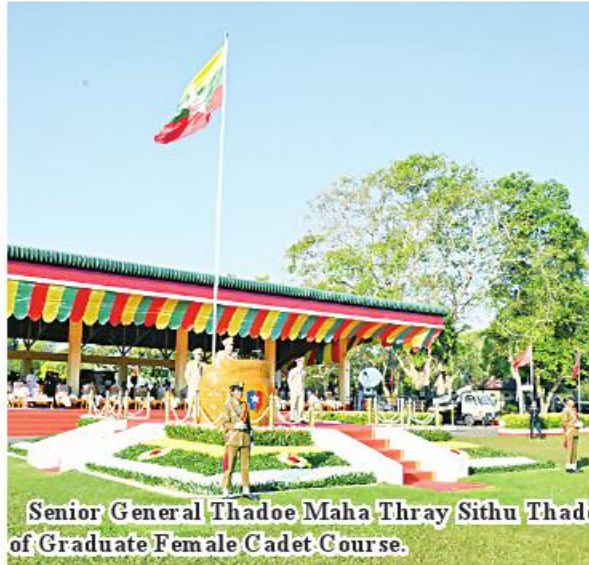
Senior General Thadoe Maha Thray Sithu Thadoe Thiri Thudhamma Min Aung Hlaing addresses Passing-out Parade of the 10 th Intake of Graduate Female Cadet Course.