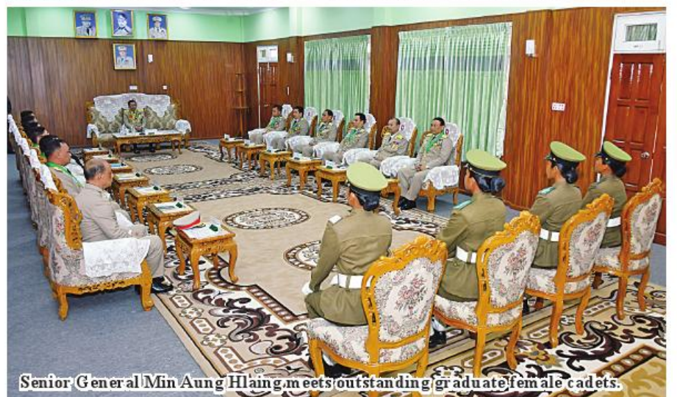
Senior General Min Aung Hlaing meets outstanding graduate female cadets.

commitment to safeguard the Nation, devoid of any coercion or external influence. In the assorted training offered by the Tatmadaw, comrades eagerly embark on the journey to becoming commendable servicewomen, driven by their own resolute decisions. Amidst the challenges that unfold in service, it becomes