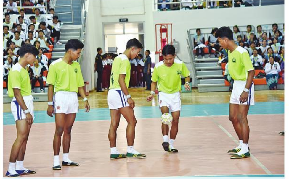
မြန်မာ့ခြင်းဝိုင်း သရုပ်ပြသစဉ်။

ကြောင်း၊ အားကစားနယ်ပယ် အောင်မြင်မှုသည် နိုင်ငံတော်ဖွံ့ဖြိုးတိုးတက်မှုကိုပါ ပြသနေခြင်းဖြစ်သည့်အတွက် အားကစားပြိုင်ပွဲများကို ယှဉ်ပြိုင်ရာတွင် ကိုယ့်အဖွဲ့အစည်းအတွက်တင်မဟုတ်ဘဲ မိမိလူမျိုး၊ မိမိနိုင်ငံတော်၏ ကျေးဇူးကို ဆပ်နိုင်သည့်