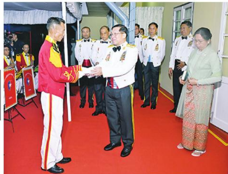
နိုင်ငံတော်စီမံအုပ်ချုပ်ရေးကောင်စီဥက္ကဋ္ဌ တပ်မတော်ကာကွယ်ရေးဦးစီးချုပ် ဗိုလ်ချုပ်မှူးကြီးမင်းအောင်လှိုင် တပ်မတော်(ကြည်း) ဗိုလ်သင်တန်းကျောင်း(မှော်ဘီ) ဂုဏ်ပြုစစ်တီးပိုင်းတပ်ခွဲ၏ ဂုဏ်ပြုတီးမှုတ်မှုကို ကြည့်ရှုအားပေးပြီး ချီးမြှင့်ငွေများ ပေးအပ်စဉ်။