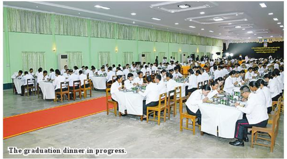
The graduation dinner in progress.