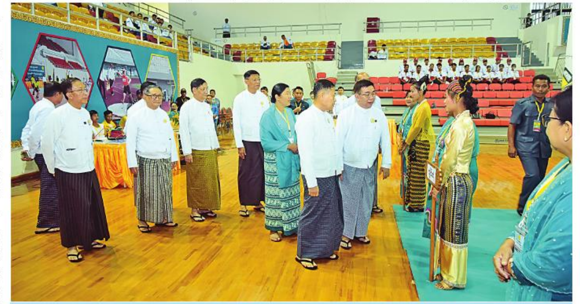
ပညာရေး၊ ကျန်းမာရေးနှင့် လူ့စွမ်းအားအရင်းအမြစ်ဖွံ့ဖြိုးတိုးတက်ရေးကော်မတီဥက္ကဋ္ဌ နိုင်ငံတော်စီမံအုပ်ချုပ်ရေးကောင်စီဒုတိယဥက္ကဋ္ဌ ဒုတိယဝန်ကြီးချုပ် ဒုတိယဗိုလ်ချုပ်မှူးကြီးစိုးဝင်း ၂၀၂၃-၂၀၂၄ ပညာသင်နှစ် ပညာရေးဒီဂရီကောလိပ်ပေါင်းစုံအားကစားပြိုင်ပွဲ တွင် ဝင်ရောက်ယှဉ်ပြိုင်ကြမည့် ပြိုင်ပွဲဝင်အသင်းများမှ အသင်းအုပ်ချုပ်သူ၊ နည်းပြများနှင့် အားကစားသမားများကို ရင်းရင်းနှီးနှီး လိုက်လံနှုတ်ဆက်စဉ်။

အချင်းချင်း ထိတွေ့မှု၊ ချစ်ခင်ရင်းနှီးမှု၊ ညီညွတ်မှု ဒေသန္တရ ဗဟုသုတများရရှိမှု အပြင် အားကစားတွင် ထူးချွန်သည့် အခြေခံပညာ ဆရာ၊ ဆရာမများအဖြစ် ပေါ်ထွန်းလာစေမည်ဖြစ်ကြောင်း၊ တစ်နည်း အားဖြင့် အခြေခံပညာအတွက် ပညာရေး နှင့် အားကစားစွမ်းရည်ကိုပါ အားထားရ