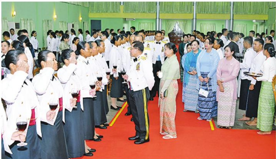
နိုင်ငံတော်စီမံအုပ်ချုပ်ရေးကောင်စီဥက္ကဋ္ဌ တပ်မတော်ကာကွယ်ရေးဦးစီးချုပ် ဗိုလ်ချုပ်မှူးကြီးမင်းအောင်လှိုင်နှင့် ဇနီး ဒေါ်ကြူကြူလှ သင်တန်းဆင်းအမျိုးသမီးအရာရှိများကို တစ်ဦးချင်း ရင်းရင်းနှီးနှီးလိုက်လံနှုတ်ဆက်စဉ်။

မြဝတီသဘင်ဆောင်၌ ပြည်သူ့သက်ဆုံးရေးနှင့် စိတ်ဓာတ်စစ်ဆင်ရေးညွှန်ကြားရေးမှူးချုပ် ကွပ်ကဲမှုအောက် မြဝတီတေးဂီတအဖွဲ့၏ တေးသီချင်းများဖြင့် ဂုဏ်ပြုဖျော်ဖြေတင်ဆက်မှုများကို ကြည့်ရှုအားပေးခဲ့ကြောင်း သတင်းရရှိသည်။