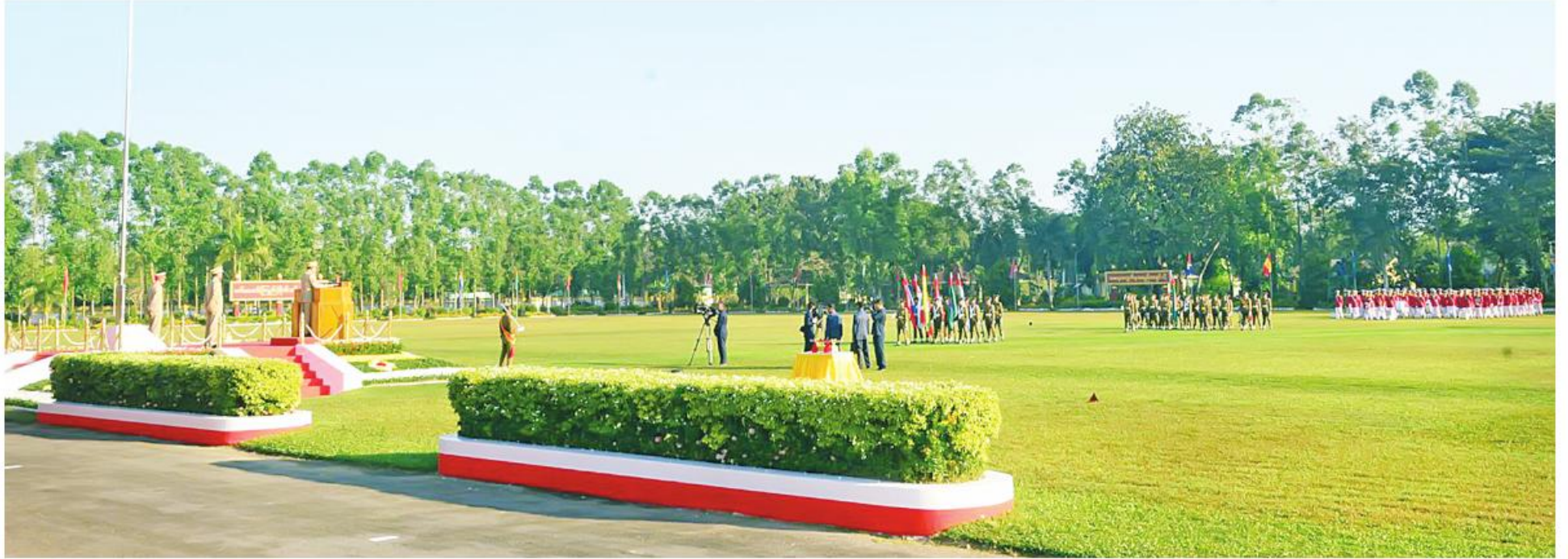
နိုင်ငံတော်စီမံအုပ်ချုပ်ရေးကောင်စီဥက္ကဋ္ဌ တပ်မတော်ကာကွယ်ရေးဦးစီးချုပ် ဝိုင်းဇော်၊ ဝန်ထမ်းများ၊ သတိုးမဟာသရေစည်သူ သတိုးသီရိသုဓမ္မမင်းအောင်လှိုင် ဘွဲ့ရအမျိုးသမီးဝိုင်းလောင်းသင်တန်း အမှတ်စဉ် (၁၀) သင်တန်းဆင်း ဂုဏ်ပြုခမ်းရေးပြအခမ်းအနားတွင် မိန့်ခွန်းပြောကြားစဉ်။

စာမျက်နှာ ၁၇မှအဆက် အကျင့်စာရိတ္တကောင်းခြင်း၊ စိတ်ဓာတ်ကောင်းခြင်း၊ သစ္စာရှိခြင်း၊ စွမ်းရည်သုံးရပ်ပြည့်စုံခြင်း၊ စည်းကမ်းအရာတွင်စံနမူနာပြုဖြစ်ခြင်းစသည့် ခေါင်းဆောင်မှုအင်္ဂါရပ်များနှင့်အညီ လုပ်ဆောင်ကြရမည်ဖြစ်ကြောင်း။ “သွေးသင့်သည့်နေရာကိုသာ သွေးရန်၊ ပေါင်းသင့်သည့် သူကိုသာပေါင်းရန်၊ လုပ်သင့်သည့် အလုပ်ကိုသာ လုပ်ရန်နှင့် ပြောသင့် သည့်ကိစ္စများသာပြောရန်” ဟူသည့် သင့် လေးသင့်ကို လိုက်နာကျင့်သုံးပြီး ဘဝတစ်လျှောက် ကိုယ်ကျင့်တရားကောင်း သည့် အရာရှိများဖြစ်အောင် မိမိကိုယ်ကို စောင့်ထိန်းနေထိုင်သွားကြရမည်ဖြစ်ကြောင်း၊ ထို့ကြောင့် ခေါင်းဆောင်ကောင်းတစ်ဦး ဖြစ်လာရန် ကျရာတာဝန်များ၌ ကျေပွန်စွာ ထမ်းဆောင်ပြီး ခေါင်းဆောင်မှုအင်္ဂါရပ်များနှင့်ပြည့်စုံအောင် ကြိုးစားအားထုတ် သွားကြရန် အလေးအနက်ထားမှာကြား လိုကြောင်း။ မကြာခင်တွင် ပြန်တမ်းဝင်အရာရှိငယ် များအဖြစ် တပ်မတော်(ကြည်း၊ ရေ၊ လေ) တပ်ဖွဲ့အသီးအသီးတွင် ပေးအပ်သည့်တာဝန် များကို ထမ်းဆောင်ရတော့မည်ဖြစ်ပြီး ခေါင်းဆောင်ငယ်များ တတ်မြောက် ကျွမ်းကျင်ရမည့် အခြေခံစစ်ပညာများ၊ ခေါင်းဆောင်မှုနှင့် ကွပ်ကဲမှုပညာရပ်များကို စာတွေ့၊ လက်တွေ့ သင်ကြားလေ့ကျင့် ပေးခဲ့ပြီးဖြစ်ကြောင်း၊ မိမိတို့ရောက်ရှိ တာဝန်ထမ်းဆောင်ရမည့် တပ်ရင်း၊ တပ်ဖွဲ့ နှင့် ဌာနချုပ်များတွင် နေ့စဉ်လုပ်ဆောင် နေကြရသည့် အုပ်ချုပ်မှုလုပ်ငန်းတာဝန် များရှိပြီး ယင်းတာဝန်များကို ထမ်းဆောင် ရာတွင် စစ်ဦးစီး၊ စစ်ရေး၊ စစ်ထောက်