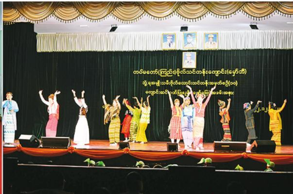
နိုင်ငံတော်စီမံအုပ်ချုပ်ရေးကောင်စီဥက္ကဋ္ဌ တပ်မတော်ကာကွယ်ရေးဦးစီးချုပ် ဗိုလ်ချုပ်မှူးကြီးမင်းအောင်လှိုင်နှင့် ဧည့်သည်သက်ဆုံးရေးနှင့်စိတ်ဓာတ်စစ်ဆင်ရေးညွှန်ကြားရေးမှူးချုပ် ကွပ်ကဲမှုအောက် မြဝတီတေးဂီတအဖွဲ့၏ တေးသီချင်းများဖြင့် ဂုဏ်ပြုဖျော်ဖြေတင်ဆက်မှုများကို ကြည့်ရှုအားပေးစဉ်။

နေပြည်တော် ဒီဇင်ဘာ ၂၂ (မှော်ဘီ)ကျောင်းအုပ်ကြီးနှင့် ရန်ကုန်တပ်မတော်(ကြည်း) ဗိုလ်သင်တန်းကျောင်း(မှော်ဘီ) ဘွဲ့ရအမျိုးသမီးဗိုလ်လောင်း သင်တန်းအမှတ်စဉ်(၁၀) သင်တန်းဆင်း ဂုဏ်ပြုညစာစားပွဲအခမ်းအနားကို ယနေ့ညနေပိုင်းတွင် ရန်ကုန်မြို့ တပ်မတော်(ကြည်း) ဗိုလ်သင်တန်းကျောင်း(မှော်ဘီ)ရှိ ပြည်ထောင်စုခန်းမ၌ ကျင်းပရာ နိုင်ငံတော်စီမံအုပ်ချုပ်ရေးကောင်စီဥက္ကဋ္ဌ တပ်မတော်ကာကွယ်ရေးဦးစီးချုပ် ဗိုလ်ချုပ်မှူးကြီးမင်းအောင်လှိုင် တက်ရောက်ချီးမြှင့်သည်။ အဆိုပါ သင်တန်းဆင်းဂုဏ်ပြုညစာစားပွဲအခမ်းအနားသို့ နိုင်ငံတော်စီမံအုပ်ချုပ်ရေးကောင်စီဥက္ကဋ္ဌ တပ်မတော်ကာကွယ်ရေးဦးစီးချုပ်နှင့်အတူ ဇနီး ဒေါ်ကြူကြူလှ၊ ကာကွယ်ရေးဦးစီးချုပ်(ရေ) ဗိုလ်ချုပ်ကြီးမိုးအောင်နှင့် ဇနီး၊ ကာကွယ်ရေးဦးစီးချုပ်(လေ) ဗိုလ်ချုပ်ကြီးထွန်းအောင်နှင့် ဇနီး၊ ပြည်ထောင်စုအဆင့်ပုဂ္ဂိုလ်များနှင့် ဇနီးများ၊ ကာကွယ်ရေးဦးစီးချုပ်ရုံးမှ တပ်မတော်အရာရှိကြီးများနှင့် ဇနီးများ၊ ရန်ကုန်တိုင်းဒေသကြီးဝန်ကြီးချုပ်၊ ရန်ကုန်တိုင်းစစ်ဌာနချုပ် တိုင်းမှူး၊ တပ်မတော်(ကြည်း) ဗိုလ်သင်တန်းကျောင်း