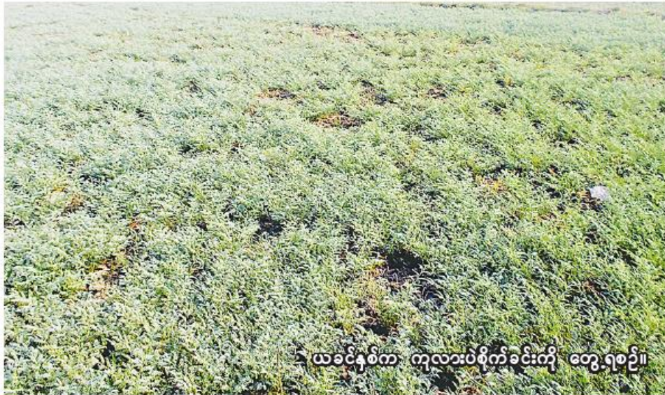
ယခင်နှစ်က ကုလားပဲစိုက်ခင်းကို တွေ့ရစဉ်။