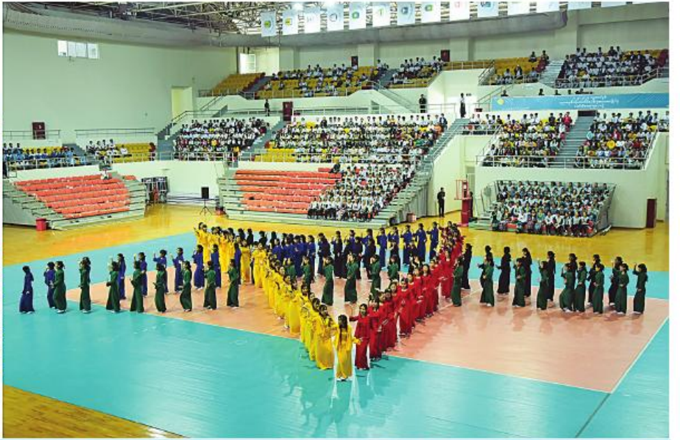
ပညာရေး၊ ကျန်းမာရေးနှင့် လူ့စွမ်းအားအရင်းအမြစ်ဖွံ့ဖြိုးတိုးတက်ရေးကော်မတီဥက္ကဋ္ဌ နိုင်ငံတော်စီမံအုပ်ချုပ်ရေးကောင်စီဒုတိယဥက္ကဋ္ဌ ဒုတိယဝန်ကြီးချုပ် ဒုတိယဗိုလ်ချုပ်မှူးကြီးစိုးဝင်းနှင့် အခမ်းအနားတက်ရောက်လာကြသူများက Physical Fitness Dance မြန်မာ့သိုင်း၊ ပဝါက၊ မြန်မာ့ခြင်းဝိုင်းနှင့် အေရိုးဗစ်သရုပ်ပြသမှုတို့ကို ကြည့်ရှုအားပေးစဉ်။

စာမျက်နှာ ၂၀ မှအဆက် ယှဉ်ပြိုင်ကစားခြင်းအားဖြင့် တရားမျှတမှု၊ စိတ်ဓာတ်ကြံ့ခိုင်မှု၊ အပြန်အလှန်လေးစားမှု စသည့် ကောင်းမြတ်သည့်အလေ့အထများကို ရရှိစေနိုင်မည်ဖြစ်ကြောင်း။