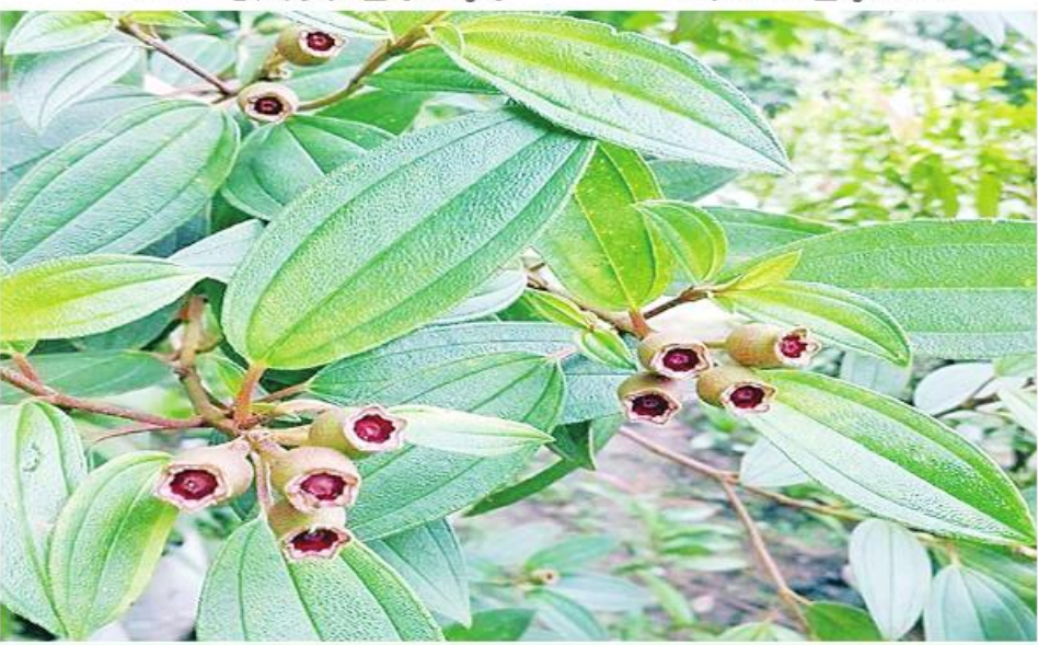
ဆေးဖက်ဝင် ဆေးအိုးပုတ်ပင်ကို တွေ့ရစဉ်။

သက်သာစေနိုင်ပါတယ်။ ၆။ နန္ဒင်းမှုန့်ကို ပျားရည်နဲ့တေပြီး ရွေးကြီးစေ့လောက် အလုံးပြုလုပ်ပြီး မနက်၊ ည သုံးလုံးလောက်စားပေးပါ။ အကိုက်အခဲရောဂါအမျိုးမျိုးကို သက်သာစေနိုင်ပါတယ်။ ၇။ ကြက်သွန်ဖြူကိုမီးဖုတ်ပြီး စားပေးရင် လေသက်ပြီး အကိုက်အခဲကိုသက်သာစေနိုင်ပါတယ်။ ၈။ စုတ်ထိုးဆေးနဲ့ကုသတာ၊ ရှေးလူကြီးတွေက မခံမရပ်နိုင်အောင်ကိုက်ခဲရင် ကြေးစုတ်နဲ့ စုတ်ထိုးဆေးကိုအသုံးပြုကြပါတယ်။ မြန်မာ့ရိုးရာကြေးစုတ်တွေကို