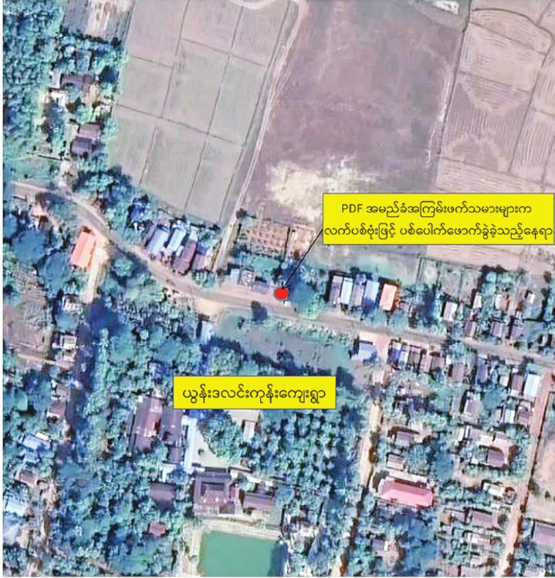
PDF အမည်ခံအကြမ်းဖက်သမားများက လက်ပစ်ဗုံးဖြင့် ဖောက်ခွဲခဲ့သည့်နေရာ

ဘီးလင်းမြို့နယ် ယွန်းဒလင်းကုန်းကျေးရွာရှိ ဘောလုံးကွင်း၌ ကိုးနဝင်းဘုရားပွဲကျင်းပနေစဉ် PDF အမည်ခံ အကြမ်းဖက်သမားများက လက်ပစ်ဗုံးဖြင့် ဖောက်ခွဲခဲ့သည့် နေရာပြပုံ