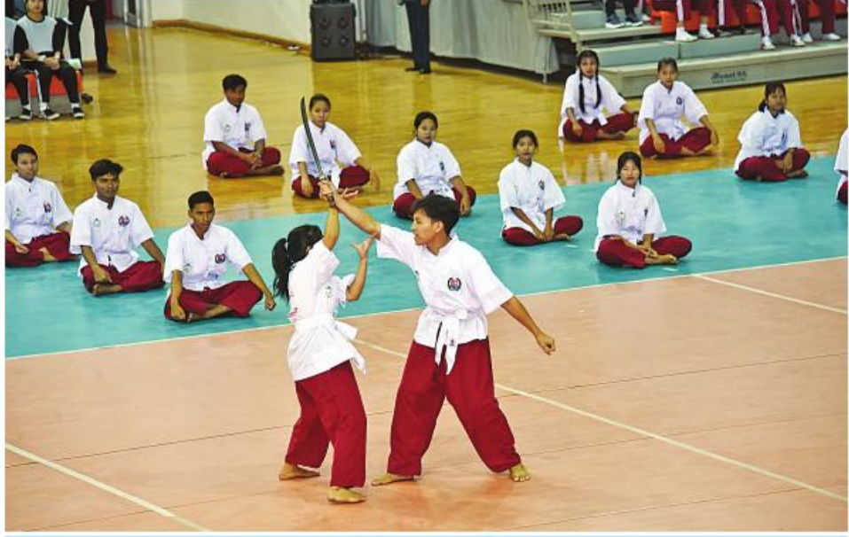
မြန်မာ့သိုင်း သရုပ်ပြသစဉ်။

ကောင်စီဒုတိယဥက္ကဋ္ဌ ဒုတိယဝန်ကြီးချုပ်သည် အခမ်းအနားသို့တက်ရောက်လာကြသူများနှင့်အတူ မိတ္တီလာပညာရေးဒီဂရီကောလိပ်၊ လှည်းကူးပညာရေးဒီဂရီကောလိပ်နှင့် တောင်ငူပညာရေးဒီဂရီကောလိပ်တို့မှ ကျောင်းသား၊ ကျောင်းသူများက Physical Fitness Dance၊ မြန်မာ့သိုင်း၊ ပဝါက၊ မြန်မာ့ခြင်းဝိုင်းနှင့် အေရိုးဗစ်သရုပ်ပြသမှုတို့ကို ကြည့်ရှုအားပေးခဲ့ကြသည်။ ၂၀၂၃-၂၀၂၄ ပညာသင်နှစ် ပညာရေးဒီဂရီကောလိပ်ပေါင်းစုံအားကစားပြိုင်ပွဲကို ဒီဇင်ဘာ ၂၂ ရက်မှ ၂၆ ရက်ထိ အားကစားနည်းများအလိုက် နေပြည်တော်ရှိ ဝဏ္ဏသိဒ္ဓိ