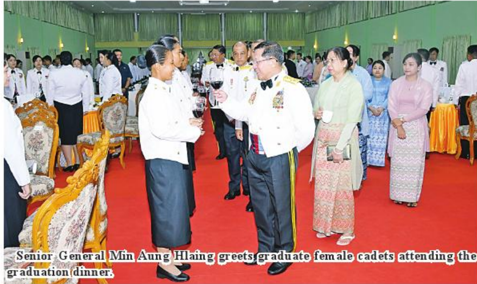
Senior General Min Aung Hlaing greets graduate female cadets attending the graduation dinner.

Nay Pyi Taw December 22 The graduation dinner of the 10 th Intake of Graduate Female Cadet Course of Defence Services (Army) Officers Training School (Hmawby) was held at the Union Hall of the Defence Services (Army) Officers