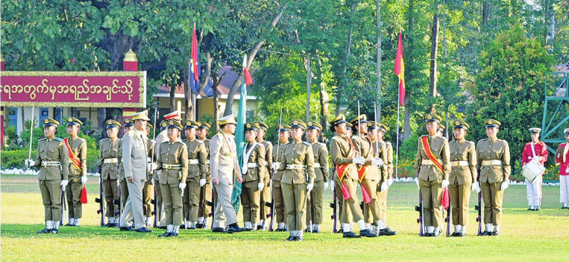
နိုင်ငံတော်စီမံအုပ်ချုပ်ရေးကောင်စီဥက္ကဋ္ဌ တပ်မတော်ကာကွယ်ရေးဦးစီးချုပ် ဗိုလ်ချုပ်မှူးကြီး သတိုးမဟာသရေစည်သူ သတိုးသီရိသုဓမ္မမင်းအောင်လှိုင် ကျောင်းဆင်းဗိုလ်လောင်းတပ်ခွဲကို စစ်ဆေးစဉ်။

နေပြည်တော် ဒီဇင်ဘာ ၂၂ ဗိုလ်လောင်းသင်တန်းအမှတ်စဉ်(၁၀) သင်တန်း ဗိုလ်သင်တန်းကျောင်း(မှော်ဘီ) စစ်ရေးပြတွင်း၌ ဗိုလ်ချုပ်မှူးကြီး သတိုးမဟာသရေစည်သူ သတိုးတပ်မတော်၏အမျိုးသမီးစစ်မှုထမ်းများ၏ အခန်း ဆင်းဂုဏ်ပြုစစ်ရေးပြအခမ်းအနားကို ယနေ့ ကျင်းပပြုလုပ်ရာ နိုင်ငံတော်စီမံအုပ်ချုပ်ရေး သီရိသုဓမ္မမင်းအောင်လှိုင် တက်ရောက်မိန့်ခွန်းကဏ္ဍကို အားသစ်လောင်းမည့် ဘွဲ့ရအမျိုးသမီး နံနက်ပိုင်းတွင် ရန်ကုန်မြို့ရှိ တပ်မတော်(ကြည်း) ကောင်စီဥက္ကဋ္ဌ တပ်မတော်ကာကွယ်ရေးဦးစီးချုပ် ပြောကြားသည်။ စာမျက်နှာ ၁၆ ကော်လံ ၁၂၅