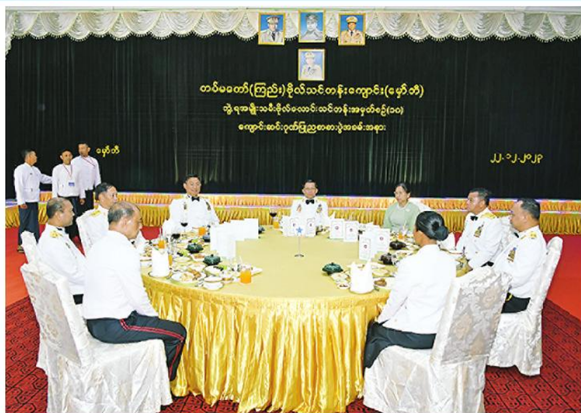
နိုင်ငံတော်စီမံအုပ်ချုပ်ရေးကောင်စီဥက္ကဋ္ဌ တပ်မတော်ကာကွယ်ရေးဦးစီးချုပ် ဗိုလ်ချုပ်မှူးကြီးမင်းအောင်လှိုင်နှင့် ဇနီး ဒေါ်ကြူကြူလှတို့က သင်တန်းဆင်းအရာရှိများ၊ ညစာစားပွဲတက်ရောက်လာကြသူများနှင့်အတူ ဂုဏ်ပြုညစာကို အတူတကွသုံးဆောင်စဉ်။

နယ်မှ အရာရှိကြီးများ၊ ဖိတ်ကြားထားသည့် ညွှန်ကြားရေးမှူး တက်ရောက်ကြသည်။ ဦးစွာ နိုင်ငံတော်စီမံအုပ်ချုပ်ရေးကောင်စီဥက္ကဋ္ဌ တပ်မတော်ကာကွယ်ရေးဦးစီးချုပ်က သင်တန်းဆင်းအမျိုးသမီးအရာရှိများကို တစ်ဦးချင်းရင်းရင်းနှီးနှီး လိုက်လံနှုတ်ဆက်သည်။ ထို့နောက် နိုင်ငံတော်စီမံအုပ်ချုပ်ရေးကောင်စီဥက္ကဋ္ဌ တပ်မတော်ကာကွယ်ရေးဦးစီးချုပ်နှင့်အဖွဲ့ဝင်များသည် သင်တန်းဆင်းအမျိုးသမီးအရာရှိများ၊ ညစာစားပွဲတက်ရောက်လာကြသူများနှင့်အတူ ဂုဏ်ပြုညစာကို အတူတကွ သုံးဆောင်ကြသည်။ ထို့နောက် နိုင်ငံတော်စီမံအုပ်ချုပ်ရေးကောင်စီဥက္ကဋ္ဌ တပ်မတော်ကာကွယ်ရေးဦးစီးချုပ်နှင့်အဖွဲ့ဝင်များသည် တပ်မတော်(ကြည်း) ဗိုလ်သင်တန်းကျောင်း(မှော်ဘီ) ဂုဏ်ပြုစစ်တီးပိုင်းတပ်ခွဲ၏ ဂုဏ်ပြုတီးမှုတ်မှုကို ကြည့်ရှုအားပေးပြီး ချီးမြှင့်ငွေများ ပေးအပ်သည်။ ယင်းနောက် နိုင်ငံတော်စီမံအုပ်ချုပ်ရေးကောင်စီဥက္ကဋ္ဌ တပ်မတော်ကာကွယ်ရေးဦးစီးချုပ်နှင့် အဖွဲ့ဝင်များသည် သင်တန်းဆင်း အမျိုးသမီးအရာရှိများနှင့်အတူ