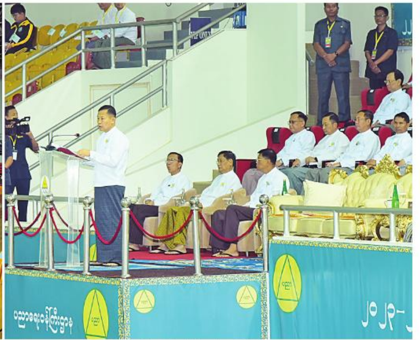
ပညာရေး၊ ကျန်းမာရေးနှင့် လူ့စွမ်းအားအရင်းအမြစ်ဖွံ့ဖြိုးတိုးတက်ရေးကော်မတီဥက္ကဋ္ဌ နိုင်ငံတော်စီမံအုပ်ချုပ်ရေးကောင်စီဒုတိယဥက္ကဋ္ဌ ဒုတိယဝန်ကြီးချုပ် ဒုတိယဗိုလ်ချုပ်မှူးကြီးစိုးဝင်း ၂၀၂၃-၂၀၂၄ ပညာသင်နှစ် ပညာရေးဒီဂရီကောလိပ်ပေါင်းစုံအားကစားပြိုင်ပွဲ ဖွင့်ပွဲအခမ်းအနားတွင် အမှာစကားပြောကြားစဉ်။

ကျော့မှအဆက် နိုင်ငံတော် စီမံအုပ်ချုပ်ရေးကောင်စီ ဒုတိယဥက္ကဋ္ဌ ဒုတိယဝန်ကြီးချုပ် ဒုတိယဗိုလ်ချုပ်မှူးကြီးစိုးဝင်းက အမှာစကား ပြောကြားရာတွင် အားကစားသည် နိုင်ငံ တစ်နိုင်ငံ၊ လူမျိုးတစ်မျိုး၏ ကျန်းမာကြံ့ခိုင်မှု၊ ခွဲလှဲလွယ်လွယ်ကြီးမားမှုနှင့် စည်းလုံးညီညွတ် မှု၊ ပူးပေါင်းဆောင်ရွက်တတ်မှု၊ စည်းကမ်း လိုက်နာတတ်မှုတို့ကို ထပ်ဟပ်ပေါ်လွင်စေ နိုင်သည့် စွမ်းရည်ပြပွဲဖြစ်ကြောင်းဖြစ်ကြောင်း၊ အားကစားပြုလုပ်ခြင်းကြောင့် ပထမဆုံးရရှိသည့် အကျိုးကျေးဇူးသည် တစ်ကိုယ်ရေ ကျန်းမာကြံ့ခိုင်ရေးဆိုင်ရာ ကောင်းကျိုးပင်ဖြစ်ကြောင်း၊ အသင်းအဖွဲ့ နှင့်ကစားရသည့် အလေ့အထမှတစ်ဆင့် အချင်းချင်းစည်းလုံးညီညွတ်မှု တစ်ခုချင်း အားဖြင့် စုပေါင်းစိတ်ဓာတ်ကိုရရှိစေပြီး ထိုမှတစ်ဆင့် နိုင်ငံ့ဂုဏ်၊ အမျိုးသားရေးဂုဏ် ကို ဆောင်ကြဉ်းလိုသည့် အမျိုးသားရေး စိတ်ဓာတ် ပိုမိုထက်သန်လာစေမည်ဖြစ် ကြောင်း။