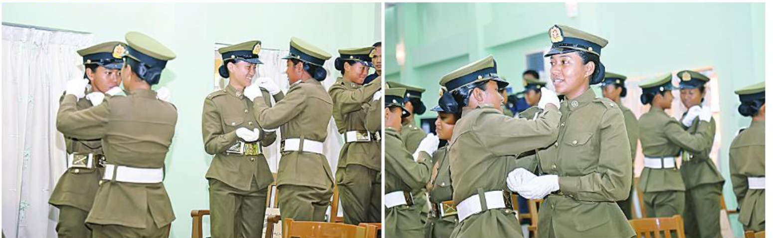
တပ်မတော်(ကြည်း) ဝိုင်းသင်တန်းကျောင်း(မှော်ဘီ) ဘွဲ့ရအမျိုးသမီးဝိုင်းသင်တန်းအမှတ်စဉ်(၁၀) သင်တန်းဆင်းပိုင်းလောင်းများ ဒုတိယဝိုင်းအဆင့် တံဆိပ်တပ်ဆင်နေမှုကို တွေ့ရစဉ်။

အတွက်အရည်အချင်းပြည့်ဝသည့် ဦးစီး အရာရှိများ မွေးထုတ်ပေးရန်ဆိုသည့် ရည်ရွယ်ချက်ဖြင့် တပ်မတော်(ကြည်း) ဝိုင်းသင်တန်းကျောင်း(မှော်ဘီ)၌ ၂၀၁၄ ခုနှစ်မှ စတင်ဖွင့်လှစ်သင်ကြားခဲ့ပြီး ယခုအခါ ဘွဲ့ရအမျိုးသမီး ဝိုင်းလောင်း သင်တန်းအမှတ်စဉ်(၁၀)အထိ လေ့ကျင့် မွေးထုတ်ပေးနိုင်ခဲ့ပြီးဖြစ်ကြောင်းနှင့် သင် တန်းဆင်းအမျိုးသမီးအရာရှိများအနေဖြင့် သက်ဆိုင်ရာ(ကြည်း၊ ရေ၊ လေ) လက်ရုံး တပ်ဖွဲ့များတွင် အသီးသီးတာဝန်ထမ်း ဆောင်ကြရမည်ဖြစ်ကြောင်း သတင်း ရရှိသည်။