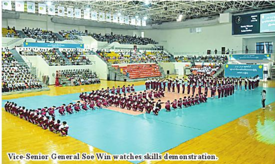
Vice-Senior General Soe Win watches skills demonstration.