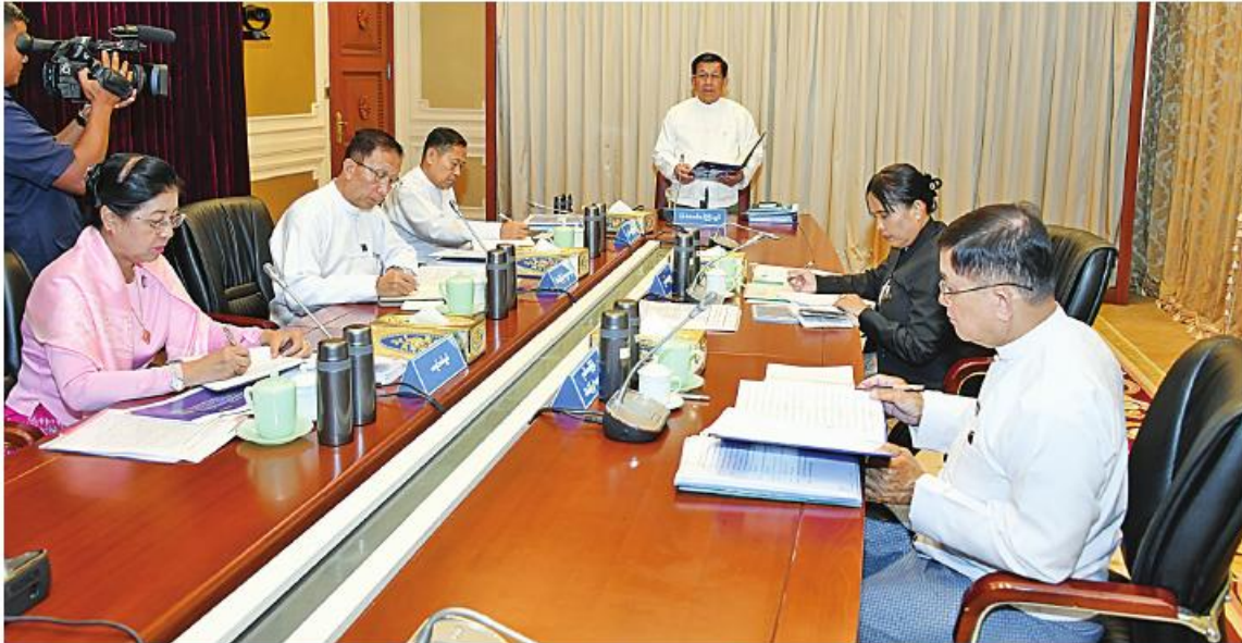
ဘဏ္ဍာရေးဆိုင်ရာကော်မရှင်ဥက္ကဋ္ဌ နိုင်ငံတော်စီမံအုပ်ချုပ်ရေးကောင်စီဥက္ကဋ္ဌ နိုင်ငံတော်ဝန်ကြီးချုပ် ပိုလ်ချုပ်မှူးကြီး မင်းအောင်လှိုင် ဘဏ္ဍာရေးဆိုင်ရာကော်မရှင်အစည်းအဝေးအမှတ်စဉ်(၂/၂၀၂၃)တွင် အမှာစကားပြောကြားစဉ်။

နေပြည်တော် ၃ ဇန်နဝါ ၁၅ (၂/၂၀၂၃) တွင် ပြည်ထောင်စုနှင့် တိုင်းဒေသကြီး၊ ပြည်နယ်များ၏ ၂၀၂၃-၂၀၂၄ ဘဏ္ဍာနှစ်အတွက် ဖြည့်စွက်ခွင့်ပြုငွေ တောင်းခံမှုများကို ဘဏ္ဍာရေးဆိုင်ရာကော်မရှင်က အတည်ပြုပေးရန်ဖြစ်ပါကြောင်း၊ အတည်ပြုပြီးပါက ၂၀၂၃-၂၀၂၄ ဘဏ္ဍာနှစ် ပြည်ထောင်စု၏ နောက်ထပ် ဘဏ္ဍာငွေခွဲဝေသုံးစွဲရေး ဥပဒေကြမ်းကို ပြည်ထောင်စုအစိုးရအဖွဲ့ကတစ်ဆင့် နိုင်ငံတော်စီမံအုပ်ချုပ်ရေးကောင်စီကို ဆက်လက်ပေးပို့တင်ပြ၍ အတည်ပြုပြဋ္ဌာန်းမည်ဖြစ်ပါကြောင်း။ ပြည်ထောင်စုနှင့် တိုင်းဒေသကြီး၊ ပြည်နယ်များသည် နိုင်ငံတော်စီမံအုပ်ချုပ်ရေးကောင်စီက နောက်ထပ် ဘဏ္ဍာငွေခွဲဝေသုံးစွဲရေးဥပဒေကို အတည်ပြုပြဋ္ဌာန်းပြီးမှသာ သုံးစွဲနိုင်မည်ဖြစ်သည့် အတွက် ဖြည့်စွက်ခွင့်ပြုငွေသုံးစွဲနိုင်သည့် ကာလမှာ လေးလခန့်သာရှိသည်ကိုလည်း သတိပြုရမည်ဖြစ်ပါကြောင်း၊ ဘဏ္ဍာငွေများကို များစွာလျာထားတောင်းခံထားပြီး မသုံးစွဲနိုင်သဖြင့် ပြန်လည်အပ်နှံခြင်းများ မဖြစ်ပေါ်စေရေးအတွက် ပြည်ထောင်စုဝန်ကြီးဌာနများနှင့် တိုင်းဒေသကြီးနှင့်