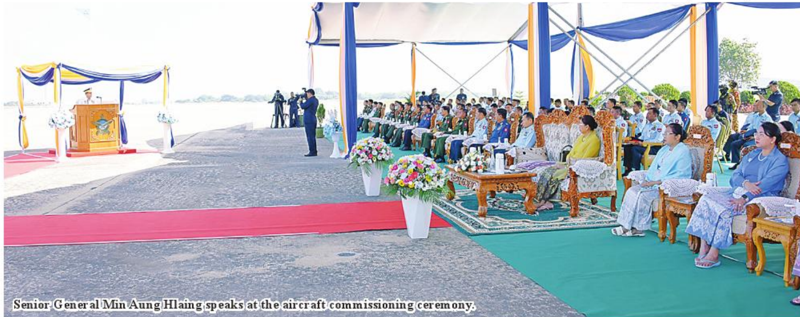
Senior General Min Aung Hlaing speaks at the aircraft commissioning ceremony.