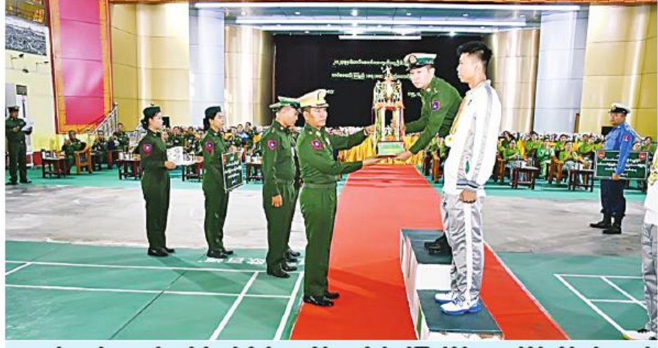
တပ်မတော်ကာကွယ်ရေးဦးစီးချုပ်ကိုယ်စား တိုင်းမှူး ဗိုလ်ချုပ်ကြည်ခိုင် အလယ်ပိုင်းတိုင်းစစ်ဌာနချုပ် အသင်းကို ခိုင်းဆုပေးအပ်ချီးမြှင့်စဉ်။

(ဌာန)တပ်ဖွဲ့ဝင်များ၊ စစ်မှုထမ်းဟောင်းအဖွဲ့ဝင် များနှင့် ဒေသပြည်သူများကို ယနေ့တွင် တိုင်းစစ်ဌာန ချုပ်အသီးသီးမှ တိုင်းမှူးများနှင့် တာဝန်ရှိသူများက သွားရောက်ကြည့်ရှု ၍ တစ်ဦးချင်း၏ ရောဂါဖြစ်ပွားမှု၊ ဆေးဝါးကုသပေးထားမှုနှင့် ကျန်းမာရေးတိုးတက် ကောင်းမွန်မှု အခြေအနေများကို ရင်းရင်းနှီးနှီးမေးမြန်း အားပေးစကားပြောကြားပြီး အာဟာရပြည့်စုံစားသောက် ဖွယ်ရာများနှင့် ထောက်ပံ့ငွေများပေးအပ်ကြသည်။ ထို့နောက် တိုင်းမှူးများနှင့်တာဝန်ရှိသူများက ဆေးရုံ များအတွင်း လှည့်လည်ကြည့်ရှု၍ လိုအပ်သည်များ ညှိနှိုင်း ဆောင်ရွက်ပေးခဲ့ကြကြောင်း သတင်းရရှိသည်။