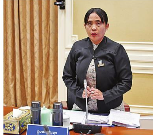
ဥပဒေရေးရာဝန်ကြီးဌာန ပြည်ထောင်စုဝန်ကြီး ဒေါက်တာ သီတာဦး ရှင်းလင်းတင်ပြစဉ်။