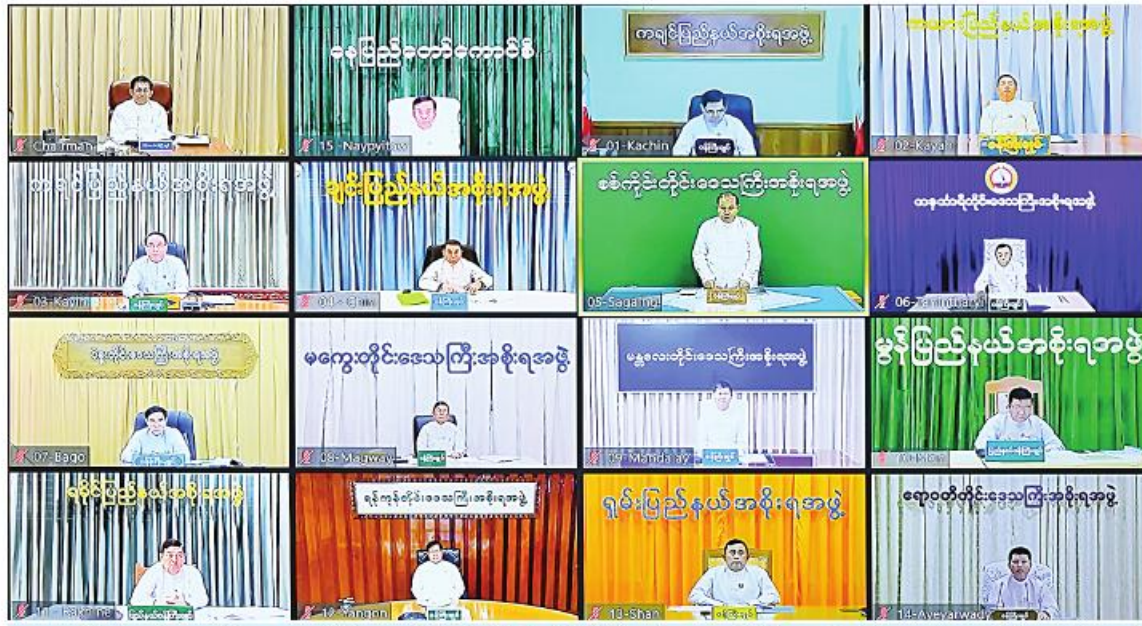
နေပြည်တော်ကောင်စီဥက္ကဋ္ဌ၊ တိုင်းဒေသကြီးနှင့် ပြည်နယ်ဝန်ကြီးချုပ်များက Video Conferencing ဖြင့် တက်ရောက်ကြစဉ်။