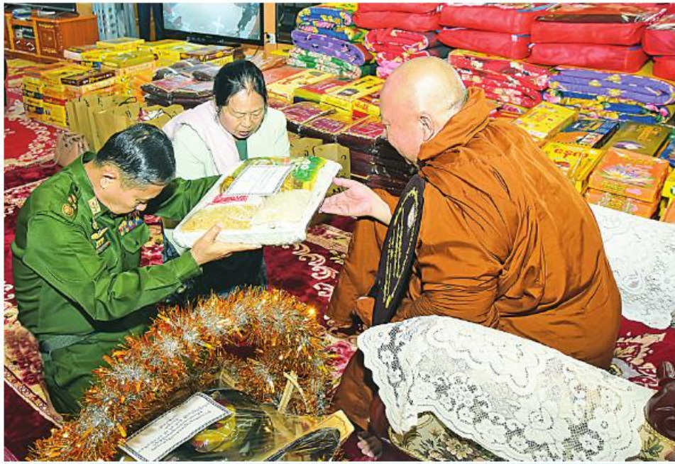
လားရှိုးမြို့ သီရိမင်္ဂလာမန်ဆူရမ်းကျောင်းတိုက်ဆရာတော်ကြီး အဂ္ဂမဟာဂန္ထဝါကေပဏ္ဍိတ အဂ္ဂမဟာကမ္မဋ္ဌာနာစရိယ အဂ္ဂမဟာသဒ္ဓမ္မဇောတိကဓဇ ဒေါက်တာဘဒ္ဒန္တပုညနန္ဒက နိုင်ငံတော်စီမံအုပ်ချုပ်ရေးကောင်စီ ဒုတိယဥက္ကဋ္ဌ ဒုတိယတပ်မတော်ကာကွယ်ရေးဦးစီးချုပ် ကာကွယ်ရေးဦးစီးချုပ်(ကြည်း) ဒုတိယဗိုလ်ချုပ်မှူးကြီး ဖိုးဝင်းနှင့် ဇနီး ဒေါ်သန်းသန်းနွယ်တို့က လှူဖွယ်ပစ္စည်းများ ဆက်ကပ်လှူဒါန်းစဉ်။