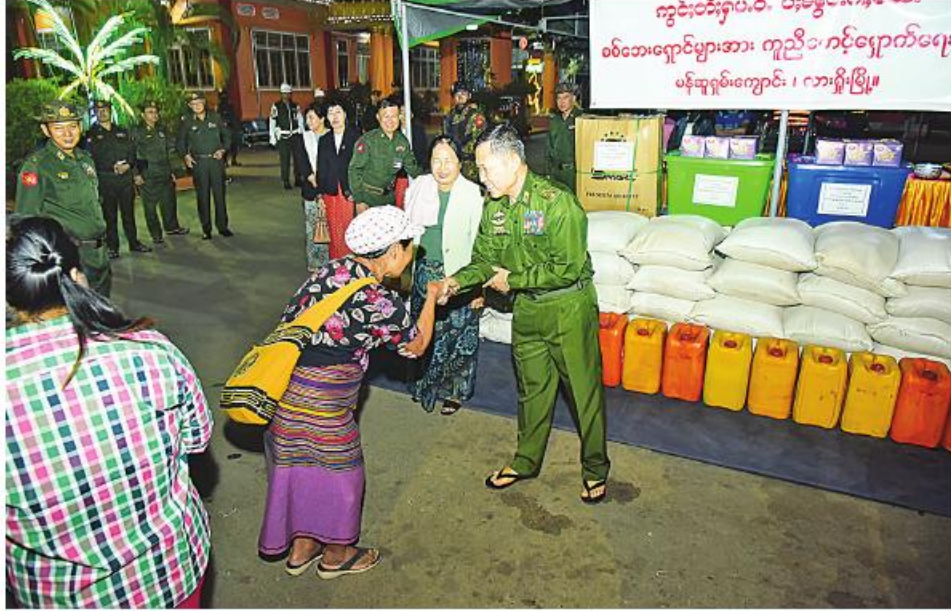
နိုင်ငံတော်စီမံအုပ်ချုပ်ရေးကောင်စီ ဒုတိယဥက္ကဋ္ဌ ဒုတိယတပ်မတော်ကာကွယ်ရေးဦးစီးချုပ် ကာကွယ်ရေးဦးစီးချုပ်(ကြည်း) ဒုတိယဗိုလ်ချုပ်မှူးကြီး ဖိုးဝင်းနှင့် ဇနီး ဒေါ်သန်းသန်းနွယ်တို့က လားရှိုးမြို့ သီရိမင်္ဂလာမန်ဆူရမ်းကျောင်းတိုက်တွင် ရောက်ရှိနေသည့် ယာယီနေရပ်စွန့်ခွာ ဒေသခံပြည်သူများကို ရင်းရင်းနှီးနှီးနှုတ်ဆက်စဉ်။