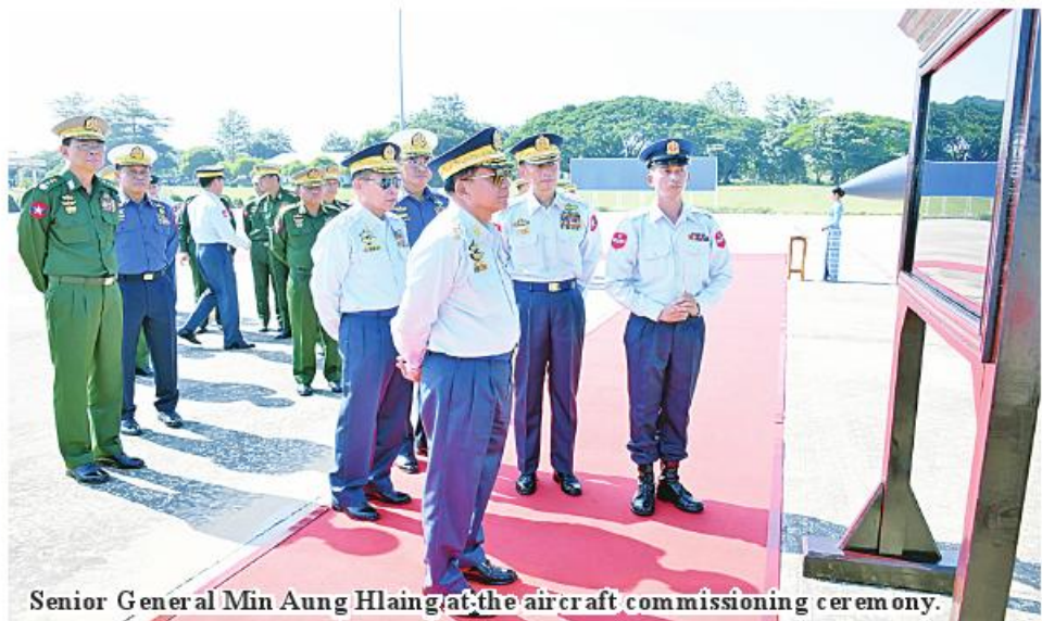
Senior General Min Aung Hlaing at the aircraft commissioning ceremony.

the Tatmadaw (Army) and the Tatmadaw (Navy) in conventional and non-conventional warfare as well as public welfare warfare for the sake of the people and urged them to continue their assigned duties with utmost efforts. The Tatmadaw (Air) needs to review improvement of air forces in regional and international countries on time and shape itself to be a compact and capable air force power and aerospace capability. It is necessary to exert efforts for fulfilling their needs and improve material and capability. The Tatmadaw (Air) See Page 14