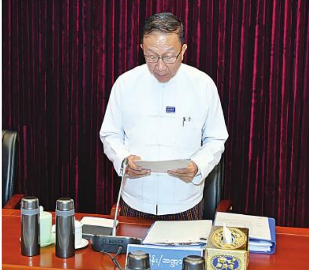
ဘဏ္ဍာရေးဆိုင်ရာကော်မရှင်အတွင်းရေးမှူး စီမံကိန်းနှင့် ဘဏ္ဍာရေးဝန်ကြီးဌာန ပြည်ထောင်စုဝန်ကြီး ဦးဝင်းရှိန် ရှင်းလင်းတင်ပြစဉ်။

နိုင်ငံခြားငွေလဲလှယ်နှုန်း ကွာခြားချက်ကြောင့် လိုအပ်လာသည့်အသုံးစရိတ်များ၊ နိုင်ငံတော်သို့ ထပ်မံပေးဆောင်ရမည့် ဝင်ငွေခွန်၊ ကုန်သွယ်လုပ်ငန်းခွန်နှင့် နိုင်ငံတော်သို့ ထည့်ဝင်ငွေများအတွက် တောင်းခံသည့်အတိုင်း ခွင့်ပြုခဲ့ပြီး မဖြစ်မနေပေးချေရန် ထပ်မံလိုအပ်သည့် နိုင်ငံဝန်ထမ်းလစာစရိတ်၊ ချီးမြှင့်ငွေ၊ ခရီးစရိတ်၊ အတိုးပေးငွေများကို စိစစ်ခွင့်ပြုခဲ့