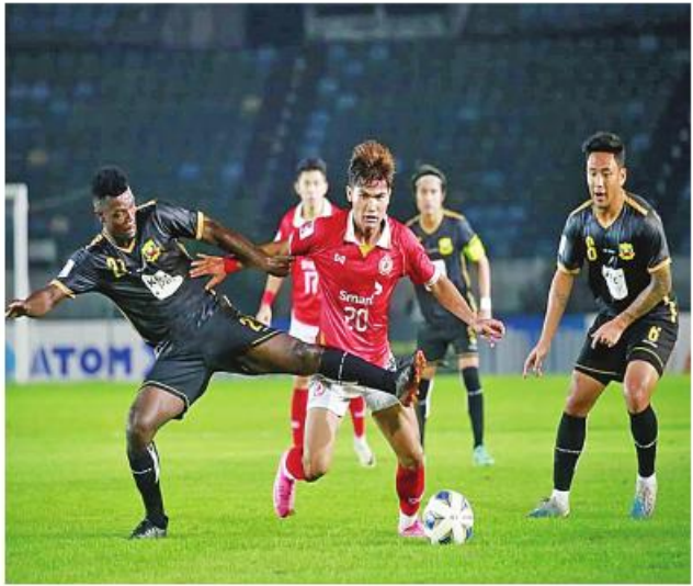
ရန်ကုန် ဒီဇင်ဘာ ၁၅ မြို့ သုဝဏ္ဏအားကစားကွင်းတွင် ရှမ်းယူနိုက်တက်အသင်းနှင့်ကမ္ဘောဒီးယားကလပ် ပဒွမ်းပင်ခရောင်း အသင်းတို့ကစားခဲ့ရာ ရှမ်းယူနိုက်တက်အသင်းက နှစ်ဂိုး တစ်ဂိုးဖြင့် အနိုင်ရရှိခဲ့ကြောင်း သိရသည်။