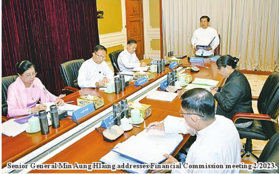
Senior General Min Aung Hlaing addresses Financial Commission meeting 2/2023.

Nay Pyi Taw December 15 Financial Commission Meeting (2/2023) was held at the meeting hall of the Office of the Chairman of the State Administration Council in Nay Pyi Taw this afternoon and Chairman of the Financial Commission Chairman of the State Administration Council Prime Minister Senior General Min Aung Hlaing delivered an address at the meeting.