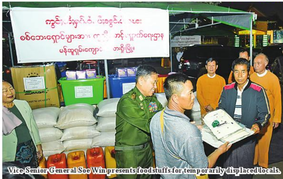
Vice-Senior General Soe Win presents foodstuffs for temporarily displaced locals.