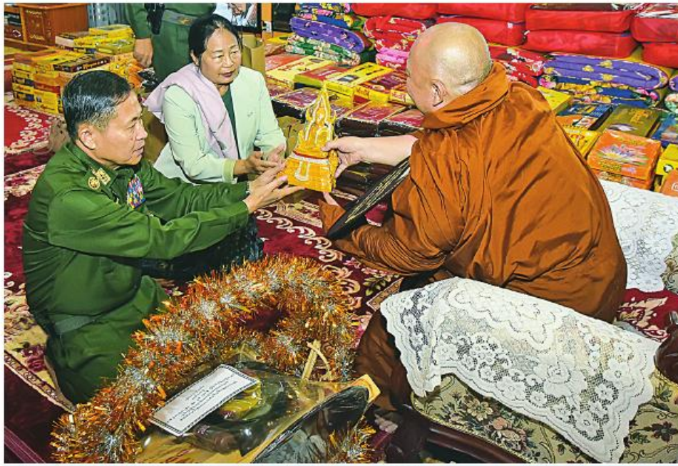
လားရှိုးမြို့ သီရိမင်္ဂလာမန်ဆူရမ်းကျောင်းတိုက်ဆရာတော်ကြီး အဂ္ဂမဟာဂန္ထဝါကေပဏ္ဍိတ အဂ္ဂမဟာကမ္မဋ္ဌာနာစရိယ အဂ္ဂမဟာသဒ္ဓမ္မဇောတိကဓဇ ဒေါက်တာဘဒ္ဒန္တပုညနန္ဒက နိုင်ငံတော်စီမံအုပ်ချုပ်ရေးကောင်စီ ဒုတိယဥက္ကဋ္ဌ ဒုတိယတပ်မတော်ကာကွယ်ရေးဦးစီးချုပ် ကာကွယ်ရေးဦးစီးချုပ်(ကြည်း) ဒုတိယဗိုလ်ချုပ်မှူးကြီး ဖိုးဝင်းနှင့် ဇနီး ဒေါ်သန်းသန်းနွယ်တို့အား ဓမ္မလက်ဆောင်များ ပြန်လည်ပေးအပ်စဉ်။