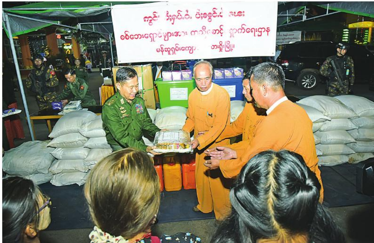
နိုင်ငံတော်စီမံအုပ်ချုပ်ရေးကောင်စီဥက္ကဋ္ဌ နိုင်ငံတော်ဝန်ကြီးချုပ် တပ်မတော်ကာကွယ်ရေးဦးစီးချုပ်က ပေးအပ်သည့်အဝတ်အထည်များ၊ ဆန်၊ ဆီနှင့်စားသောက်ဖွယ်ရာပစ္စည်းများကို နိုင်ငံတော်စီမံအုပ်ချုပ်ရေးကောင်စီဒုတိယဥက္ကဋ္ဌ ဒုတိယတပ်မတော်ကာကွယ်ရေးဦးစီးချုပ်(ကြည်း) ဒုတိယပိုလ်ချုပ်မှူးကြီးစိုးဝင်းက ပေးအပ်ရာ ယာယီနေရပ်စွန့်ခွာဒေသခံပြည်သူများကိုယ်စား တာဝန်ရှိသူများက လက်ခံရယူကြစဉ်။