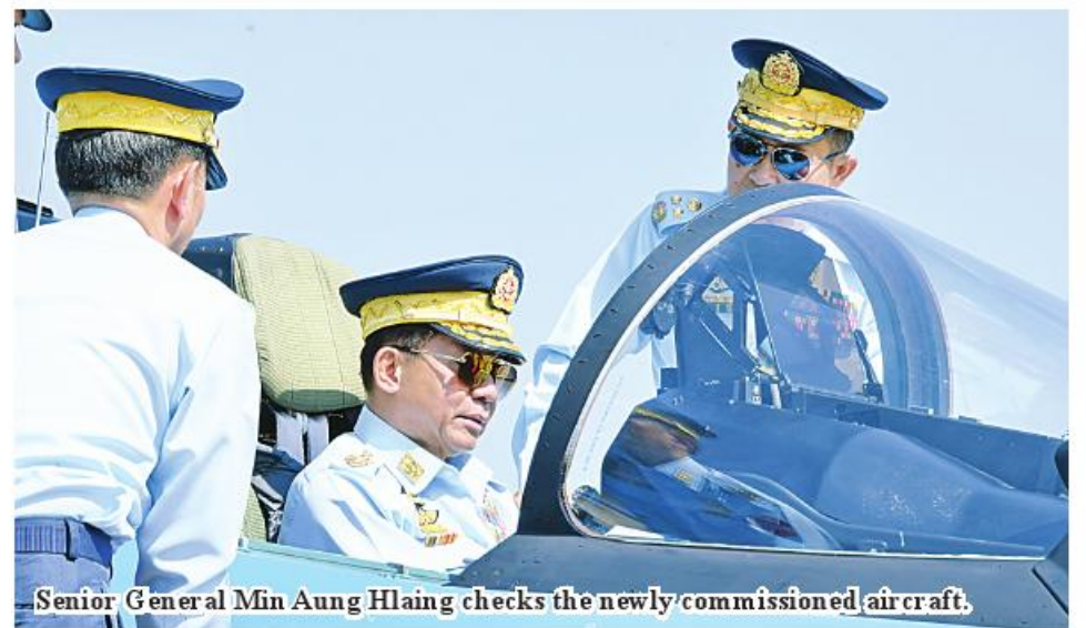
Senior General Min Aung Hlaing checks the newly commissioned aircraft.

Servicemen from the Tatmadaw (Air) deployed aircraft and helicopters at full capacity in the military operations for clashes in North-East Command and other military command areas in October and sacrificed their lives for achieving success in fighting. Hence, the Senior General honoured them and urged all servicemen to preserve such fine traditions as good legacy. It can be seen that the Tatmadaw (Air) has been dutifully serving the duties in State defence measures in addition to rescue and relief measures in the natural disasters and humanitarian assistance during the 76 years period. Hence, the Tatmadaw (Air) is joining hands with