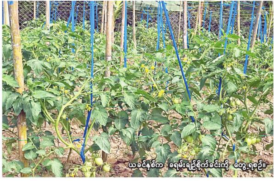
ယခုနှစ်က ခရမ်းချဉ်စိုက်ခင်းကို တွေ့ရစဉ်။