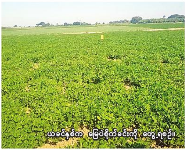
ယခုနှစ်က မြေပဲစိုက်ခင်းကို တွေ့ရစဉ်။

ဦးစီးဌာနမှ သိရသည်။ ခင်ဦးမြို့နယ်တွင် ယခုနှစ် ဆောင်းမြေပဲစိုက်ပျိုးသည့် တောင် သူများကို မြို့နယ်စိုက်ပျိုးရေးဦးစီး ဌာနက မျိုးကောင်းမျိုးသန့်ရွေးချယ် စိုက်ပျိုးရေး၊ စိုက်နည်းစနစ်မှန်ကန် ရေး၊ GAP စနစ်ဖြင့် စိုက်ပျိုး ရေး စသည့်စိုက်ပျိုးရေးနည်းပညာ များ အသိပညာပေးလျက်ရှိကြောင်း သိရသည်။ (၂၀၆)