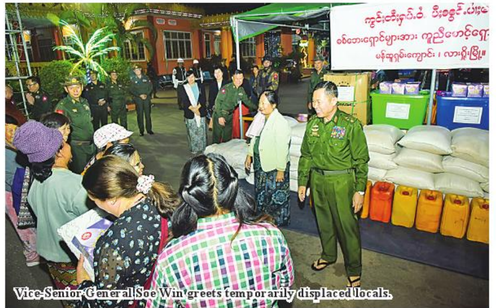
Vice-Senior General Soe Win greets temporarily displaced locals.