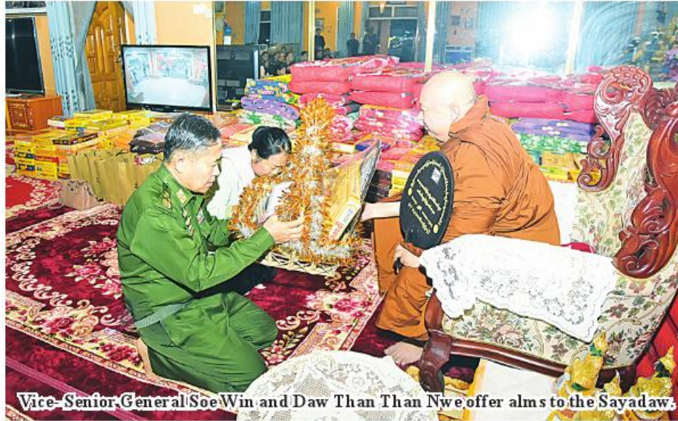
Vice-Senior General Soe Win and Daw Than Than Nwe offer alms to the Sayadaw.