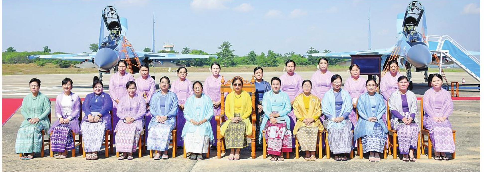
နိုင်ငံတော်စီမံအုပ်ချုပ်ရေးကောင်စီဥက္ကဋ္ဌ တပ်မတော်ကာကွယ်ရေးဦးစီးချုပ် ဗိုလ်ချုပ်မှူးကြီးမင်းအောင်လှိုင်၏ ဓနိ ဒေါ်ကြူကြူလှနှင့်အဖွဲ့ဝင်များ အမှတ်တရပေါင်းဓာတ်ပုံရိုက်စဉ်။

ထိရောက်စွာစွမ်းဆောင်နိုင်သော မဟာဗျူဟာမြောက်စွမ်းရည်အချို့ကိုပိုင်ဆိုင်သည့် နည်းဗျူဟာမြောက် လေတပ်အဖြစ် ကူးပြောင်းရပ်တည်နိုင်ရန် ခြေလှမ်းသစ်တစ်ရပ်ဖြစ်သည်ကို ပြောကြားလိုကြောင်း။