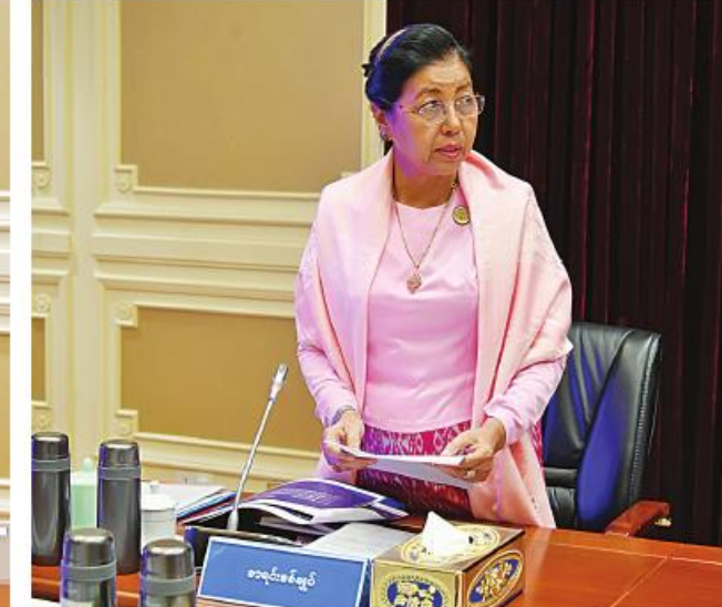
ပြည်ထောင်စုစာရင်းစစ်ချုပ် ဒေါက်တာခင်နိုင်ဦး ရှင်းလင်းတင်ပြစဉ်။

Conferencing ဖြင့် တက်ရောက်ကြသည်။ ဦးစွာ ဘဏ္ဍာရေးဆိုင်ရာကော်မရှင်ဥက္ကဋ္ဌ နိုင်ငံတော်ဝန်ကြီးချုပ် ပိုလ်ချုပ်မှူးကြီး မင်းအောင်လှိုင်က အဖွင့်အမှာစကား ပြောကြားရာတွင် ယနေ့ကျင်းပသည့် ဘဏ္ဍာရေးဆိုင်ရာကော်မရှင်အစည်းအဝေး