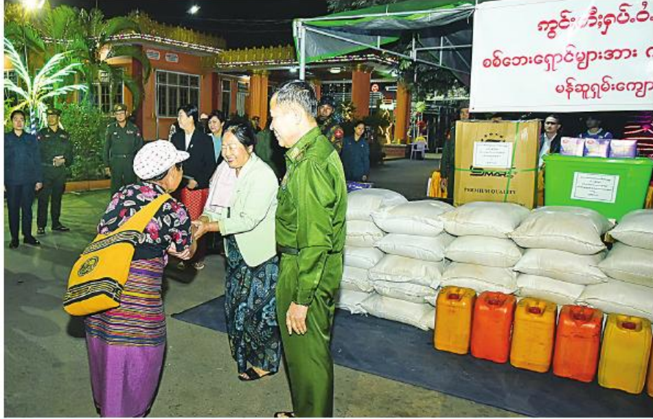
နိုင်ငံတော်စီမံအုပ်ချုပ်ရေးကောင်စီ ဒုတိယဥက္ကဋ္ဌ ဒုတိယတပ်မတော်ကာကွယ်ရေးဦးစီးချုပ် ကာကွယ်ရေးဦးစီးချုပ်(ကြည်း) ဒုတိယဗိုလ်ချုပ်မှူးကြီး ဖိုးဝင်းနှင့် ဇနီး ဒေါ်သန်းသန်းနွယ်တို့က လားရှိုးမြို့ သီရိမင်္ဂလာမန်ဆူရမ်းကျောင်းတိုက်တွင် ရောက်ရှိနေသည့် ယာယီနေရပ်စွန့်ခွာ ဒေသခံပြည်သူများကို ရင်းရင်းနှီးနှီးနှုတ်ဆက်စဉ်။

ကျောပုံးမှအဆက် နိုင်ငံတော်စီမံအုပ်ချုပ်ရေးကောင်စီဥက္ကဋ္ဌ နိုင်ငံတော်ဝန်ကြီးချုပ် တပ်မတော် ကာကွယ်ရေးဦးစီးချုပ်က ပေးအပ်သည့် အဝတ်အထည်များ၊ ဆန်၊ ဆီနှင့် စားသောက်ဖွယ်ရာပစ္စည်းများကို နိုင်ငံတော်စီမံအုပ်ချုပ်ရေးကောင်စီ ဒုတိယဥက္ကဋ္ဌ ဒုတိယတပ်မတော်ကာကွယ်ရေးဦးစီးချုပ် ကာကွယ်ရေးဦးစီးချုပ်(ကြည်း)နှင့် ဇနီးတို့က ပေးအပ်ရာ ယာယီနေရပ်စွန့်ခွာ ဒေသခံပြည်သူများ ကိုယ်စား တာဝန်ရှိသူများက လက်ခံရယူကြသည်။ ထို့နောက် နိုင်ငံတော်စီမံအုပ်ချုပ်ရေးကောင်စီ ဒုတိယဥက္ကဋ္ဌ ဒုတိယတပ်မတော် ကာကွယ်ရေးဦးစီးချုပ် ကာကွယ်ရေးဦးစီးချုပ်(ကြည်း)နှင့် ဇနီးတို့သည် သီရိမင်္ဂလာမန်ဆူရမ်းကျောင်းတိုက်တွင် ရောက်ရှိနေ