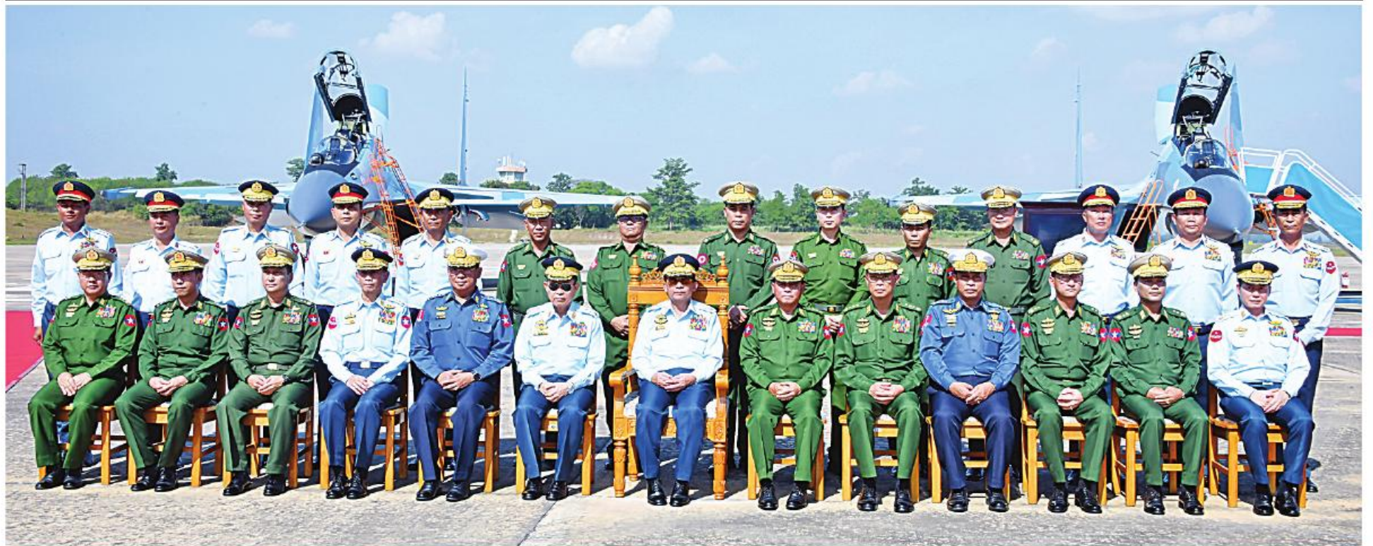
နိုင်ငံတော်စီမံအုပ်ချုပ်ရေးကောင်စီဥက္ကဋ္ဌ တပ်မတော်ကာကွယ်ရေးဦးစီးချုပ် ဗိုလ်ချုပ်မှူးကြီးမင်းအောင်လှိုင်နှင့်အဖွဲ့ဝင်များ အမှတ်တရပေါင်းဓာတ်ပုံရိုက်စဉ်။

ရှေ့မှူးအဆက် လူစွမ်းအားအရင်းအမြစ်တို့၏ အခန်းကဏ္ဍသည် ပဋိပက္ခများ၏ ရလဒ်ကိုအဆုံးအဖြတ်ပေးနိုင်သည်ဟု နိုင်ငံ့မာမာယုံကြည်ထားသကဲ့သို့ ယခင်အတိတ်ကာလအတွေ့အကြုံများက သင်ခန်းစာရယူပြီး အနာဂတ်ကာလအတွက် အောင်မြင်စွာ ကိုင်တွယ်ဖြေရှင်းနိုင်မည့် နည်းလမ်းကောင်းများကို ရှာဖွေသွားရမည် ဖြစ်ကြောင်း။