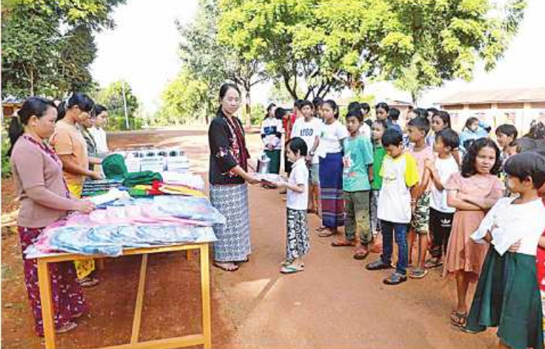
တာဝန်ရှိသူများက တပ်မတော်သားမိသားစုဝင် ကျောင်းသား၊ကျောင်းသူများအတွက် ကျောင်းဝတ်စုံ၊ကျောင်းသုံးစာရေးကိရိယာများနှင့်ထောက်ပံ့ငွေများ ပေးအပ်လှူဒါန်းစဉ်။

နေပြည်တော် ဒီဇင်ဘာ ၁၄ ရှမ်းပြည်နယ် (မြောက်ပိုင်း)အတွင်း အောက်တိုဘာ ၂၇ ရက်မှစ၍ MNDAA၊ TNLA၊ AA အဖွဲ့တို့နှင့် PDFအမည်ခံ ရှမ်းပြည်နယ် (မြောက်ပိုင်း)အတွင်း အကြမ်းဖက်လုပ်ရပ်များကြောင့်အချို့သော ကျေးရွာများ၊ မြို့များ၊ လမ်း၊ တံတားများ ပျက်စီးဆုံးရှုံးခဲ့ရပြီး ဒေသခံပြည်သူလူထု တို့အနေဖြင့် ၎င်းတို့၏နေရပ်မှ တိမ်းရှောင် စွန့်ခွာ၍ လားရှိုးမြို့ရှိ ဘုန်းတော်ကြီးကျောင်းများ၊ စာသင်ကျောင်းများ၊ ဘာသာရေးကျောင်းများ၊ ရုံး၊ အဆောက်အအုံများ၌ ယာယီတည်းခိုနေထိုင်လျက်ရှိသည်။ အဆိုပါ ယာယီနေရပ်စွန့်ခွာ ဒေသခံပြည်သူများ၏ စားဝတ်နေရေးနှင့် အုပ်ချုပ်မှုကိစ္စရပ်များ အဆင်ပြေစေရန် နိုင်ငံတော်အစိုးရနှင့် အချုပ်အခြာအာဏာတည်တံ့ခိုင်မြဲရေး ဒါတွေကိုအစဉ်တစိုက် ရပ်တည်၊ ဆောက်တည်သွားမှာဖြစ်ကြောင်းပြောကြားလိုပါတယ်။