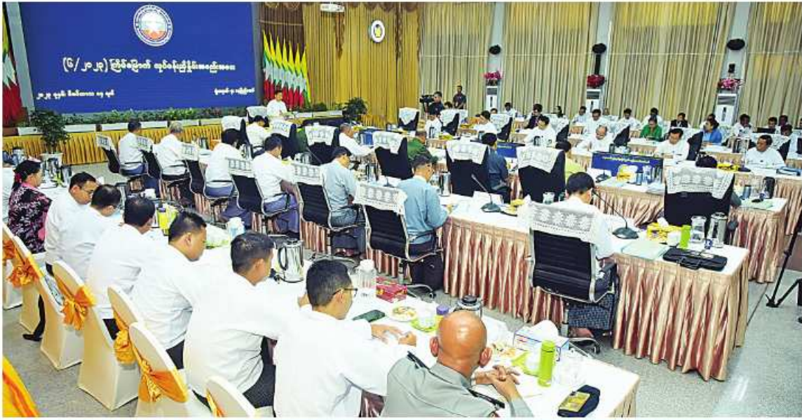
တရားမဝင်ကုန်သွယ်မှုတိုက်ဖျက်ရေးဦးဆောင်ကော်မတီဥက္ကဋ္ဌ နိုင်ငံတော်စီမံအုပ်ချုပ်ရေးကောင်စီဒုတိယဥက္ကဋ္ဌ ဒုတိယဝန်ကြီးချုပ် ဒုတိယဗိုလ်ချုပ်မှူးကြီးစိုးဝင်း၊ တရားမဝင်ကုန်သွယ်မှုတိုက်ဖျက်ရေးဦးဆောင်ကော်မတီ လုပ်ငန်းညှိနှိုင်းအစည်းအဝေး(၆/ ၂၀၂၃)တွင် အမှာစကားပြောကြားစဉ်။

တရားမဝင်ကုန်သွယ်မှုကို ကမ္ဘာ့ကုန်သွယ်ရေးအဖွဲ့က အဓိပ္ပာယ်ဖွင့်ဆိုရာမှာ "နိုင်ငံတကာဥပဒေများအရ သတ်မှတ်ထားသည့် တရားမဝင်ကုန်စည်များကို ထုတ်လုပ်ခြင်း၊ ဝယ်ယူခြင်း၊ ရောင်းချခြင်း၊ ပို့ဆောင်ခြင်း၊ ရွှေ့ပြောင်းခြင်း၊ လွှဲပြောင်းခြင်း၊ လက်ခံရရှိခြင်း၊ လက်ဝယ်ထားရှိခြင်း