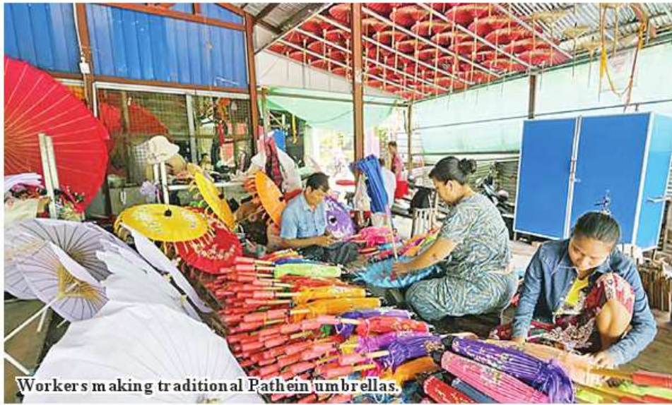
Workers making traditional Pathein umbrellas.

Pathein December 14 The market for the Pathein umbrella has seen a little sign of improvement as the open season has arrived, according to the owners of