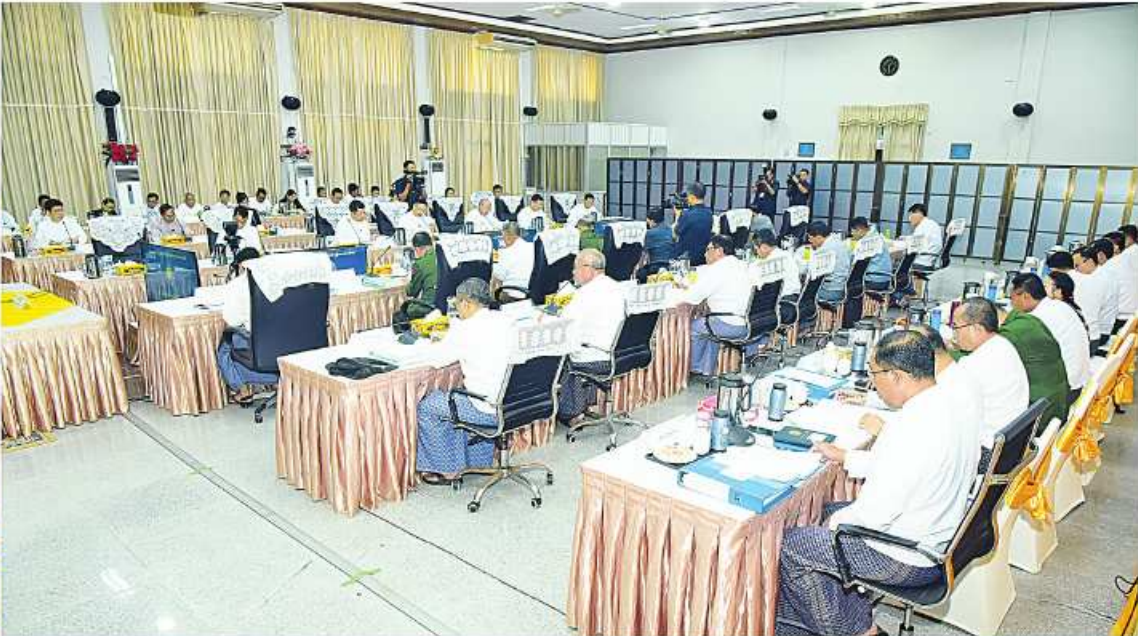
တရားမဝင်ကုန်သွယ်မှုတိုက်ဖျက်ရေးဦးဆောင်ကော်မတီဥက္ကဋ္ဌ နိုင်ငံတော်စီမံအုပ်ချုပ်ရေးကောင်စီ ဒုတိယဥက္ကဋ္ဌ ဒုတိယဝန်ကြီးချုပ် ဒုတိယပိုလ်ချုပ်မှူးကြီးစိုးဝင်း တရားမဝင်ကုန်သွယ်မှုတိုက်ဖျက်ရေးဦးဆောင်ကော်မတီ လုပ်ငန်းညှိနှိုင်းအစည်းအဝေး(၆/၂၀၂၃)တွင် အမှာစကားပြောကြားစဉ်။

နေပြည်တော် ဒီဇင်ဘာ ၁၄ ရေးနှင့် ကူးသန်းရောင်းဝယ်ရေးဝန်ကြီးဌာန ဝန်ကြီးချုပ် ဒုတိယပိုလ်ချုပ်မှူးကြီးစိုးဝင်း နှင့် ဦးထွန်းအံ့၊ ဒုတိယဝန်ကြီးများ၊ နေပြည်တော် တရားမဝင်ကုန်သွယ်မှုတိုက်ဖျက်ရေးဦးဆောင်ကော်မတီလုပ်ငန်းညှိနှိုင်းအစည်းအဝေး(၆/၂၀၂၃) တိုက်ဖျက်ရေးဦးဆောင်ကော်မတီဥက္ကဋ္ဌ နိုင်ငံတော် ကို ယနေ့မွန်းလွဲပိုင်းတွင် နေပြည်တော်ရှိ စီးပွား စီမံအုပ်ချုပ်ရေးကောင်စီ ဒုတိယဥက္ကဋ္ဌ ဒုတိယ ဩသည့် ဦးဝင်းရှိန်၊ ဒုတိယပိုလ်ချုပ်ကြီးရာပြည့် အဖွဲ့များမှ စာမျက်နှာ ၁၈ ကော်လံ ၁၂၅