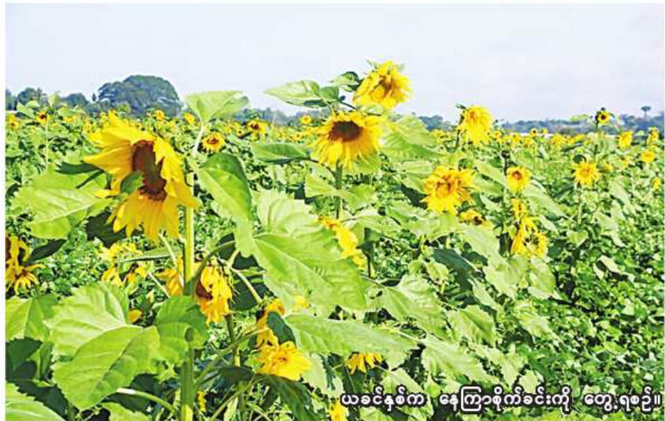
ယခင်နှစ်က နေကြာစိုက်ခင်းကို တွေ့ရစဉ်။