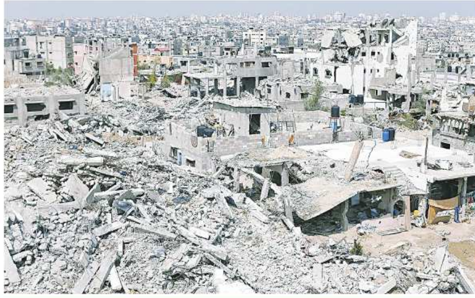
အစွရေးပဋိပက္ခတွင် တိုက်ခိုက်ခံရသည့် ဂါလာဒေသအဆောက်အအုံများ

အီရန်အနေဖြင့် စစ်ပွဲတွင်ပါဝင်ရန်ဆုံးဖြတ်ခဲ့မည် ဆိုလျှင် ပါရုန်ပင်လယ်ကွေ့မှဖြတ်သန်းသွားလာနေ သောသင်္ဘောများနှင့် ဆီသယ်သင်္ဘောများအပေါ် ဟန့်တားနှောင့်ယှက်မှုများ ဖြစ်ပေါ်လာနိုင်ပေသည်။ ထိုထက်ပိုမိုဆိုးရွားလာမည်ဆိုလျှင် အခြေခံအဆောက်