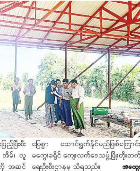
မကွေးမြို့နယ် သံဘိုရွာသစ်ခေတ်မီစံပြကျေးရွာ၌ ဘက်စုံသုံးခန်းမတည်ဆောက်နေမှု စစ်ဆေး

ခဲ့ကြောင်း သိရသည်။ မကွေးမြို့နယ် သံဘိုရွာသစ်ခေတ်မီစံပြ ကျေးရွာ၌ ဘက်စုံသုံးခန်းမတည်ဆောက် ခြင်းလုပ်ငန်းကို ကျေးလက်ဒေသဖွံ့ဖြိုးတိုး တက်ရေးဦးစီးဌာနက ၂၀၂၃-၂၀၂၄ ဘဏ္ဍာနှစ်တွင် ခေတ်မီစံပြကျေးရွာစီမံ ကိန်း(Smart Village)ရန်ပုံငွေကျပ် ၂၅ ဒသမ ၅ သန်းဖြင့် မကွေးမြို့နယ် ကျေး လက်ဒေသဖွံ့ဖြိုးတိုးတက်ရေးဦးစီးဌာနက တာဝန်ယူ၍ အောက်တိုဘာ ၂၀ ရက်က စတင်ဆောင်ရွက်ခဲ့ရာ ယခုအခါ လုပ်ငန်း များ ၈၀ ရာခိုင်နှုန်းခန့် ပြီးစီးနေပြီဖြစ်