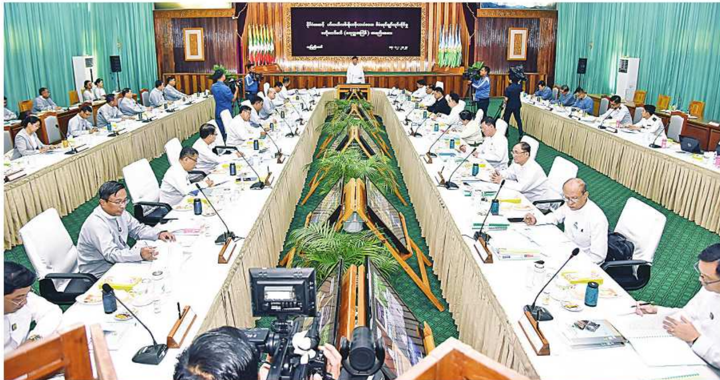
နိုင်ငံတော်စီမံအုပ်ချုပ်ရေးကောင်စီအဖွဲ့ဝင် ဒုတိယဝန်ကြီးချုပ်နှင့် ပို့ဆောင်ရေးနှင့်ဆက်သွယ်ရေးဝန်ကြီးဌာန ပြည်ထောင်စုဝန်ကြီး ဗိုလ်ချုပ်ကြီးမြထွန်းဦး နိုင်ငံအဆင့် ပင်လယ်ကမ်းရိုးတန်းသယ်ယာပို့ဆောင်ရေးအစီအမံများကို စတုတ္ထအကြိမ်အစည်းအဝေးတွင် အမှာစကားပြောကြားစဉ်။

နေပြည်တော် ၁၄ ဇူလိုင် ၂၀၂၃ - နိုင်ငံအဆင့် ပင်လယ်ကမ်းရိုးတန်းသယ်ယာပို့ဆောင်ရေးအစီအမံများကို စတုတ္ထအကြိမ်အစည်းအဝေးကို ယနေ့မနက် ၉ နာရီတွင် နေပြည်တော်ရှိ သယ်ယာပို့ဆောင်ရေး ဝန်ကြီးဌာန သစ်တောဌာန အကြီးကြပ်ရေးမှူးချုပ် ဦးမြထွန်းဦး၏ အမှာစကားပြောကြားမှုတွင် ပြည်ထောင်စုဝန်ကြီး ဦးမြထွန်းဦးက ပင်လယ်ကမ်းရိုးတန်းသယ်ယာပို့ဆောင်ရေးအစီအမံများကို စတုတ္ထအကြိမ်အစည်းအဝေးတွင် အမှာစကားပြောကြားခဲ့သည်။ ဦးမြထွန်းဦးက ပင်လယ်ကမ်းရိုးတန်းသယ်ယာပို့ဆောင်ရေးအစီအမံများကို စတုတ္ထအကြိမ်အစည်းအဝေးတွင် အမှာစကားပြောကြားခဲ့သည်။ ဦးမြထွန်းဦးက ပင်လယ်ကမ်းရိုးတန်းသယ်ယာပို့ဆောင်ရေးအစီအမံများကို စတုတ္ထအကြိမ်အစည်းအဝေးတွင် အမှာစကားပြောကြားခဲ့သည်။