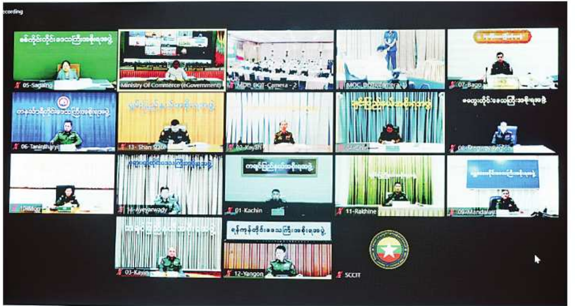
တိုင်းဒေသကြီးနှင့် ပြည်နယ် တရားမဝင်ကုန်သွယ်မှုတိုက်ဖျက်ရေးအထူးအဖွဲ့ဥက္ကဋ္ဌများက ဝီဒီယိုကွန်ဖရင့်စနစ်ဖြင့် တက်ရောက်ကြစဉ်။