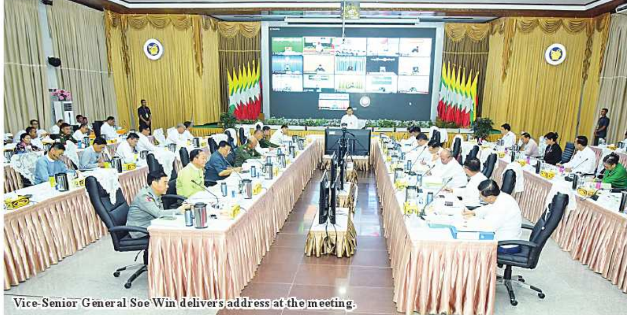
Vice-Senior General Soe Win delivers address at the meeting.