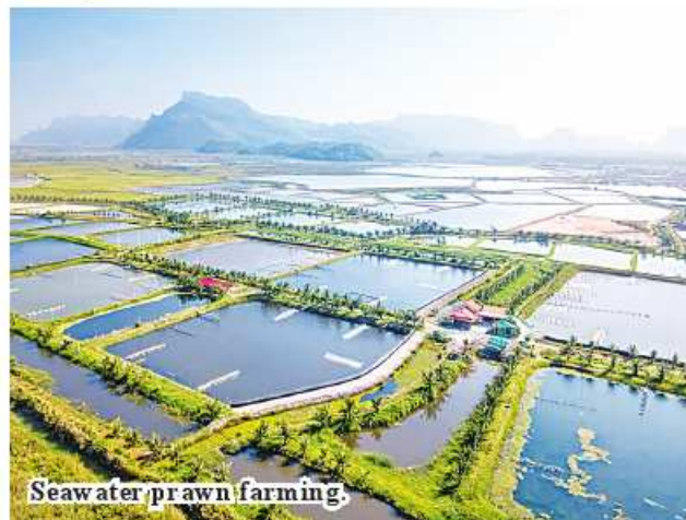
Seawater prawn farming.

In November 2023, Taninthayi Region's Myeik District was able to ex-