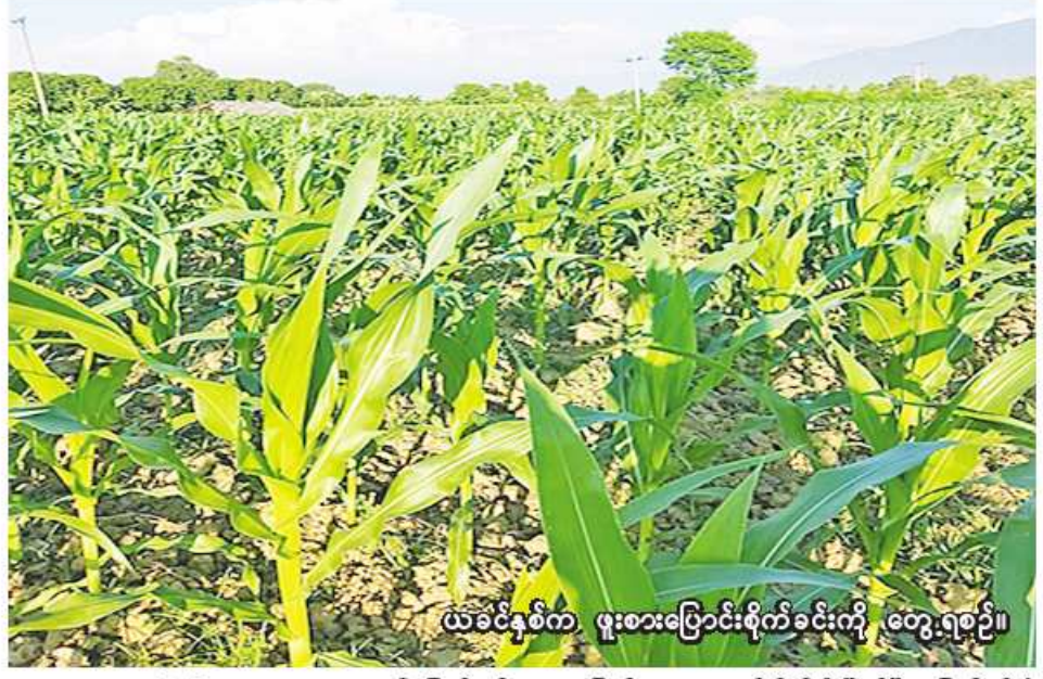
ယခင်နှစ်က ဖူးစားပြောင်းစိုက်ခင်းကို တွေ့ရစဉ်။