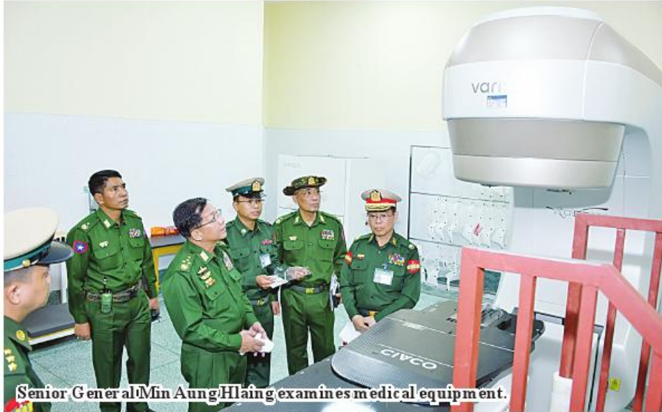
Senior General Min Aung Hlaing examines medical equipment.