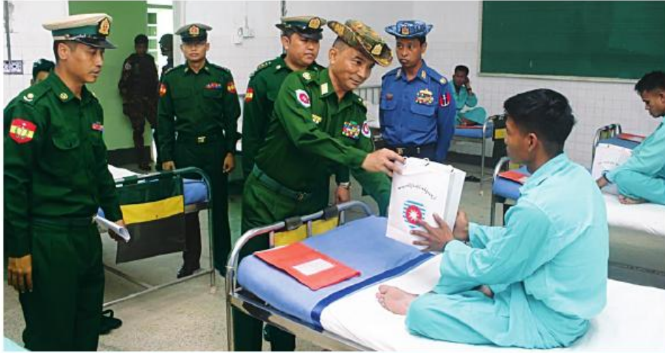
အနောက်ပိုင်းတိုင်းစစ်ဌာနချုပ် တိုင်းမှူး ဝိုလ်ချုပ်ထင်လတ်ဦး ဆေးကုသမှုခံယူနေသူ တစ်ဦးကို အာဟာရပြည့်စုံသောက်ဖွယ်ရာများ ထောက်ပံ့ပေးအပ်စဉ်။

နေပြည်တော် ၁၆ ဇူလိုင် တက်ရောက် ဆေးကုသမှုခံယူနေသူများကို အာဟာရပြည့်စုံသောက်ဖွယ်ရာများ ထောက်ပံ့ပေးအပ်စဉ်။