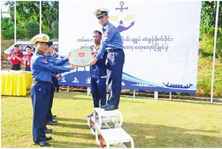
တပ်မတော်ကာကွယ်ရေးဦးစီးချုပ်ခိုင်းအလယ်ပိုင်းတိုင်းစစ်ဌာနချုပ်မှ တာဝန်ရှိသူတစ်ဦးက ဝိုလ်လှပွဲအဖွဲ့ဝင်များကို ဆုပေးအပ်စဉ်။

နေပြည်တော် ၁၆ ဇူလိုင် ၂၀၂၃ ခုနှစ် တပ်မတော်ကာကွယ်ရေးဦးစီးချုပ်ခိုင်း တပ်မတော်(ကြည်း၊ ရေ၊ လေ) လှေလှော်ပြိုင်ပွဲ ဝိုလ်လှပွဲနှင့်ဆုပေးပွဲကို ယနေ့နံနက်ပိုင်းတွင် ရန်ကုန်မြို့၊ ပြောကြားပြီး တက်ရောက်လာသူများနှင့် တပ်မတော်(ရေ) လှေလှော်ရွက်တိုက်အသင်း (အင်းလျားကန်)၌ ပြုလုပ်ရာ ရေတပ်မှ သင်္ဘောကျင်းဌာနချုပ်မှ တာဝန်ရှိသူများ၊ အရာရှိ၊ စစ်သည်၊ မိသားစုများ၊ မြန်မာနိုင်ငံလှေလှော်အဖွဲ့ချုပ် ဥက္ကဋ္ဌနှင့် တက္ကသိုလ်များလှေလှော်အသင်း တို့မှ တာဝန်ရှိသူများ၊ ဝိုလ်လှပွဲအဖွဲ့ဝင်များ၊ ဝိုလ်လှပွဲအဖွဲ့ဝင်အားကစားသမားများနှင့် အားကစား ကာကွယ်ရေးဦးစီးချုပ် ကိုယ်စား ဝန်ထမ်းများ တက်ရောက်ကြသည်။