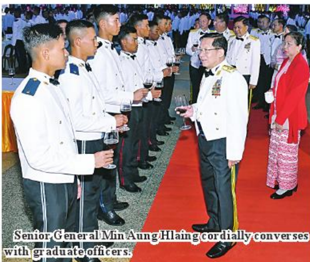
Senior General Min Aung Hlaing cordially converses with graduate officers.

Nay Pyi Taw December 8 The graduation dinner of the 65 th Intake of Defence Services Academy took place at the cadet mess hall of Anawrahta Battalion at Defence Services Academy in PyinOoLwin this evening, attended by State Administration Council Chairman Commander-in-Chief of Defence Services Senior General Min Aung Hlaing.