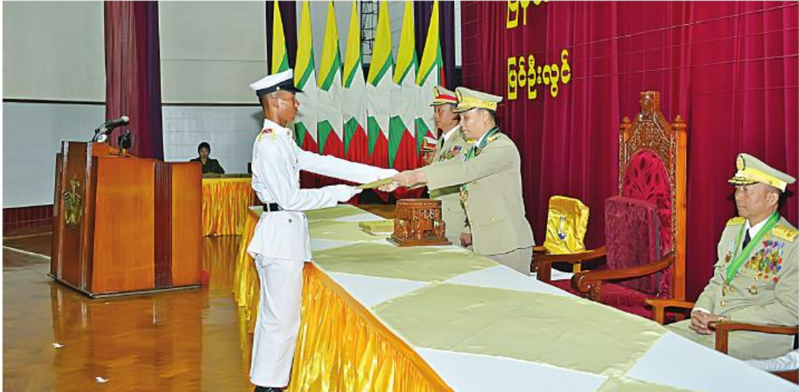
ကာကွယ်ရေးဦးစီးချုပ်ရုံး(ကြည်း) စစ်ရာထူးခန့်ချုပ် ဒုတိယဗိုလ်ချုပ်ကြီးလင်းအောင် ကျောင်းဆင်းရိုလ်လောင်းတစ်ဦးချင်းစီကို ပြန်တမ်းဝင်ခန့်အပ်လွှာများပေးအပ်စဉ်။

ပြန်ကြားရေးဆက်ကော်မတီ၊ သဝဏ်လွှာပြုစုရေးဆက်ကော်မတီ၊ ကျန်းမာရေးဆက်ကော်မတီ၊ အားကစားပြိုင်ပွဲများ ကျင်းပရေးဆက်ကော်မတီနှင့် စာရင်းစစ်ဆေးရေးကော်မတီတို့က ၂၀၂၄ ခုနှစ် (၇၆)နှစ်မြောက်လွတ်လပ်ရေးနေ့ အခမ်းအနားအောင်မြင်စွာကျင်းပနိုင်ရေးအတွက် သက်ဆိုင်ရာကဏ္ဍအလိုက်ရှင်းလင်းတင်ပြကြသည်။ ထို့နောက် ၂၀၂၄ ခုနှစ် (၇၆)နှစ်မြောက်လွတ်လပ်ရေးနေ့ကျင်းပရေးပဟိုက်ကော်မတီဥက္ကဋ္ဌ နိုင်ငံတော်စီမံအုပ်ချုပ်ရေးကောင်စီ ဒုတိယဥက္ကဋ္ဌ ဒုတိယဝန်ကြီးချုပ်က ရှင်းလင်းဆွေးနွေးတင်ပြချက်များအပေါ် လိုအပ်သည်များ ပေါင်းစပ်ညှိနှိုင်းဆောင်ရွက်ပေးပြီး နိဂုံးချုပ်အမှာစကားပြောကြားကာ အစည်းအဝေးကို ရုပ်သိမ်းလိုက်ကြောင်း သတင်းရရှိသည်။