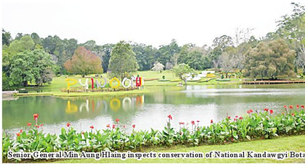
Senior General Min Aung Hlaing inspects conservation of National Kandawgyi Botanical Gardens.