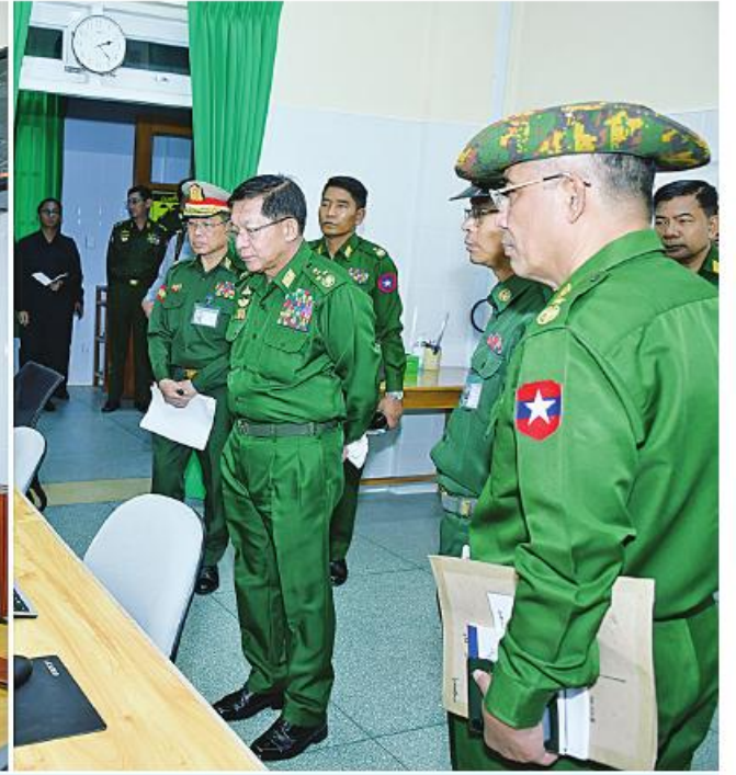
နိုင်ငံတော်စီမံအုပ်ချုပ်ရေးကောင်စီဥက္ကဋ္ဌ တပ်မတော်ကာကွယ်ရေးဦးစီးချုပ် ဗိုလ်ချုပ်မှူးကြီးမင်းအောင်လှိုင် ဓာတ်ရောင်ခြည်ကုသဓာတ်နှင့် CTစက်ဖြင့် ရောဂါရှိသည့်နေရာများအား တိကျစွာပုံဖော်သည့်စက်တို့ တပ်ဆင်သုံးစွဲထားမှုအခြေအနေများကို ကြည့်ရှုစစ်ဆေးစဉ်။