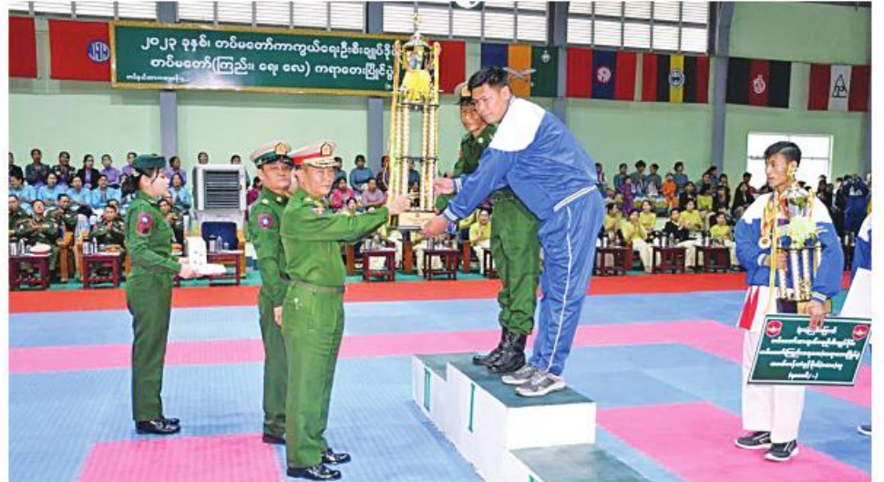
တပ်မတော်ကာကွယ်ရေးဦးစီးချုပ်ခိုင်းအလယ်ပိုင်းတိုင်းစစ်ဌာနချုပ်မှ တာဝန်ရှိသူတစ်ဦးက ဝိုလ်လှပွဲအဖွဲ့ဝင်များကို ဆုပေးအပ်စဉ်။

နေပြည်တော် ၁၆ ဇူလိုင် ၂၀၂၃ ခုနှစ် တပ်မတော်ကာကွယ်ရေးဦးစီးချုပ်ခိုင်း တပ်မတော်(ကြည်း၊ ရေ၊ လေ) ကရာတေးပြိုင်ပွဲ ဝိုလ်လှပွဲနှင့်ဆုပေးပွဲကို ယနေ့နံနက်ပိုင်းတွင် အလယ်ပိုင်းတိုင်း စစ်ဌာနချုပ်ရှိ အားကစားခန်းမ၌ပြုလုပ်ရာ တိုင်းစစ်ဌာနချုပ်မှ တာဝန်ရှိသူများ၊ အရာရှိ၊ စစ်သည်၊ မိသားစုဝင်များ၊ ဝိုလ်လှပွဲအဖွဲ့ဝင်များ၊ ဝိုလ်လှပွဲအဖွဲ့ဝင်များနှင့် ပြိုင်ပွဲဝင် အားကစားသမားများ တက်ရောက်ကြသည်။