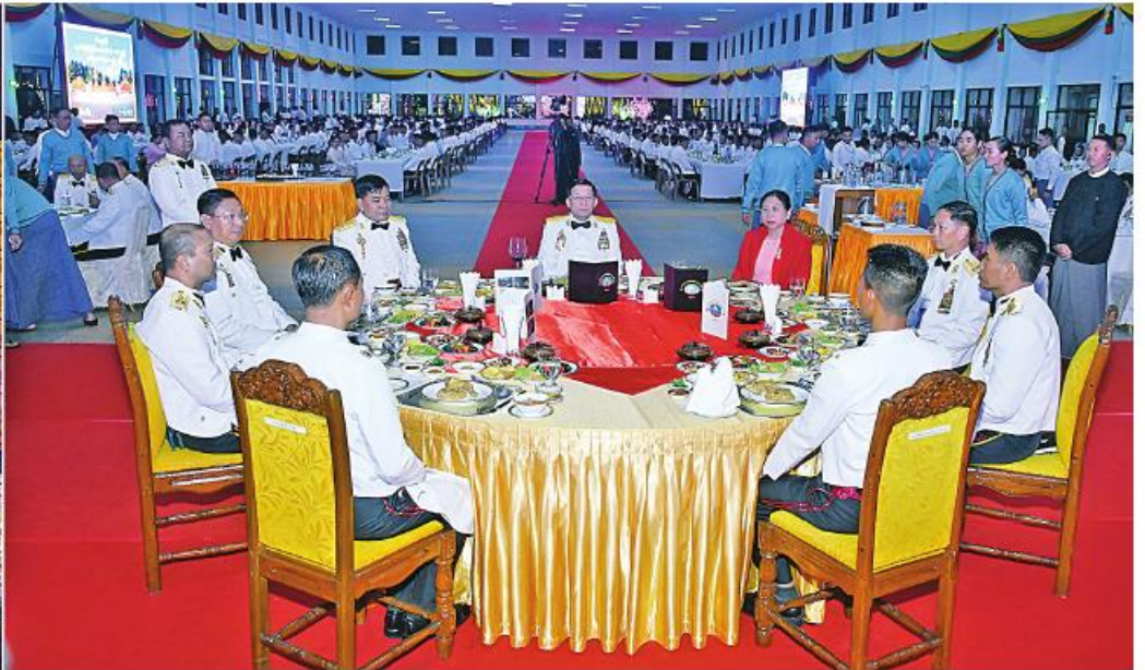
နိုင်ငံတော်စီမံအုပ်ချုပ်ရေးကောင်စီဥက္ကဋ္ဌ တပ်မတော်ကာကွယ်ရေးဦးစီးချုပ် ဝိုလ်ချုပ်မှူးကြီးမင်းအောင်လှိုင်နှင့်ဗိုလ်ချုပ်မှူးကြီး ဒေါ်ကြူကြူလှ၊ အစမ်းအနားတက်ရောက်လာကြသူများက ပြည်သူ့ဆက်ဆံရေးနှင့်စိတ်ဓာတ်စစ်ဆင်ရေး ညွှန်ကြားရေးမှူးရုံးကွပ်ကဲမှုအောက် မြဝတီတေးဂီတအဖွဲ့၏တေးသီချင်းများဖြင့် သီဆိုတီးမှုတ်ဖျော်ဖြေမှုကို ကြည့်ရှုအားပေးခဲ့။

နေပြည်တော် ၆ ဇူလိုင် ၂၀၂၃ စစ်တက္ကသိုလ် ဗိုလ်လောင်းသင်တန်း အမှတ်စဉ်(၆၅) သင်တန်းဆင်းဂုဏ်ပြုညစာ စားပွဲအခမ်းအနားကို ယနေ့ညနေပိုင်းတွင် ပြင်ဦးလွင်မြို့၊ စစ်တက္ကသိုလ် အနော်ရထာ တပ်ရင်းဗိုလ်လောင်းစားရိပ်သာ၌ ကျင်းပ ပြုလုပ်ရာ နိုင်ငံတော်စီမံအုပ်ချုပ်ရေး ကောင်စီဥက္ကဋ္ဌ တပ်မတော်ကာကွယ်ရေး ဦးစီးချုပ် ဝိုလ်ချုပ်မှူးကြီးမင်းအောင်လှိုင် တက်ရောက်ခဲ့ခြင်းဖြစ်သည်။