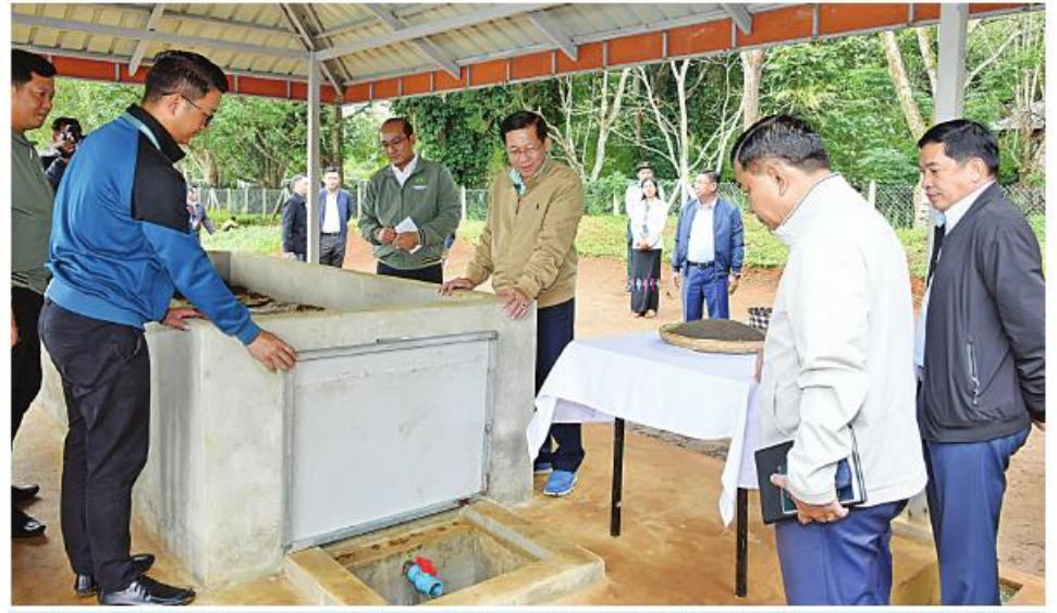
နိုင်ငံတော်စီမံအုပ်ချုပ်ရေးကောင်စီဥက္ကဋ္ဌ နိုင်ငံတော်ဝန်ကြီးချုပ် ဝိုလ်ချုပ်မှူးကြီးမင်းအောင်လှိုင် တံကျစ် မြေညှာထုတ်လုပ်ထားရှိမှုအခြေအနေများကို ကြည့်ရှုစစ်ဆေးခဲ့။

စာမျက်နှာ ၁၉ မှအဆက် သတ်မှတ်ချက်နှင့် ပမာဏထက်ပင် ကျော်လွန်သည်အထိ ထိန်းသိမ်းဆောင်ရွက် နိုင်ခဲ့ပြီးဖြစ်ကြောင်း၊ ထို့ပြင် မူလရှိရင်းစွဲ