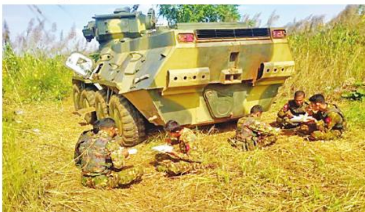
စေတနာရှင်အလှူရှင်ပြည်သူများက လှူဒါန်းသော ထောပတ်ထမင်းဘူးများ လုံခြုံရေးတပ်ဖွဲ့ဝင်များလက်ဝယ်သို့ ရောက်ရှိစဉ်။