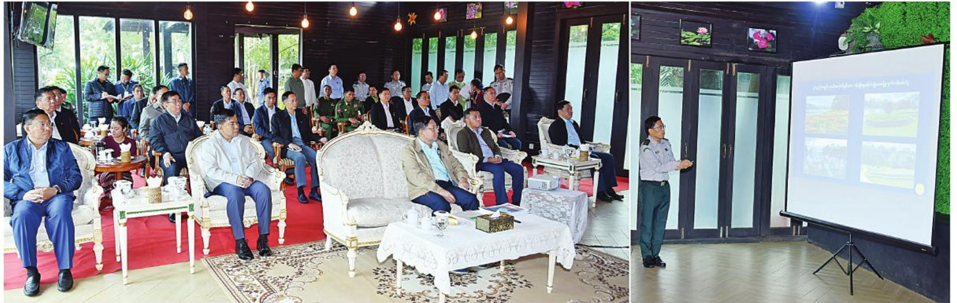
နိုင်ငံတော်စီမံအုပ်ချုပ်ရေးကောင်စီဥက္ကဋ္ဌ နိုင်ငံတော်ဝန်ကြီးချုပ် ဝိုင်းချုပ်မှူးကြီးမင်းအောင်လှိုင်အား သစ်တောဦးစီးဌာန ညွှန်ကြားရေးမှူးချုပ် ဒေါက်တာသောင်းနိုင်ဦးက ရှင်းလင်းတင်ပြစဉ်။

နေပြည်တော် ၃ ဇန်နဝါရီ ၈ နိုင်ငံတော်စီမံအုပ်ချုပ်ရေးကောင်စီဥက္ကဋ္ဌ နိုင်ငံတော်ဝန်ကြီးချုပ် ဝိုင်းချုပ်မှူးကြီး မင်းအောင်လှိုင်သည် ယနေ့နံနက်ပိုင်းတွင် ကောင်စီတွဲဖက်အတွင်းရေးမှူး ဒုတိယ