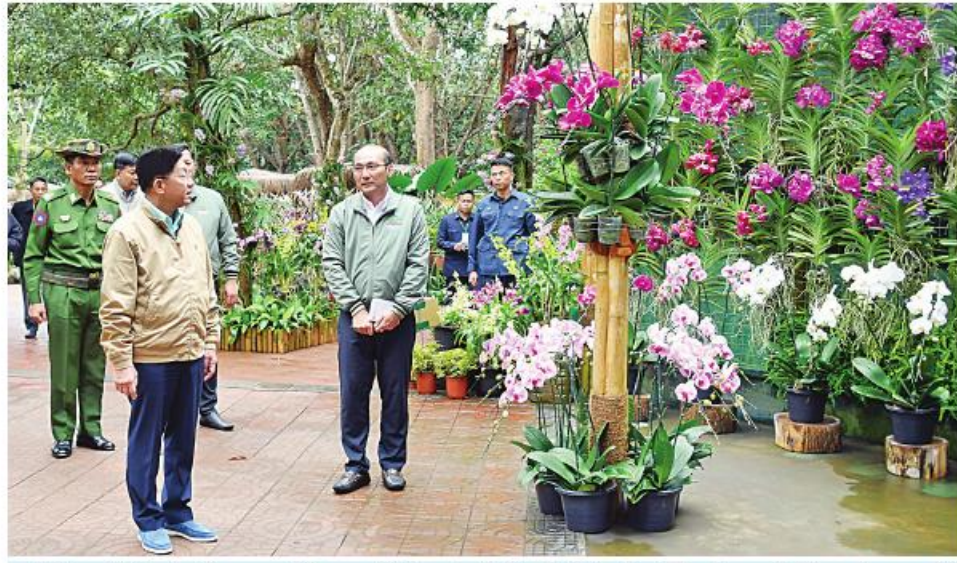
နိုင်ငံတော်စီမံအုပ်ချုပ်ရေးကောင်စီဥက္ကဋ္ဌ နိုင်ငံတော်ဝန်ကြီးချုပ် ဝိုလ်ချုပ်မှူးကြီးမင်းအောင်လှိုင် သစ်ခွေညှာပုံ၌ ပြသထားရှိမှုများကို ကြည့်ရှုစစ်ဆေးခဲ့။

ကွပ်ကဲမှုအောက် မြဝတီတေးဂီတအဖွဲ့က တေးသီချင်းများဖြင့် သီဆိုတီးမှုတ်ဖျော်ဖြေ ကြရာ နိုင်ငံတော်စီမံအုပ်ချုပ်ရေးကောင်စီ ဥက္ကဋ္ဌ တပ်မတော်ကာကွယ်ရေးဦးစီးချုပ် နှင့် တက်ရောက်လာကြသူများက ကြည့်ရှု အားပေးခဲ့ကြောင်း သတင်းရရှိသည်။