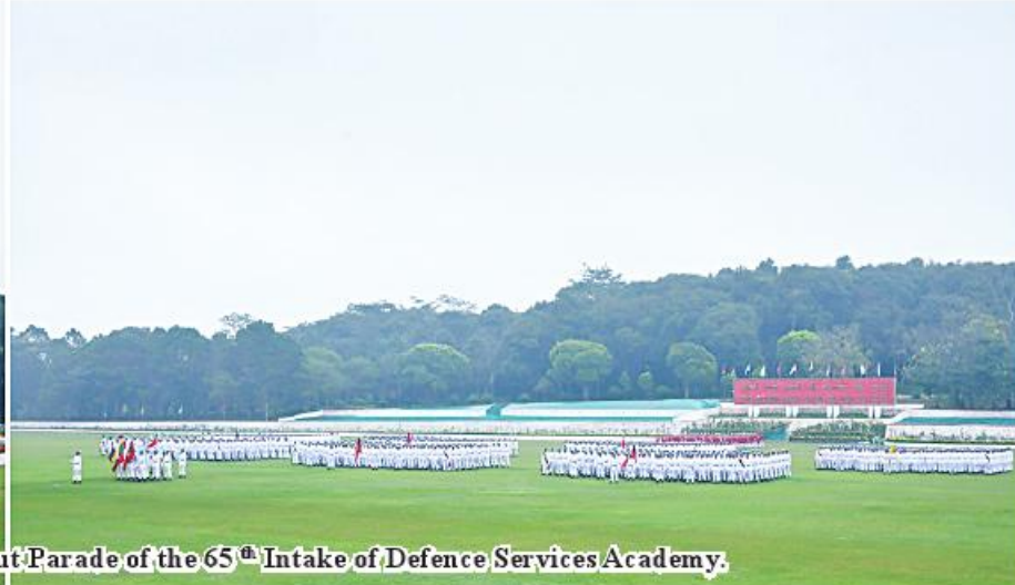
Senior General Min Aung Hlaing addresses the Passing-out Parade of the 65 th Intake of Defence Services Academy.

Nay Pyi Taw December 8 The Passing-out Parade of the 65 th Intake of Defence Services Academy was held at the parade ground of DSA in Pyin Oo Lwin this morning with an address by Chairman of State Administration Council Commander-in-Chief of Defence Services Senior General Thadoe Maha Thray Sithu Thadoe Thiri Thudhamma Min Aung Hlaing.