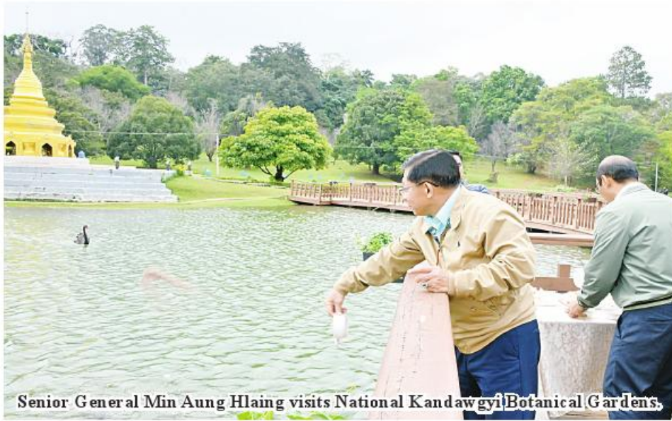
Senior General Min Aung Hlaing visits National Kandawgyi Botanical Gardens.