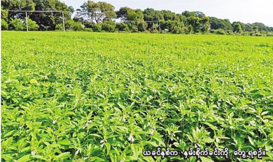
ယခုနှစ်က နှမ်းစိုက်ခင်းကို တွေ့ရစဉ်။

အင်းတော် ဒီဇင်ဘာ ၈ စစ်ကိုင်းတိုင်းဒေသကြီး ကသာခရိုင် အင်းတော်မြို့နယ်တွင် ယခုနှစ် ဆောင်းသီးနှံစိုက်ပျိုးရာသီ၌ နှမ်း ၁၁၆၂၅ ဧကစိုက်ပျိုးပြီးစီး ပြီးကြောင်း အင်းတော်မြို့နယ် စိုက်ပျိုးရေးဦးစီးဌာနမှ သိရသည်။ အင်းတော်မြို့နယ်တွင် ယခုနှစ် ဆောင်းသီးနှံစိုက်ပျိုးရာသီ၌