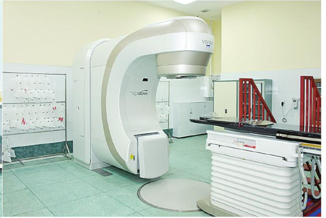
နိုင်ငံတော်စီမံအုပ်ချုပ်ရေးကောင်စီဥက္ကဋ္ဌ တပ်မတော်ကာကွယ်ရေးဦးစီးချုပ် ဗိုလ်ချုပ်မှူးကြီးမင်းအောင်လှိုင် ဓာတ်ရောင်ခြည်ကုသဓာတ်နှင့် CT စက်ဖြင့် ရောဂါရှိသည့်နေရာများအား တိကျစွာပုံဖော်သည့်စက်တို့ တပ်ဆင်သုံးစွဲထားမှုအခြေအနေများကို ကြည့်ရှုစစ်ဆေးစဉ်။