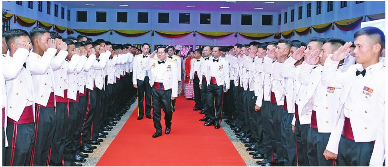
နိုင်ငံတော်စီမံအုပ်ချုပ်ရေးကောင်စီဥက္ကဋ္ဌ တပ်မတော်ကာကွယ်ရေးဦးစီးချုပ် ဝိုလ်ချုပ်မှူးကြီးမင်းအောင်လှိုင် သင်တန်းဆင်းအရာရှိများအား တစ်ဦးချင်းရင်းရင်းနှီးနှီးလိုက်လံ နှုတ်ဆက်ခဲ့။

အဆိုပါသင်တန်းဆင်း ဂုဏ်ပြုညစာ စားပွဲအခမ်းအနားသို့ နိုင်ငံတော်စီမံအုပ်ချုပ် ရေးကောင်စီဥက္ကဋ္ဌ တပ်မတော်ကာကွယ် ရေးဦးစီးချုပ်နှင့်အတူ ဇနီး ဒေါ်ကြူကြူလှ၊ ညွှန်ကြားရေးမှူးရုံး (ကြည်း၊ ရေ၊ လေ) ဝိုလ်ချုပ်ကြီးမောင်မောင်အေးနှင့် ဇနီး၊ ကာကွယ်ရေးဦးစီးချုပ်(ရေ) ဝိုလ်ချုပ်ကြီး မိုးအောင်နှင့် ဇနီး၊ ကာကွယ်ရေးဦးစီးချုပ် (လေ) ဝိုလ်ချုပ်ကြီးထွန်းအောင်နှင့် ဇနီး၊ ကာကွယ်ရေးဦးစီးချုပ်မှူး တပ်မတော် အရာရှိကြီးများနှင့် ဇနီးများ၊ ပြည်ထောင်စု ဝန်ကြီးများ၊ မန္တလေးတိုင်းဒေသကြီးဝန်ကြီး ချုပ်နှင့် ဇနီး၊ အလယ်ပိုင်းတိုင်းစစ်ဌာနချုပ် တိုင်းမှူး၊ စစ်တက္ကသိုလ်ကျောင်းအုပ်ကြီး၊ ပြင်ဦးလွင်တပ်နယ်မှ တာဝန်ရှိသူများ၊ ကျောင်းဆင်းအရာရှိများ၏ မိဘအုပ်ထိန်း