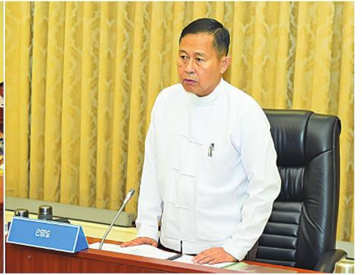
၂၀၂၄ ခုနှစ် (၇၆)နှစ်မြောက် လွတ်လပ်ရေးနေ့ကျင်းပရေးပဟိုက်ကော်မတီဥက္ကဋ္ဌ နိုင်ငံတော်စီမံအုပ်ချုပ်ရေးကောင်စီ ဒုတိယဥက္ကဋ္ဌ ဒုတိယဝန်ကြီးချုပ် ဒုတိယဗိုလ်ချုပ်မှူးကြီးစိုးဝင်း ၂၀၂၄ ခုနှစ် (၇၆)နှစ်မြောက် လွတ်လပ်ရေးနေ့ကျင်းပရေးပဟိုက်ကော်မတီ ဒုတိယအကြိမ်ညှိနှိုင်းအစည်းအဝေးတွင် အမှာစကားပြောကြားစဉ်။

နေပြည်တော် ဒီဇင်ဘာ ၈ ၂၀၂၄ ခုနှစ် (၇၆)နှစ်မြောက်လွတ်လပ်ရေးနေ့ကျင်းပရေးပဟိုက်ကော်မတီ ဒုတိယအကြိမ် ညှိနှိုင်းအစည်းအဝေးကို ယနေ့ မွန်းလွဲ ၂ နာရီခွဲတွင် နေပြည်တော်ရှိ နိုင်ငံတော်စီမံအုပ်ချုပ်ရေးကောင်စီ ဥက္ကဋ္ဌ ရုံးအစည်းအဝေးခန်းမ၌ကျင်းပရာ ၂၀၂၄ ခုနှစ် (၇၆)နှစ်မြောက် လွတ်လပ်ရေးနေ့ကျင်းပရေးပဟိုက်ကော်မတီဥက္ကဋ္ဌ နိုင်ငံတော်စီမံအုပ်ချုပ်ရေးကောင်စီ ဒုတိယဥက္ကဋ္ဌ ဒုတိယဝန်ကြီးချုပ် ဒုတိယဗိုလ်ချုပ်မှူးကြီးစိုးဝင်း တက်ရောက်အမှာစကားပြောကြားသည်။ အစည်းအဝေးသို့ ပဟိုက်ကော်မတီဝင် ပြည်ထောင်စုဝန်ကြီးများ၊ နေပြည်တော်ကောင်စီဥက္ကဋ္ဌ၊ နေပြည်တော်တိုင်းစစ်ဌာနချုပ် တိုင်းမှူး၊ ဒုတိယဝန်ကြီး