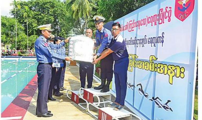
တပ်မတော်ကာကွယ်ရေးဦးစီးချုပ်ကိုယ်စား နယ်မြေခံရေတပ်ကွပ်ကဲမှုဌာနချုပ်မှူးက ခိုင်းဆုပေးအပ်ချီးမြှင့်စဉ်။

ကိုယ်စား ရေတပ်ကွပ်ကဲမှုဌာနချုပ်မှူးက အမှာစကားပြောကြားပြီး တက်ရောက်လာကြသူများနှင့်အတူ ပြိုင်ပွဲဝင်အသင်းများ၏ ဗိုလ်လုပွဲယှဉ်ပြိုင်မှုများကို ကြည့်ရှုအားပေးကြသည်။ ထို့နောက် ဆုပေးပွဲကိုဆက်လက်ပြုလုပ်ရာ ပြိုင်ပွဲအမျိုးအစားအလိုက်ဆုရရှိသူများကို တာဝန်ရှိသူများကလည်းကောင်း၊ ခိုင်းဆုရရှိသော ကာကွယ်ရေးဦးစီးချုပ်ရုံး(ရေ)ကိုယ်စားပြုအသင်းကို တပ်မတော်ကာကွယ်ရေးဦးစီးချုပ်ကိုယ်စား ရေတပ်ကွပ်ကဲမှုဌာနချုပ်မှူးကလည်းကောင်း ဆုများအသီးသီးပေးအပ်ချီးမြှင့်ခဲ့ကြကြောင်း သတင်းရရှိသည်။