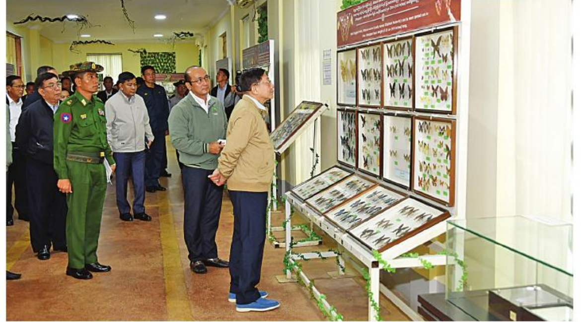
နိုင်ငံတော်စီမံအုပ်ချုပ်ရေးကောင်စီဥက္ကဋ္ဌ နိုင်ငံတော်ဝန်ကြီးချုပ် ဝိုင်းချုပ်မှူးကြီးမင်းအောင်လှိုင် လိပ်ပြာပြတိုက်တွင် ပြသထား ရှိမှုများကို ကြည့်ရှုစစ်ဆေးစဉ်။

အထိမ်းအမှတ် နေရာ (Land Mark) တစ်ခုဖြစ်သဖြင့် ရေရှည်တည်တံ့စေရေးနှင့် ခရီးသွားများ အမြဲမပြတ်လည်ပတ်နိုင်ရေး စဉ်ဆက်မပြတ်