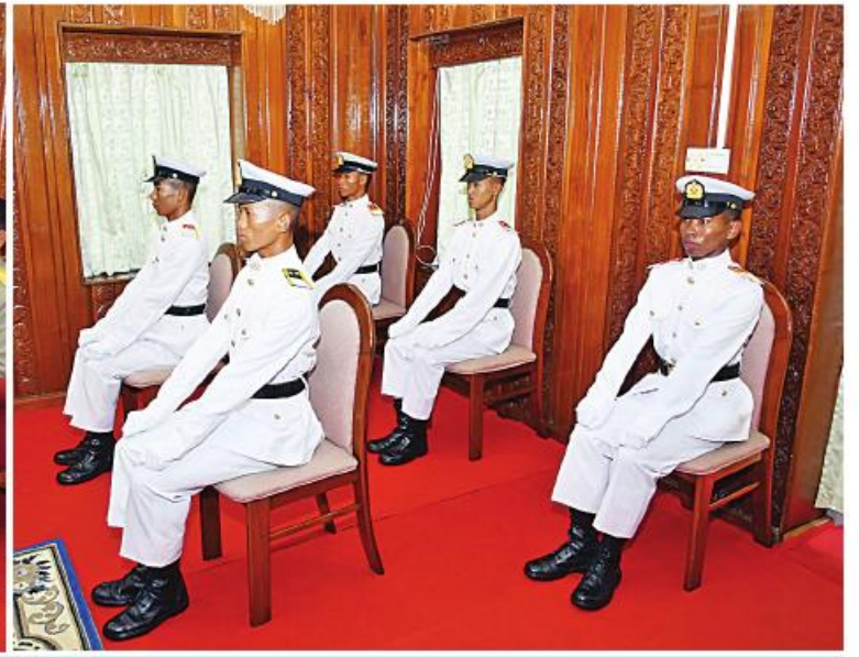
နိုင်ငံတော်စီမံအုပ်ချုပ်ရေးကောင်စီဥက္ကဋ္ဌ တပ်မတော်ကာကွယ်ရေးဦးစီးချုပ် ဗိုလ်ချုပ်မှူးကြီး သတိုးမဟာသရေစည်သူ သတိုးသိရီသုဓမ္မမင်းအောင်လှိုင် ထူးချွန်ချစ်ကြည်ဖြူ ဗိုလ်လောင်းငါးဦးကို တွေ့ဆုံရုံ ဂုဏ်ပြုအမှာစကား ပြောကြားစဉ်။