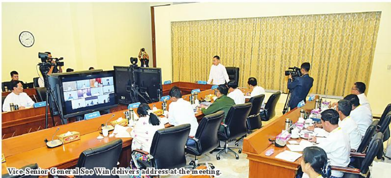
Vice-Senior General Soe Win delivers address at the meeting.

Nay Pyi Taw December 8 The second coordination meeting of the Central Committee for Organizing the 76th Anniversary of Independence Day (2024) was held at the Office of Chairman of State Administration Council today at 2:30 pm in