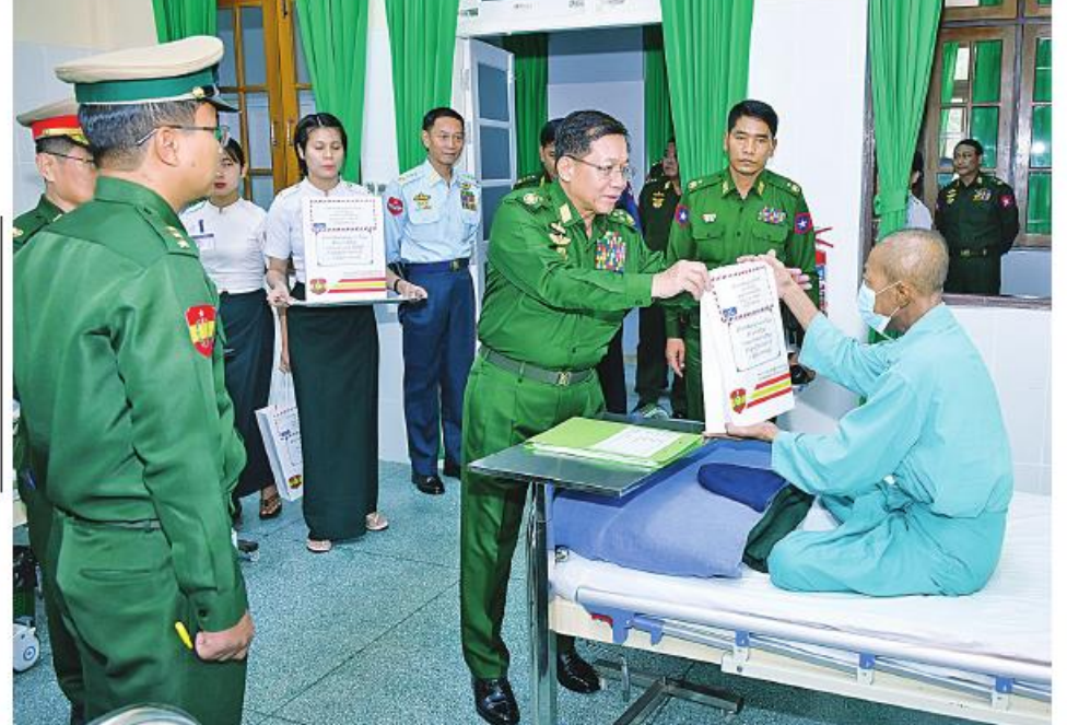
နိုင်ငံတော်စီမံအုပ်ချုပ်ရေးကောင်စီဥက္ကဋ္ဌ တပ်မတော်ကာကွယ်ရေးဦးစီးချုပ် ဗိုလ်ချုပ်မှူးကြီးမင်းအောင်လှိုင် ဆေးရုံတက်ရောက်ကုသမှုခံယူလျက်ရှိသည့် အရာရှိ၊ စစ်သည်များအား ဂုဏ်ပြုချီးမြှင့်ငွေနှင့် လက်ဆောင်ပစ္စည်းများပေးအပ်စဉ်။