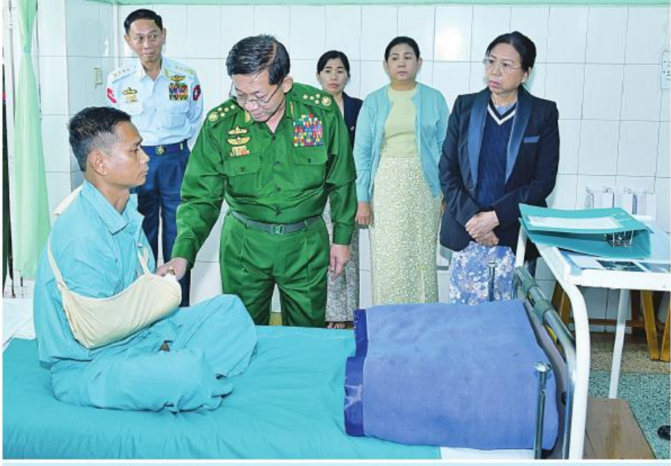
နိုင်ငံတော်စီမံအုပ်ချုပ်ရေးကောင်စီဥက္ကဋ္ဌ တပ်မတော်ကာကွယ်ရေးဦးစီးချုပ် ဗိုလ်ချုပ်မှူးကြီးမင်းအောင်လှိုင်နှင့် ဇနီး ဒေါ်ကြူကြူလှတို့က နိုင်ငံတော်ကာကွယ်ရေးနှင့်လုံခြုံရေးတာဝန်များထမ်းဆောင်စဉ် ထိခိုက်ဒဏ်ရာ ရရှိခဲ့သော အရာရှိ၊ စစ်သည်များအား တစ်ဦးချင်းလိုက်လံတွေ့ဆုံ၍ ရင်းနှီးနှေးထွေးစွာမေးမြန်းပြီး အားပေးစကားပြောကြားစဉ်။