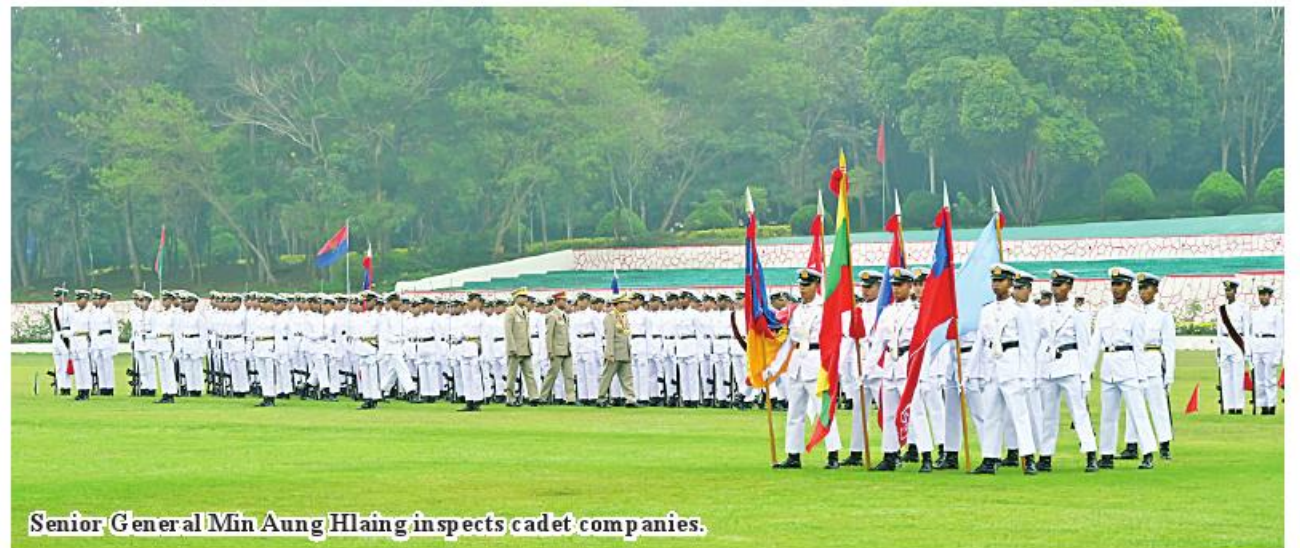
Senior General Min Aung Hlaing inspects cadet companies.

In his address, the Senior General said today is a great rejuvenation day for the Nation and the Tatmadaw as it marks the fostering of a new