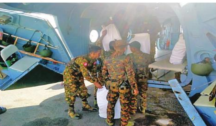
လုံခြုံရေးတပ်ဖွဲ့ဝင်များအတွက် စေတနာရှင်အလှူရှင် ပြည်သူများကလှူဒါန်း သော ထောပတ်ထမင်းဘူးများနှင့် စားသောက်ဖွယ်ရာများကို တပ်မတော် ရဟတ်ယာဉ်ဖြင့် ပို့ဆောင်ပေးစဉ်။

နေပြည်တော် ၁၆ ဇူလိုင် - နိုင်ငံတော်ကာကွယ်ရေးနှင့် လုံခြုံရေး တာဝန်များကို စွမ်းစွမ်းတမ်းတမ်းဆောင် ရွက်ရုံသာ လုံခြုံရေးတပ်ဖွဲ့ဝင်များ အတွက် စေတနာရှင်အလှူရှင် ပြည်သူ များက အလှူငွေများ ပေးအပ်လှူဒါန်း လျက်ရှိသည်အပြင် စားသောက်ဖွယ်ရာများ ကိုလည်း ပေးပို့လှူဒါန်းလျက်ရှိသည်။ ယနေ့တွင်လည်း စေတနာရှင်အလှူရှင် ပြည်သူများက အရှေ့မြောက်တိုင်းစစ်ဌာန ချုပ်နယ်မြေအတွင်း နိုင်ငံတော်ကာကွယ် ရေးနှင့် လုံခြုံရေးတာဝန်များ ထမ်းဆောင် နေသည့် လုံခြုံရေးတပ်ဖွဲ့ဝင်များအတွက် ထောပတ်ထမင်းဘူးများကို ပေးအပ် လှူဒါန်းကြရာ တာဝန်ရှိသူများက လက်ခံ ရယူပြီး လားရှိုးမြို့မှတစ်ဆင့် တပ်မတော် မော်တော်ယာဉ်များ၊ ရဟတ်ယာဉ်များဖြင့် လုံခြုံရေးတပ်ဖွဲ့ဝင်များ၏ လက်ဝယ် အရောက် လိုက်လံပို့ဆောင်ပေးကြသည်။ စေတနာရှင်ပြည်သူများ လှူဒါန်းသည့် ထောပတ်ထမင်းဘူးများနှင့်အတူ ရဟန်း သံဃာများနှင့် ပြည်သူများက ရေးသား ပေးပို့သည့် “နိုင်ငံတော်ရဲ့ ပိုင်နက်နယ်မြေ များနဲ့ အမျိုးဘာသာ သာသနာတော်ကို စောင့်ရှောက်နေတဲ့ တပ်မတော်သားများ ဘေးအပါးရန်အပေါင်းကို နှိမ်နင်း အောင်မြင်ကြပါစေ၊ တိုင်းပြည်ရန်စွယ် ဟူသမျှကို အမြစ်ပါမကျန် ချေမှုန်းနိုင်ကြ ပါစေ” စသည့် ဆုတောင်းမေတ္တာစာလွှာ များပါရှိကြောင်း သတင်းရရှိသည်။