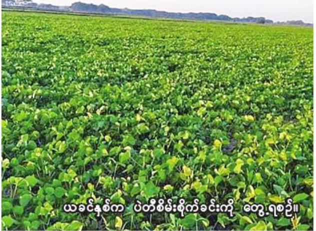
ယခင်နှစ်က ပဲတီစိမ်းစိုက်ခင်းကို တွေ့ရစဉ်။

မှန်ကန်ရေး၊ ပိုးမွှားကျရောက်မှု တင်းရှင်းရေး၊ ဓာတ်မြေဩဇာစနစ် တကျသုံးစွဲရေး၊ အထွက်နှုန်းကောင်းမွန်ရေးတို့ကို အသိပညာပေးဆောင်ရွက်လျက်ရှိကြောင်း ချောင်းဦးမြို့နယ် စိုက်ပျိုးရေးဦးစီးဌာနမှ သိရသည်။ (၂၀၆)