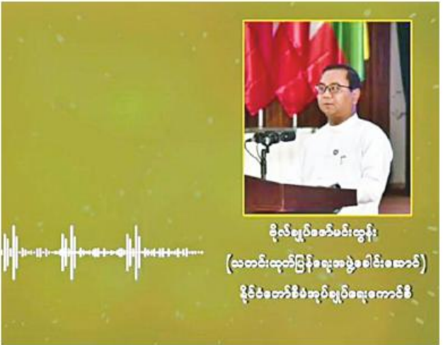
ပိုလ်ချုပ်ဇော်မင်းထွန်း (သတင်းထုတ်ပြန်ရေးအဖွဲ့ခေါင်းဆောင်) နိုင်ငံတော်စီမံအုပ်ချုပ်ရေးကောင်စီ

တာတွေ၊ အမျိုးမျိုး တရုတ်-မြန်မာ နှစ်နိုင်ငံအကြားမှာ အထင်အမြင် လွဲအောင် လုပ်ကြံဖန်တီးလုပ်တာများရှိပြီးဖြစ်ပါတယ်။ ရှိနေပါတယ်။ ယခင်ကလည်းလုပ်ခဲ့ပါတယ်။ ယခုလည်း ဆက်လက်လုပ်ဆောင်နေဆဲပဲ ဖြစ်ပါတယ်။ နောက်လည်း လုပ်ဆောင်မှာဖြစ်ပါတယ်။ သူတို့အနေနဲ့က နှုတ်ကထုတ်ဖော်မပြောသည့်တိုင် မြန်မာနိုင်ငံကို အသုံးချပြီးတော့ တရုတ်တိုင်းချုပ်ရေးမူဝါဒ CHINA CONTAINMENT POLICY ကို ကျင့်သုံးနေတာဖြစ်ပါတယ်။ ဒါတွေကို ကျွန်တော်တို့ နိုင်ငံသူ၊ နိုင်ငံသားများအနေနဲ့ သတိပြုရမှာဖြစ်ကြောင်း ပထမဦးဆုံးပြောကြား လိုပါတယ်။ နောက်တစ်ခုကတော့ သတင်းမှား ကောလာဟလသတင်းများဖြစ် ပါတယ်။ ပြည်ပျက်မီဒီယာများအနေနဲ့ အခုနိုင်ငံမှာဖြစ်ပျက်နေတဲ့ အခြေအနေများပေါ်မှာမူတည်ပြီး ကောလာဟလသတင်းတွေ၊ သတင်း တု၊ သတင်းယောင်တွေ မိန့်ခွင့်အမျှထုတ်နေပါတယ်။ မိန့်ခွင့်အမျှလည်း တွေ့နေရမှာဖြစ်ပါတယ်။ ကျွန်တော်တို့အနေနဲ့ သတင်းတု၊ သတင်းမှား များနဲ့ပတ်သက်ပြီး၊ ကောလာဟလသတင်းများနဲ့ပတ်သက်ပြီး ဖြေရှင်း ပါတယ်။ ဖြေရှင်းပေးမယ့်လည်း ဒါနဲ့ပတ်သက်ပြီး ဒီဟာတွေသည် သတင်း တု၊ သတင်းမှားများကို ဆက်လက်ပြီးဆောင်ရွက်နေတာကို တွေ့ရမှာ ဖြစ်ပါတယ်။ ဒီကောလာဟလသတင်းများ ထုတ်လွှင့်ရတဲ့ရည်ရွယ်ချက် ကတော့ ကြောက်ရွံ့မှုတို့၊ မျှော်လင့်ချက်တို့ ဒါတွေနဲ့ထုတ်လွှင့်တာ ဖြစ်ပါတယ်။ သူတို့အနေနဲ့ သတင်းတု၊ သတင်းမှားများနဲ့ ပြည်သူလူထု