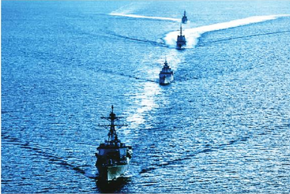
တောင်တရုတ်ပင်လယ်တွင် ASEX-01N စစ်ရေးလေ့ကျင့်နေစဉ်။

၂၀၂၃ ခုနှစ် စက်တင်ဘာလအတွင်း အင်ဒိုနီးရှား နိုင်ငံက လက်ခံကျင်းပခဲ့ပြီး Natuna ၌ ပြုလုပ်ခဲ့သော အာဆီယံ သွေးစည်းညီညွတ်ရေးလေ့ကျင့်မှု 2023 (ASEX-01N) သည် အရှေ့တောင်အာရှနိုင်ငံများ အသင်း(ASEAN)အတွက် ပထမဆုံးသော အဆင့်မြင့် ပူးတွဲစစ်ရေးလေ့ကျင့်မှုတစ်ခုပင်ဖြစ်သည်။ ၎င်းစစ်ရေးလေ့ကျင့်မှုသည် အာဆီယံအဖွဲ့ဝင်နိုင်ငံများ၏ ကြီးမားသော စွမ်းဆောင်ရည်ပေးပို့ပေးခဲ့သည်။ တရုတ်နိုင်ငံကို အားပေးထောက်ခံလျက်ရှိသည့် ကမ္ဘောဒီးယားနိုင်ငံသည်ပင်လျှင် အဆိုပါ စစ်ရေးလေ့ကျင့်မှုပြုလုပ်ရာသို့ တက်ရောက်ခဲ့သည်။