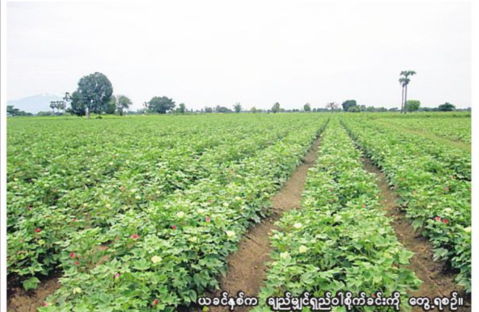
ယခင်နှစ်က ချည်မျှင်ရည်ဝါစိုက်ခင်းကို တွေ့ရစဉ်။