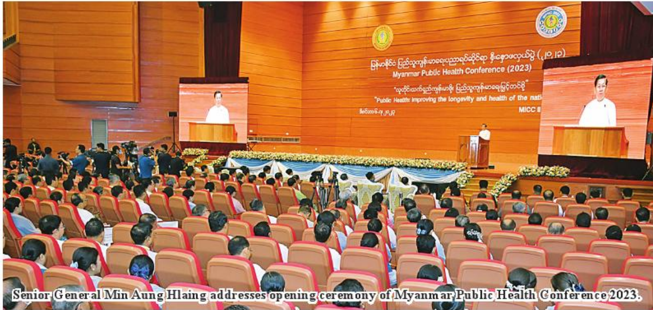
Senior General Min Aung Hlaing addresses opening ceremony of Myanmar Public Health Conference 2023.

Nay Pyi Taw December 6 Chairman of the State Administration Council Prime Minister Senior General Min Aung Hlaing delivered an address at the opening ceremony of Myanmar Public Health Conference 2023 at the Myanmar International Convention Centre-II in Nay Pyi Taw at 8 am today.