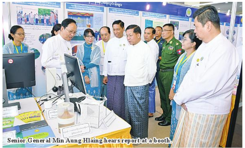
Senior General Min Aung Hlaing hears report at a booth.

risk allowance is also given monthly to employees who need health security. The Stat has increased budgets year after year for public health activities such as vaccination and TB, procurement of HIV treatment drugs and medical equipment, maternal and child health, nutritional development, and purchases of medicines and medical equipment for non-communicable diseases such as hypertension, diabetes and