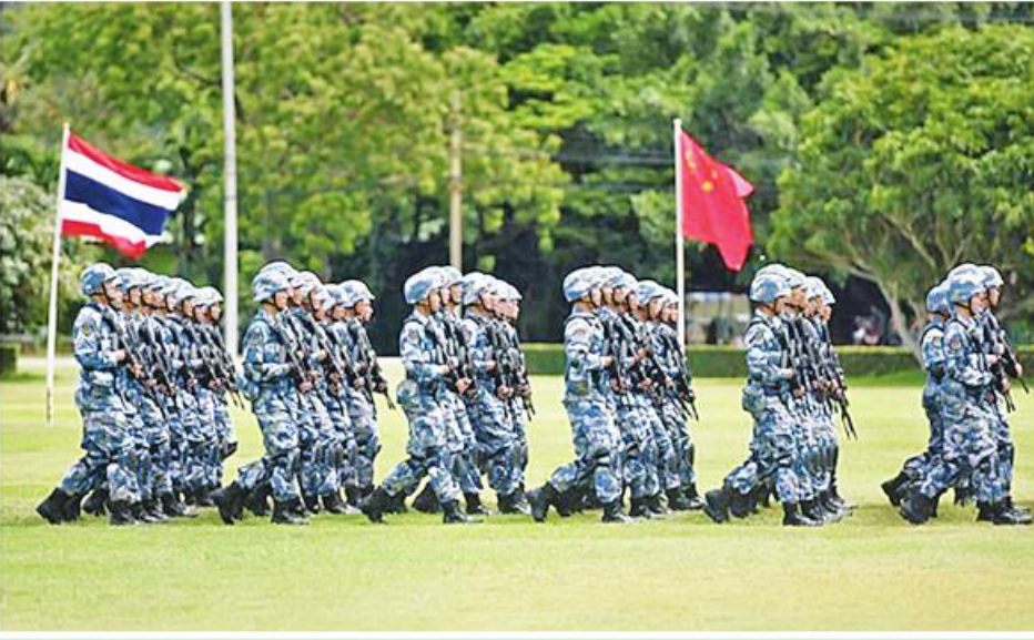
တရုတ်နှင့်ထိုင်းနိုင်ငံ ပူးတွဲစစ်ရေးလေ့ကျင့်မှု

တရုတ်နိုင်ငံပိုင် သင်္ဘောကျင်းကော်ပိုရေးရှင်း (China State Shipbuilding Corporation-CSSC) သည် ၎င်း၏ ကြီးမားသော ပြခန်းတွင် သင်္ဘောပုံစံမျိုးစုံကို ပြသခဲ့သည်။ တစ်ခုမှာ ထိုင်းဘုရင့်ရေတပ်ကဝယ်ယူမည့် S26T ဒီဇယ်-လျှပ်စစ်သုံးရေငုပ်သင်္ဘောဖြစ်သည်။ သို့သော်လည်း မကြာသေးမီက ထိုင်းနိုင်ငံသည် တရုတ်နိုင်ငံမှ ဘတ် ၁၃ ဒသမ ၅ ဘီလီယံ တန်ဖိုးရှိ ရေငုပ်သင်္ဘော ဝယ်ယူရေးအစီအစဉ်ကို ရပ်ဆိုင်းခဲ့သည်။ ၎င်းမှာ ယူကရိန်းစစ်ပွဲအပြီးတွင် ဂျာမနီက ပို့ကုန်တင်ပို့မှုကို