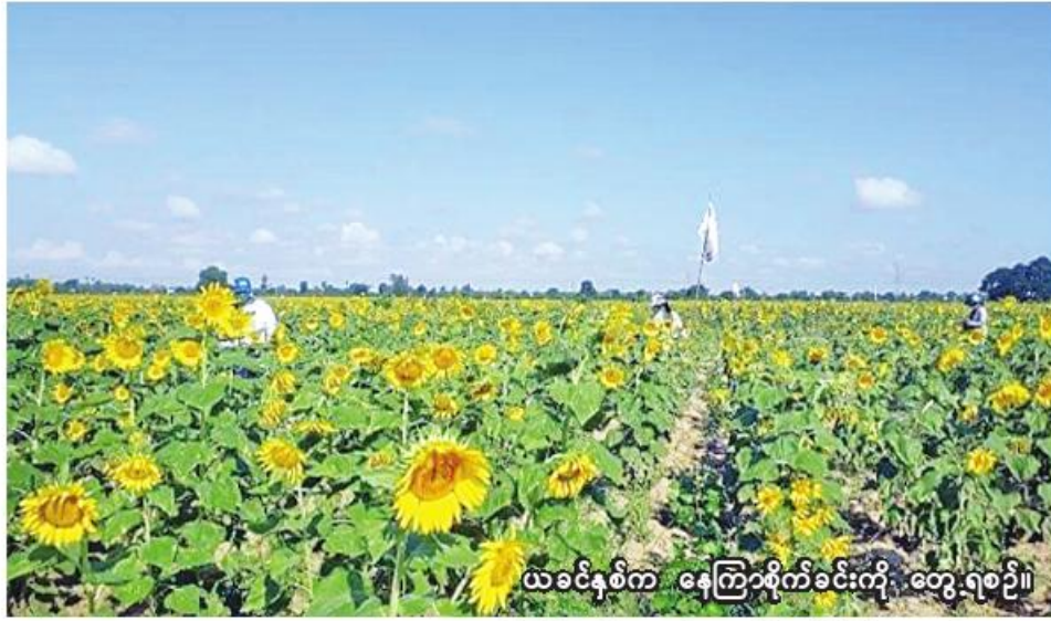
ယခင်နှစ်က နေကြာစိုက်ခင်းကို တွေ့ရစဉ်။

ချောင်းဦးမြို့နယ်တွင် ၃၇၆ ဧက စုစုပေါင်း ၉၂၀၈ ဧကဖြစ်ကြောင်း သိရသည်။