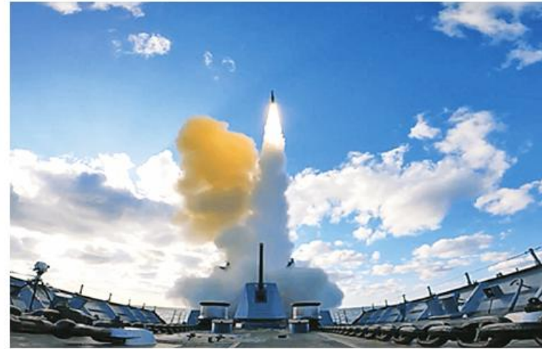
Domestic SM-2 Ship-to-Air Missile Test ကို အာသာပြန်ဆိုထားပါသည်။ South Korea Conducts First

Stars and Stripes သတင်းဌာနက ရေးသားဖော်ပြထားသည်။ တောင်ကိုရီးယားရေတပ်သည် ယခင်က Hawaii Barking Sands ကမ်းခြေရှိ ပစ်ခတ်ခုံးကျည်စမ်းသပ်ရေးကွင်းတွင် SM-2 ခုံးကျည်ကို စမ်းသပ်ပစ်ခတ်ခဲ့ဖူးကြောင်း Yonhap သတင်းအေဂျင်စီက ရေးသားထားသည်။ အမေရိကန်ရေတပ်အင်ဂျင်နီယာများ၊ တောင်ကိုရီးယားရေတပ်နှင့် ကာကွယ်ရေး ဖွံ့ဖြိုးတိုးတက်ရေးအေဂျင်စီ (ADD) တို့သည် ပြင်ဆင်ရေးလုပ်ငန်းများမှသည် ခုံးကျည်ပစ်ခတ်စဉ်နှင့်ပတ်သက်၍ ခွဲခြမ်းစိတ်ဖြာခြင်းထိ လုပ်ငန်းစဉ်တစ်ခုလုံးကို ပံ့ပိုးကူညီရန် အတူတကွပါဝင်ခဲ့ကြောင်း