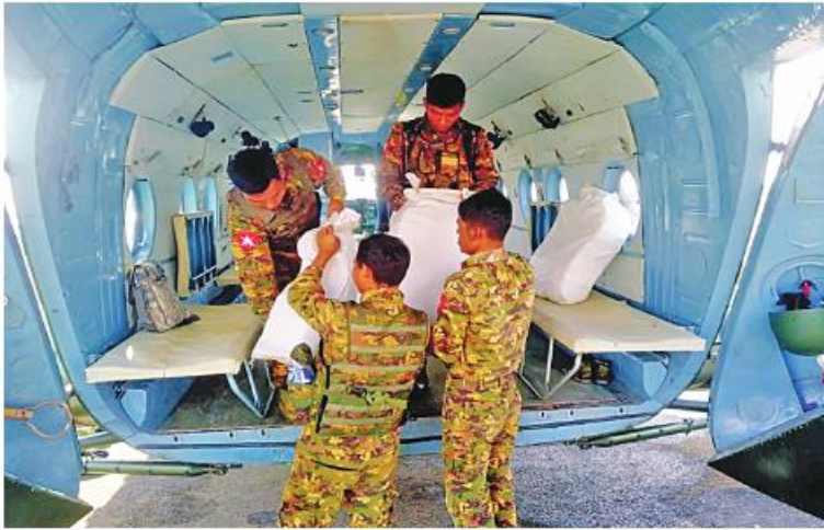
လုံခြုံရေးတပ်ဖွဲ့ဝင်များအတွက် စေတနာရှင်အလှူရှင် ပြည်သူများကလှူဒါန်းသော ဒံပေါက်ထမင်းဘူးများနှင့် စားသောက်ဖွယ်ရာများကို တပ်မတော်ရဟတ်ယာဉ်ဖြင့် ပို့ဆောင်ပေးစဉ်။

နေပြည်တော် ၁၆ ဇူလိုင် ၂၀၂၃ နိုင်ငံတော်ကာကွယ်ရေးနှင့် လုံခြုံရေးတာဝန်များကို စွမ်းစွမ်းတမ်းတမ်းဆောင်လျက်ရှိသော လုံခြုံရေးတပ်ဖွဲ့ဝင်များအတွက် စေတနာရှင်အလှူရှင် ပြည်သူများက အလှူငွေများပေးအပ်လှူဒါန်းလျက်ရှိသည်အပြင် စားသောက်ဖွယ်ရာများကိုလည်း ပေးပို့လှူဒါန်းလျက်ရှိသည်။