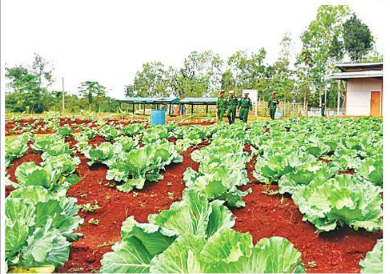
အရှေ့အလယ်ပိုင်းတိုင်းစစ်ဌာနချုပ် တိုင်းမှူး ဗိုလ်ချုပ်မှူးမင်းထွန်း တိုင်းစစ်ဌာနချုပ်ဘက်ရုံးခိုက်ပျိုးမွေးမြူရေးခြံအတွင်း ကြည့်ရှုစစ်ဆေးစဉ်။

တည်ဆောက်ရာတွင် သက်ဆိုင်ရာကဏ္ဍအလိုက်ရွှေ့ဆောင်ရွှေ့ရွက်ပြုပြီးထူးချွန်စွာ စွမ်းစွမ်းတမ်းတမ်းဆောင်ရွက်ကြသော ပုဂ္ဂိုလ်များ၊ သက်ဆိုင်ရာပညာရပ်ဖြင့် နိုင်ငံတော်နှင့် လူ့စွမ်းအားအရင်းအမြစ်များဖွံ့ဖြိုးတိုးတက်ရေးအတွက် အကျိုးပြုကြသည့် ပုဂ္ဂိုလ်များနှင့် ညွှန်ကြားရေးမှူးချုပ်လုပ်သက် သုံးနှစ်၊ ငါးနှစ်ပြည့်မီသော ညွှန်ကြားရေးမှူးချုပ်နှင့်အဆင့်တူအရာရှိကြီးများအား စွမ်းဆောင်မှုဆိုင်ရာ ဂုဏ်ထူးဆောင် တံဆိပ်များ၊ ချီးမြှင့်နိုင်ရေးကို ၂၀၁၄ ခုနှစ် ဂုဏ်ထူးဆောင်ဘွဲ့များ၊ ဂုဏ်ထူးဆောင်တံဆိပ်များဆိုင်ရာ ပြဋ္ဌာန်းချက်ကိုဖြည့်စွက်ပြဋ္ဌာန်းချက်နှင့်အညီ စိစစ်သွားမည်ဖြစ်ကြောင်း။ နိုင်ငံတော်ကို ထူးကဲစွာအကျိုးပြုသည့် ဂုဏ်ပြုချီးမြှင့်ထိုက်သူ သာသနာ့အာဇာနည်များ၊ လူပုဂ္ဂိုလ်များ၊ တပ်မတော်သားများ၊ မြန်မာနိုင်ငံရဲတပ်ဖွဲ့ ဝင်များနှင့် နိုင်ငံ့ဝန်ထမ်းများကို ဂုဏ်ထူးဆောင်တံဆိပ်များ၊ ဘွဲ့တံဆိပ်များ၊ ဝန်ထမ်းတံဆိပ်များ၊ ဝိစိစိပြီးချီးမြှင့်မည့်အပြင် နိုင်ငံတော်စီမံအုပ်ချုပ်ရေးကောင်စီ ဥက္ကဋ္ဌ နိုင်ငံတော်ဝန်ကြီးချုပ်၏ လမ်းညွှန်ချက်နှင့်အညီ နိုင်ငံတော်တာဝန်ထမ်းဆောင်ရင်းထိခိုက်ဒဏ်ရာရသော ဆုံးကျဆုံးခဲ့သည့် နိုင်ငံ့ဝန်ထမ်းများကိုလည်း ထောက်ပံ့ပေးပေးအပ်နိုင်ရေးအတွက်ကိုလည်း ယခုအစည်းအဝေးတွင် ထည့်သွင်းစိစစ်သွားမည်ဖြစ်ကြောင်း။ ယနေ့အစည်းအဝေးတွင် ပဏာမစိစစ်ရေးအဖွဲ့ အစည်းအဝေး၌ ဆွေးနွေးဆုံးဖြတ်ခဲ့သည့် ဂုဏ်ထူးဆောင်ဘွဲ့များ၊ ဂုဏ်ထူးဆောင်တံဆိပ်များကို ထပ်မံစိစစ်ပြီး ပြည်ထောင်စုအစိုးရအဖွဲ့ အစည်းအဝေး