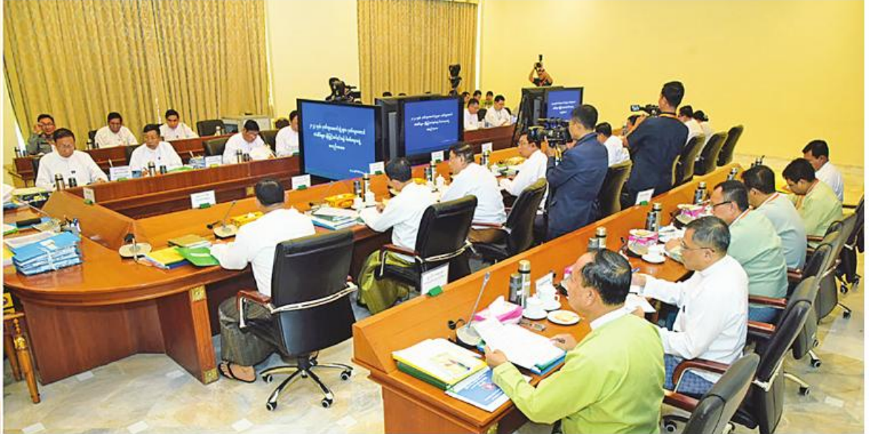
Vice-Senior General Soe Win delivers speech at the meeting.

Nay Pyi Taw December 6 The Scrutiny Committee on Conferring the Honorary Titles and Medals for 2024 held a meeting at State Administration Council Chairman's Office here this afternoon, addressed by Patron of the committee SAC Vice Chairman Deputy Prime Minister Vice-Senior General Soe Win. Also present were members of the committee union ministers, deputy ministers, senior military officers from Office of Commander-in-Chief, and officials. The Vice-Senior General said the meeting would discuss the scrutinization of the work of conferring awards on members of the religious order and laypersons who made brilliant efforts in the interest of the Sasana in building a peaceful and modern country and Tatmadaw members and civilian servants including members of Myanmar Police Force for discharging duties