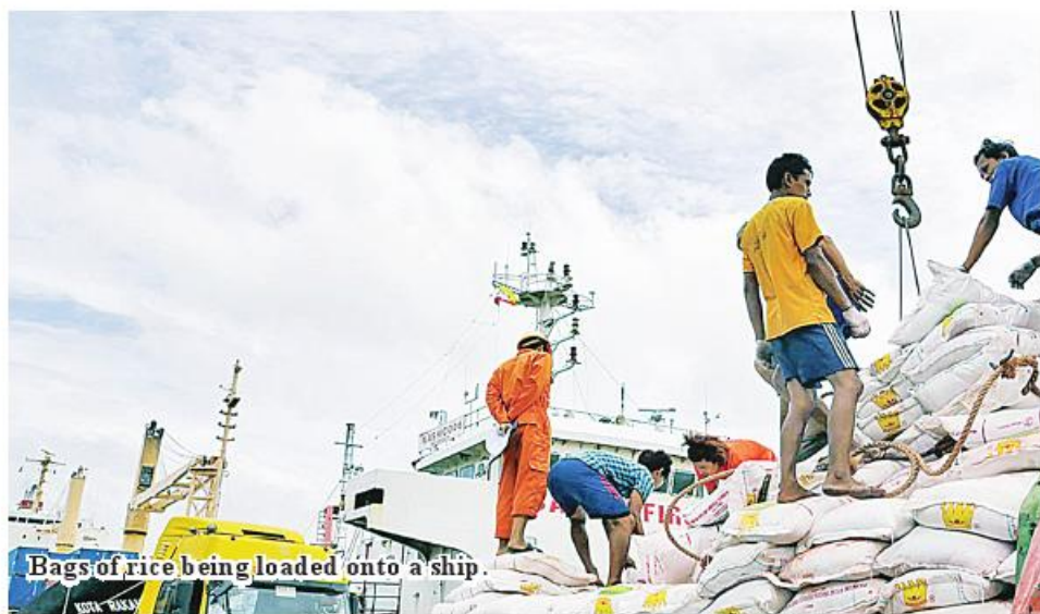
Bags of rice being loaded onto a ship.

Nay Pyi Taw December 6 by Myanmar Rice Federation (MRF) on December 5. A total of 49 companies exported 175,990 tonnes of rice and broken rice during November of 2023-2024 FY, according to reports released