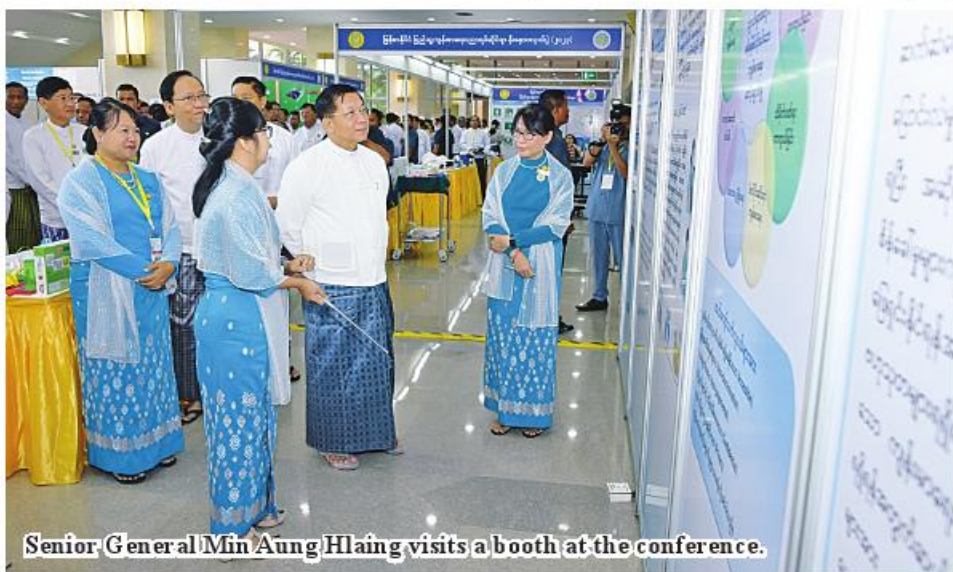
Senior General Min Aung Hlaing visits a booth at the conference.

ministers, the chairman of Union Civil Service Board, the chairman of Nay Pyi Taw Council, senior military officers from the office of the Commander-in-Chief, deputy ministers, departmental heads, diplomats from foreign embassies to Myanmar, resident representatives from UN agencies, those from non-governmental organizations, international and local public health experts, rectors and professors from medical