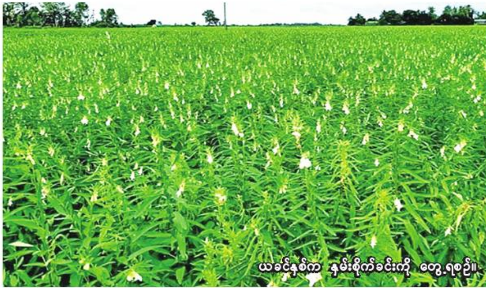
ယခင်နှစ်က နှမ်းစိုက်ခင်းကို တွေ့ရစဉ်။

နှမ်းစိုက်ပျိုးရာတွင် တိုးချဲ့စိုက်ပျိုးနိုင်ရေး၊ စိုက်ပျိုးသည့်နည်းစနစ်မှန်ကန်ရေး၊ GAP နည်းစနစ်ဖြင့် စိုက်ပျိုးနိုင်ရေး၊ မျိုးကောင်းမျိုးသန့်များ စိုက်ပျိုးနိုင်ရေး၊ အထွက်နှုန်းကောင်းမွန်သည့်မျိုးများ စိုက်ပျိုးနိုင်ရေးအတွက် မြို့နယ်စိုက်ပျိုးရေးဦးစီးဌာနမှ ဝန်ထမ်းများက အသိပညာပေးလျက်ရှိကြောင်း သိရသည်။