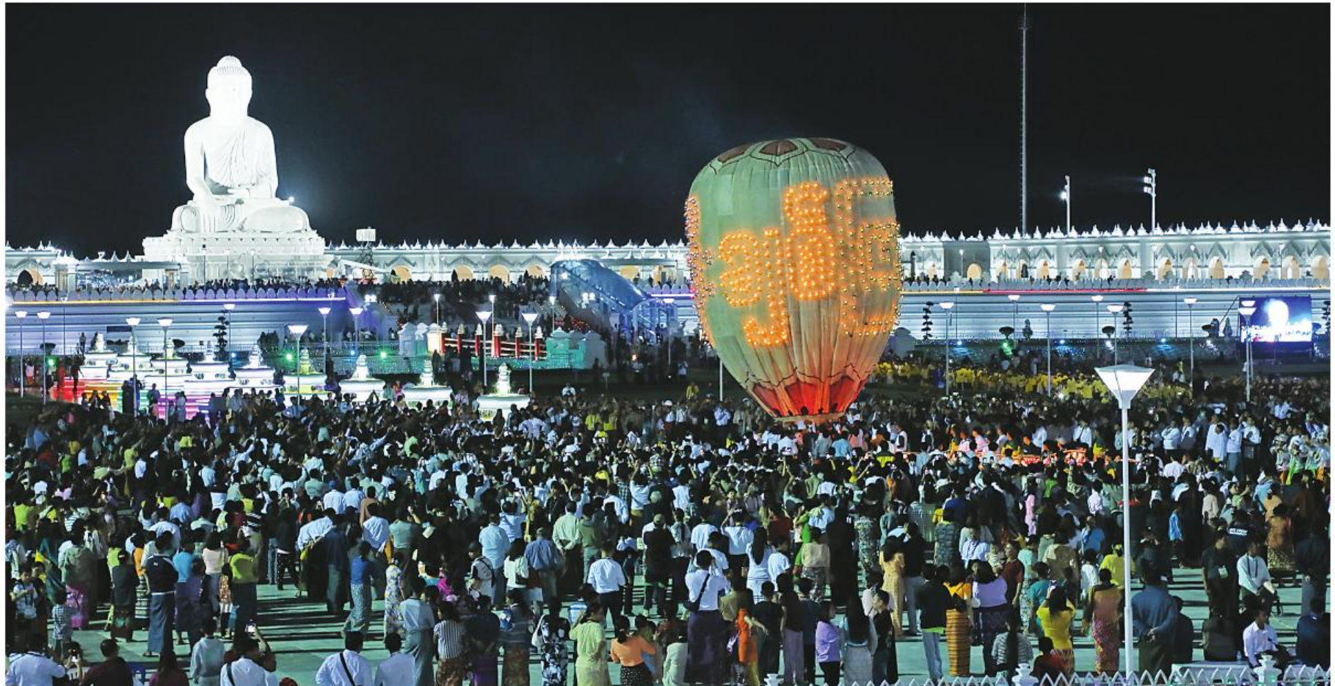
နေပြည်တော် နိုဝင်ဘာ ၂၆ ရုပ်ပွားတော်မြတ်ကြီး ပရိဝုဏ်တွင် ပါဝင်ဆင်နွှဲကြသည့် ဘုရားဖူးလာ တိုင်မီးထွန်းပွဲတော်လာ ဘုရားဖူးပြည်သူ များရှေ့တွင် လုံခြုံရေးအရ လိုအပ်ပြည်ထောင်စုနယ်မြေ နေပြည်တော် တန်ဆောင်တိုင်မီးထွန်းပွဲတော် ဒုတိယ ပြည်သူများဖြင့် အထူးစည်ကားများပြား များ ဘေးအန္တရာယ်ကင်းရှင်းစွာဖြင့် သည့် စစ်ဆေးမှုများဆောင်ရွက်ပေးပြီး ဒုတိယနေ့အတွင်း တည်ထား နေ့အဖြစ် စည်ကားသိုက်မြိုက်စွာ ဆက် လျက်ရှိသည်။ များ စိတ်လက်အေးချမ်းစွာ ဘုရားဖူးမြော် ပွဲတော်အတွင်း ပူဇော်အောင်မြင်ခဲ့သည့် မာရဝိဇယဗုဒ္ဓ လက်ကျင်းပရာ အနယ်နယ်အရပ်ရပ်မှ ဦးစွာ တာဝန်ရှိသူများက တန်ဆောင် ပါဝင်ဆင်နွှဲနိုင်ရေးအတွက် ဘုရားမုခ်ဦး