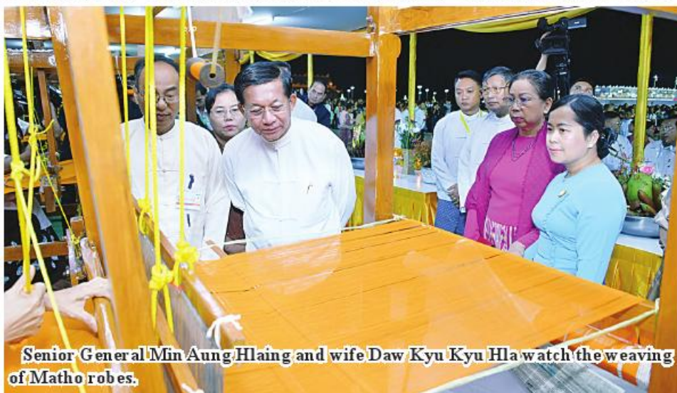
Senior General Min Aung Hlaing and wife Daw Kyu Kyu Hla watch the weaving of Matho robes.

ing fireworks, firecrackers, big hot-air balloons and offering the first Matho robes are being organized while the precinct of the Buddha park is decorated with LED lights. As MSMEs have also set up stalls selling local products, foodstuffs, consumer products and traditional snacks, members of the public have been invited to make pilgrimages to the Buddha image during the festival.