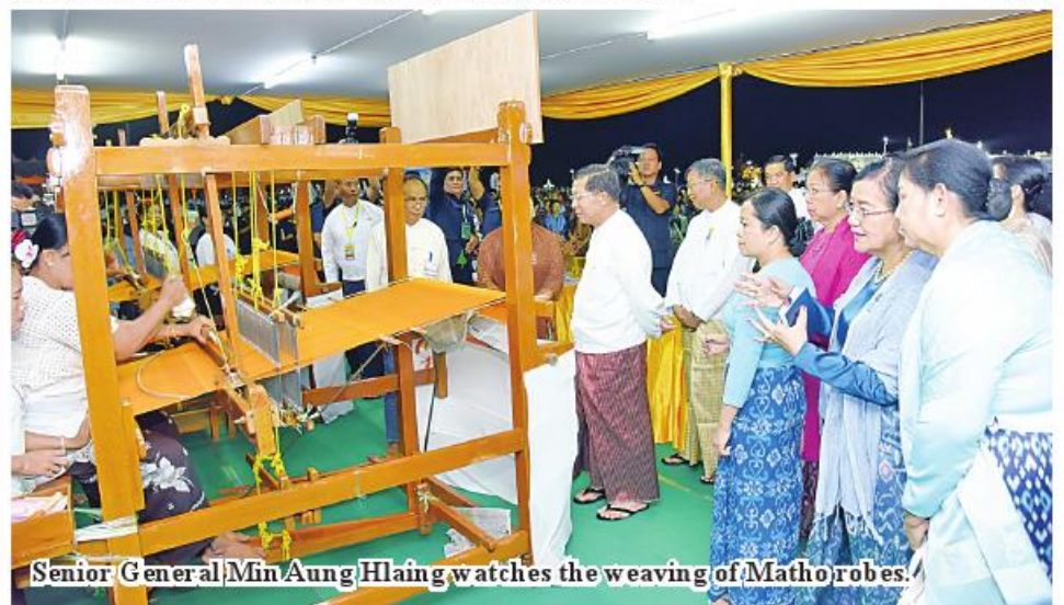
Senior General Min Aung Hlaing watches the weaving of Matho robes.