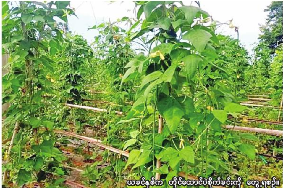
ယခင်နှစ်က တိုင်ထောင်ပဲစိုက်ခင်းကို တွေ့ရစဉ်။