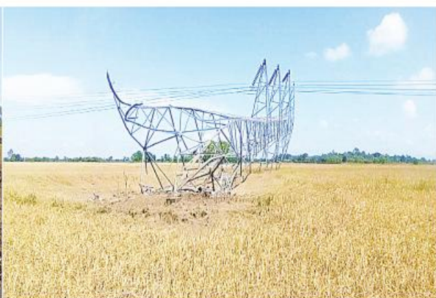
အကြမ်းဖက်သမားများပျက်ဆီးခဲ့သည့် ကေဗီ ၂၃၀ သာယာကျန်း-ကမာနတ်၊ သာယာကျန်း-ဘိုင်းဒါး နစ်ထပ်ဓာတ်အားလိုင်း ဖြိုလဲပျက်စီးခဲ့သည့်မှတ်တမ်းဓာတ်ပုံ။