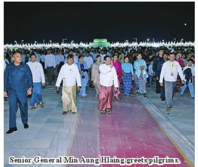
Senior General Min Aung Hlaing greets pilgrims.

Also present at the ceremony together with the Senior General and wife were the secretary of the SAC, the joint secretary of the SAC and wife, members of the SAC and their wives, union level officials, union ministers and their wives, the chairman of the Nay Pyi Taw Council, senior officers from the Office of the Commander-in-Chief of Defence Services and their wives, the commander of the Nay Pyi Taw Command