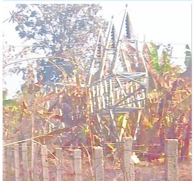
အကြမ်းဖက်သမားများပျက်ဆီးခဲ့သည့် ၁၃၂ ကေဗီ ဘီလူးဇောင်း(၂)-တီကျစ်နစ်ထပ်ဓာတ်အားလိုင်း တာဝါတိုင်အမှတ်(၁၅၂) ဖြိုလဲပျက်စီးခဲ့သည့်မှတ်တမ်းဓာတ်ပုံ။