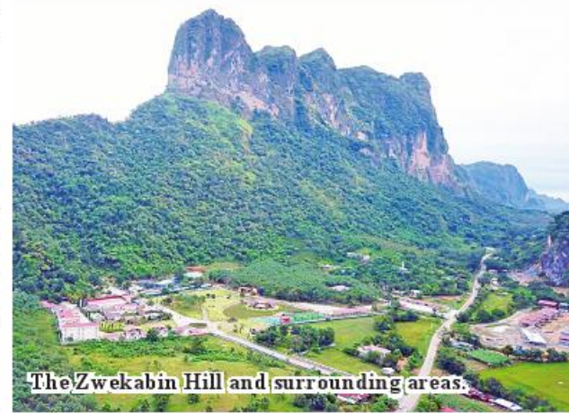
The Zwegabin Hill and surrounding areas.

with beautiful natural scenes, natural caves and forests and paddy plantations. Travellers