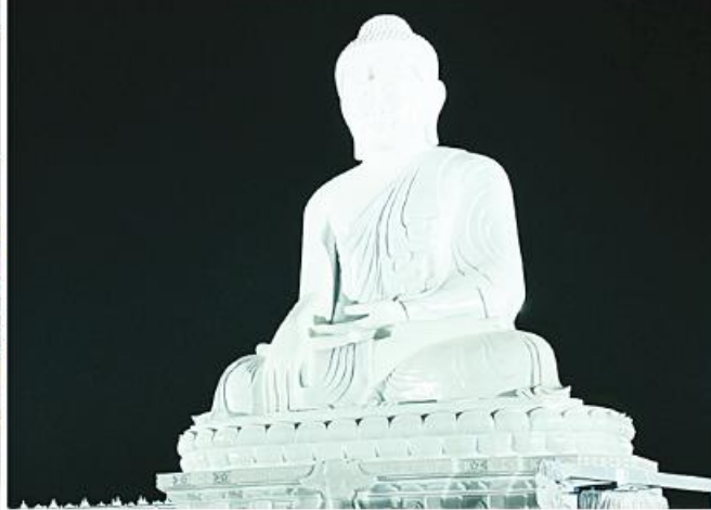
rectorate of Public Relations and Psychological Warfare performed Myaing Myaing drum bands and music. Then, the Senior General and wife and guests enthusiastically

ter and lights to the Buddha image and walking around in the precinct of the Buddha image before offering 3600 oil lights to the Buddha image together with pilgrims and greeting them cordially.