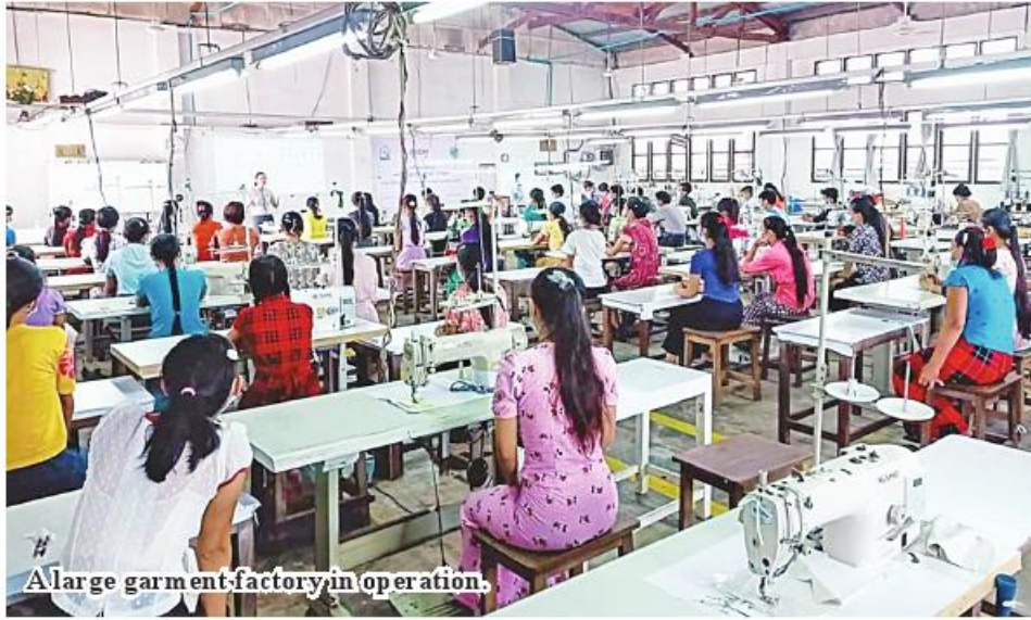
A large garment factory in operation.