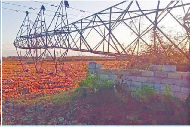
အကြမ်းဖက်သမားများပျက်ဆီးခဲ့သည့် ၁၃၂ ကေဗီ ဘီလူးဇောင်း(၂)-တီကျစ်နစ်ထပ်ဓာတ်အားလိုင်း တာဝါတိုင်အမှတ်(၁၁၅) ဖြိုလဲပျက်စီးခဲ့သည့်မှတ်တမ်းဓာတ်ပုံ။