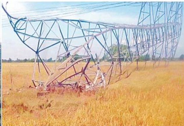
အကြမ်းဖက်သမားများပျက်ဆီးခဲ့သည့် ကေဗီ ၂၃၀ သာယာကျန်း-ကမာနတ်၊ သာယာကျန်း-ဘိုင်းဒါး နစ်ထပ်ဓာတ်အားလိုင်း ဖြိုလဲပျက်စီးခဲ့သည့်မှတ်တမ်းဓာတ်ပုံ။