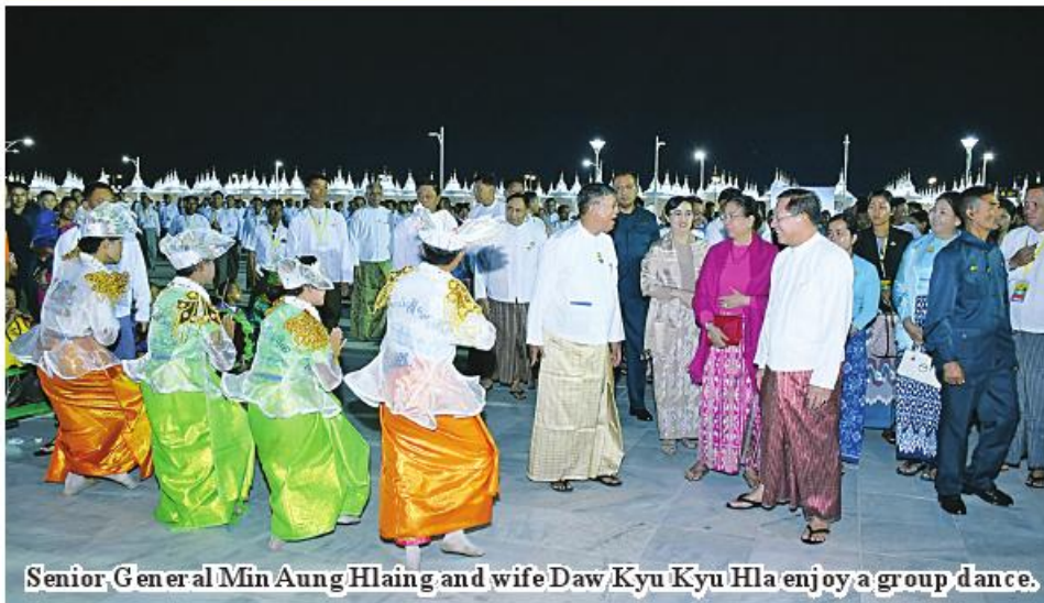
Senior General Min Aung Hlaing and wife Daw Kyu Kyu Hla enjoy a group dance.

The opening ceremony of the first Matho robe weaving and offering to the Maravijaya Buddha Image in the precinct of the Buddha Park in Dekkhinathiri Township in Nay Pyi Taw Union Territory was held at the fountain square in the precinct this evening and Chairman of the State Administration Council Prime Minister Senior General Min Aung Hlaing and wife Daw Kyu Kyu Hla attended the ceremony.