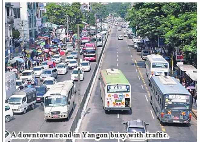
A downtown road in Yangon busy with traffic.

In Yangon Region, mung bean is mostly grown in the townships of Taikkyi, Hmawby and Htantabin, and they have been growing it since October. Therefore, currently, the price of mung bean in Yangon Region is good at a rate of K130,000 per basket. 336