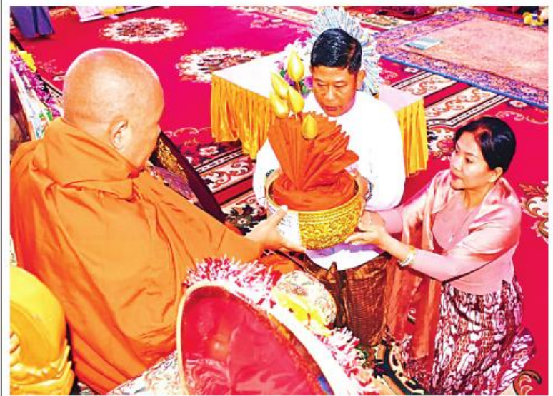
ဆရာတော်ထံ အရှေ့အလယ်ပိုင်းတိုင်းစစ်ဌာနချုပ် တိုင်းမှူး ဦးလှိုင်ကျော်စွာနှင့် တာဝန်ရှိသူများက ဆက်ကပ်လှူဒါန်းစဉ်။