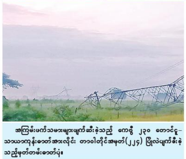
အကြမ်းဖက်သမားများပျက်ဆီးခဲ့သည့် ကေဗီ ၂၃၀ တောင်ငူ-သာယာကျန်းဓာတ်အားလိုင်း တာဝါတိုင်အမှတ်(၂၂၄) ဖြိုလဲပျက်စီးခဲ့သည့်မှတ်တမ်းဓာတ်ပုံ။

နေပြည်တော် နိုဝင်ဘာ ၂၆ လက်နက်ကိုင်သောင်းကျန်းသူများနှင့်PDF အမည်ခံ အကြမ်းဖက်ပူးပေါင်းအဖွဲ့များသည် တိုင်းပြည်တည်ငြိမ်အေးချမ်းမှုနှင့် တရားဥပဒေစိုးမိုးမှုကို ပျက်ပြားစေရန် ရည်ရွယ်ချက်ဖြင့် နိုင်ငံပိုင်ဘဏ်များ၊ ပုဂ္ဂလိကပိုင်ဘဏ်များ၊ ဌာနဆိုင်ရာရုံးများ၊ နိုင်ငံတော်ပိုင်ပစ္စည်းများ၊ ပုဂ္ဂလိကပိုင်ပစ္စည်းများ၊ စက်ရုံ၊ အလုပ်ရုံများ၊ တယ်လီဖုန်းတာဝါတိုင်များနှင့် လျှပ်စစ်ဓာတ်အားလိုင်း