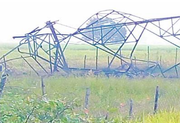
အကြမ်းဖက်သမားများပျက်ဆီးခဲ့သည့် ကေဗီ ၂၃၀ တောင်ငူ-သာယာကျန်းဓာတ်အားလိုင်း တာဝါတိုင်အမှတ်(၂၂၅) ဖြိုလဲပျက်စီးခဲ့သည့်မှတ်တမ်းဓာတ်ပုံ။