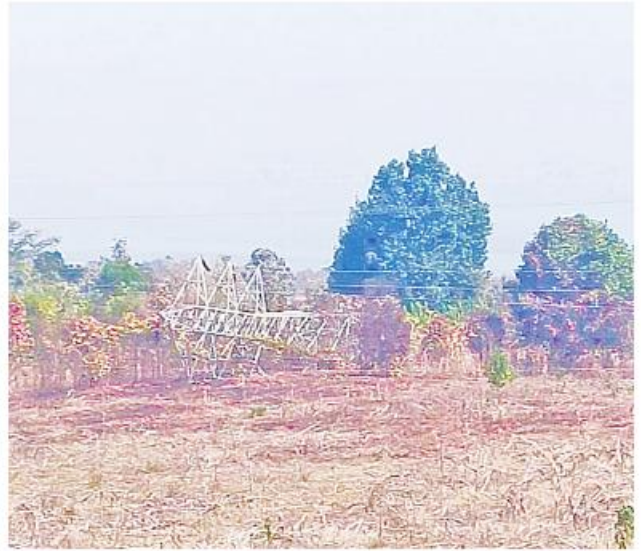
အကြမ်းဖက်သမားများပျက်ဆီးခဲ့သည့် ၁၃၂ ကေဗီ ဘီလူးဇောင်း(၂)-တီကျစ်နစ်ထပ်ဓာတ်အားလိုင်း တာဝါတိုင်အမှတ်(၁၅၁) ဖြိုလဲပျက်စီးခဲ့သည့်မှတ်တမ်းဓာတ်ပုံ။