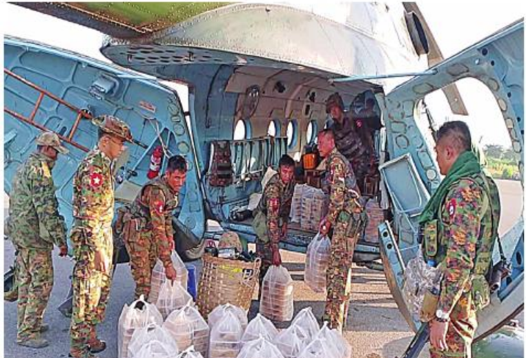
နိုင်ငံတော်ကာကွယ်ရေးနှင့် လုံခြုံရေးတာဝန်များကို စွမ်းစွမ်းတမံထမ်းဆောင်လျက် ရှိသော လုံခြုံရေးတပ်ဖွဲ့ဝင်များအတွက် စေတနာရှင်အလှူရှင် ပြည်သူများက လှူဒါန်း သည့် ပံ့ပိုးကူညီမှုများကို တပ်မတော်ရဟတ်ယာဉ်များဖြင့် ပို့ဆောင်ပေးစဉ်။

နေပြည်တော် နိုဝင်ဘာ ၂၄ လျက်ရှိသည့်အပြင် စားသောက်ဖွယ်ရာ နိုင်ငံတော်ကာကွယ်ရေးနှင့် လုံခြုံရေး များကိုလည်း ပေးပို့လှူဒါန်းလျက် တာဝန်များကို စွမ်းစွမ်းတမံထမ်းဆောင် ရှိသည်။ ယနေ့တွင်လည်း စေတနာရှင်အလှူရှင် လျက်ရှိ သောလုံခြုံရေးတပ်ဖွဲ့ဝင်များ ပြည်သူများက အရှေ့မြောက်တိုင်းစစ် အတွက် စေတနာရှင်အလှူရှင် ပြည်သူ များက အလှူငွေများ ပေးအပ်လှူဒါန်း ဌာနချုပ်နယ်မြေအတွင်း နိုင်ငံတော်