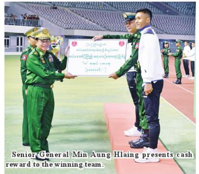
Senior General Min Aung Hlaing presents cash reward to the winning team.