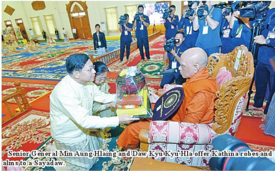
Senior General Min Aung Hlaing and Daw Kyu Kyu Hla offer Kathina robes and alms to a Sayadaw.