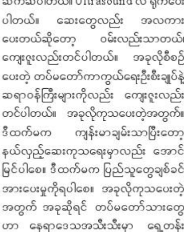
ဆက်ဆံပါတယ်။ Ultrasound လဲ ရိုက်ပေးပါတယ်။ ဆေးတွေလည်း အလကားပေးတယ်ဆိုတော့ ဝမ်းလည်းသာတယ်။ ကျေးဇူးလည်းတင်ပါတယ်။ အခုလိုစီစဉ်ပေးတဲ့ တပ်မတော်ကာကွယ်ရေးဦးစီးချုပ်နဲ့ ဆရာဝန်ကြီးများကိုလည်း ကျေးဇူးလည်း တင်ပါတယ်။ အခုလိုကုသပေးတဲ့အတွက်၊ ဒီထက်မက ကျန်းမာချမ်းသာပြီးတော့ နယ်လှည့်ဆေးကုသရေးမှာလည်း အောင်မြင်ပါစေ။ ဒီထက်မက ပြည်သူတွေချစ်ခင်အားပေးမှုကိုရပါစေ။ အခုလိုကုသပေးတဲ့အတွက် အခုဆိုရင် တပ်မတော်သားတွေဟာ နေရာဒေသအသီးသီးမှာ ရွှေတန်းတာဝန်တွေကို သွားရောက်ထမ်းဆောင်နေရတယ်လို့ ကြားသိရပါတယ်။ အဲ့ဒီလို တပ်မတော်သားတွေဟာ မအားလပ်တဲ့ ကြားကနေ ကျွန်မတို့ကျေးရွာကို လာရောက်ပြီး ဆေးကုသပေးတဲ့အတွက် အရမ်းကို ကျေးဇူးတင်ပါတယ်။ တပ်မတော်သားတွေ အားလုံး စိတ်ချမ်းသာ ကိုယ်ကျန်းမာပြီး

ကိုယ်ကလဲ ဒီတပ်မတော်ကိုအားပေးတယ် ဂုဏ်လည်းယူတယ်။ ကျေးဇူးလည်း တင်တယ်။ လက်တွေ့အပြုအမူတော့ ဝမ်းလည်းသာတယ်။ ကြည်လည်းကြည်နူးတယ်။ အခုရောဂါ တစ်ဝက်သက်သာတယ် လို့ခံစားရပါတယ်။ ဆေးကုသရေးအဖွဲ့က ကောင်းကောင်းမွန်မွန် ရည်ချက်မွန်မွန်နဲ့