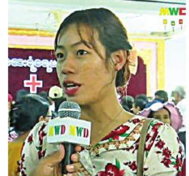
တော့ အစုံပေါ့။ မျက်စိပါရဂူတွေလည်းပါတယ်။ နား၊ နှာခေါင်း ခွဲစိတ်ပါရဂူတွေလည်းပါတာပေါ့။ အဲ့လို ကုသပေးတဲ့အဖွဲ့ကိုလည်း ညီမ ပြည်သူတွေကိုယ်စား ကျေးဇူးတင်ပါတယ်။ ပရဟိတမျိုးတွေလည်း ဆက်ပြီးလုပ်နိုင်ပါစေလို့ ဆုတောင်းပေးပါတယ်ဟုပြောသည်။

မျက်နှာမှာ အဖုတွေဖြစ်နေလို့ဆိုပြီး အရေပြားလာပြတာပါ။ တွေ့ရာမျက်နှာ သစ်မသစ်နဲ့ပေါ့။ နောက်ပြီးတော့ အပြင်သွားလို့ရင် မျက်မှန်တွေတပ်ပေါ့။ ဒီဖုန်မူနဲ့ကြောင့်လည်း မျက်နှာမှာ အဖုတွေဖြစ်တယ်လို့ပြောတယ်။ ဆေးထုတ်ပေးလိုက်တယ်။ စာအုပ်ထဲမှာ ဆေးနာမည်လေးရေးပြီးတော့လေ။ သိပ်ပြီးတော့ ပိုက်ဆံမတတ်နိုင်တဲ့သူတွေ၊ နောက်ပြီးတော့ သိပ်ပြီးအဆင်မပြေတဲ့သူတွေ အတွက်တော့ အဆင်ပြေတာပေါ့။ သွားခံတွင်းပါရဂူ အနီးအကြောပါရဂူ၊ နောက်ပြီး