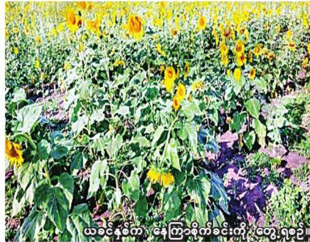
ယခင်နှစ်က နေကြာစိုက်ခင်းကို တွေ့ရစဉ်။

ဧက ၂၀၃၀ စိုက်ပျိုးနိုင်ခဲ့ကြောင်း သိရသည်။ မြင်းမူမြို့နယ်တွင် ယခုနှစ် နေကြာတိုးချဲ့စိုက်ပျိုးနိုင်ရေးအတွက် မြို့နယ် စိုက်ပျိုးရေးဦးစီးဌာနက ပညာပေးသင်တန်းများ အချိန်နှင့် တင်ဆောင်ရွက်ခြင်း၊ ဝန်ထမ်းနှင့် နေကြာစိုက်ပျိုးမည့်တောင်သူများ စွမ်းဆောင်ရည်မြင့်မားရေးအတွက် ပညာပေးသင်တန်းများကို အချိန်နှင့်ဆောင်ရွက်ပေးလျက်ရှိကြောင်း သိရသည်။ မြင်းမူမြို့နယ်တွင် ယခုနှစ် နေကြာစိုက်ပျိုးမည့် တောင်သူများကို မျိုးစေ့များပံ့ပိုးပေးနိုင်ရေး၊ ယူရီးယားဓာတ်မြေဩများ ချို့သော ဈေးနှုန်းရောင်းချပေးနိုင်ရေး စီမံထားခြင်း၊ ထွက်ရှိလာသော နေကြာမျိုးများကို တောင်သူမှ တောင်သူ ဖလှယ်သည့်နည်းစနစ်များဖြင့် ဖြန့်ဖြူးသွားမည်ဖြစ်ကြောင်း သိရသည်။ (၂၀၆)