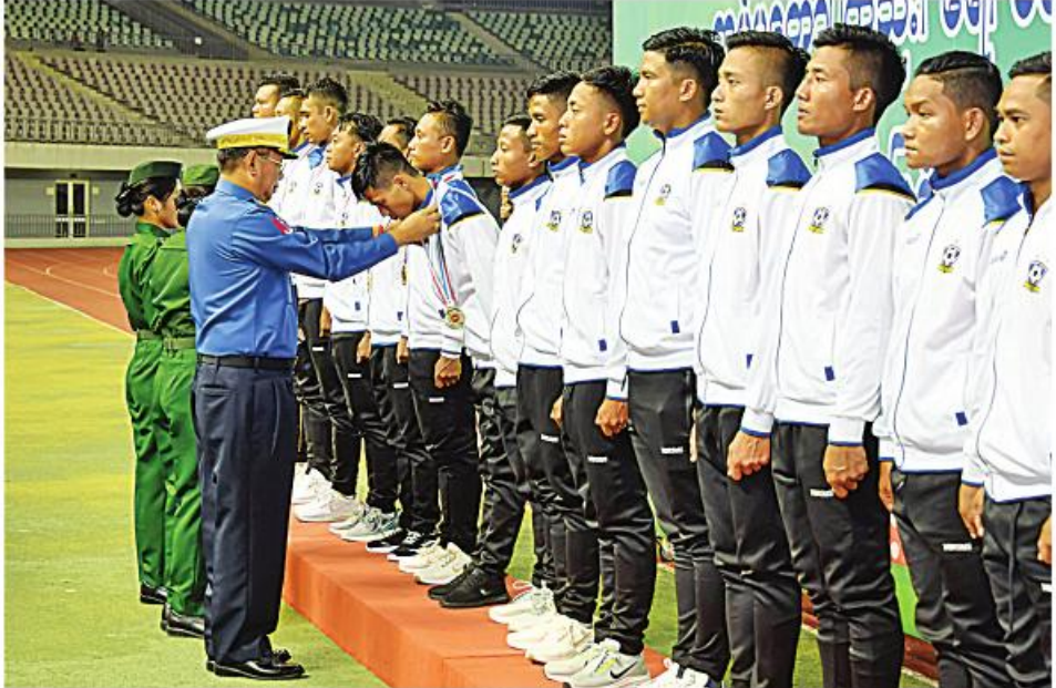
ကာကွယ်ရေးဦးစီးချုပ်(ရေ) ဗိုလ်ချုပ်ကြီးမိုးအောင် (က)အဆင့်ပြိုင်ပွဲတွင် ပထမဆုရရှိသည့် ကာကွယ်ရေးဦးစီးချုပ်ရုံး(ကြည်း) စခန်းမှူးရုံးအသင်းမှ အားကစားသမားများအား တစ်ဦးချင်းဆုတံဆိပ်များကို ပေးအပ်ချီးမြှင့်စဉ်။