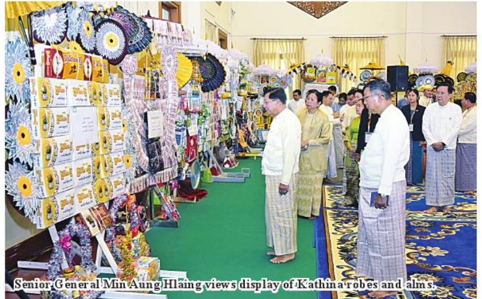
Senior General Min Aung Hlaing views display of Kathina robes and alms.

donated 50 Padethabins and K90,158,500, which totally amounted to K136,714,600.