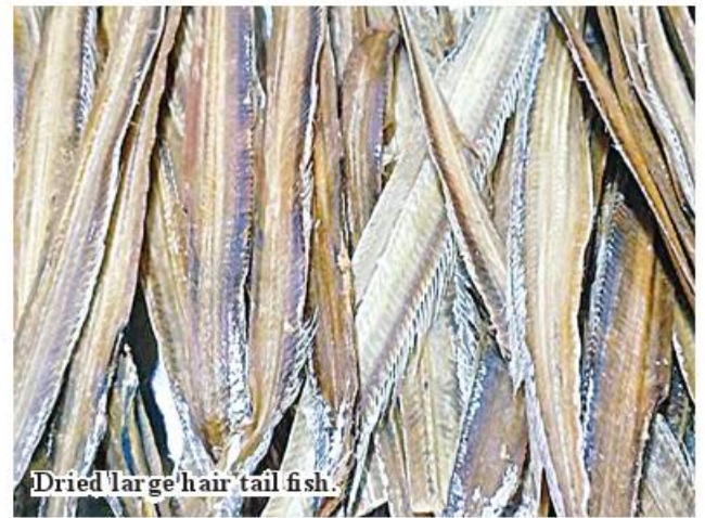
Dried large hair tail fish.

consumption of the grass-roots and middle class. Dried large head hairtail fish from fishing industries in the coastal areas of Bogale, Pyapon and Ama townships have already arrived in the market.