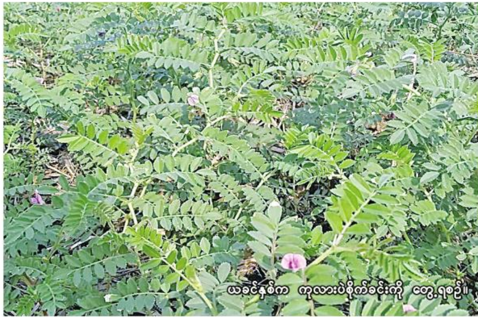
ယင်းမာပင်က ကုလားပဲစိုက်ခင်းကို တွေ့ရစဉ်။

ယင်းမာပင် နိုဝင်ဘာ ၂၄ စစ်ကိုင်းတိုင်းဒေသကြီး ယင်းမာပင်ခရိုင်တွင် ယခုနှစ် ဆောင်းသီးနှံစိုက်ပျိုးရာသီ၌ ကုလားပဲ ၂၀၃၀၆ ဧက စိုက်ပျိုးပြီးစီးပြီဖြစ်ကြောင်း ယင်းမာပင်ခရိုင် စိုက်ပျိုးရေးဦးစီးဌာနမှ သိရသည်။