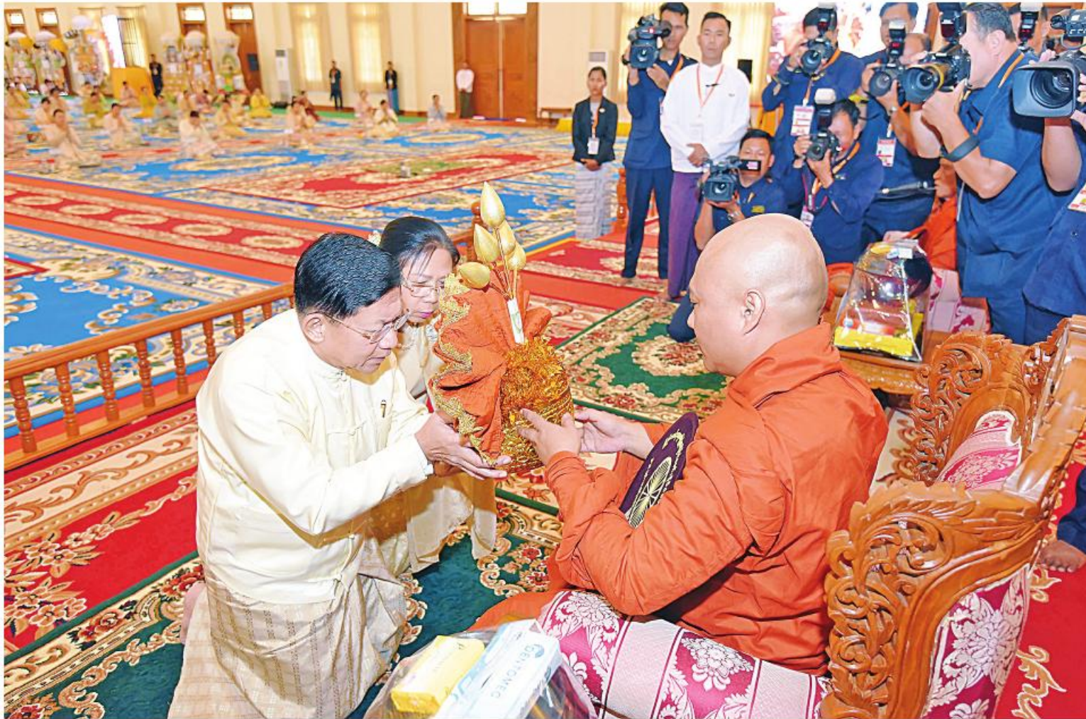
ကထိန်အလှူခံကျောင်း၊ ဓမ္မသီရိမြို့နယ် မဟာဝိဇိတာရုံကျောင်းတိုက်ဆရာတော် ဘဒ္ဒန္တဇရာထွေရထံ နိုင်ငံတော်စီမံအုပ်ချုပ်ရေးကောင်စီဥက္ကဋ္ဌ နိုင်ငံတော်ဝန်ကြီးချုပ် ဗိုလ်ချုပ်မှူးကြီးမင်းအောင်လှိုင်နှင့် ဓနိုး ဒေါ်ကြူကြူလှတို့က ကထိန်လှူသင်္ကန်း ဆက်ကပ်လှူဒါန်းစဉ်။