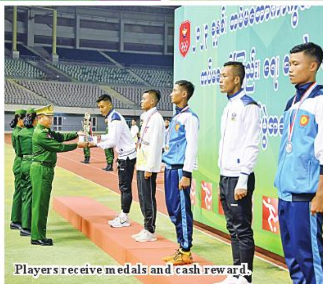
Players receive medals and cash reward.