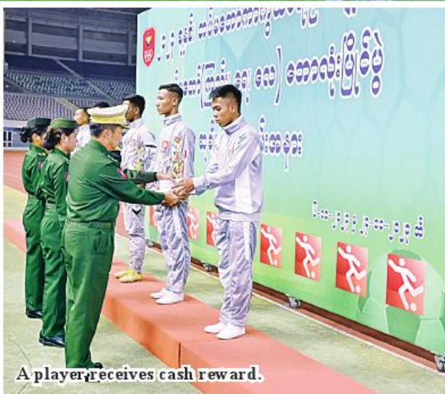
A player receives cash reward.