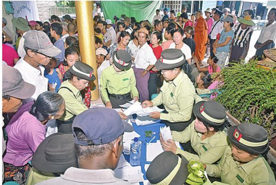
တပ်မတော်နှင့် ကျန်းမာရေး ဝန်ကြီးဌာနတို့မှ နယ်လှည့် အထူးကုဆေးအဖွဲ့က ဒေသခံ ပြည်သူများကို ကျန်းမာရေး စောင့်ရှောက်မှု လုပ်ငန်းများ ဆောင်ရွက်ပေးစဉ်။

နေပြည်တော် နိုဝင်ဘာ ၂၄ ကမ်းရိုးတန်းဒေသ တစ်လျှောက်ရှိ ဒေသခံပြည်သူများကို ကျန်းမာရေး စောင့်ရှောက်မှုလုပ်ငန်းများ ဆောင်ရွက်ပေးရန်အတွက် တပ်မတော်ပင်လယ်သွားဆေးရုံရေယာဉ်(သံလွင်)နှင့်အတူ လိုက်ပါလာသည့် တပ်မတော်မှ ပါရဂူများ၊ ဆေးမှူးများ၊ သူနာပြုများနှင့် ကျန်းမာရေးဝန်ကြီးဌာနမှ ပါရဂူများ၊ ဆရာဝန်များ၊ သူနာပြုများပါဝင်သော နယ်လှည့်အထူးကုဆေးအဖွဲ့သည် ယနေ့တွင် ဧရာဝတီတိုင်းဒေသကြီး လပွတ္တာမြို့နယ် တူးမြောင်းကျေးရွာသို့ရောက်ရှိကြရာ ဌာနဆိုင်ရာ တာဝန်ရှိသူများ၊ ရပ်မိရပ်ဖများ၊ ဆရာ၊ ဆရာမများနှင့် ကျောင်းသား၊ ကျောင်းသူများက သောင်းသောင်းမြဲမြဲကြိုဆိုနှုတ်ဆက်ကြသည်။ အဆိုပါ နယ်လှည့်အထူးကုဆေးအဖွဲ့သည် တူးမြောင်းကျေးရွာ တိုက်နယ်ဆေးရုံ၌အခြေပြု၍ အဆိုပါကျေးရွာနှင့် အနီးပတ်ဝန်းကျင်ကျေးရွာများမှ ဒေသခံပြည်သူ ၉၄၂ ဦးကို ကျန်းမာရေးစောင့်ရှောက်မှုလုပ်ငန်းများ ဆောင်ရွက်ပေးသည်။ ထိုသို့ ဆောင်ရွက်ပေးရာတွင် နယ်လှည့် အထူးကုဆေးအဖွဲ့က ဆေးကုသမှုဆိုင်ရာရောဂါ ၃၄၂ ဦး၊ ခွဲစိတ်ရောဂါ ၃၃ ဦး၊ သားဖွားမီးယပ်ရောဂါ ၂၇ ဦး၊ ကလေးရောဂါ ၃၉ ဦး၊ အရိုးရောဂါ ၁၈၆ ဦး၊ နား၊ နှာခေါင်း၊ လည်ချောင်းရောဂါ ၄၁ ဦး၊ မျက်စိရောဂါ ၁၉၇ ဦးနှင့် သွားနှင့် ခံတွင်းရောဂါ ၇၇ ဦးတို့ကို လိုအပ်သည့် ဆေးဝါးကုသမှုများ ဆောင်ရွက်ပေးသည်။ ထို့ပြင် အထွေထွေခွဲစိတ်လူနာ ၁၁ ဦး၊ မျက်စိခွဲစိတ်လူနာ ၁၂ ဦး၊ ဓာတ်မှန်ရိုက်လူနာ ၁၅ ဦး၊ Ultrasound ဖြင့် စမ်းသပ်စစ်ဆေးလူနာ ၅၇ ဦး၊ ECG စက်ဖြင့်