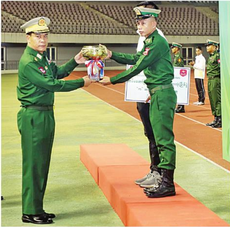
နေပြည်တော်တိုင်းစစ်ဌာနချုပ် တိုင်းမှူး ဝိုင်းချုပ်စောသန်းလှိုင် (က)အဆင့် ပြိုင်ပွဲတွင် အသန်ရှင်းဆုံးဆုရရှိသည့် ရန်ကုန်တိုင်းစစ်ဌာနချုပ်အသင်းကို ဆုပေးလေးနှင့် ငွေသားဆု ပေးအပ်ချီးမြှင့်စဉ်။

ယင်းနောက် ဆုချီးမြှင့်ခြင်းအခမ်းအနားကို ဆက်လက်ပြုလုပ်ရာ တပ်မတော်(ကြည်း၊ ရေ၊ လေ)ဘောလုံးပြိုင်ပွဲ (၁)အဆင့် ပြိုင်ပွဲတွင် အသန်ရှင်းဆုံးဆုရရှိသည့် အနောက်တောင်တိုင်းစစ်ဌာနချုပ်အသင်းနှင့် (က)အဆင့်ပြိုင်ပွဲတွင် အသန်ရှင်းဆုံးဆုရရှိသည့် ရန်ကုန်တိုင်းစစ်ဌာနချုပ်အသင်းတို့ကို နေပြည်တော်တိုင်းစစ်ဌာနချုပ် တိုင်းမှူး ဝိုင်းချုပ်စောသန်းလှိုင်က ဆုပေးနှင့် ငွေသားဆုများကိုလည်းကောင်း၊ (ခ) အဆင့်ပြိုင်ပွဲတွင် တတိယဆုရရှိသည့် အနောက်ပိုင်းတိုင်းစစ်ဌာနချုပ်အသင်းနှင့် (က)အဆင့်ပြိုင်ပွဲတွင် တတိယဆုရရှိသည့် ရန်ကုန်တိုင်းစစ်ဌာနချုပ် အသင်းတို့ကို စစ်ရာထူးခန့်ချုပ် ဒုတိယဝိုင်းချုပ်ကြီး