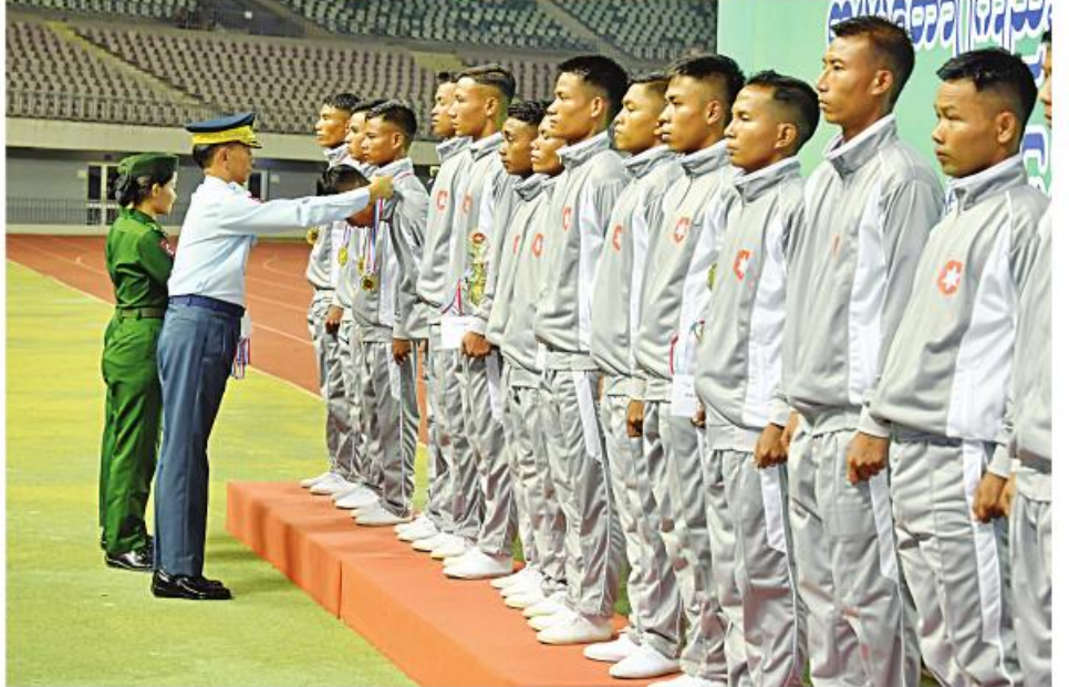
ကာကွယ်ရေးဦးစီးချုပ်(လေ) ဗိုလ်ချုပ်ကြီးထွန်းအောင် (ခ)အဆင့်ပြိုင်ပွဲတွင် ပထမဆုရရှိသည့် တောင်ပိုင်းတိုင်းစစ်ဌာနချုပ်အသင်းမှ အားကစားသမားများအား တစ်ဦးချင်းဆုတံဆိပ်များကို ပေးအပ်ချီးမြှင့်စဉ်။

စစ်ရေးချုပ် ဒုတိယဗိုလ်ချုပ်ကြီး ဖိုးမင်းဦး (ခ)အဆင့်ပြိုင်ပွဲတွင် ဒုတိယဆုရရှိသည့် အနောက်တောင်တိုင်း စစ်ဌာနချုပ်အသင်းမှ အားကစားသမားများအား ငွေသားဆုနှင့် တစ်ဦးချင်း ဆုတံဆိပ်များကို ပေးအပ်ချီးမြှင့်စဉ်။