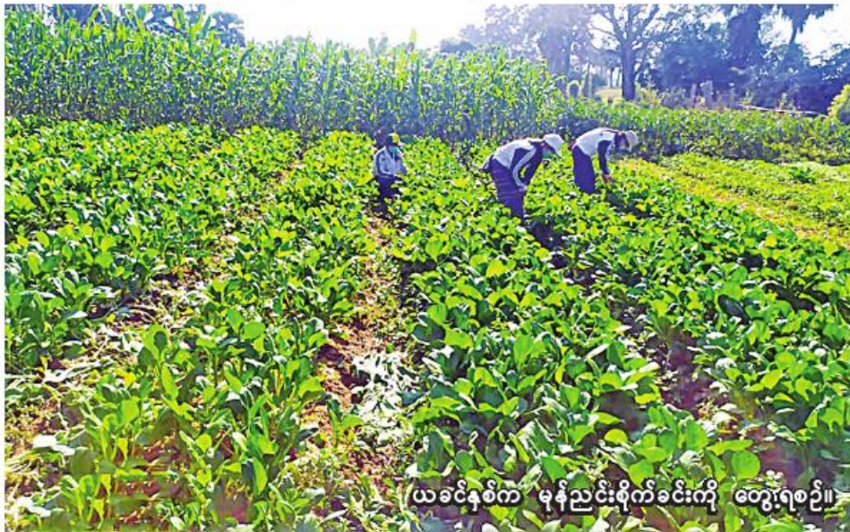
ယခင်နှစ်က မုန်ညင်းစိုက်ခင်းကို တွေးရစဉ်။