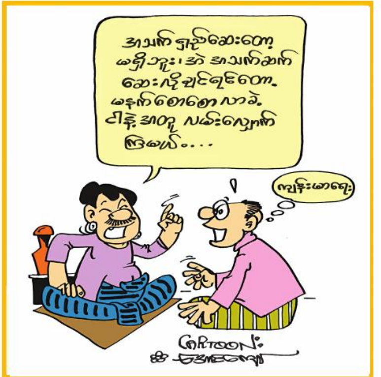
အသက် နှုတ်ဆေးဝေတု မရှိဘူး၊ အဲဒါအသက်ဆက်ဆေးလို့ ချင်တုလေတု။ မနက်စောစော လာခဲ။ ငါနဲ့ အတူ ဂမင်းလျှောက် ခြမယ်... ကျန်းမာရေး GIRIBON အဲဒါအသက်ဆေး