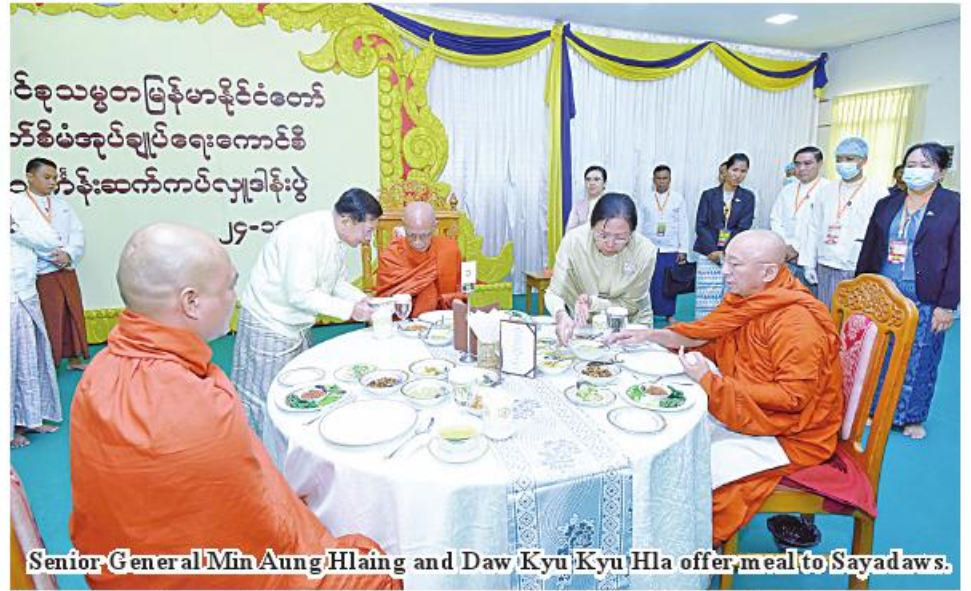
Senior General Min Aung Hlaing and Daw Kyu Kyu Hla offer meal to Sayadaws.