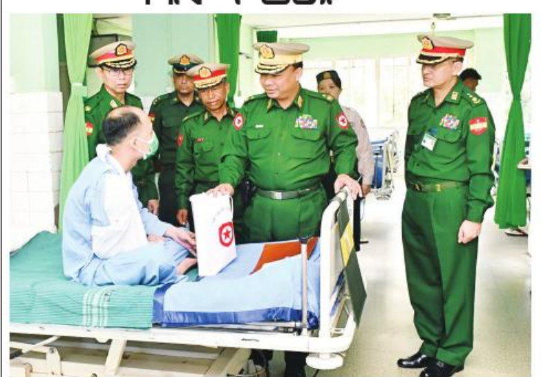
ရန်ကုန်တိုင်းစစ်ဌာနချုပ်တိုင်းမှူး ဗိုလ်ချုပ်စော်ဟိန်း ဆေးကုသမှုခံယူနေသူတစ်ဦးကို ရင်းရင်းနှီးနှီးစောစောအားပေးကြည့်ရှုစဉ်။

နေပြည်တော် နိုဝင်ဘာ ၂၄ တနင်္သာရီတိုင်းဒေသကြီး မြိတ်မြို့နှင့် ကော့သောင်းမြို့တို့ရှိ တပ်မတော်ဆေးရုံ များ၊ ရန်ကုန်တိုင်းဒေသကြီး မင်္ဂလာဒုံ မြို့နယ်ရှိ တပ်မတော်ဆေးရုံကြီး ခုတင်-၁၀၀၀ နှင့် တပ်မတော်အရိုးရောဂါ အထူးကုဆေးရုံကြီး ခုတင်-၅၀၀၊ ဧရာဝတီ တိုင်းဒေသကြီး ပုသိမ်မြို့ရှိ နယ်မြေခံ ဆေးတပ်ရင်းနှင့် စစ်ကိုင်းတိုင်းဒေသကြီး ကလေးမြို့ရှိ တပ်မတော်ဆေးရုံတို့၌ တက် ရောက်ဆေးကုသမှုခံယူနေသော အရာရှိ၊ စစ်သည်၊ မိသားစုဝင်များ၊ မြန်မာနိုင်ငံ ရဲ့တပ်ဖွဲ့ဝင်များ၊ ပြည်သူ့စစ်(ဌာန) တပ်ဖွဲ့ဝင်များ၊ စစ်မှုထမ်းဟောင်းအဖွဲ့ဝင်