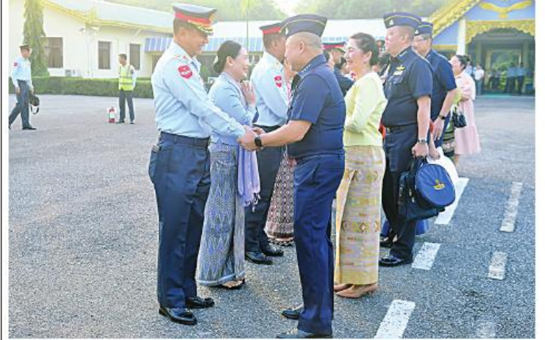
ထိုင်းဘုရင့်လေတပ်ဦးစီးချုပ် Air Chief Marshal Punpakdee Pattanakul နှင့်ဇနီး ဦးဆောင်သောကိုယ်စားလှယ်အဖွဲ့ကို တပ်မတော်(လေ)မှ အရာရှိကြီးများနှင့် တာဝန်ရှိသူများက မင်္ဂလာဒုံလေတပ်စခန်းဌာနချုပ်၌ ပို့ဆောင်နှုတ်ဆက်စဉ်။

Group Captain Jumphol Chantakam- maနှင့် တာဝန်ရှိသူတို့က မင်္ဂလာဒုံလေတပ် စခန်းဌာနချုပ်၌ ပို့ဆောင်နှုတ်ဆက်ကြ သည်။ အဆိုပါ ချစ်ကြည်ရေးကိုယ်စားလှယ် အဖွဲ့သည် နိုဝင်ဘာ ၂၃ ရက်တွင် ရန်ကုန် မြို့ရှိ ရွှေတိဂုံစေတီတော်၊ ကမ္ဘာအေးစေတီ တော်နှင့် ဗိုလ်တထောင်ကျိုက်ဒေးအပ် ဆံတော်ဦးစေတီတို့အား ပူးမြော် ကြည်ညိုကြပြီး ဗိုလ်ချုပ်အောင်ဆန်းဈေးသို့ သွားရောက်လေ့လာခဲ့ကြကြောင်း သတင်း ရရှိသည်။