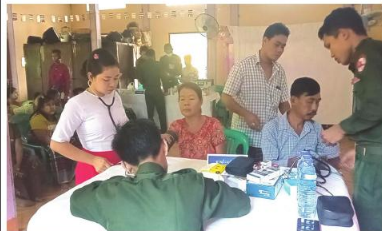
ရန်ကုန်တိုင်းစစ်ဌာနချုပ် နယ်မြေဆေးကုသရေးအဖွဲ့က ဒေသခံပြည်သူများကို ကျန်းမာရေးစောင့်ရှောက်မှုလုပ်ငန်းများဆောင်ရွက်ပေးစဉ်။

သည် ကျန်းမာရေးစောင့်ရှောက်မှုလုပ်ငန်းများ ဆက်လက်ဆောင်ရွက်ပေးလျက်ရှိကြောင်း သတင်းရရှိသည်။