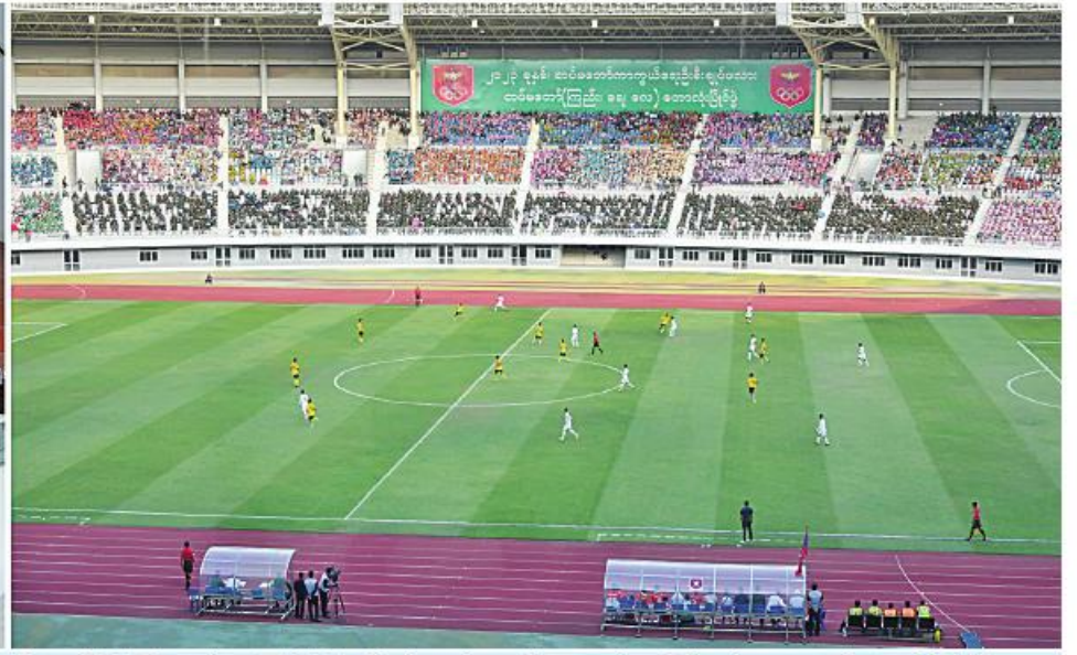
နိုင်ငံတော်စီမံအုပ်ချုပ်ရေးကောင်စီဥက္ကဋ္ဌ တပ်မတော်ကာကွယ်ရေးဦးစီးချုပ် ဗိုလ်ချုပ်မှူးကြီးမင်းအောင်လှိုင်နှင့် ဓနိုး ဒေါ်ကြူကြူလှတို့ အကြိမ်(၆၀)မြောက် တပ်မတော်ကာကွယ်ရေးဦးစီးချုပ်ဖလား တပ်မတော်(ကြည်း၊ ရေ၊ လေ)ဘောလုံးပြိုင်ပွဲ ဗိုလ်လုပွဲတွင် အရှေ့ပိုင်းတိုင်းစစ်ဌာနချုပ်ကိုယ်စားပြုဘောလုံးအသင်းနှင့် ကာကွယ်ရေးဦးစီးချုပ်ရုံး(ကြည်း)စခန်းမှူးရုံးကိုယ်စားပြုဘောလုံးအသင်းတို့ယှဉ်ပြိုင်ကစားနေမှုကို ကြည့်ရှုအားပေးစဉ်။