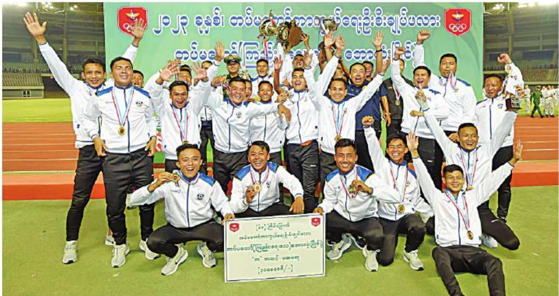
အကြိမ်(၆၀)မြောက် တပ်မတော်ကာကွယ်ရေးဦးစီးချုပ်ပေးလေး တပ်မတော်(ကြည်း၊ ရေ၊ လေ)ဘောလုံးပြိုင်ပွဲတွင် အနိုင်ရရှိလိမ့် နဲ့သည့် ကာကွယ်ရေးဦးစီးချုပ်ရုံး(ကြည်း) စခန်းများရုံးကိုယ်စားပြုဘောလုံးအသင်း အောင်ပွဲခံစဉ်။

အဆိုပါအကြိမ်(၆၀)မြောက် တပ်မတော် ကာကွယ်ရေးဦးစီးချုပ်ပေးလေး တပ်မတော် (ကြည်း၊ ရေ၊ လေ) ဘောလုံးပြိုင်ပွဲကို (က) အဆင့်ပြိုင်ပွဲနှင့် (ခ)အဆင့်ပြိုင်ပွဲဟူ၍ ပြိုင်ပွဲ နှစ်မျိုးခွဲခြားကာ (က)အဆင့်တွင် ပြိုင်ပွဲဝင်အသင်း ၁၆ သင်း၊ (ခ)အဆင့်တွင် ပြိုင်ပွဲဝင်အသင်းရှစ်သင်း စုစုပေါင်း ၂၄ သင်း ဖြင့် ကျင်းပပြုလုပ်ခဲ့ခြင်းဖြစ်ကြောင်း၊ ပထမ အဆင့်အုပ်စုပတ်လည်ပြိုင်ပွဲများကို တိုင်းစစ် ဌာနချုပ်များအလိုက် ရန်ကင်းခွဲ၍ ယှဉ်ပြိုင် ကစားခဲ့ကြပြီး နေပြည်တော်ရှိ ဝေယျာသီရိ တပ်မတော်အားကစားကွင်း၌ ဒုတိယအဆင့် ရှုံးထွက်ပွဲစဉ်များနှင့် ဝိုင်းလှပွဲ ပွဲစဉ်များကို ၂၀၂၃ ခုနှစ် နိုဝင်ဘာ ၆ ရက်မှ စတင်၍ ယှဉ်ပြိုင်ကစားခဲ့ကြခြင်းဖြစ်ကာ ယနေ့တွင် ဝိုင်းလှပွဲနှင့် ဆုချီးမြှင့်ပွဲအခမ်းအနားကို အောင်မြင်စွာကျင်းပပြီးစီးခဲ့ခြင်းဖြစ်ကြောင်း သတင်းရရှိသည်။