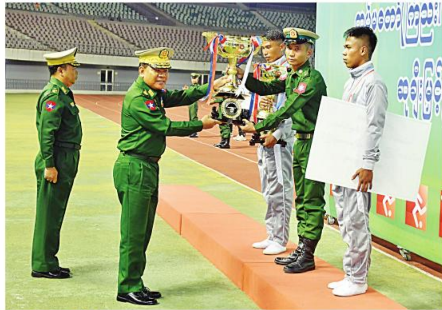
ညွှန်ကြားကွပ်ကဲရေးမှူးကြီး (ကြည်း၊ ရေ၊ လေ) ဗိုလ်ချုပ်ကြီး မောင်မောင်အေး တပ်မတော် (ကြည်း၊ ရေ၊ လေ) ဘောလုံးပြိုင်ပွဲ (ခ)အဆင့်ပြိုင်ပွဲတွင် ပထမဆုရရှိသော တောင်ပိုင်းတိုင်းစစ်ဌာနချုပ် အသင်းကို တပ်မတော် ကာကွယ်ရေးဦးစီးချုပ်၏ တံခွန်စိုက်ဆုဖလား၊ ဆင့်ပွားဆုဖလားနှင့် ငွေသားဆုများကို ပေးအပ်ချီးမြှင့်စဉ်။

ပြည်ထောင်စုအဆင့်ပုဂ္ဂိုလ်များနှင့် ဇနီးများ၊ ကာကွယ်ရေးဦးစီးချုပ်ရုံးမှ အဆင့်မြင့် တပ်မတော်အရာရှိကြီးများနှင့် ဇနီးများ၊ နေပြည်တော်တိုင်းစစ်ဌာနချုပ် တိုင်းမှူး၊ နိုင်ငံတော် ကာကွယ်ရေးတက္ကသိုလ်မှ သင်တန်းသားအရာရှိကြီးများ၊ ကာကွယ်ရေးဦးစီးချုပ်ရုံး (ကြည်း၊ ရေ၊ လေ)ရုံး၊ ဌာနအသီးသီးမှ အရာရှိ၊ စစ်သည်၊ မိသားစုများ၊ နေပြည်တော်တိုင်းစစ်ဌာနချုပ်ရှိ တပ်နယ်များမှ အရာရှိ၊ စစ်သည်၊ မိသားစုများ၊ တပ်မတော်ဘောလုံးအကယ်ဒမီမှ သင်တန်းသားများ၊ ဖိတ်ကြားထားသည့် ဧည့်သည်တော်များနှင့် အားကစားဝါသနာရှင်ပရိသတ်များ တစ်ခဲနက်တက်ရောက်ကြည့်ရှုအားပေးကြသည်။