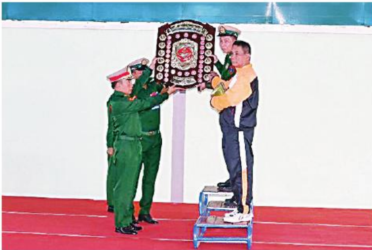
တပ်မတော်ကာကွယ်ရေးဦးစီးချုပ်ကိုယ်စား ဒုတိယတိုင်းမှူး ဗိုလ်မှူးချုပ်ဝင်းစော်မိုး တံခွန်ခိုက်ခိုင်းဆု ပေးအပ်ချီးမြှင့်စဉ်။

နေပြည်တော် နိုဝင်ဘာ ၂၄ ၂၀၂၃ ခုနှစ် တပ်မတော်ကာကွယ်ရေး ဦးစီးချုပ်ဒိုင်း တပ်မတော်(ကြည်း၊ရေ၊လေ) အမျိုးသား၊အမျိုးသမီး ဂျူဒိုပြိုင်ပွဲဗိုလ်လုပွဲ