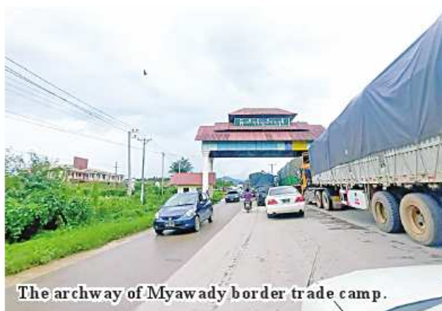
The archway of Myawady border trade camp.

In trading process of 17 border trade camps this financial year, Htikhee border camp handled US$1,889.189 million comprising US$1,718.545 million worth of export and US$170.644 million worth of import. Muse camp also handles US$1,483.297 million worth of trade volume including US$1,071.870 million worth of export and US$1,483.297 million worth of import. Myawady camp in Myanmar-Thai border tackled US$246.044 million worth of export goods and US$627.91 million worth of import products, totalling US$873.954 million. Myanmar exports agricultural produce, fishery products, minerals and CMP products and imports animal foodstuffs, bicycles, garment, stationery, auto parts, construction materials, vehicles, fertilizers, motorcike parts, electronics, foodstuffs, cosmetics, raw CMP materials, drugs, slippers, fruits, paints, household goods, personal goods, factory equipment, machinery and fishing equipment.