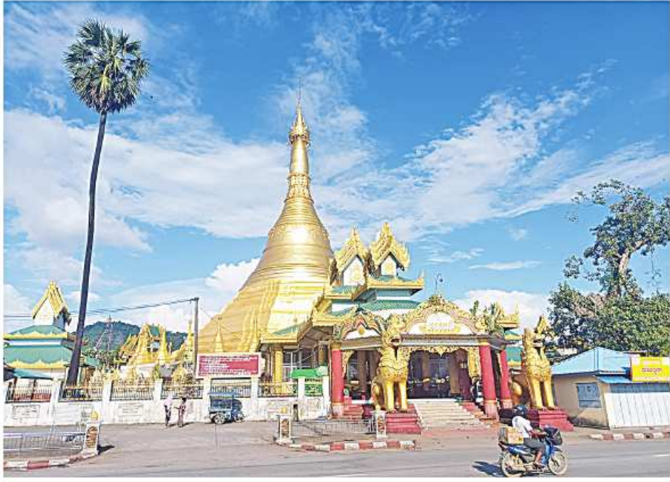
သထုံမြို့ရှိ ရွှေစာရံစေတီကို တွေ့ရစဉ်။

တစ်ယောက်က ဘောင်းဘီတိုဝတ်ဆင်လာတာကြောင့် ဝင်ခွင့်မရတော့ဘဲ သူနဲ့အတူအပြင်မှာစောင့်ကျန်ရစ်ခဲ့ရတော့တယ်။ ဖူးမြော်ပြီးပြန်ထွက်လာကြတဲ့ မောင်နှမတွေရှိနေပေမဲ့လဲ နောက်တစ်ခေါက်ထပ်မံတန်းစီစောင့်ဆိုင်းဖို့အတွက် ဘုရားဖူးဧည့်သည်လူအုပ်ကြီးက အလွန်များပြားလွန်းပြီး ကျွဲဘေးနားထိရောက်ရှိနေပြီဖြစ်လို့ ဖူးမြော်ခွင့်ကိုလက်လျှော့လိုက်ရတယ်။ အဲဒီအချိန်တုန်းက ဗုဒ္ဓမြတ်စွယ်တော်ကို ဖူးမြော်ရဖို့အတွက် မနက် ၄ နာရီ၊ ၅ နာရီလောက်ကတည်းက စတင်တန်းစီစောင့်ဆိုင်းနေခဲ့ရပြီး ၇ နာရီ၊ ၈ နာရီလောက်ရောက်မှ ဖူးမြော်ခွင့်ရရှိကြတာပါ။ မိမိကိုယ်တိုင်ကတော့ ယာယီစံကျောင်းရှေ့ဝင်ပေါက်