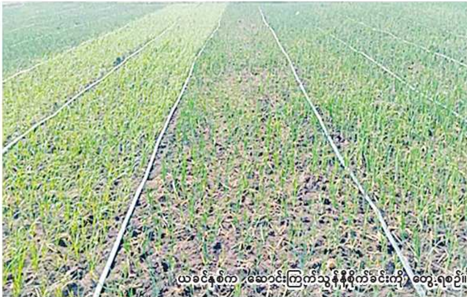
ယခုနှစ်က ဆောင်းကြက်သွန်နီစိုက်ခင်းကို တွေ့ရစဉ်။

“ဒီနှစ် ရွှေဘိုခရိုင်မှာ ဆောင်းကြက်သွန်နီဧက ၁၀၀၀၀ ကျော် စိုက်ပျိုးဖို့လျာထားပါတယ်။ နိုဝင်