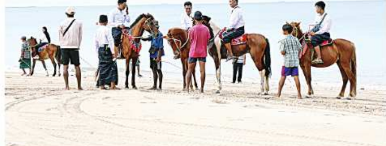
နိုင်ငံတော်ကာကွယ်ရေးတာဝန်ထမ်းဆောင်စဉ် ထိခိုက်ဒဏ်ရာရရှိခဲ့ပြီး ပြန်လည်ကောင်းမွန်လာသည့် တပ်မတော်သား အရာရှိ၊စစ်သည်များ ချောင်းသာကမ်းခြေ၌ အနားယူအပန်းဖြေခြင်းများ ဆောင်ရွက်ခဲ့ခြင်း

အဆိုပါအနားယူအပန်းဖြေခရီးစဉ်သွားရောက်ခဲ့သည့် အရာရှိ၊ စစ်သည်များကို သက်ဆိုင်ရာ တိုင်းစစ်ဌာနချုပ်အလိုက် တိုင်းမှူးများ၊ တာဝန်ရှိသူများက လိုအပ်သည်များ ဖြည့်ဆည်းဆောင်ရွက်ပေးခြင်း၊ တန်ခိုးကြီးဘုရားစေတီများ၊ အထင်ကရနေရာများ၏ ဗဟုသုတဖြစ်ပွယ်ရာ အကြောင်းအရာများနှင့် ပတ်သက်၍ လိုက်လံရှင်းလင်းပြသခြင်းများကို ဆောင်ရွက်ပေးခဲ့ရာ အရာရှိ၊စစ်သည်များအနေဖြင့် စိတ်လက်ပေါ့ပါးစွာဖြင့် ဒေသန္တရဗဟုသုတများကို လေ့လာခဲ့ကြပြီး ၎င်းတို့အတွက် လွန်စွာအကျိုးရှိသည့် ခရီးစဉ်တစ်ခုဖြစ်ကြောင်း၊ ယခုကဲ့သို့ အပန်းဖြေခရီးစဉ်သွားရောက်နိုင်ရေး စီစဉ်ဆောင်ရွက်ပေးခဲ့သည့် တပ်မတော် အကြီးအကဲများကိုလည်း ကျေးဇူးအထူးတင်ရှိကြောင်းနှင့် စိတ်ဓာတ်ခွန်အားများ ပိုမိုရရှိခဲ့ကြောင်း သတင်းရရှိသည်။