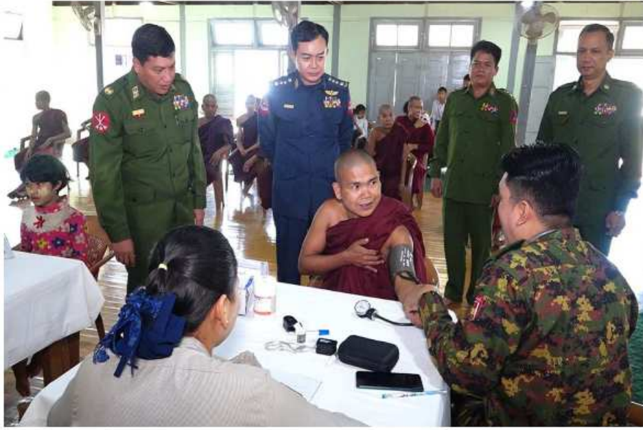
သံဃာတော်များအား မြောက်ပိုင်းတိုင်း ဝန်ဌာနချုပ် နယ်မြေခံ ဆေးကုသရေးအဖွဲ့က ကျန်းမာရေး စောင့်ရှောက်မှု လုပ်ငန်းများ ဆောင်ရွက်ပေးနေမှု ကို တာဝန်ရှိသူ များကကြည့်ရှု အားပေးစဉ်။