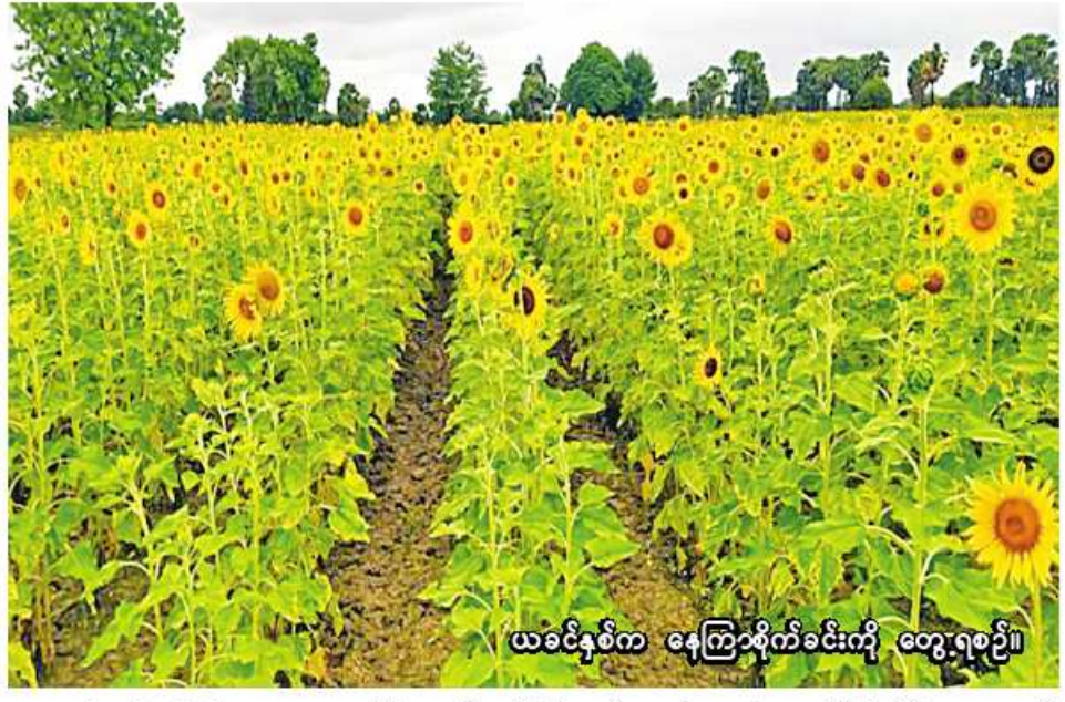
ယခင်နှစ်က နေကြာစိုက်ခင်းကို တွေ့ရစဉ်။ ရမည်းသင်း နိုဝင်ဘာ ၂၃ မန္တလေးတိုင်းဒေသကြီး ရမည်းသင်းမြို့နယ်တွင် ယခုနှစ် ဆောင်းသီးနှံစိုက်ပျိုးရာသီ၌ နေကြာဧက ၁၁၀၅၀ စိုက်ပျိုးပြီးစီးပြီဖြစ်ကြောင်း သိရသည်။