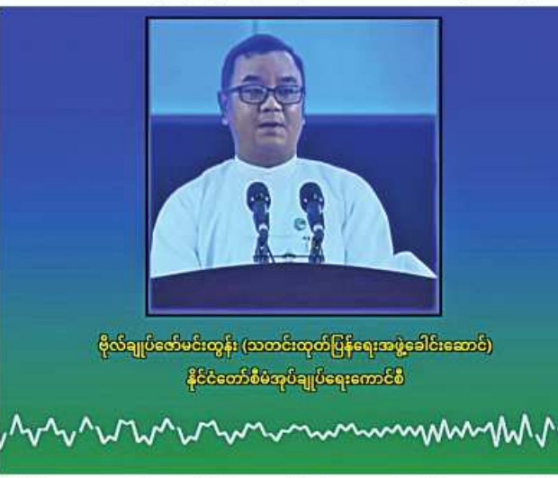
ပိုလ်ချုပ်ဇော်မင်းထွန်း (သတင်းထုတ်ပြန်ရေးအဖွဲ့ခေါင်းဆောင်) နိုင်ငံတော်စီမံအုပ်ချုပ်ရေးကောင်စီ

ဒီနေ့မှာတော့ မနက် ၉ နာရီ ၄၅ မိနစ်လောက်မှာ မူဆယ်မြို့နယ် ကောင်းခံကျေးရွာအနီးမှာရှိတဲ့ Seven ဟွာကျင့် ကုန်တင်ကုန်ချ ကားကြီးဝင်းကို MNDA နဲ့ TNLA ပူးပေါင်းအဖွဲ့ သောင်းကျန်းသူ အဖွဲ့က ကောင်းခံရွာရဲ့တောင်ဘက်ကနေ Drone များနဲ့ ကားတွေပေါ် Drop Bomb များကြဲခဲ့တာရှိပါတယ်။ အဲဒီမှာ ကျွန်တော်တို့ တရုတ်နိုင်ငံ ဘက်မှ မြန်မာနိုင်ငံဘက်ကို Export တင်သွင်းလာတဲ့ကား ၂၅၈ စီးရှိပါ တယ်။ အဓိကတော့ လူသုံးကုန်ပစ္စည်းတွေ၊ ဆေးဝါးပစ္စည်းတွေ၊ အဝတ် အထည်တွေ၊ ဆောက်လုပ်ရေးသုံးပစ္စည်းတွေတင်ထားတဲ့ ကားတွေဖြစ်ပါ တယ်။ ဒီကားတွေဟာ လမ်းမှာ ကျွန်တော်တို့ မူဆယ်-မန္တလေးလမ်းမကြီး တစ်လျှောက်မှာ TNLA နဲ့ MNDA အဖွဲ့တွေက ကားလမ်းတွေဖျက်ဆီး ပြီး တံတားများချိုးထားတဲ့အတွက် ဒီနေရာမှာ ရပ်တန့်ထားတဲ့ ကားတွေ ဖြစ်ပါတယ်။ အဲကား ၂၅၈ စီးထဲက အစီး ၁၂၀ လောက် မီးလောင်ပျက်စီး ခဲ့ပါတယ်။ ဒါကို ကျွန်တော်တို့ မူဆယ်မှာရှိတဲ့ မီးသတ်တပ်ဖွဲ့၊ မီးသတ် ကား လေးစီး၊ လုံခြုံရေးဆောင်ရွက်ပေးနေတဲ့ တပ်မတော်သားများ၊ ပြည်သူ့ စစ်တပ်ဖွဲ့ဝင်များပူးပေါင်းပြီး မီးငြိမ်းသတ်ခဲ့ရပါတယ်။ မီးလောင်လွယ်တဲ့ ပစ္စည်းတွေဖြစ်တဲ့အတွက်ကြောင့်မလို့ မီးအချိန်ပြင်းပါတယ်။ ဒီညနေပိုင်း ၄ နာရီလောက်မှ မီးငြိမ်းသတ်နိုင်ခဲ့ပါတယ်။ ကားအစီး ၁၂၀ လောက် မီးလောင်ပျက်စီးခဲ့ရပါတယ်။ ဒါနဲ့ပတ်သက်ပြီး ဒီနေရာသည် စစ်ရေးနဲ့