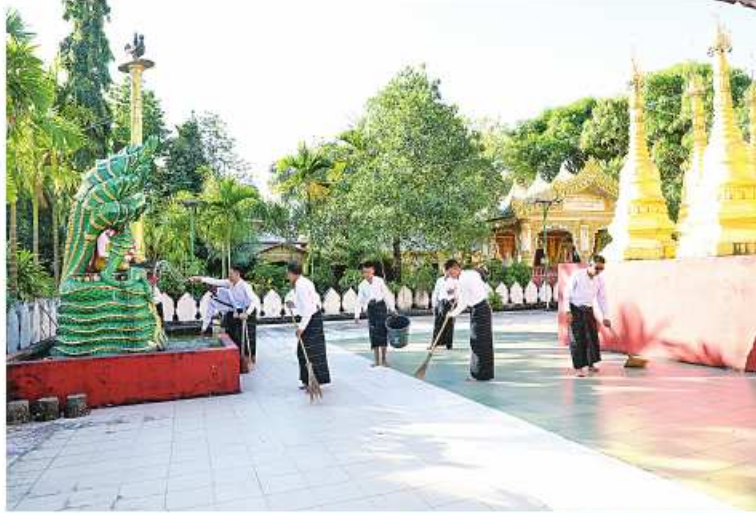
နိုင်ငံတော်ကာကွယ်ရေးတာဝန်ထမ်းဆောင်စဉ် ထိခိုက်ဒဏ်ရာရရှိခဲ့ပြီး ပြန်လည်ကောင်းမွန်လာသည့် တပ်မတော်သား အရာရှိ၊စစ်သည်များ ဘုရားပရိပုဏ်အတွင်း သန့်ရှင်းရေးဆောင်ရွက်ခဲ့ခြင်း

ထို့အတူ ပုသိမ်မြို့ရှိ ရွှေမုဋ္ဌောစေတီတော်မြတ်ကြီး၊ ချောင်းသာကမ်းခြေရှိ