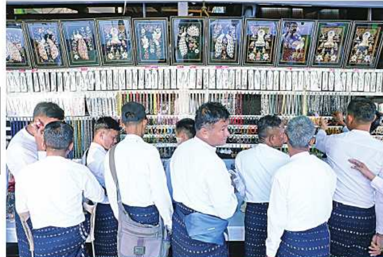
နိုင်ငံတော်ကာကွယ်ရေးတာဝန်ထမ်းဆောင်စဉ် ထိခိုက်ဒဏ်ရာရရှိခဲ့ပြီး ပြန်လည်ကောင်းမွန်လာသည့် တပ်မတော်သား အရာရှိ၊ စစ်သည်များ ကမာခရလက်မှုပညာများအား လေ့လာခြင်း