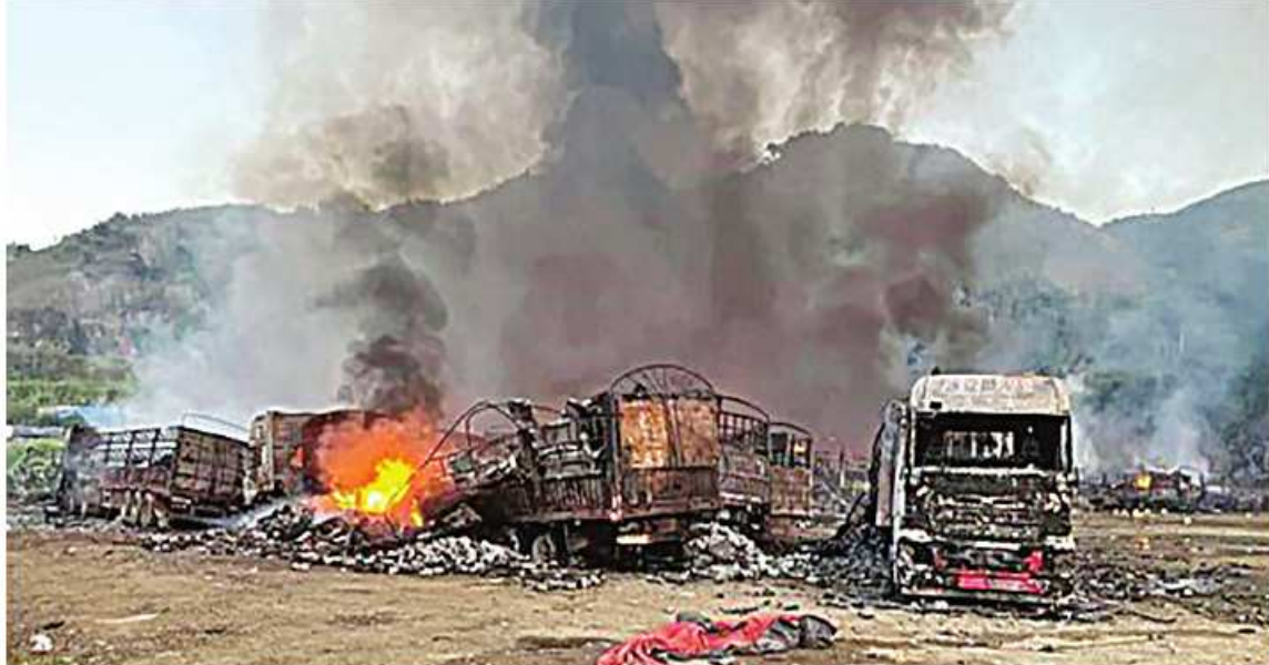
MNDAA၊ TNLA အဖွဲ့နှင့် PDF အမည်ခံပူးပေါင်းအကြမ်းဖက်သမားများ၏ Drop Bomb များ ပစ်ချတိုက်ခိုက်မှုကြောင့် မော်တော်ယာဉ်များ မီးလောင်ပျက်စီးနေမှုကို တွေ့ရခြင်း

ထိုကဲ့သို့ မီးလောင်ကျွမ်းမှုများဖြစ်ပေါ်ခဲ့သဖြင့် မြို့နယ်မီးသတ်တပ်ဖွဲ့ဝင်များ၊ ပြည်သူ့စစ်ဌာနတပ်ဖွဲ့ဝင်များ၊ ဒေသခံ