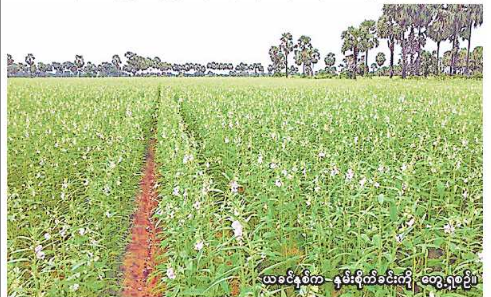
ယခင်နှစ်က နှမ်းစိုက်ခင်းကို တွေ့ရစဉ်။

မန္တလေး နိုဝင်ဘာ ၂၃ မန္တလေးတိုင်းဒေသကြီးအတွင်း သမဝါယမအသင်းသားတော်သူများ နိုင်ငံစီးပွားမြှင့်တင်ရေးရန် ပုံငွေဖြင့် ဆောင်းဆီထွက်သီးနှံစိုက်ပျိုးနိုင်ရေးအတွက် ငွေကျပ်သန်း ၁၂၀ ကျော် ထုတ်ချေးပေးသွားမည်ဖြစ်ကြောင်း မန္တလေးတိုင်းဒေသကြီး သမဝါယမဦးစီးဌာန လက်ထောက်ညွှန်ကြားရေးမှူး ဦးလှိုင်မိုးက ပြောပြ၍ သိရသည်။ နိုင်ငံစီးပွားမြှင့်တင်ရေးရန်ပုံငွေဖြင့် ဆောင်းဆီထွက်သီးနှံစိုက်ပျိုးနိုင်ရန် တံတားဦးမြို့နယ်ရှိ သမဝါယမအသင်း သုံးသင်း၊ အသင်းသားတော်သူ ၂၀၃ ဦး၊ ဆောင်းဆီထွက်သီးနှံစိုက်ဧက ၆၀၇ ဧကအတွက် ချေးငွေကျပ် ၁၂၇ ဒသမ ၆ သန်းကို ၂၀၂၄ ခုနှစ် ဖေဖော်ဝါရီလမှစ၍ ထုတ်ချေးပေးသွားမည်ဖြစ်ကြောင်း သိရသည်။ “နိုင်ငံစီးပွားမြှင့်တင်ရေးရန်ပုံငွေနှင့် ဆောင်းဆီထွက်သီးနှံစိုက်ပျိုးသွားမဲ့ တံတားဦးမြို့နယ်ကို ပံ့ပိုးပေးသွားမှာပါ။ ဆောင်းဆီထွက်သီးနှံစိုက်ပျိုးမဲ့ သီးနှံအလိုက် မြေပဲ သတ်မှတ်ထားကြောင်း မန္တလေးတိုင်းဒေသကြီး သမဝါယမဦးစီးဌာနမှ သိရသည်။ (၁၈၅)