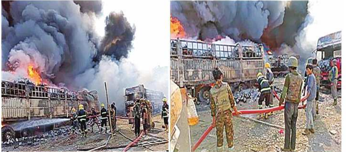
MNDAA၊ TNLA အဖွဲ့နှင့် PDF အမည်ခံပူးပေါင်းအကြမ်းဖက်သမားများ၏ Drop Bomb များ ပစ်ချတိုက်ခိုက်မှုကြောင့် မော်တော်ယာဉ်များ မီးလောင်ပျက်စီးနေမှုကို လုံခြုံရေးတပ်ဖွဲ့ဝင်များက ကူညီကယ်ဆယ်ရေးဆောင်ရွက်နေခြင်း

MNDAA၊ TNLA အဖွဲ့နှင့် PDF အမည်ခံ ပူးပေါင်းအကြမ်းဖက်သမားများသည် လုံခြုံရေးတပ်ဖွဲ့ဝင်များ လုံခြုံရေးဆောင်ရွက်ထားမှုမရှိသည့် စစ်ရေးပစ်ခတ်မဟုတ်သော မြန်မာ-တရုတ် နှစ်နိုင်ငံ ကုန်သွယ်ကိတ် ကျင်စခန်းကျော့အတွင်းရှိ ဆဲပင်းဟွာကျင့်ကုမ္ပဏီ သွင်းကုန်ကားဝင်းအတွင်းသို့ Drone ယာဉ်များဖြင့် Drop Bomb များ ပစ်ချတိုက်ခိုက်ခဲ့ရာ ကားဝင်းအတွင်း ရပ်နားထားသည့် မော်တော်ယာဉ်များပေါ်သို့ ဗုံးသီးများ ကျရောက်ပေါက်ကွဲမှုကြောင့် မီးလောင်ကျွမ်းမှုဖြစ်ပွားခဲ့ပြီး ယာဉ်တစ်စီးမှတစ်စီးဆက်လက်လောင်ကျွမ်းမှုဖြစ်ပေါ်ခဲ့သည်။