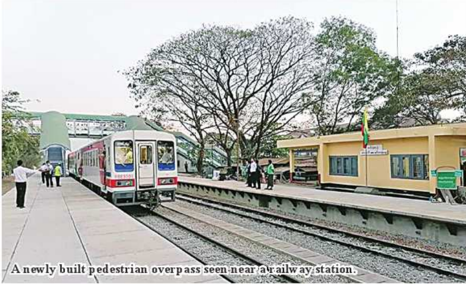
A newly built pedestrian overpass seen near a railway station.

Yangon November 23 Ministry will build two pedestrian overpasses on Yangon circular railroad and one pedestrian overpass on Yangon-Mandalay railroad in the 2023-2024 FY, according to the Ministry of Transport and Communications. Myanmar Railways (MR) under the Ministry of Transportation and Communication has been implementing railway upgrade projects according to the fiscal year. Among the upgrading projects, the upgrading and reconstruction of railroads,