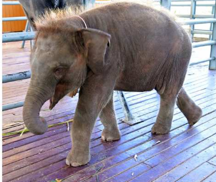
၂၀၂၂ ခုနှစ်တွင် ပေါ်ထွန်းလာသော ဆင်ဖြူတော်ကလေး “ရဋ္ဌနန္ဒက” ကျန်းမာပျော်ရွှင်လျက်ရှိမှုကို တွေ့ရစဉ်။

နေပြည်တော် နိုဝင်ဘာ ၂၃ ရခိုင်ပြည်နယ် တောင်ကုတ်မြို့နယ်ရှိ မြန်မာ့သစ်လုပ်ငန်းဆင်ပိုင်းမှ ဆင်မ ဇာနန်းလှ အသက် ၃၃ နှစ်က ဆင်ဖြူတော် အထီးကလေးတစ်စီးကို ၂၀၂၂ ခုနှစ် ဇူလိုင် ၂၃ ရက် နံနက် မင်္ဂလာ အချိန် ၆ နာရီခွဲတွင် မွေးဖွားခဲ့ပြီး အဆိုပါဆင်ဖြူတော်ကလေးမှာ မွေးဖွားစတွင် အရပ်အမြင့် ၂ ပေ ၅ လက်မ၊ ကိုယ်လုံး လုံးပတ် ၃ ပေ ၁ လက်မ၊ ကိုယ်အလေးချိန်ပေါင် ၁၈၀ ခန့်ရှိသည်။ ဆင်ဖြူတော်ကလေး၏ ဘွဲ့နာမံတော်မှာ “ရဋ္ဌနန္ဒက” ဖြစ်ပြီး အဆိုပါဆင်ဖြူတော်ကလေးသည် ရတနာဆင်ဖြူတော်များ၏ ကြန်အင်လက္ခဏာ ရှစ်ချက်အနက် မျက်လုံးပုလဲရောင်ဖြစ်ခြင်း၊ စာမျက်နှာ ၂၁ ကော်လံ ၁ ☆