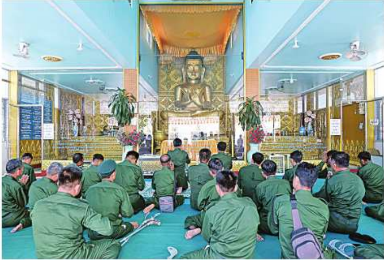
နိုင်ငံတော်ကာကွယ်ရေးတာဝန်ထမ်းဆောင်စဉ် ထိခိုက်ဒဏ်ရာရရှိခဲ့ပြီး ပြန်လည်ကောင်းမွန်လာသည့် တပ်မတော်သား အရာရှိ၊စစ်သည်များ တန်ခိုးကြီးဘုရားများအား သွားရောက်ဖူးမြော်ကြည့်ခဲ့ခြင်း

နေပြည်တော် နိုဝင်ဘာ ၂၃ နိုင်ငံတော်ကာကွယ်ရေးတာဝန် ထမ်းဆောင်စဉ် ထိခိုက်ဒဏ်ရာရရှိခဲ့ပြီး ဆေးရုံ၊ ဆေးခန်းများတွင် တက်ရောက်ကုသ၍ ပြန်လည်ကောင်းမွန်လာသည့်တပ်မတော်သား အရာရှိ၊စစ်သည်များကို တပ်မတော်အကြီးအကဲ၏ လမ်းညွှန်မှုအရ အနားယူအပန်းဖြေခရီးစဉ်အဖြစ် ဧရာဝတီတိုင်းဒေသကြီး ချောင်းသာကမ်းခြေသို့ မော်တော်ယာဉ်များဖြင့် နိုဝင်ဘာ ၁၈ ရက်တွင် ပို့ဆောင်ပေးခဲ့သည်။