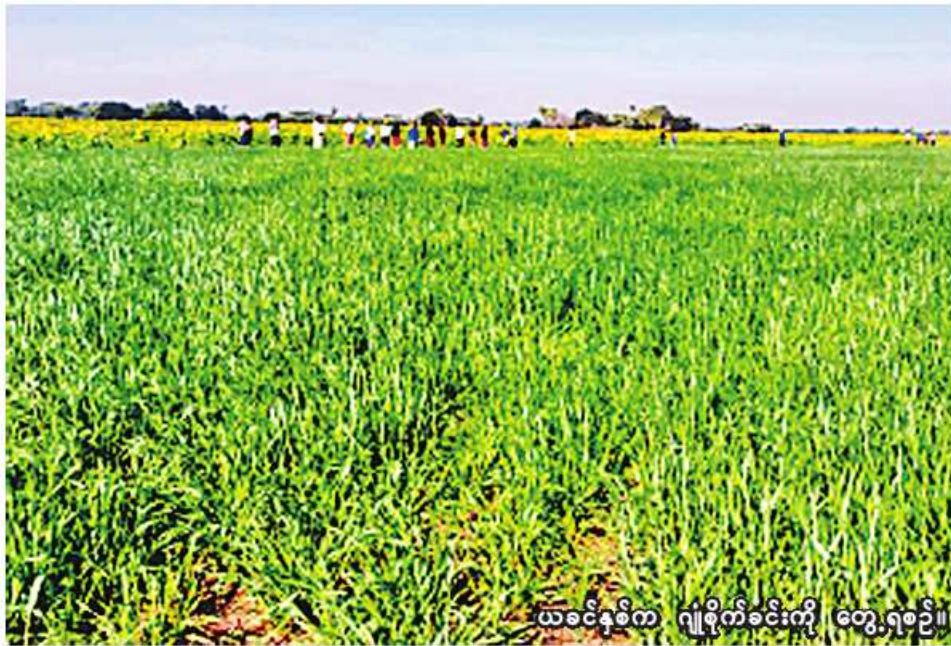
ယခင်နှစ်က ဂျုံစိုက်ခင်းကို တွေ့ရစဉ်။

ရေဦး နိုဝင်ဘာ ၂၃ စစ်ကိုင်းတိုင်းဒေသကြီး ရေဦးခရိုင်တွင် ယခုနှစ် ဆောင်းသီးနှံစိုက်ပျိုးရာသီ၌ ဂျုံဧက ၁၀၅၀ စိုက်ပျိုးမည်ဖြစ်ကြောင်း ရေဦးခရိုင် စိုက်ပျိုးရေးဦးစီးဌာနမှ သိရသည်။ ရေဦးခရိုင်တွင် ယခုနှစ် ဆောင်းသီးနှံစိုက်ပျိုးရာသီ၌ ဂျုံစိုက်ပျိုးရန်အတွက် မြို့နယ်အလိုက်