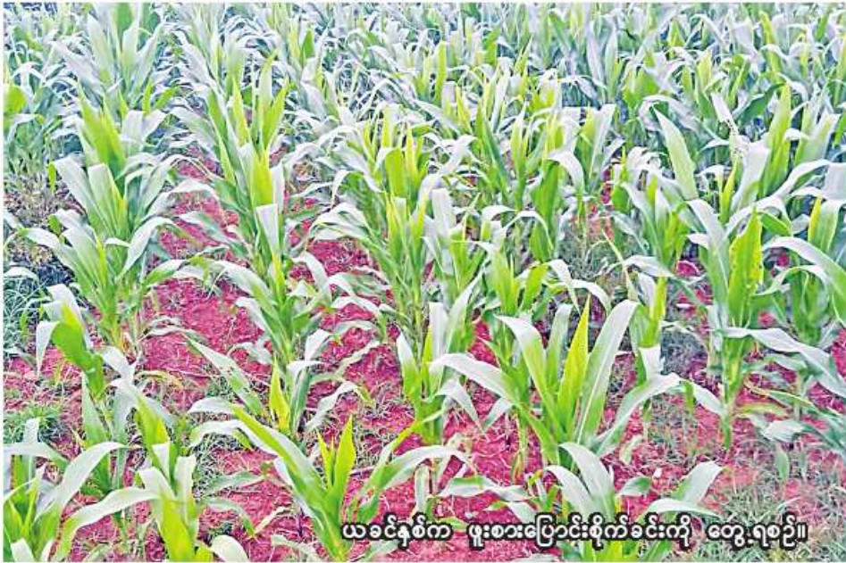
ယခုနှစ်က ဖူးစားပြောင်းစိုက်ခင်းကို တွေ့ရစဉ်။

စစ်ကိုင်း နိုဝင်ဘာ ၂၃ စစ်ကိုင်းတိုင်းဒေသကြီး စစ်ကိုင်းခရိုင် မြင်းမူမြို့နယ်တွင် ယခုနှစ် ဆောင်းသီးနှံစိုက်ပျိုးရာသီ၌ အစေ့ထုတ်ပြောင်းနှင့် ဖူးစားပြောင်း ၆၀၀၆ ဧက စိုက်ပျိုးပြီးစီးပြီဖြစ်ကြောင်း စစ်ကိုင်းခရိုင် စိုက်ပျိုးရေးဦးစီးဌာနမှ သိရသည်။ မြင်းမူမြို့နယ်တွင် ယခုနှစ် ဆောင်းသီးနှံစိုက်ပျိုးရာသီ၌ အစေ့ထုတ်ပြောင်းနှင့် ဖူးစားပြောင်း ၆၀၀၆ ဧက စိုက်ပျိုးပြီးစီးပြီဖြစ်ကြောင်း စစ်ကိုင်းခရိုင် စိုက်ပျိုးရေးဦးစီးဌာနမှ သိရသည်။