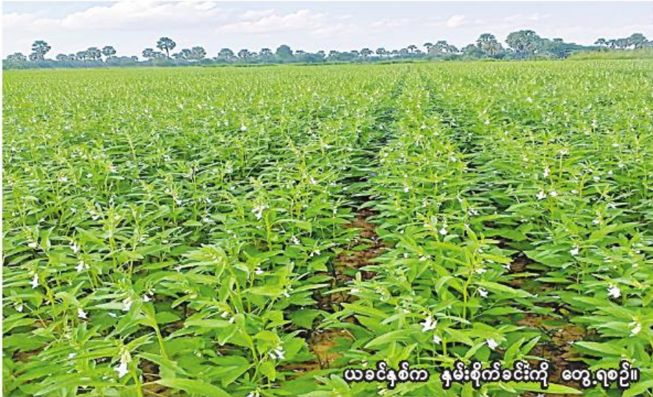
ယခင်နှစ်က နှမ်းစိုက်ခင်းကို တွေ့ရစဉ်။

ဒီပဲယင်းမြို့နယ်တွင် ယခုနှစ် မိုးသီးနှံစိုက်ပျိုးရာသီ၌ တောင်သူများ နှမ်းတိုးချဲ့စိုက်ပျိုးနိုင်ရေး၊ GAP နည်းစနစ်ဖြင့် စိုက်ပျိုးနိုင်ရေး၊ မျိုးကောင်းမျိုးသန့်များ စိုက်ပျိုးနိုင်ရေး၊ အထွက်နှုန်းကောင်းမွန်သည့်မျိုးများ စိုက်ပျိုးနိုင်ရေးအတွက် သက်ဆိုင်ရာ မြို့နယ်စိုက်ပျိုးရေးဦးစီးဌာနက အသိပညာပေးလုပ်ငန်းများ ဆောင်ရွက်ပေးလျက်ရှိကြောင်း သိရသည်။