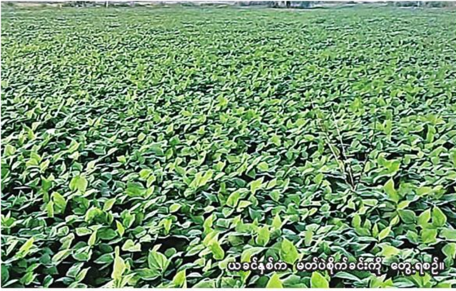
ယခင်နှစ်က မတ်ပဲစိုက်ခင်းကို တွေ့ရစဉ်။