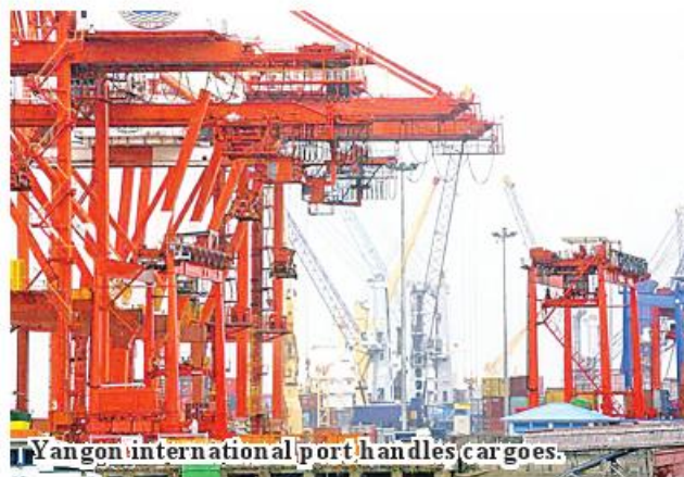
Yangon international port handles cargoes.

Third prioritized materials are electronics, home electronics, telephones and communication accessories, foodstuffs, personal goods and vehicles and heavy ma-