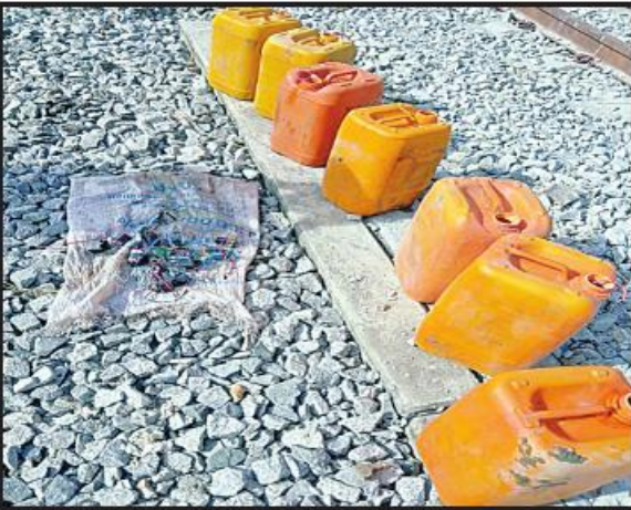
ခိုက်ဦး-ပြန်တန်ဆာဘူတာကြားတံတားအမှတ်(၁၁၆-A)အား မိုင်းထောင်ဖောက်ခွဲရန် တပ်ဆင်ထားသောယမ်းကြိုး၊ ဆက်စပ်ပစ္စည်းများနှင့် ယမ်းများထည့်သွင်းထားသည့် ပလတ်စတစ်ပုံး၊ ခုနစ်ပုံးတွေ့ရှိရမှုမှတ်တမ်းဓာတ်ပုံ။