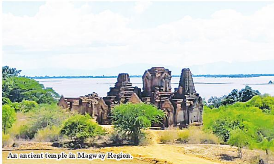
An ancient temple in Magway Region.