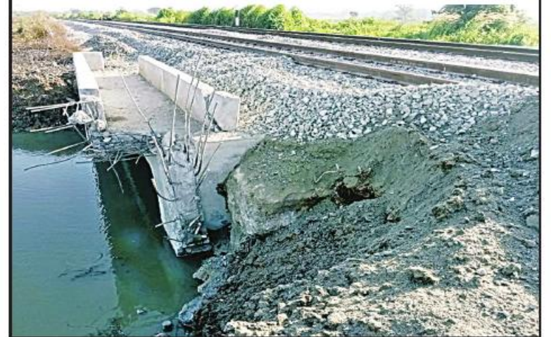
ခိုက်ဦး-ပြန်တန်ဆာဘူတာကြား မိုင်းထောင်ဖောက်ခွဲထားမှုကြောင့် တံတားအမှတ် (၁၁၆-A) Wing Wall ကွန်ကရစ်ခွဲထိခိုက်ပျက်စီးနေမှုမှတ်တမ်းဓာတ်ပုံ။

မြေရှင်းလင်းစစ်ဆေးခြင်း၊ မြန်မာ့မီးရထား အဖွဲ့များ ပိုမိုကောင်းမွန်လာစေရေး၊ ဝန်ထမ်းများက ပျက်စီးသွားသော ရထားလမ်းအား ပြန်လည်မွမ်းမံပြုပြင်ခြင်း တို့ကိုဆောင်ရွက်ခဲ့ပြီး ရထားသွားလာမှုကို ထိခိုက်မှုမရှိသော အစွန်လမ်းမှဆက်လက် စေလွှတ်ပေးခဲ့ပြီးဖြစ်သည်။ အကြမ်းဖက်သောင်းကျန်းသူအဖွဲ့များ အနေဖြင့် ၂၀၂၁ ခုနှစ် ဖေဖော်ဝါရီ ၁ ရက် မှစ၍ ယခုအချိန်အထိမြန်မာ့မီးရထားလမ်း ကွန်ရက်တစ်ခုလုံးတွင်ရထားလမ်းနှင့်ရထား ဘူတာနယ်မြေအတွင်း ငှဲထောင်မိုင်းခွဲတွေ့ ရှိခြင်း ၁၂၈ ကြိမ်၊ ရထားတံတားများအား မိုင်းခွဲဖျက်ဆီးခြင်း ၄၆ ကြိမ်၊ ဘူတာ အဆောက်အအုံနှင့် ဝန်ထမ်းနေအိမ်များ ကိုမီးရှို့ဖျက်ဆီးခြင်း ၁၂ ကြိမ်ကျူးလွန် ခဲ့ကြကြောင်း မှတ်တမ်းများအရသိ ရသည်။ နိုင်ငံတော်အစိုးရအနေဖြင့် အများ ပြည်သူ့အရေးသွားလာမှုနှင့် တူနစ်စည်ပုံ ဆောင်မှု အဆင်ပြေချောမွေ့မြန်ဆန်စေ ရေးအတွက် ရထားလမ်းအခြေခံအဆောက် မှုသတင်းရရှိသည်။ အဖွဲ့များ ပိုမိုကောင်းမွန်လာစေရေး၊ ရထားပို့ဆောင်ရေးစနစ်ကို အဆင့်မြှင့် တင်နေသည့် စီမံကိန်းလုပ်ငန်းများကို ရည်မှန်းချက်ထားရှိ၍ စီမံဆောင်ရွက် ပေးလျက်ရှိသော်လည်း အကြမ်းဖက် သောင်းကျန်းသူများကမူ နိုင်ငံတော်ပိုင် ရထားစက်ခေါင်းတွဲများနှင့်ခရီးသည်များ၊ တူနစ်စည်များထိခိုက်ပျက်စီးစေရေး၊ ပြည်သူ များအသက်အန္တရာယ်ထိခိုက်ပြီး စိတ်မချမ်း မြေ့စေရေးရထားဖြင့်ခရီးသွားလာမှု မပြု ရဲအောင် ခြိမ်းခြောက်ခြင်းတို့အပြင် ရန်ကုန်-မန္တလေးရထားလမ်း အဆင့်မြှင့် တင်ရေးစီမံကိန်းလုပ်ငန်းများ အချိန်ပိုမို ကြန့်ကြာစေရေးတို့အတွက် ယုတ်မာပက် စက်သောရည်ရွယ်ချက်များဖြင့် အကြိမ် ကြိမ်ကျူးလွန်နေကြသောကြောင့် အဆိုပါ အကြမ်းဖက်သောင်းကျန်းသူများ၏ ယုတ် မာပက်စက်မှုများအပေါ် ဒေသခံပြည်သူ တစ်ရပ်လုံးက ပြင်းထန်စွာဆန့်ကျင်ကန့် ကွက်ရှုတ်ချလျက်ရှိကြောင်း မြန်မာ့မီးရထား မှုသတင်းရရှိသည်။