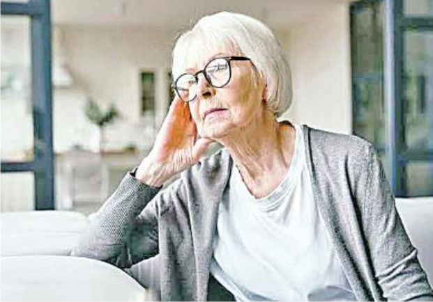
Ref : Xinhua News Trs : KKO

အခါမျှ အလည်အပတ်မသွားသူများတွင် သေချိန်မတန်ဘဲ သေဆုံးရနိုင်ခြေ ပိုမိုနိမ့်ကျခြင်း သုတေသန ပညာရှင်များက ပြောကြားသည်။ ထိုနည်းတူ မိသားစုမိတ်ဆွေများထံ သွားရောက်လည်ပတ်မှုကို တစ်လလျှင်တစ်ကြိမ်မျှ ပြုလုပ်သူများပင်လျှင် လာမည့် ၁၂ နှစ်အတွင်း အသက်ဆုံးပါးနိုင်ခြေမြင့်မားလာတတ်ကြောင်း သုတေသနပညာရှင်များ၏အဆိုအရ သိရသည်။ သို့ရာတွင် ချစ်သူခင်သူ မိတ်ဆွေ ဆွေမျိုးများထံ တစ်လလျှင် အနည်းဆုံးတစ်ကြိမ် အလည်အပတ် သွားခြင်းဖြင့် လူမှုရေးအရ အထီးကျန်မှုကြောင့် သေချိန်မတန်ဘဲ သေဆုံးနိုင်ခြေကို လျှော့ချနိုင် ပုံမှန်ထက် မြင့်မားနေတတ်ကြောင်း သိရသည်။ Ref : Xinhua News Trs : KKO