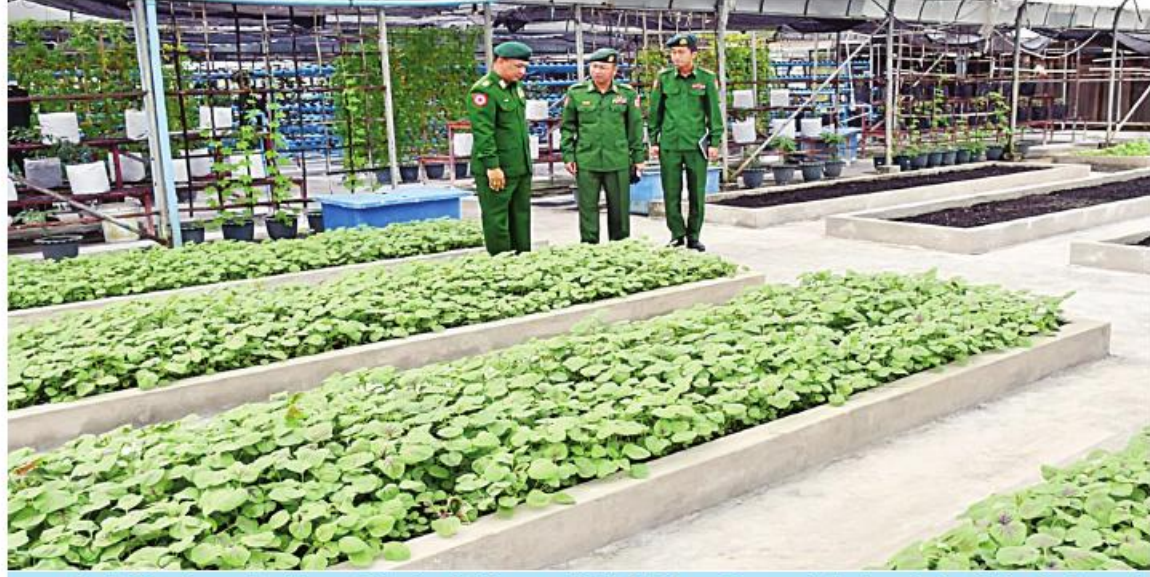
ရန်ကုန်တိုင်းစစ်ဌာနချုပ် တိုင်းမှူး ဗိုလ်ချုပ်ဇော်ဟိန်း အမှတ်(၁) စိုက်ပျိုးမွေးမြူရေးစခန်း(ခေတ်ဘွားကြီးကုန်း)၌ သီးပင်စားပင် များ စိုက်ပျိုးထားရှိမှုကို ကြည့်ရှုစစ်ဆေးခဲ့ပါ။

နေပြည်တော် နိုဝင်ဘာ ၁၄ ဒေသတွင်း စားရေရိက္ခာဖူလုံစေရန်နှင့် ပြည်သူများ၏ စားသောက်ရေးကိုအထောက် အကူဖြစ်စေရန်အတွက် တိုင်းစစ်ဌာနချုပ် များ၊ တပ်ရင်း၊ တပ်ဖွဲ့များ၌ စိုက်ပျိုးမွေးမြူ ရေးလုပ်ငန်းများကို ကြိုးပမ်းဆောင်ရွက် လျက်ရှိပါသည်။ ထိုသို့ ဆောင်ရွက်လျက်ရှိရာ ယနေ့ မွန်းလွဲပိုင်းတွင် ရန်ကုန်တိုင်းစစ်ဌာနချုပ် တိုင်းမှူး ဗိုလ်ချုပ်ဇော်ဟိန်းနှင့် တာဝန်