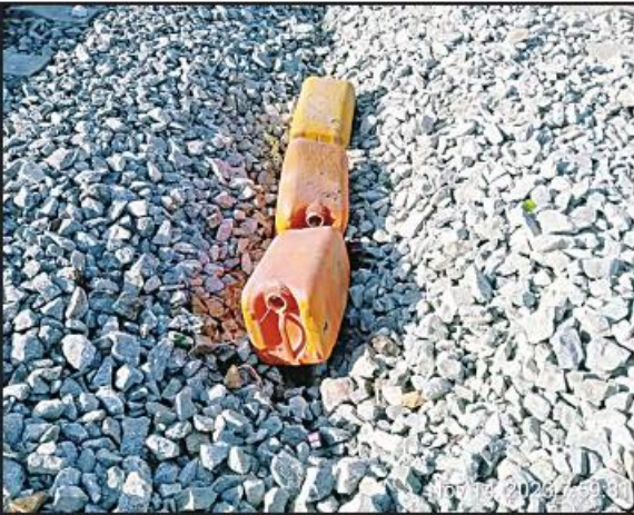
ခိုက်ဦး-ပြန်တန်ဆာဘူတာကြားတံတားအမှတ်(၁၆၆-A)အား ဖောက်ခွဲဖျက်ဆီး၍မိုင်းထောင်ထားမှုမှတ်တမ်းဓာတ်ပုံ။