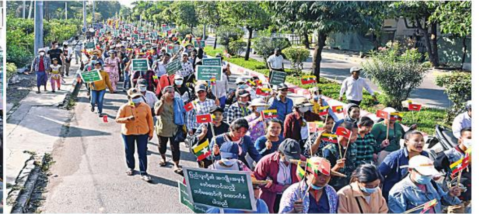
မန္တလေးမြို့နှင့်ပြင်ဦးလွင်မြို့တို့၌ ငြိမ်းချမ်းရေးလိုလားသည့် ပြည်သူများက နိုင်ငံတော်ကာကွယ်ရေးနှင့်လုံခြုံရေးတာဝန်များကို စွမ်းစွမ်းတမ်းတမ်းဆောင်ရွက်သည့် တပ်မတော်သားများ၊ မြန်မာနိုင်ငံရဲတပ်ဖွဲ့ဝင်များ၊ ပြည်သူ့စစ်များနှင့် ၎င်းတို့၏မိသားစုဝင်များအားလုံးကို ထောက်ခံပွဲကျင်းပစဉ်။

★ ကျောပုံ၊ မုအဆက် PDF အမည်ခံ အကြမ်းဖက်လက်နက်ကိုင် သောင်းကျန်းသူများအား ဆန့်ကျင်ရှုတ်ချပြီး နိုင်ငံတော်ကာကွယ်ရေးနှင့် လုံခြုံရေးတာဝန်များကို ထမ်းဆောင်နေကြသည့် တပ်မတော်သားများအား ထောက်ခံအားပေးပွဲကို ကျင်းပပြုလုပ်သည်။ ဦးစွာ မန္တလေးမြို့အတွင်းရှိ ငြိမ်းချမ်းရေးကို လိုလားသည့် သံဃာတော်များနှင့် ပြည်သူ့အင်အား ၂၀၀၀ ကျော်သည် စုရပ်နေရာဖြစ်သည့် မန္တလေးတိုင်းဒေသကြီးအောင်မြေသာစံမြို့နယ် ကျောက်တော်ကြီးဘုရားရှေ့ ၆၆ လမ်းပေါ်တွင် စုစည်း၍ ၎င်းမှတစ်ဆင့် နန်းမြို့ ကျေးဘေး ၁၂ လမ်းတစ်လျှောက်၊ ထိုမှတစ်ဆင့် ၇၃ လမ်းအတိုင်း၎င်းမှတစ်ဆင့် မန္တလေးတောင်ခြေရှိ ရွှေမန်းတောင်လူငယ်အားကစားလေ့ကျင့်ရေးစခန်းတွင်းအတွင်းသို့ ချီတက်၍ လမ်းတစ်လျှောက် အကြမ်းဖက်လက်နက်ကိုင် သောင်းကျန်းသူများအား ဆန့်ကျင်ရှုတ်ချပြီး တပ်မတော်သားများကို ထောက်ခံအားပေးသည့် ကြွေးကြော်သံများတစ်ကြွေး၍ ဆန္ဒထုတ်ဖော်ကြသည်။ ထို့နောက် ရွှေမန်းတောင်လူငယ်အားကစားလေ့ကျင့်ရေးစခန်းတွင်းအတွင်း အမျိုးသားရေး တက်ကြွလှုပ်ရှားသူများက နိုင်ငံတော်သီချင်းကို ဖွင့်လှစ်ခဲ့ပြီး အစွန်းရောက် အကြမ်းဖက်သမားများ၏ ယုတ်မာကောက်ကျစ်မှုများ၊ အကြမ်းဖက်သတ်ဖြတ်မှုများ၊ အကြမ်းဖက်လုပ်ရပ်များနှင့် ပတ်သက်၍ အမျိုးသားရေး တက်ကြွလှုပ်ရှားသူများက ရှင်းလင်းဟောပြောခြင်းကို ဆက်လက်