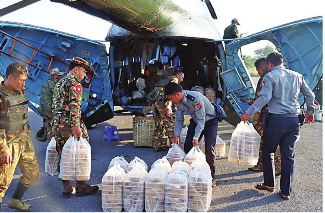
အရှေ့မြောက်တိုင်းစစ်ဌာနချုပ်နယ်မြေအတွင်း နိုင်ငံတော်လုံခြုံရေးနှင့် ကာကွယ်ရေးတာဝန်များကို စွမ်းစွမ်းတမ်းတမ်းဆောင်ရွက်ရုံသာ လုံခြုံရေးတပ်ဖွဲ့ဝင်များအတွက် စေတနာရှင်အလှူရှင်ပြည်သူများက လှူဒါန်းထားသည့် ဒံပေါက်ဘူးများကို တပ်မတော် လေယာဉ်ပေါ်သို့ တင်ဆောင်နေစဉ်။

နေပြည်တော် နိုဝင်ဘာ ၁၄ နိုင်ငံတော်လုံခြုံရေးနှင့်ကာကွယ်ရေးတာဝန်များကို စွမ်းစွမ်းတမ်းတမ်းဆောင်ရွက်ရုံသာ လုံခြုံရေးတပ်ဖွဲ့ဝင်များအတွက် စေတနာရှင်အလှူရှင်ပြည်သူများက အလှူငွေများ ပေးအပ်လှူဒါန်းလျက်ရှိသည့်အပြင် ဒံပေါက်ဘူးများနှင့် စားသောက်ဖွယ်ရာများကိုလည်း ပေးပို့လှူဒါန်းလျက်ရှိသည်။ ယနေ့တွင်လည်း စေတနာရှင်အလှူရှင်ပြည်သူများက အရှေ့မြောက်တိုင်းစစ်ဌာနချုပ်နယ်မြေအတွင်း နိုင်ငံတော်လုံခြုံရေးနှင့် ကာကွယ်ရေးတာဝန်များ ထမ်းဆောင်နေသည့် လုံခြုံရေးတပ်ဖွဲ့ဝင်များအတွက် ဒံပေါက်ဘူးများကို ပေးအပ်လှူဒါန်းကြရာ တာဝန်ရှိသူများက လက်ခံရယူပြီး လားရှိုးမြို့မှတစ်ဆင့် တပ်မတော်မော်တော်ယာဉ်များ၊ ရဟတ်ယာဉ်များဖြင့် လုံခြုံရေးတပ်ဖွဲ့ဝင်များ၏ လက်ဝယ်အရောက် စာမျက်နှာ ၁၆ ကော်လံ ၁၀