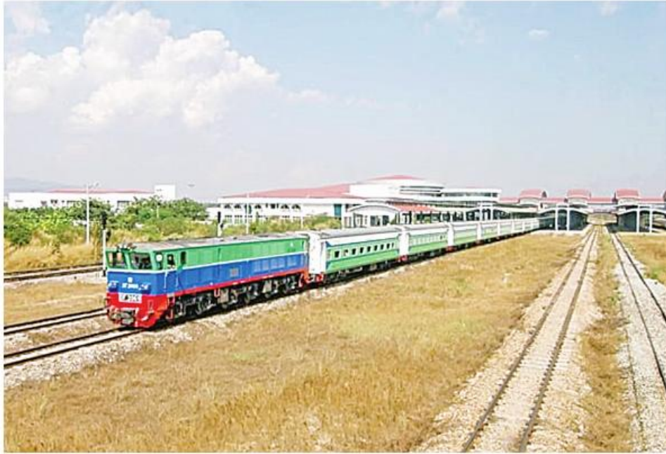
နေပြည်တော် နိုဝင်ဘာ ၁၄

တန်ဆောင်တိုင်ပွဲတော်ကာလ ရုံးပိတ်ရက်များတွင် နယ်ဝေးအထူးရထားများ ပြေးဆွဲပေးသွားမည်ဖြစ်ကြောင်း ပို့ဆောင်ရေးနှင့်ဆက်သွယ်ရေးဝန်ကြီးဌာန သတင်းများအရ သိရသည်။ ပို့ဆောင်ရေးနှင့် ဆက်သွယ်ရေးဝန်ကြီးဌာန ပြန်မာ့မီးရထားသည် ခရီးသွားပြည်သူများ ခရီးသွားလာရာတွင် အဆင်ပြေလွယ်ကူစေရေးအတွက် လိုအပ်သော ရထားလမ်းခရီးစဉ်များနှင့် လိုအပ်သော အချိန်ကာလများတွင် ပုံမှန်