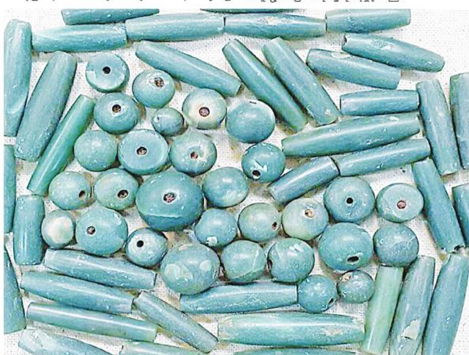
စပုံမြစ်ဝှမ်းမှတွေ့ရှိခဲ့သည့် ပုတီးစေ့များ။

ရှေးဦးလူသားများသည် စပုံမြစ်ဝှမ်း၊ ပန်းလောင် မြစ်အရှေ့ဘက်တွင်ရှိသည့် ပြဒါးလင်းဂူတွင် ကျောက် ကြမ်းခေတ်မှ ကျောက်ချောခေတ်ထိနေထိုင်ခဲ့ကြပြီး စပုံမြစ်ဝှမ်းဒေသတွင် ကျောက်ကြမ်းခေတ်၊ ကျောက် လယ်ခေတ်၊ ကျောက်ချောခေတ်ယဉ်ကျေးမှုများ ထွန်း ကားခဲ့ပြီးနောက် ကျောက်ချောခေတ်နောက်ပိုင်း၌