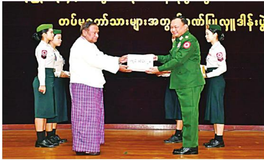
ရန်ကုန်တိုင်းစစ်ဌာနချုပ် တိုင်းမှူး ဗိုလ်ချုပ်ဇော်ဟိန်းထံ စေတနာရှင် အလှူရှင်တစ်ဦးက နိုင်ငံတော်လုံခြုံရေးနှင့် ကာကွယ်ရေးတာဝန်ကို စွမ်းစွမ်းတမ်းတမ်းဆောင်ရွက်ရုံသာ လုံခြုံရေးတပ်ဖွဲ့ဝင်များ အတွက် ဂုဏ်ပြုချီးမြှင့်ငွေများ ပေးအပ်ခဲ့ပါ။

နေပြည်တော် နိုဝင်ဘာ ၁၄ နိုင်ငံတော်လုံခြုံရေးနှင့် ကာကွယ်ရေး တာဝန်ကို စွမ်းစွမ်းတမ်းတမ်းဆောင်ရွက် ရုံသာ လုံခြုံရေးတပ်ဖွဲ့ဝင်များအတွက် စေတနာရှင်အလှူရှင်များက ဂုဏ်ပြုချီးမြှင့် ငွေများ လာရောက်ဂုဏ်ပြုချီးမြှင့်ပေးအပ် လျက်ရှိပါသည်။ ထိုသို့ ပေးအပ်လျက်ရှိရာ ယနေ့တွင် ရန်ကုန်တိုင်းဒေသကြီးအတွင်းရှိ စေတနာ