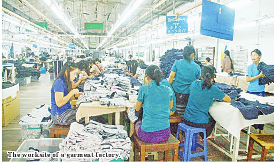
The worksite of a garment factory.

Nay Pyi Taw November 5 Up to 80 percent of factories in Myanmar's garment industry are owned by foreigners, according to reports released by the Myanmar Garment Manufacturers As-