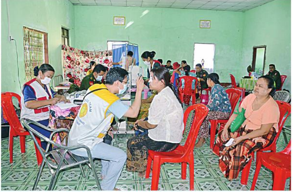
တပ်မတော်နှင့် ကျန်းမာရေးဝန်ကြီးဌာနတို့မှ နယ်လှည့်အထူးကုဆေးအဖွဲ့များက ဒေသခံပြည်သူများကို ကျန်းမာရေးစောင့်ရှောက်မှုလုပ်ငန်းများ ဆောင်ရွက်ပေးစဉ်။

နေပြည်တော် နိုဝင်ဘာ ၅ အတွင်းရှိ ကမ်းရိုးတန်းဒေသတစ်လျှောက်မှ တို့မှ ပါရဂူများ၊ ဆေးမှူးများနှင့် သူနာပြုများပါဝင် ငပုတောမြို့နယ် ကျွဲကူးရွာ၌ အခြေပြု၍ ဒေသခံ ရန်ကုန်တိုင်းဒေသကြီး ကိုကိုးကျွန်းမြို့နယ်နှင့် ဒေသခံပြည်သူများကို ကျန်းမာရေးစောင့်ရှောက်မှု သော နယ်လှည့်အထူးကုဆေးအဖွဲ့များလိုက်ပါလာ ပြည်သူ ၁၂၃၇ ဦးကို ကျန်းမာရေးစောင့်ရှောက်မှု ရောဂါတိုင်းဒေသကြီး ဟိုင်းကြီးကျွန်းနှင့် အနီး လုပ်ငန်းများဆောင်ရွက်ပေးရန် ထွက်ခွာလာ သည့် တပ်မတော်ပင်လယ်သွားဆေးရုံရေယာဉ် လုပ်ငန်းများ ဆက်လက်ဆောင်ရွက်ပေးသည်။ ပတ်ဝန်းကျင်ကျေးရွာများနှင့် ရခိုင်ပြည်နယ် သည့် တပ်မတော်နှင့် ကျန်းမာရေးဝန်ကြီးဌာန (သံလွင်)သည် ယနေ့တွင် ရောဂါတိုင်းဒေသကြီး စာမျက်နှာ ၁၉ ကော်လံ ၁ ☆