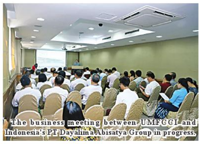
The business meeting between UMFCCI and Indonesia's PT Dayalima Abisatya Group in progress.