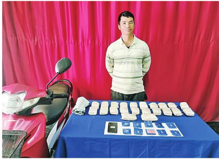
နေပြည်တော် နိုဝင်ဘာ ၅ ရဲတပ်ဖွဲ့ဝင်များ ပါဝင်သောဖွဲ့စည်းပေးအဖွဲ့ မူးယစ်ဆေးဝါး တားဆီးနှိမ်နင်းရေး သည် နိုဝင်ဘာ ၃ ရက် မွန်းလွဲ ၂ နာရီတွင်

တာချီလိတ်မြို့ ရန်အောင်မြေရပ်ကွက် ပါလျှံ(၁)ကွက်သစ်လမ်းတွင် လီဂေ(ခ) အားဂေ မောင်းနှင်လာသည့် ဆိုင်ကယ် ကို ရပ်တန့်စစ်ဆေးရာမှစ၍ စိတ်ကြွေး သွပ်ဆေးပြား ၆၀၀၀ သိမ်းဆည်းရမိခဲ့ပြီး မွန်းလွဲ ၂ နာရီ ၄၅ မိနစ်တွင် တာချီလိတ် မြို့နယ် လွယ်တော်ခမ်းကျေးရွာအုပ်စု စန်းလုံ(အပေါ်)ကျေးရွာရှိ ၎င်း၏နေအိမ် ကို ဆက်လက်ရှာဖွေရာ စိတ်ကြွေးသွပ် ဆေးပြား ၄၂၀၀၀ ကိုလည်းကောင်း ထပ်မံသိမ်းဆည်းရမိခဲ့သဖြင့် ၎င်းတို့အား မူးယစ်ဆေးဝါးနှင့် စိတ်ကိုပြောင်းလဲစေ သော ဆေးဝါးများဆိုင်ရာဥပဒေအရ အရေးယူထားကြောင်း သတင်းရရှိသည်။