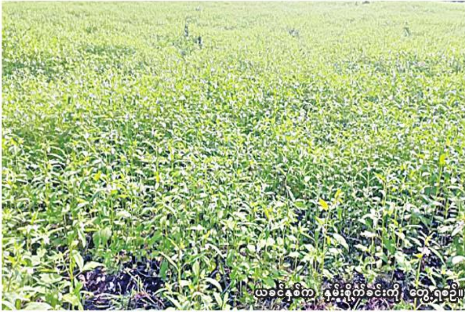
ယခင်နှစ်က နှမ်းစိုက်ခင်းကို တွေ့ရစဉ်။

စစ်ကိုင်း နိုဝင်ဘာ ၅ သိရသည်။ စစ်ကိုင်းမြို့နယ်တွင် ယခုနှစ် မိုးသီးနှံစိုက်ပျိုးရာသီ၌ ၂၇၈၅၀၈ ဧက စိုက်ပျိုးရန်လျာထားပြီး ယခုနှစ် မေလမှစတင်စိုက်ပျိုးခဲ့ရာ ယနေ့ထိ ၂၇၈၅၀၈ ဧက စိုက်ပျိုးရေးဦးစီးဌာနမှ သိရသည်။ “ပြီးခဲ့တဲ့နှစ်က စစ်ကိုင်းမြို့နယ်မှာ မိုးသီးနှံစိုက်ပျိုးရာသီမှာ ၂၈၀၀၀၀ ဧက စိုက်ပျိုးနိုင်ခဲ့ပါတယ်။ ဒီနှစ် မိုးသီးနှံစိုက်ပျိုးရာသီမှာ သီးနှံစုံ ၂၇၈၅၀၈ ဧက စိုက်ပျိုးပြီးစီးပြီဖြစ်ကြောင်း စစ်ကိုင်းမြို့နယ် စိုက်ပျိုးရေးဦးစီးဌာနမှ သိရသည်။