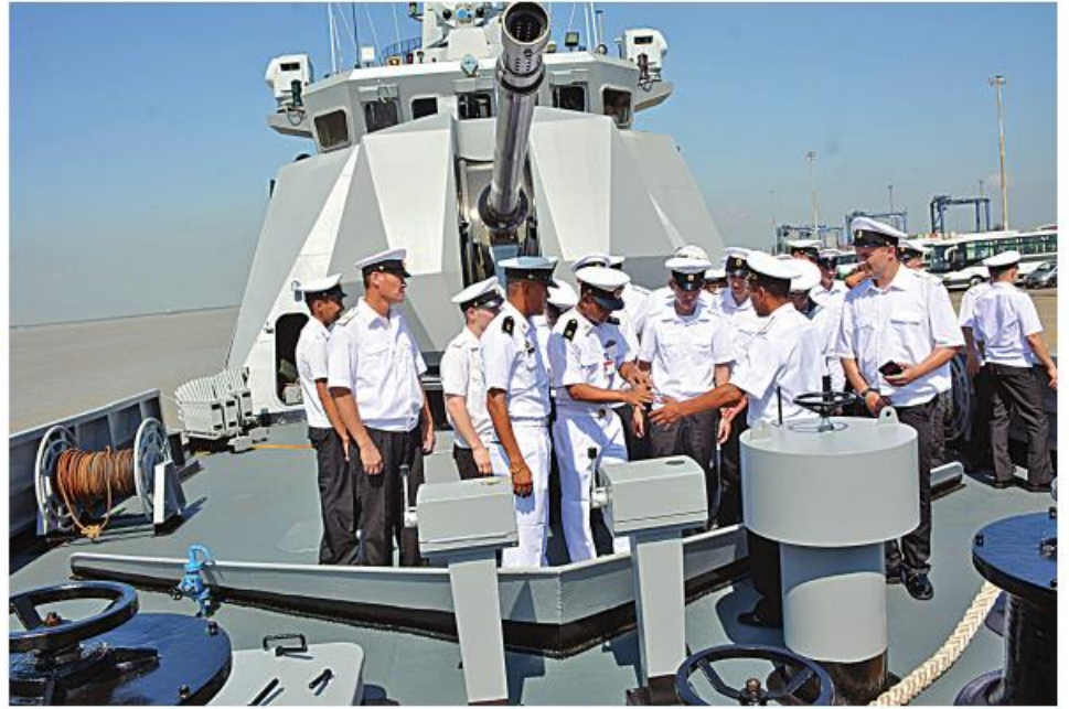
ချစ်ကြည်ရေးခရီးရောက်ရှိနေသည့် ရုရှားရေတပ်စစ်ရေယာဉ်များမှ အရာရှိ၊ စစ်သည်များက တပ်မတော်(ရေ)မှ စစ်ရေယာဉ်များသို့ လာရောက်လေ့လာစဉ်။