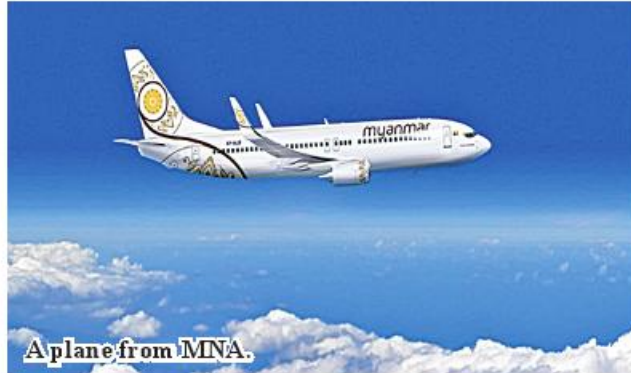
A plane from MNA.

Currently, raw elephant foot yam crops are being transformed into finished products by modern methods in foreign countries to produce a variety of breads, beverages, food, cosmetics, industrial raw materials, traditional medicine and modern medicine, and waste products are used as animal feed. Elephant foot yams produced in Myanmar are better than those produced in other parts of Asia and they have strong demands from China, Japan, South Korea and India. 336