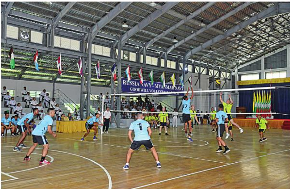
ရုရှားရေတပ်စစ်ရေယာဉ်များမှ အရာရှိ၊ စစ်သည်များနှင့် တပ်မတော်(ရေ)မှ အရာရှိ၊ စစ်သည်များက ချစ်ကြည်ရေးဘော်လီဘောပြိုင်ပွဲနှင့် ချစ်ကြည်ရေးဘောလုံးပြိုင်ပွဲကို ယှဉ်ပြိုင်စဉ်။