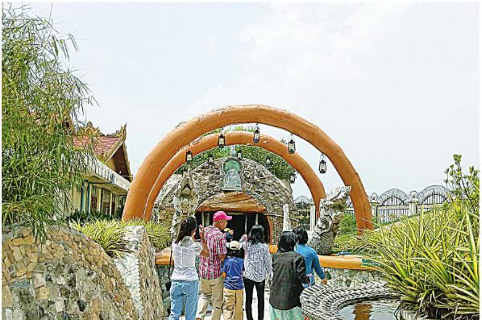
မန္တလေး နိုဝင်ဘာ ၅