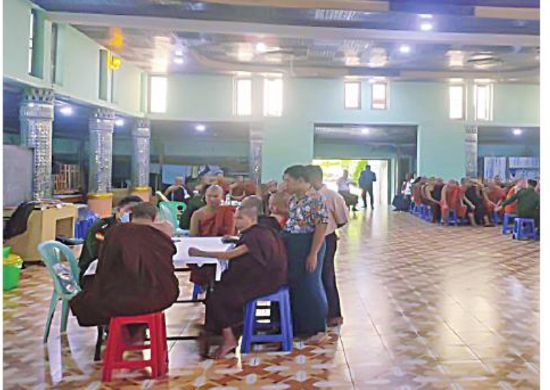
အလယ်ပိုင်းတိုင်းစစ်ဌာနချုပ် နယ်မြေခံဆေးကုသရေးအဖွဲ့က မန္တလေးတိုင်းဒေသကြီး အောင်မြေသာစံမြို့နယ် ဥပသ်တော်ရပ်ကွက် နဂါးပရိယတ္တိစာသင်တိုက်ရှိ ဆရာတော်၊ သံဃာတော်များအား ကျန်းမာရေးစောင့်ရှောက်မှုလုပ်ငန်းများ ဆောင်ရွက်ပေးစဉ်။

နေပြည်တော် ၆ ဇူလိုင် ၂၀၂၃ စီးပွားရေးနှင့်ကူးသန်းရောင်းဝယ်ရေးဝန်ကြီးဌာန စားသုံးဆီတင်သွင်းသိုလှောင်ဖြန့်ဖြူးခြင်းလုပ်ငန်းကြီးကြပ်ရေးကော်မတီ အနေဖြင့် စားအုန်းဆီကမ္ဘာ့ဈေးနှုန်းဖြစ်ပေါ်ပြောင်းလဲမှုနှင့် အညီ ပြည်တွင်း၌ ဖြစ်သင့်ဖြစ်ထိုက်သည့် ဈေးနှုန်းများဖြစ်ပေါ်စေရေး ထိန်းကျောင်းဆောင်ရွက်လျက်ရှိပြီး စားအုန်းဆီအဓိက ထုတ်လုပ်တင်ပို့သည့် မလေးရှားနိုင်ငံတွင်ဖြစ်ပေါ်နေသည့် FOB ဈေးနှုန်းများကိုနေ့စဉ်စောင့်ကြည့်ကာ သယ်ယူပို့ဆောင်ခ ကုန်ကုစရိတ်များ၊ ဘဏ်စရိတ်များ၊ အခွန်အခများထည့်သွင်း တွက်ချက်၍ ပြည်တွင်းဈေးကွက်၌ ရောင်းဝယ်ဖောက်ကားရမည့် အခြေခံလက်ကားရည်ညွှန်းဈေးနှုန်းကို ထုတ်ပြန်ပေးလျက် ရှိသည်။ ယခုအပတ်အတွင်း ကမ္ဘာ့စားအုန်းဆီထုတ်လုပ်တင်ပို့သည့် နိုင်ငံများတွင် ဈေးကွက်နှင့်ဈေးနှုန်းဖြစ်ပေါ်မှုများအရ နိုဝင်ဘာ ၆ ရက်မှ နိုဝင်ဘာ ၁၂ ရက်ထိ ရန်ကုန်အထိုင်ဈေး အခြေခံလက်ကားရည်ညွှန်းဈေးနှုန်းမှာ စားအုန်းဆီ တစ်ပိဿာလျှင် ၄၅၆၀ ကျပ်ဖြစ်ကြောင်း ထုတ်ပြန်ကြေညာထားသည်။ ထို့ပြင် ပြည်တွင်းဈေးကွက်အတွင်း ဈေးနှုန်းမြင့်တင်ရောင်းချခြင်း၊ ဈေးကစားရန်ရည်ရွယ်ချက်ဖြင့် သိုလှောင်ခြင်းနှင့် မသမာသည့်လုပ်ဆောင်မှုများပြုလုပ်ပါက အရေးကြီးကုန်စည်နှင့် ဝန်ဆောင်မှုပေးအရ အရေးယူဆောင်ရွက်သွားမည်ဖြစ်ကြောင်း အသိပေးထုတ်ပြန်ထားသည်။ အခြေခံလက်ကားရည်ညွှန်းဈေးနှုန်းများကို စားသုံးသူရေးရာဦးစီးဌာန၏ Website: www.doca.gov.mm ၊ Facebook Page နှင့် မြန်မာနိုင်ငံ ဆီကုန်သည်နှင့် ဆီလုပ်ငန်းရှင်များ အသင်း၏ Facebook Page တွင် ဝင်ရောက်ကြည့်ရှုနိုင်ကြောင်း သတင်းရရှိသည်။ (သတင်းစဉ်)