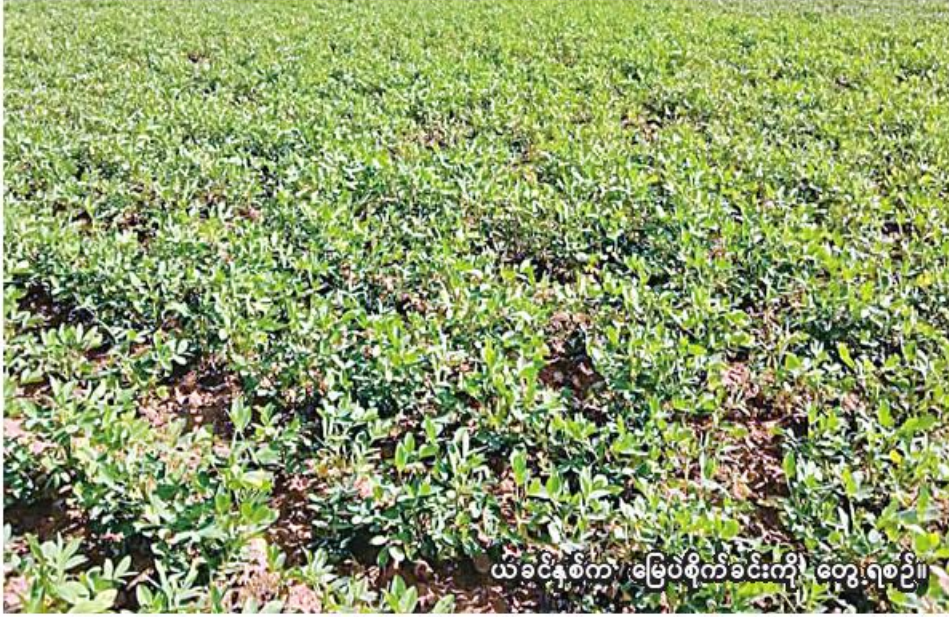
ယခင်နှစ်က မြေပဲစိုက်ခင်းကို တွေ့ရစဉ်။