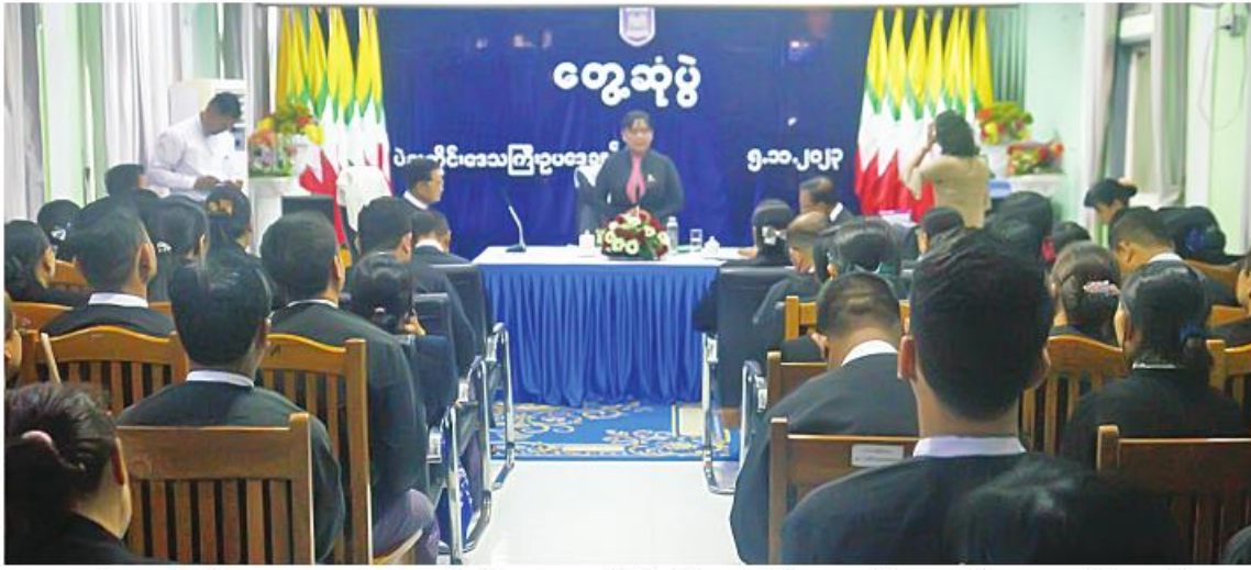
ပဲခူး နိုင်ငံသာ ၅ ရန်နှင့် ရေဘေးသင့်ဝန်ထမ်းများသက်သာ တိုင်းဒေသကြီး ဥပဒေချုပ်ရုံးအစည်းအဝေး ပဲခူးတိုင်းဒေသကြီးအတွင်းရှိ ရေဘေး ချောင်ချိရေးအတွက် ထောက်ပံ့ငွေပေးအပ် ခန်းမ၌ ကျင်းပသည်။ သင့်ခဲ့သောဥပဒေရုံးများ ပြန်လည်ဖြုတ်ပြင် လျှင်မြန်စေရန်အတွက် ယနေ့နံနက်ပိုင်းတွင် ပဲခူး အခမ်းအနားတွင် ပြည်ထောင်စုဝန်ကြီး

နှင့် ပြည်ထောင်စုရှေ့ချုပ် ဒေါက်တာ ဦးခင်မောင်တင့်က ဥပဒေရုံးများ၏ သိတာဦးတည် ဥပဒေရေးရာဝန်ကြီးဌာနအနေ လုပ်ငန်းဆောင်ရွက်မှု အခြေအနေနှင့် ဖြင့် ဝန်ထမ်းများသက်သာချောင်ချိရေး ရေဘေးသင့်ခဲ့သည့် ဥပဒေရုံးအဆောက် အတွက် ငွေကျပ်သိန်း ၉၀ နှင့် စားသောက် အဖွဲ့များပျက်စီးမှုနှင့် ပြုပြင်ထိန်းသိမ်း ဖွယ်ရာများ လာရောက်လျှော့နည်းခြင်းဖြစ် ဆောင်ရွက်ထားမှု အခြေအနေများကို ကြောင်း၊ ရေဘေးကျရောက်စဉ် တိုင်းဒေသ ရှင်းလင်းတင်ပြသည်။ ကြီး ဥပဒေချုပ်နှင့် တိုင်းဒေသကြီးဥပဒေ ယင်းနောက် ပြည်ထောင်စုဝန်ကြီးနှင့် အရာရှိတို့၏ ကြီးကြပ်ဆောင်ရွက်မှုဖြင့် ပြည်ထောင်စုရှေ့ချုပ်ကထောက်ပံ့ငွေနှင့် ထိခိုက်သေဆုံးမှုမရှိဘဲ ထောက်ပံ့ပစ္စည်းများကို တိုင်းဒေသကြီး ဝန်ထမ်းများ ထိခိုက်သေဆုံးမှုမရှိဘဲ ဥပဒေချုပ်ထံပေးအပ်ပြီး ရေဘေးဒဏ် အဆောက်အအုံများအနည်းငယ်သာပျက်စီး ကြောင့် ပျက်စီးခဲ့သည့် တိုင်းဒေသကြီး ဆုံးရှုံးမှုရှိခဲ့ပြီး ပြန်လည်ထူထောင်ရေး ဥပဒေချုပ်ရုံး၊ ပဲခူးခရိုင်ဥပဒေရုံး၊ ပဲခူးမြို့ လုပ်ငန်းများကို တက်ကြွစွာကြိုးပမ်းဆောင် ရွက်ခဲ့ကြသည်အတွက် အားလုံးကိုကျေးဇူး နယ်ဥပဒေရုံးတို့ကို ပြန်လည်ဖြုတ်ပြင်ထားရှိမှု တင်ရှိကြောင်း ပြောကြားသည်။ ကို လှည့်လည်ကြည့်ရှုစစ်ဆေးခဲ့ကြောင်း တို့ပြင် ပဲခူးတိုင်းဒေသကြီး ဥပဒေချုပ် သတင်းရရှိသည်။ (သတင်းစဉ်)