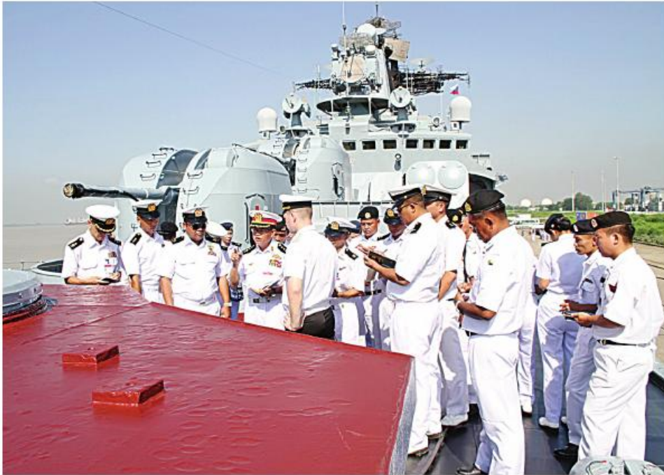
တပ်မတော်(ရေ)မှ အရာရှိ၊ စစ်သည်များက ရုရှားစစ်ရေယာဉ်များသို့ သွားရောက်လေ့လာစဉ်။