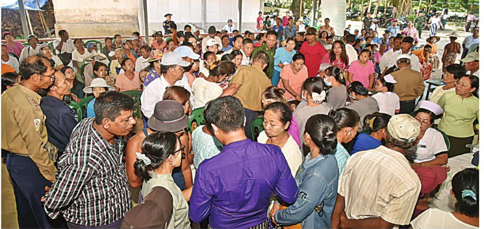
သံဃာတော်နှင့် ဒေသခံပြည်သူများကို တပ်မတော်နှင့် ကျန်းမာရေးဝန်ကြီးဌာနတို့မှ နယ်လှည့်အထူးဆေးကုသရေးအဖွဲ့က ကျန်းမာရေးစောင့်ရှောက်မှုလုပ်ငန်းများ ဆောင်ရွက်ပေးစဉ်။