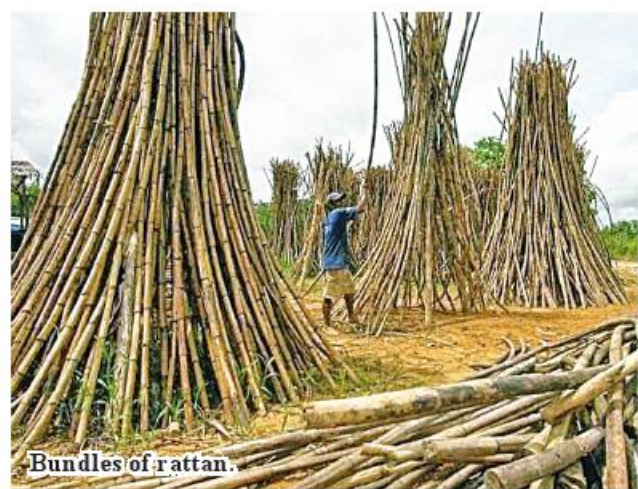
Bundles of rattan.

Raw rattan materials and rattan furniture have been exported to South Korea, Japan, the United States and Europe.