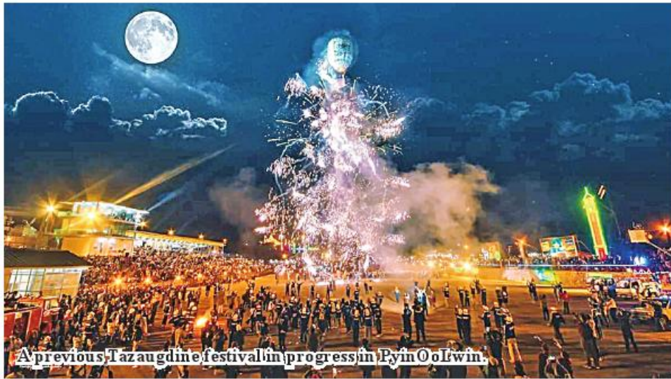
A previous Tazaugdine festival in progress in Pyin Oo Lwin.