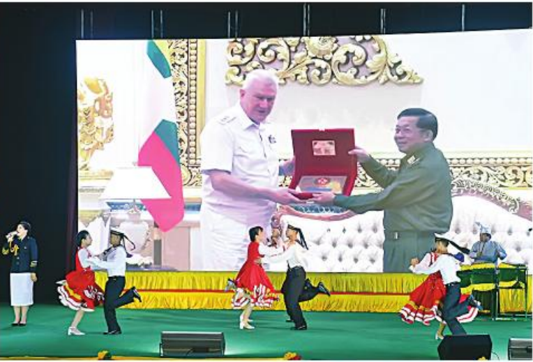
မြန်မာ-ရုရှား နှစ်နိုင်ငံချစ်ကြည်ရေး မြန်မာ့တပ်မတော်ယဉ်ကျေးမှုအဖွဲ့နှင့် ရုရှားရေတပ်သံစုံတီးဝိုင်းအဖွဲ့ ရန်ကုန်တိုင်းစစ်ဌာနချုပ် လေယာဉ်ရိပ်မာန်၌ ဖော်ဖြေပွဲ။