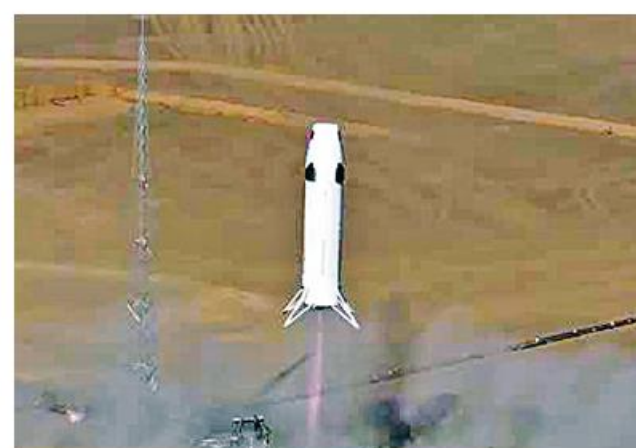
i Space ကုမ္ပဏီသည် SQX-2Y ခုံးပျံစမ်းသပ်မှုကို ဒီဇင်ဘာ ၃ ရက်က ပြုလုပ်ခဲ့ခြင်းဖြစ်ကြောင်း သိရသည်။

သည့် SQX-2Y ခုံးပျံသည် မြေပြင်သို့ ပြန်လည်ဆင်းသက်ရာတွင် တစ်စက္ကန့်လျှင် သုည ဒသမ ၀၂၅ မီတာနှုန်းဖြင့် ချောမွေ့စွာပြန်လည် ဆင်းသက်နိုင်ခဲ့ကြောင်း သိရသည်။ SQX-2Y စမ်းသပ်ခုံးပျံသည် အောက်ဆီဂျင်မီသိန်းဓာတ် ငွေ့ရည်ကို လောင်စာအဖြစ် သုံးစွဲထားသည့် ခုံးပျံဖြစ်ကြောင်း သိရသည်။ SQX-2Y ခုံးပျံစမ်းသပ်မှုမှ နည်းပညာဆိုင်ရာ အဓိကသတင်း အချက်အလက်များကို ရယူနိုင်ခဲ့ကြောင်း i Space ကုမ္ပဏီက သတင်းထုတ်ပြန်ထားသည်။