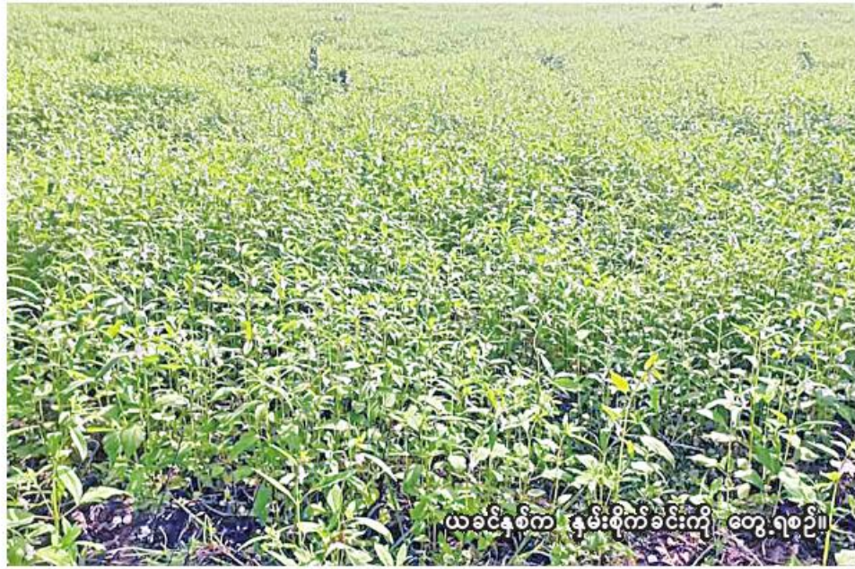
ယခုနှစ်က မိုးနှမ်းစိုက်ခင်းကို တွေ့ရစဉ်။