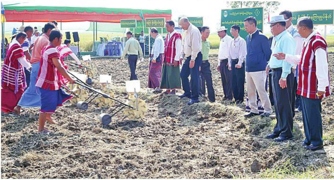
ယင်းနောက် နိုင်ငံတော်စီမံအုပ်ချုပ်ရေး ကောင်စီအဖွဲ့ဝင်များနှင့် အဖွဲ့သည် ဆောင်းဆီထွက်သီးနှံ နေကြာမျိုးစေ့ချက်ရိယာဖြင့် ကွင်းသရုပ်ပြစိုက်ပျိုးနေမှုကို ကြည့်ရှုအားပေးကြပြီး ယဉ်ကျေးမှုအဖွဲ့များ ကို ဂုဏ်ပြုချီးမြှင့်ငွေများ ပေးအပ်သည်။

ဆောင်းဆီထွက်သီးနှံ နေကြာမျိုးစေ့၊ မြေဩဇာများပေးအပ်ခြင်းနှင့် မျိုးစေ့ချက်ရိယာဖြင့်စိုက်ပျိုးခြင်း ကွင်းသရုပ်ပြ အခမ်းအနားကို ယနေ့နံနက်ပိုင်းတွင် ဘားအံမြို့နယ် ထောင်ဝိကွင်း၌ကျင်းပရာ နိုင်ငံတော်စီမံအုပ်ချုပ်ရေးကောင်စီအဖွဲ့ဝင် မန်းငြိမ်းမောင်နှင့် ခွန်စုံလွင်တို့ တက်ရောက် အားပေးကြသည်။ အခမ်းအနားတွင် နိုင်ငံတော်စီမံ အုပ်ချုပ်ရေးကောင်စီအဖွဲ့ဝင် မန်းငြိမ်းမောင် က အမှာစကားပြောကြားသည်။ ထို့နောက် နိုင်ငံတော်စီမံအုပ်ချုပ်ရေးကောင်စီအဖွဲ့ဝင် မန်းငြိမ်းမောင်၊ ခွန်စုံလွင်၊ ပြည်ထောင်စု ဝန်ကြီး Jeng Phang နော်တောင်နှင့် ပြည်နယ်ဝန်ကြီးချုပ် ဦးစောမြင့်ဦးတို့က တောင်သူများကို နေကြာမျိုးစေ့နှင့်မြေဩဇာ များ ထောက်ပံ့ပေးအပ်သည်။