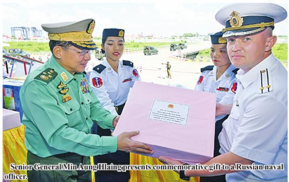
Senior General Min Aung Hlaing presents commemorative gift to a Russian naval officer.