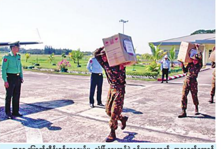
အရှေ့မြောက်တိုင်းစစ်ဌာနချုပ်မှ လုံခြုံရေးတပ်ဖွဲ့ဝင်များအတွက် အနောက်တောင် တိုင်းစစ်ဌာနချုပ်မှ အရာရှိ၊ စစ်သည်၊ မိသားစုများ လှူဒါန်းထားသည့် စားသောက် ဖွယ်ရာများကို လာရှိုးမြို့သို့ တပ်မတော်လေယာဉ်ဖြင့် ပို့ဆောင်ပေးစဉ်။

စေတနာရှင်အလှူရှင်များက စုစုပေါင်းဂုဏ်ပြု ချီးမြှင့်ငွေကျပ် ၁၀၀၀ သိန်းနှင့် စားသောက် ဖွယ်ရာများကို ဂုဏ်ပြုပေးအပ်ရာ တာဝန်ရှိ သူများက လက်ခံရယူကြသည်။ ယင်းနောက် တိုင်းမှူးက ကျေးဇူးတင်စကား ပြန်လည် ပြောကြားသည်။