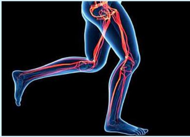
မိမိတို့ရဲ့ ခန္ဓာကိုယ်မှာ အဆီပိုတွေ မရှိတော့ဘူးဆိုရင် ကြွက်သားတွေကလည်း ပိုမို ပေါ့လွင်လာပြီး သန်မာလာမှာ ဖြစ်ပါတယ်။ ဒီလို ဖြစ်ချင်တယ်ဆိုရင်

တော့ တစ်ရက်ကို ခြေလှမ်းရေ ၁၀၀၀၀ လောက် လမ်းလျှောက် ပေးရုံနဲ့တင် ရရှိနိုင်ပါတယ်။ ဒီထက်ပိုပြီး ပြင်းထန်တဲ့ လေ့ကျင့်ခန်းမျိုးလိုချင်တယ်ဆို ရင်တော့ တောင်တက်လမ်း လျှောက်ခြင်းကိုလည်း ကြိုးစား ကြည့်သင့်ပါတယ်။ ဒါ့အပြင် စက္ကန့် ၃၀ မှ ၁ မိနစ်၊ ၂ မိနစ်အထိ ခပ်မြန်မြန်လမ်း လျှောက်ပြီး ပုံမှန်လမ်းပြန် လျှောက်ခြင်း၊ အဲဒီနောက် ခပ် မြန်မြန်မြန်ပြီး လမ်းလျှောက်ခြင်း လိုမျိုး လေ့ကျင့်ခန်းတွေကလည်း ထိရောက်မှုရှိလှပါတယ်။ လမ်းလျှောက်ခြင်းဟာ သင့် ခန္ဓာကိုယ်တစ်လျှောက်မှာရှိတဲ့ ကြွက်သားတွေရဲ့ တင်းအားကို တိုးမြှင့်စေတာသာဖြစ်ပါတယ်။ လမ်းလျှောက်ခြင်းဟာ ပြင်း ထန်တဲ့ လေ့ကျင့်ခန်းမဟုတ်တဲ့ အတွက် ကြွက်သားတွေနာကျင် ခြင်းမရှိစေပါဘူး။ ဒါကြောင့် အနာတရဖြစ်တာမျိုး၊ နောက် တစ်ခေါက် လမ်းလျှောက်ဖို့ အတွက် ကြွက်သားတွေနာလို့ မလျှောက်နိုင်တာမျိုးလည်း မဖြစ် စေပါဘူး။