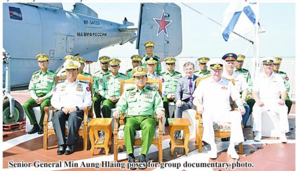
Senior General Min Aung Hlaing poses for group documentary photo.