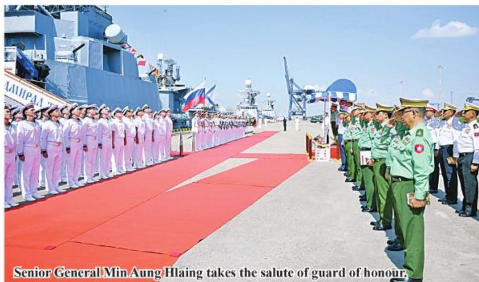
Senior General Min Aung Hlaing takes the salute of guard of honour.

Nay Pyi Taw November 6 Chairman of State Administration Council Commander-in-Chief of Defence Services Senior General Min Aung Hlaing was welcomed