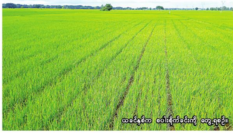
ယခင်နှစ်က စပါးစိုက်ခင်းကို တွေ့ရစဉ်။