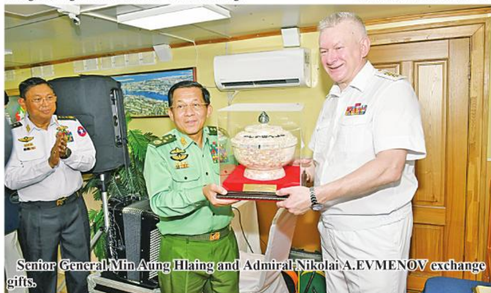
Senior General Min Aung Hlaing and Admiral Nikolai A. EVMENOV exchange gifts.

Nay Pyi Taw November 6 Chairman of State Administration Council Commander-in-Chief of Defence Services Senior General Min Aung Hlaing was welcomed