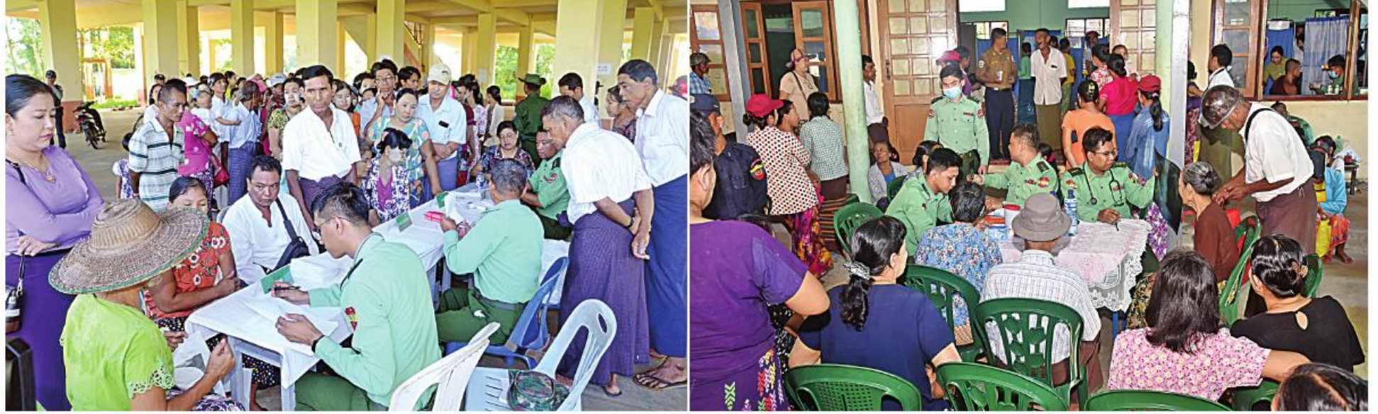
တပ်မတော်နှင့် ကျန်းမာရေးဝန်ကြီးဌာနတို့မှ နယ်လှည့်အထူးကုဆေးအဖွဲ့များက ဒေသခံပြည်သူများကို ကျန်းမာရေးစောင့်ရှောက်မှုလုပ်ငန်းများ ဆောင်ရွက်ပေးစဉ်။

အားလုံးကိုကျေးဇူးတင်ပါတယ်ရှင်။ အခုလို စီစဉ်ပေးတဲ့ တပ်မတော်ကာကွယ်ရေးဦးစီး ချုပ်နဲ့ တာဝန်ရှိသူများကို ကျေးဇူးတင်ပါ တယ်ရှင်။ နောက်ကိုလည်း ခဏခဏလာပြီး အခဲကုသပေးပါလို့ မေတ္တာရပ်ခံချင် ပါတယ်ရှင်။