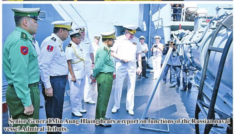
Senior General Min Aung Hlaing hears a report on functions of the Russian naval vessel Admiral Tributs.

When the Senior General and party arrived on board Russian naval vessel Admiral Tributs, they were welcomed by the ship's 2 nd rank captain