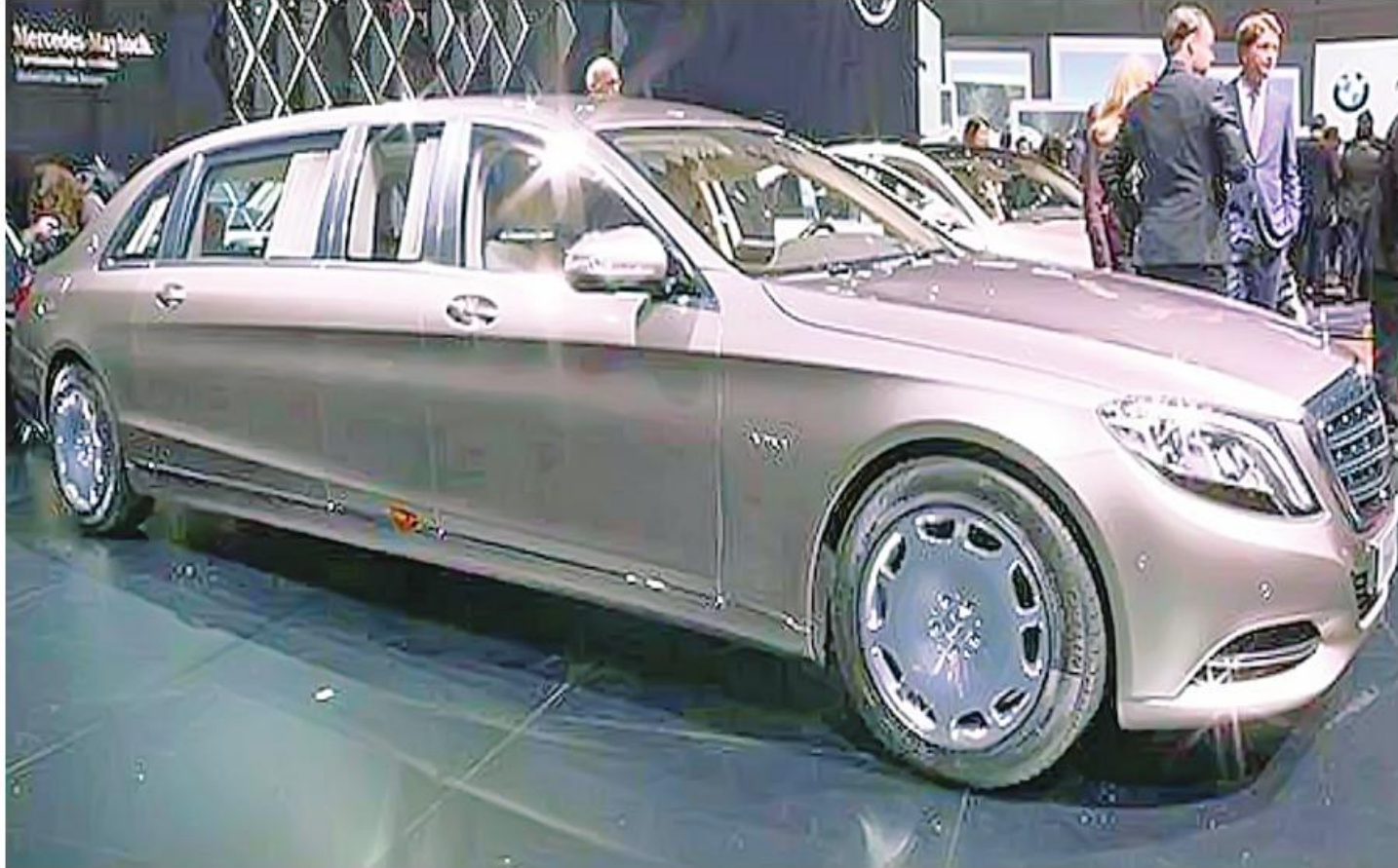
Geneva International Motor Show 2015 ၌ ပြသထားသော Mercedes-Maybach 600

၂၀၁၅ ခုနှစ်အတွင်းက ဆွစ်ဇာလန်နိုင်ငံ Foundation of the Geneva International Motor Show က ကြီးမားကျင်းပသည့် ၈၅ ကြိမ်မြောက် အပြည်ပြည်ဆိုင်ရာမော်တော်ကားပြပွဲသို့တက်ရောက်ရန် ဖိတ်ကြားခြင်းခံခဲ့ရသဖြင့် ၂၀၁၅ ခုနှစ် ဥရောပခရီးစဉ်အတွင်း အဆိုပါပြပွဲကြီးကို တက်ရောက်လေ့လာနိုင်ရန် ခရီးတစ်ထောက်အဖြစ် ဆွစ်ဇာလန်နိုင်ငံသို့ ရောက်ရှိခဲ့သည်။