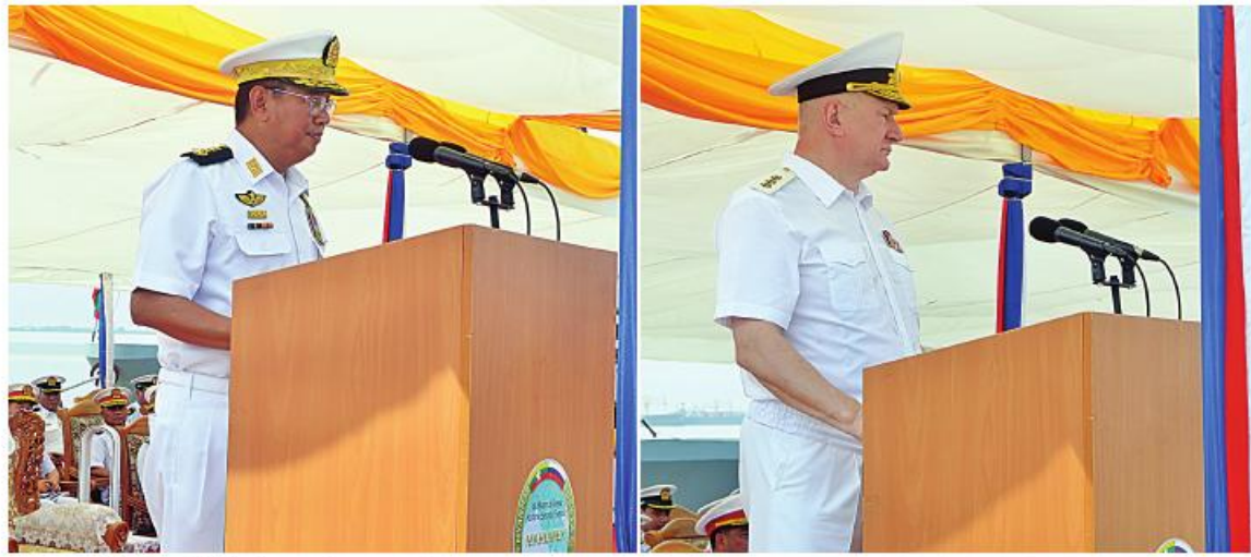
နေပြည်တော် နိုဝင်ဘာ ၆

ပထမအကြိမ် မြန်မာ-ရုရှားရေကြောင်း လုံခြုံရေးဆိုင်ရာလေ့ကျင့်ခန်း၏ ဖွင့်ပွဲ အခမ်းအနားကို နိုဝင်ဘာ ၅ ရက် နေ့လယ် ဝိုင်းတွင် ရန်ကုန်မြို့ သီလဝါဆိပ်ကမ်း၌ ကျင်းပပြုလုပ်ရာ ကာကွယ်ရေးဦးစီးချုပ် (ရေ) ဗိုလ်ချုပ်ကြီးမိုးအောင်၊ ရုရှားရေတပ် ဦးစီးချုပ် Admiral Nikolai A. EVMENOV နှင့် နှစ်နိုင်ငံရေတပ်အရာရှိ ကြီးများ၊ မြန်မာနိုင်ငံဆိုင်ရာ ရုရှားစစ်သံမှူး နှင့် ဖိတ်ကြားထားသူများ တက်ရောက် ကြသည်။