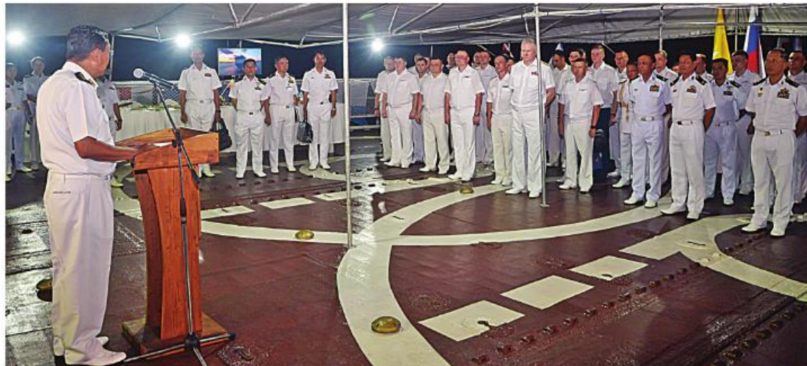
ကာကွယ်ရေးဦးစီးချုပ်(ရေ) ဗိုလ်ချုပ်ကြီးမိုးအောင် ရုရှားရေတပ်ဦးစီးချုပ် Admiral Nikolai A. EVMENOV အား ဂုဏ်ပြု ညစာဖြင့် တည်ခင်းညှော်ညစာစားပွဲတွင် နှုတ်ခွန်းဆက်စကားပြောကြားစဉ်။