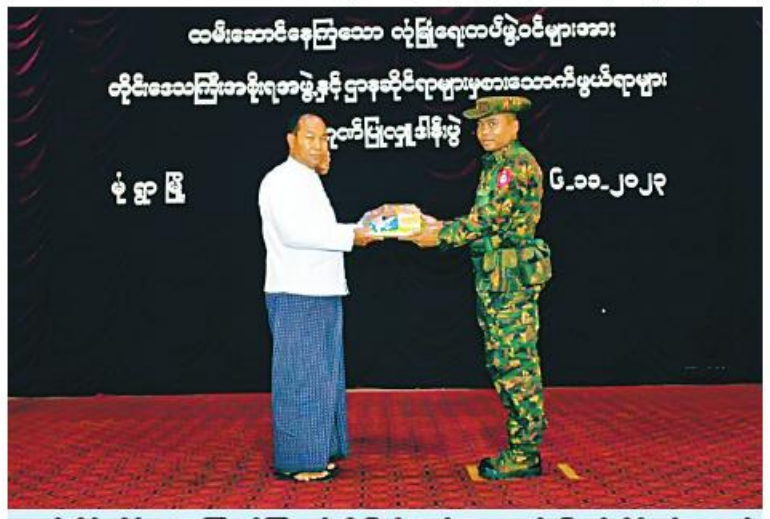
စစ်ကိုင်းတိုင်းဒေသကြီးဝန်ကြီးချုပ် ဦးမြတ်ကျော် အနောက်မြောက်တိုင်းစစ်ဌာနချုပ် နယ်မြေအတွင်း နိုင်ငံတော်လုံခြုံရေးနှင့် ကာကွယ်ရေးတာဝန်ကို စွမ်းစွမ်းတမ်းထမ်းဆောင် လျက်ရှိသော လုံခြုံရေးတပ်ဖွဲ့ဝင်များအတွက် ဂုဏ်ပြုချီးမြှင့်ငွေများ ပေးအပ်စဉ်။

နေပြည်တော် နိုဝင်ဘာ ၆ နိုင်ငံတော်လုံခြုံရေးနှင့် ကာကွယ်ရေး တာဝန်ကို စွမ်းစွမ်းတမ်းထမ်းဆောင်လျက် ရှိသော လုံခြုံရေးတပ်ဖွဲ့ဝင်များအတွက် စေတနာရှင်အလှူရှင်များက ဂုဏ်ပြုချီးမြှင့် ငွေများ လာရောက်ဂုဏ်ပြုပေးအပ်လျက် ရှိသည်။