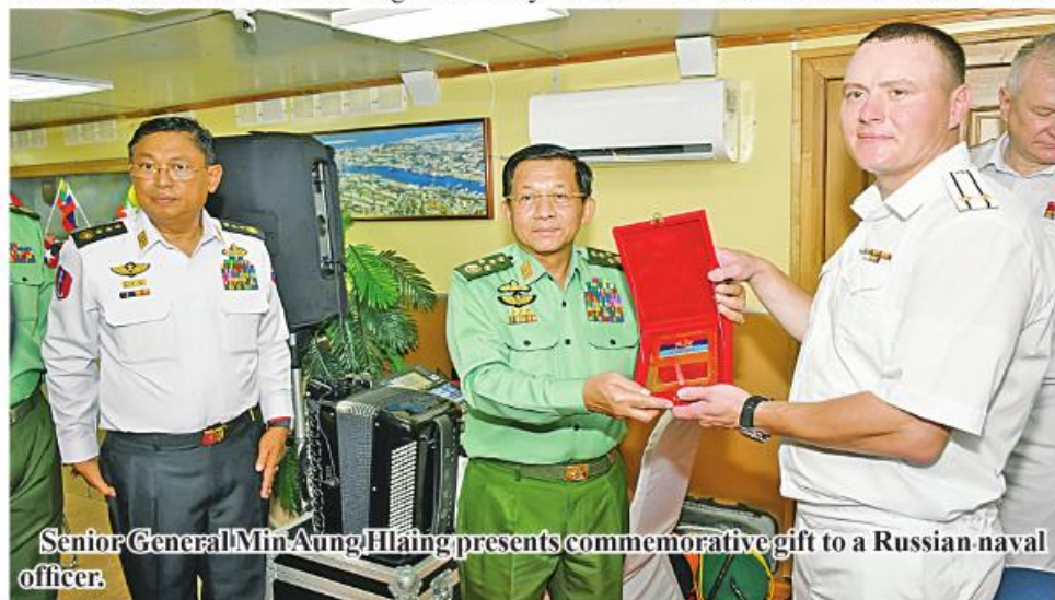
Senior General Min Aung Hlaing presents commemorative gift to a Russian naval officer.