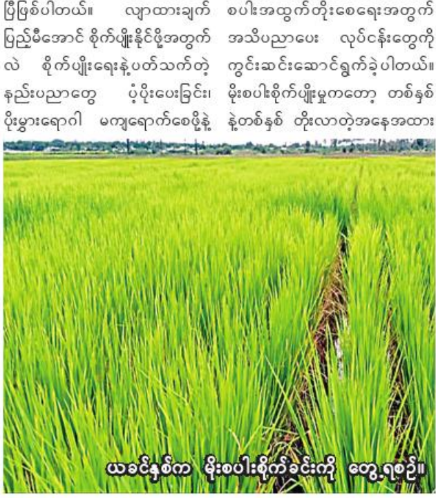
ယခင်နှစ်က မိုးစပါးစိုက်ခင်းကို တွေ့ရစဉ်။

ကလေး နိုဝင်ဘာ ၆ စစ်ကိုင်းတိုင်းဒေသကြီး ကလေး ခရိုင် ကလေးမြို့နယ်တွင် ယခုနှစ် မိုးသီးနှံစိုက်ပျိုးရာသီ၌ မိုးစပါး သီးနှံ ၁၈၅၂၆ ဧက စိုက်ပျိုးပြီးစီး ပြီးဖြစ်ကြောင်း ကလေးမြို့နယ် စိုက်ပျိုးရေးဦးစီးဌာနမှ သိရသည်။ ယခုနှစ် မိုးသီးနှံစိုက်ပျိုးရာသီ၌ ကလေးမြို့နယ်တွင် မိုးစပါး ၁၈၅၂၆ ဧကစိုက်ပျိုးရန် လျာထား ပြီး ယခုနှစ် ငွန်လမှစတင် စိုက် ပျိုးခဲ့ရာ ယနေ့ထိ လျာထားဧက အားလုံး စိုက်ပျိုးပြီးစီးပြီဖြစ်ကြောင်း သိရသည်။ “ဒီနှစ် ကလေးမြို့နယ်မှာ မိုးစပါးဧက ၁၈၀၀၀ ကျော် လျာထားစိုက်ပျိုးခဲ့ပါတယ်။ ဒီနေ့ထိ လျာထားဧကအားလုံး စိုက်ပျိုးပြီးစီး