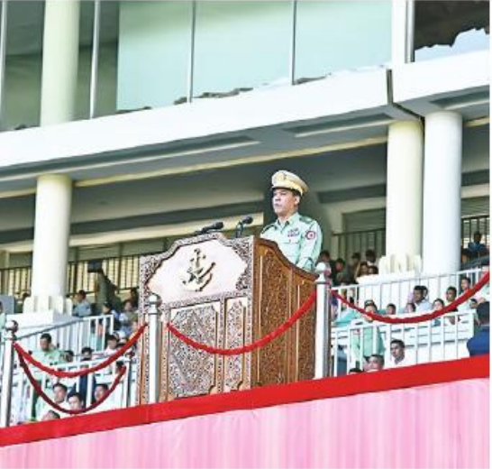
တပ်မတော်ကာကွယ်ရေးဦးစီးချုပ်ကိုယ်စား တိုင်းမှူး ဗိုလ်ချုပ်စောသန်းလှိုင် အကြိမ်(၆၀)မြောက် တပ်မတော်ကာကွယ်ရေးဦးစီးချုပ်ပလား တပ်မတော်(ကြည်း၊ ရေ၊ လေ) ဘောလုံးပြိုင်ပွဲပွင့်ပွဲတွင် အမှာစကားပြောကြားခဲ့။

ဦးစွာတပ်မတော်ကာကွယ်ရေးဦးစီးချုပ်ကိုယ်စား တိုင်းမှူးက အဖွင့်အမှာစကားပြောကြားသည်။ ထို့နောက် တိုင်းမှူးနှင့် တက်ရောက်လာကြသူများက ဒုတိယ