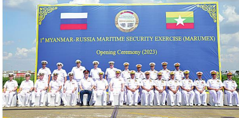
မြန်မာ-ရုရှား ရေကြောင်းလုံခြုံရေးဆိုင်ရာလေ့ကျင့်ခန်းဖွင့်ပွဲအခမ်းအနားတက်ရောက်လာကြသူများ ဖုပေါင်း မှတ်တမ်းတင်ဓာတ်ပုံရိုက်စဉ်။