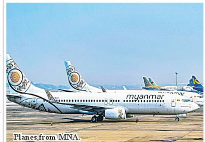
Planes from MNA.