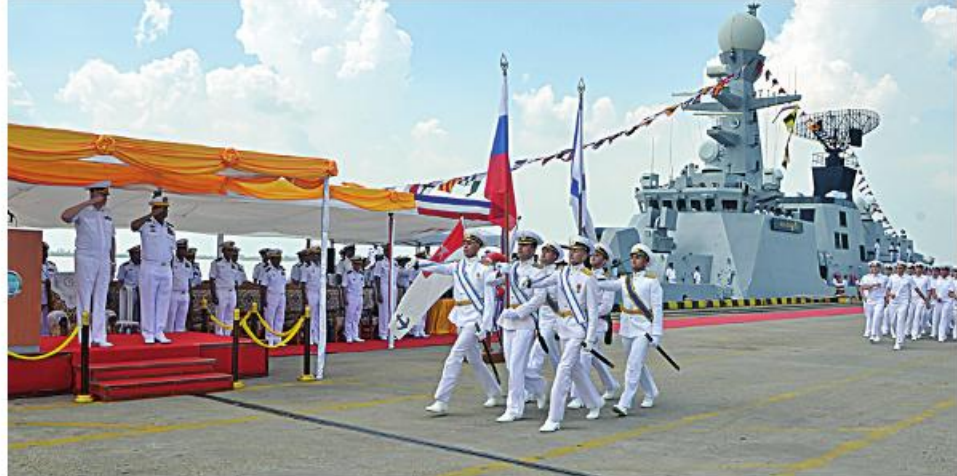
ကာကွယ်ရေးဦးစီးချုပ်(ရေ) ဗိုလ်ချုပ်ကြီးမိုးအောင်နှင့် ရုရှားရေတပ်ဦးစီးချုပ် Admiral Nikolai A. EVMENOV တို့ နှစ်နိုင်ငံရေတပ်စစ်ရေးပြတပ်ခွဲများ၏ အလေးပြုခြင်းကို ခံယူစဉ်။