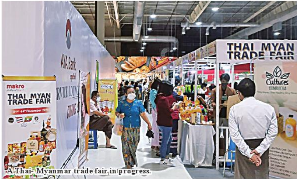
A Thai-Myanmar trade fair, in progress.

Yangon November 6 Myanmar handicraft stores will be opened to revive the market in promotion areas of shopping centres in Yangon Region, according to U Thardu, patron of Myanmar Arts and Crafts Association.