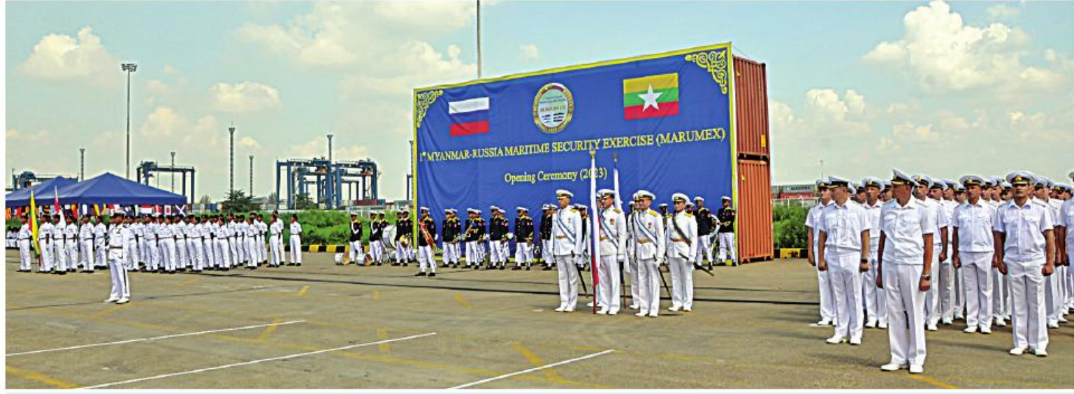
ကာကွယ်ရေးဦးစီးချုပ်(ရေ) ဗိုလ်ချုပ်ကြီးမိုးအောင်နှင့် ရုရှားရေတပ်ဦးစီးချုပ် Admiral Nikolai A. EVMENOV တို့ ပထမအကြိမ် မြန်မာ-ရုရှားရေကြောင်း လုံခြုံရေး ဆိုင်ရာလေ့ကျင့်ခန်းဖွင့်ပွဲအခမ်းအနားတွင် အမှာစကားပြောကြားစဉ်။

ရွက်ခဲ့သည်။မြန်မာ-ရုရှားရေကြောင်း လုံခြုံ ရေးဆိုင်ရာလေ့ကျင့်ခန်းတွင် တပ်မတော် (ရေ) နှင့် တပ်မတော်(လေ)မှ လေယာဉ်၊ ရဟတ်ယာဉ်၊ စစ်ရေယာဉ်များသည် ရုရှား ရေတပ်မှ စစ်ရေယာဉ်များ၊ ရဟတ်ယာဉ် များဖြင့်ပူးပေါင်း၍ ဝေဟင်ရန်၊ ရေပြင်ရန်၊ ရေအောက်ရန် ကာကွယ်ရေးလေ့ကျင့်ခန်း များ၊ရေကြောင်းလုံခြုံရေးဆိုင်ရာလေ့ကျင့် ခန်းများဆောင်ရွက်သွားမည်ဖြစ်ပြီး အဆိုပါ လေ့ကျင့်ခန်းအတွင်း နှစ်နိုင်ငံရေတပ်မှ အရာရှိစစ်သည်များ ပါဝင်လေ့ကျင့်ဆောင် ရွက်ကြမည်ဖြစ်ကြောင်း သတင်းရရှိသည်။