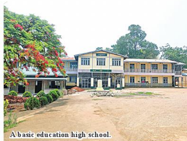
A basic education high school.

With the cooperation of the Ministry of Education, the Ministry of Agriculture, Livestock and Irrigation, and the Ministry of Science and Technology, 75 associate high schools that will be planned to open and up to 51 schools have been opened in 2023-2024 academic year and the remaining schools will continue to be opened in the 2024-2025 academic year. Therefore, private entrepreneurs are already invited to open tenders to carry out construction works in 34 basic education high schools in the 2024-2025 academic year. In this academic year, a total of 2,691 students are