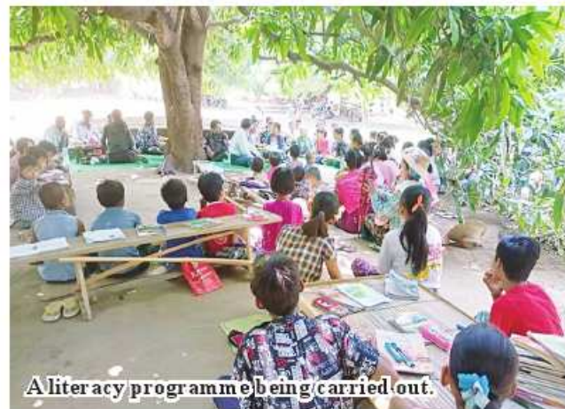
A literacy programme being carried out.

The campaign will target those with little knowledge about Myanmar and mathematics. Therefore, priority will be given to young people at the age of 15 and above, adults and elders. The program will be implemented in collaboration with the relevant region/state governments starting in December 2023. The programme will start in the townships of Shan and Kachin states and in some