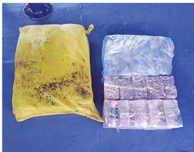
The seized drugs in packages.