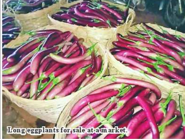
Long eggplants for sale at a market.