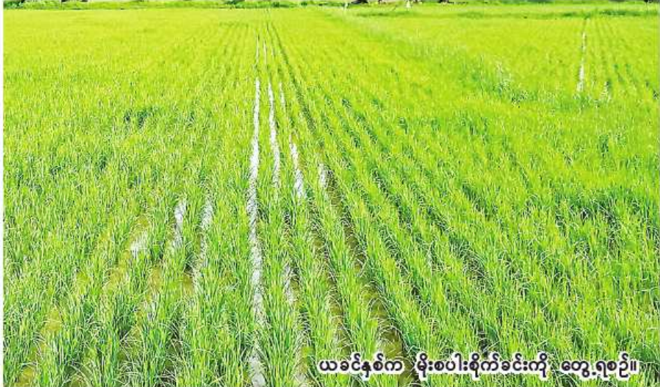
ယခင်နှစ်က မိုးစပါးစိုက်ခင်းကို တွေ့ရစဉ်။

စာမျက်နှာ ၄ မှအဆက် အသားတိုးတက်မှုကို ကြိုးစားရမယ်။ စာအရေးအသားတိုးတက်မှုဟာ အမှန်တော့ အားကျင့်သလိုပါပဲ။ ကြွက်သားလေ့ကျင့်ခန်းလုပ် အလေ့အကျင့်လည်းလိုတယ်။ စနစ်ကျဖို့လည်းလိုတယ်။ ဆိုလိုတာကလေ့ကျင့်မှုမရှိဘဲ စနစ်မကျရင် တကယ်တမ်းတိုးတက်မှုကို မရနိုင်ဘူး။ ကာယဗလသမားတစ်ယောက်ဟာ အောက်ပိုင်းတောင့်ရက်သားနဲ့ အောက်ပိုင်းလေ့ကျင့်ခန်းပဲဆက်လုပ်နေရင် နောက်ကျတော့ ဂင်တိုတိုဖြစ်လာမယ်။ အချိုးအစားမမျှဘဲ ဖြစ်လာမယ်။ မိမိလိုတဲ့ဘက်ကို လေ့ကျင့်ပေးရင် နောက် တဖြည်းဖြည်းမျိုး ကောင်းလာမှာပဲ။ ဥပမာ-အဖွဲ့အနွဲ့ကောင်းတဲ့ စာရေးဆရာတစ်ယောက်ဟာ နင်းကန့်ဖွဲ့နွဲ့နေရင် နောက်တော့ ဘာမှ မသိအောင်ရှုပ်ထွေးပြီး လုံးလည်လိုက်သွားမှာပဲ။ ဒါကြောင့် အရေးအသားဟန်မှာလည်း မိမိလိုတဲ့နေရာကိုလေ့ကျင့်ပြင်ဆင်ခြင်းအားဖြင့် တိုးတက်လာဖို့လိုတယ်။ နောက်ပြီး ရေးဟန်ရေးနည်းနဲ့ပတ်သက်ပြီး အတွေးမခေါင်ကြပါနဲ့။ ကြီးကြီးကျယ်ကျယ်တွေ လှမ်းတွေးမနေပါနဲ့။ စာပေဟန်ဆိုတာ စာဖတ်သူနဲ့ ဆက်သွယ်ရေးပေါင်းကူးတံတားပါပဲ။ စာဖတ်သူက တွေ့ထိနိုင်ရမယ်။ နားလည်နိုင်ရမယ်။ စာဖတ်သူကို ဩဇာညောင်းစေရမယ်။ ဆွဲဆောင်နိုင်ရမယ်။ ဒါဟာ စာပေဟန်နဲ့ သဘောပဲ။ အတွေ့အကြုံတွေကြွယ်ဝစေမယ့် ဒီအတွေ့အကြုံတွေကို ဖောက်သည်ချရာမှာ ရည်ရွယ်ချက်မမှန်ရင်၊ ဇောတနာမသန်ရင် အလကားပဲ။ အတွေ့အကြုံလည်းရမ်းသာ၊ ရည်ရွယ်ချက်လည်းမှန် ဒါပေမဲ့ရေးသားရာမှာ စာပတ်သူတွေနဲ့ မဟပ်မိ၊ မပေါင်းစပ်မိရင်လည်း အလကားပဲ။ ရည်ရွယ်ချက်လည်းမှန် အရေးအသားလည်းကောင်းပြီး အတွေ့အကြုံအရ ခေါင်းပါးနေလို့ရှိရင် ဘိုင်စကတိက ခိုးချ၊ နိုင်ငံခြားစာပေတွေက