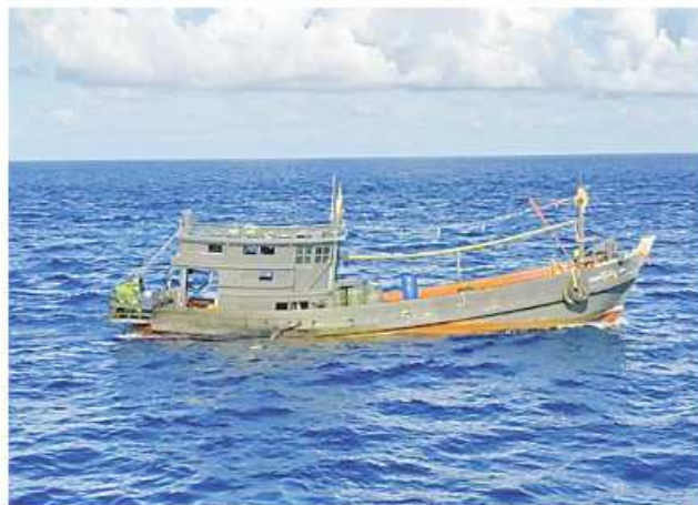
The seized mechanized boat that was carrying narcotic drugs.

Nay Pyi Taw November 2 momentum as a national task to effectively curb the illegal drugs trade that is harmful to the entire mankind including-