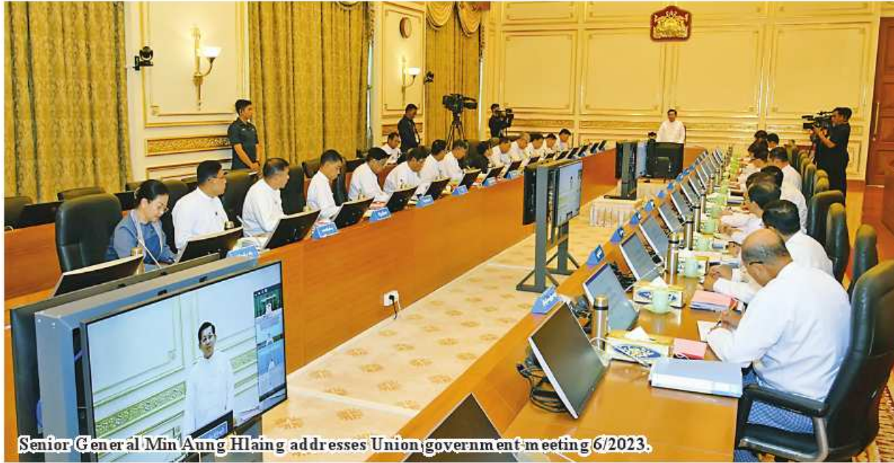
Senior General Min Aung Hlaing addresses Union government meeting 6/2023.