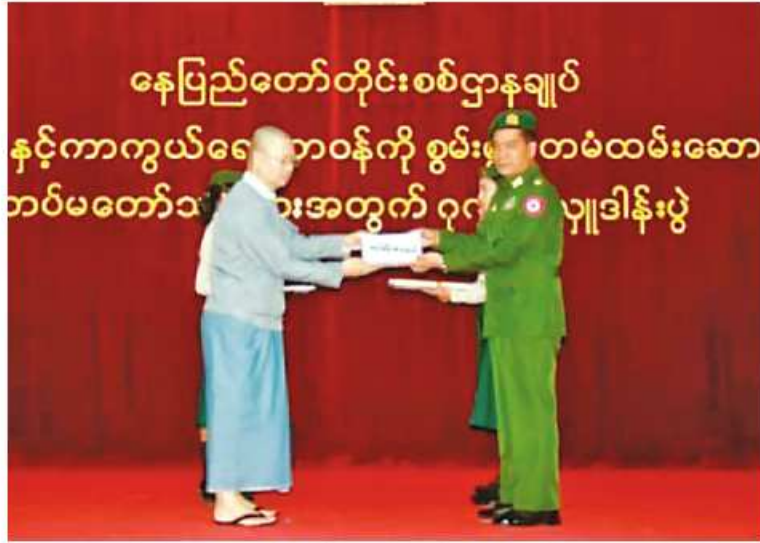
နေပြည်တော်တိုင်းစစ်ဌာနချုပ် တိုင်းမှူး ဗိုလ်ချုပ်စောသန်းလှိုင်ထံ အလှူရှင်တစ်ဦးက လုံခြုံရေးတပ်ဖွဲ့ဝင်များအတွက် ဂုဏ်ပြုချီးမြှင့်ငွေများပေးအပ်စဉ်။

ထို့အတူ မကွေးတိုင်းဒေသကြီးအတွင်း ရှိ စေတနာရှင် အလှူရှင်များက ဂုဏ်ပြု ချီးမြှင့်ငွေများပေးအပ်ခြင်းကို မကွေးမြို့ မြို့တော်ခန်းမဌာနချုပ်မှာ တိုင်းဒေသကြီး ဝန်ကြီးချုပ် ဦးတင်လွင်၊ နယ်မြေခံတပ်မှ တာဝန်ရှိသူများ၊ ဌာနဆိုင်ရာတာဝန်ရှိသူ များနှင့် စေတနာရှင် အလှူရှင်များ တက် ရောက်ကြသည်။ ထို့နောက် စေတနာရှင် အလှူရှင် ၁၃ ဦးက လုံခြုံရေးတပ်ဖွဲ့ဝင် များအတွက် ဂုဏ်ပြုချီးမြှင့်ငွေ စုစုပေါင်း ငွေကျပ်သိန်း ၂၀၀၀ ကို ဂုဏ်ပြုပေးအပ်ရာ တိုင်းဒေသကြီးဝန်ကြီးချုပ်နှင့် တာဝန်ရှိသူ များက လက်ခံရယူပြီး ကျေးဇူးတင်စကား ပြန်လည်ပြောကြားကာ ဂုဏ်ပြုမှတ်တမ်းလွှာ များပေးအပ်ခဲ့ကြောင်း သတင်းရရှိသည်။