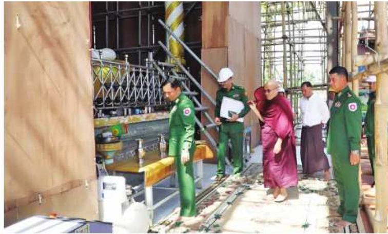
အနောက်ပိုင်းတိုင်းစစ်ဌာနချုပ် တိုင်းမှူး ဝိုလ်ချုပ်ထင်လတ်ဦး စစ်တွေမြို့ရှိ ရှေးဟောင်းသမိုင်းဝင်ဦးရဲကျော်သူကျောင်းတိုက် ပြန်လည်ပြုပြင်နေမှုကို ကြည့်ရှု ဝမ်းသာစဉ်

နေပြည်တော် ၃ ဝင်ဘာ ၂ နိုင်ငံတော်စီမံအုပ်ချုပ်ရေးကောင်စီဥက္ကဋ္ဌ နိုင်ငံတော်ဝန်ကြီးချုပ် ဝိုလ်ချုပ်မှူးကြီး မင်းအောင်လှိုင် ၂၀၂၃ ခုနှစ် ဇူလိုင် ၁၁ ရက်တွင် ရခိုင်ပြည်နယ် စစ်တွေမြို့သို့ ရောက်ရှိစဉ် ခရီးစဉ်၌ မိုခါမုန်တိုင်းတိုက် ခတ်မှုကြောင့် ထိခိုက်ပျက်စီးမှုများဖြစ်ပေါ် ခဲ့သည့် စစ်တွေမြို့ရှိ ရှေးဟောင်းသမိုင်းဝင် ဦးရဲကျော်သူကျောင်းတိုက်၊ ပင်မကျောင်း ဆောင်နှင့် ကျောင်းတိုက်အတွင်းရှိ သကျမုနိဘုရား သိမ်တော်ကြီးတို့အား