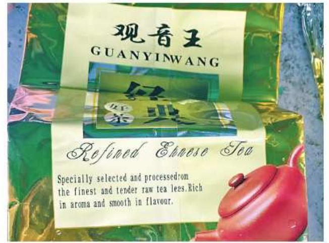
Packages that contain drugs.

Nay Pyi Taw November 2 momentum as a national task to effectively curb the illegal drugs trade that is harmful to the entire mankind including-