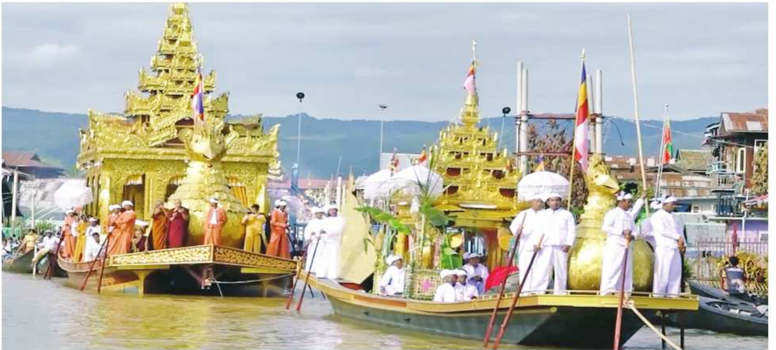
အင်းလေးဖောင်တော်ဦးမြတ်စွာဘုရားရုပ်ရှင်တော်မြတ်များ မူလစံကျောင်းတော်သို့ ပြန်လည်ကြွဝင်သည့်ပွဲတော်ကျင်းပစဉ်။

အင်းလေးဖောင်တော်ဦးမြတ်စွာဘုရား ရုပ်ရှင်တော်မြတ်များ အင်းလေးဒေသ ၂၁ ဌာနသို့ ကြွချီအပူဇော်ခံပြီး နိုဝင်ဘာ ၁ ရက် နံနက်ပိုင်းက ရေသာကုန်းကျောင်းမှ မူလစံကျောင်းတော်သို့ ပြန်လည်ကြွဝင်ခဲ့ သည်။ အင်းလေးဖောင်တော်ဦးမြတ်စွာ ဘုရားရုပ်ရှင်တော်မြတ်များ မူလစံကျောင်း တော်သို့ ပြန်လည်ကြွဝင်သည့်ပွဲတော်တွင် အင်းလေးရိုးရာလှေပြိုင်ပွဲများ ပါဝင်ကျင်းပ ယှဉ်ပြိုင်လျက်ရှိရာ ဒေသခံတိုင်းရင်းသား ပြည်သူများက တတ်တက်ကြွကြွစည်းလုံး ညီညွတ်စွာပါဝင်ယှဉ်ပြိုင်ကြပြီး ဒေသခံ ပြည်သူများကလည်း သောင်းသောင်းဖြူ ဖြူကြည့်ရှုအားပေးကြကြောင်း သိရသည်။