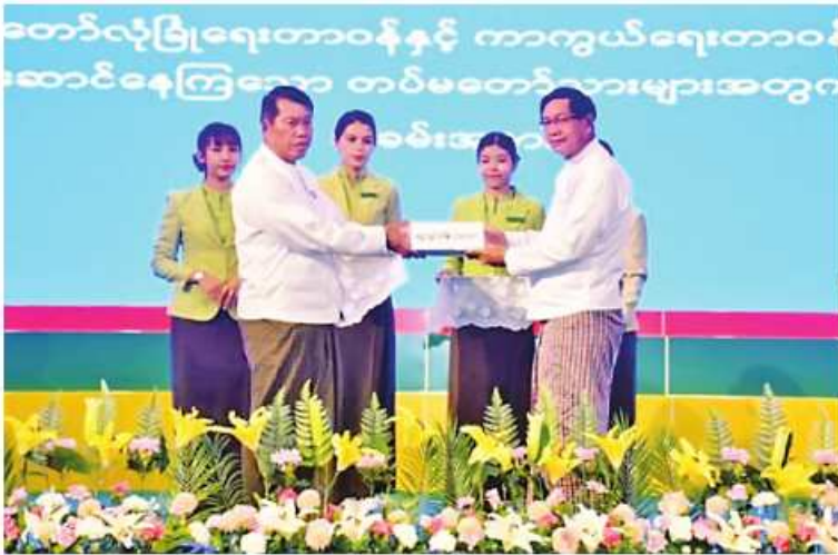
ရန်ကုန်တိုင်းဒေသကြီးဝန်ကြီးချုပ် ဦးစိုးသိန်းထံ အလှူရှင်တစ်ဦးက လုံခြုံရေး တပ်ဖွဲ့ဝင်များအတွက် ဂုဏ်ပြုချီးမြှင့်ငွေများပေးအပ်စဉ်။

ထို့နောက် စေတနာရှင်အလှူရှင် ၃၅ ဦးက ဂုဏ်ပြုချီးမြှင့်ငွေ စုစုပေါင်းငွေကျပ် ၂၁၉၈၄ သိန်းကို ဂုဏ်ပြုပေးအပ်ရာ တိုင်းမှူးက လက်ခံရယူပြီး ကျေးဇူးတင်