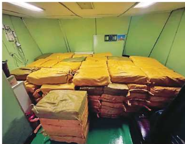
Photo shows the seized drugs.