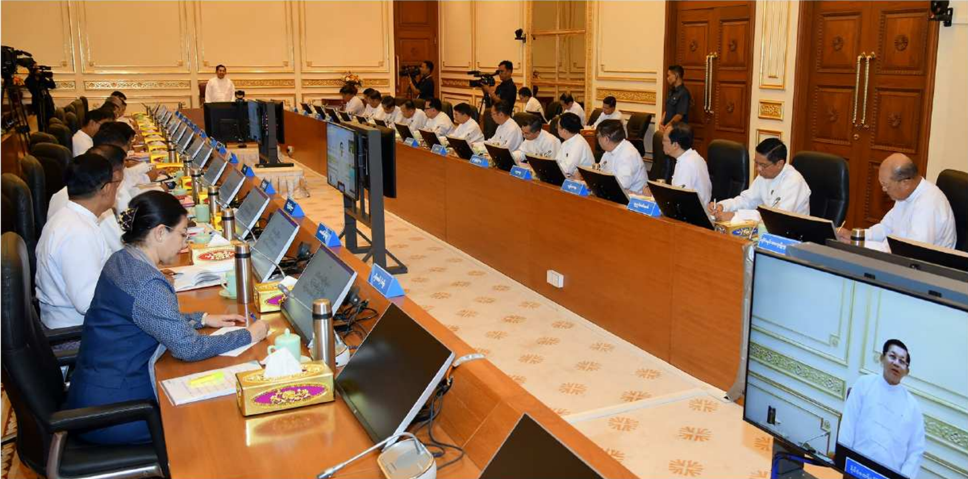
နိုင်ငံတော်စီမံအုပ်ချုပ်ရေးကောင်စီဥက္ကဋ္ဌ နိုင်ငံတော်ဝန်ကြီးချုပ် ပိုလ်ချုပ်မှူးကြီးမင်းအောင်လှိုင် ပြည်ထောင်စုအစိုးရအဖွဲ့အစည်းအဝေး အမှတ်စဉ်(၆/၂၀၂၃)တွင် အမှာစကားပြောကြားစဉ်။

နေပြည်တော် နိုဝင်ဘာ ၂ နေပြည်တော်ရှိ နိုင်ငံတော်စီမံအုပ်ချုပ်ရေး တော်ဝန်ကြီးချုပ် ပိုလ်ချုပ်မှူးကြီးမင်းအောင်လှိုင် တာဝန်ရှိသူများတက်ရောက်ကြပြီး နေပြည်တော် ပြည်ထောင်စုအစိုးရအဖွဲ့ အစည်းအဝေး ကောင်စီဥက္ကဋ္ဌရုံး အစည်းအဝေးခန်းမ၌ကျင်းပရာ တက်ရောက်အမှာစကားပြောကြားသည်။ ကောင်စီဥက္ကဋ္ဌ တိုင်းဒေသကြီးနှင့် ပြည်နယ်ဝန်ကြီး အမှတ်စဉ်(၆/၂၀၂၃)ကို ယနေ့နံနက်ပိုင်းတွင် နိုင်ငံတော်စီမံအုပ်ချုပ်ရေးကောင်စီဥက္ကဋ္ဌ နိုင်ငံ အစည်းအဝေးသို့ ပြည်ထောင်စုဝန်ကြီးများနှင့် ချုပ်များက စာမျက်နှာ ၁၆ ကော်လံ ၁၂၃