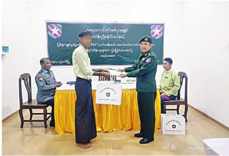
မြောက်ပိုင်းတိုင်းစစ်ဌာနချုပ် တိုင်းမှူး ဝိုလ်မှူးချုပ်မှီးလှိုင်ထံ KIA နှင့် PDF အဖွဲ့ဝင်တစ်ဦးက လက်နက်အပ်နှံခံစဉ်။