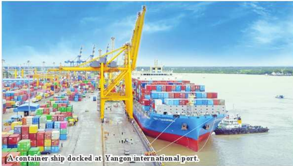
A container ship docked at Yangon international port.

Yangon November 2 During the period from January to September 2023, 530 container ships arrived at Yangon international ports and carried out cargo operations, according to the Myanmar Port Authority. In January 52 cargo ships