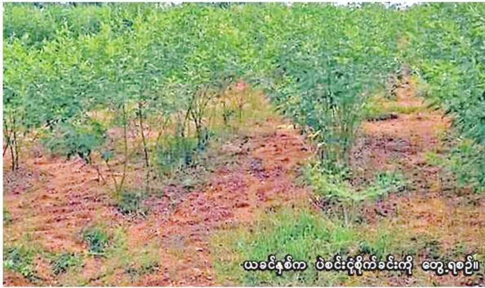
ယခင်နှစ်က ပဲစင်းငုံစိုက်ခင်းကို တွေ့ရစဉ်။

ကျွန်းလှ ခိုင်သာ ၂ စစ်ကိုင်းတိုင်းဒေသကြီး ကန့်သတ်ချက်အရ ကျွန်းလှမြို့နယ်တွင် ယခုနှစ် မိုးသီးနှံစိုက်ပျိုးရာသီ၌ ပဲမျိုးစုံ ၁၆၉၄၂ ဧက စိုက်ပျိုးပြီးစီးပြီ ဖြစ်ကြောင်း ကျွန်းလှမြို့နယ် စိုက်ပျိုးရေးဦးစီးဌာနမှ သိရသည်။ ကျွန်းလှမြို့နယ်တွင် ယခုနှစ် မိုးသီးနှံ စိုက်ပျိုးရာသီ၌ ပဲမျိုးစုံ