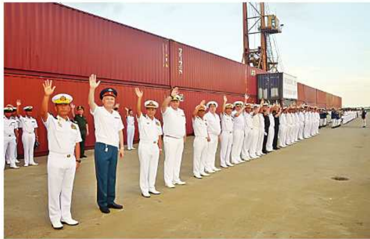
ရုရှားရေတပ်မှ စစ်ရေယာဉ်များ ရေကြောင်းလုံခြုံရေးဆိုင်ရာလေ့ကျင့်ခန်းဆောင်ရွက်ရန်နှင့် ချစ်ကြည်ရေးခရီးလည်ပတ်ရန် ရန်ကုန်မြို့သို့ရောက်ရှိရာ တပ်မတော်(ရေ) မှ အရာရှိကြီးများ၊ အရာရှိ၊ စစ်သည်များ၊ ရုရှားစစ်သံမှူးနှင့် တာဝန်ရှိသူများက ကြိုဆိုနှုတ်ဆက်စဉ်