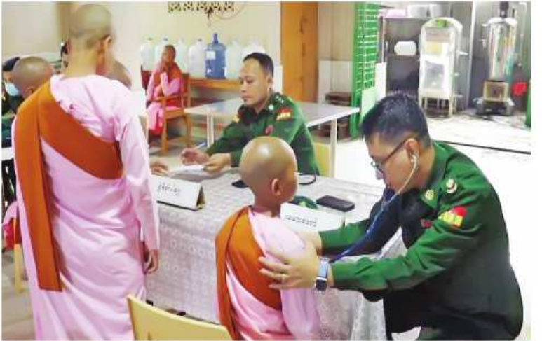
သာသနာ့ဌာနဝင်သီလရှင်များအား တောင်ပိုင်းတိုင်းစစ်ဌာနချုပ် နယ်မြေခံဆေး ကုသရေးအဖွဲ့က ကျန်းမာရေးစောင့်ရှောက်မှုလုပ်ငန်းများ ဆောင်ရွက်ပေးစဉ်

နေပြည်တော် ၃ ဝင်ဘာ ၂ ပဲခူးတိုင်းဒေသကြီး ပြည်မြို့ပိုင်လ်တစ်ထောင် ရပ်ကွက်ရှိ သာသနာ့ဝေပုဇွန်ကန် သီလရှင်စာသင်တိုက်ရှိ သာသနာ့ဌာနဝင် သီလရှင် ၉၄ ပါးတို့ကို တောင်ပိုင်းတိုင်း စစ်ဌာနချုပ် နယ်မြေခံဆေးကုသရေးအဖွဲ့ က အဆိုပါစာသင်တိုက်၌ နှလုံးရောဂါ၊ သွေးတိုးရောဂါ၊ နား၊ နှာခေါင်း၊ လည်ချောင်း ရောဂါ၊ ဆီးချိုရောဂါ၊ သွားနှင့်ခံတွင်းရောဂါ၊ အသက်ရှူလမ်းကြောင်းဆိုင်ရာ ရောဂါ၊ အထွေထွေရောဂါတို့နှင့်ပတ်သက်၍ လိုအပ် သည့် ကျန်းမာရေးစစ်ဆေးကုသခြင်းများ ဆောင်ရွက်ပေးသည်။ ယင်းသို့ ဆောင်ရွက်ပေးနေမှုများကို တိုင်းစစ်ဌာနချုပ်မှ တာဝန်ရှိသူများက သွားရောက်ကြည့်ရှုအားပေးပြီး လိုအပ် သည့်များ ညှိနှိုင်းဆောင်ရွက်ပေးခဲ့ကြ ကြောင်း သတင်းရရှိသည်။