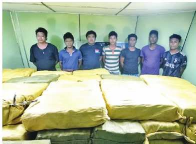
Suspects together with the seized drugs.

operations with neighbouring personnel that Nyi Nyi, who countries. Hence, transnational drug gangs are turning to the maritime routes that have advantages.