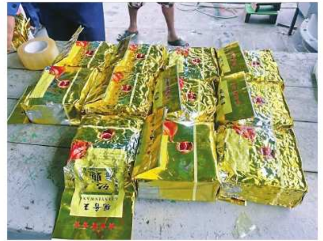
The seized drugs in packages.