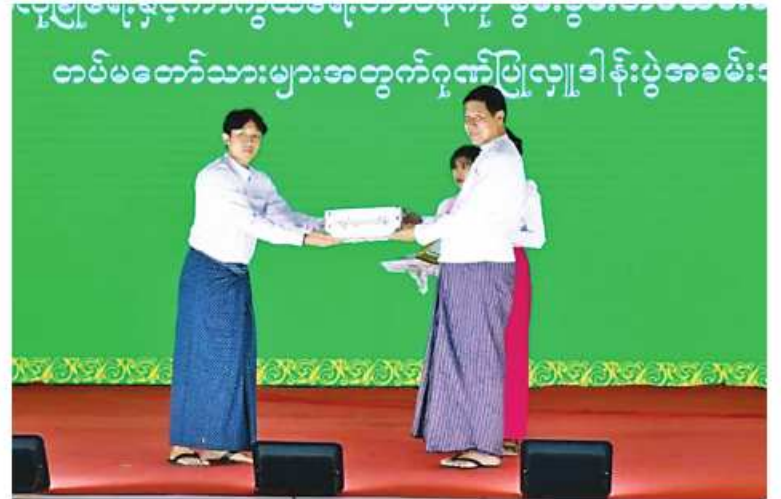
မန္တလေးတိုင်းဒေသကြီးဝန်ကြီးချုပ် ဦးမျိုးအောင်ထံ အလှူရှင်တစ်ဦးက လုံခြုံရေး တပ်ဖွဲ့ဝင်များအတွက် ဂုဏ်ပြုချီးမြှင့်ငွေများပေးအပ်စဉ်။

ထို့အတူ ဧရာဝတီတိုင်းဒေသကြီး အတွင်းရှိ စေတနာရှင် အလှူရှင်များက ဂုဏ်ပြုချီးမြှင့်ငွေများ ပေးအပ်ခြင်းကို အနောက်တောင်တိုင်းစစ်ဌာနချုပ်ရှိ ဧရာ ဝတီခန်းမဌာနချုပ်မှာ ဧရာဝတီတိုင်းဒေသ