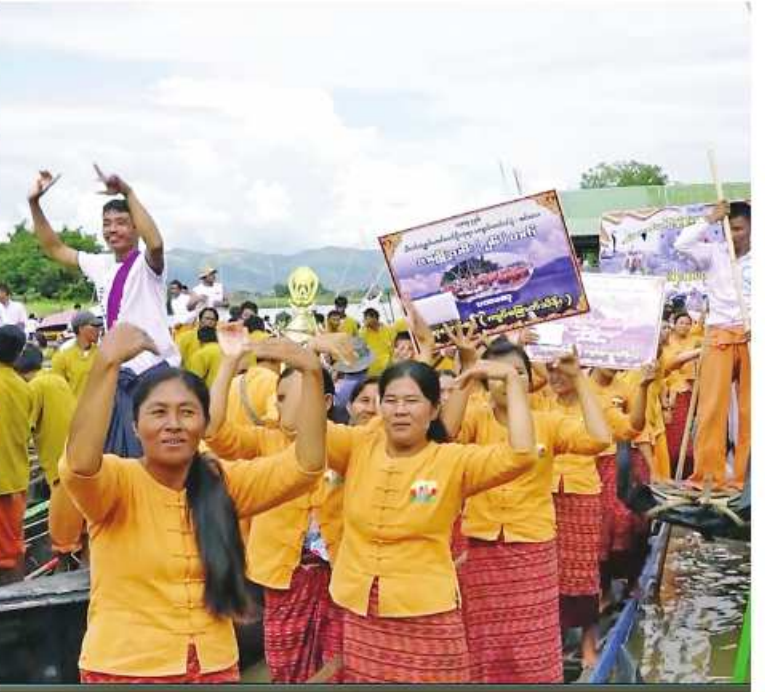
အင်းလေးဖောင်တော်ဦးမြတ်စွာဘုရားရုပ်ရှင်တော်မြတ်များ မူလစံကျောင်းတော်သို့ ပြန်လည်ကြွဝင်သည့်ပွဲတော်တွင် အင်းလေးရိုးရာလှေပြိုင်ပွဲများကို ဒေသခံပြည်သူများ ကြည့်ရှုအားပေးစဉ်။