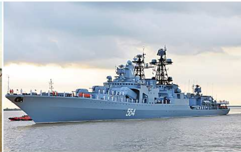
ရုရှားရေတပ်မှ ဖျက်သင်္ဘော (De-Admiral Tributs၊ Admiral Pan-steroy)များဖြစ်သည့် စစ်ရေယာဉ် telev နှင့် Sea Tanker Pechenga တို့သည် ပြည်ထောင်စုသမ္မတမြန်မာနိုင်ငံ တော်သို့ ပထမအကြိမ် ပြန်မာ-ရုရှား ရေကြောင်းလုံခြုံရေးဆိုင်ရာ လေ့ကျင့်ခန်း