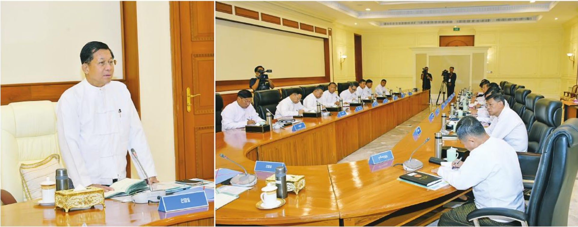
နိုင်ငံတော်စီမံအုပ်ချုပ်ရေးကောင်စီဥက္ကဋ္ဌ နိုင်ငံတော်ဝန်ကြီးချုပ် ဝိုင်းချုပ်မှူးကြီးမင်းအောင်လှိုင် နိုင်ငံတော်စီမံအုပ်ချုပ်ရေးကောင်စီအစည်းအဝေး (၅/၂၀၂၃)တွင် အမှာစကားပြောကြားစဉ်။

နေပြည်တော် အောက်တိုဘာ ၂၆ - နိုင်ငံတော်စီမံအုပ်ချုပ်ရေးကောင်စီ အစည်းအဝေး (၅/၂၀၂၃)ကို ယနေ့နံနက်ပိုင်းတွင် နေပြည်တော်ရှိ နိုင်ငံတော်စီမံအုပ်ချုပ်ရေးကောင်စီဥက္ကဋ္ဌမှူးအစည်းအဝေးခန်းမ၌ ကျင်းပပြုလုပ်ရာ နိုင်ငံတော်စီမံအုပ်ချုပ်ရေးကောင်စီဥက္ကဋ္ဌ နိုင်ငံတော်ဝန်ကြီးချုပ် ဝိုင်းချုပ်မှူးကြီးမင်းအောင်လှိုင် တက်ရောက်အမှာစကားပြောကြားသည်။ အစည်းအဝေးသို့ နိုင်ငံတော်စီမံအုပ်ချုပ်ရေးကောင်စီဒုတိယဥက္ကဋ္ဌ ဒုတိယဝန်ကြီးချုပ် ဒုတိယဝိုင်းချုပ်မှူးကြီးစိုးဝင်း၊ အတွင်းရေးမှူး ဒုတိယဝိုင်းချုပ်ကြီးအောင်လင်းဒွေး၊ တွဲဖက်အတွင်းရေးမှူး ဒုတိယဝိုင်းချုပ်ကြီးရဲဝင်းဦး၊ ကောင်စီအဖွဲ့ဝင်များနှင့် တာဝန်ရှိသူများ တက်ရောက်ကြသည်။ တစ်နိုင်ငံလုံးပစ်ခတ်တိုက်ခိုက်မှုရပ်စဲရေး၊ သဘောတူစာချုပ်(NCA) ရှစ်နှစ်မြောက် နှစ်ပတ်လည်နေ့အခမ်းအနားကို အောက်တိုဘာ ၁၅ ရက်တွင် နိုင်ငံရေးအနှစ်သာရရှိရှိ၊ အဓိပ္ပာယ်ပြည့်ဝခမ်းနားထည်ဝါစွာဖြင့် ကျင်းပနိုင်ခဲ့ကြောင်း၊ ဥက္ကဋ္ဌ နိုင်ငံတော်ဝန်ကြီးချုပ်က အမှာစကားပြောကြားရာတွင် တစ်နိုင်ငံလုံး ပစ်ခတ်တိုက်ခိုက်မှုရပ်စဲရေးသဘောတူစာချုပ်(NCA) ရှစ်နှစ်မြောက်နှစ်ပတ်လည်နေ့အခမ်းအနားကို အောက်တိုဘာ ၁၅ ရက်တွင် နိုင်ငံရေးအနှစ်သာရရှိရှိ၊ အဓိပ္ပာယ်ပြည့်ဝခမ်းနားထည်ဝါစွာဖြင့် ကျင်းပနိုင်ခဲ့ကြောင်း၊ စာမျက်နှာ ၁၆ ကော်လံ ၁၂၅