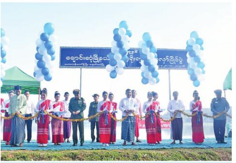
ဖွင့်ပွဲပြည်နယ်ဝန်ကြီးချုပ် ဦးအောင်ကြည်သိန်း၊ အရှေ့တောင်တိုင်းစစ်ဌာနချုပ် တိုင်းမှူး ဗိုလ်မှူးချုပ်စိုးမင်းနှင့် ဌာနဆိုင်ရာတာဝန်ရှိသူများက မြန်မာ့ရိုးရာလှေလှော်ပြိုင်ပွဲကို ဖဲကြိုးဖြတ်ဖွင့်လှစ်ပေးစဉ်။

ပြည်နယ်ဝန်ကြီးချုပ်၊ တိုင်းမှူးနှင့် တာဝန်ရှိသူများက လှေလှော်ပြိုင်ပွဲကို ဖဲကြိုးဖြတ်ဖွင့်လှစ်ပေးပြီး လှေလှော်ပြိုင်ပွဲဝင်အားကစားသမားများကို ရင်းရင်းနှီးနှီးလိုက်လံ နှုတ်ဆက်ကာ ပြိုင်ပွဲဝင်အသင်းများ၏ ယှဉ်ပြိုင်လှော်ခတ်နေမှုများအား ကြည့်ရှုအားပေးကြသည်။ အဆိုပါမြန်မာ့ရိုးရာလှေလှော်ပြိုင်ပွဲကို တစ်တက်လှော်ပြိုင်ပွဲဝင်အသင်း ၁၁ သင်း၊ သုံးတက်လှော်ပြိုင်ပွဲဝင်အသင်း ၁၄ သင်း၊ စုစုပေါင်း ၂၅ သင်းဖြင့် အောက်တိုဘာ ၂၈ ရက်ထိ ယှဉ်ပြိုင်သွားမည်ဖြစ်ကြောင်း အမှာစကားပြောကြားသည်။ ထို့နောက်