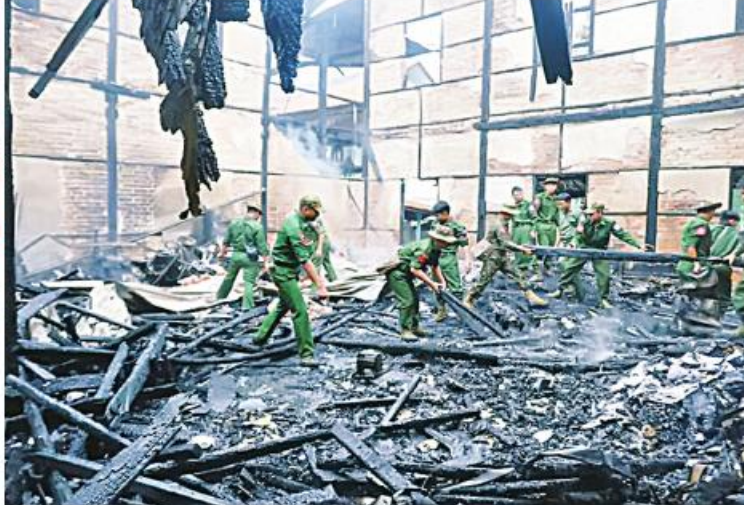
မော်လမြိုင်မြို့ ပန်းဘဲတန်းရပ်ကွက် အမှတ်(၉)ကျောင်းလမ်းရှိ အမှတ်(၉)အခြေခံပညာအထက်တန်းကျောင်းမီးလောင်မှုဖြစ်စဉ်မှ တရားခံ တစ်ဦး ပမ်းဆီးရမိ

နေပြည်တော် အောက်တိုဘာ ၂၆ ရပ်ကွက် အမှတ်(၉)ကျောင်းလမ်းရှိ မီးသတ်ဦးစီးဌာန ဦးစီးမှူး ဦးစီးသော အောက်တိုဘာ ၂၅ ရက် နံနက် ၃ နာရီ အမှတ်(၉) အခြေခံပညာအထက်တန်း မီးသတ်တပ်ဖွဲ့ဝင်များ၊ ရပ်ကွက်အုပ်ချုပ် မိနစ် ၄၀ တွင် မော်လမြိုင်မြို့ ပန်းဘဲတန်း ကျောင်း၌ မီးလောင်မှုဖြစ်ပွားခဲ့ရာ မြို့နယ် ရေးအဖွဲ့ဝင်များ၊ ရပ်ကွက်နေပြည်သူများက မီးသတ်ယာဉ် ရှစ်စီး၊ ရေသယ်ယာဉ် သုံးစီး၊ အုပ်ချုပ်မှုယာဉ် တစ်စီးတို့ဖြင့် ဝိုင်းဝန်းငြိမ်း သတ်ခဲ့ရာ နံနက် ၇ နာရီခွဲတွင် မီးငြိမ်းခဲ့