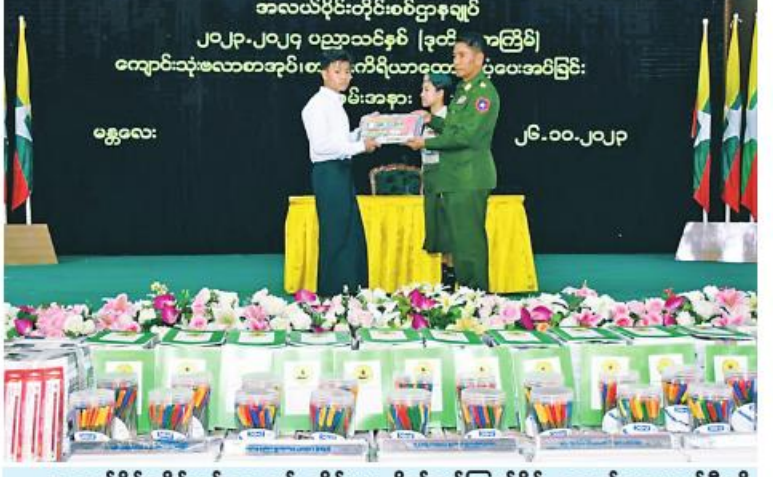
အလယ်ပိုင်းတိုင်းစစ်ဌာနချုပ် တိုင်းမှူး ဗိုလ်ချုပ်ကြည်ခိုင် ကျောင်းသားတစ်ဦးကို ကျောင်းသုံးပလာစာအုပ်နှင့် စာရေးကိရိယာများ ထောက်ပံ့ပေးအပ်စဉ်။

များ တက်ရောက်ကြသည်။ ဦးစွာ တိုင်းမှူးက အဖွင့်အမှာစကားပြောကြားသည်။ ထို့နောက် တိုင်းမှူးနှင့်တာဝန်ရှိသူများက ၂၀၂၃ - ၂၀၂၄ ပညာသင်နှစ်တွင် တက်ရောက် ပညာသင်ကြားလျက်ရှိသည့် ကျောင်းသား၊ ကျောင်းသူဦးရေ ၄၉၀ တို့ကို ကျောင်းသုံးပလာစာအုပ်နှင့်စာရေးကိရိယာ ထောက်ပံ့ပေးအပ်ရာ ကျောင်းသား၊ ကျောင်းသူများက လက်ခံရယူကြသည်။ ၎င်းနောက် တိုင်းမှူးနှင့်တာဝန်ရှိသူများက တက်ရောက်လာကြသူများကို ရင်းရင်းနှီးနှီးလိုက်လံနှုတ်ဆက်ခဲ့ကြောင်း သတင်းရရှိသည်။