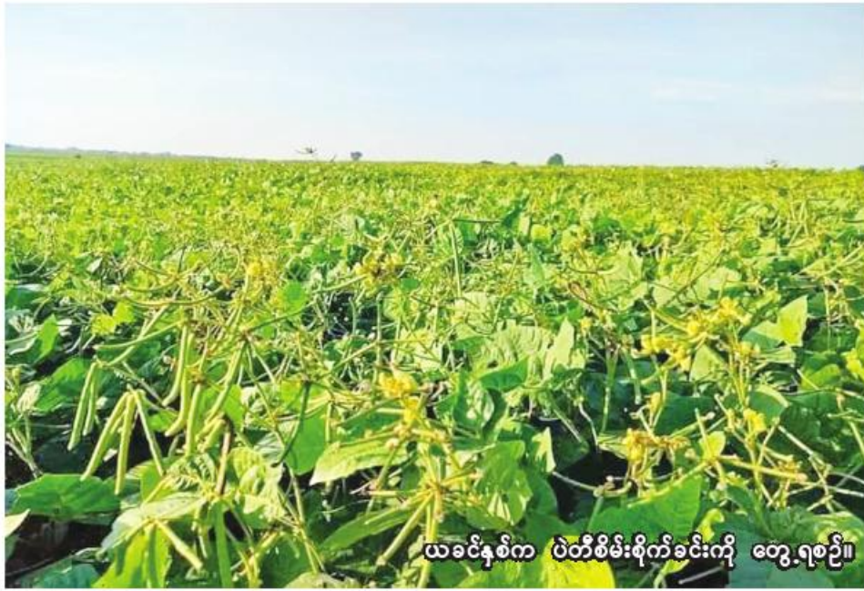
ယခင်နှစ်က ပဲတီစိမ်းစိုက်ခင်းကို တွေ့ရစဉ်။