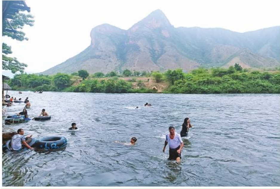
ဆင်ခေါင်းတောင်ကို အဝေးမှတွေ့ရစဉ်။

ရှုခင်းတွေက အလွန်သာယာလှပပါတယ်။ အဝေးတစ်နေရာက မြို့ကြီးဆည်ရေပြင်ကျယ်၊ ဆည်ရေပြင်ကိုပတ်လည်ပိုင်း ကာရံပေးထားတဲ့ မှိုင်းမှိုင်းပြာပြာတောင်တန်းကြီးတွေ၊ ဆည်ရေပြင်အောက် ရေလွှတ်မြောင်းတစ်လျှောက်က စိမ်းစိမ်းစိုစိုစိုက်ခင်းပျိုးခင်းတွေ၊ သစ်ပင်အုပ်အုပ်၊ အိမ်ခြေစုစုကျေးရွာငယ်လေးတွေ စသဖြင့် ဟိုတစ်ခု၊ ဒီတစ်ခုနဲ့ မြင်တွေ့နေရတယ်။ မြင်တွေ့နေရတဲ့ တောင်အောက်ခြေက ရှုခင်း