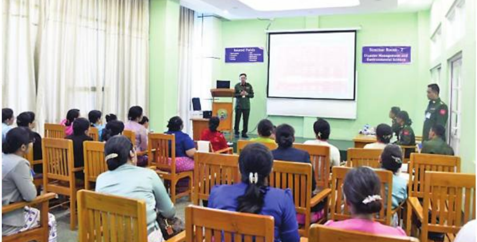
စစ်တက္ကသိုလ်အဆင့်မြင့်စာပေပညာပဟိုဌာနတွင် သိပ္ပံနှင့်နည်းပညာဆိုင်ရာဖွံ့ဖြိုးတိုးတက်ရေးကွန်ဖရင့်(၂၀၂၃) ကျင်းပစဉ်

နေပြည်တော် အောက်တိုဘာ ၂၆ တပ်မတော်အနေဖြင့် သိပ္ပံနှင့်နည်းပညာဆိုင်ရာများ အထောက်အကူပြုနိုင်ရန်နှင့် လူ့စွမ်းအားအရင်းအမြစ် ဖွံ့ဖြိုးတိုးတက်စေရန်ရည်ရွယ်၍ သိပ္ပံနှင့် နည်းပညာဆိုင်ရာ ဖွံ့ဖြိုးတိုးတက်ရေးကွန်ဖရင့်(၂၀၂၃) (Conference on Science and Technology Development -2023) (CSTD-2023) ဖွင့်ပွဲအခမ်းအနားကို ယနေ့နံနက်ပိုင်းတွင် ပြင်ဦးလွင်တပ်နယ် စစ်တက္ကသိုလ် အဆင့်မြင့်စာပေပညာပဟိုဌာန ငါးထပ်စာသင်ဆောင်ရှိ Multifunction Hall ၌ ကျင်းပပြုလုပ်သည်။