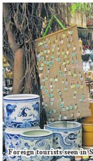
Foreign tourists seen in Sein Pan Gone Village.

learn about the traditions and lifestyles of the villages," he continued. In this village, there are also interesting items created by Burmese handicrafts, including weaving industry,