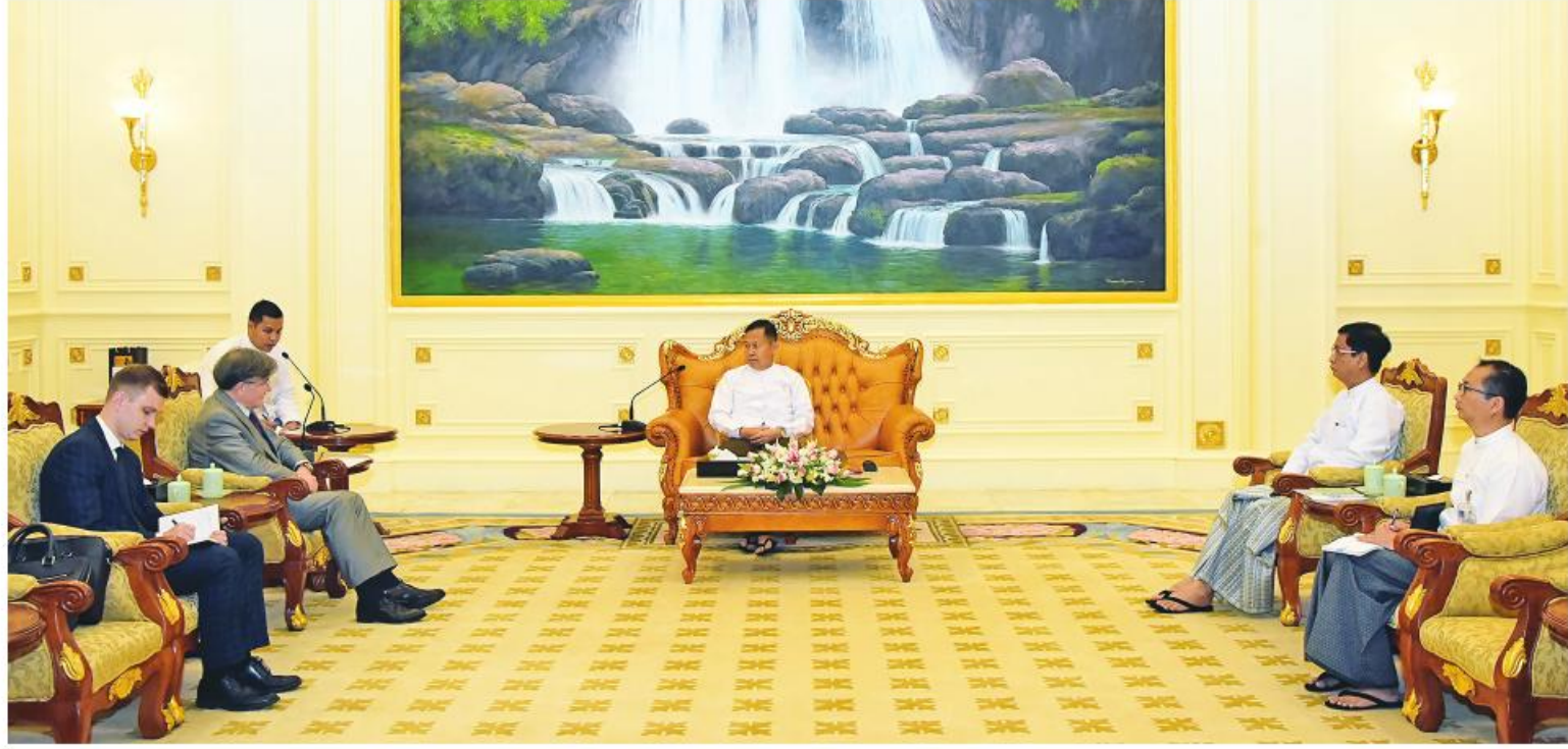
နေပြည်တော် အောက်တိုဘာ ၂၆ နိုင်ငံတော်စီမံအုပ်ချုပ်ရေးကောင်စီ ဒုတိယဥက္ကဋ္ဌ ဒုတိယဝန်ကြီးချုပ် ဒုတိယဗိုလ်ချုပ်မှူးကြီး စိုးဝင်းသည် ယနေ့ညနေပိုင်းတွင် မြန်မာနိုင်ငံဆိုင်ရာ ရုရှားဖက်ဒရေးရှင်းနိုင်ငံ သံအမတ်ကြီး H.E. Mr. Iskander Azizov ကို နိုင်ငံတော် စီမံအုပ်ချုပ်ရေးကောင်စီ ဥက္ကဋ္ဌရုံး သံတမန်ဆောင်ညွှန်ခန်းမ၌ လက်ခံတွေ့ဆုံသည်။ စာမျက်နှာ ၂၂ ကော်လံ ၄ ☆ နိုင်ငံတော်စီမံအုပ်ချုပ်ရေးကောင်စီ ဒုတိယဥက္ကဋ္ဌ ဒုတိယဝန်ကြီးချုပ် ဒုတိယဗိုလ်ချုပ်မှူးကြီးစိုးဝင်း မြန်မာနိုင်ငံဆိုင်ရာ ရုရှားဖက်ဒရေးရှင်းနိုင်ငံ သံအမတ်ကြီး H.E. Mr. Iskander Azizov ကို လက်ခံတွေ့ဆုံသည်။