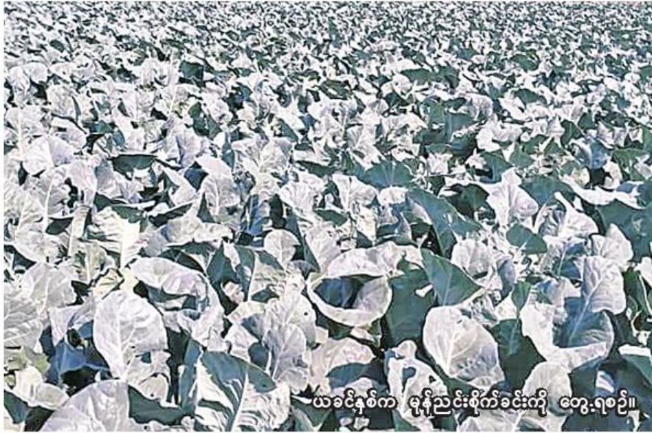
ယခုနှစ်က မုန့်ညင်းစိုက်ခင်းကို တွေ့ရစဉ်။

ကလေး အောက်တိုဘာ ၂၆ စစ်ကိုင်းတိုင်းဒေသကြီး ကလေးခရိုင်တွင် ယခုနှစ် မိုးသီးနှံစိုက်ပျိုးရာသီ၌ ဟင်းသီးဟင်းရွက် ၁၂၇၄၆ ဧက စိုက်ပျိုးပြီးစီးပြီဖြစ်ကြောင်း ကလေးခရိုင် စိုက်ပျိုးရေးဦးစီးဌာနမှ သိရသည်။