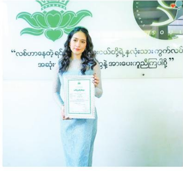
“လစ်ဟာနေတဲ့ရင်သွေးလေးများဂေဟာသို့ အသုံးပြုရန်အားပေးကူညီကြပါစို့”

“ဒီနှစ်ကို ပါတီမလုပ်ဘဲနဲ့ အလှူလေး လုပ်ချင်တဲ့စိတ်လေးဖြစ်