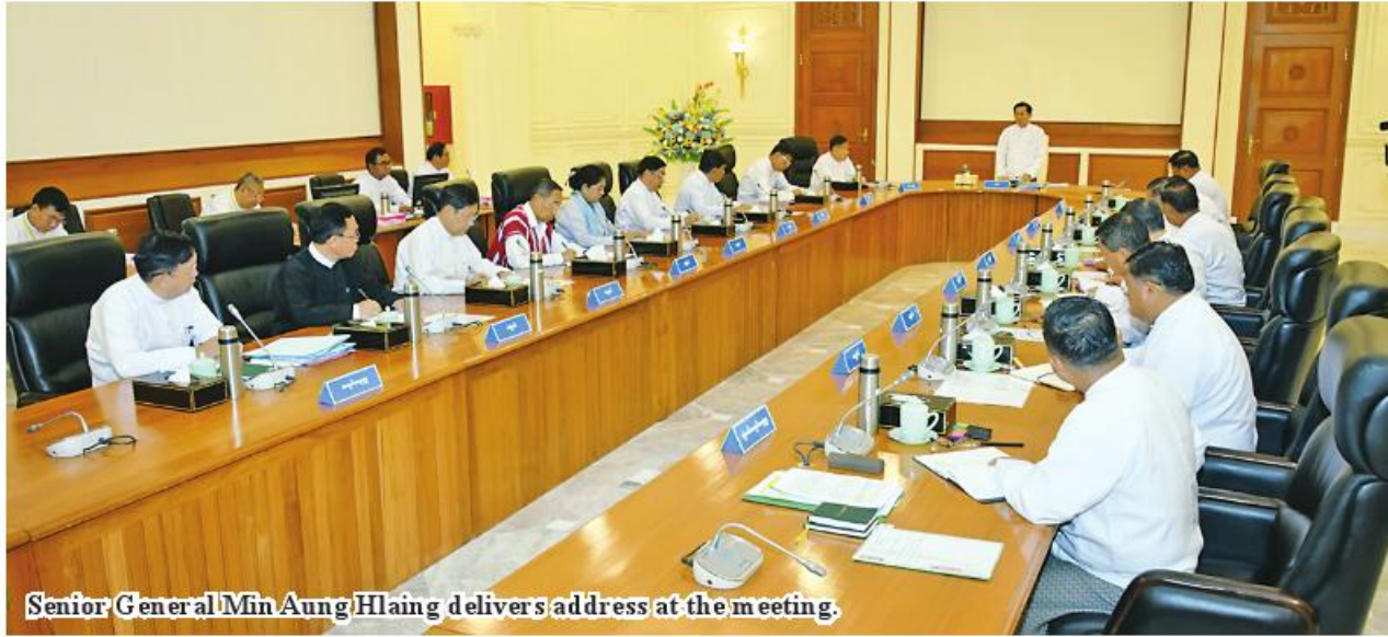
Senior General Min Aung Hlaing delivers address at the meeting.

Nay Pyi Taw October 26 The State Administration Council held the meeting 5/2023 at the meeting hall of SAC Chairman's Office here this morning, addressed by Chairman of State Administration Council Prime Minister Senior General Min Aung Hlaing.