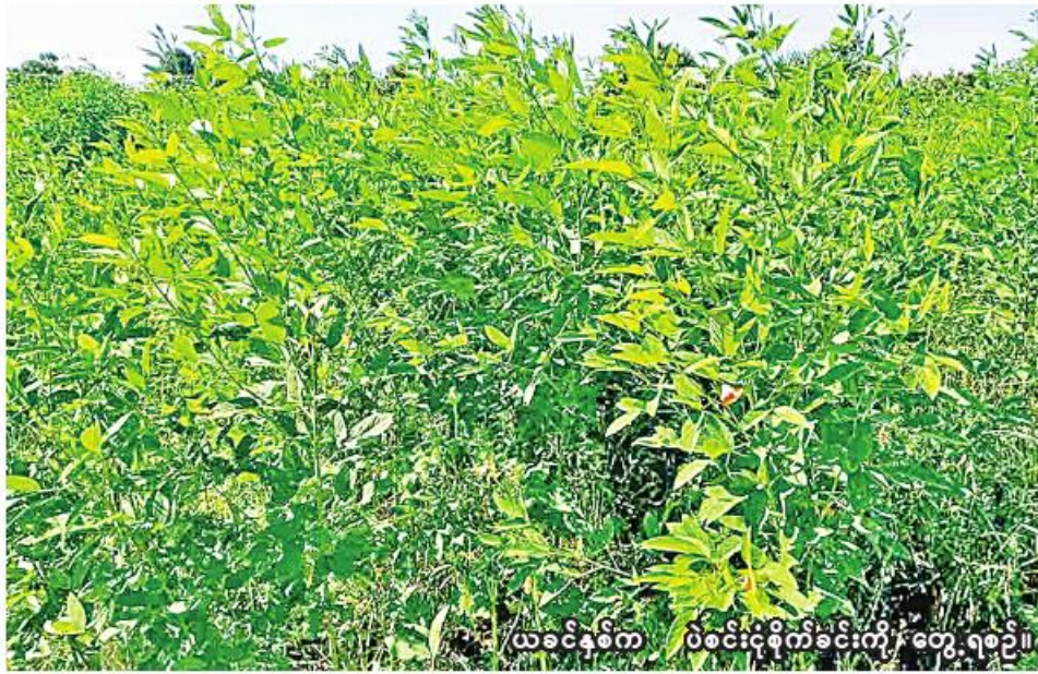
လပွတ္တာမြို့နယ်တွင် စိုက်ပျိုးထားသော သီးနှံစုံများ