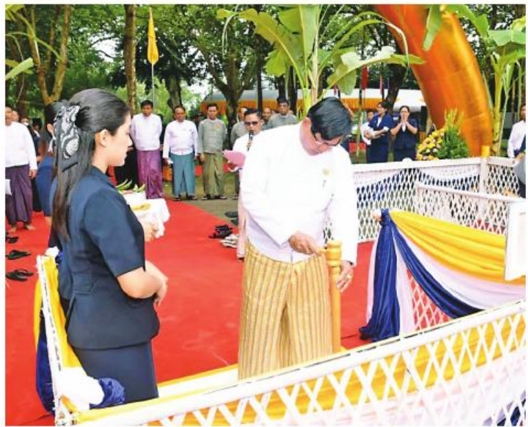
ရန်ကုန်တိုင်းဒေသကြီး ဝန်ကြီးချုပ် ဦးစိုးသိန်း သတ်မှတ်နေရာတွင် ရတနာပန္နက်တော်အား စိုက်ထူပေးစဉ်။

နေပြည်တော် အောက်တိုဘာ ၂၆ - ရန်ကုန်တိုင်းဒေသကြီး အစိုးရအဖွဲ့၏ ကြီးကြပ်မှုဖြင့် ရန်ကုန်မြို့တော်စည်ပင်သာယာရေးကော်မတီ (လမ်း၊ တံတား)က တာဝန်ယူတည်ဆောက်မည့် ရွှေတိဂုံစေတီတော်(အနောက်ဘက်မုခ်နှင့်ပြည်သူ့ရင်ပြင်ပန်းခြံကြား) မြေအောက်လမ်းကူးလူသွားဥမင်(Underpass)အဆောက်အအုံရတနာပန္နက်တော်တင် မင်္ဂလာအခမ်းအနားကို ယနေ့နံနက်ပိုင်းက ရန်ကုန်တိုင်းဒေသကြီး ဒဂုံမြို့နယ် ဦးဝိစာရလမ်း၌ ပြုလုပ်ရာ အခမ်းအနားသို့ နိုင်ငံတော်စတုတ္ထယုဂ်ဝန်ဆောင် တိပိဋကဩဝါဒါစရိယ အဂ္ဂမဟာ