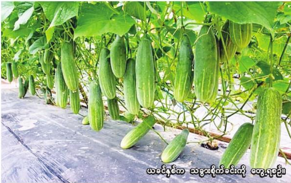
ယခင်နှစ်က သခွေးစိုက်ခင်းကို တွေ့ရစဉ်။