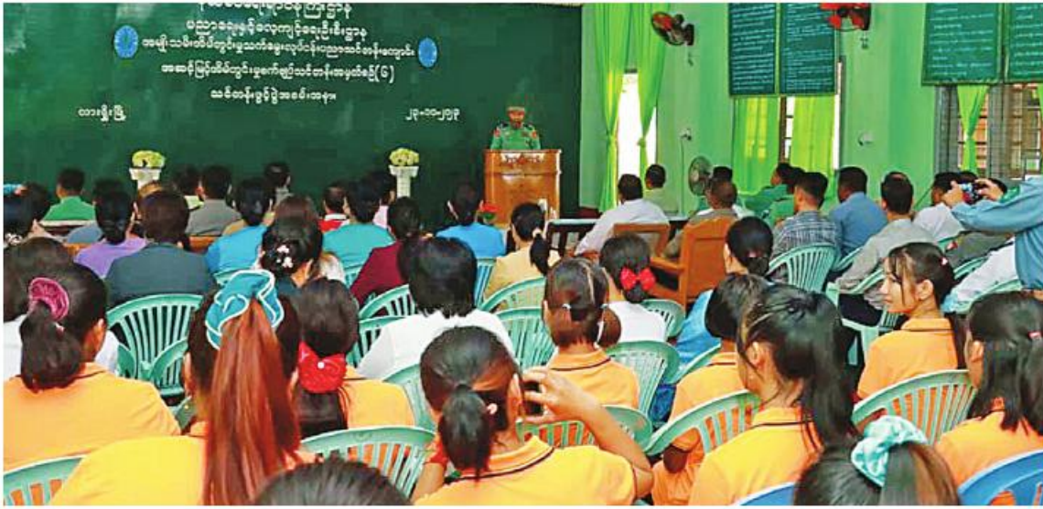
ရှမ်းပြည်နယ်(မြောက်ပိုင်း) လားရှိုးမြို့၌ အဆင့်မြင့်အိမ်တွင်းမှုစက်ချုပ်သင်တန်းအမှတ်စဉ်(၆) ပွင့်ပွဲကျင်းပစဉ်။

နေပြည်တော် အောက်တိုဘာ ၂၃ - နယ်စပ်ရေးရာဝန်ကြီးဌာန ပညာရေးနှင့်လေ့ကျင့်ရေးဦးစီးဌာနက ကြီးမှူးဖွင့်လှစ်သည့် အဆင့်မြင့်အိမ်တွင်းမှုစက်ချုပ်သင်တန်းအမှတ်စဉ်(၆) ဖွင့်ပွဲများကို ယနေ့နံနက်ပိုင်းတွင် ရှမ်းပြည်နယ် (မြောက်ပိုင်း) လားရှိုးမြို့နှင့် ရှမ်းပြည်နယ် (တောင်ပိုင်း) ကွန်ဟိန်းမြို့တို့ရှိ အမျိုးသမီးအိမ်တွင်းမှုသက်မွေးလုပ်ငန်းပညာသင်တန်းကျောင်းများ၌ပြုလုပ်ရာ သက်ဆိုင်ရာ တိုင်းစစ်ဌာနချုပ်များမှ တိုင်းမှူး၊ ဒုတိယ တိုင်းမှူးနှင့် ဌာနဆိုင်ရာတာဝန်ရှိသူများ၊ နယ်စပ်ရေးရာဝန်ကြီးဌာန ပညာရေးနှင့်လေ့ကျင့်ရေးဦးစီးဌာနမှ တာဝန်ရှိသူများ၊ မြို့မမြို့ဖများ၊ သင်တန်းနည်းပြများ၊ သင်တန်းသား၊ သင်တန်းသူများ၊ ဖိတ်ကြားထားသူများ တက်ရောက်ကြသည်။ ဦးစွာ တိုင်းမှူးနှင့် ဒုတိယတိုင်းမှူးတို့က အဖွင့်အမှာစကားများ အသီးသီးပြောကြားကြသည်။ ထို့နောက် တိုင်းမှူး၊ ဒုတိယတိုင်းမှူးနှင့် တာဝန်ရှိသူများက သင်တန်းသူများကို ဂုဏ်ပြုချီးမြှင့်ငွေများပေးအပ်ပြီး ရင်းရင်း နှီးနှီးလိုက်လံနှုတ်ဆက်ကြသည်။ ၎င်းနောက် အဆိုပါသင်တန်းကျောင်းများ၌ ခင်းကျင်းပြသထားသည့် အဆင့်မြင့်အိမ်တွင်းမှုအသက်မွေးဝမ်းကျောင်း ထုတ်ကုန်ပစ္စည်းများနှင့် သင်ထောက်ကူပစ္စည်းများကို လိုက်လံကြည့်ရှုကြသည်။ အဆိုပါအဆင့်မြင့်အိမ်တွင်းမှု စက်ချုပ်သင်တန်းများကို ၂၀၂၄ ခုနှစ် မတ် ၂၂ ရက်ထိ သင်တန်းသူဦးရေ ၃၀၀၀ ဖြင့်ဖွင့်လှစ်သင်ကြားပေးသွားမည်ဖြစ်ကြောင်း သတင်းရရှိသည်။