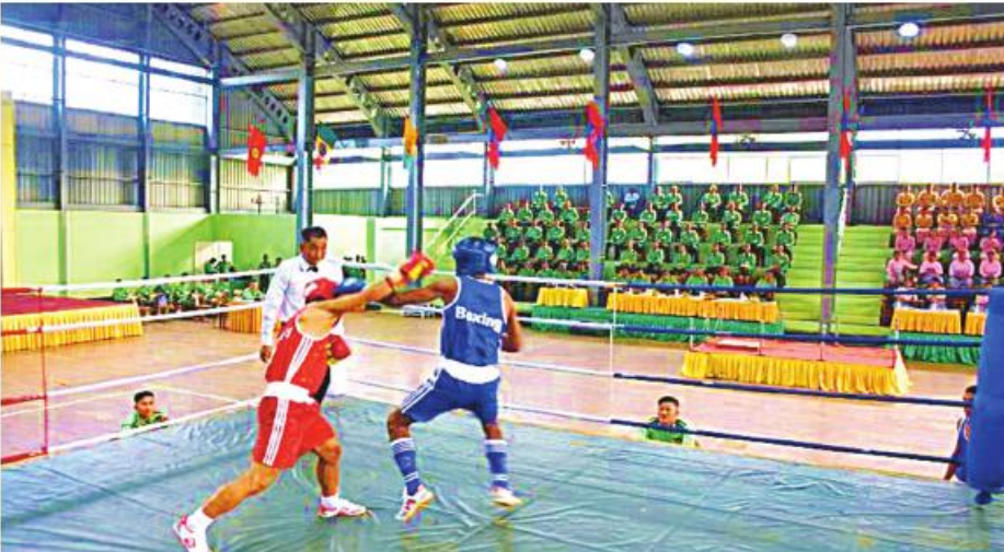
အရှေ့အလယ်ပိုင်း တိုင်းစစ်ဌာနချုပ် တိုင်းမှူးခိုင်း လက်တွေ့ပြိုင်ပွဲ အဖွင့်ပွဲစဉ် ယှဉ်ပြိုင်ကစားနေမှုကို တွေ့ရစဉ်။

နေပြည်တော် အောက်တိုဘာ ၂၃ - အရှေ့အလယ်ပိုင်းတိုင်း စစ်ဌာနချုပ် ၂၀၂၃ ခုနှစ် တိုင်းမှူးခိုင်း လက်တွေ့ပြိုင်ပွဲ ဖွင့်ပွဲကို ယနေ့ ညနေပိုင်းတွင် တိုင်းစစ်ဌာနချုပ်ရှိ အောင်လေးယုခန်းမ၌ ပြုလုပ်ရာ တိုင်းမှူး ဗိုလ်ချုပ်မှူးမင်းထွန်းနှင့်အဖွဲ့ဝင်များ၊ အရာရှိ၊ စစ်သည်၊ မိသားစုများ၊ ခိုင်အဖွဲ့ဝင်များနှင့် ပြိုင်ပွဲဝင်အားကစားသမားများ တက်ရောက်ကြသည်။