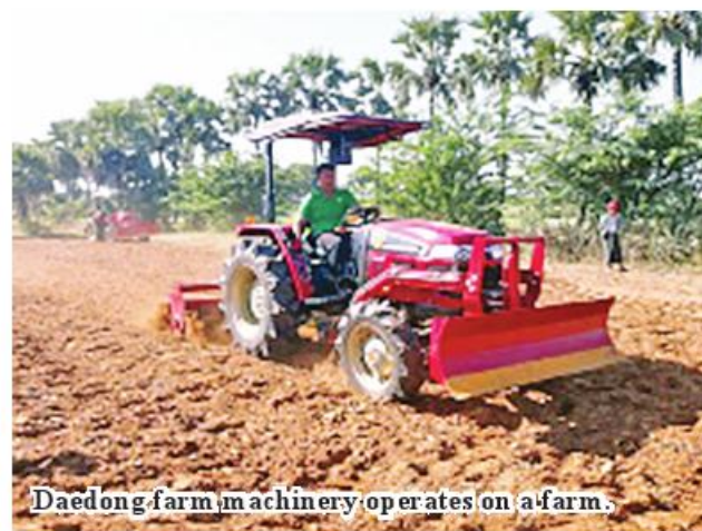
Daedong farm machinery operates on a farm.

"This financial year, three smart villages were established. Necessary items of agricultural machinery were sold to farmers, members of the cooperative societies for convenience in their farming works. We help farmers from three smart villages enjoy fruits of social living standard,"