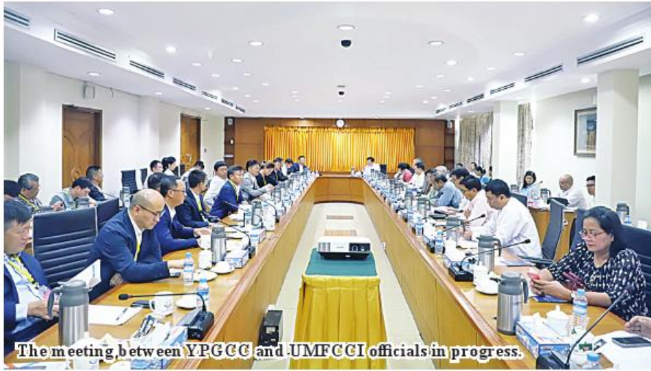
The meeting between YPGCC and UMFCCI officials in progress.