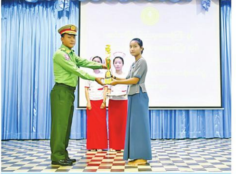
အရှေ့တောင်တိုင်းစစ်ဌာနချုပ် တိုင်းမှူး ဗိုလ်မှူးချုပ်စိုးမင်း ထူးချွန်ဆုရသင်တန်း သူ တစ်ဦးကို ဆုပေးအပ်ရီးဖြင့်စဉ်။

နေပြည်တော် အောက်တိုဘာ ၂၃ - မွန်ပြည်နယ် မော်လမြိုင်မြို့ ခုတင်-၅၀၀ဆံ့ ပြည်သူ့ဆေးရုံကြီးနှင့် ခုတင်-၂၀၀ဆံ့ အမျိုးသမီးနှင့် ကလေးဆေးရုံကြီး တို့၌ ဖွင့်လှစ်သင်ကြားသည့် သူနာပြုအကူ(ပြင်ပ)သင်တန်းဆင်းပွဲကို ယနေ့ နံနက်ပိုင်းတွင် မော်လမြိုင်မြို့ အထွေထွေရောဂါကုဆေးရုံကြီးရှိ အစည်းအဝေးခန်းမ၌ ပြုလုပ်ရာ မွန်ပြည်နယ် ဝန်ကြီးချုပ် ဦးအောင်ကြည်သိန်း၊ အရှေ့တောင်တိုင်း စစ်ဌာနချုပ် တိုင်းမှူး ဗိုလ်မှူးချုပ်စိုးမင်းနှင့် ဌာနချုပ်ဆိုင်ရာ တာဝန်ရှိသူများ၊ သင်တန်းသား၊ သင်တန်းသူများ၊ ဖိတ်ကြားထားသူများ တက်ရောက်ကြသည်။