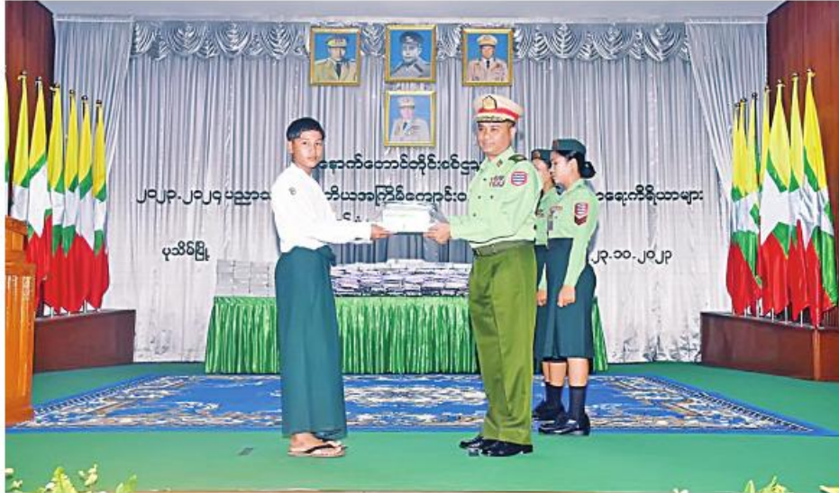
အနောက်တောင် တိုင်းစစ်ဌာနချုပ် တိုင်းမှူး ဗိုလ်မှူးချုပ်ဝေလင်း ကျောင်းသား တစ်ဦးကို ကျောင်းဝတ်စုံနှင့် ကျောင်းသုံးစာရေး ကိရိယာများ ထောက်ပံ့ပေးအပ်စဉ်။

နေပြည်တော် အောက်တိုဘာ ၂၃ - အနောက်တောင်တိုင်း စစ်ဌာနချုပ် ၂၀၂၃-၂၀၂၄ ပညာသင်နှစ် ဒုတိယအကြိမ် ကျောင်းဝတ်စုံနှင့် ကျောင်းသုံးစာရေးကိရိယာများ ထောက်ပံ့ပေးအပ်ခြင်းကို ယနေ့ မွန်းလွဲပိုင်းတွင် တိုင်းစစ်ဌာနချုပ်ရှိ ဧရာဝတီခန်းမ၌ ပြုလုပ်ရာ တိုင်းမှူး ဗိုလ်မှူးချုပ်ဝေလင်းနှင့် အဖွဲ့ဝင်များ၊ အရာရှိ၊ စစ်သည်၊ မိသားစုများ၊ ဆရာ၊ ဆရာမများနှင့် ကျောင်းသား၊ ကျောင်းသူများ တက်ရောက်ကြသည်။