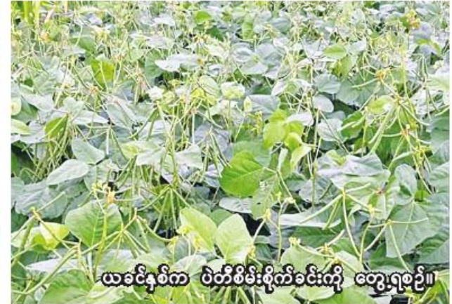
ယခင်နှစ်က ပဲတီစိမ်းစိုက်ခင်းကို တွေ့ရစဉ်။

ဝက်လက်မြို့နယ်တွင် ယခုနှစ် ပဲတီစိမ်းစိုက်တောင်သူများကို မြို့နယ်စိုက်ပျိုးရေးဦးစီးဌာနအနေဖြင့် ဒေသနှင့်ကိုညီညွတ်မျိုးကောင်း၊ မျိုးသန့်ရရှိရေး၊ စိုက်နည်းစနစ်မှန်ကန်ရေး၊ ပိုးမွှားကုရောက်မှုကင်းရှင်းရေး၊ ဓာတ်မြေဩဇာစနစ်တကျ သုံးစွဲရေး၊ အထွက်နှုန်းကောင်းမွန်ရေးတို့ကို အသိပညာပေးလျက်ရှိကြောင်း ဝက်လက်မြို့နယ် စိုက်ပျိုးရေးဦးစီးဌာနမှ သိရသည်။ (၂၀၆)