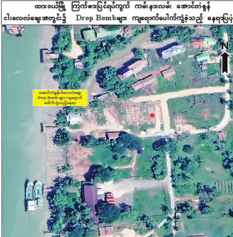
နေပြည်တော် အောက်တိုဘာ ၂၃ - ထားဝယ်မြို့ ကြမ်းစားပြင်ရပ်ကွက် ကမ်းနားလမ်း အောင်တံခွန် ငါးလေလံဈေးအတွင်း၌ Drop Bombများ ကျရောက်ပေါက်ကွဲခဲ့သည့် နေရာပြပုံ

ခိုက်ခဲ့ကြောင်း သိရသည်။ ဖြစ်စဉ်မှာ ထားဝယ်မြို့ ကြမ်းစားပြင် ရပ်ကွက် ကမ်းနားလမ်းရှိ အောင်တံခွန် ငါးလေလံဈေးကို PDF အမည်ခံအကြမ်း ပက်သမားများက ယနေ့ မွန်းလွဲပိုင်းတွင် ဈေး၏ အနောက်မြောက်ဘက်မီတာ ၅၀၀ ခန့်အကွာမှ Drone အသုံးပြု၍ Drop ဖုံးများဖြင့် ပစ်ချတိုက်ခိုက်ခဲ့သဖြင့် ဈေးဝယ်နေသည့် အသက် ၁၄ နှစ်အရွယ် ကလေး တစ်ဦး ဖုံးစထိမှန် ဒဏ်ရာများရရှိခဲ့ ကြောင်း သိရသည်။ အဆိုပါ ထိခိုက်ဒဏ်ရာရရှိခဲ့သူကို လုံခြုံရေးတပ်ဖွဲ့ဝင်များက ထားဝယ်မြို့ ပြည်သူ့ဆေးရုံသို့ ပို့ဆောင်ဆေးကုသမှုခံယူ စေလျက်ရှိကြောင်းနှင့် ယခုကဲ့သို့ အများ ပြည်သူများ အထိတ်တလန့်ဖြစ်စေရန် ရည်ရွယ်ချက်ဖြင့် ဒေသခံပြည်သူများ အေးချမ်းစွာ ဈေးရောင်း၊ ဈေးဝယ်ပြုလုပ် နေသည့် ဈေးအတွင်းသို့ Drop ဖုံးများ ပစ်ချတိုက်ခိုက်ခဲ့သည့် PDF အမည်ခံ အကြမ်းပက်သမားများကို အမြန်ဆုံး ဖမ်းဆီးရမိရေး လုံခြုံရေးတပ်ဖွဲ့ဝင်များက လိုအပ်သည့်လုံခြုံရေးလုပ်ငန်းများ ဆောင် ရွက်လျက်ရှိကြောင်း သတင်းရရှိသည်။