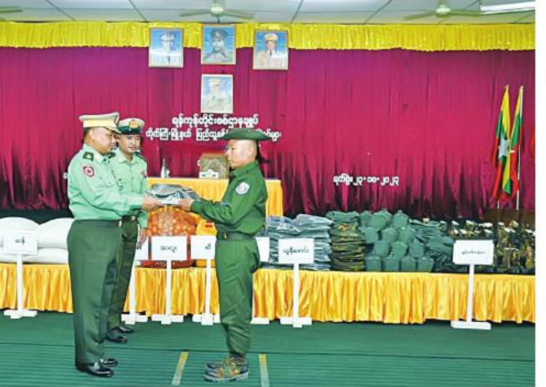
ရန်ကုန်တိုင်း စစ်ဌာနချုပ် တိုင်းမှူး ဗိုလ်ချုပ်ဇော်ဟိန်း ပြည်သူ့စစ်(ဌာနေ) တပ်ဖွဲ့ဝင်များအတွက် ဆန်၊ ဆီနှင့် စားသောက်ဖွယ်ရာများ ထောက်ပံ့ပေးအပ်စဉ်။

နေပြည်တော် အောက်တိုဘာ ၂၃ - ရန်ကုန်တိုင်းဒေသကြီး လှည်းကူးမြို့နယ် မင်းကုန်းကျေးရွာနှင့် တိုက်ကြီးမြို့နယ် ချင်းကုန်းကျေးရွာတို့ရှိ ပြည်သူ့စစ်(ဌာနေ)တပ်ဖွဲ့ဝင်များကို ယနေ့ နံနက်ပိုင်းတွင် ရန်ကုန်တိုင်းစစ်ဌာနချုပ် တိုင်းမှူး ဗိုလ်ချုပ်ဇော်ဟိန်းနှင့် တာဝန်ရှိသူများက နယ်မြေခံသင်တန်းကျောင်းခန်းမများ၌ တွေ့ဆုံသည်။ ဦးစွာ တိုင်းမှူးက အမှာစကားပြောကြားပြီး ပြည်သူ့စစ်(ဌာနေ)တပ်ဖွဲ့ဝင်များ၏ တင်ပြချက်များအပေါ် လိုအပ်သည်များညှိနှိုင်းဖြည့်ဆည်း ဆောင်ရွက်ပေးသည်။ ထို့နောက် တိုင်းမှူးက ပြည်သူ့စစ်(ဌာနေ) တပ်ဖွဲ့ဝင်များအတွက် ဆန်၊ ဆီနှင့် စားသောက်ဖွယ်ရာများ ထောက်ပံ့ပေးအပ်ပြီး ရင်းရင်းနှီးနှီးလိုက်လံ နှုတ်ဆက်သည်။ ထို့နောက် တိုင်းမှူးနှင့် တာဝန်ရှိသူများသည် တိုက်ကြီးမြို့နယ်ရှိ နယ်မြေခံဆေးတပ်ရင်း၌ တက်ရောက်ဆေးကုသမှုခံယူလျက်ရှိသော အရာရှိ၊ စစ်သည်များကို သွားရောက်တွေ့ဆုံ၍ တစ်ဦးချင်း၏ ရောဂါဖြစ်ပွားမှုများ၊ ဆေးကုသပေးထားမှုနှင့် ကျန်းမာရေးတိုးတက်မှုအခြေအနေများကို ရင်းရင်းနှီးနှီးမေးမြန်းအားပေးစကားပြောကြားကာ ဆေးရုံအတွင်းလှည့်လည်ကြည့်ရှုခဲ့ကြောင်း သတင်းရရှိသည်။