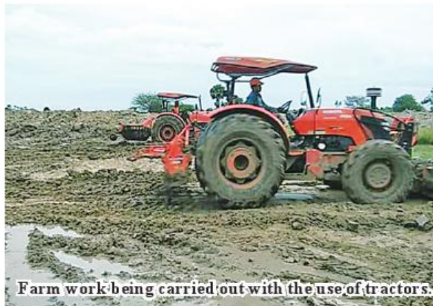
Farm work being carried out with the use of tractors.

Mandalay October 8 This financial year, K210 million of loans was disbursed to farmers through JICA (two-step loan) for purchase of agricultural machinery, said U Soe Ko Ko Win, Mandalay Region Manager of Myanmar Agricultural Development Bank. The bank has issued loans to three farmers from townships of Mandalay Region from August in cooperation with JICA for purchasing tractors, combine harvesters and other machinery in order to transform manual to the mechanized farming. The bank plans to issue more loans to farmers from remaining townships. "We help local farmers transform manual to mechanized farming in the region. The bank will issue loans to seven townships with soft interest rate. We allow K7 million in maximum to each farmer. So far, we have disbursed loans to farmers from two townships for purchase of a combine harvester and two tractors," he added. Thanks to agricultural machinery, farmers can make