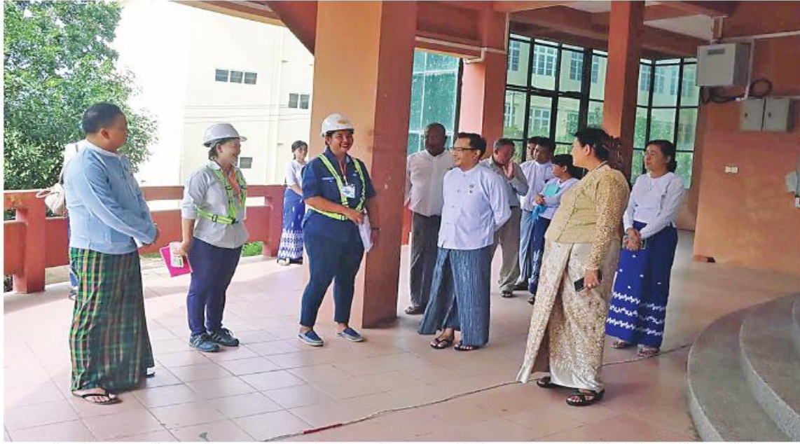
ရန်ကုန် အောက်တိုဘာ ၈ ဦးတည်ချက်များကို အောင်မြင်အောင် အကူပြုနိုင်မည့် အရည်အသွေးပြည့်ဝသော နိုင်ငံတော်၏ ရှေ့လုပ်ငန်းစဉ်များနှင့် ဆောင်ရွက်ရာတွင် ကောင်းစွာအထောက်အကူပြုနိုင်မည့် နည်းပညာရှင်များ အစဉ်မွေးထုတ်နိုင်ရေး

ကြီးပမ်းဆောင်ရွက်ရန်၊ ယင်းသို့ဆောင်ရွက်ရာတွင် ဗလင်းတန်နှင့်ပြည့်စုံပြီး ပြည်သူ့အကျိုးသယံဇာတနှင့် လူငယ်များ ပျိုးထောင်ပေးရေး အလေးထားဆောင်ရွက်ရန်၊ MSMEs လုပ်ငန်းများဖွံ့ဖြိုးရေး နည်းပညာများပံ့ပိုးပေးနိုင်ရေး ဆောင်ရွက်ရန်၊ စပါးခွဲလောင်စာသုံး Gasifier အပါအဝင် ပြန်ပြည်မြဲစွမ်းအင်နှင့် လျှပ်စစ်သုံး ယာဉ်ဆိုင်ရာ သုတေသနများကို ဆောင်ရွက်ရန်၊ပြည်တွင်းပြည်ပ တက္ကသိုလ်များနှင့် ပူးပေါင်းဆောင်ရွက်မှု မြှင့်တင်ကာ University Ranking မြှင့်မားလာစေရေး ဆောင်ရွက်ကြရန် သိပ္ပံနှင့်နည်းပညာဝန်ကြီးဌာန ဒုတိယဝန်ကြီး ဒေါက်တာအောင်လေးက ယမန်နေ့ ညနေပိုင်းတွင် နည်းပညာတက္ကသိုလ်(မှော်ဘီ)ကို သွားရောက်စစ်ဆေးစဉ်တာဝန်ရှိသူများကို ပြောကြားသည်။