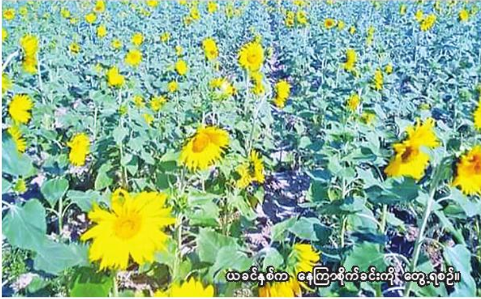
ယခင်နှစ်က နေကြာစိုက်ခင်းကို တွေ့ရစဉ်။

ဘုတလင် အောက်တိုဘာ ၈ စစ်ကိုင်းတိုင်းဒေသကြီး မုံရွာခရိုင် ဘုတလင်မြို့နယ်တွင် ယခုနှစ် မိုးသီးနှံစိုက်ပျိုးရာသီ၌ နေကြာ ၅၇၀၀၀ ကေ စိုက်ပျိုးပြီးစီးပြီးဖြစ်ကြောင်း ဘုတလင်မြို့နယ် စိုက်ပျိုးရေးဦးစီးဌာန စာရင်းများအရ သိရသည်။