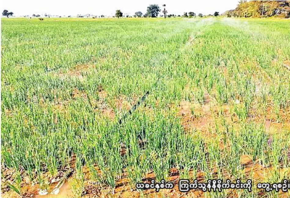
ယခင်နှစ်က ကြက်သွန်နီစိုက်ခင်းကို တွေ့ရစဉ်။

စစ်ကိုင်း အောက်တိုဘာ ၈ စစ်ကိုင်းတိုင်းဒေသကြီး စစ်ကိုင်းခရိုင်တွင် ယခုနှစ် မိုးသီးနှံစိုက်ပျိုးရာသီ၌ ကြက်သွန်နီ ၁၉၈၁ ဧက စိုက်ပျိုးပြီးစီးပြီဖြစ်ကြောင်း စစ်ကိုင်းခရိုင် စိုက်ပျိုးရေးဦးစီးဌာနမှ သိရသည်။