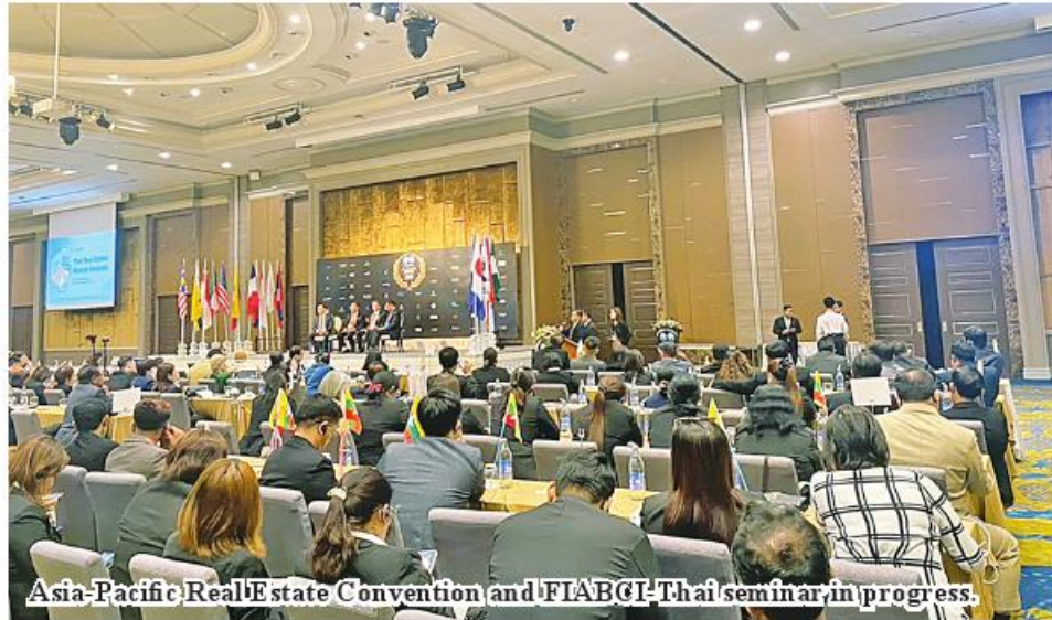
Asia-Pacific Real Estate Convention and FIABCI-Thai seminar in progress.

Yangon October 8 More than 110 members of the Myanmar Real Estate Services Association (MRE-SA) attended the Asia-Pacific Real Estate Convention and FIABCI-Thai seminar for