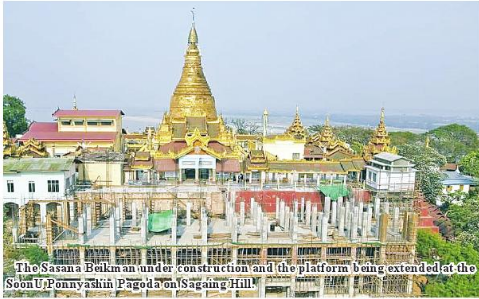
The Sasana Beikman under construction and the platform being extended at the SoonU Ponnyashin Pagoda on Sagaing Hill.

Sagaing October 8 Hill of Sagaing Region will be completed in October this year, according to the board of trustees. The Ponnyashin Sasana Beikman for stay of pilgrims was built on 9 September 2022 and it will be completed by cent per cent on 29 October, the full moon of