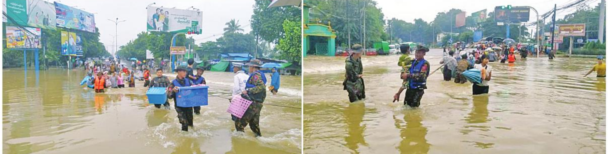
တောင်ပိုင်းတိုင်းစစ်ဌာနချုပ်ကွပ်ကဲမှုအောက်ရှိ နယ်မြေခံတပ်မတော်သားများ၊ မြန်မာနိုင်ငံရဲတပ်ဖွဲ့ဝင်များ၊ မီးသတ်တပ်ဖွဲ့ဝင်များ၊ လူမှုရေးအသင်းအဖွဲ့များက ရေဘေးသင့်ပြည်သူများကို ကူညီကယ်ဆယ်ရေးလုပ်ငန်းများ ဆောင်ရွက်ပေးခဲ့ခြင်း။

နေပြည်တော် အောက်တိုဘာ ၈ ပဲခူးတိုင်းဒေသကြီး ပဲခူးမြို့နယ်၌ အောက်တိုဘာ ၇ ရက်နှင့် ယနေ့တို့တွင် မိုးသည်းထန်စွာရွာသွန်းပြီး ပဲခူးမြစ်ရေ သည် စိုးရိမ်ရေအမှတ် စင်တီမီတာ ၈၈၀ အထက် ၆၈ စင်တီမီတာ (နှစ်ပေပေခန့်)အထိ မြင့်တက်မှုကြောင့် ပဲခူးမြို့ပေါ်ရှိ ရပ်ကွက် ရှစ်ခုနှင့် ကျေးရွာနှစ်ခုတို့တွင် ရေကြီးရေလျှံ မှုများဖြစ်ပေါ်ခဲ့သည်။ အဆိုပါ ရေကြီးရေလျှံမှုများဖြစ်ပေါ်ခဲ့ သည့်နေရာများသို့ ယနေ့တွင် တောင်ပိုင်း တိုင်းစစ်ဌာနချုပ် ကွပ်ကဲမှုအောက်ရှိ နယ်မြေခံတပ်မတော်သားများ၊ မြန်မာနိုင်ငံ ရဲတပ်ဖွဲ့ဝင်များ၊ မီးသတ်တပ်ဖွဲ့ဝင်များ၊