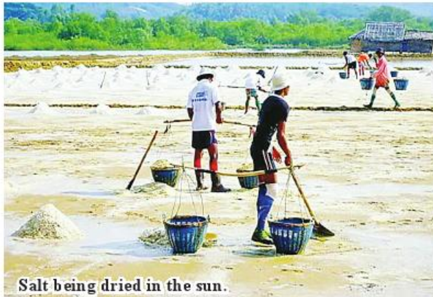
Salt being dried in the sun.