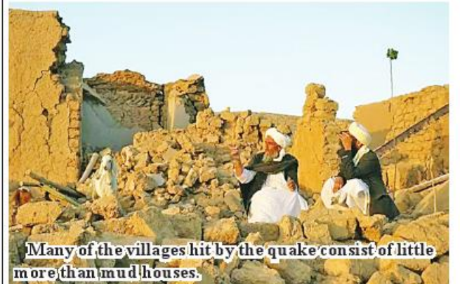
Many of the villages hit by the quake consist of little more than mud houses.