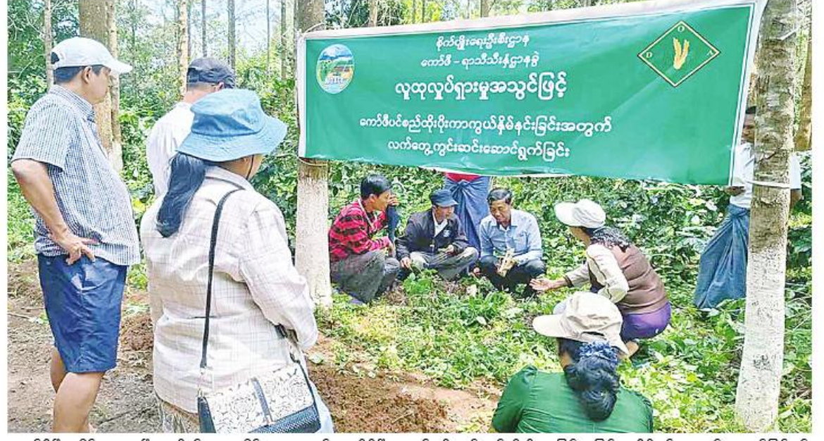
ကော်ဖီခြံပေါင်း ၇၅၁ ခြံ၊ စိုက်ကေပေါင်း ၁၀၆၁၄၄၁၁၂၂ ကေကို ကွင်းဆက်စစ်ဆေးခြင်း၊ နည်းပညာပေးခြင်းများ ဆောင်ရွက်လျက်ရှိရာ ပိုးကျကေပေါင်း ၂၈၉ ဒသမ ၆၅ ကေ၊ ပျက်စီးကေပေါင်း ၁၂၉ ဒသမ ၄ ကေရှိကြောင်းသိရသည်။ ပိုးကျသည့် ကော်ဖီစိုက်ခင်းများ ကွင်းဆက်ပြတ် ကာကွယ်နှိမ်နင်းနိုင်ရေးအတွက် မိမိခြံအတွင်းသို့ ပင်စည်ထိုးပိုး ကျရောက်မှု ရှိ မရှိ ကင်းထောက်စစ်ဆေးရန်၊ ပိုးတွေ့ပါက ညွှန်ကြားထားသည့် ကာကွယ်နှိမ်နင်းနည်းများအတိုင်း ကာကွယ်နှိမ်နင်းရန်၊ ပိုးကျရောက်ခဲ့သော ကိုင်းပြတ်များကို မီးရှို့ဖျက်ဆီးရန်၊ ထင်းအဖြစ်လုံးဝမသုံးစွဲရန်၊ အောက်တိုဘာလနှင့် နိုဝင်ဘာလတွင် အကောင်ကြီးများ ပြန်ထွက်သည်ကာလ

ပြောင်းလဲလာသည့် ရာသီဥတုနှင့် အပူချိန်မြင့်တက်လာမှုကြောင့် ကော်ဖီစိုက်ခင်းများတွင် ပင်စည်ထိုးပိုးအပြု ကျရောက်မှု ပိုမိုများပြားလာသည်အတွက် ၂၀၂၁ခုနှစ် ကစတင်ပြီး ၂၀၂၃ ခုနှစ်ထိ ပိုးကျရောက်သည့် ဒေသများတွင် စိုက်ပျိုးရေးဦးစီးဌာန၊ သီးနှံကာကွယ်ရေးဌာနခွဲ ရုံးချုပ်၊ တိုင်း၊ ခရိုင်အဆင့်တို့မှ တာဝန်ရှိသူများ၊ မြို့နယ်ဦးစီးမှူး ရုံးမှ ဝန်ထမ်းများ၊ ကော်ဖီရာသီခွဲမှ ကော်ဖီသုတေသနနှင့် ကော်ဖီခြံတာဝန်ခံများ ဦးဆောင်၍ ကွင်းဆက်ကင်းထောက်ခြင်း၊ ပင်စည်ထိုးပိုးကာကွယ်နှိမ်နင်းခြင်းလုပ်ငန်းများနှင့်ပတ်သက်၍ သင်တန်း၊ ဆွေးနွေးပွဲ၊ ကွင်းသရုပ်ပြပွဲ၊ နည်းပညာပေးလက်ကမ်းစာစောင် ပြန့်ဝေခြင်းတို့ကို ဆောင်ရွက်ခဲ့ပြီး ယခုချိန်အထိ ကာကွယ်နှိမ်နင်းခြင်းလုပ်ငန်းများကိုလည်း ဆက်လက်ဆောင်ရွက်လျက်ရှိသည်။