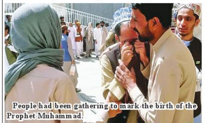
People had been gathering to mark the birth of the Prophet Muhammad.

On the other attack, a spokesman for Khyber Pakhtunkhwa police said that two suicide bombers and a vehicle full of explosives had been intercepted. BBC