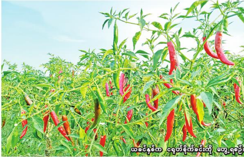
ယခင်နှစ်က ငရုတ်စိုက်ခင်းကို တွေ့ရစဉ်။