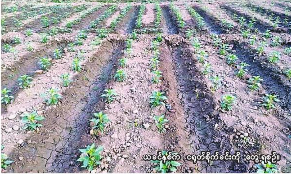
ယင်းမာပင်ခရိုင်တွင် ငရုတ်စိုက်ခင်းကို တွေ့ရစဉ်။

ယင်းမာပင် အောက်တိုဘာ ၅ စစ်ကိုင်းတိုင်းဒေသကြီး ယင်းမာပင်ခရိုင်တွင် ယခုနှစ် မိုးသီးနှံ စိုက်ပျိုးရာသီ၌ ငရုတ် ၁၁၀၈ ဧက စိုက်ပျိုးပြီးစီးပြီဖြစ်ကြောင်း ယင်းမာပင်ခရိုင် စိုက်ပျိုးရေးဦးစီးဌာနမှ သိရသည်။