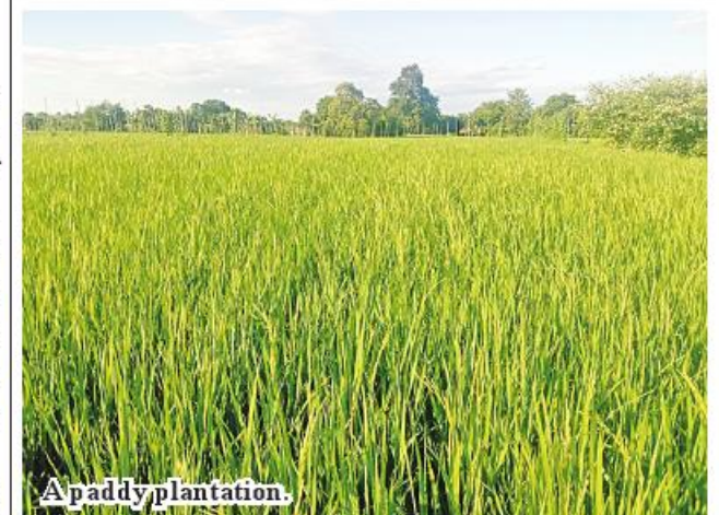
A paddy plantation.