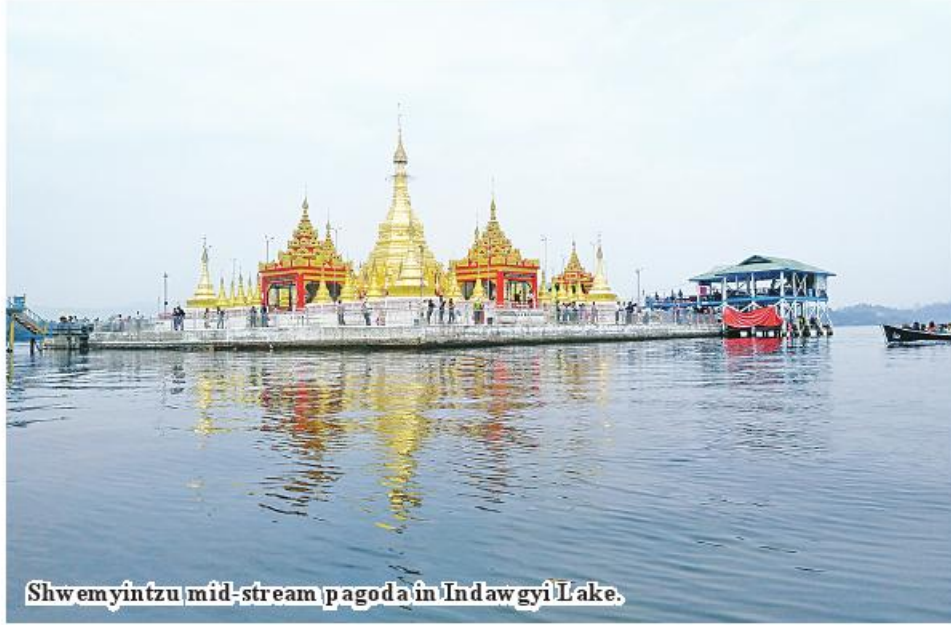
Shwemyintzu mid-stream pagoda in Indawgyi Lake.

Mohnyin October 5 A plan is underway to hold the ceremony of offering 1,500 oil lights to Shwemyintzu mid-stream pagoda in Indawgyi Lake of Mohnyin Township on a grand scale with traditional Shanni ethnic dance, said U Chit Than, a member of pagoda board of trustees. The offering of 1,500 oil