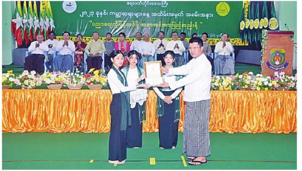
ရန်ကုန်တိုင်းဒေသကြီးဝန်ကြီးချုပ် ဦးစိုးသိန်း ကမ္ဘာ့ဆရာများနေ့ အထိမ်းအမှတ်ပြိုင်ပွဲများတွင် ဆုရရှိသူတစ်ဦးကို ဆုပေးအပ်ချီးမြှင့်စဉ်။