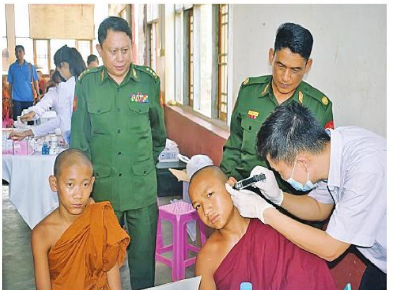
သံဃာတော်များအား အရှေ့မြောက်တိုင်းစစ်ဌာနချုပ် နယ်မြေခံဆေးကုသရေးအဖွဲ့ က ကျန်းမာရေးစောင့်ရှောက်မှုလုပ်ငန်းများ ဆောင်ရွက်ပေးနေမှုကို တာဝန်ရှိသူများက ကြည့်ရှုအားပေးစဉ်။