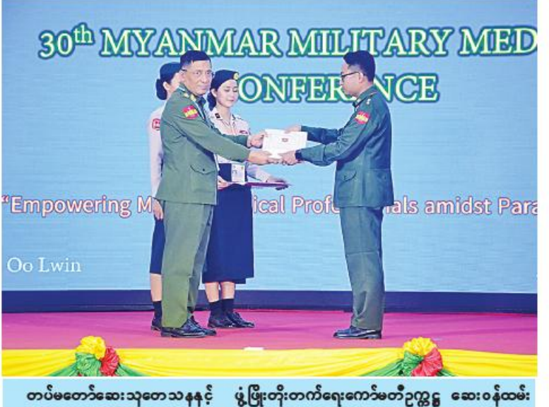
အကြိမ်(၃၀)မြောက် မြန်မာ့တပ်မတော်ဆေးပညာရပ်ဆိုင်ရာနီးနောဖလှယ်ပွဲ တတိယနေ့ ကျင်းပစဉ်။