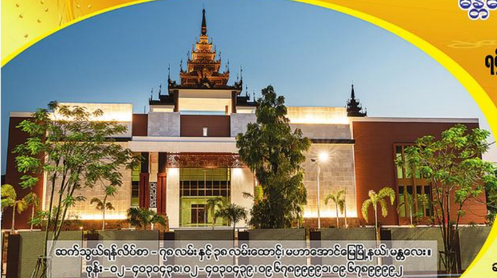
ဆက်သွယ်ရန်လိပ်စာ - ၇၈ လမ်း၊ နှင့် ၃၈ လမ်းထောင့်၊ မဟာအောင်မြေမြို့နယ်၊ မန္တလေး။ ဖုန်း - ၀၂-၄၀၃၀၄၃၈၊ ၀၂-၄၀၃၀၄၃၉၊ ၀၉-၆၇၈၉၉၉၅၊ ၀၉-၆၇၈၉၉၉၉

ပဒေသာကပွဲ၊ တေးဂီတဖျော်ဖြေပွဲများ၊ အလှူဓာတ်ပုံရိုက်ကူးခြင်းများအတွက် ခန်းမများ၊ ငှားရမ်းခြင်းနှင့် ဝန်ဆောင်မှုများဆောင်ရွက်ပေးလျက်ရှိပါသည်။