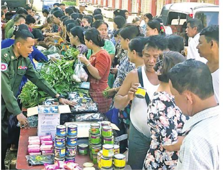
စစ်တွေမြို့ရှိ မုန်တိုင်းဒဏ်သင့် ပြည်သူများအား စားသောက်ကုန်ပစ္စည်း များနှင့် လူသုံးကုန်ပစ္စည်းများကို ဈေးနှုန်း သက်သာစွာဖြင့် ရောင်းချပေးစဉ်။

အိမ်ဆောက်ပစ္စည်းများကို လည်းကောင်း ပြင်ပပေါက်ဈေးထက် သက်သာသော ဈေးနှုန်းများဖြင့် ဆက်လက်ရောင်းချပေးရာ ဒေသံပြည်သူများနှင့် ဌာနဆိုင်ရာဝန်ထမ်း မိသားစုများက ဝမ်းသာအားရ ဝယ်ယူ အားပေးကြကြောင်းနှင့် ယခုကဲ့သို့စားရေး အခက်အခဲဖြစ်ပေါ်နေချိန်တွင် သက်သာ သော ဈေးနှုန်းများဖြင့် ရောင်းချပေးမှုအပေါ် တာဝန်ရှိသူများကို အထူးပင်ကျေးဇူးတင် ရှိကြောင်း သတင်းရရှိသည်။