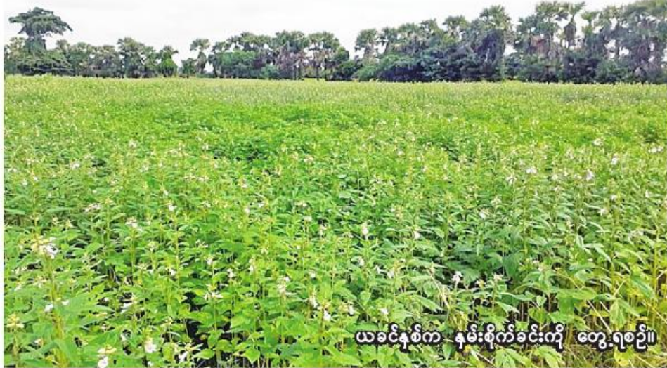
ယခင်နှစ်က နှမ်းစိုက်ခင်းကို တွေ့ရစဉ်။

ရေဦး အောက်တိုဘာ ၅ စစ်ကိုင်းတိုင်းဒေသကြီး ရေဦးခရိုင်တွင် ယခုနှစ် မိုးသီးနှံစိုက်ပျိုးရာသီ၌ မိုးနှမ်း ၃၁၆၆၁ ကေ စိုက်ပျိုးပြီးစီးပြီဖြစ်ကြောင်း ရေဦးခရိုင်စိုက်ပျိုးရေးဦးစီးဌာနမှ သိရသည်။ ရေဦးခရိုင်တွင် ယခုနှစ် မိုးသီးနှံစိုက်ပျိုးရာသီ၌ မိုးနှမ်း ၃၀၅၇၅ ကေ စိုက်ပျိုးရန် လျာထားပြီး ယခုနှစ် မေလမှ စတင်စိုက်ပျိုးခဲ့ရာ ယနေ့ထိ ၃၁၆၆၁ ကေ စိုက်ပျိုးပြီးစီးပြီဖြစ်ကြောင်း သိရသည်။ “ဒီနှစ် မိုးသီးနှံစိုက်ပျိုးရာသီမှာ