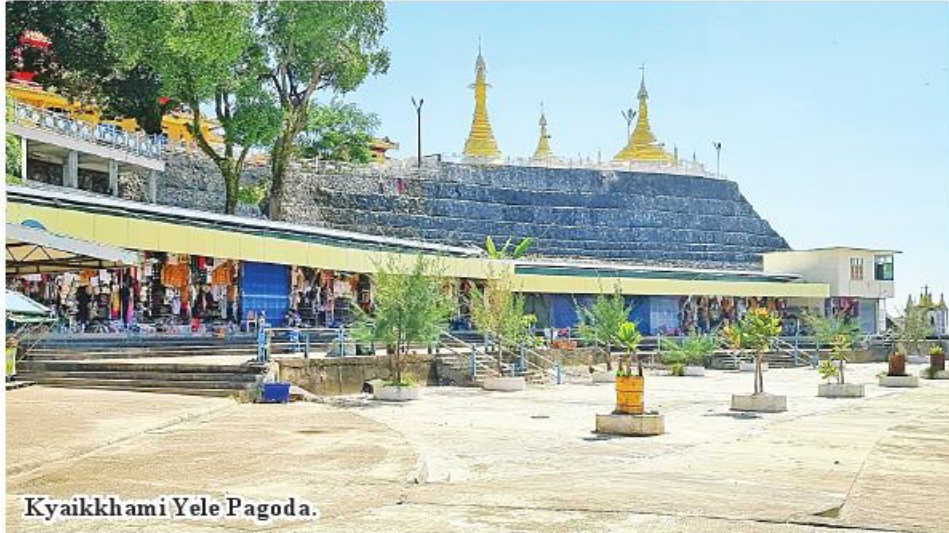
Kyaikkhami Yele Pagoda.