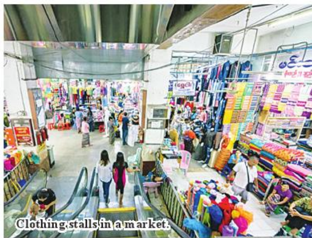
Clothing stalls in a market.

Among the big bazaars in Mandalay, Zay Cho Market is a large market that distributes and sells a variety of other items, including clothing, consumer goods, and food products, and the sales of textiles and clothing at Zay Cho Market have recovered since the last week of September. "As the winter season is about to arrive, sales of clothes produced by domestic garment factories have recovered at low prices. In addition, sales of winter clothes produced in China have also recovered," he continued. Similarly, in addition to clothing items produced from China and entered in the Mandalay Zay Cho Market, other consumer goods and cosmetic products are also