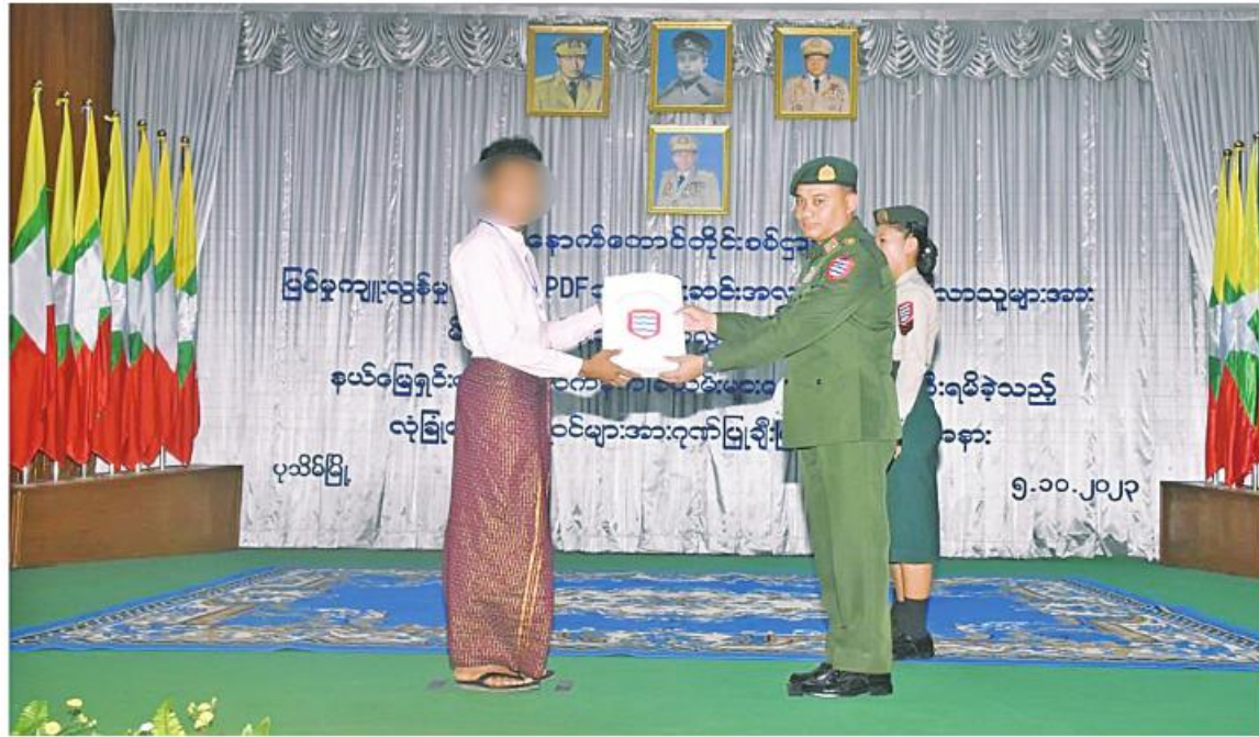
အနောက်တောင်တိုင်းစစ်ဌာနချုပ် တိုင်းမှူး ဝင်းဦးဝင်း၊ ဝင်းဦးဝင်း၊ ဥပဒေဘောင်အတွင်းဝင်ရောက်လာသည့် PDF အဖွဲ့ဝင် တစ်ဦးကို ထောက်ပံ့ပစ္စည်းများပေးအပ်စဉ်။

နေပြည်တော် အောက်တိုဘာ ၅ - နိုင်ငံတော် စီမံအုပ်ချုပ်ရေးကောင်စီ သည် PDF အပါအဝင် အဖွဲ့အစည်းအမျိုးမျိုး အမည်ခံ၍ လက်နက်ကိုင်ဆောင်လျက်ရှိ သည့် အဖွဲ့အစည်းများအတွင်း ရောက်ရှိ နေသူများကို ဥပဒေဘောင်အတွင်းသို့ ပြန်လည်ဝင်ရောက်ရန် ဖိတ်ခေါ်၍ ဥပဒေ ဘောင်အတွင်းသို့ ဝင်ရောက်လာသူများကို လိုအပ်သည့် ကူညီပံ့ပိုးမှုများဆောင်ရွက် ပေးသွားမည်ဖြစ်ကြောင်းနှင့် လက်နက်၊ ခဲယမ်းများဖြင့် ဝင်ရောက်လာသူများကို ဆုကြေးငွေများ ထောက်ပံ့ပေးသွားမည်ဖြစ် ကြောင်း ထုတ်ပြန်ထားရှိပြီးဖြစ်ရာ ယနေ့ နေ့လယ်ပိုင်းတွင်လည်း ပြစ်မှုကျူးလွန်ခြင်း မရှိသော PDF အဖွဲ့မှ အလင်းဝင်ရောက် လာသူများကို မိဘအုပ်ထိန်းသူများထံပြန် လည်လွှဲပြောင်းပေးအပ်ခြင်းနှင့် နယ်မြေ လုံခြုံရေးဆောင်ရွက်စဉ် လက်နက်၊ ခဲယမ်းများ ဖော်ထုတ်ဖမ်းဆီးရမိခဲ့သည့် လုံခြုံရေးတပ်ဖွဲ့ဝင်များအား ဂုဏ်ပြုချီးမြှင့် ခြင်းကို အနောက်တောင်တိုင်းစစ်ဌာနချုပ် ရော့တီခန်းမ၌ ပြုလုပ်ရာ ရော့တီတိုင်း